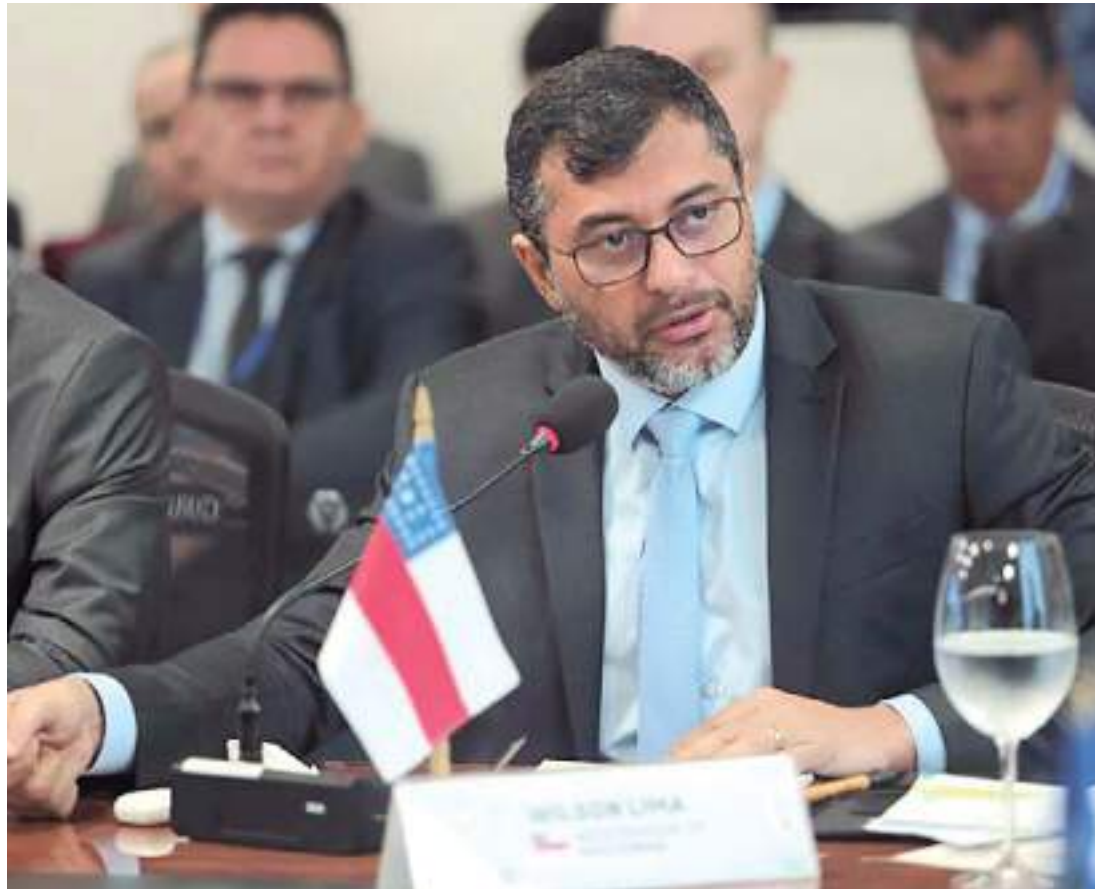
Governador realizou declarações envolvendo antenas do projeto com tecnologia de Elon Musk

nar (PL), em parceria com o empresário americano Elon Musk, fundador das empresas de desenvolvimento de satélites, Starlink, e de fabricante de sistemas aeroespaciais, SpaceX, em maio de 2022, anunciou que levaria internet para 19 mil escolas brasileiras por meio da empresa Starlink. Na época, o governo Bolsonaro divulgou que a meta de conectar 100% das escolas públicas na região Norte até o final de 2022. No entanto, até hoje, mais de 5 mil escolas ainda estão sem internet na região, segundo dados da Agência Nacional de Telecomunicações (Anatel).