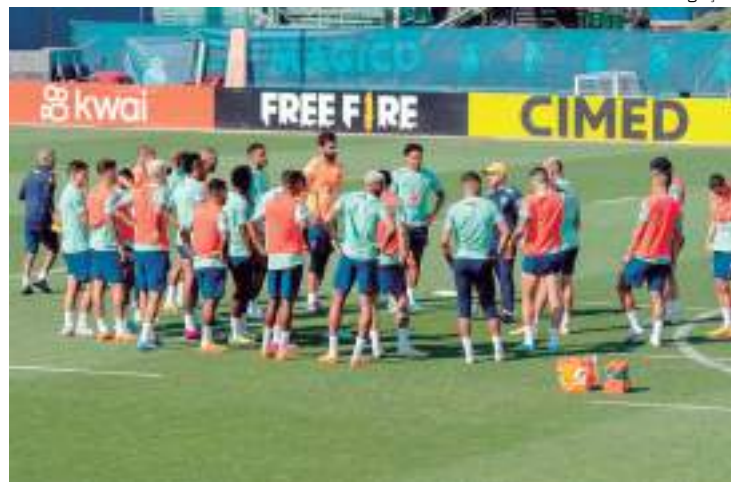
Jogadores Seleção Brasileira fazem último treino para amistoso contra Senegal

A Seleção deve manter o time que derrotou Guiné, com Ederson no gol, Marquinhos na zaga, Casemiro no