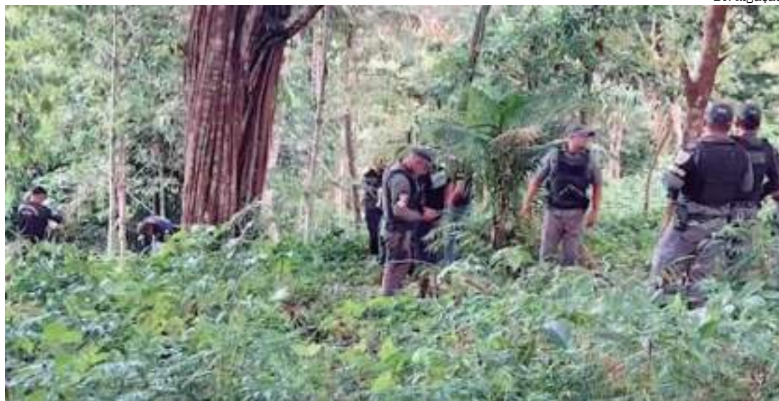
Homem foi assassinado a tiros em uma área de mata

Um homem ainda sem identificação foi assassinado a tiros durante a tarde deste domingo (18), em uma área de mata, na rua Chico Mendes, comunidade Valparaíso, bairro Jorge Teixeira, Zona Leste de Manaus.