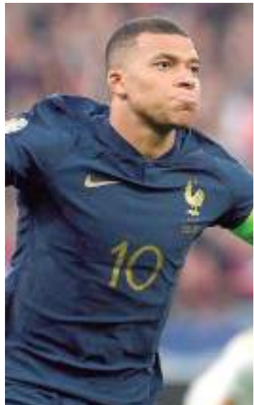
Atacante Mbappé fez o gol da vitória da Seleção da França contra Grécia