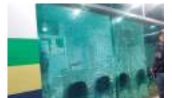
Prédio do 72º Distrito Integrado de Polícia

Ao AGORA a Polícia Civil do Amazonas (PC-AM) informou que um Inquérito Policial (IP) foi instaurado para apurar as circunstâncias do fato.