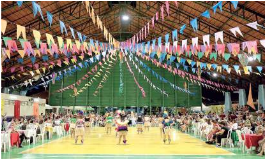
Joelma vem para Manaus neste sábado para apresentação no Sambódromo