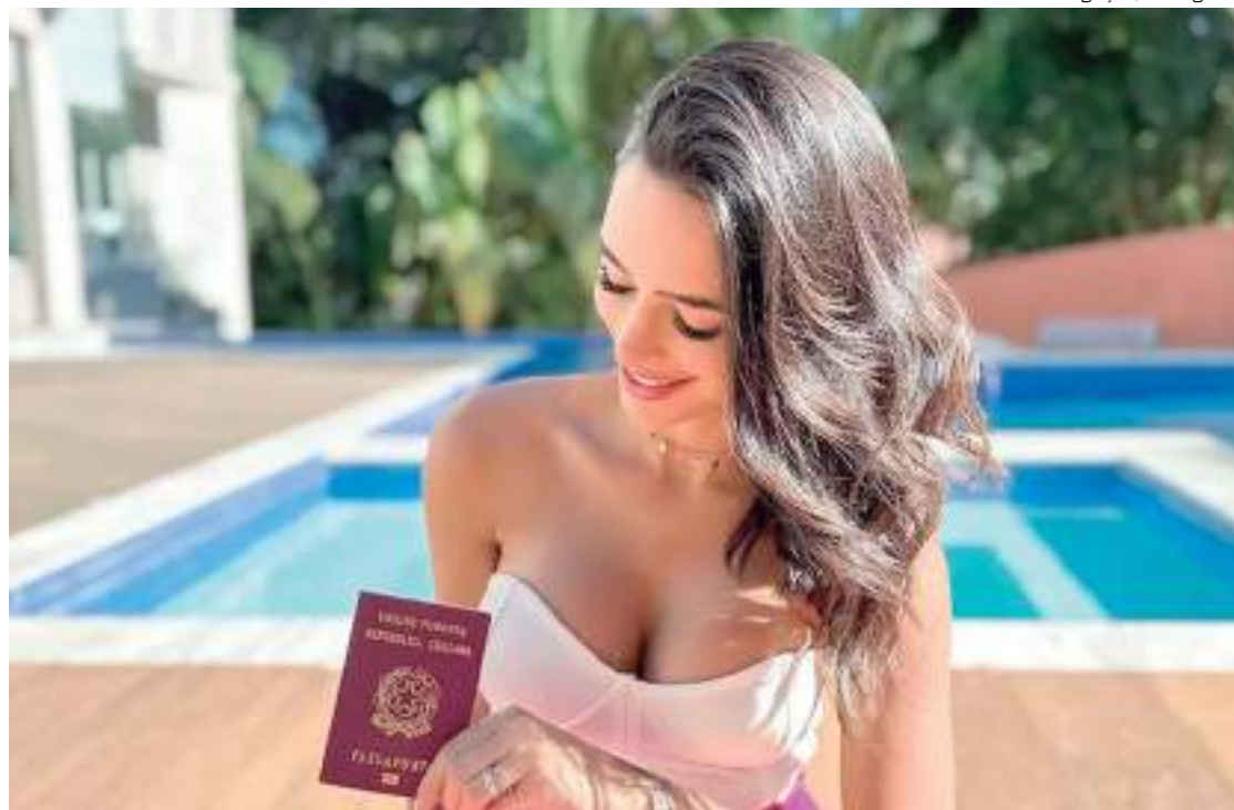
Bruna Biancardi anuncia projeto familiar

Bruna Biancardi anunciou, nesta segunda-feira (19), um projeto para sua família em meio a polêmicas com Neymar. A influenciadora surgiu em seu Instagram pela primeira vez, desde que uma possível traição de seu noivo veio à tona.