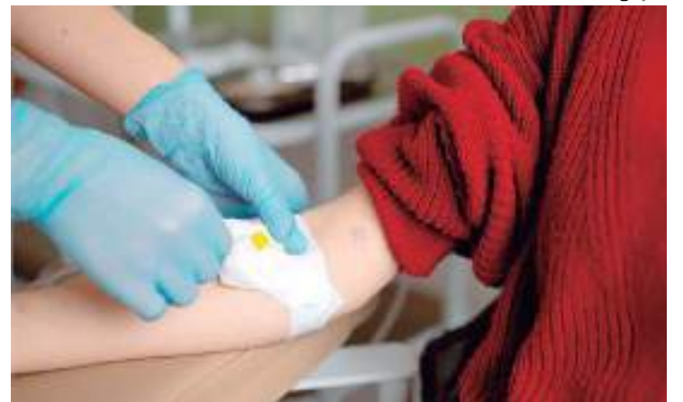
Para doar basta levar os documentos e fazer cadastro

Também é preciso pesar no mínimo 50 quilos, estar descansado e ter repousado ao menos seis horas na noite anterior, além de estar bem alimentado. Quem pretende doar não deve ingerir bebida alcoólica no dia anterior e é preciso evitar fumar pelo menos duas horas antes da doação. No momento da triagem, é necessário apresentar documento original com foto.