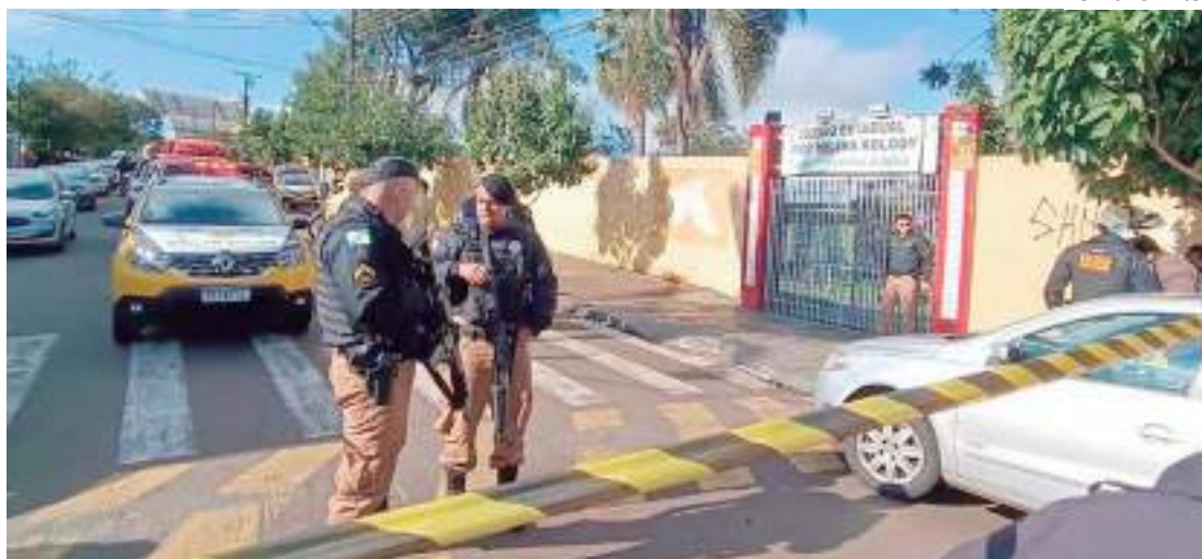
Policiais em frente à escola estadual Professora Helena Kolody, em Cambé (PR), após ataque a tiros