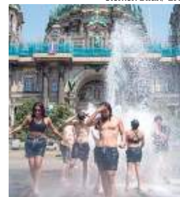
Os mais de 16 mil óbitos ocorreram devido às ondas do calor