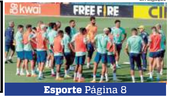
Esporte Página 8