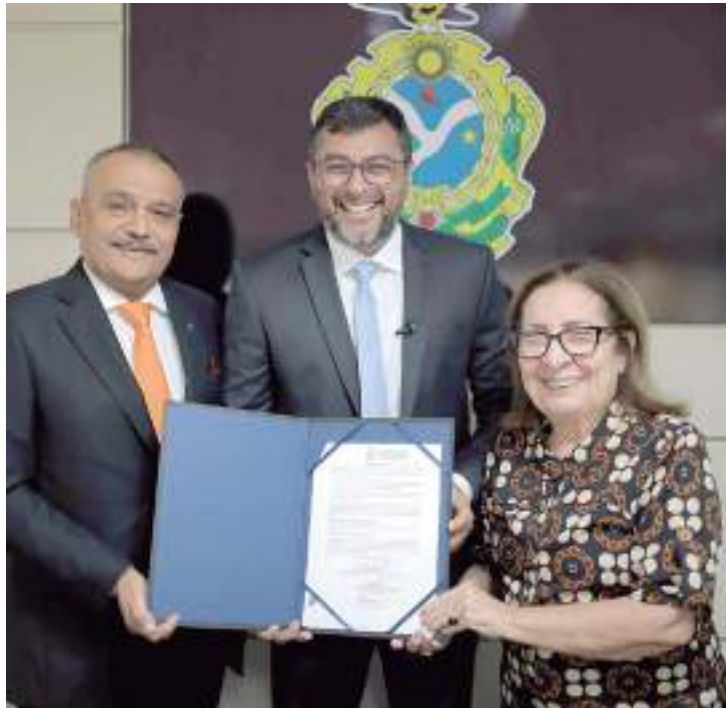
Termo de Cooperação prevê apoio a realização de pesquisas e atividades de interesse do processo