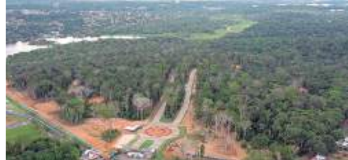
Empreendimento fica na Estrada do Cetur, no bairro Tarumã, Zona Oeste

A área do Quintas conta com quase 200 espécies de essências florestais e frutíferas catalogadas e representadas por 45 famílias botânicas. Angelim-rajado, aburana, apuí, breu branco, breu vermelho, ingá chichica, lourinho e sorvinha são algumas delas. Está sendo realizado um monitoramento ambiental inclusive para os projetos de resgate da fauna silvestre das áreas de supressão vegetal e o de controle de qualidade ambiental, que visam minimizar os impactos da obra.