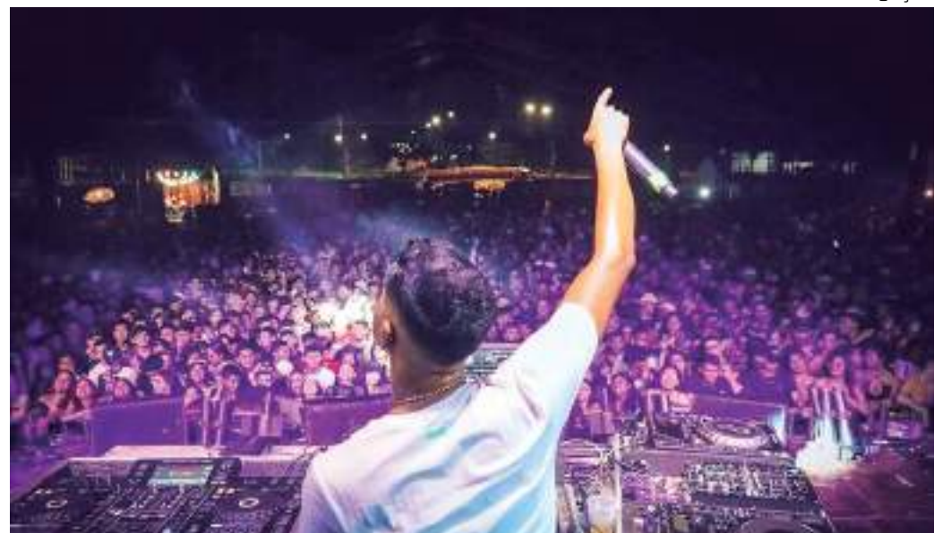
Sunset dos visitantes reúne artistas locais

Os interessados em adquirir os ingressos para o Lounge Amazon Best podem ir até a sede da empresa em Parintins, localizada na rua Vieira Junior, n 754, Centro. Os ingressos também estão disponíveis no site Ingressos Fly ( www.ingresso-fly.com ).