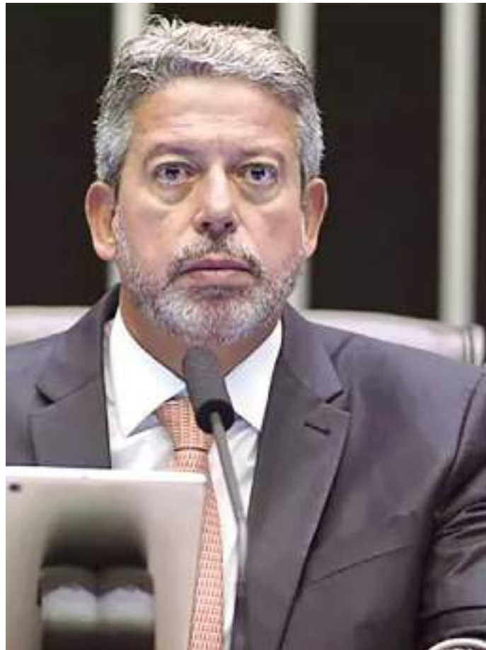
Presidente da Câmara dos Deputados, Arthur Lira, faz parte do partido Progressistas

Mesmo dentro do MEC, foco inicial dos policiais, os tentáculos vão além dos kits de robótica — e nessas outras frentes também há sinais de irregularidades. Duas instituições federais de ensino sediadas no estado de Lira, por exemplo, puseram dinheiro em uma das empresas investigadas: o Instituto Federal de Alagoas (IFAL) e a Universidade Federal de Alagoas (UFAL) fecharam mais de R$ 13 milhões