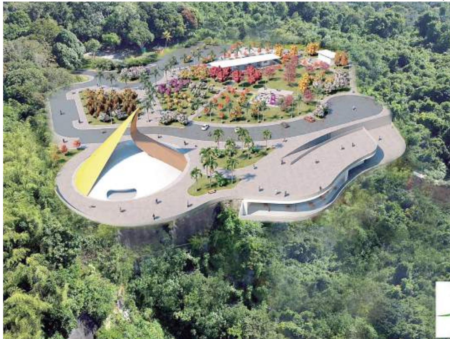
Parque ficará localizado na avenida Desembargador Anísio Jobim, Colônia Antônio Aleixo

Tanto a proposta de Niemeyer, de 2005, quanto a do Implurb, de 2021, seguem os critérios para a proteção da dimensão cênica do Encontro das Águas, com áreas de livre circulação e contemplação, valorização do fenômeno e de proteção à paisagem e permeabilidade visual. "O parque será uma nova referência em opção de lazer, turismo local, nacional e internacional, aproveitando