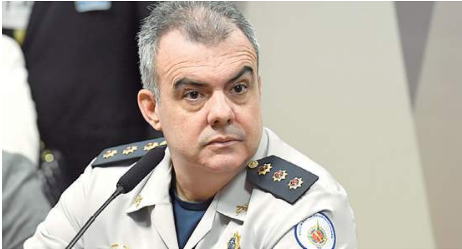
Coronel, preso desde janeiro, voltou a declarar que a "ação da PM sempre foi limitada pelas Forças Armadas

Ele cita nominalmente o chefe do Centro de Inteligência,