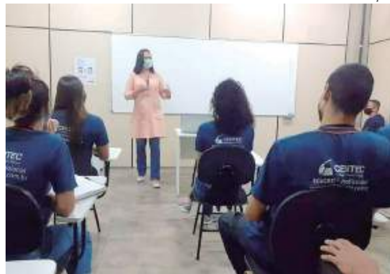
Centec está com inscrições abertas para o concurso de bolsas 2023