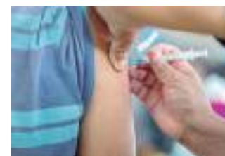
Atendimento vão de 8h às 20h

Para receber a vacina, basta apresentar documento de identificação com foto, CPF ou Cartão Nacional de Saúde e a carteira de vacinação.