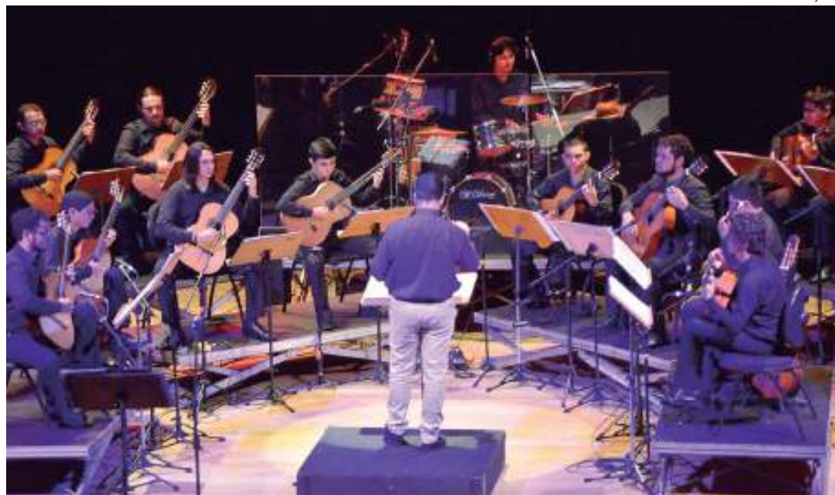
Evento celebra os 40 anos de carreira do poeta amazonense