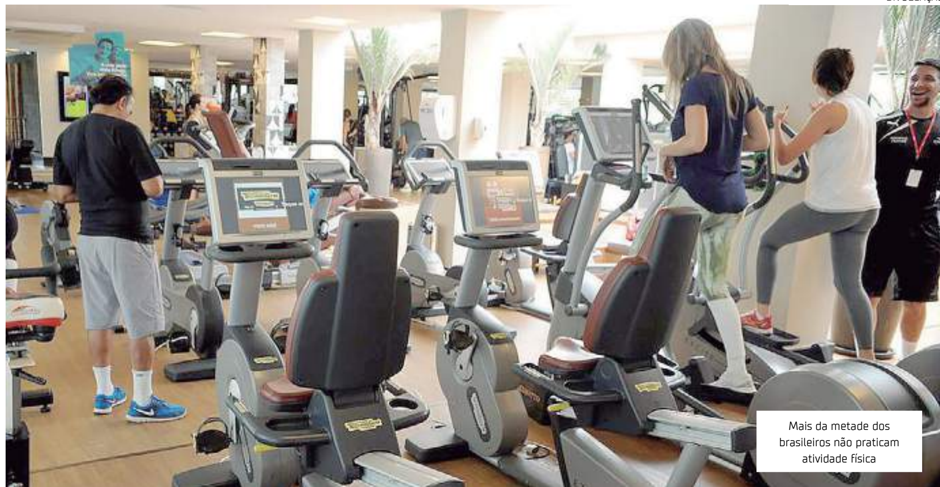
Mais da metade dos brasileiros não praticam atividade física

Além da frequência da prática de atividades físicas, o estudo fez a associação entre a prática delas e o adoecimento. Segundo o levantamento do Sesi, 72% das pessoas que praticam exercícios com frequência não tiveram problemas de saúde nos últimos 12 meses.