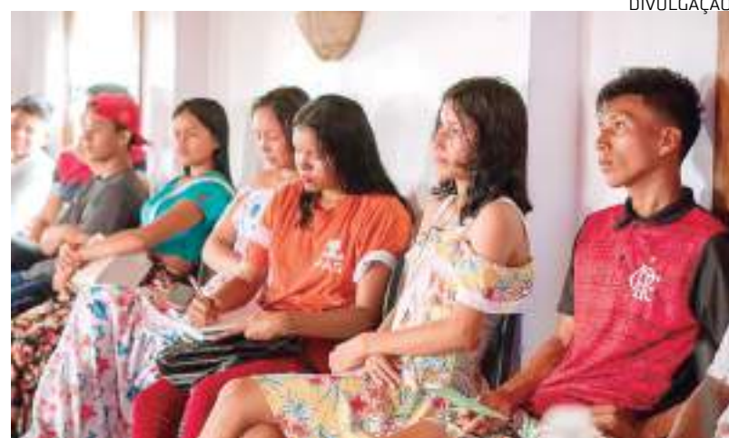
material é gratuito pelo site da FAS

A Fundação Amazônia Sustentável (FAS) lançou o "Caderno de Boas Práticas Pedagógicas de Leitura: Educação para Sustentabilidade". A publicação apresenta métodos e práticas educativas para o desenvolvimento integral de crianças e adolescentes em comunidades do interior da Amazônia.