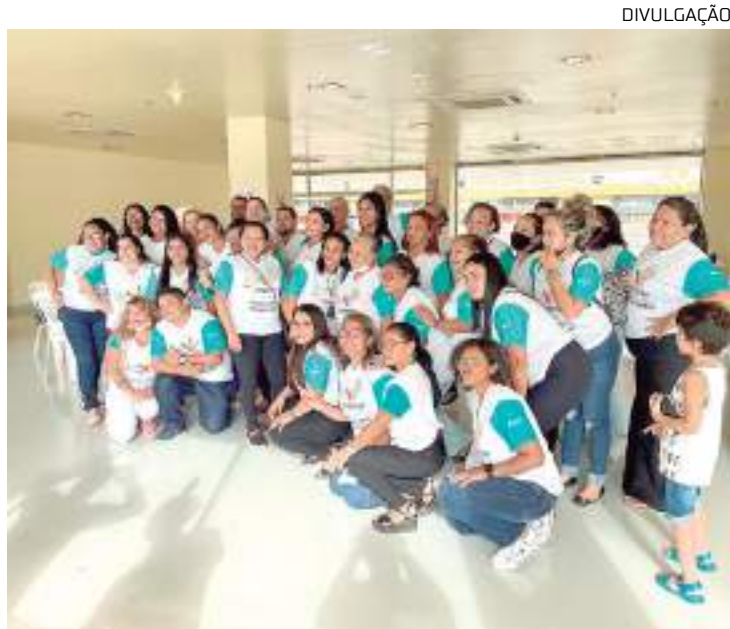
Ação acontece no próximo sábado, 1º de julho das 8h às 12h

Os serviços e atividades que serão oferecidos são: encaminhamento para vagas de empregos, orientação sobre carteira de trabalho digital, orientação para acesso ao seguro desemprego, atendimento de clínica financeira, doação de mudas de plantas, teste rápido de Covid-19, triagem para atendimento médico, atendimento ginecológico e obstétrico, atendimento de mastologista, atendimento em fisioterapia, orientação