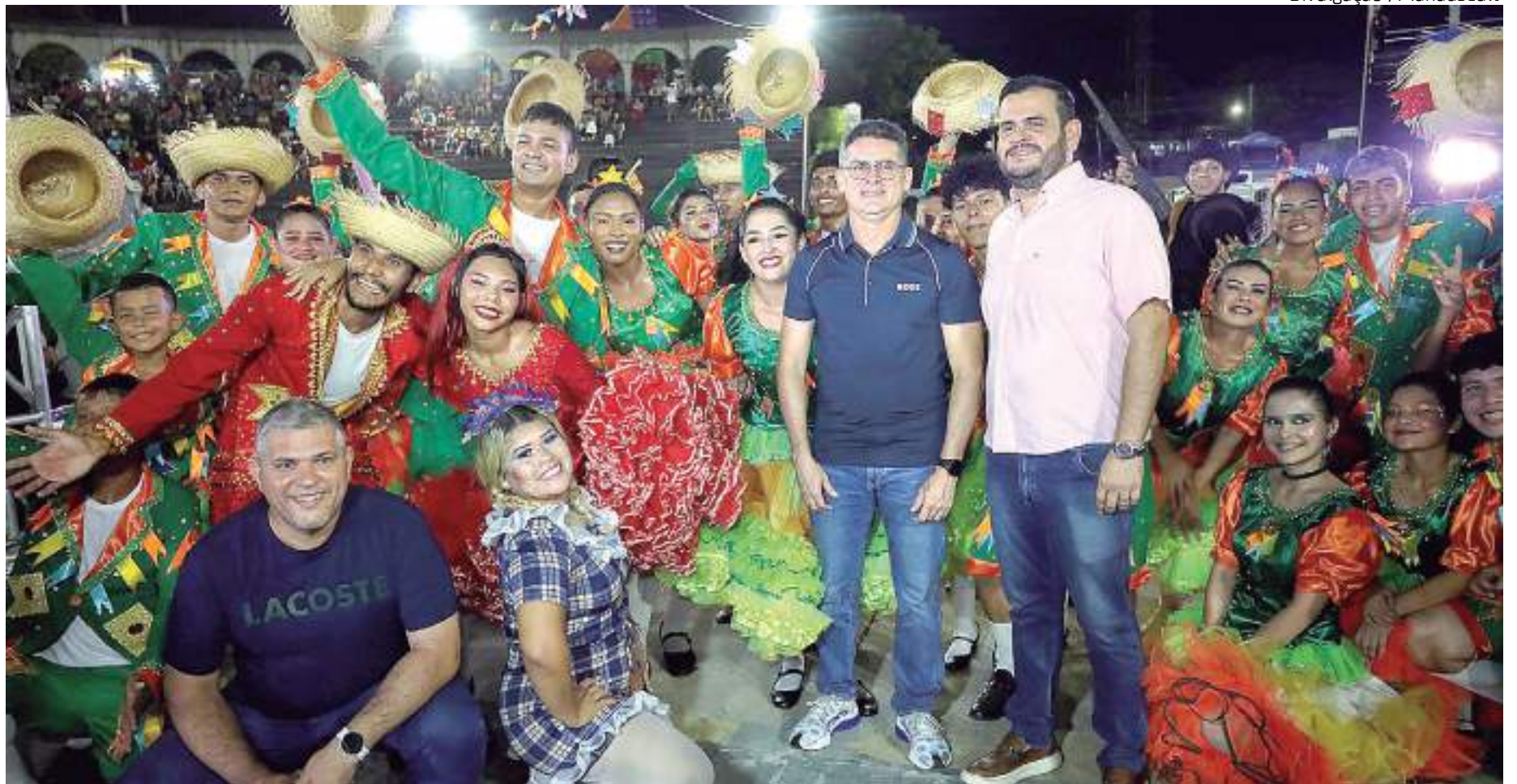
Prefeito destacou evento como sendo o maior dos últimos 10 anos

"Essa divisão nos permitiu manter esse alto nível, desde a ornamentação, o público que comprou a ideia do resgate cultural, nós viemos aqui desde o primeiro dia trazendo diversas atrações, justamente para trazer cada vez mais