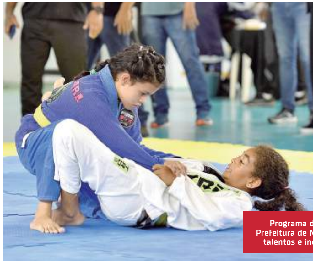
Programa de esporte da Prefeitura de Manaus encontra talentos e incentiva atletas

"Foram 365 dias árduos, de muito trabalho, e temos orgulho do que foi construído até aqui. O manauara, hoje, tem várias opções de modalidades e locais para se exercitar. Além disso, nossos talentos têm mostrado o valor em torneios nacionais e internacionais com o nosso apoio. O esporte de base também tem sido olhado com carinho. Sabemos que há muito caminho a ser percorrido, e nossa cidade é um local de muito potencial,