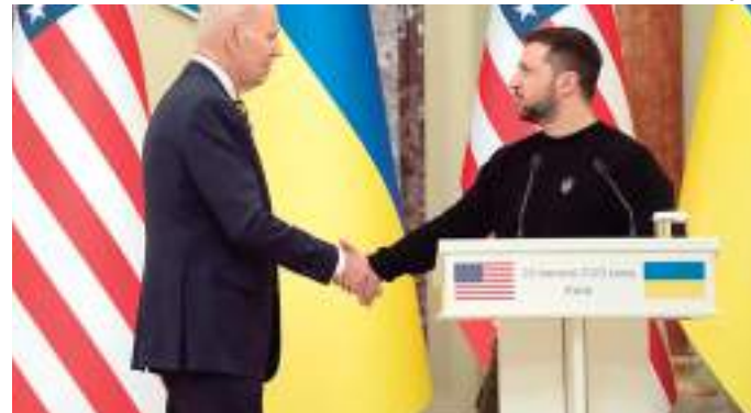
Biden deve anunciar pacote de US$ 500 milhões para Ucrânia

Os EUA forneceram mais de US$ 39 bilhões em assistência de segurança à Ucrânia desde o início da invasão russa em fevereiro de 2022, incluindo US$ 22 bilhões em saques presidenciais.