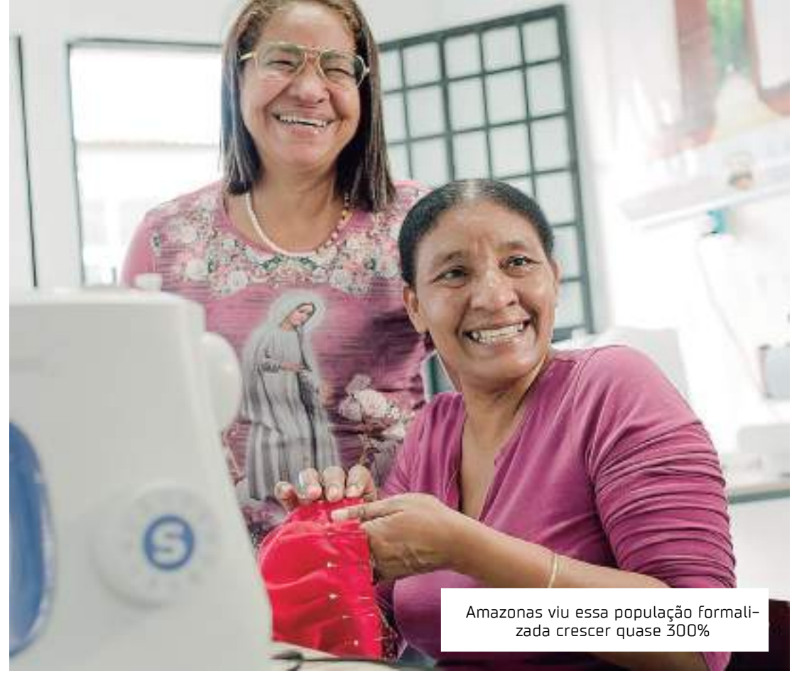
Amazonas viu essa população formalizada crescer quase 300%

O projeto "Ven, Tú Puedes!", dirigido pela Visão Mundial e