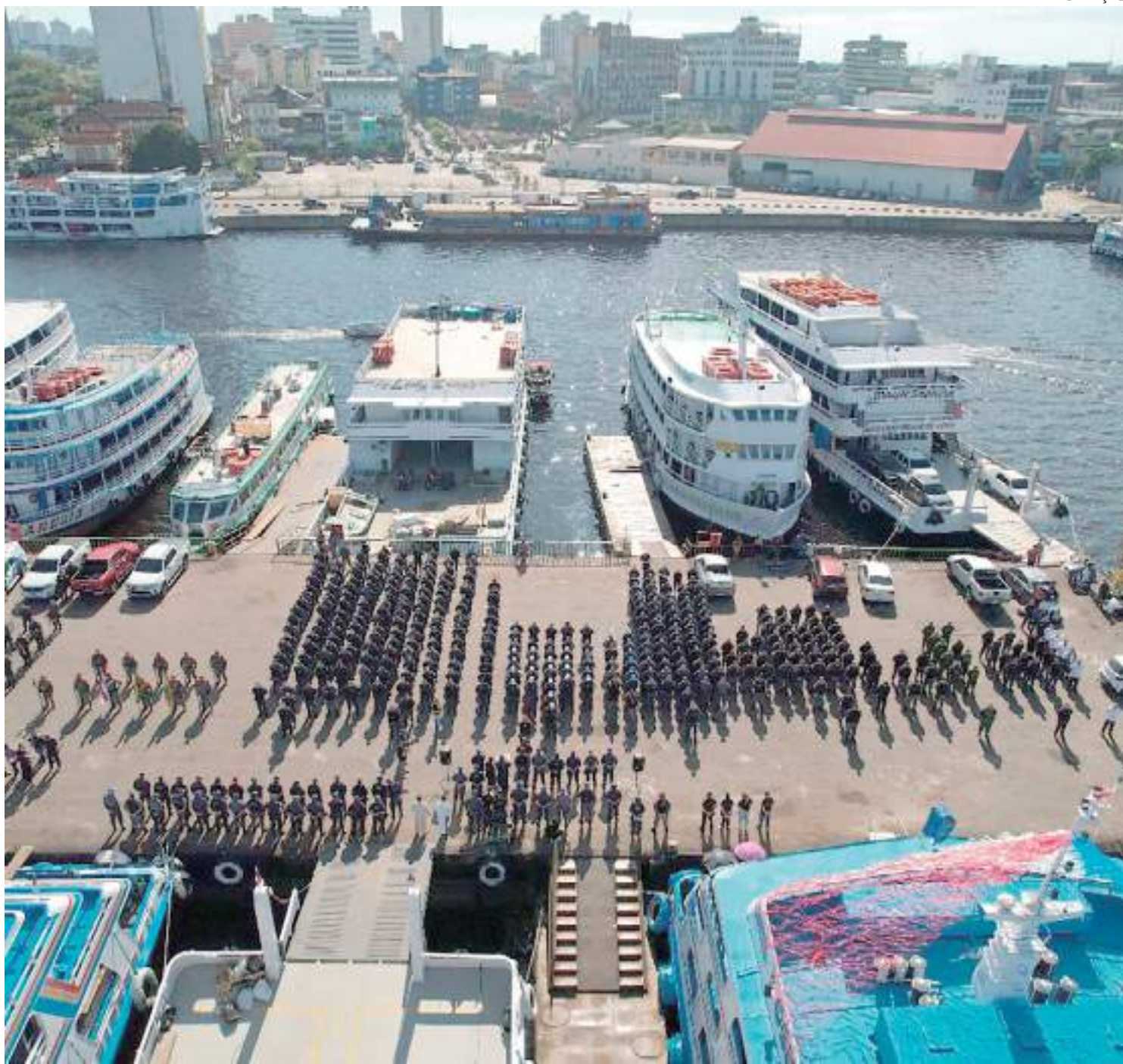
Prefeito destacou evento como sendo o maior dos últimos 10 anos

Conforme a PMAM, as ações serão realizadas de forma integrada com os outros órgãos de segurança, de forma repressiva e preventiva, para evitar crimes, durante as operações de combate à criminalidade na região, bem como a manu-