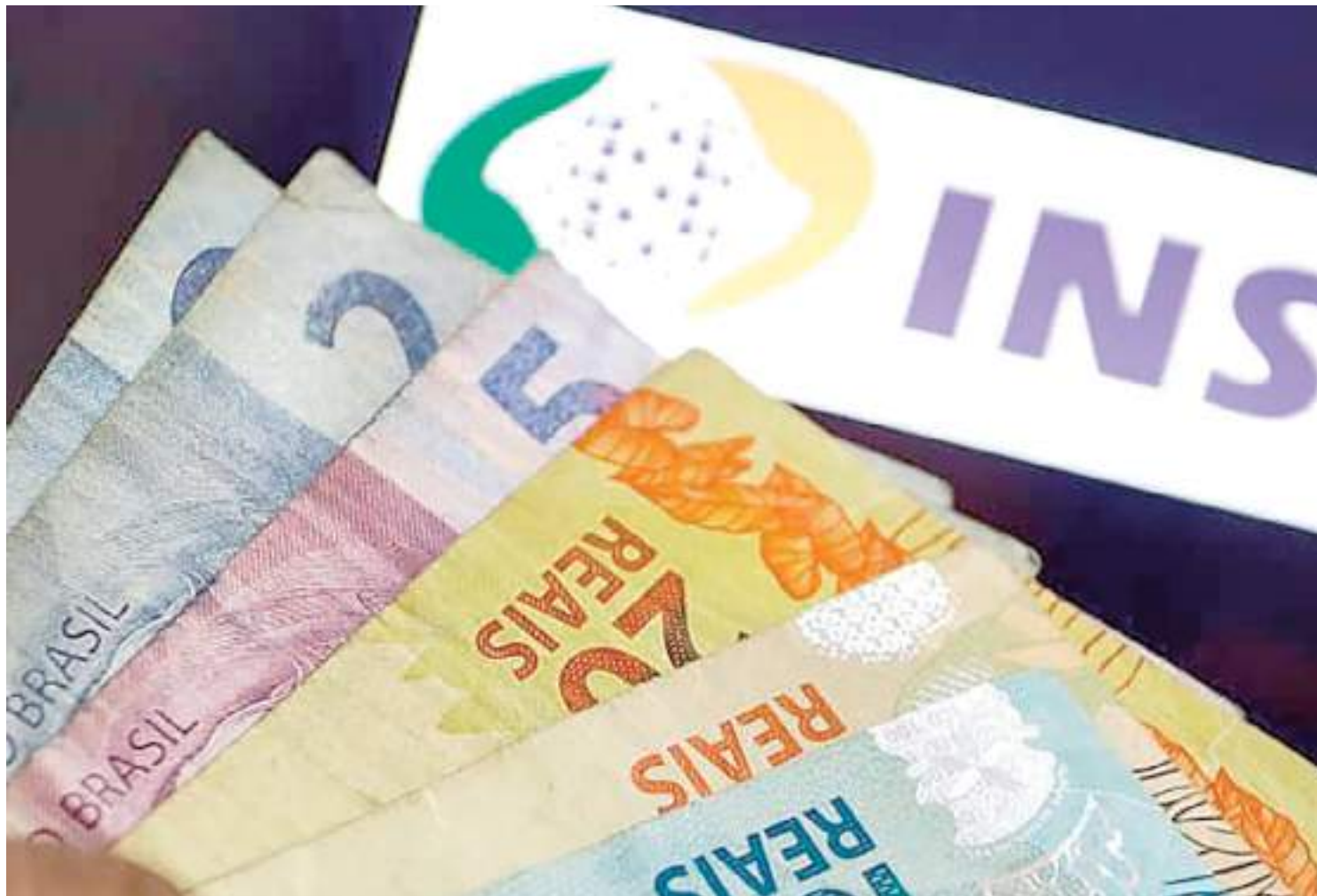
Regra era questionada pela Confederação Nacional dos Trabalhadores Assalariados e Assalariadas Rurais

O julgamento —realizado no plenário virtual— chegou ao final na última sexta-feira (23). Por oito votos, venceu a tese da constitucionalidade defendida pelo ministro relator do caso, Luís Roberto Barroso. Votaram com ele os ministros Dias Toffoli, André Mendonça, Gilmar Mendes, Alexandre de Moraes, Cármen Lúcia, Luiz Fux e Nunes