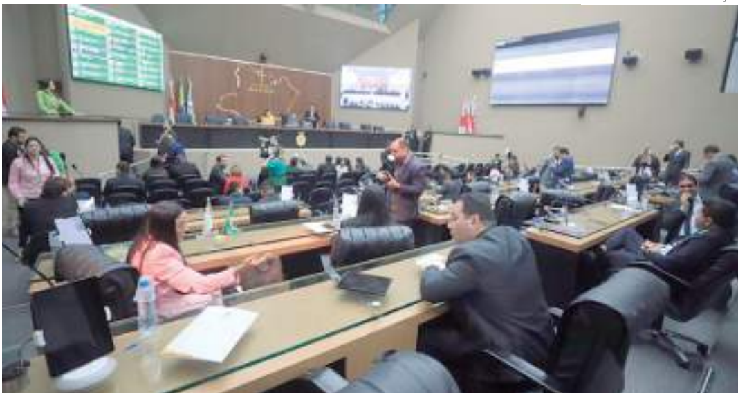
Aumento da verba poderá facilitar a realização de investimentos

A deputada celebrou o aumento do valor do repasse que será enviado pelo Governo Federal para o Amazonas.