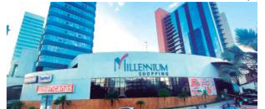
Na última edição, "Julho Black Brasil" contou com mais de 6 mil lojas