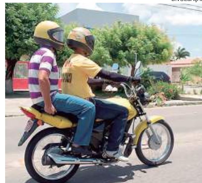
Empresa orienta motoristas e passageiros

Para usar os aplicativos é exigido que o passageiro seja maior de 18 anos, da mesma forma que é feito em relação aos carros. Por lei, a viagem de moto é limitada a duas pessoas (condutor e passageiro)