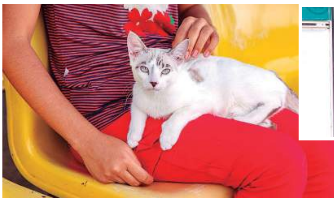
Campanha tem meta de vacinar mil animais até dia 29 de junho

De acordo com o chefe do Núcleo de Vigilância de Zoonoses do CCZ, Jhonata Calheiros, a etapa da área rural fluvial da campanha foi iniciada na quarta-feira, 21/6, com o apoio do Distrito de Saúde (Disa) Rural e a meta é a vacinação de mil animais até o dia 29 de junho.