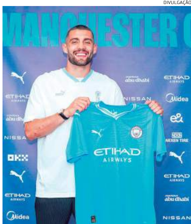
Kovacic vestirá a camisa do City na próxima temporada

para a Arábia Saudita. Koulibaly já foi anunciado pelo Al-Hilal, assim como Kanté pelo Al-Ittihad; Ziyech está próximo de um acordo com o Al-Nassr e Mendy já tem acordo costurado com o Al-Ahli. Outro rival que pode se beneficiar do “saldão” de liberação dos Blues é o Arsenal, que já tem o sinal verde de Kai Havertz para a contratação.