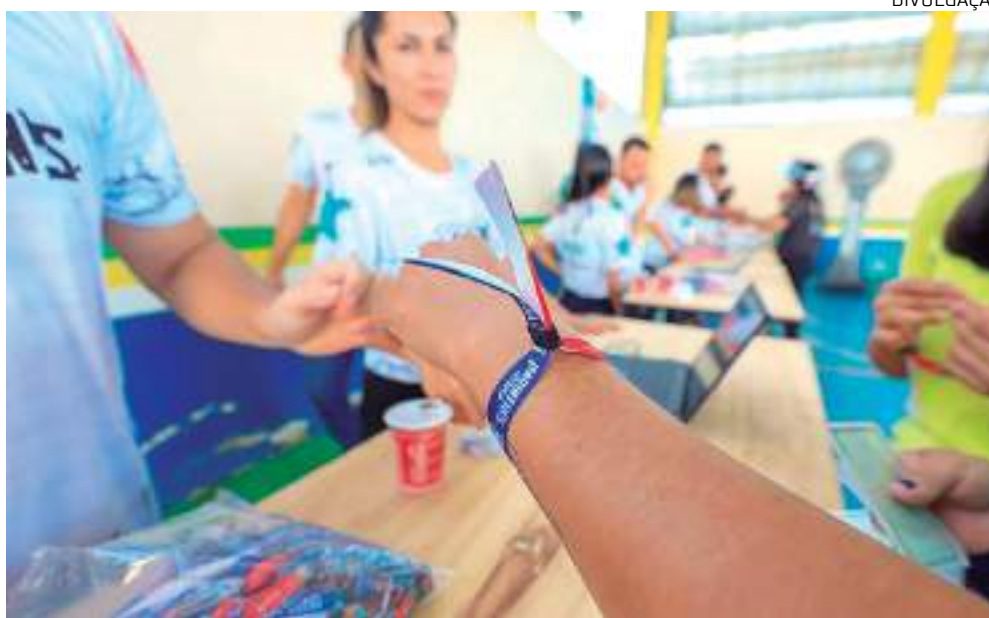
Ao todo, 17 mil pulseiras serão disponibilizadas

"Na terça e quarta-feira, a gente entrega algo de 4.200, em cada dia, e o restante na quinta-feira, quando acontece a festa no Bumbódromo", afirmou o titular da pasta.