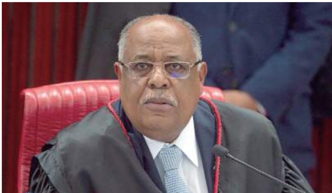
Ministro Benedito é o relator da ação que pode tornar Bolsonaro inelegível

Depois de Benedito, votarão os ministros do STJ (Superior Tribunal de Justiça) Raul Araújo,