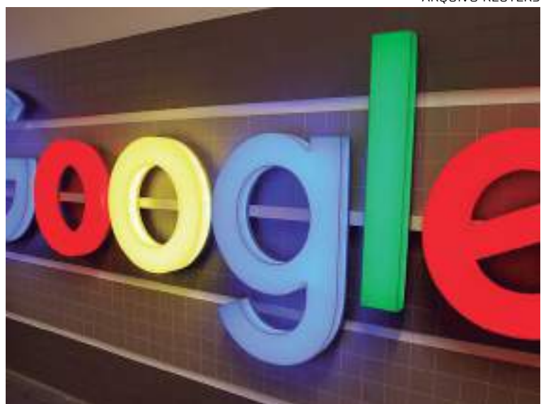
Empresa também tem projetos para alertas climáticos

A novidade anunciada no evento da terça-feira é que os alertas para enchentes em regiões ribeirinhas serão enviados por notificações no celular. De acordo com a empresa, usuários do sistema Android que estiverem com suas notificações ligadas e localizados próximos das regiões impactadas por inundações ribeirinhas começarão a receber alertas em tempo real e previsão no celular.