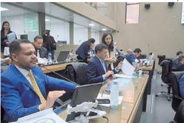
Deputados revoltaram-se com preços de viagens ao interior

O Projeto de Lei nº 573 de 2023, oriundo da Mensagem Governamental nº 46 de 2023, modifica dispositivos da Lei nº 3.430, de 3 de setembro de 2009, que reduza a base de cálculo nas operações internas com querosene de aviação (QAV) e gasolina de aviação (GAV). O projeto estabelece o percentual de 7% nas operações para prestador de serviço de transporte aéreo de passageiros que atenda com voos regulares o mínimo