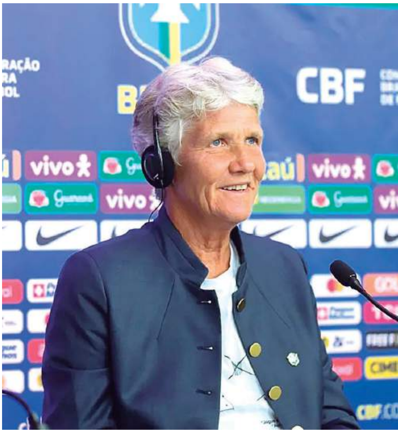
Pia anunciou convocação das meninas que vão representar o Brasil na Copa do Mundo