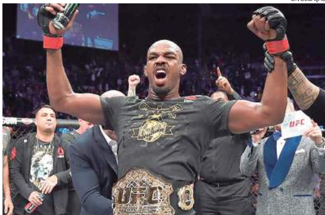
Norte-americano quer treinar Zuckerberg para luta contra Elon Musk

Elon Musk e Mark Zuckerberg são empresários de sucesso, mas a rivalidade entre eles pode acabar sendo resolvida em uma possível luta. Recentemente, o dono do 'Twitter' e o proprietário do 'Facebook' concordaram em se enfrentar e, a partir daí, até Dana White entrou na jogada, expressando o interesse em realizar o hipotético combate. Agora, foi Jon Jones quem opinou sobre o inusitado assunto e já escolheu um lado.