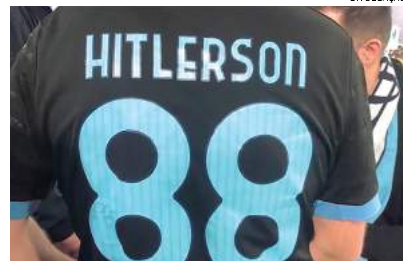
Federação quer acabar com uso de camisas de movimento antissemitas