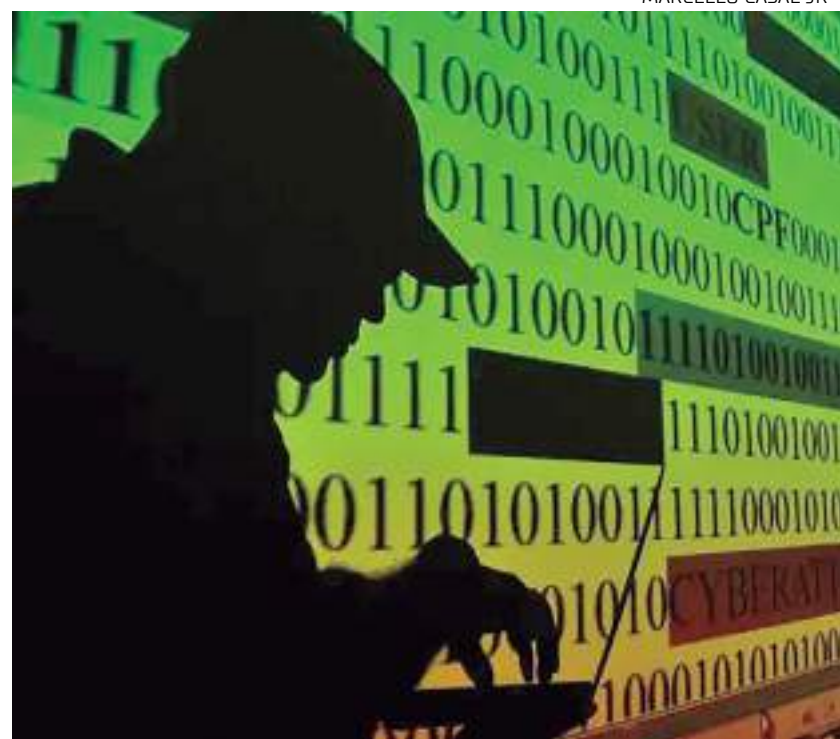
Investigações ao Encrochat começaram em 2017