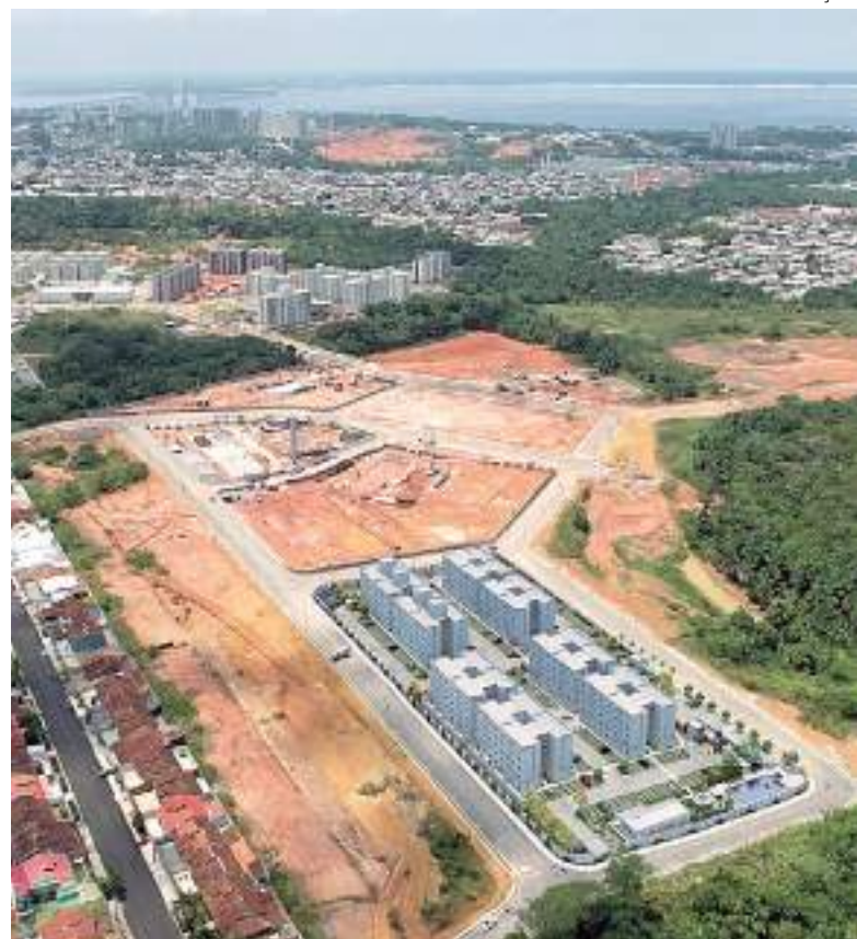
Parque Mosaico é o segundo mais procurado na capital por consumidores