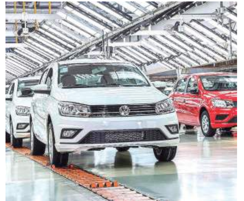
Volkswagen segue ajustando a produção de veículos