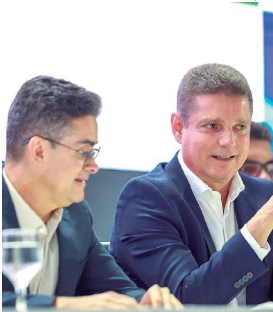
Prefeito David Almeida com o Secretário Chefe da Casa Civil, Marcos Rotta

processo será otimizado, isto é, um ganho de tempo que resultará na aceleração das informações oficiais da Prefeitura de Manaus, divulgadas por intermédio do Diário Oficial.