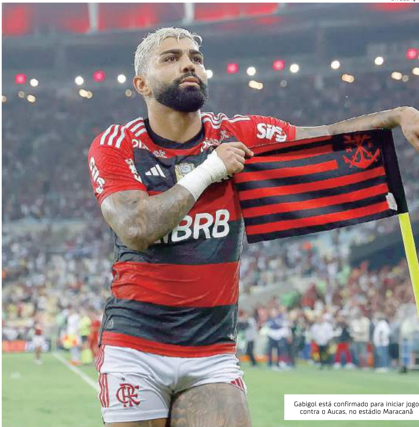
Gabigol está confirmado para iniciar jogo contra o Aucas, no estádio Maracanã

O Flamengo não tem maiores problemas para o seu de-