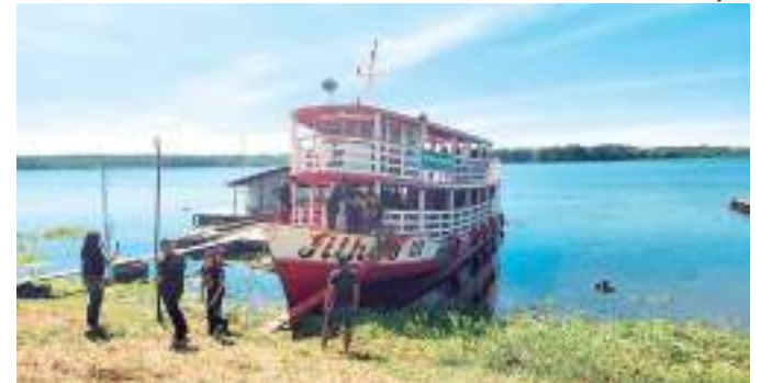
Estudantes terão a oportunidade de fazer cursos no barco-escola

Com o barco-escola em funcionamento, o TRT-11 cumpre a missão de aproximar a Justiça do Trabalho das comunidades ribeirinhas. Além do plantio de mudas nativas envolvendo as comunidades ribeirinhas, também serão oferecidos os seguintes cursos de capacitação para alunos das escolas municipais de Manaus: Mídias Digitais (20 horas), Artesanato e Biojoias (20 horas), Palestra "Trabalho Legal" (4 horas) e Palestra sobre Educação Ambiental (4 horas). A ideia é atender nove escolas do Lago do Puraquequara, Jatuarana, Tabocal, Terra Nova, Marimba e Assentamento de forma itinerante,