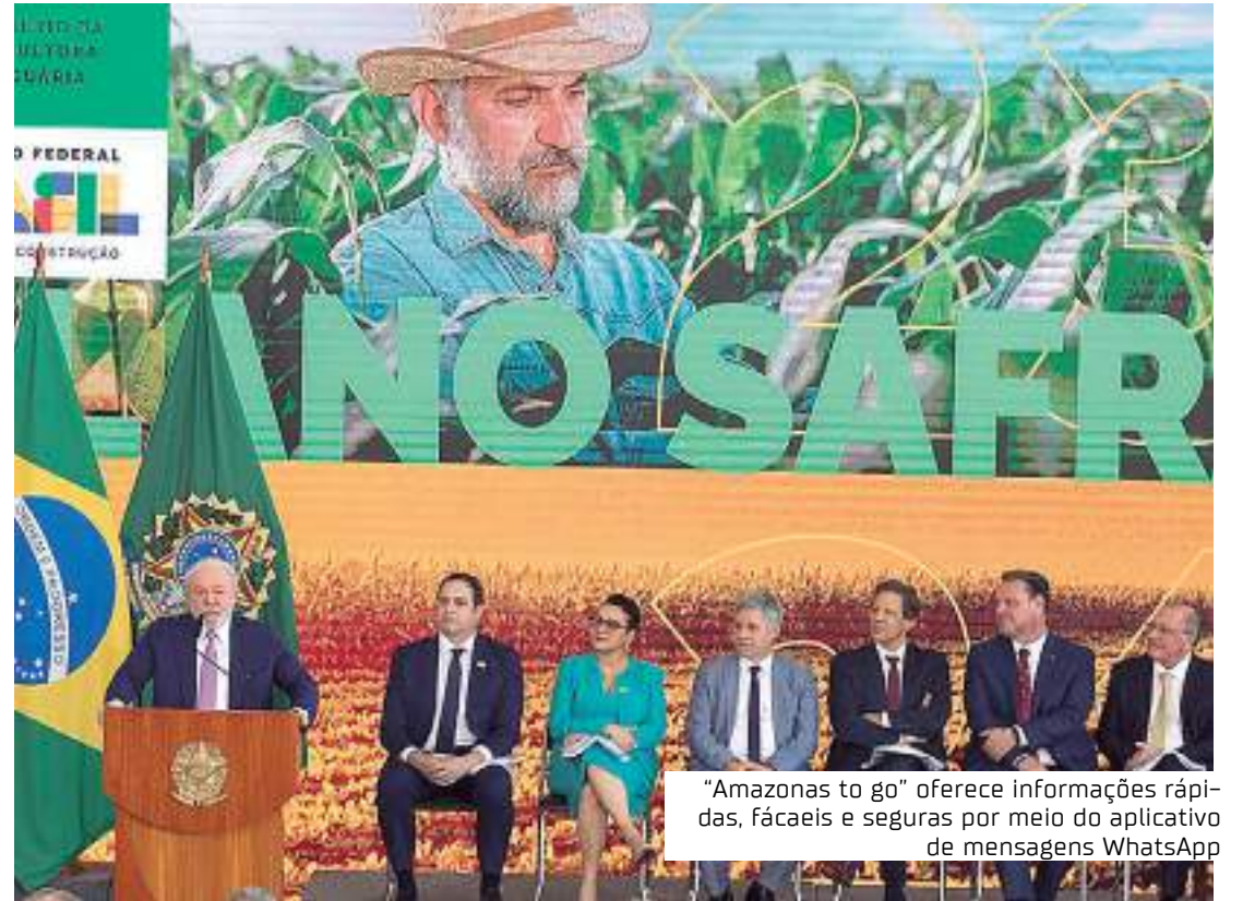
"Amazonas to go" oferece informações rápidas, fáceis e seguras por meio do aplicativo de mensagens WhatsApp

duo, o presidente da Associação Brasileira dos Produtores de Algodão (Abrapa), Alexandre Schenkel, destacou as ações dos governos anteriores do presidente Lula no apoio ao agronegócio, como renegociação de dívidas e garantia de preços mínimos, e disse que o crédito é, hoje, um dos principais insumos para viabilizar a atividade agropecuária, "permitindo trazer inovações tecnológicas, sustentabilidade e qualidade para a produção brasileira".