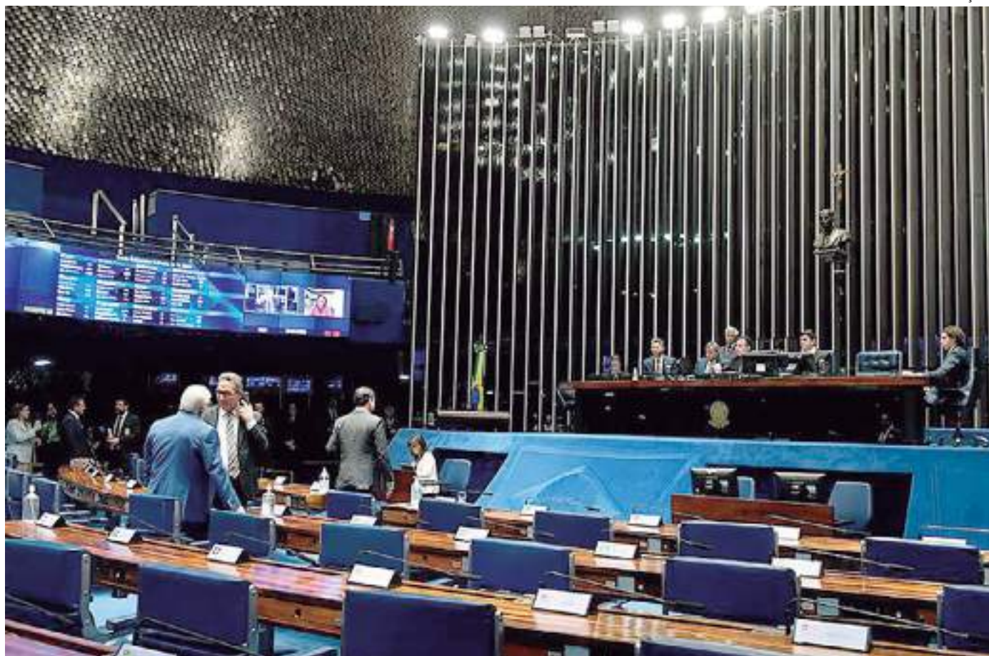
Originário da Câmara dos Deputados, o texto foi apresentado em 2016

O projeto também inclui como estratégias do PNE a coleta anual de dados sobre o nível de escolarização dos brasileiros no exterior e prevê a promoção de estudos a respeito com o objetivo de embasar políticas públicas para este seg-