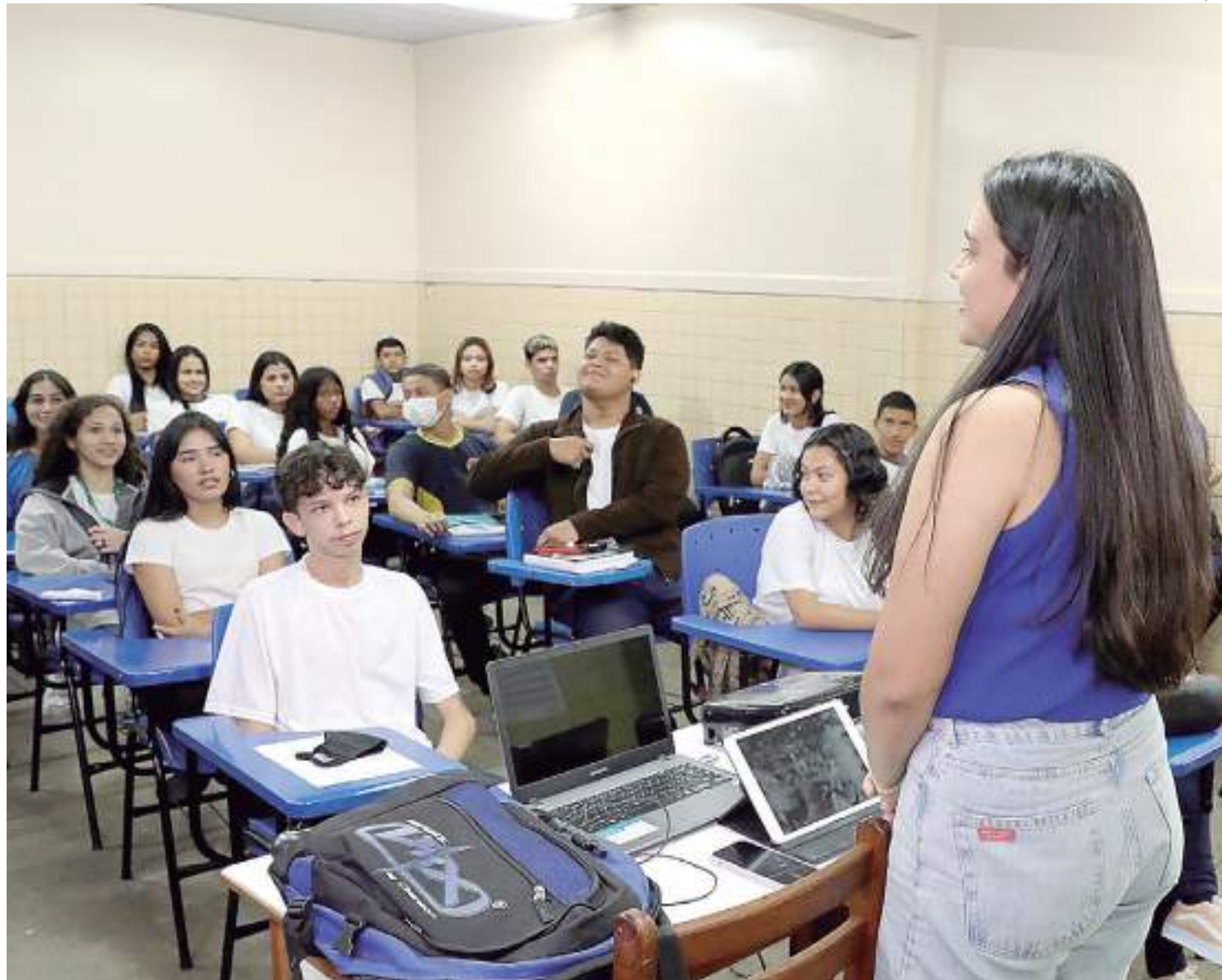
Valor pago aos profissionais do Amazonas é superior ao piso nacional

De acordo com a secretaria de Estado de Educação