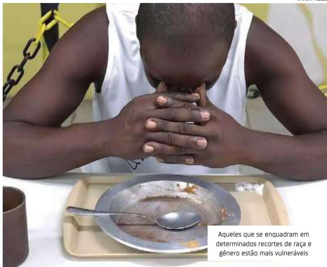
Aqueles que se enquadram em determinados recortes de raça e gênero estão mais vulneráveis

No total, 33,1 milhões de pessoas foram impactadas pela fome no país. Aqueles que se enquadram em determinados recortes de raça e gênero estão mais vulneráveis. Os lares chefiados por mulheres negras representam 22% dos que sofrem com o problema, quase o dobro em relação aos