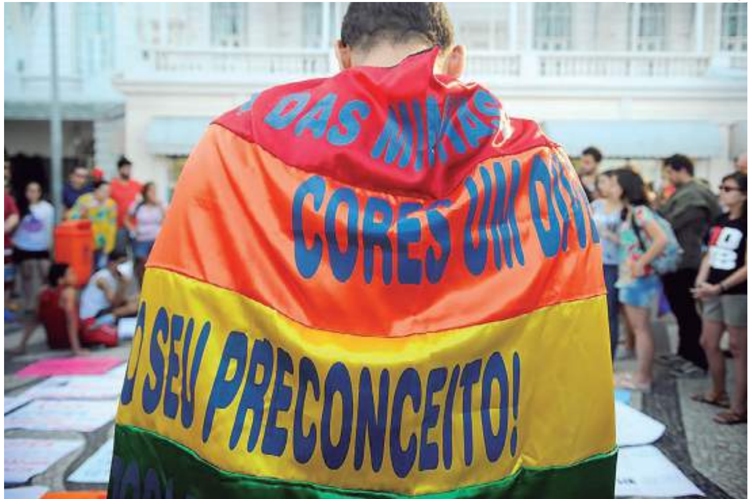
ONG Micro Rainbow Brasil é pioneira em empreendedorismo para essa comunidade