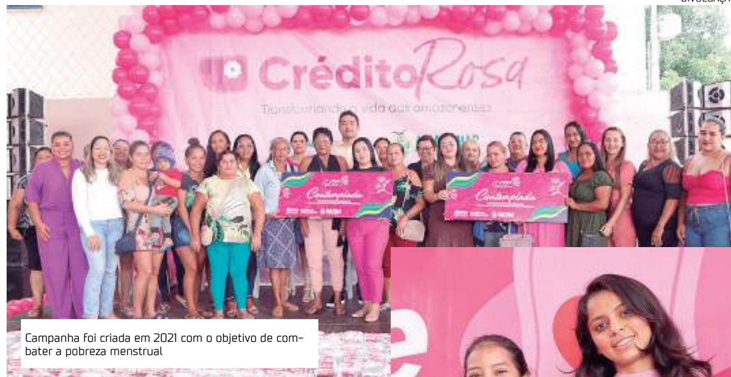
Campanha foi criada em 2021 com o objetivo de combater a pobreza menstrual

Na ocasião, a Seas entregou 80 cheques simbólicos para empreendedoras con-