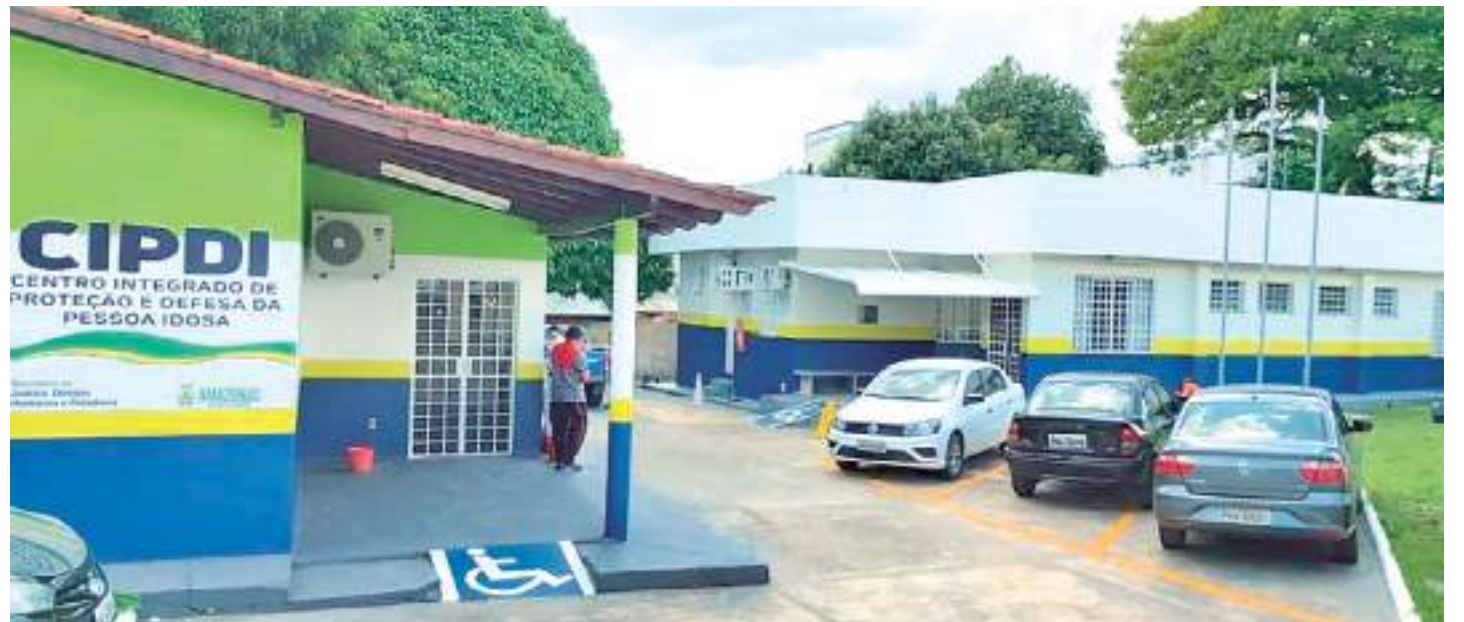
Delegacia Especializada em Crimes contra o Idoso (DECCI) atua na apuração desses delitos

CI é investigar todo e qualquer crime previsto no Estatuto do Idoso, ou outros crimes previstos em outras legislações, mas desde que ocorram em âmbito familiar e estejam vinculados à