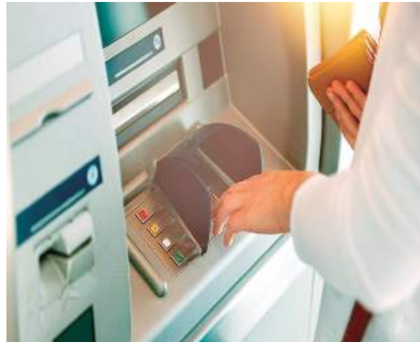
Antes do período de pandemia, 25% dos consumidores afirmavam utilizar dinheiro para mais de 75% das suas despesas mensais

A inclusão financeira não é distribuída uniformemente. Os ganhos em termos de inclusão financeira não são distribuídos uniformemente, uma vez que, entre os indivíduos que responderam à pesquisa, apenas 59% dos que têm baixa renda e 40% dos que vivem fora das grandes cidades afirmaram ter conta bancária.