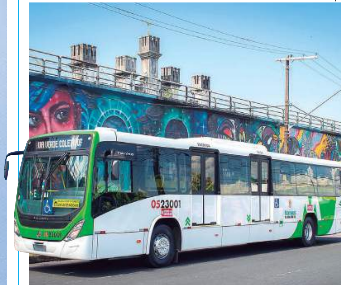
Agentes de trânsito e fiscais estarão no local para orientar condutores e usuários