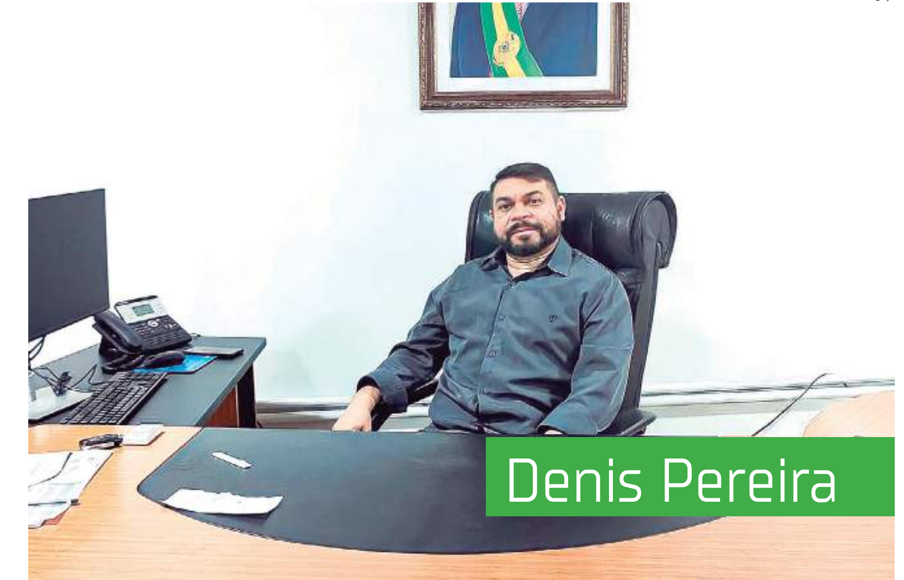
Presidente do Instituto Nacional de Colonização e Reforma Agrária (Incra), Denis da Silva Pereira

Precarização ou paralisação das Políticas Públicas que são atribuições do Incra: Criação de Projetos de Assentamentos, serviços de assistência técnica, estruturação de ramais, crédito, construção de casas em assentamentos da reforma agrária e comunidades tradicionais, fomento ao desenvolvimento agroindustrial das associações e cooperativas de agricultores familiares, regularização fundiária, Programa Nacional de Educação na Reforma Agrária (PRONERA), entre outros. Necessidade de reestruturação, reimplantação e criação de