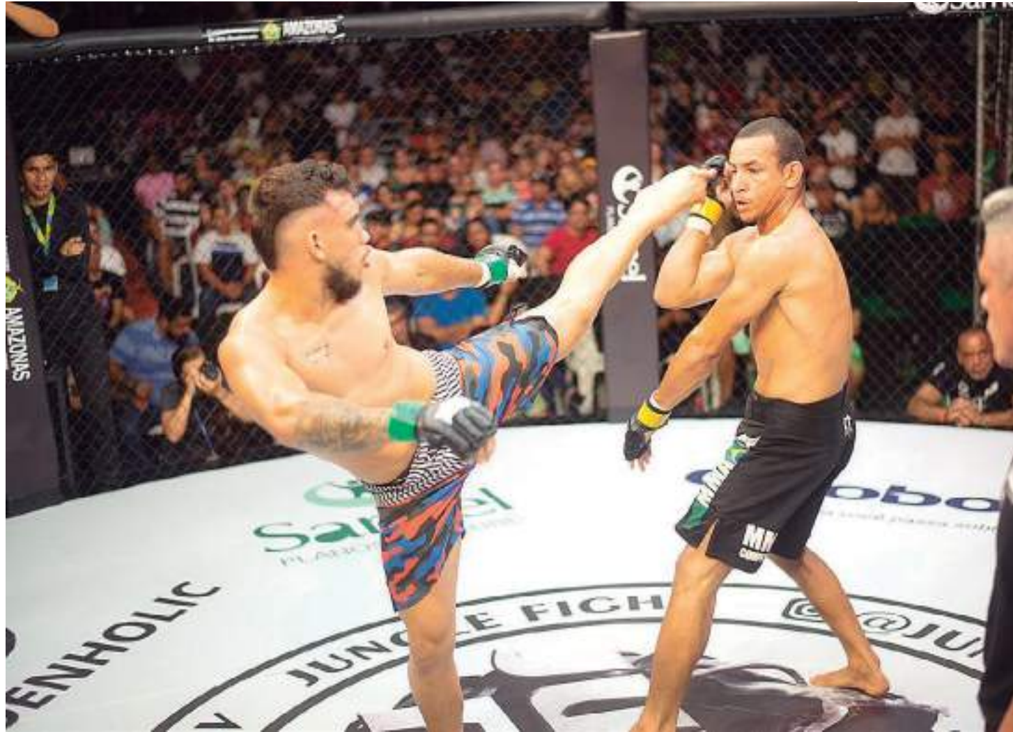
Competidores vão disputar evento de lutas que carrega o nome do maior atleta de MMA de Manaus, José Aldo

"Minha equipe tem preparado uma rotina de treino para que eu possa desenvolver um trabalho totalmente diferente daquilo que eu normalmente apresento em minhas lutas, afinal, desta vez estarei lutando Kickboxing e não Muay thai, que é o mais habitual em minha rotina. Eu nunca penso sobre 'vencer ou perder', o mais importante é ter uma boa