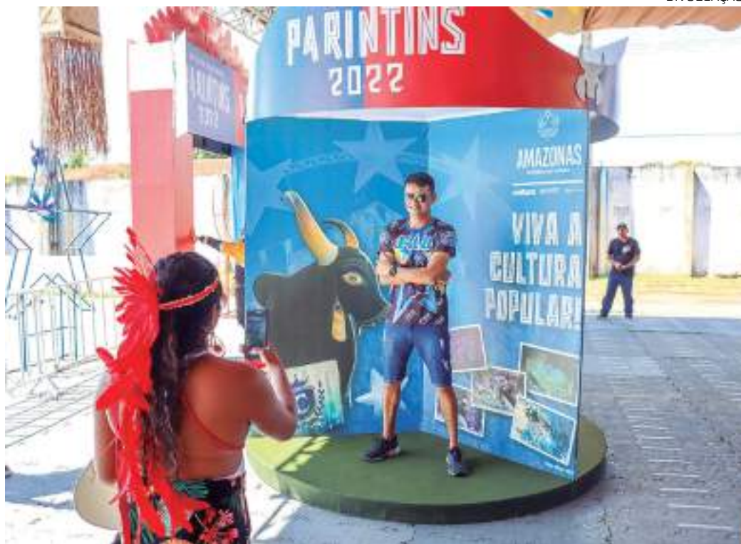
Evento tem espaços instagramáveis