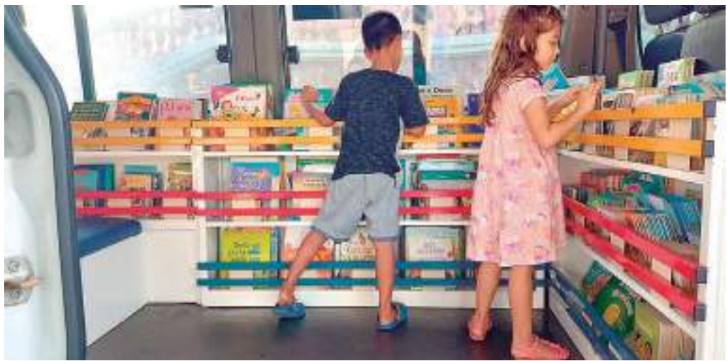
Iniciativa promove a divulgação dos trabalhos de escritores amazonenses