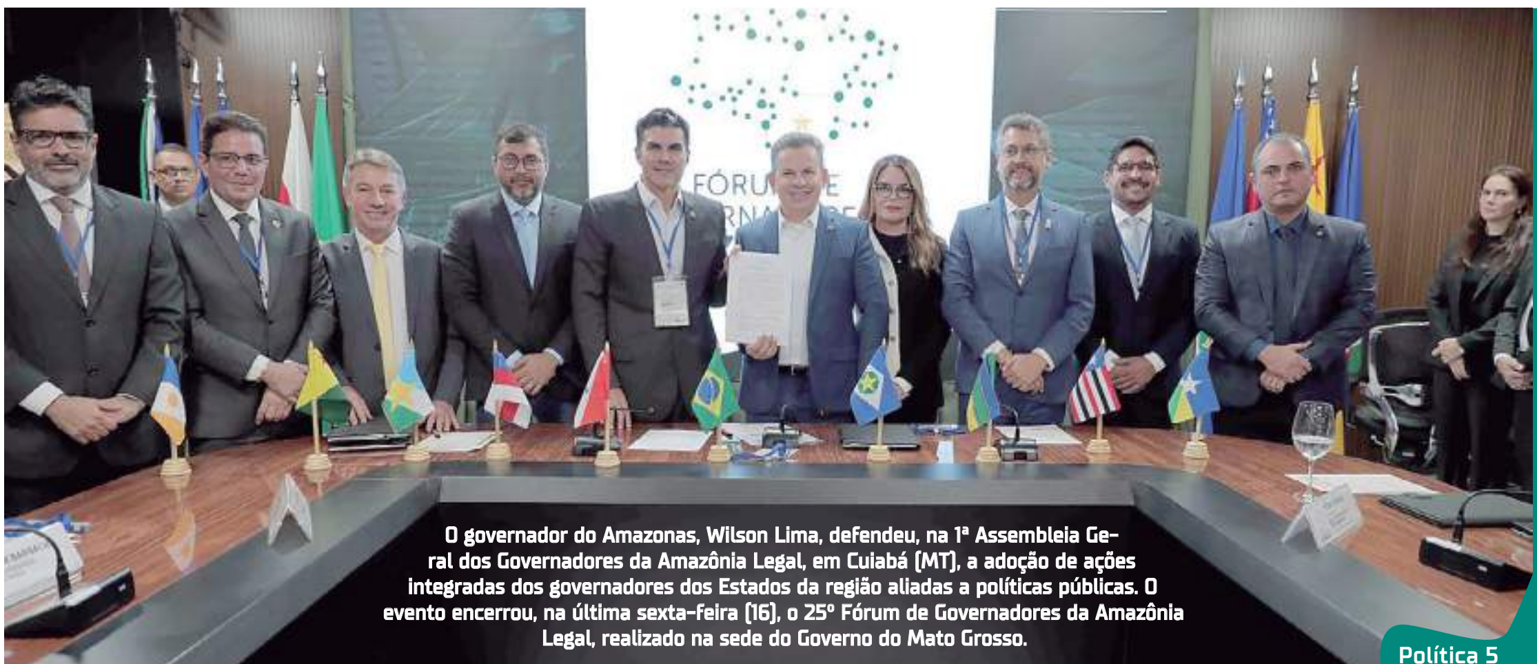
O governador do Amazonas, Wilson Lima, defendeu, na 1ª Assembleia Geral dos Governadores da Amazônia Legal, em Cuiabá (MT), a adoção de ações integradas dos governadores dos Estados da região aliadas a políticas públicas. O evento encerrou, na última sexta-feira (16), o 25º Fórum de Governadores da Amazônia Legal, realizado na sede do Governo do Mato Grosso.