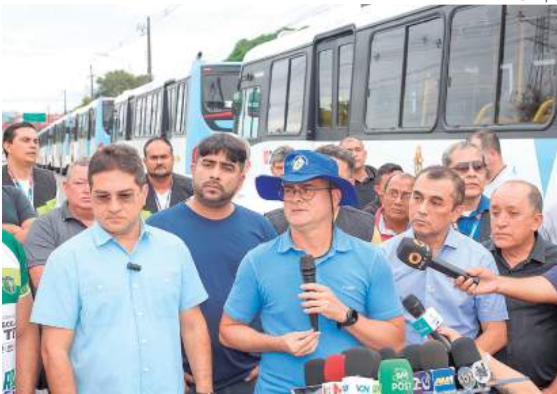
David Almeida enfatizou que 12 ônibus de nova frota entregue são elétricos

"Conforme o compromisso assumido, estamos entregando 22 ônibus de um total de 150 que nós vamos colocar no sistema ainda este ano. Deste número, teremos 12 elétricos. Esses ônibus que estão sendo apresentados foram contratados pela empresa Veja, de um total de 40. Já colocaremos à disposição da po-