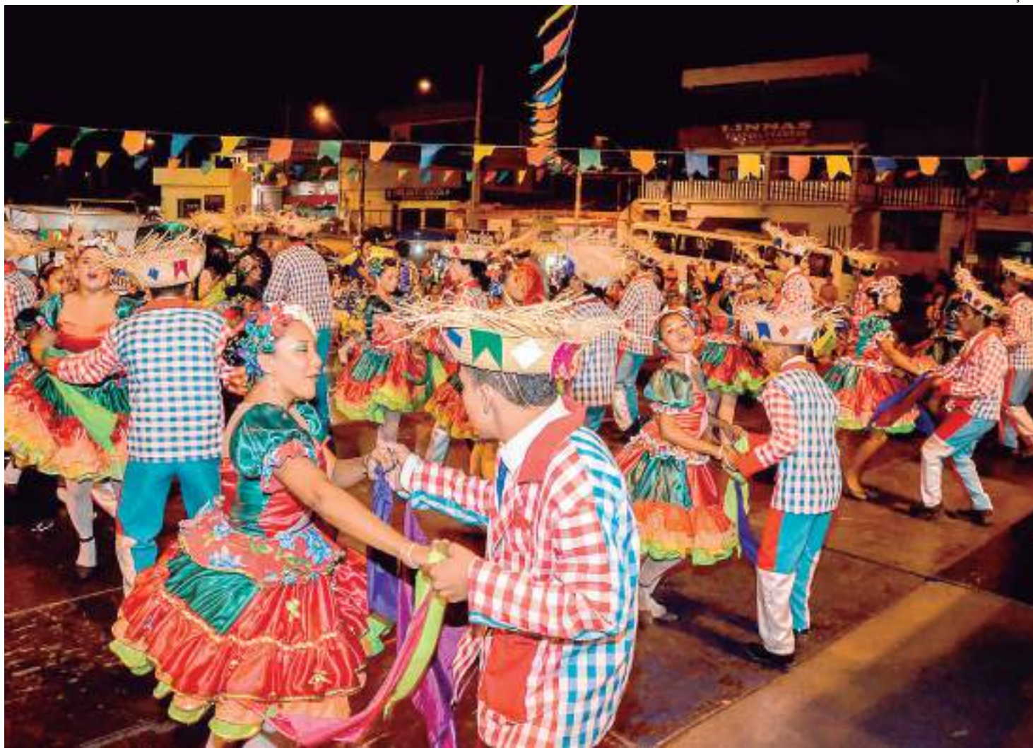
Festejos juninos no Brasil possuem forte influência da Europa e África

Além da quadrilha, a dança de fitas, o vanerão, que é presente no sul do país como uma dança de origem alemã, e a ciranda também são danças tradicionais. No Norte do país há diversas danças, nem todas conhecidas pelo