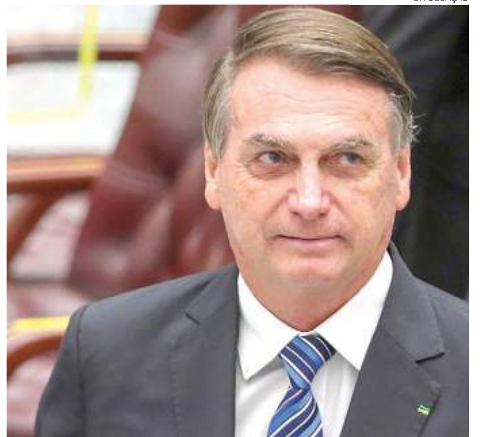
Segundo advogados, Bolsonaro não sabia de trama arquitetada por Mauro Cid

No dia 7 de junho, também foi divulgada a informação de que uma suposta minuta de um decreto de Garantia da Lei e da Ordem (GLO) e textos que seriam destinados a dar suporte ao governo em um eventual golpe de Estado foram encontrados pela PF no celular de Cid.