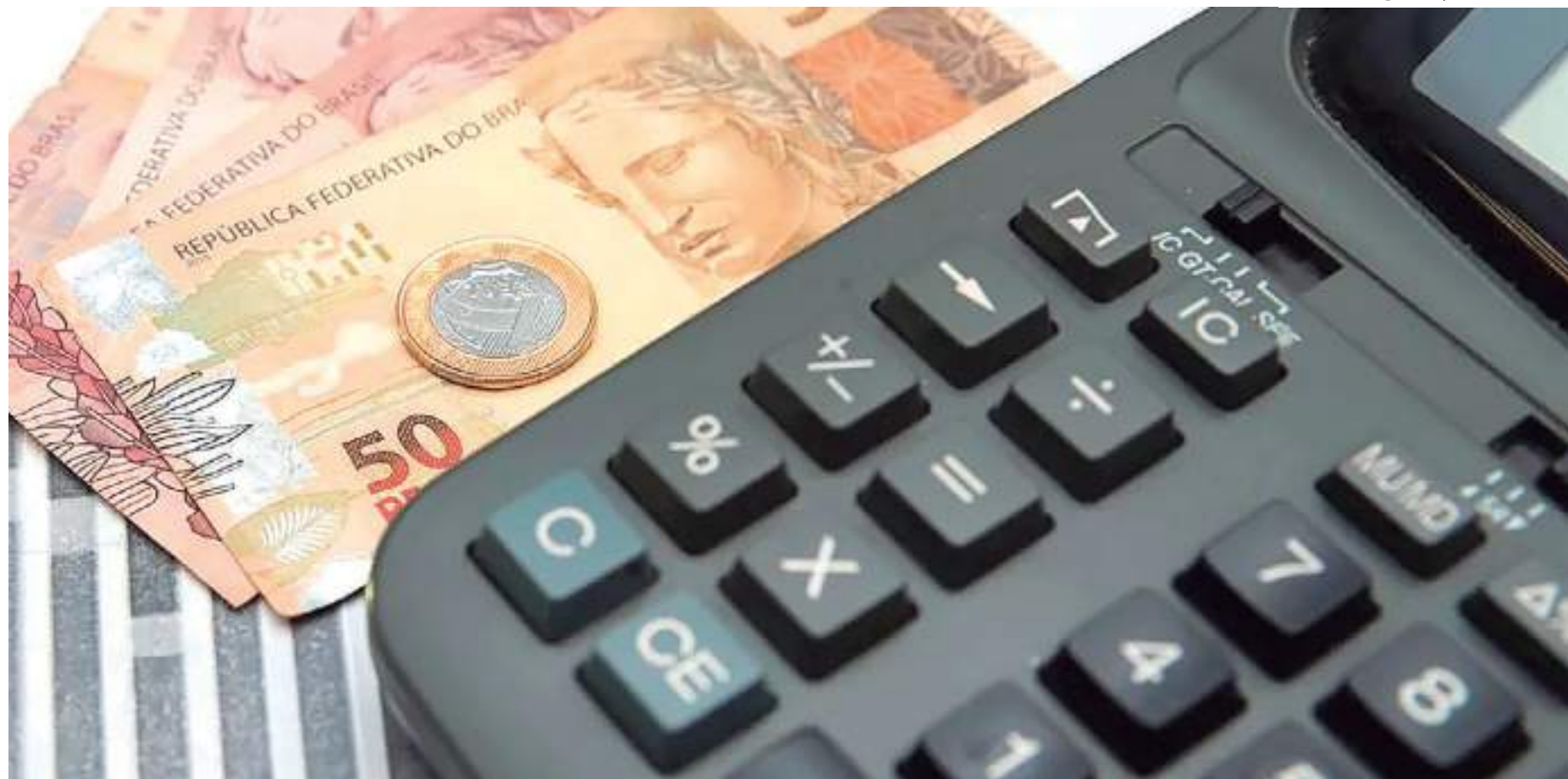
O ÍNDICE DE ATIVIDADE ECONÔMICA (IBC-BR) DO BANCO CENTRAL é considerado uma prévia do PIB

Em março de 2021, o BC iniciou um ciclo de aperto monetário, em meio à alta dos preços de alimentos, de energia e de