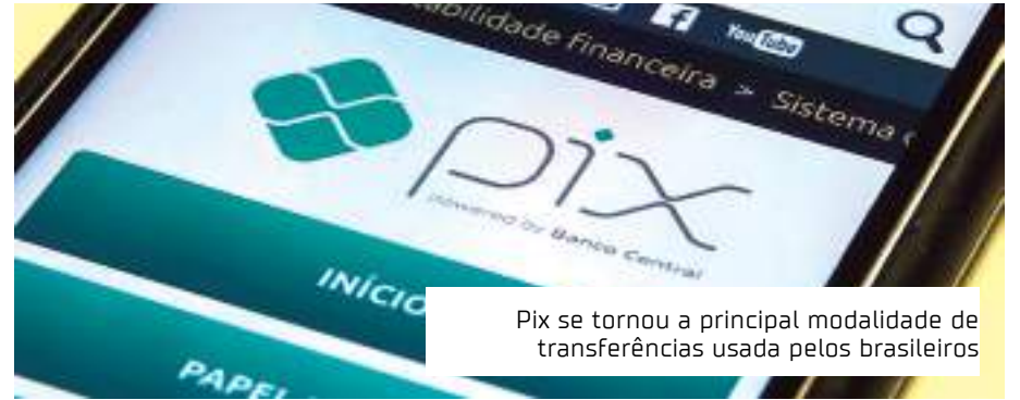
Pix se tornou a principal modalidade de transferências usada pelos brasileiros

A Justa, fintech de meios de pagamento que inclui o Pix e as maquininhas, apresenta um crescimento fluido e constante na quantidade de lojistas utilizando a modalidade de pagamento instantâneo desde julho de 2022. Comparando os dados de todo o ano passado com os quatro primeiros meses de 2023, houve um crescimento de 84% no volume de transações e de 69% em movimentações financeiras. A quantidade de lojistas a adotarem o Pix para o