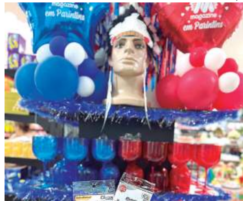
Copos, balões e suportes em azul e vermelho para decorar as festas