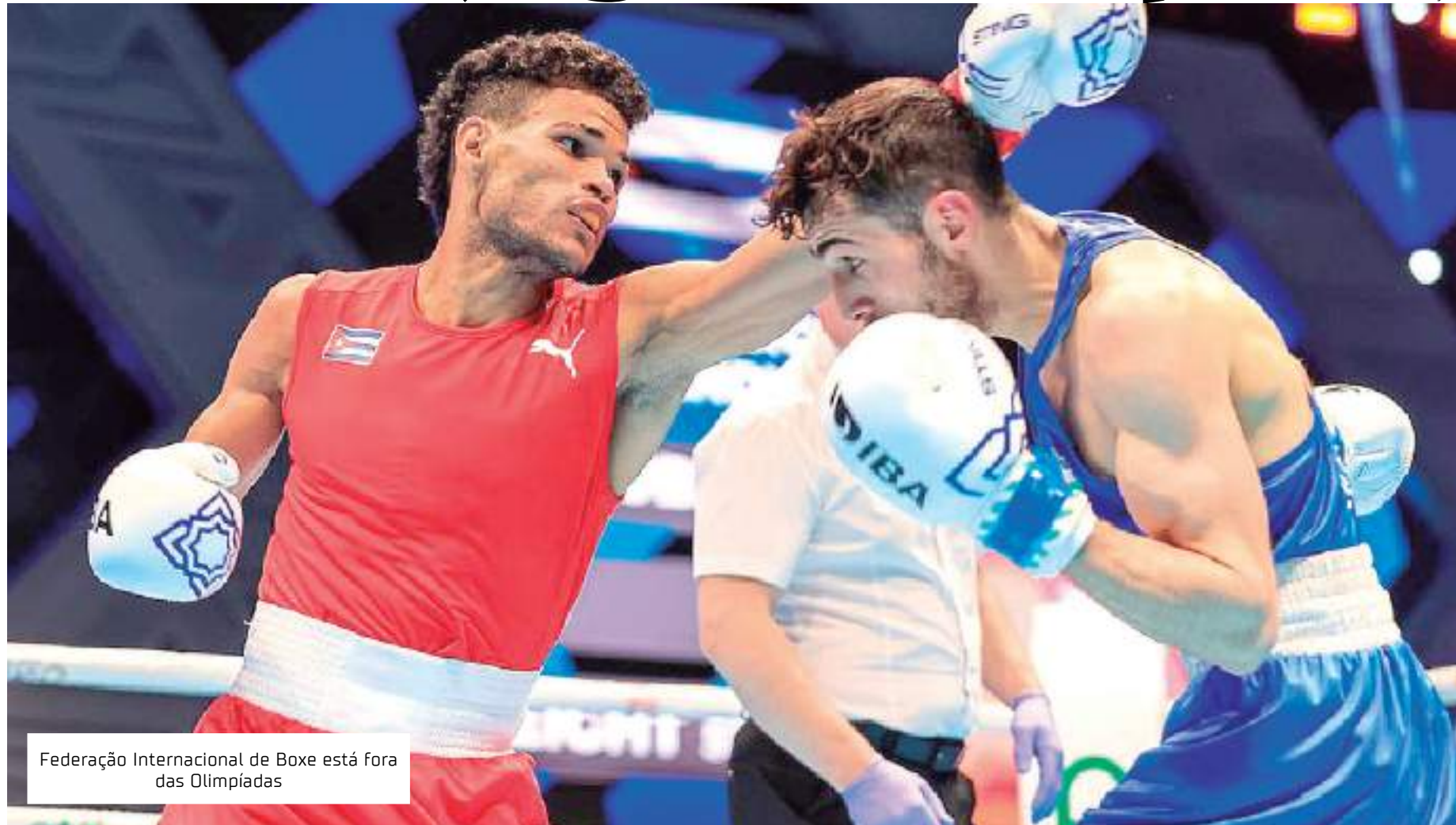
Federação Internacional de Boxe está fora das Olimpíadas

Com a credibilidade arranhada por escândalos de arbitragem e um ex-dirigente considerado pelos Estados Unidos "um dos líderes do crime organizado" no Uzbequistão, a Federação de boxe tinha prometido esforços para se reformular após a chegada do novo presidente, o russo Umar Kremlev, em dezembro de 2020.