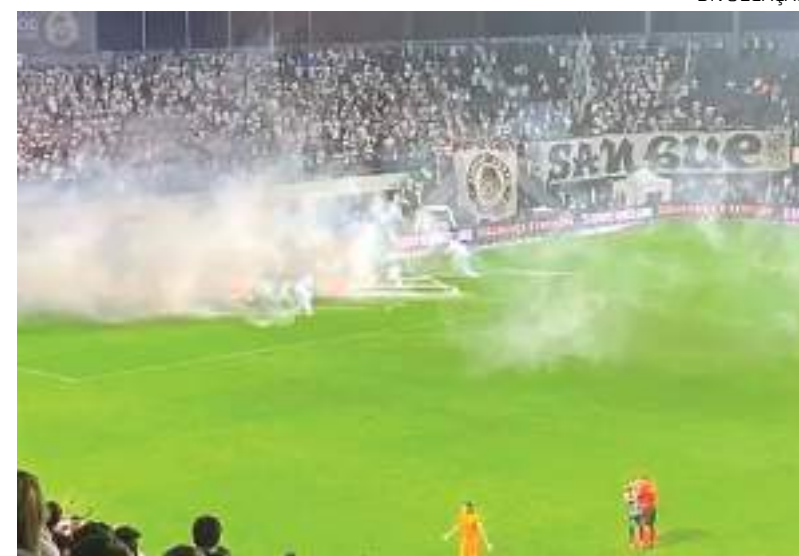
Torcedores do Santos jogaram bomba no campo de futebol, após derrota