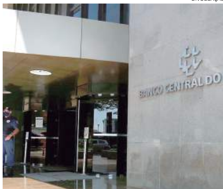
Banco Central manteve Selic em 13,75% ao ano e frustrou expectativas

Procurada, a Febraban, entidade que representa os maiores bancos brasileiros, não quis comentar a decisão do Copom.