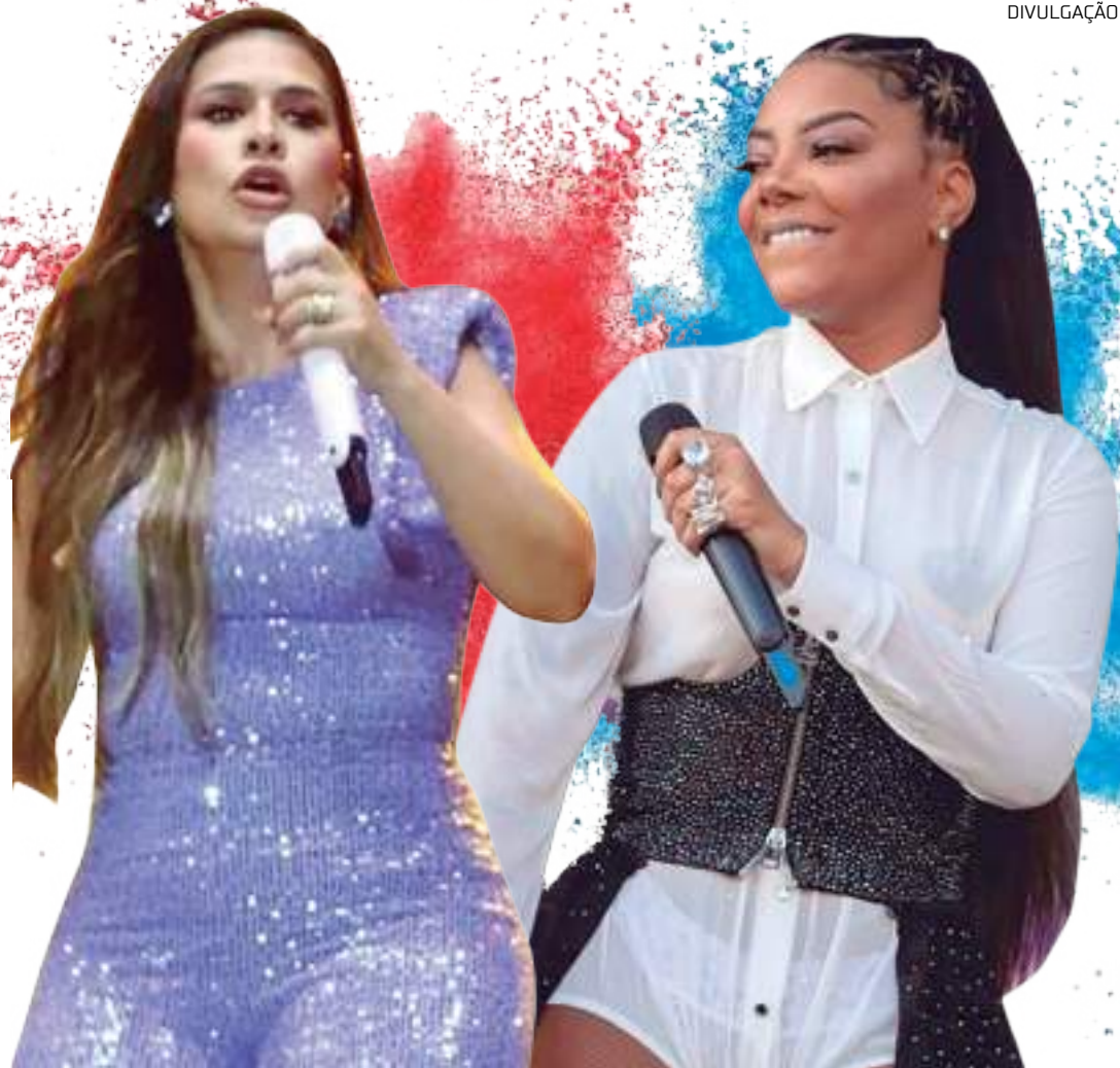
"Amazonas to go" oferece informações rápidas, fáceis e seguras por meio do aplicativo de mensagens WhatsApp

dante a doação de dois itens de uma lista predefinida de produtos não perecíveis. Para cada doação, um CPF será cadastrado para o recebimento de uma pulseira de acesso à festa. A ação é um resultado da parceria entre a pasta de Cultura e de Assistência Social. Um posto de arrecadação e armazenagem