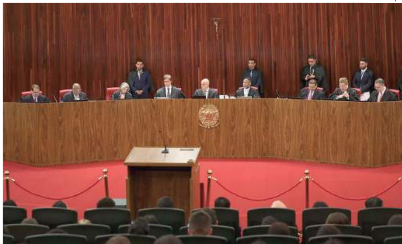
Caso o parecer seja acolhido, o ex-presidente Jair Bolsonaro ficará inelegível por 8 anos

Bolsonaro, porém, recorreu a um aproveitamento “arbitrário da situação propiciada pelo desempenho