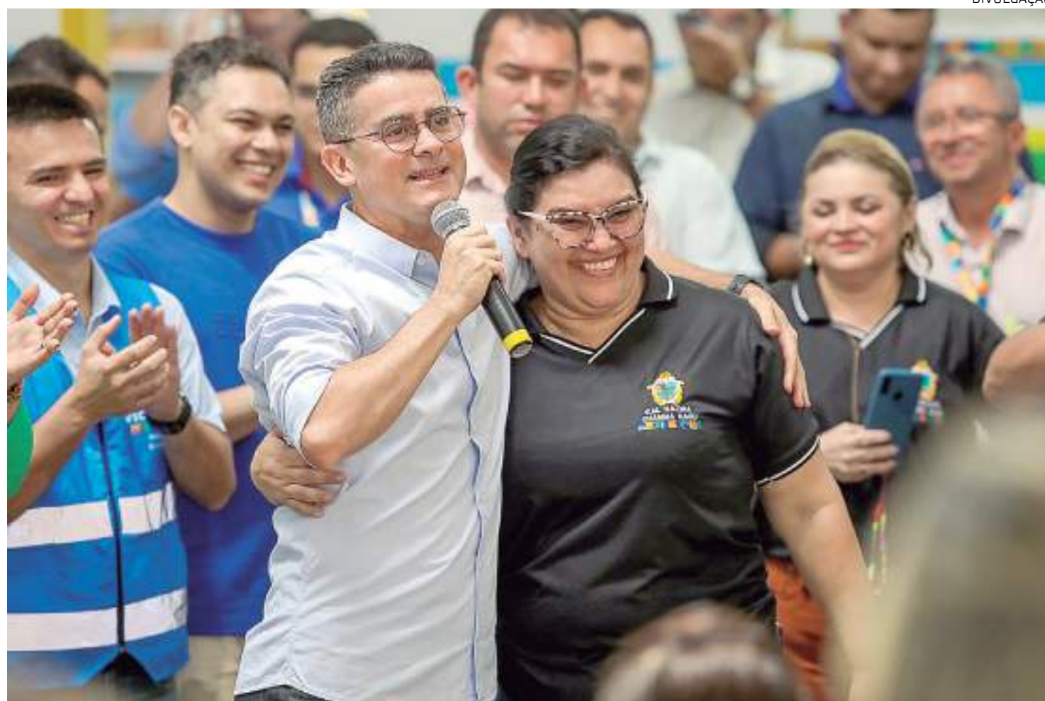
Servidores públicos e David Almeida celebram avanços na gestão da capital amazonense

A Lei nº 3.078 foi publicada na edição nº 5610, do