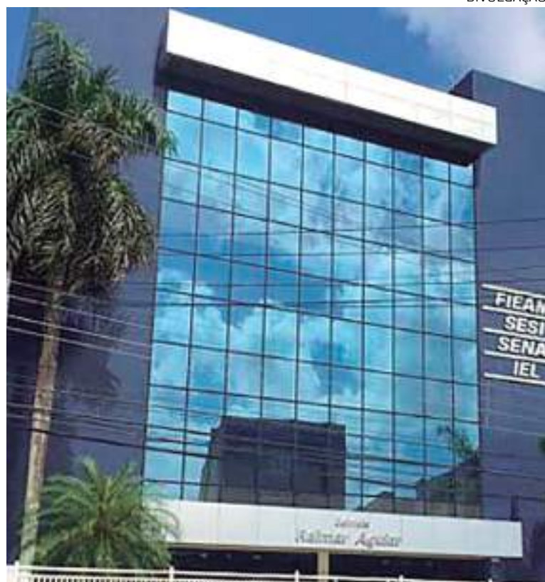
PQA tem como finalidade disponibilizar metodologias para processos do PIM

“Nosso tema este ano é para reforçar o compromisso das organizações do Amazonas, em especial as Indústrias com a Sustentabilidade Ambiental. Sabemos que no Polo Industrial de Manaus, o compromisso com o meio ambiente deve ser prioridade, uma vez que temos normas rígidas que as indústrias precisam cumprir. É importante ressaltar para todo país que a Indústria Amazônica ajuda a preservar nossa floresta”, conclui.