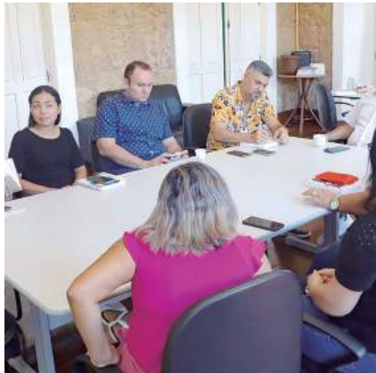
Comissão interna é responsável pela pré-seleção dos artistas