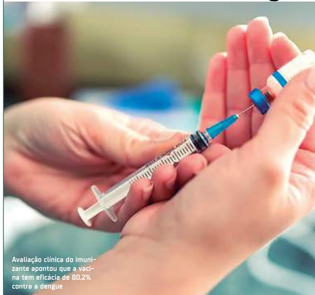
Avaliação clínica do imunizante apontou que a vacina tem eficácia de 80,2% contra a dengue

A Associação Brasileira de Clínicas de Vacinas (ABCVAC) informou que uma nova vacina contra a dengue deve chegar ao Brasil na próxima semana. Composta por quatro diferentes sorotipos do vírus causador da doença, a Qdenga, da empresa Takeda Pharma Ltda., foi aprovada pela Agência Nacional de Vigilância Sanitária (Anvisa) em março. De acordo com o órgão regulador, a dose confere ampla proteção contra a dengue.