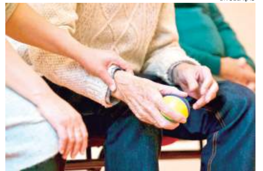
Envelhecimento populacional cresce de forma acelerada