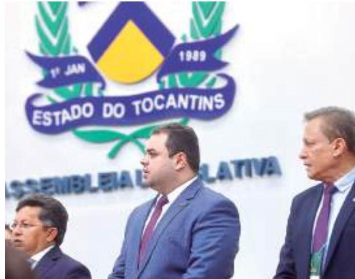
Presidente da Aleam destacou importância do Parlamento Amazônico

Tendo como principais temas debatidos a regularização fundiária e o licenciamento ambiental, a reunião foi realizada no plenário da Assembleia Legislativa do Tocantins (Alet) e contou com a presença de parlamentares das Assembleias Legislativas que