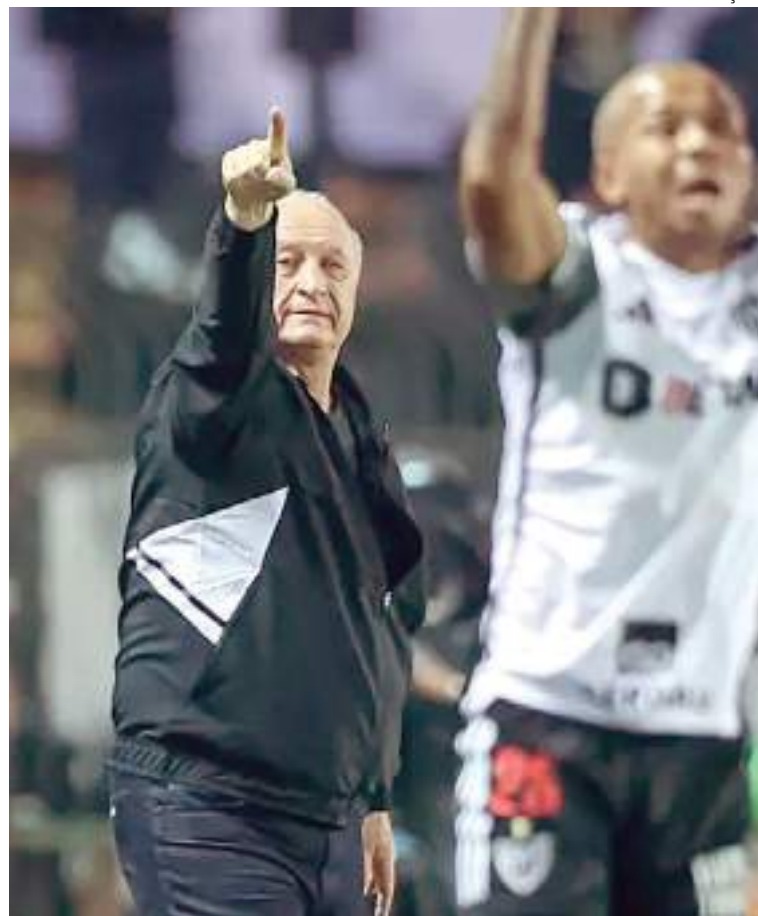
Treinador estreou pelo Galo no jogo contra o Fluminense