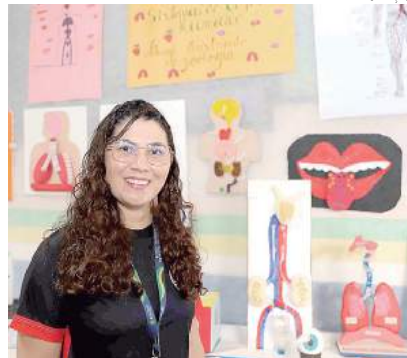
Com atividades sensoriais, trabalho envolve alunos do Ensino Fundamental