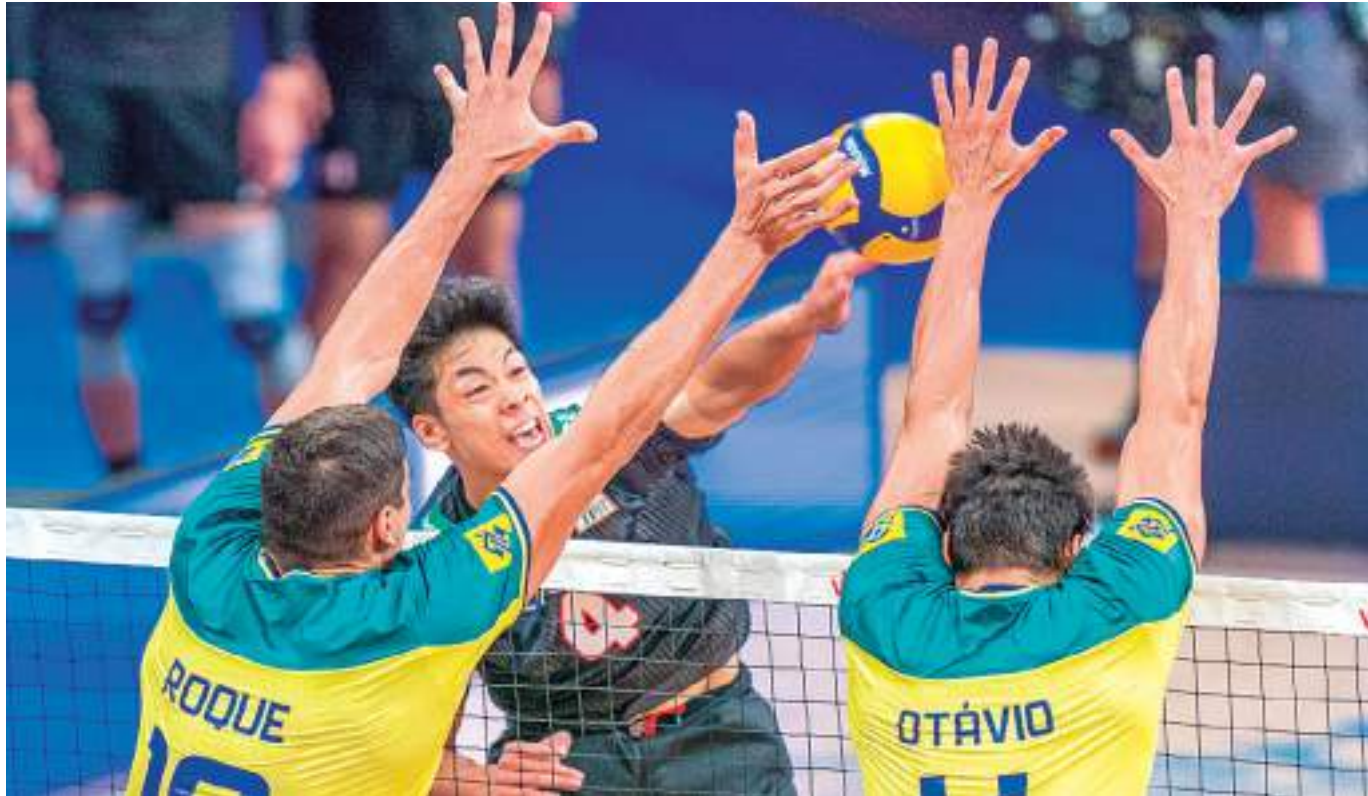
Jogadores brasileiros não conseguiram resistir a força do ataque japonês