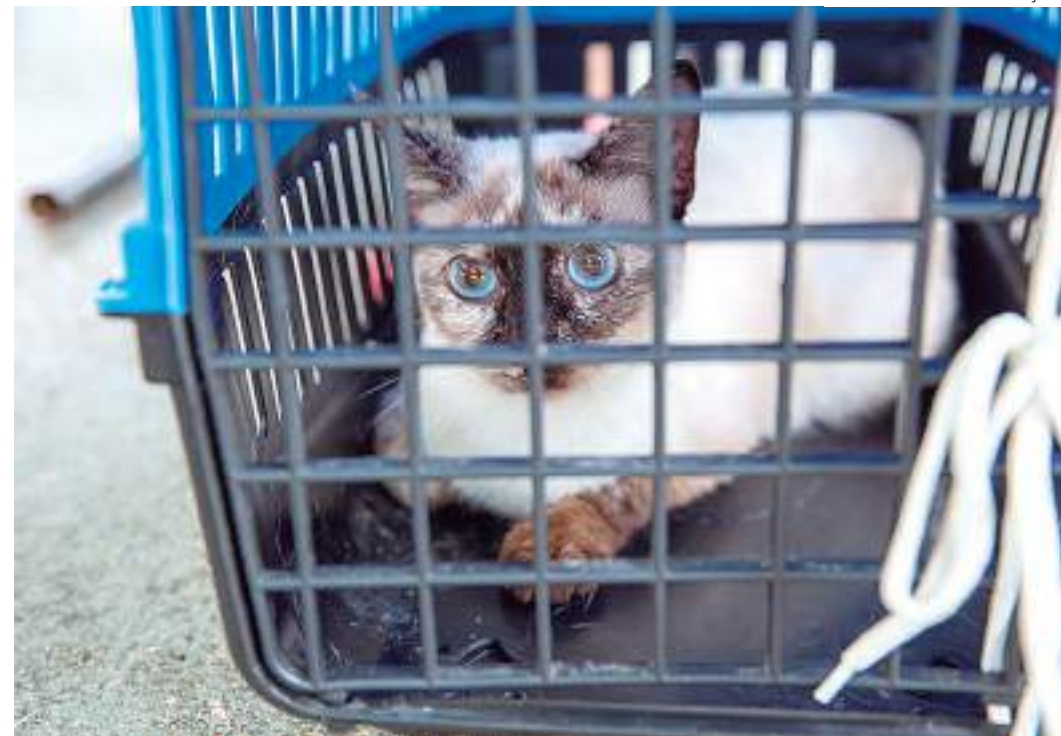
O sistema libera vagas nos dias 30 de junho e 14 de julho

Mais informações sobre o procedimento podem ser obtidas pelo Disque Saúde, no 0800 280 8280, de segunda a sexta-feira, das 8h às 12h e das 13h às 17h, ou pelo e-mail cczcidadao@pmm.am.gov.br .