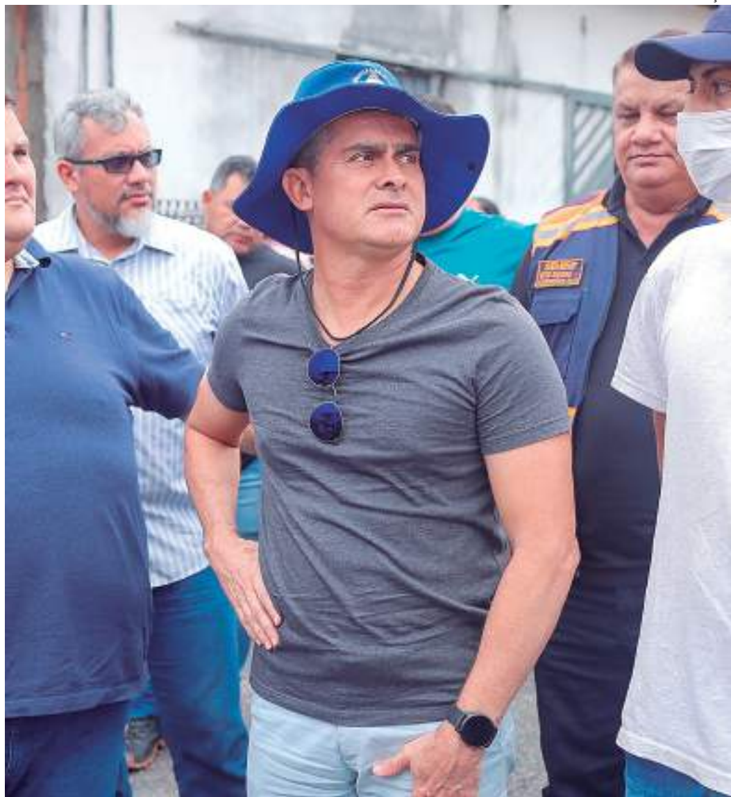
Ordem de serviço foi assinada na quinta-feira, 22 de junho

Segundo o chefe do Executivo municipal, a prioridade do pacote de obras visa atender bairros que ainda não têm asfalto. "Nas próximas semanas, com o sol abrindo, nós estaremos entrando com asfalto aqui nas comunidades, atendendo essa demanda da população que mora aqui nessas áreas, que por muito tempo esteve abandonada",