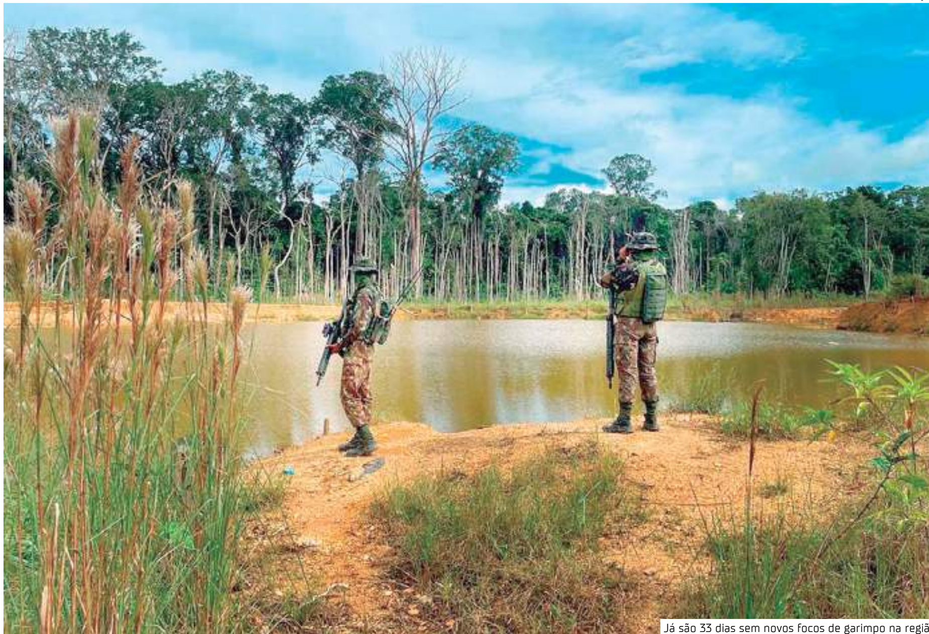
Já são 33 dias sem novos focos de garimpo na região

Sistema de satélites utilizados não identifica novas áreas de garimpo há um mês