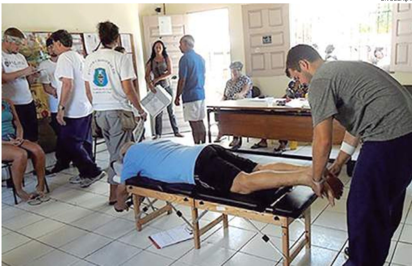
Atividade acontece de 9h às 17h na unidade 5 da instituição

"A ação vai contar com uma equipe de triagem para reali-