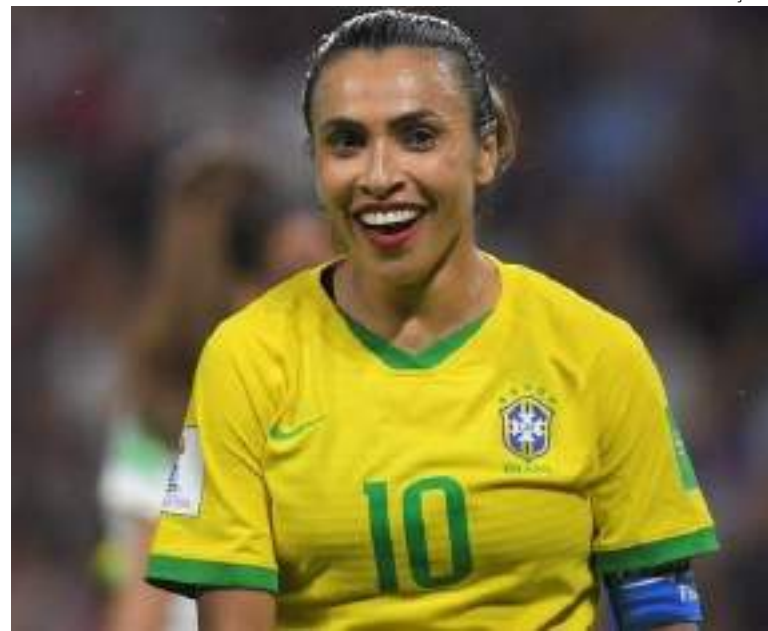
Jogadora brasileira, Marta, tem declarado R$ 63 milhões