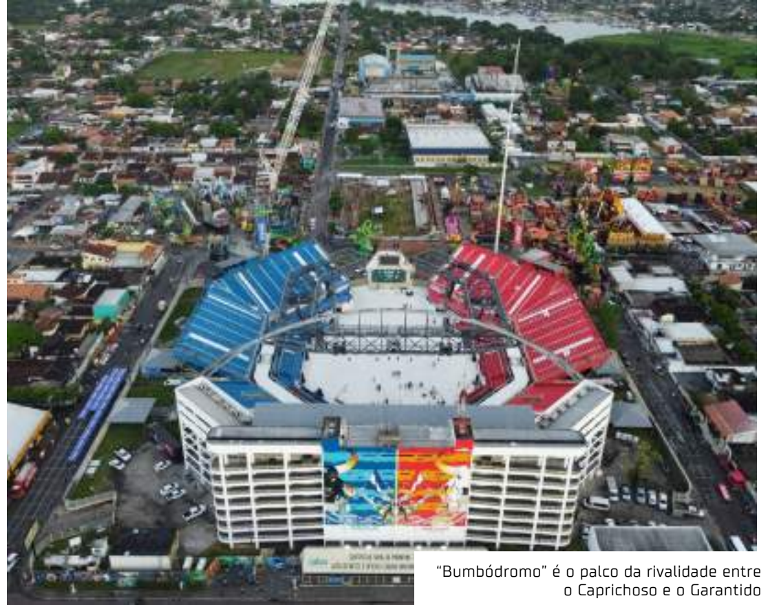
"Bumbódromo" é o palco da rivalidade entre o Caprichoso e o Garantido

Cada boi escolhe um tema para defender nas três noites festival. Para 2023, o Caprichoso levará ao Bumbódromo "O Brado do Povo Guerreiro", já o Garantido, "Garantido Por Toda a Vida". O tema é dividido em três partes e o bumbá apresenta um em cada noite. Os assuntos abordados em cada tema e subtema tem a ver com a cidade de Parintins,