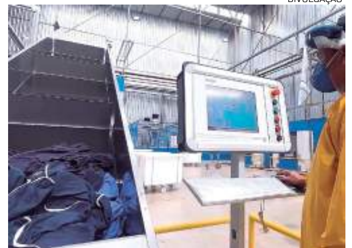
Implementação do serviço de rouparia por rastreabilidade

A Fundação Hospital do Coração Francisco Mendes é referência no Estado do Amazonas no serviço de alta