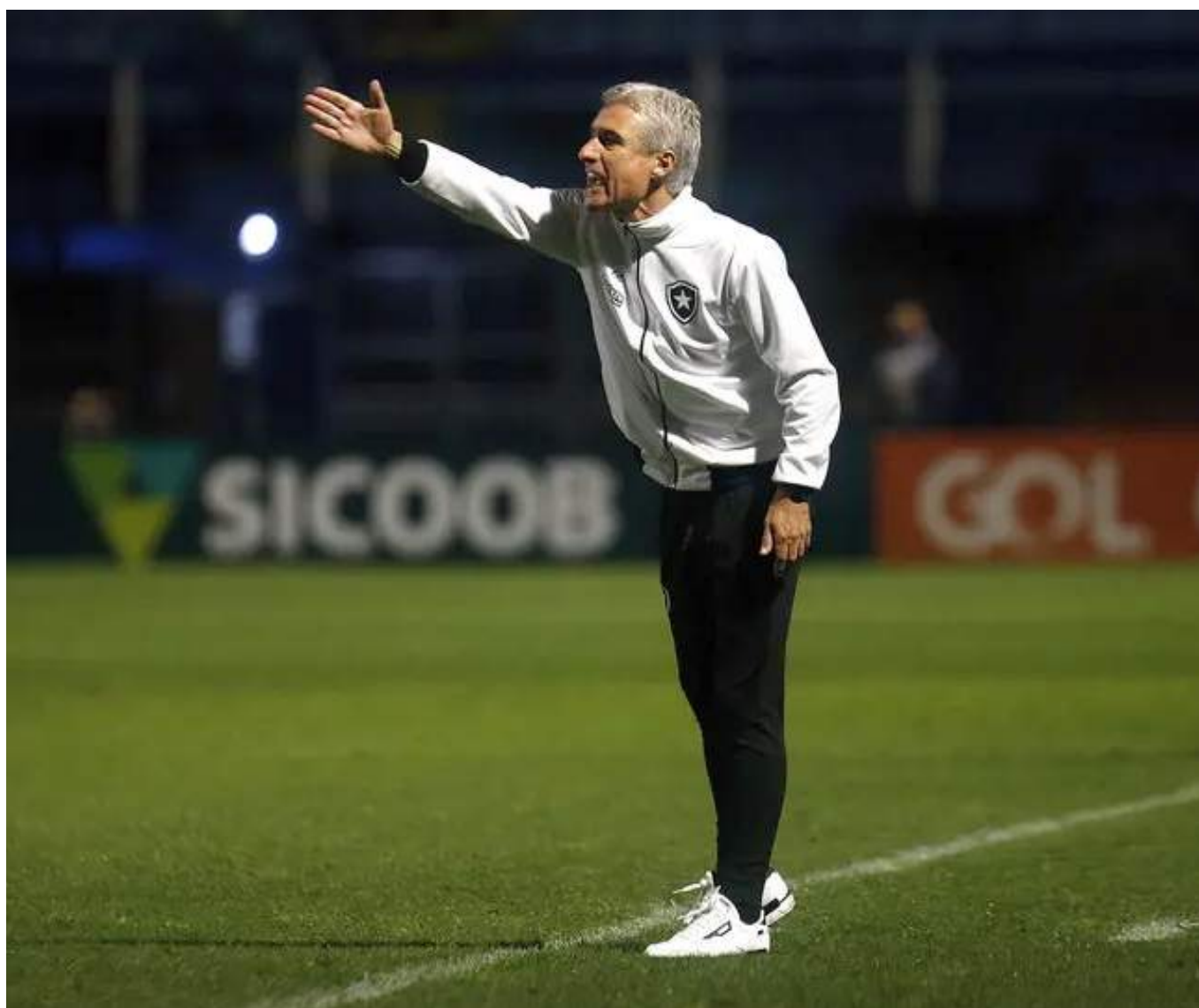
Luís Castro é o novo técnico do time de Cristiano Ronaldo, Al-Nassr

Luís Castro chegou ao Botafogo em abril de 2022, ao sair do Al Duhail, do Qatar. Castro deixa o Botafogo na liderança do Campeonato Brasileiro, com sete pontos de vantagem para o vice-líder Grêmio. Ao todo, o português comandou o Glorioso em 81 partidas, com 44 vitórias, 14 empates