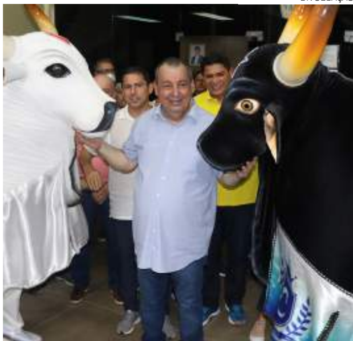
Espaço promoverá a preservação do patrimônio cultural

O financiamento do projeto foi viabilizado graças à emenda parlamentar do senador Omar Aziz, que tem se empenhado em trazer benefícios para o Amazonas e acredita