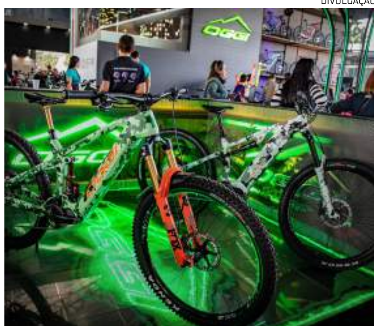
E-bikes estão revolucionando a forma como se deslocar nas cidades

Com mais de 430 profissionais especializados, a Oggi cria produtos duráveis, confortáveis e seguros utilizando a tecnologia. Além disso, oferece um seguro gratuito de 14 meses contra roubo e furto qualificado.