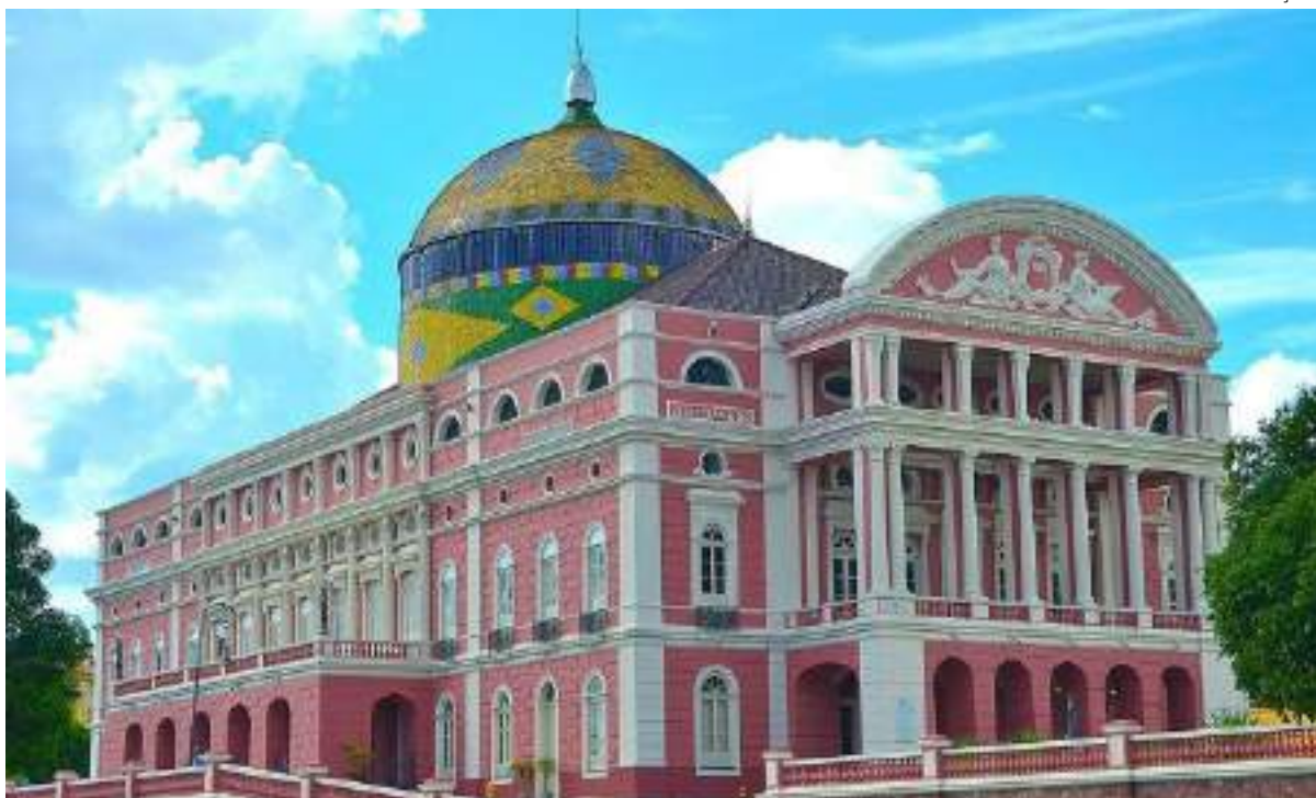
Show no Teatro Amazonas tem como proposta promover o encontro de diferentes vozes do canto lírico e popular