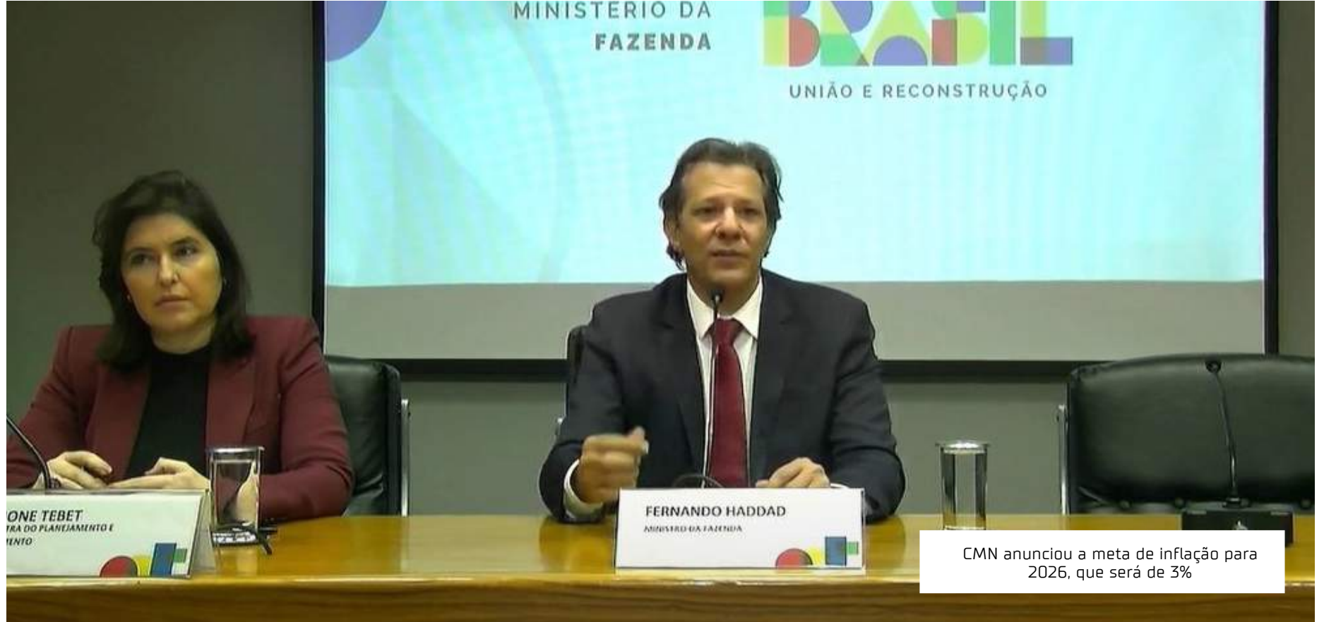
CMN anunciou a meta de inflação para 2026, que será de 3%

Para este ano, a meta foi mantida em 3,25%, também com tolerância de 1,5 ponto percentual. O regime de metas de inflação existe desde 1999, com o CMN aprovan-