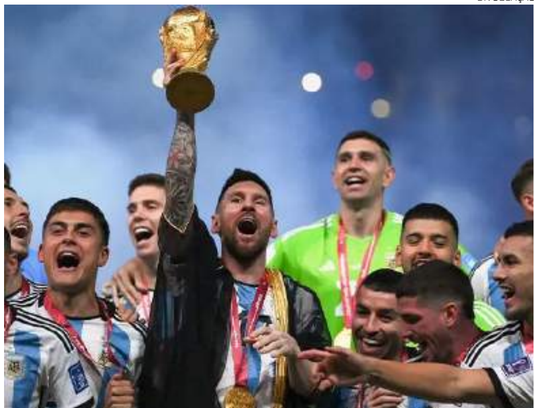
Fifa divulgou ranking de melhores seleções do mundo, com Argentina no topo da tabela