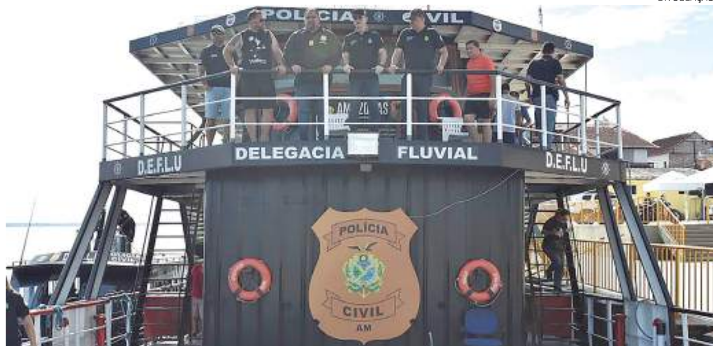
Delegacia está situada em um ponto estratégico da Ilha Tupinambarana

A Polícia Civil do Amazonas (PC-AM), por meio do Departamento de Polícia do Interior (DPI), inaugurou, na manhã desta quinta-feira (29), a Delegacia do Turista. A unidade funcionará exclusivamente durante o 56º Festival Folclórico de Parintins, das 8h às 17h, nos dias 29/06, 30/06 e 1º/07, e das 8h às 12h, no dia 2/07. A estrutura está preparada para atender as demandas dos brincantes que vieram prestigiar a dis-