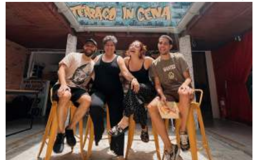
Musical está previsto para estrear em 2024