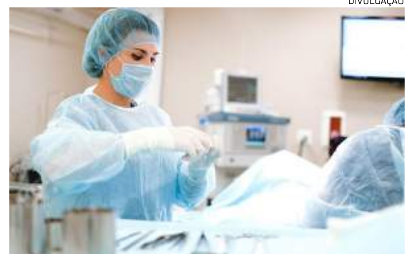
Especialização traz diversas vantagens profissionais