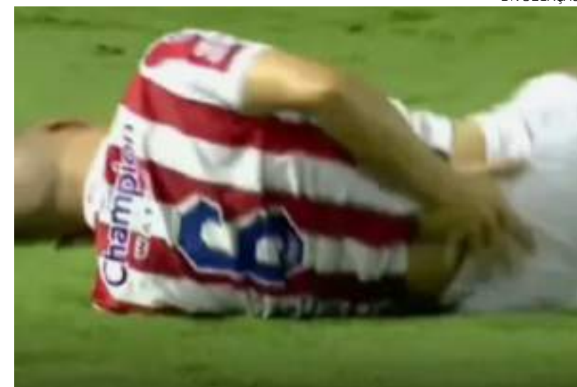
Diego sofreu fratura grave na coluna durante dividida com Yuri Ferraz