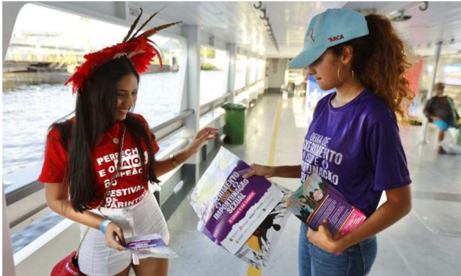
Mulheres aprovaram a iniciativa do Poder Legislativo

Na quarta-feira (28), as equipes da Procuradoria da Mulher fizeram um grande arrastão na parte da tarde em Manaus, onde o movimento de embarque para a Ilha Tupinambarana é gigantesco. A importunação sexual, que é um crime contra a dignidade da mulher, acontece muitas vezes nas redes dentro dos barcos regionais. A meta é justamente acabar com esse tipo