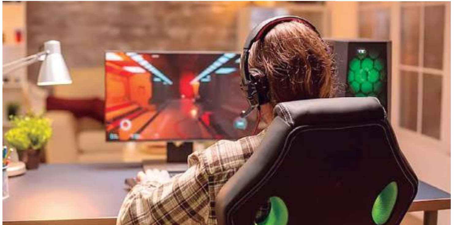
Cerca de 74% das pessoas no Brasil se declararam adeptas de jogos eletrônicos

"O marco legal não apenas propõe adequação da legislação vigente à realidade virtual, como o