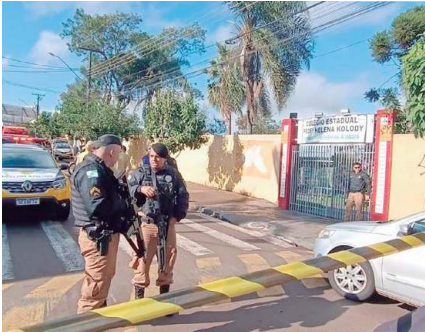
Policiais em frente à escola estadual Professora Helena Kolody, em Cambé (PR), após ataque a tiros