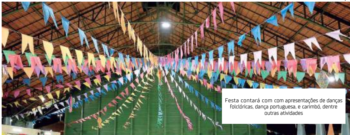
Festa contará com apresentações de danças folclóricas, dança portuguesa, e carimbó, dentre outras atividades

"Este ano estou liberada pelo meu cardiologista, fiquei tão feliz com essa notícia, o parque me ajuda diariamente. Eu tenho