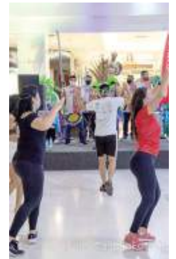
Aulão acontece no Shopping Ponta Negra