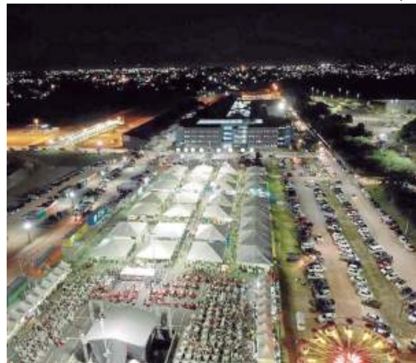
Evento acontece no bairro Parque das Laranjeiras