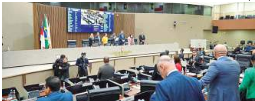
Projeto segue para análise da 2ª Comissão de Constituição, Justiça e Redação