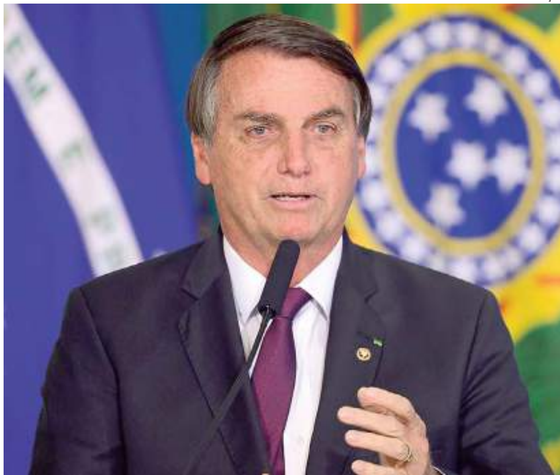
Ex-presidente é acusado de atacar o processo eleitoral e abuso de poder

O caso é relatado pelo corregedor-geral Eleitoral,