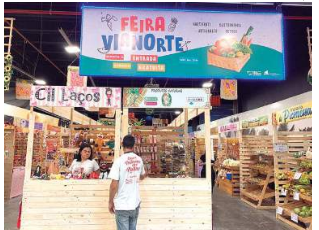
Feira reúne mais de 25 expositores no Shopping Manaus ViaNorte