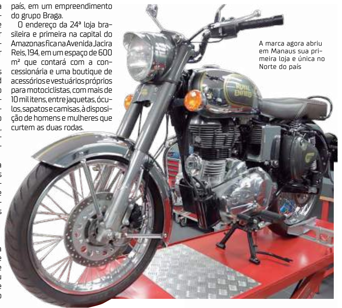
A marca agora abriu em Manaus sua primeira loja e única no Norte do país

O endereço da 24ª loja brasileira e primeira na capital do Amazonas fica na Avenida Jacira Reis, 194, em um espaço de 600 m² que contará com a concessionária e uma boutique de acessórios e vestuários próprios para motociclistas, com mais de 10 mil itens, entre jaquetas, óculos, sapatos e camisas, à disposição de homens e mulheres que curtem as duas rodas.