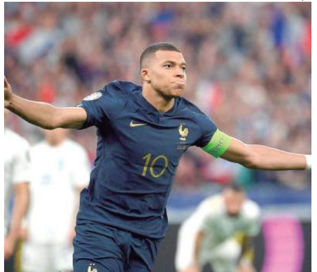
Atacante Mbappé fez o gol da vitória da Seleção da França contra Grécia

O zagueiro Mavropanos, protagonista do pênalti sobre Griezmann, recebeu seu segundo cartão amarelo e foi expulso de campo. O camisa quatro da Grécia derrubou Kolo Muani, que partia em velocidade na meia-lua e, desta vez, não conseguiu escapar do vermelho. Com um a mais, a França empilhou chances desperdiçadas ao longo da etapa final, mas conseguiu manter o 1 a 0 no placar até o fim da partida para encerrar esta Data-Fifa com os três pontos.