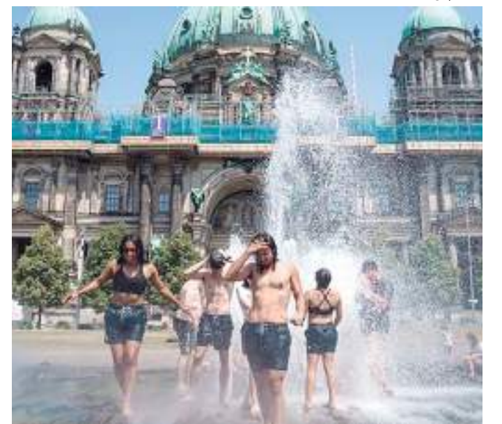
Os mais de 16 mil óbitos ocorreram sobretudo devido às ondas de calor

Além disso, Taalas afirmou que as temperaturas altas agravaram as condições de seca severa e generalizada, estimularam os incêndios florestais violentos, que resultaram na segunda maior área queimada notificada, e causaram milhares de mortes devido ao excesso de calor. Diversos países europeus, como, Bélgica, França, Alemanha, Irlanda, Itália, Luxemburgo, Espanha, Portugal, Suíça e Reino Unido tiveram o seu ano mais quente já registrado. A temperatura média anual do último ano ficou entre a segunda e a quarta mais alta já registrada, com cerca de 0,79 graus acima do normal de 1991-2020.