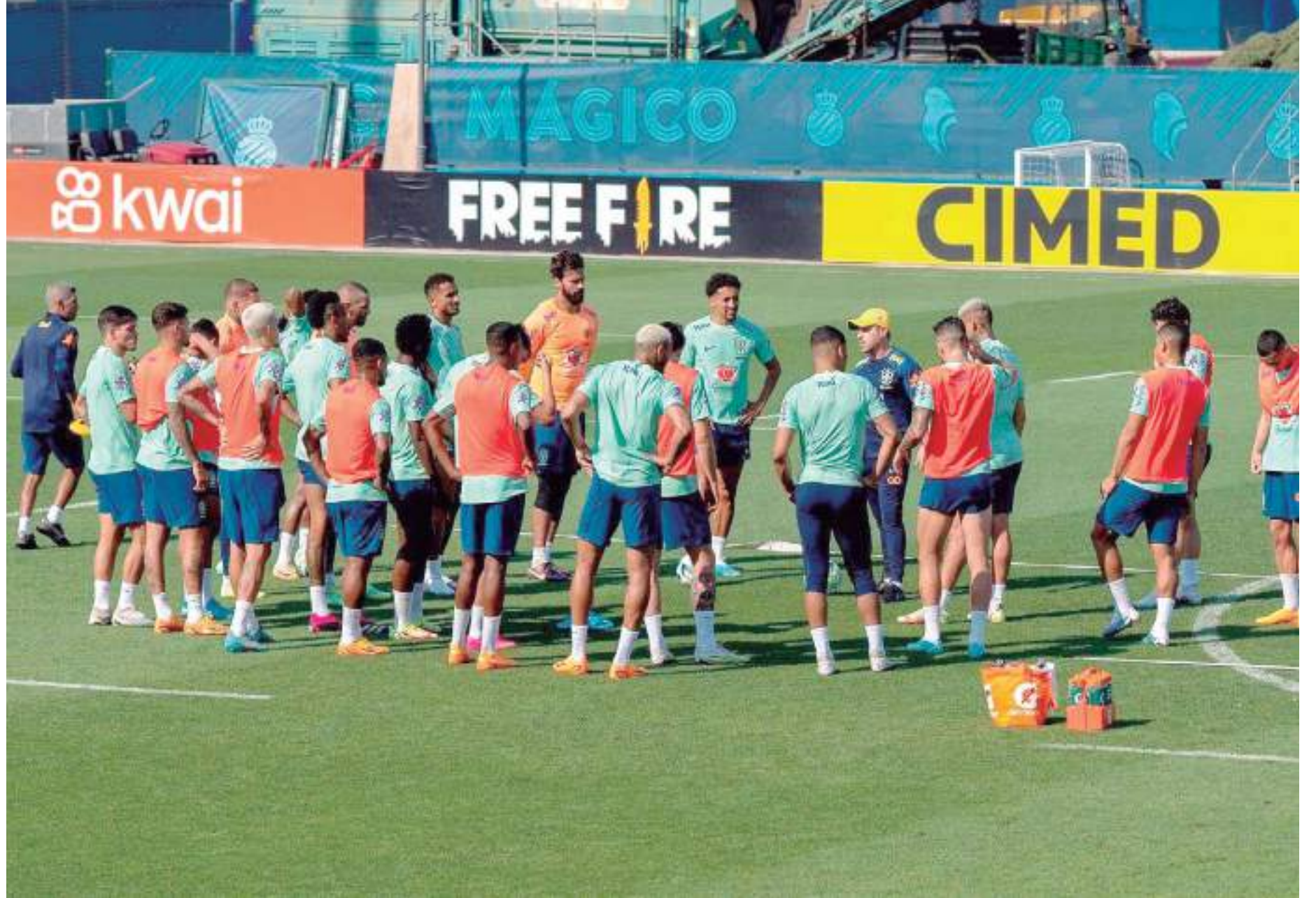
Jogadores Seleção Brasileira fazem último treino para amistoso contra Senegal