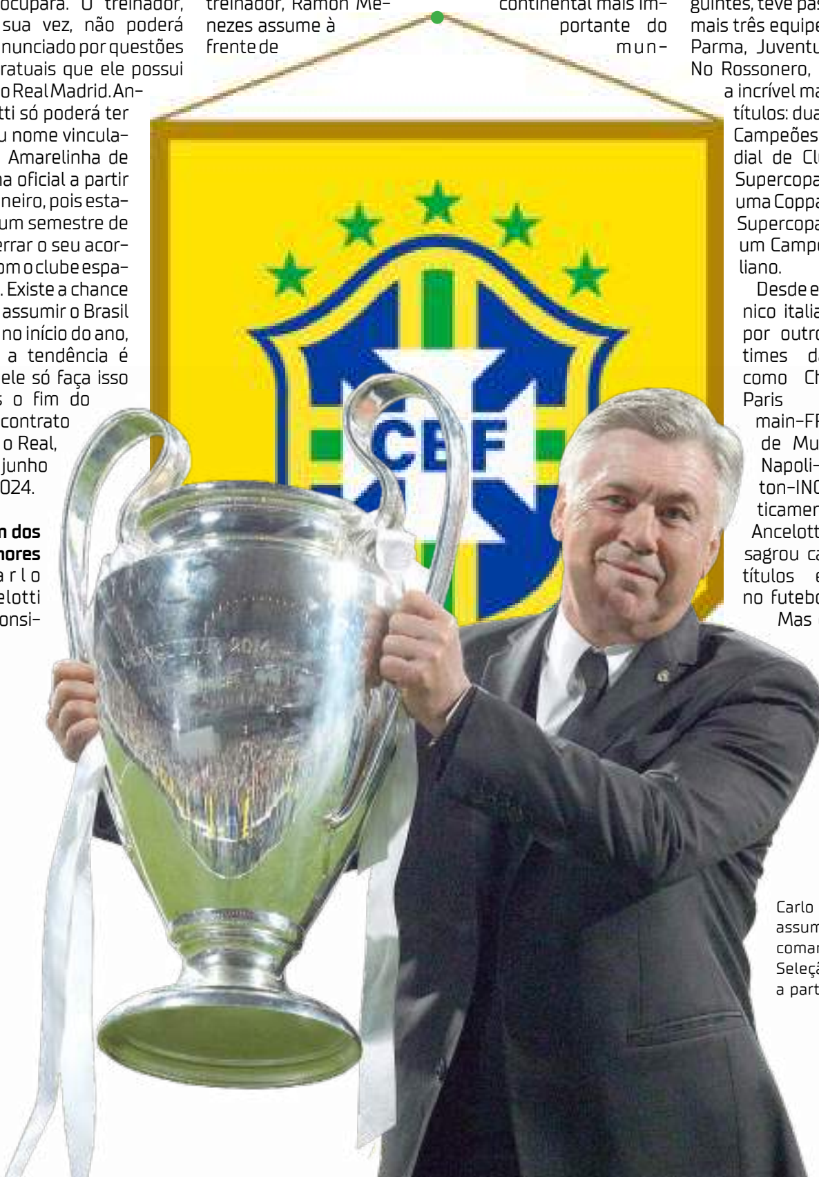
Carlo Ancelotti assumirá o comando da Seleção Brasileira a partir de 2024

Recentemente, Ancelotti voltou a afirmar que não vai assumir a Seleção Brasileira e que vai cumprir o contrato com o Real Madrid até o final, em junho de 2024. Ednaldo Rodrigues mostrou que a negociação permanece e que vai abrir negociação de forma mais direta, mas não garante esperar o treinador até 2024.