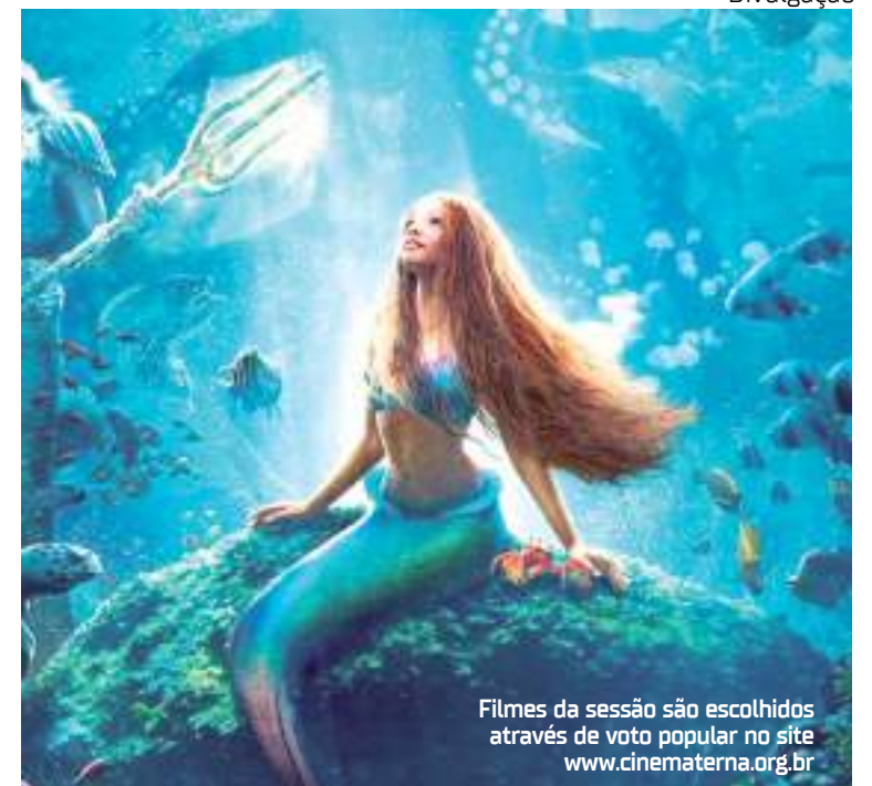
Filmes da sessão são escolhidos através de voto popular no site www.cinematerna.org.br

Ariel é uma bela e espirotuosa jovem sereia com sede de aventura. A mais nova das filhas do Rei Tritão, e a mais rebelde, Ariel anseia por descobrir mais sobre o mundo além do mar e, ao visitar a superfície, se apaixona pelo elegante Príncipe Eric. Embora as sereias sejam proibidas de interagir com os humanos, Ariel deve seguir seu coração e, para isso, ela faz um acordo com a malvada bruxa do mar, Úrsula, que lhe dá a chance de viver em terra firme, mas acaba colocando sua vida – e a coroa de seu pai – em perigo.