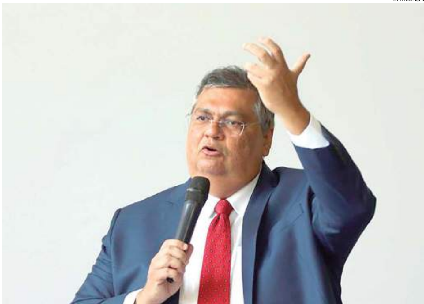
Ministro se referiu ao período de 31 de outubro de 2022 a 8 de janeiro

Dino lamentou o fato de que, segundo provas obtidas pela Polícia Federal em material apreendido, um pequeno grupo de