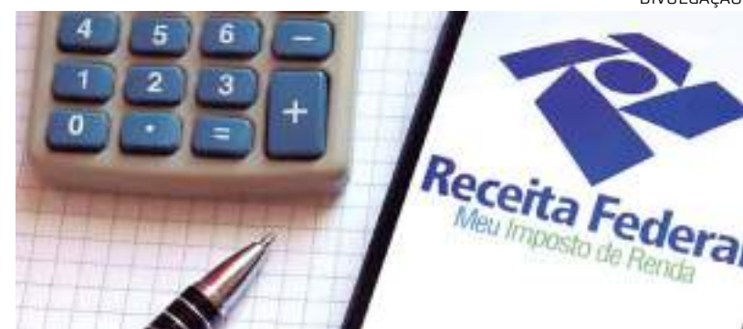
Segundo lote da restituição do Imposto de Renda será pago no dia 30 de junho