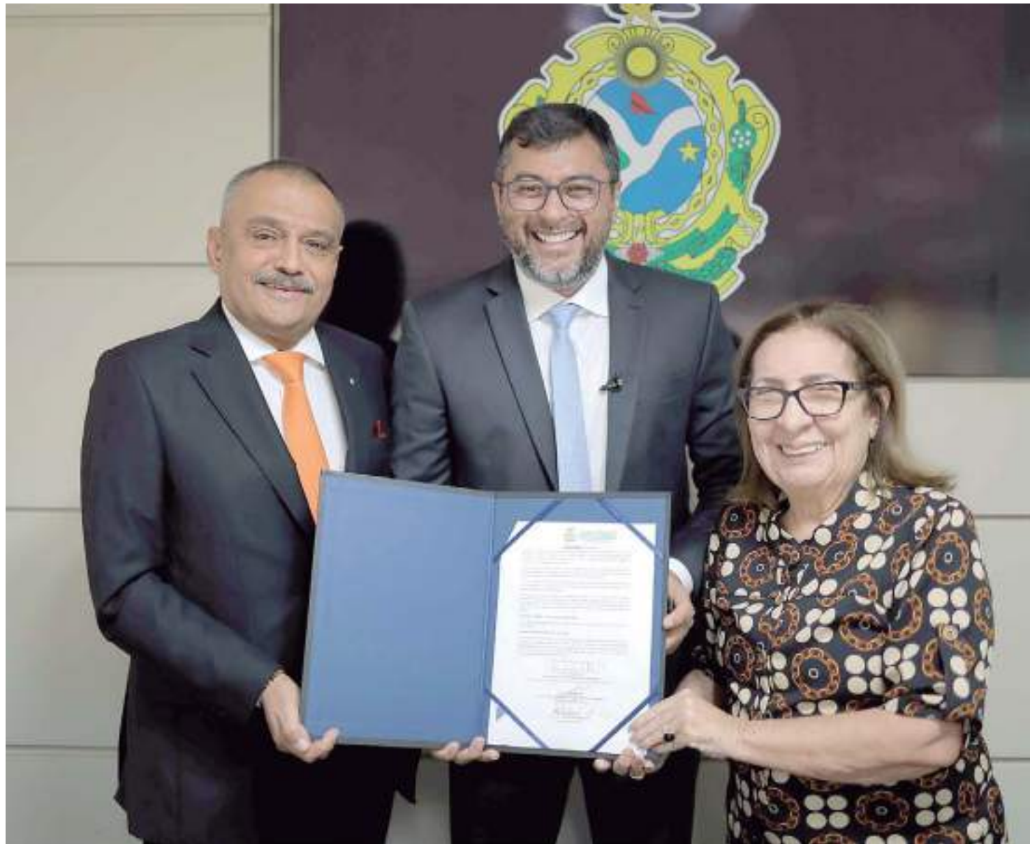
Termo de Cooperação assinado prevê apoio a realização de pesquisas e integra o programa Amazonas Meu Lar