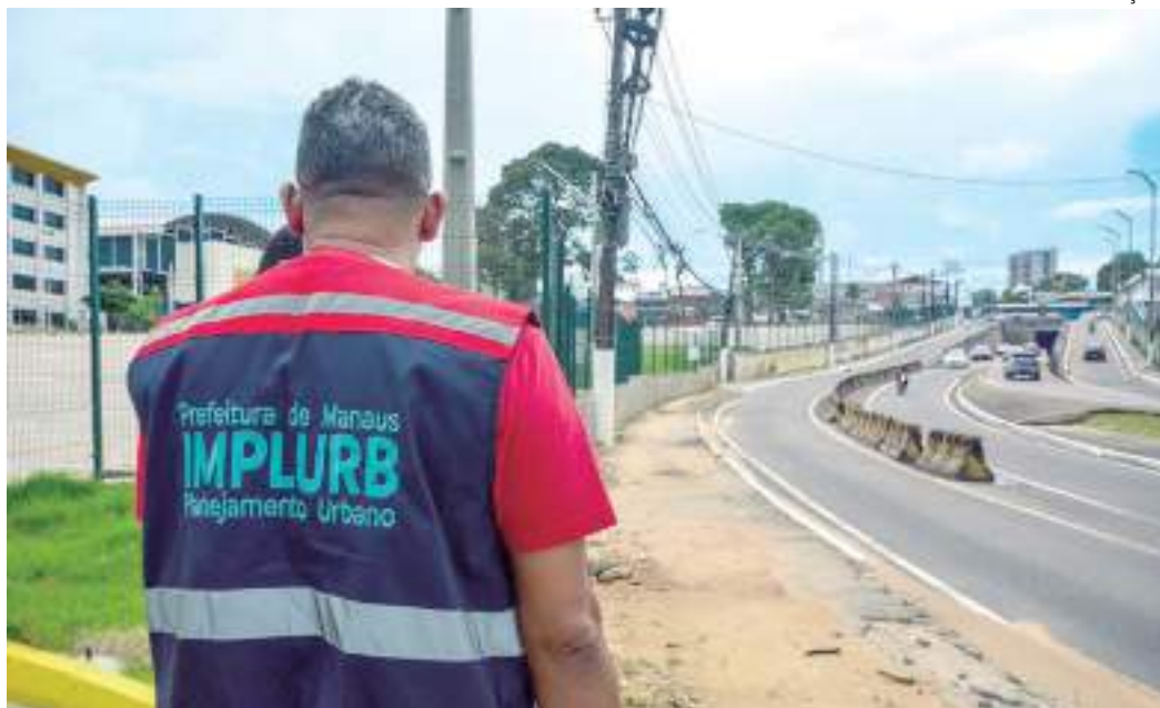
Em caso de descumprimento, instituição deverá pagar uma multa de acordo com Código de Posturas

Nesta segunda-feira, 19/6, fiscais do Implurb fizeram a notificação para a entidade de ensino providenciar a recomposição do logradouro público sob pena de multa e ação administrativa dentro do que prevê o Código de Posturas