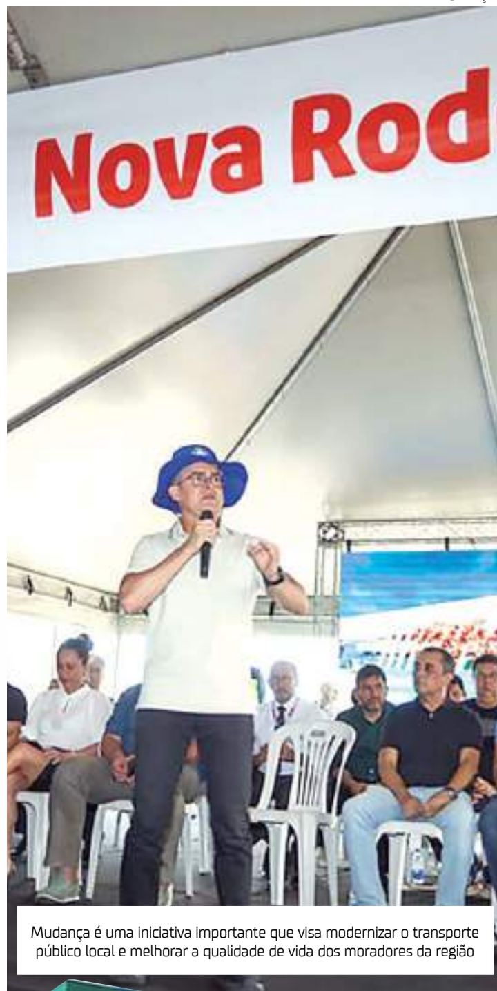
Mudança é uma iniciativa importante que visa modernizar o transporte público local e melhorar a qualidade de vida dos moradores da região

"Todos os caminhos da cidade, as ligações rodoviárias chegam mais rapidamente neste local. E para sair daqui nós vamos ter linhas de ônibus para o Centro e para todos os terminais da cidade dentro do nosso sistema. Com isso, a gente consegue levar qualidade e também fazer com que seja mais rápido e mais barato para as pessoas, melhorando a condição de trafegabilidade também na cidade de Manaus", disse o titular.