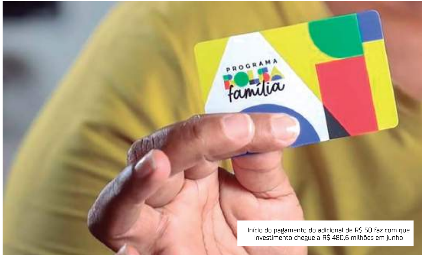
Início do pagamento do adicional de R$ 50 faz com que investimento chegue a R$ 480,6 milhões em junho

O Bolsa Família atinge em junho dois patamares inéditos no país: pela primeira vez o valor médio do benefício supera a casa dos R$ 700