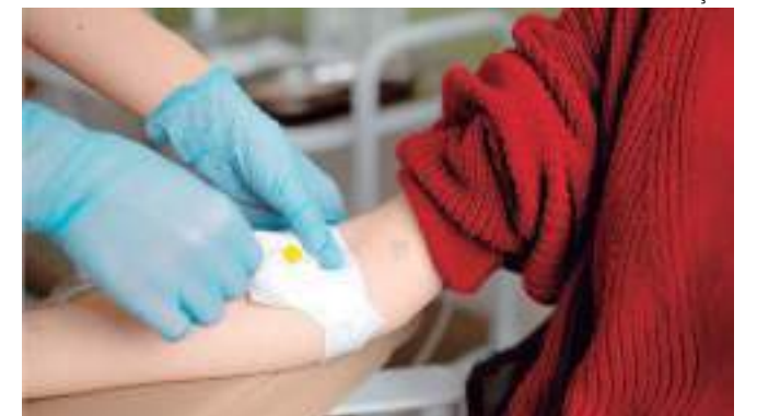
Para doar, basta comparecer com seus documentos e cadastrar

Também é preciso pesar no mínimo 50 quilos, estar descansado e ter repousado ao menos seis horas na noite anterior, além de estar bem alimentado. Quem pretende doar não deve ingerir bebida alcoólica no dia anterior e é preciso evitar fumar pelo menos duas horas antes da doação. No momento da triagem, é necessário apresentar documento original com foto.