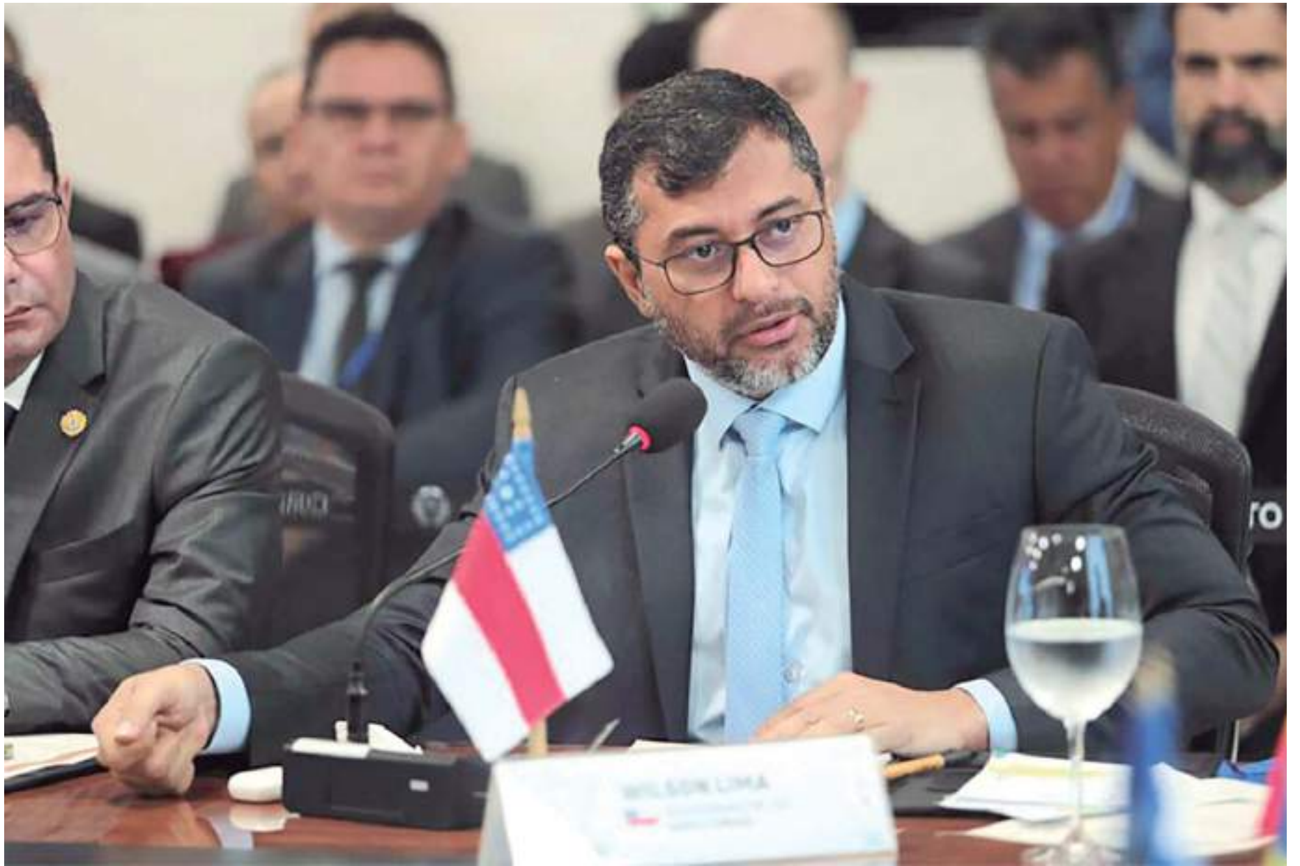
Em evento com governadores, Wilson Lima criticou a logística do projeto com a tecnologia do bilionário Elon Musk

Operações conjuntas do Ibama e da Polícia Rodoviária Federal na floresta amazônica estão ocorrendo desde o começo do ano, com o objetivo de interromper as linhas de suprimento do garimpo