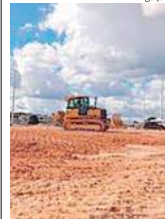
Prazo para obra é de 12 meses