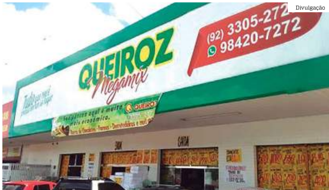
Fachada da loja Queiroz em Manaus

Para aproveitar o saldão basta acessar o site www.lojasqueiroz.com.br e clicar na aba saldão. Em seguida, é só escolher os itens e a quantidade, e finalizar a compra. Outras vantagens são o parcelamento em até