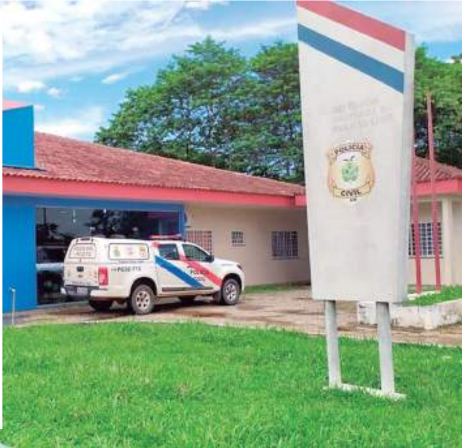
Delegacia do município de Humaitá

O homem responderá por estupro de vulnerável e ficará à disposição da Justiça.