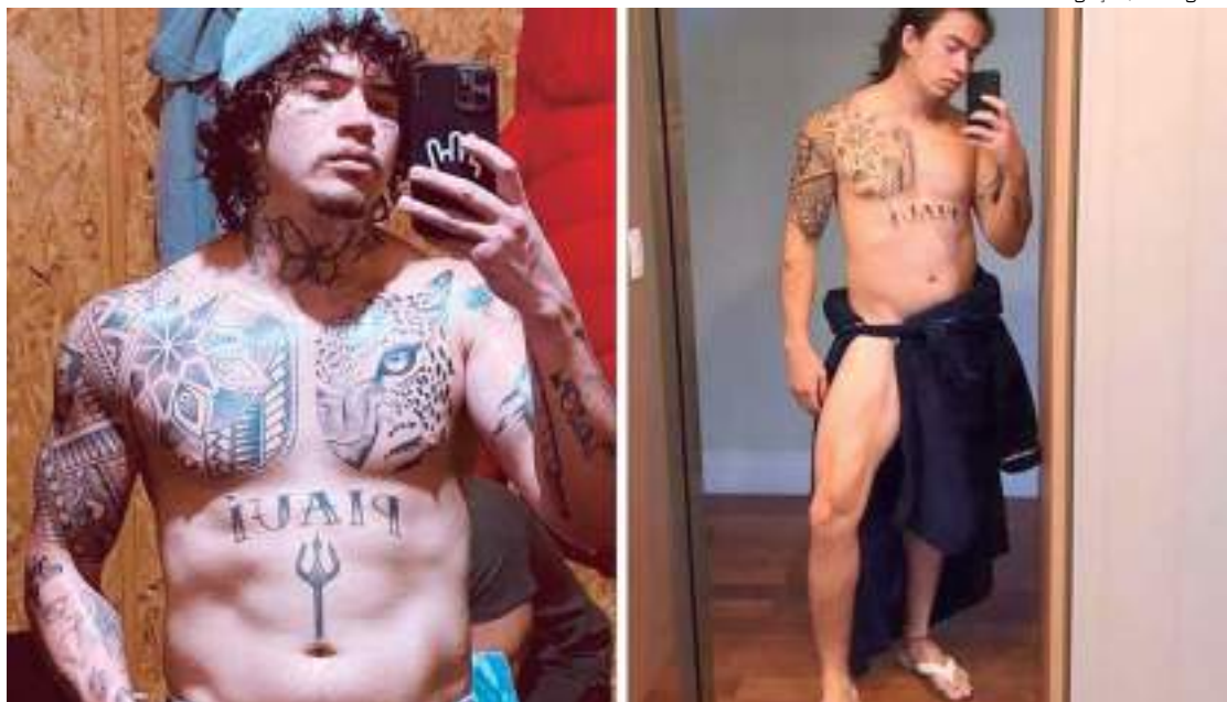
Whindersson Nunes em fotos pessoais

Whindersson Nunes ama se aventurar em novas áreas e desta vez anunciou que vai desbravar o mundo picante do OnlyFans. Nesta terça-feira, 25 de julho, o humorista revelou a novidade em seu Instagram.