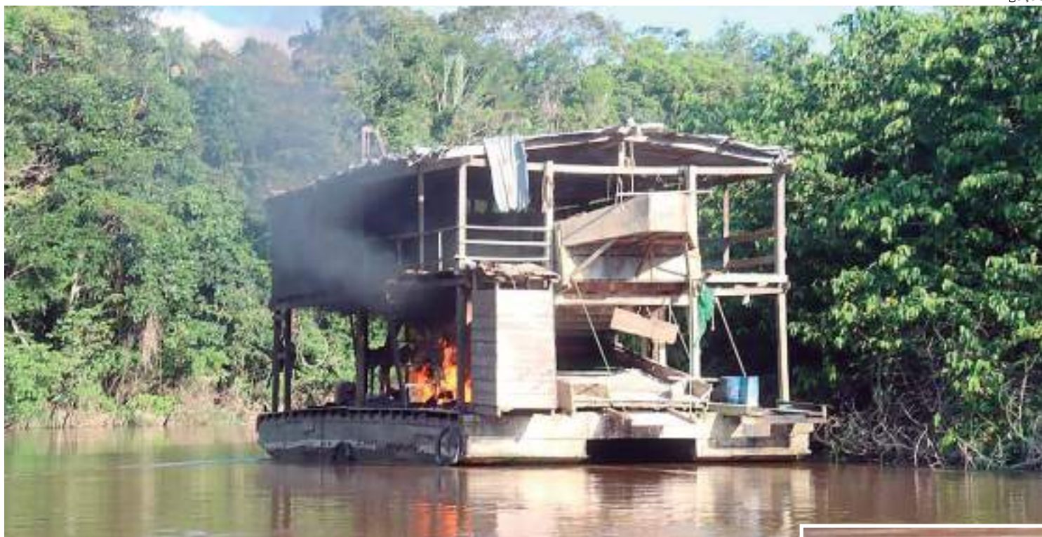
Operação é uma iniciativa essencial do Comando Militar da Amazônia

O relatório parcial da Operação Curaretinga IV indica que foram avistadas 28 dragas na região, das quais 18 foram destruídas, preservando-se, assim, 7,2 hectares de floresta. Além disso, a operação impediu a poluição de 2,4 kg de mercúrio no ecossistema. As apreensões incluem também materiais ilegais, como motosserras, armamentos, motobombas, balanças, entre outros, avaliados em R$ 96.450,00, mostrando a eficácia da operação em combater diversas atividades ilegais na área. A