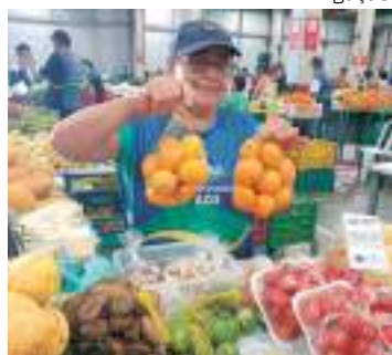
Iniciativa será realizada na última quarta de cada mês

Consumidores das Feiras de Produtos Regionais do governo do Estado, realizadas pela Agência de Desenvolvimento Sustentável do Amazonas (ADS), ganharão mais uma edição. A nova feira acontecerá na última quarta de cada mês, a partir do dia 26 de julho, das 09h às 14h, no estacionamento do Tribunal de Justiça do Estado do