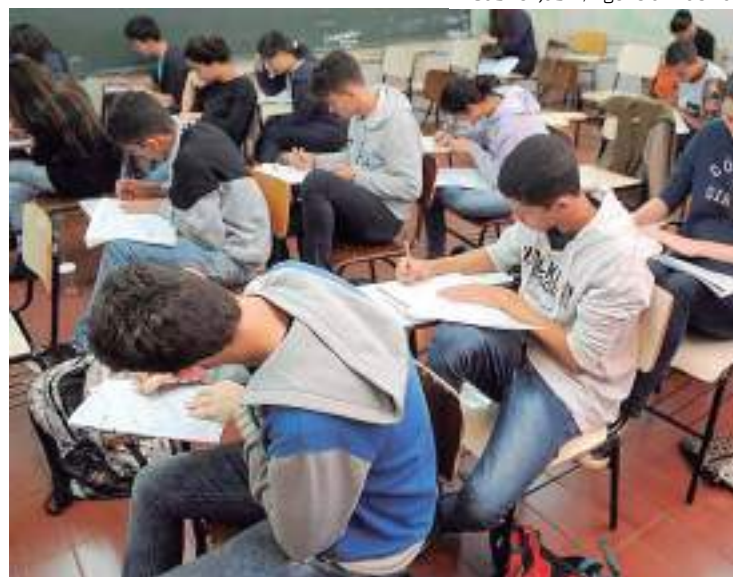
Estudantes em sala de aula

A quantidade de escolas com projetos atentos à diversidade começou a cair a partir do ano de 2015, quando o índice havia che-