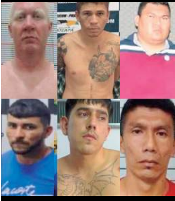
Criminosos serão transferidos para presídios federais

O ministro da Justiça, Flávio Dino, determinou, na segunda-feira (24), a transferência de presos do Amazonas para penitenciárias federais, para prevenir o agravamento da crise de segurança pública envolvendo disputa entre facções nos presídios do Estado.