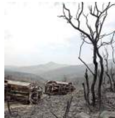
Na Argélia, ao menos 34 pessoas morreram em decorrência do fogo

com temperaturas de 49°C registradas em algumas cidades da Tunísia. A vizinha Argélia mobilizou cerca de 8 mil bombeiros para controlar os incêndios letais, disseram as autoridades. Os incêndios na ilha de Rodes na semana passada obrigaram as autoridades gregas a realizar a maior retirada já feita no país, com mais de 20 mil pessoas forçadas a deixar casas e hotéis.