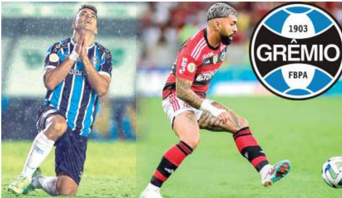
Clássico entre Grêmio e Flamengo é válido pela semifinal da Copa do Brasil

A Arena do Grêmio, em Porto Alegre, será palco do aguardado clássico nacional entre Grêmio x Flamengo, pela partida de ida das semifinais da Copa do Brasil, nesta quarta-feira (26), às 20h30 (horário de Manaus). Atual detentor do título, o Flamengo chega embalado após boas vitórias sobre o Atlético e busca um bom resultado fora de casa para ter vantagem na decisão em seu estádio. Por outro lado, o Grêmio teve um confronto mais equilibrado nas quartas de final, precisando dos pênaltis para eliminar o Bahia. O duelo é marcado pelo encontro de duas potências do futebol brasileiro, com o Flamengo sendo tetra e o Grêmio pentacampeão da Copa do Brasil.