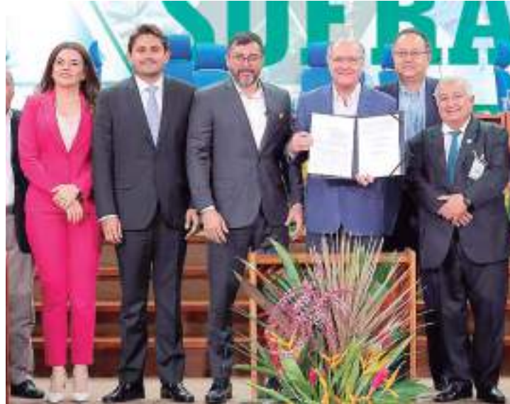
Alckmin assinou o Contrato de Gestão do Centro de Bionegócios da Amazônia

“A competitividade da Zona Franca de Manaus deve ser mantida. O objetivo da reforma tributária é simplificar, é desonerar completamente investimento porque tira a cumulatividade de crédito e desonera completamente a exportação. Esse é o objetivo, trazer um ganho de produtividade, ganho de eficiência econômica importante para o país, e ajudar a Zona Franca a poder crescer ainda mais”,