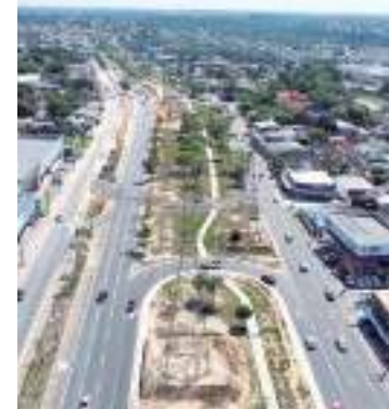
Previsão de entrega ficou para o primeiro semestre de 2024.

“Estaremos com dez agentes atuando para interditar as vias, com auxílio de equipamentos de controle viário, como viaturas, placas de sinalização, cones, supercones, de modo que os condutores sigam seus caminhos da melhor forma possível”, afirma o chefe de Operações do IMMU.