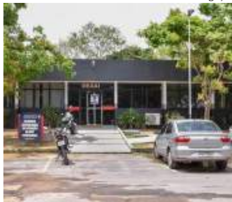
Delegacia Especializada em Apuração de Atos Infracionais

A Polícia Civil do Amazonas (PC-AM), por meio da Delegacia Especializada em Apuração de Atos Infracionais (Deaai), cumpriu, na quarta-feira (5), mandado de busca e apreensão de um adolescente de 15 anos, por ato infracional análogo a homicídio qualificado contra o próprio pai, que tinha 46 anos. O crime aconteceu em