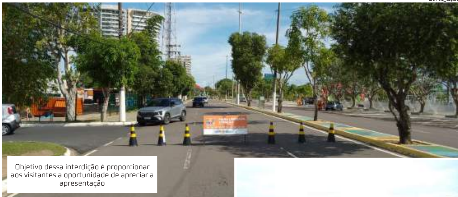
Objetivo dessa interdição é proporcionar aos visitantes a oportunidade de apreciar a apresentação

“Pedimos a colaboração de todos os condutores para seguirem as orientações dos agentes de trânsito e respeitar as sinalizações presentes na região. A prioridade é garantir a segurança de todos os envolvidos. Lembremos que a interdição ocorrerá apenas no sentido bairro/Centro da avenida Coronel Teixeira. O trânsito no sentido oposto não será afetado”, orientou o diretor de opera-