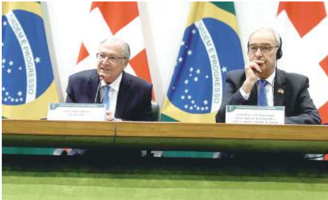
Liberação de recursos acordados entre países deve começar já nas próximas semanas

Pelas redes sociais, o vice-presidente e ministro do Desenvolvimento, Indústria, Comércio e Serviços, Geraldo Alckmin, que também participou da abertura do evento, agradeceu a ajuda do governo suíço. "A Suíça está entre os 10 maiores investidores no Brasil, contando com 660 empresas instaladas no país. Recebemos com entusiasmo as