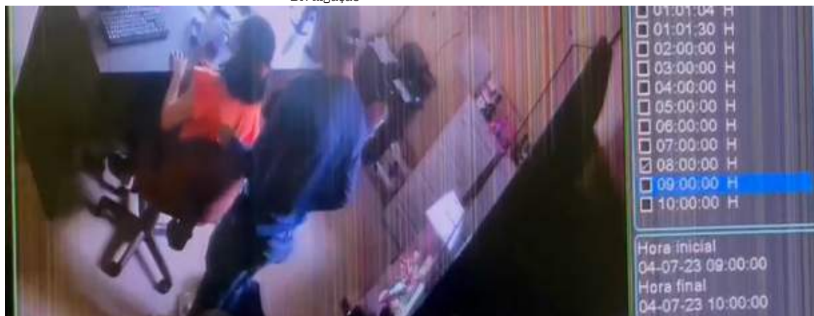
Polícia vai utilizar as câmeras de segurança para identificar os suspeitos

As câmeras de segurança de uma autoescola que foi assaltada, na terça-feira (4), na avenida Constantino Nery, registraram toda a ação da dupla que rendeu funcionários e alunos.