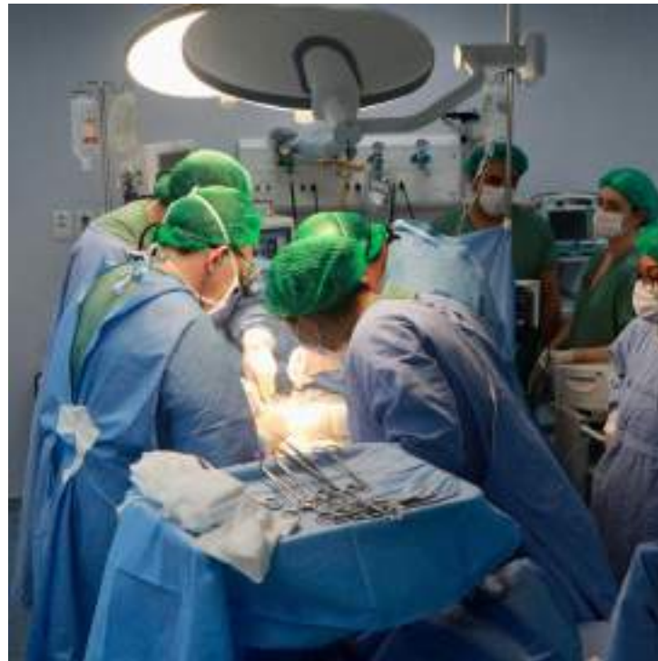
Procedimento foi realizado no Hospital Delphina Aziz

O transplante renal é um tratamento para pacientes com diagnóstico de insuficiência renal crônica, estando o doente em diálise ou mesmo em