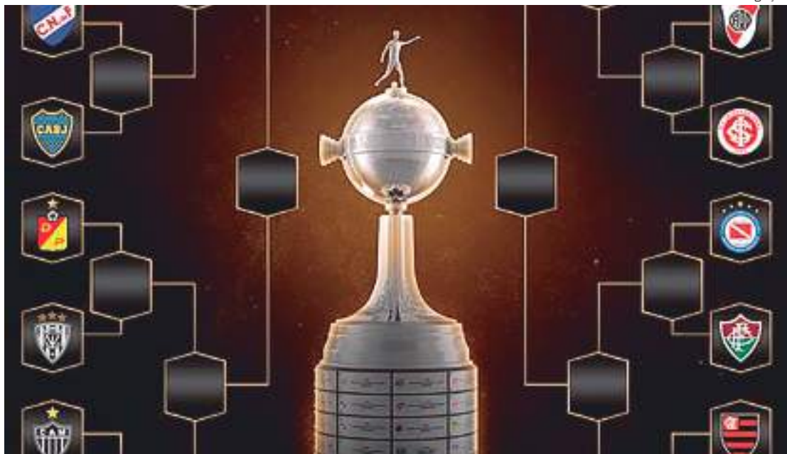
Confrontos das oitavas de final da Libertadores ainda não tem data definidas para acontecer

O Athletico-PR enfrentará o Bolívar, que foi segundo colocado no grupo