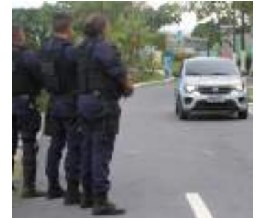
Armamento foram adquiridos em 2021

do, senão essa conduta sem incidentes. Estamos há quase um ano da primeira turma armada da Guarda Municipal de Manaus sem nenhum incidente, sem tiro acidental, sem necessidade de utilizar o armamento letal. Isso nos deixa muito contentes, muito confiantes de que o caminho é esse mesmo a ser seguido”, declarou Fontes.