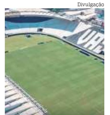
Vasco não vai poder contar com sua torcida por quatro jogos

Procurado, o clube ainda não se manifestou sobre qual estratégia jurídica adotará sobre a decisão.