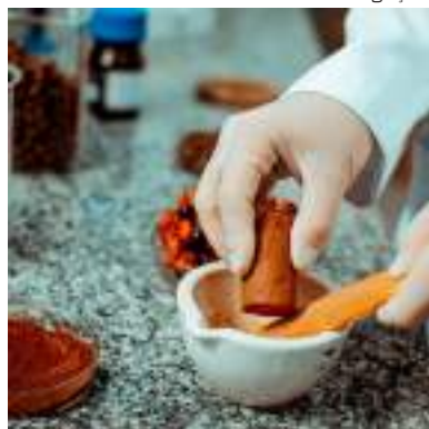
O estudo é amparado pela Fapeam

O extrato combinado do pó do guaraná ( Paullinia Cupana ) com a semente do açaí ( Euterpe Olerecea ) possui grande efeito cicatrizante, com potencial aplicação no tratamento de feridas crônicas e da fibrose (formação de tecido conjuntivo em determinado órgão ou tecido) e cicatrizes patológicas (hipertróficas), é o que