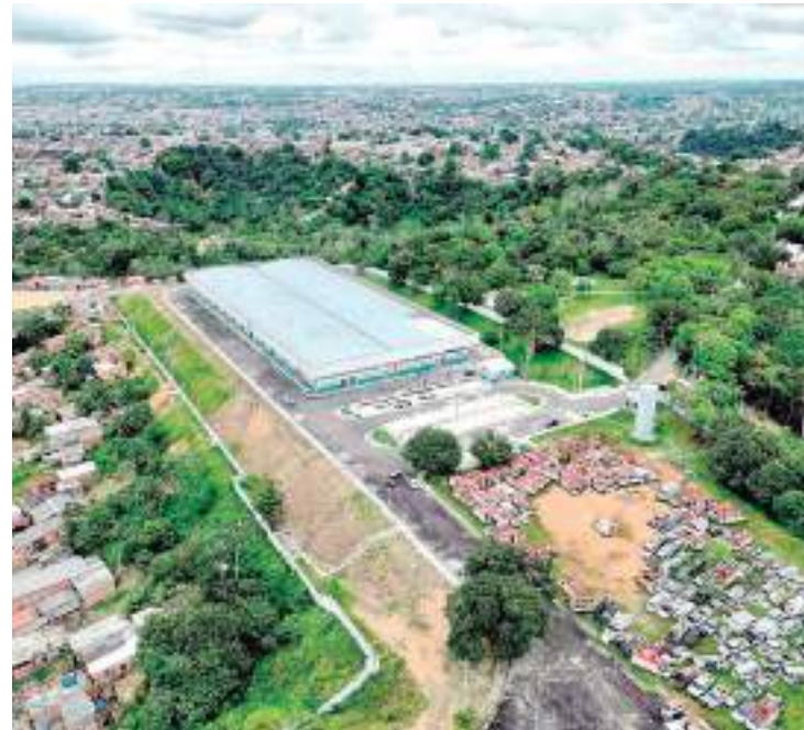
Distrito de Micro e Pequenas Empresas, no Distrito Industrial 2

Em um novo formato, o Dimicro começou a ser reformado em 2022, com recursos do Fundo Municipal