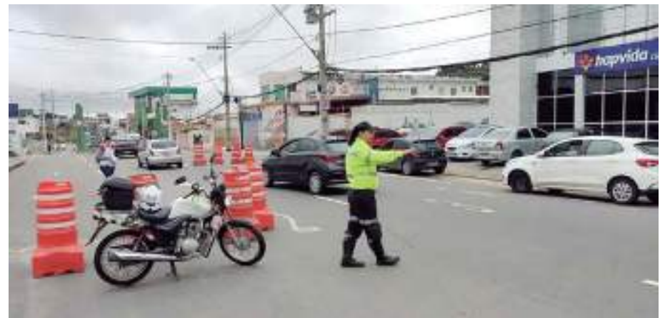
Interdição acontece para retirada das colunas de concreto

Por segurança viária, as duas estruturas foram retiradas para manutenção em fevereiro deste ano. O IMMU montou uma operação permanente 24 horas no local, restringindo a passagem de carretas ou veículos de grande porte para garantir a segurança de condutores e pedestres.