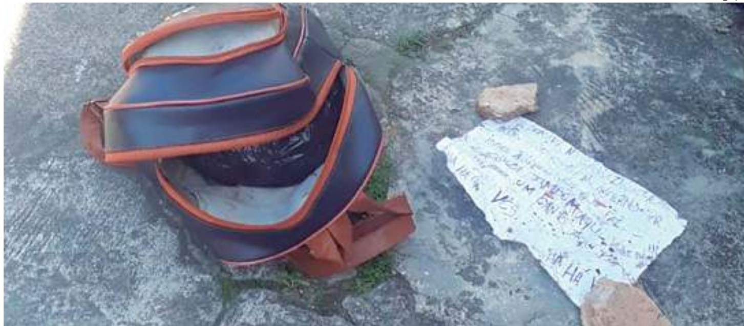
Cabeça humana foi encontrada dentro de uma mochila

Uma cabeça humana foi encontrada dentro de uma mochila, na manhã de quinta-feira (20), na rua das Águias, bairro São Lázaro, Zona Sul de Manaus. No mesmo dia, parte de um corpo esquartejado foi achada em uma calçada na rua Visconde de Itanhaém, no bairro Flores, Zona Centro-Sul.