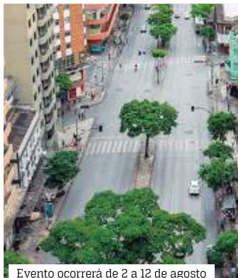
Evento ocorrerá de 2 a 12 de agosto