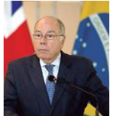
Cúpula está marcada para ocorrer de 22 a 24 de agosto

O embaixador informou que no período de um ano em que o Brasil estará na presidência do G20 vão ocorrer pelo menos 20 reuniões ministeriais do grupo em cidades brasileiras. No fim do mandato, haverá uma cúpula presidencial do G20, no Rio de Janeiro, em novembro de 2024.