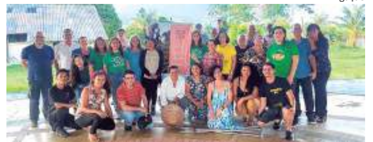
Participantes do primeiro módulo da Jornada Formativa em Manaus