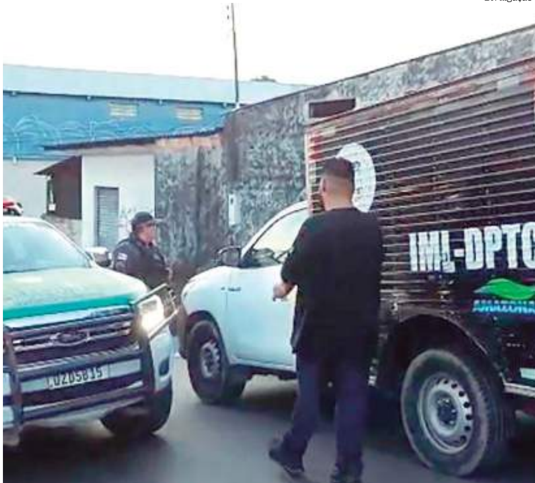
Carro do Instituto Médico Legal foi ao local retira corpo do homem

O caso deve ser investigado pela Delegacia Especializada em Homicídios e Sequestros (DEHS).