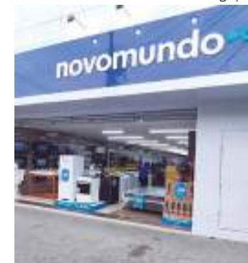
Fachada da varejista NovoMundo.Com

Além de empréstimos facilitados que podem ser feitos via FGTS, consignado ou pessoal, com muito menos burocracia, a rede varejista NovoMundo. Com também oferece outros serviços pela Novo Mundo Resolve como: Instalação, Limpeza, Impermeabilização e Detetização, garantindo uma jornada diferenciada, integrada e acessível.