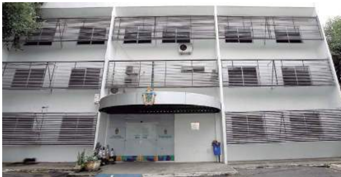
Autora também foi condenada a pagar os honorários advocatícios na ordem de 5% sobre o valor atualizado da causa

“A sustentação oral foi importante para demonstrar aos desembargadores as inconsistências processuais da rescisória, garantindo, por meio do judicioso voto do relator, seguido à unanimidade pelos demais membros, a manutenção da decisão que evitou prejuízo aos cofres públicos que, corrigido, po-