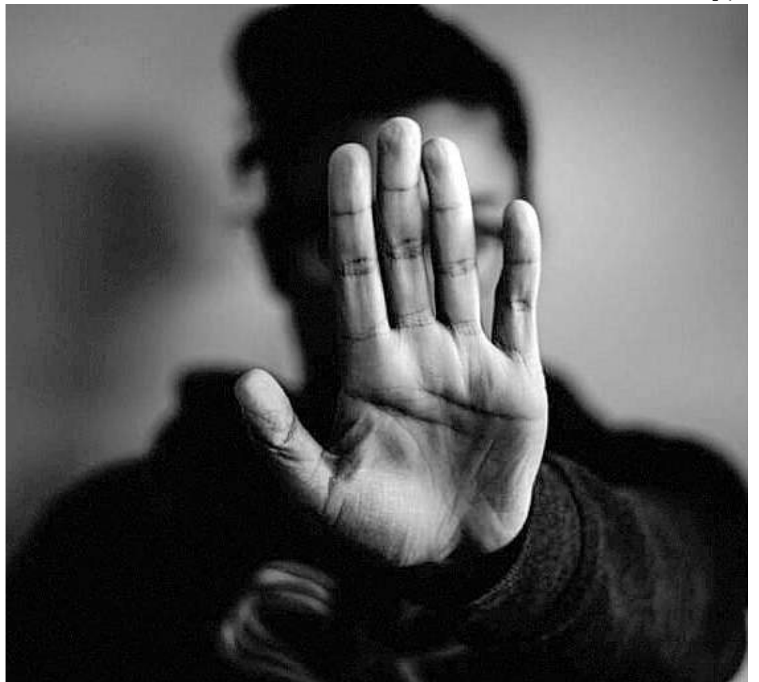
Dados foram divulgados na 17ª edição do Anuário Brasileiro de Segurança Pública

Para denunciar, ligue para o Disque-denúncia 181 ou Disque-Polícia 190