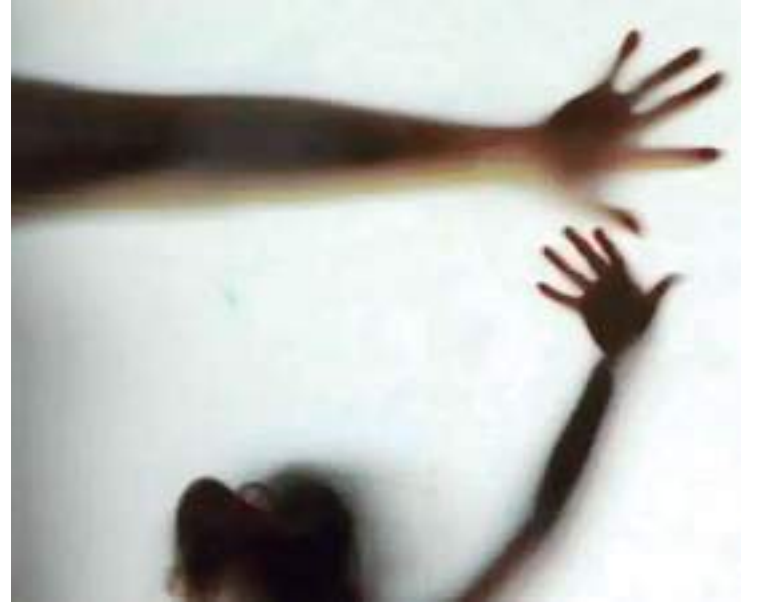
Já os estupros subiram 15,3% e exploração sexual, 16,4%

Por faixa etária, foram quase 41 mil vítimas de zero a 13 anos, das quais quase sete mil tinham entre zero e quatro anos; mais de 11 mil vítimas entre 5 e 9 anos; mais de 22 mil entre 10 e 13 anos; e mais de