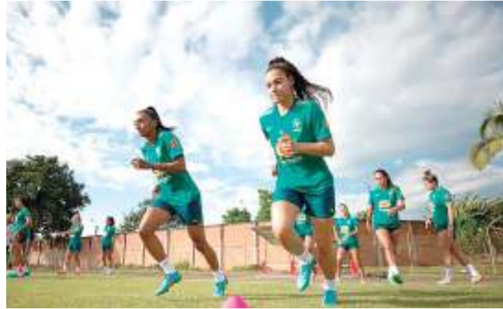
Meninas do Brasil estão treinando a todo vapor para estreia

A Copa do Mundo feminina de 2023 teve início nesta quinta-feira, com as vitórias das anfitriãs Nova Zelândia e Austrália. Faltando quatro dias para a estreia, a Seleção Brasileira treinou novamente, já visando seu primeiro jogo na competição.