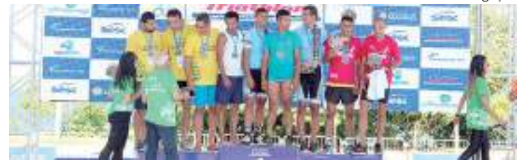
Sesc Triathlon 2023 entra na reta final de inscrições

Para trabalhadores do comércio e dependentes o investimento é de R$ 180. Já para o público em geral é de