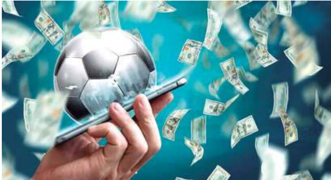
Justiça arrolou 14 pessoas por suspeita de envolvimento na manipulação de jogos do futebol brasileiro

A Operação Penalidade Máxima, responsável por investigar suspeitas de manipulações de jogos no futebol brasileiro, ganhou um novo capítulo nesta quinta-feira (27). O juiz Alessandro Pereira Pacheco, da 2ª Vara de Repressão ao Crime Organizado e Lavagem de Capitais, tornou sete atletas e sete apostadores réus no processo, segundo informação do ge.