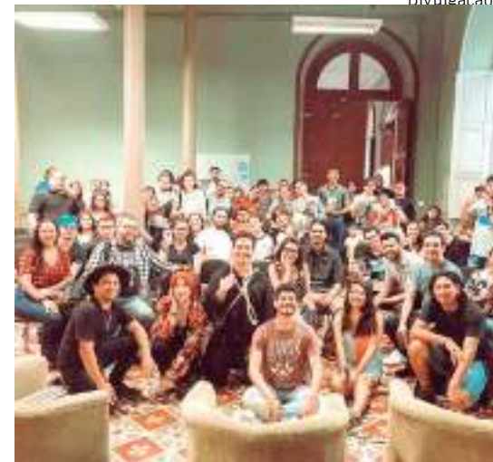
Evento acontece nos dias 28, 29 e 30