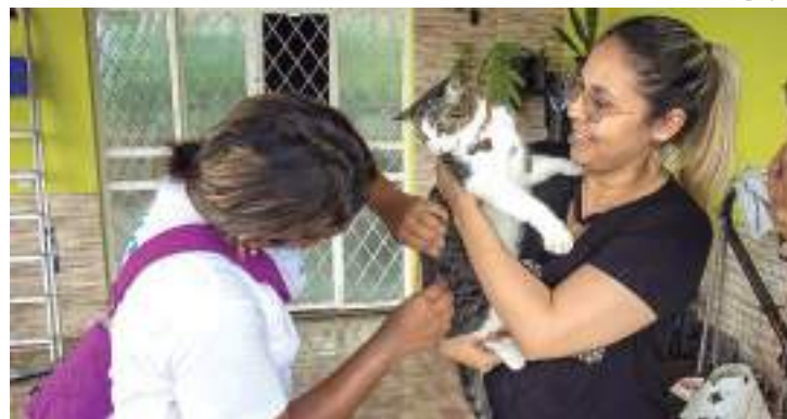
Programação vai até dia 25 de agosto

A estimativa do CCZ é que 2.000 animais, entre cães e gatos, sejam vacinados. Como critérios para receber a vacinação, uma tarefa que deve ser feita anualmente, o animal precisa estar em boas condições de saúde e ter, ao menos, três meses de idade.