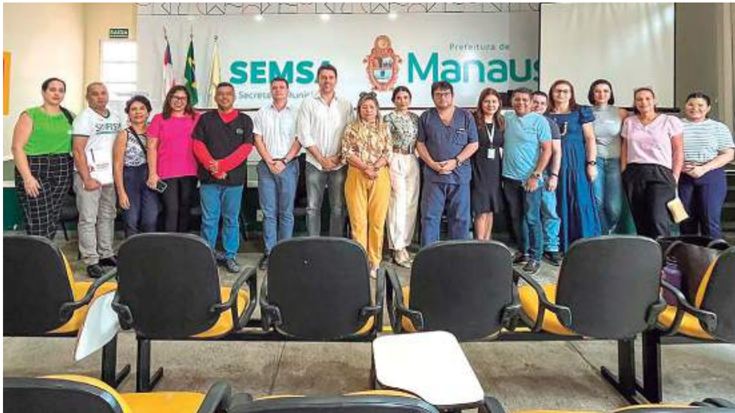
Diversos representantes da área da saúde participaram da Mesa Municipal de Negociação do SUS

Em reunião extraordinária da Mesa Municipal de Negociação do Sistema Único de Saúde (SUS), realizada na manhã desta quinta-feira (27), na sede da Secretaria Municipal de Saúde (Semsa), foi anunciado o reajuste de 4,5% para os servidores estatutários da saúde, que começa a ser pago em agosto. Como o mês da data-base da categoria é abril, os valores retroativos ao período de abril a julho serão pagos em janeiro de 2024.