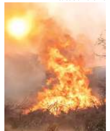
Ilha de Rodos, na Grécia

A OMM prevê que há 98% de probabilidade de que pelo menos um dos próximos cinco anos seja o mais quente já registrado e 66% de chance de exceder temporariamente 1,5°C acima da média de 1850-1900 por pelo menos um dos cinco anos.