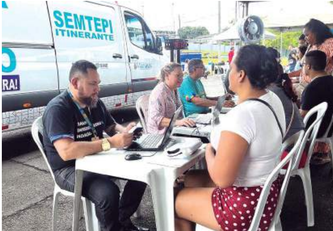
Ação oferta cadastro no Sine Manaus, vagas de emprego dentre outros serviços

"Acreditamos que essa proximidade com as comunidades nos permitirá identificar necessidades específicas e personalizar ainda mais nossos serviços, tornando-os cada vez mais eficazes e relevantes para a população local. Além disso, o 'Sine nos