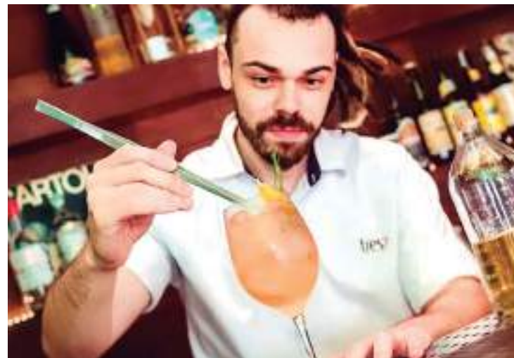
Especialista constrói bebidas usando ingredientes da região amazônica

A cervejaria artesanal Sarapó é outra opção para quem está interessado em conhecer as bebidas amazônicas. Com nome inspirado em um peixe, a empresa familiar dispõe de sete rótulos de cerveja e está localizada em um dos principais car-