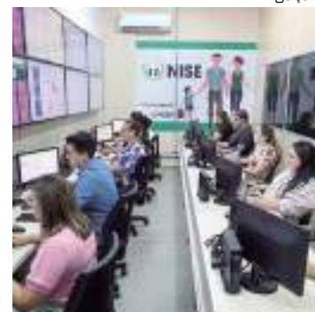
Falsos criminosos cobram PIX das escolas

De acordo com o coordenador do Nise, a melhor medida a tomar diante dessas situações é manter a calma e não realizar a transferência de valores.