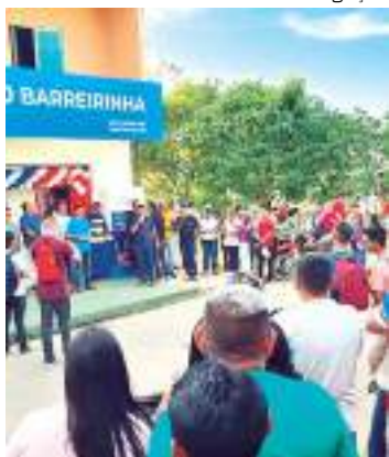
Polos têm destaque nas instituições de ensino superior

O polo de Educação a Distância (EaD), também conhecido como Polo de Apoio Presencial (PAP), desempenha um papel relevante nas Instituições de Ensino Superior (IES). O Grupo Fametro investe em polos parceiros e, atualmente, são mais de 30 distribuídos pela Região Norte.