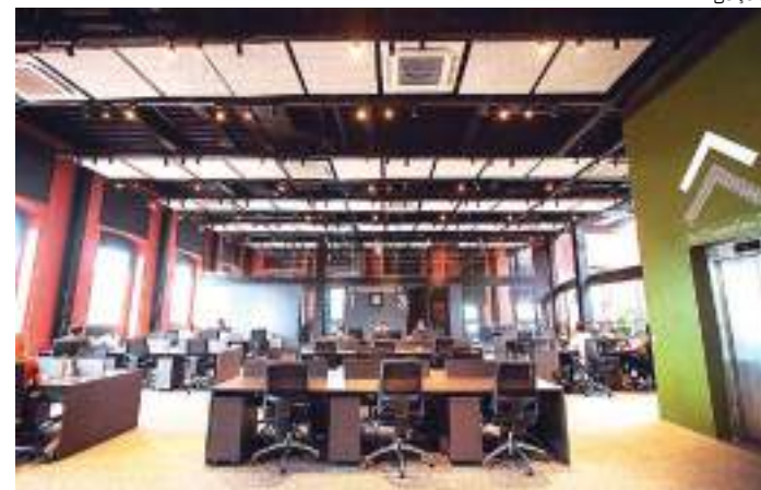
Formação será realizada no Casarão da Inovação Cassina

O evento será realizado presencialmente na próxima sexta-feira, 4 de agosto, das 18h às 21h, no Casarão da Inovação Cassina, localizado na rua Bernardo Ramos, nº 290, Centro, Zona Sul. É importante lembrar que o local possui regras de vestimenta, sendo proibida a entrada de pessoas trajando bermudas, shorts, minissaias, camisetas, regatas ou chinelos.