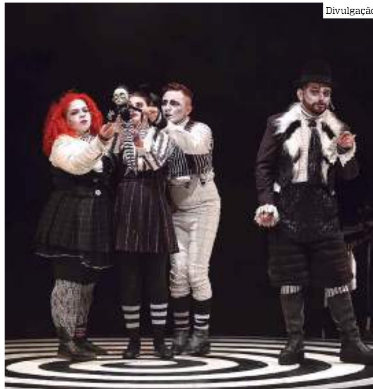
Opereta ‘Cabelos Arrepiados’ tem sessões lotadas