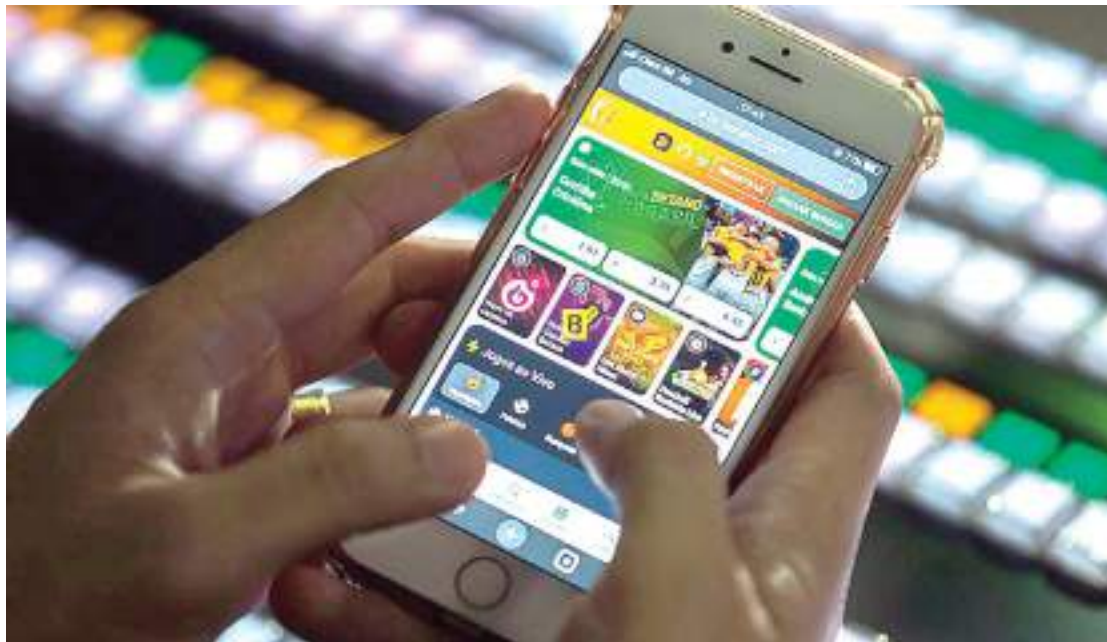
Plataformas de apostas tornaram-se instrumento para criminosos manipularem jogos de futebol

Também responderão por supostos crimes previstos na Lei Geral do Es-