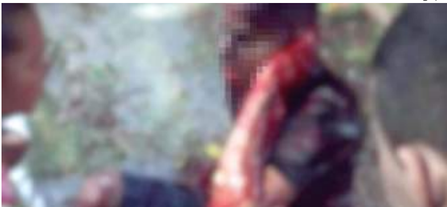
Vítima foi atacada por suspeitos não identificados