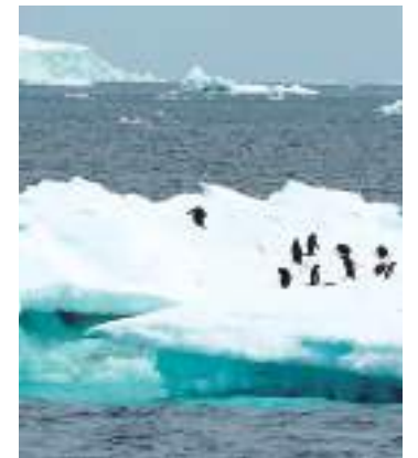
Pinguins em iceberg na Península Antártica