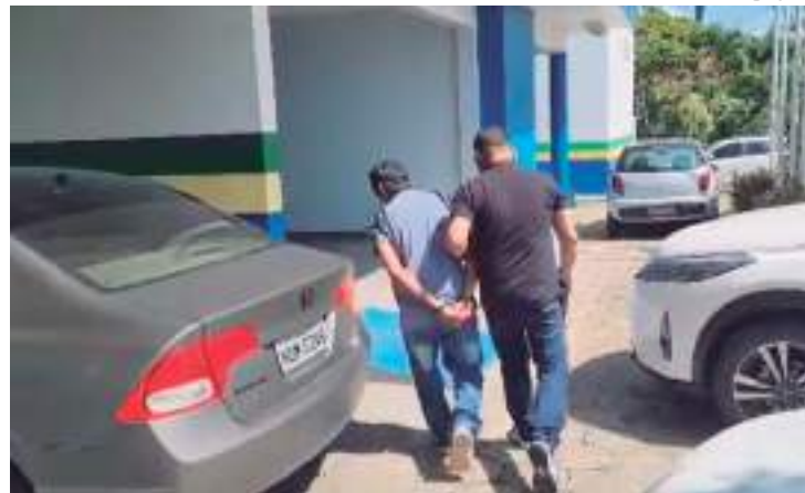
Homem estuprou em 2006 uma adolescente que saía da escola

Após passar 17 anos foragido, um homem foi preso na segunda-feira (10), no bairro Planalto, em Manaus, pelo estupro de uma adolescente na cidade de Santarém, no Pará, em 2006.