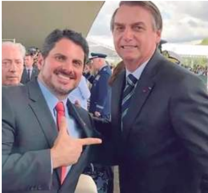
Ex-presidente Jair Bolsonaro e o senador Marcos do Val

Inicialmente, do Val havia dito, nas redes sociais, que houve uma "tentativa de Bolsonaro de me coagir para que eu pudesse dar um golpe de Estado junto a ele". Depois, o senador mudou a versão e disse que o ex-presidente teria ficado calado durante toda uma reunião que tiveram. Nesta versão, o parlamentar res-