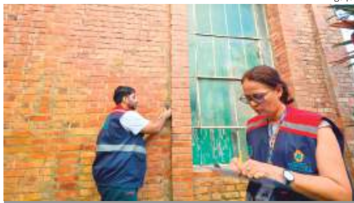
O espaço está fechado há mais de 20 anos

O trabalho em campo servirá para desenhar o estado atual da edificação, tendo como auxílio o uso da fotografia como referência para organização