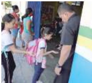
Ao todo são mais de 600 escolas que recebem os alunos

Nesta segunda-feira (10), mais de 600 escolas da rede estadual de ensino retomaram suas atividades e voltaram às aulas para o início do segundo semestre do ano letivo. Em todo o Amazonas, mais de 400 mil alunos estão matriculados nas escolas estaduais.