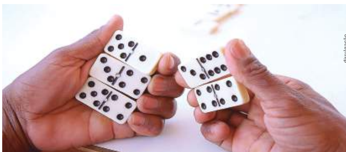
Torneio de Dominó e Xadrez para terceira idade será realizado no colégio Martha Falcão

Lançada no ano passado, a Associação Casa do Professor visa proporcionar maior qualidade de vida, bem estar físico, social, emocional e intelectual aos professores aposentados da rede pública e privada.