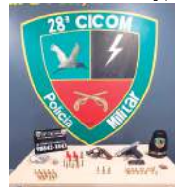
Armas, munições, dinheiro e drogas também foram apreendidas

Policiais militares da 28ª Cicom prenderam um homem, de 27 anos, pelo crime de tráfico de drogas e porte ilegal de arma de fogo, no bairro Puraquequara, na zona leste da capital. Com o suspeito, os policiais encontraram uma arma de fogo, 99 munições, duas porções médias de maconha. O homem foi conduzido ao 28º DIP.