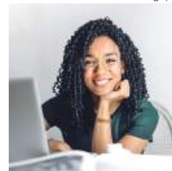
Quero Bolsa abre vagas para graduação

Mais informações podem ser obtidas na central de atendimento da Quero Bolsa pelo telefone 0800 123 2222, de segunda a sexta-feira, das 9h00 às 19h00, e aos sábados, das 9h00 às 13h00.