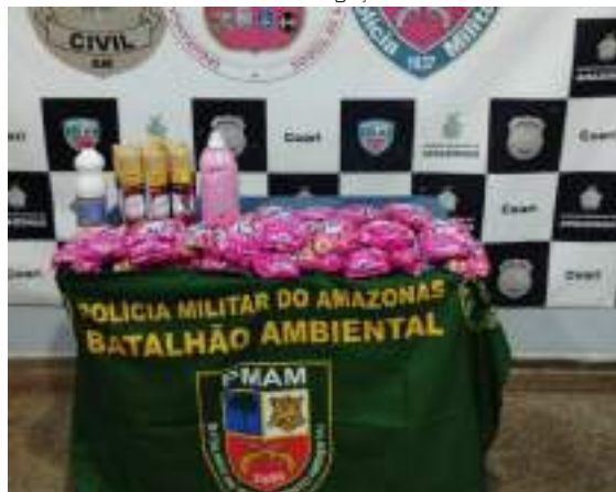
Trio foi preso por furtarem 25 pacotes de sabão em pó

Dois homens, um de 59 e outro de 47, e uma mulher de 29 anos, foram presos no município de Coari, no interior do Amazonas, por suspeita de furtarem 25 pacotes de sabão em pó, seis odorizadores de ar, dentre outros produtos de limpeza, avaliados em cerca de R$300, de um mercadinho, na sexta-feira (7).