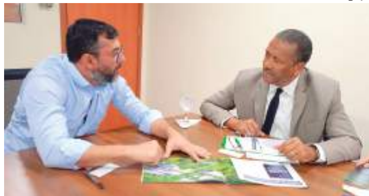
Operação Aceiro 2023 contra queimadas na Amazônia

A pedido do governador Wilson Lima, o Ministério da Justiça e Segurança Pública autorizou, na última quinta-feira (06), a atuação da Força Nacional de Segurança Pública, por até 90 dias, em Humaitá, Apuí, Boca do Acre, Lábrea