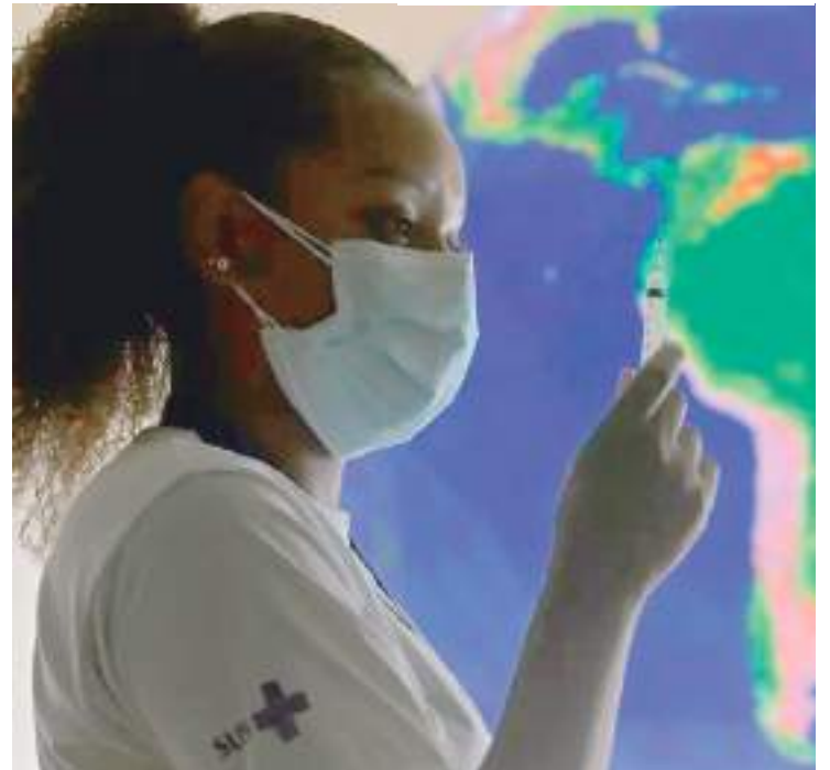
Brasil era referência mundial no assunto

No ano seguinte, viveram imagens de esperança, como profissionais de saúde agitados o sambódromo do Rio de Janeiro em centro de imunização, ou embarcando na floresta amazônica para entregar vacinas aos povos indi-