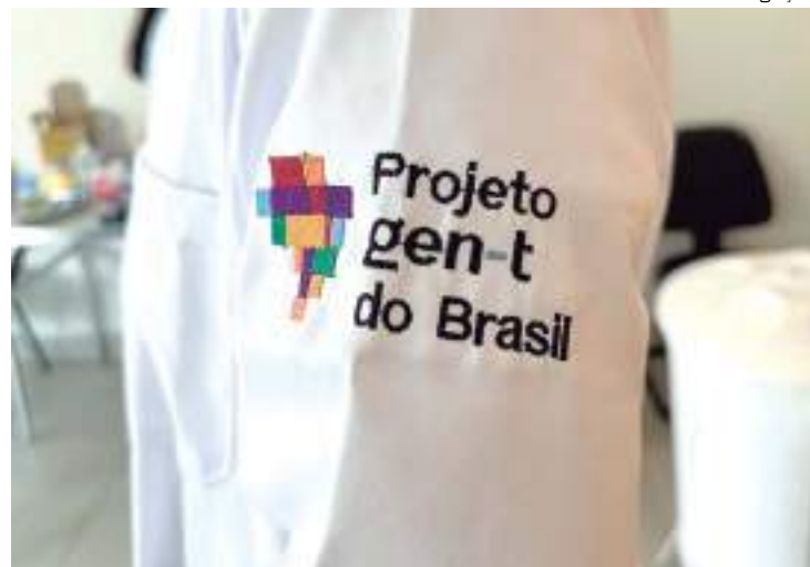
Objetivo é melhorar a prevenção e tratamento de doenças

Parte da amostra tem como destino um labora-