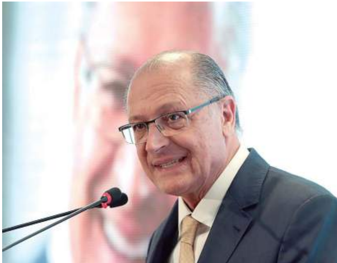
A assinatura do contrato marca o início de uma nova fase do CBA, antes ligado à Zona Franca de Manaus

2002 e começou as atividades em 2003 com o nome de Centro de Biotecnologia da Amazônia (CBA), ligado à Superintendência da Zona Franca de Manaus (Suframa). A alteração da denominação, com foco em negócios, foi feita junto com a qualificação da FUEA, pelo Decreto nº 11.516.