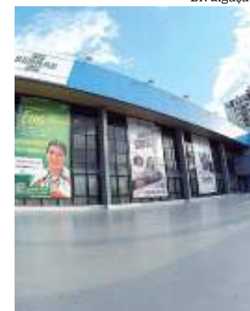
Sede do Sebrae Amazonas

Após realizar a inscrição online, o interessado receberá e-mail de confirmação.