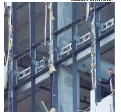
Edifícios em Moscou foram danificados

A porta-voz do Ministério das Relações Exteriores da Rússia, Maria Zakharova, disse ao canal de TV RTVI que a Ucrânia era culpada do que chamou de “um ato de terrorismo internacional”.