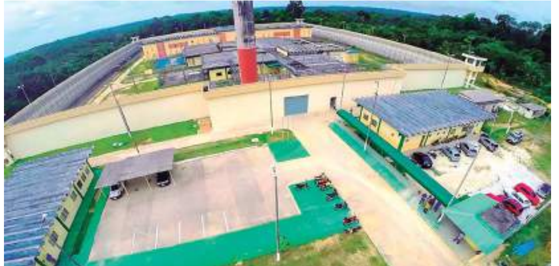
Medida foi tomada para prevenir brigas entre facções

No último dia 18, um preso foi morto após uma briga no Instituto Penal Antônio Trindade (IPAT) na BR 174. No dia seguinte, vistorias em cinco unidades prisionais de Manaus foram realizadas, mas segundo a Secretaria