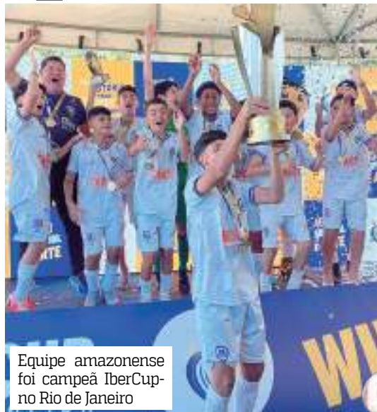
Equipe amazonense foi campeã IberCup no Rio de Janeiro