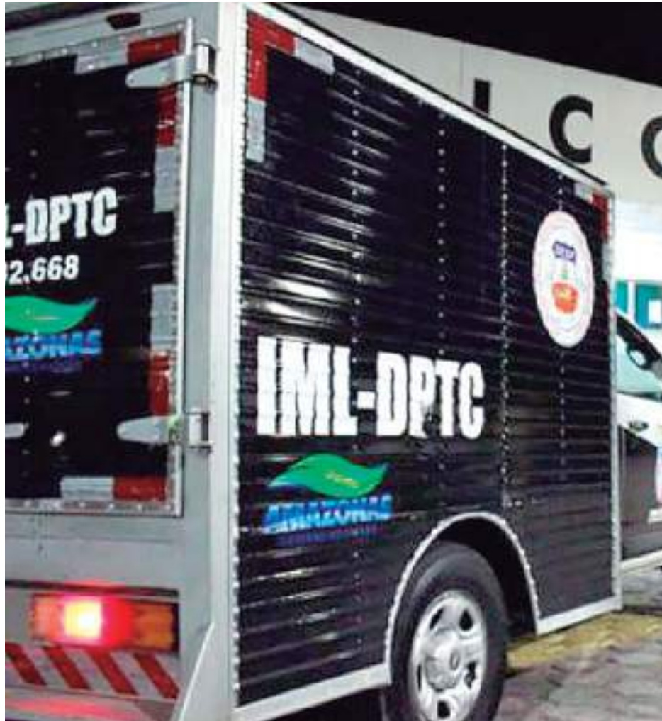
Carro do Instituto Médico Legal removeu os corpos das duas vítimas