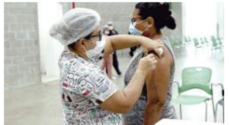
Para mais informações acesse: www.imuniza.manaus.am.gov.br

Nos pontos de vacinação, os usuários devem apresentar documento de identidade com foto, CPF ou Cartão Nacional de Saúde (CNS) e cartão de vacina para receber o imunizante. É possível consultar a situação vacinal e conferir as doses a serem aplicadas na plataforma on-line Imuniza Manaus ( imuniza.manaus.am.gov.br ).