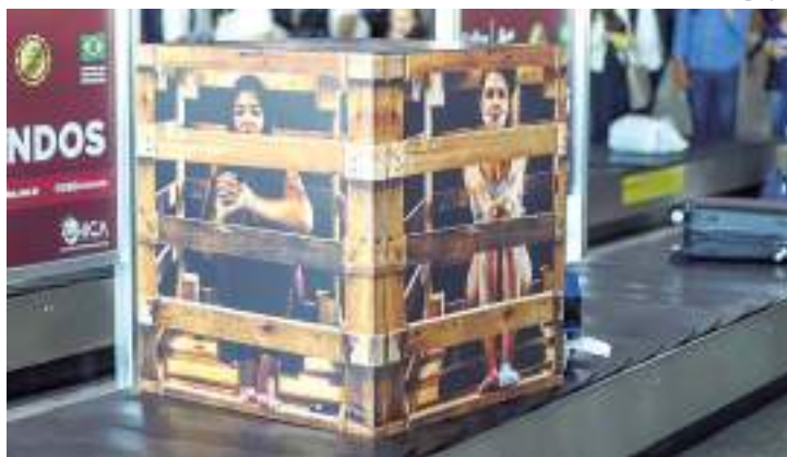
Denúncias podem ser feitas através do Disque 100

A Secretaria Municipal da Mulher, Assistência Social e Cidadania (Semasc), lançou no aeroporto inter-