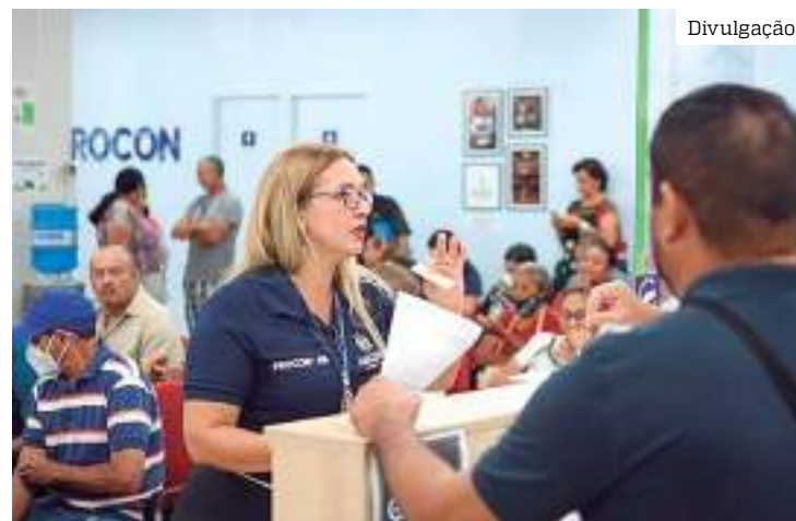
Servidores do Procon-AM atendem pessoas endividadas

Para participar do mutirão, os consumidores interessa-