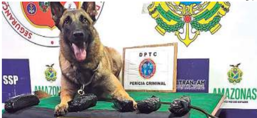
Cão policial encontrou cerca de 1,3 kg de pasta base de cocaína

Cerca de 1,3 kg de pasta base de cocaína foi apreendida no barco Maria Monteiro, por volta de 2h30 de segunda-feira (24), durante a Operação Fronteira Mais Segura/Hórus, que conta com apoio de cães farejadores.