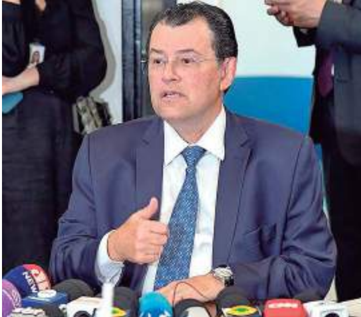
Relator da reforma na CCJ, Eduardo Braga diz que não vê espaço para aumento da carga tributária no país

“Estimamos um prazo de dois ou três meses para o amadurecimento de todos os pontos [da reforma]. O Congresso deve uma reforma tributária ao Brasil, tenho muita convicção de que a entregaremos ainda esse ano”,