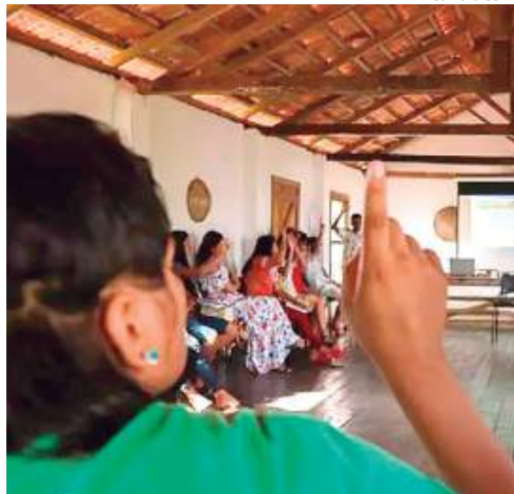
Projeto atende comunidades ribeirinhas

As atividades são realizadas por meio do Programa de Desenvolvimento Integral de Crianças e Adolescentes Ribeirinhas da Amazônia (Dica-ra) que atende o público de 0 a 17 anos em comunidades ribeirinhas e bairros periféricos de 9 municípios do interior do Amazonas. São realizadas diversas ações nos eixos de Educação e Cidadania com o intuito de proteger e garantir os direitos das crianças e adolescentes, além do empoderamento desse público e o desenvolvimento de habilidades e po-