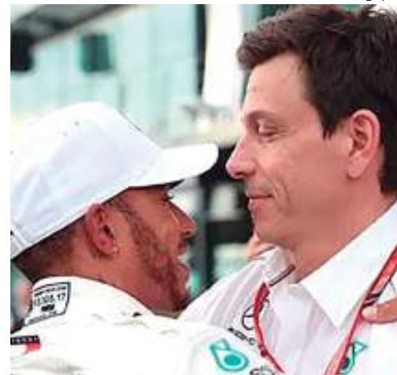
Diretor deu recado ao heptacampeão durante GP da Áustria