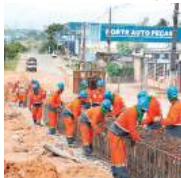
Equipe trabalha na perfuração de aproximadamente 600 estacas

A Prefeitura de Manaus, por meio da Secretaria Municipal de Infraestrutura (Seminf), avança na segunda-feira (3), com a obra do complexo viário nas avenidas Barão do Rio Branco e Governador José Lindoso, mais conhecida como avenida das Torres, no bairro Flores, Zona Centro-Sul. A equipe trabalha na perfuração de aproximadamente 600 estacas, destas, 401 fo-