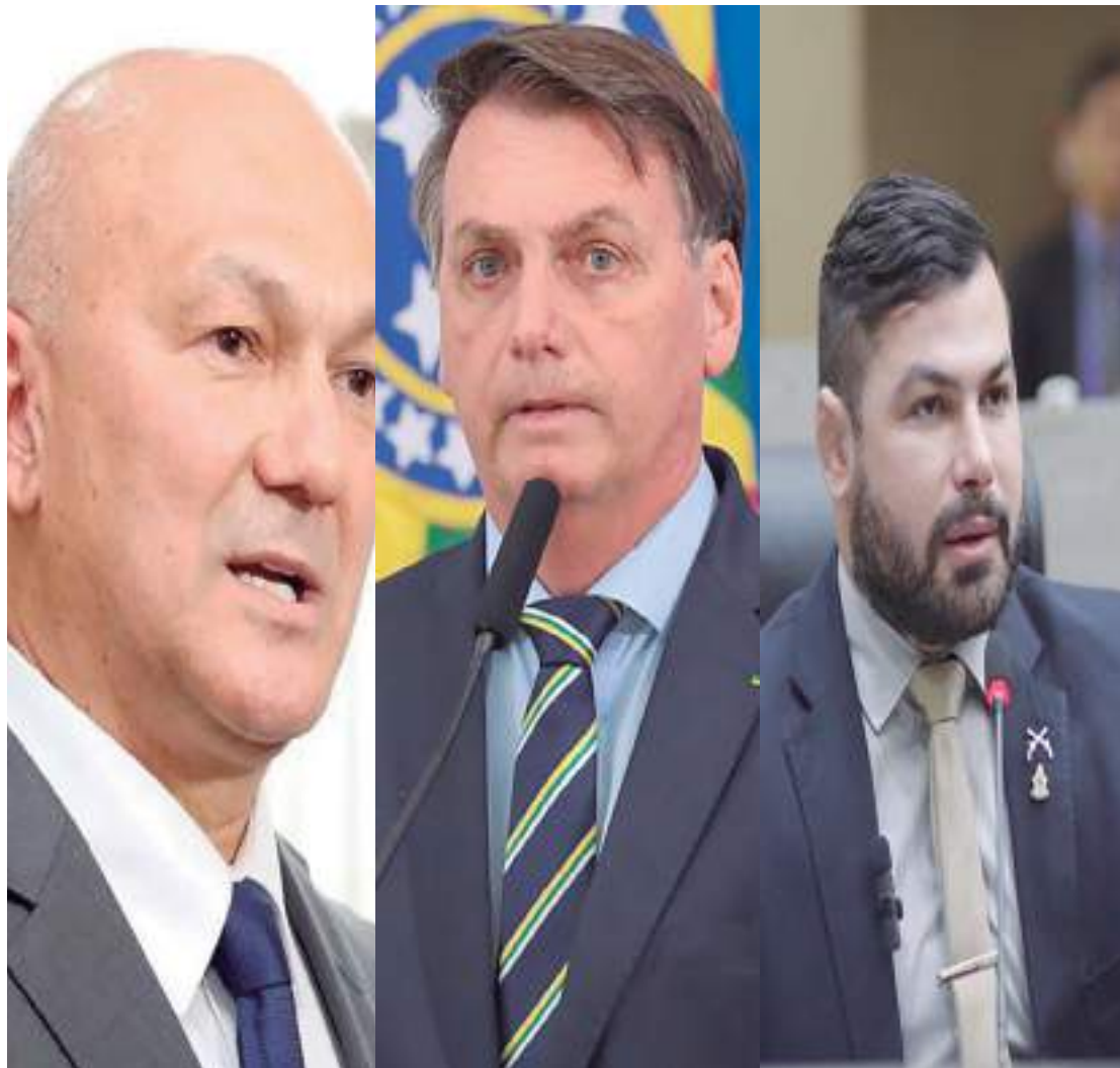
Políticos afirmam que Bolsonaro seguirá sendo líder da direita no Brasil, mesmo sem disputar pleito

Por 5 votos a 2 a favor da condenação e a inelegibilidade, Bolsonaro ficará fora das eleições até 2030 com voto decisivo dado pela ministra Cármen Lucia. Ao longo da semana, lideranças do PL afirmaram que, caso a inelegibilidade se concretizasse, Bolsonaro se tornaria o “maior cabo eleitoral” do partido. Nas