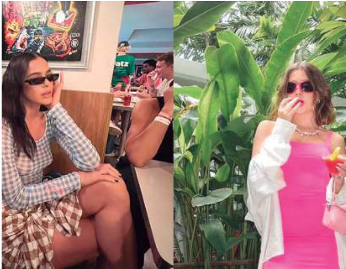
Bruna Marquezine faz pedido a fãs para pararem de brigar em seu nome e de Jade Picon

Neste último domingo (02), a atriz Bruna Marquezine respondeu a um tweet de uma fã, solicitando para que os seus fãs parassem com a briga.