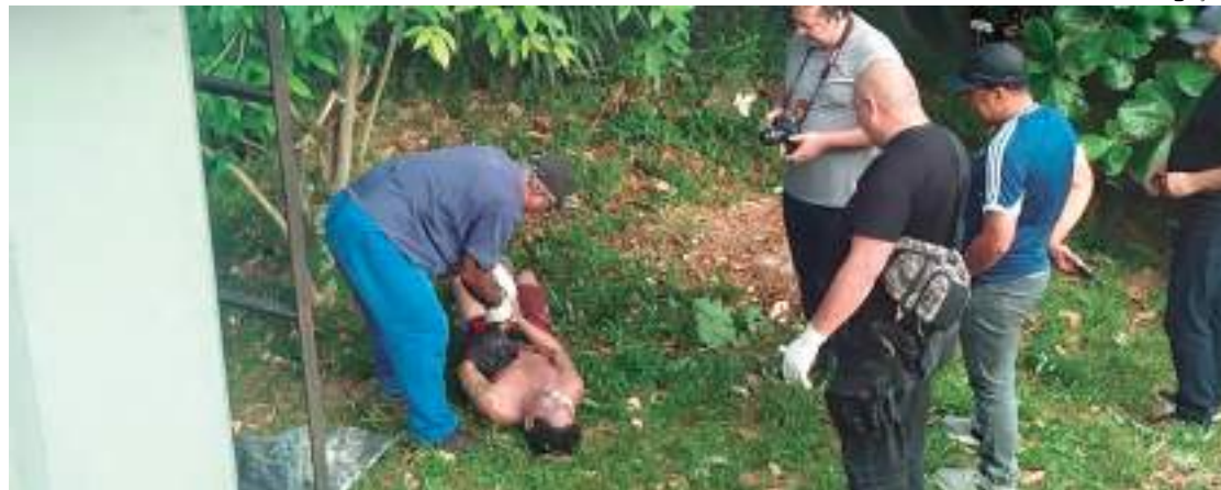
Corpo de um homem foi encontrado boiando dentro de um igarapé

O corpo de um homem, não identificado, foi encontrado boiando dentro de um igarapé localizado no bairro Chapada, Zona Centro-sul de Manaus.