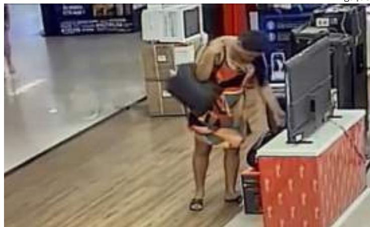
Mulher furta uma caixa de som da marca JBL de loja

A Polícia Civil do Amazonas (PC-AM), por meio do 9º Distrito Integrado de Polícia (DIP), solicita a colaboração da população na divulgação das imagens de uma mulher, não identificada, pelo furto de uma caixa de som da marca JBL, de uma loja de departamento localizada em um shopping center na Zona Leste de Manaus.