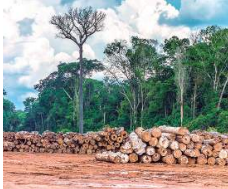
Local equivale ao tamanho de 118 campos de futebol

O Ministério do Meio Ambiente e Mudança do Clima (MMA) criou um grupo de trabalho (GT) para acompanhar medidas ambientais previstas no plano de ação do Comitê de Coordenação Nacional para Enfrentamento à Desassistência Sanitária das Populações em Território Yanomami. A decisão foi publicada nesta segunda-feira (3), no Diá-