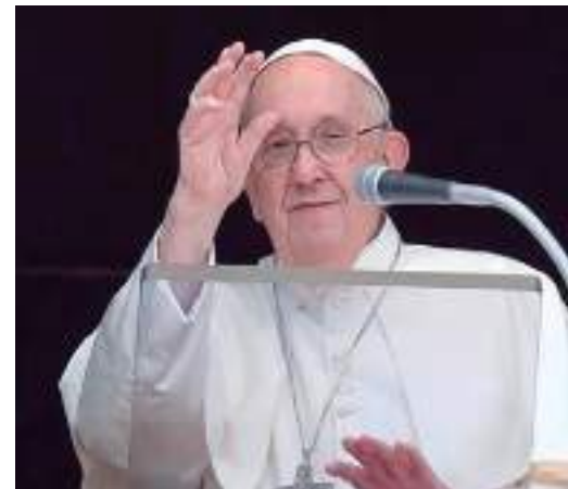
Papa Francisco discursa no Vaticano

No domingo (2), um grupo de 57 países islâmicos indicou a possibilidade de tomar medidas conjuntas contra atos de profanação do Alcorão, para que a lei internacional seja aplicada como elemento de dissuasão contra manifestações de ódio religioso.