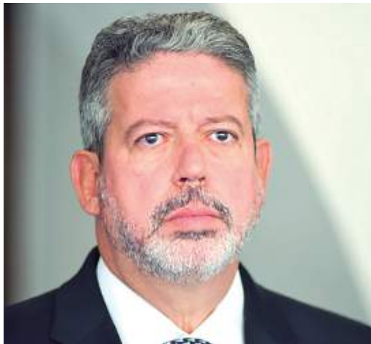
Lira ainda vai avaliar, ao longo da semana, se será possível concluir também a segunda votação na semana

Para acelerar as articulações, Lira reuniu líderes em Brasília no