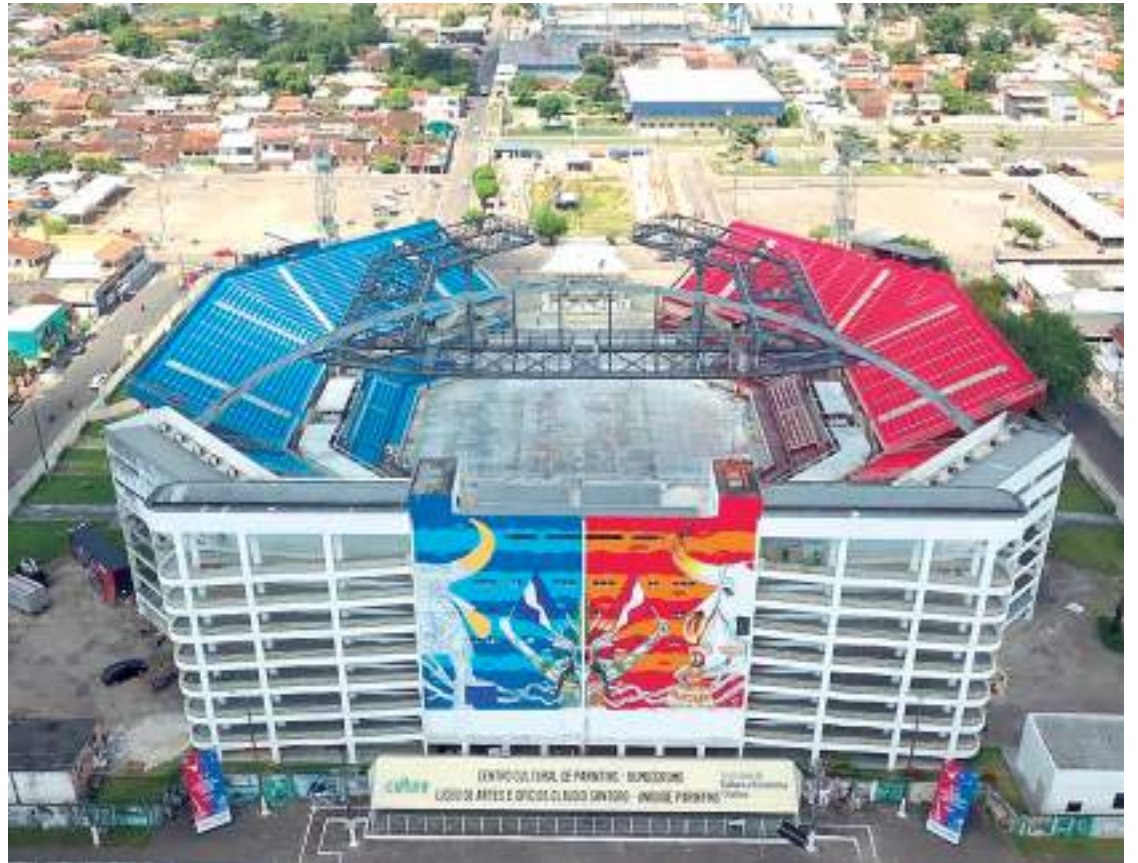
Bumbódromo é palco da disputa entre Caprichoso e Garantido

O local conta com Sala Multiuso e Sala de Multimídia; com as Galerias de Artes Wandir Santos e Jair Mendes; Cineclube