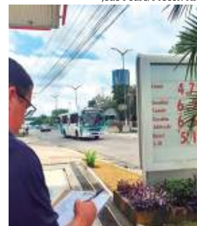
O valor de R$ 5,99 ficou congelado por um mês

O Procon-AM está aberto de segunda a sexta-feira, das 8h às 14h, na Av. André Araújo, 1500 - Aleixo para atender a população e receber as denúncias, ou via telefone 0800 092 1512/3215 4009. Ou através do site www.procon.am.gov.br e e-mail: fiscalizacaoprocon@procon.am.gov.br .