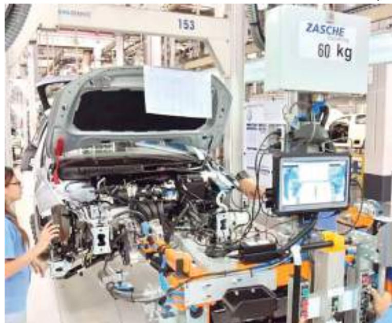
Trabalhadores da Volkswagen em Taubaté

"Importante esclarecer que não estamos com a produção totalmente parada. Estamos operando com um turno e ajustando os volumes", informou a montadora.