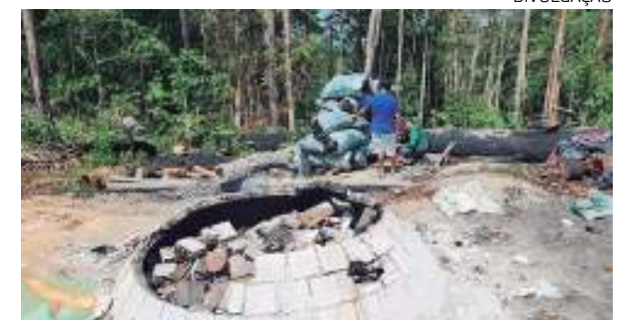
Operação já multou 22 pontos fiscalizados

De acordo com os fiscais, se trata de uma sequência ilegal: derrubadas, ocupação de área, venda de madeira retirada de forma criminosa, produção e venda de carvão, além de uso de motosserra em área não autorizada. Ao todo 22 procedimentos administrativos, entre multas, embarcos, destruição e apreensão foram consumados em uma única operação.