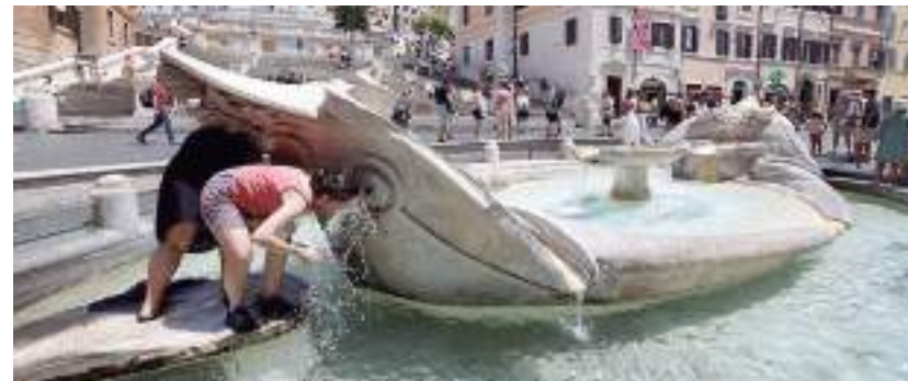
Clima extremo atinge o continente, a Ásia e os Estados Unidos