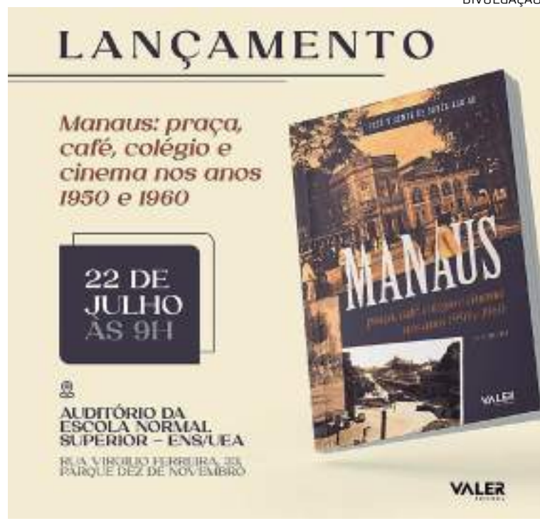
Lançamento acontece na Universidade Estadual do Amazonas