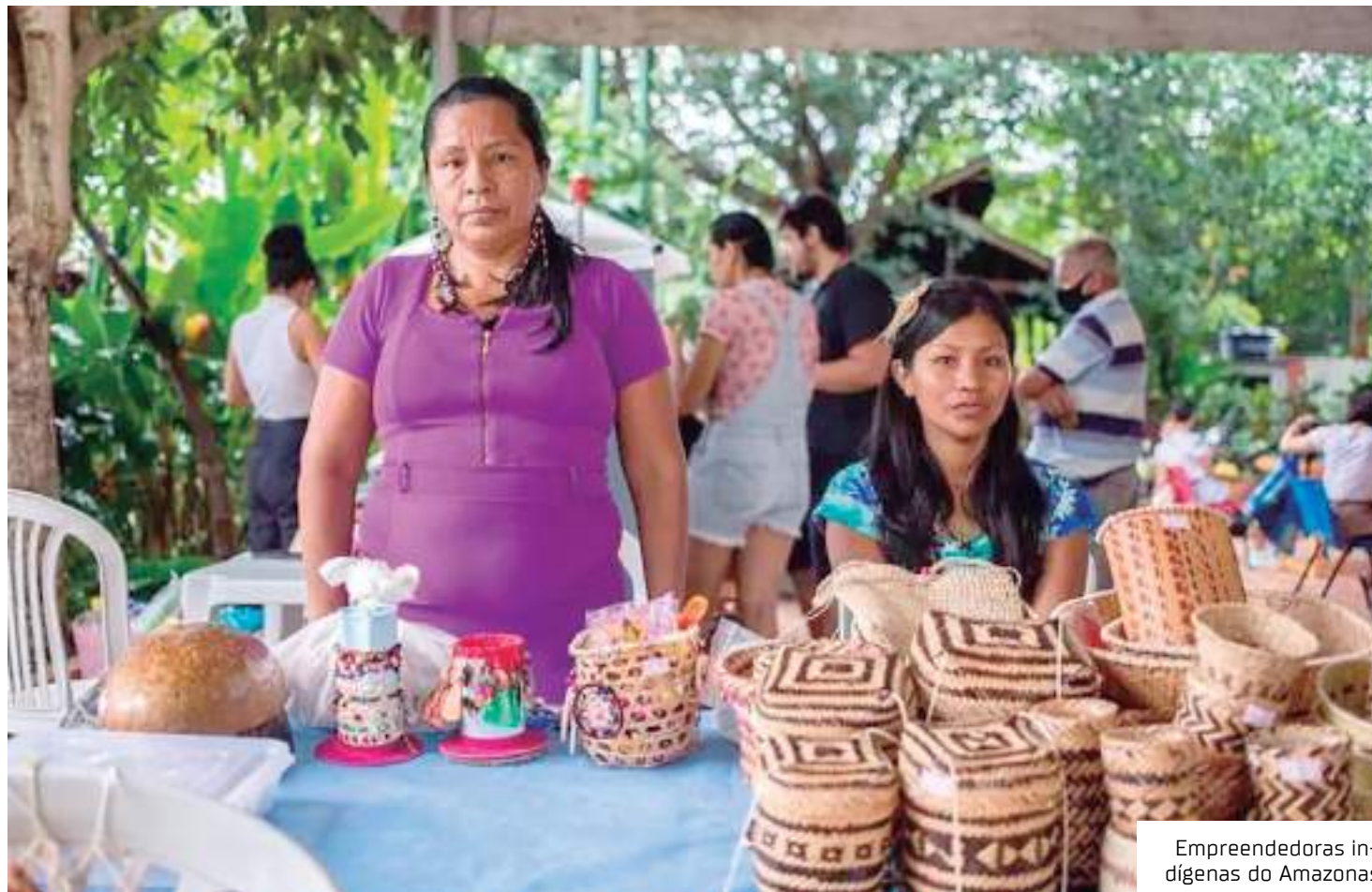
Empendedoras indígenas do Amazonas

A FAS tem como missão contribuir para a conservação do bioma pela valorização da floresta em pé e de sua biodiversidade e pela melhoria da qualidade de vida das po-