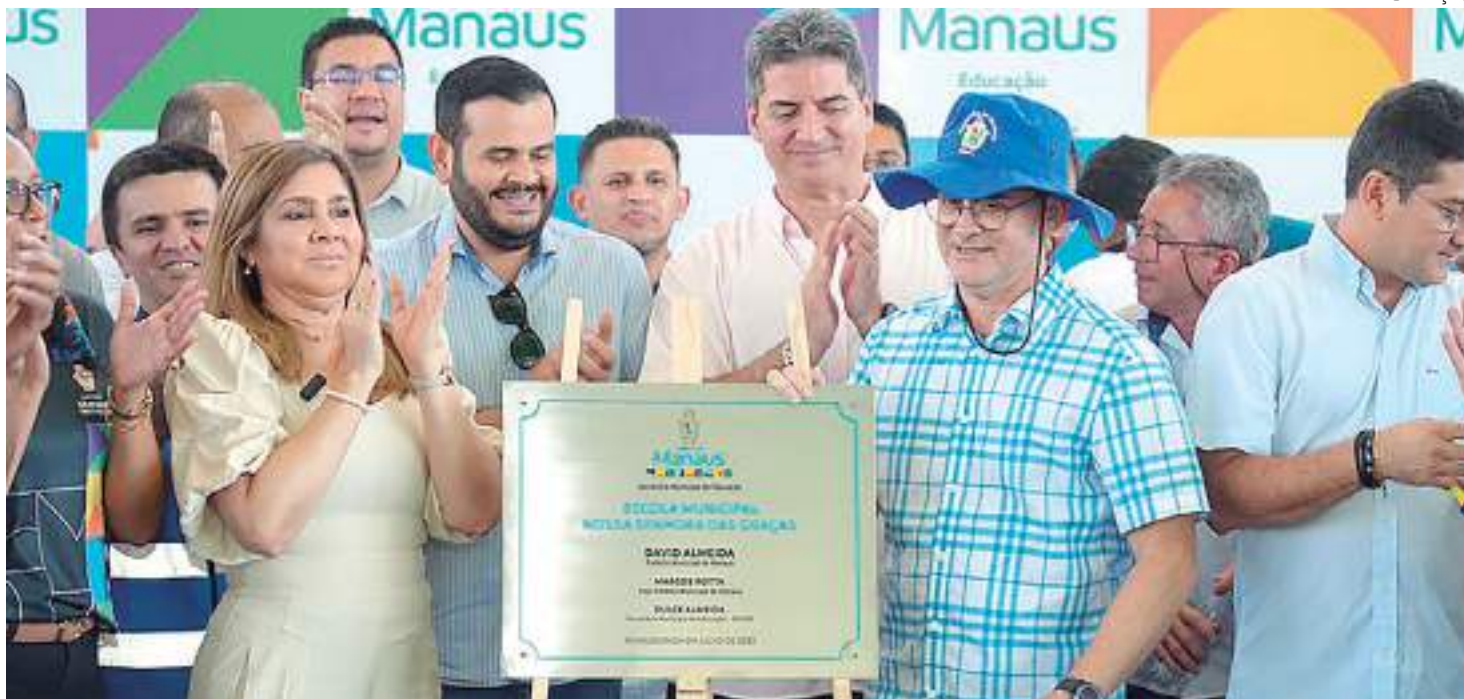
Unidade teve a pintura revitalizada, além da substituição elétrica e outros serviços

Alguns ambientes foram ampliados, como a cozinha, refeitório, banheiros, salas dos professores e de arquivado. Além disso, teve a criação de novos espaços como banheiro para Pessoas com Deficiência (PcDs), depósitos de materiais de limpeza, de alimentos, do freezer e utensílios, sala da diretoria, pedagogia, de recurso, de música e rampas de acessibilidade, com guarda corpo e corrimão, e também de uma fossa.