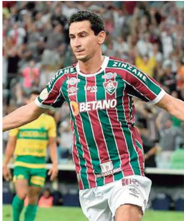
Paulo Henrique Ganso volta a sonhar com retorno a Seleção Brasileira