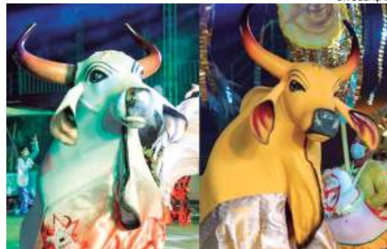
Festival é um dos maiores eventos culturais da zona rural de Parintins