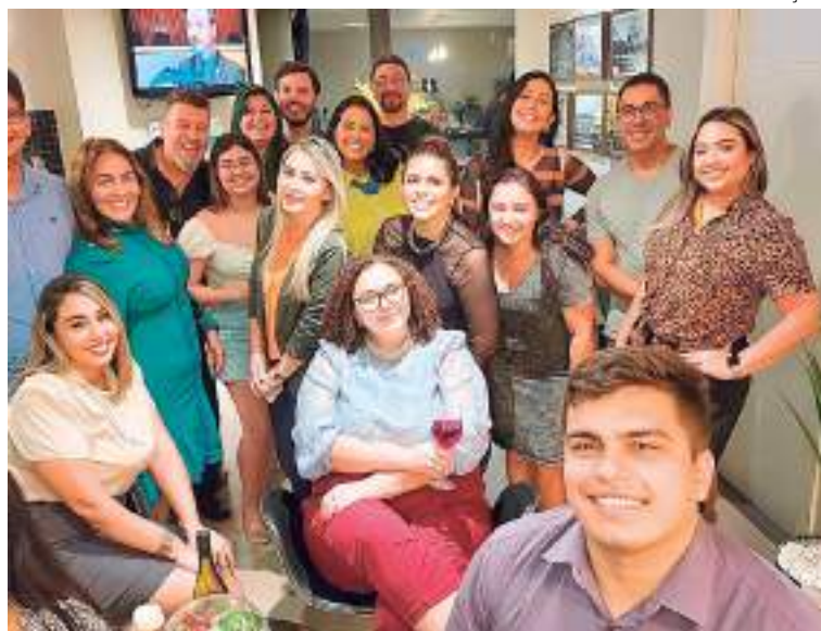
Grupo de trabalhadores da empresa Sinapsy Consultoria