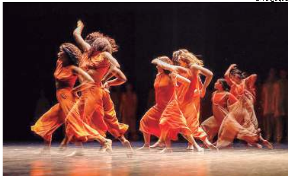
Programação conta com espetáculos do Balé Folclórico do Amazonas