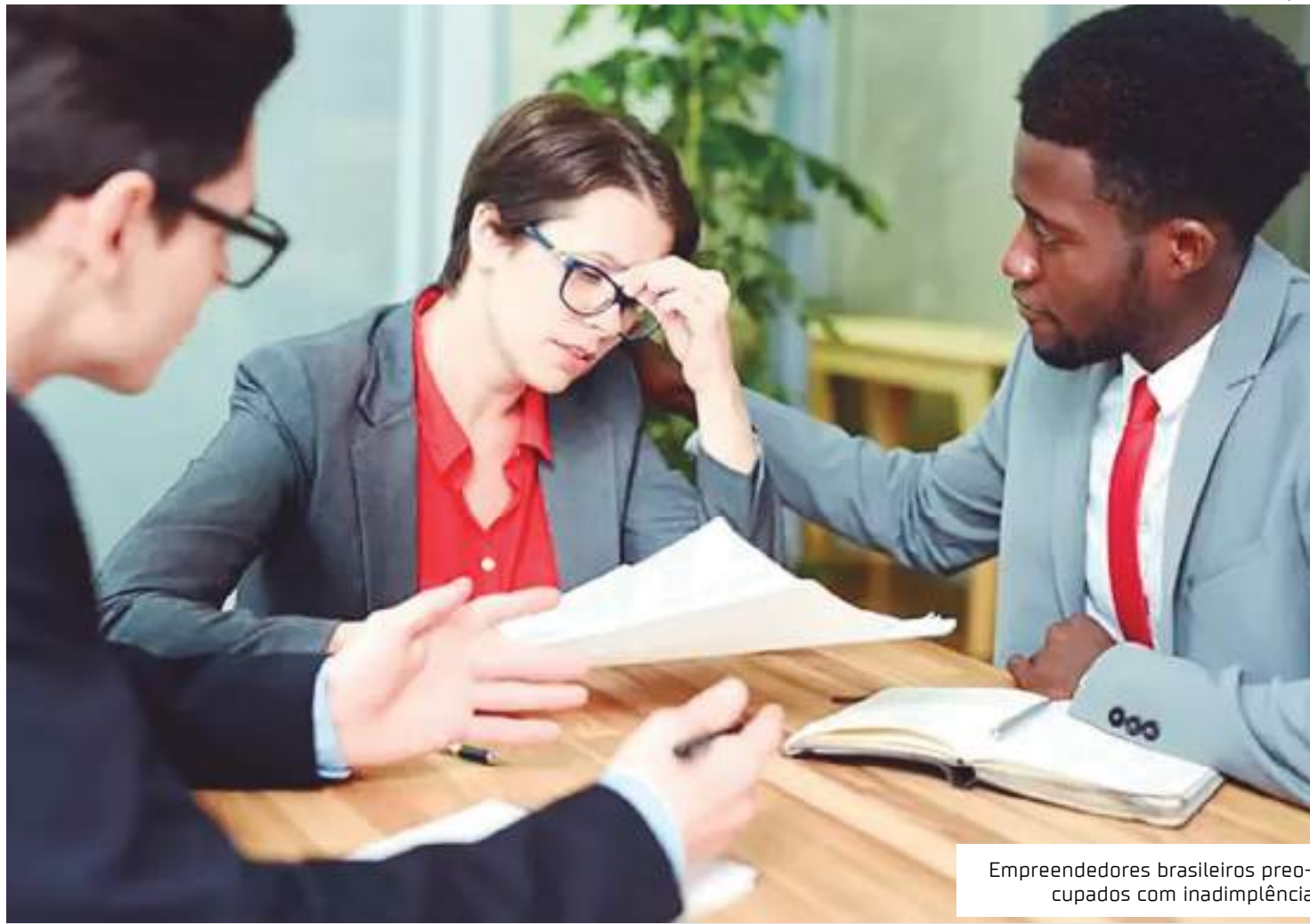
Empreendedores brasileiros preocupados com inadimplência

O advogado explica que empresários costumam recorrer a empréstimos para suprir necessidades diárias da empresa quando os gastos básicos já consomem uma parcela significativa da renda obtida. O endividamento dos pequenos negócios no Brasil, neste sentido, pode ser atribuído a diversas causas, como a falta de edu-