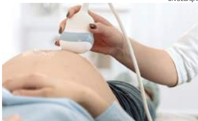
Com aumento nos casos de Zika, testes em gestantes são prioridade

O alerta é maior para as gestantes e pessoas acima de 60 anos, que, segundo o MS, são mais propensas a desenvolver complicações da doença. Vale lembrar que o país também viveu, entre 2015 e 2016, uma epidemia de Zika, ocasionando