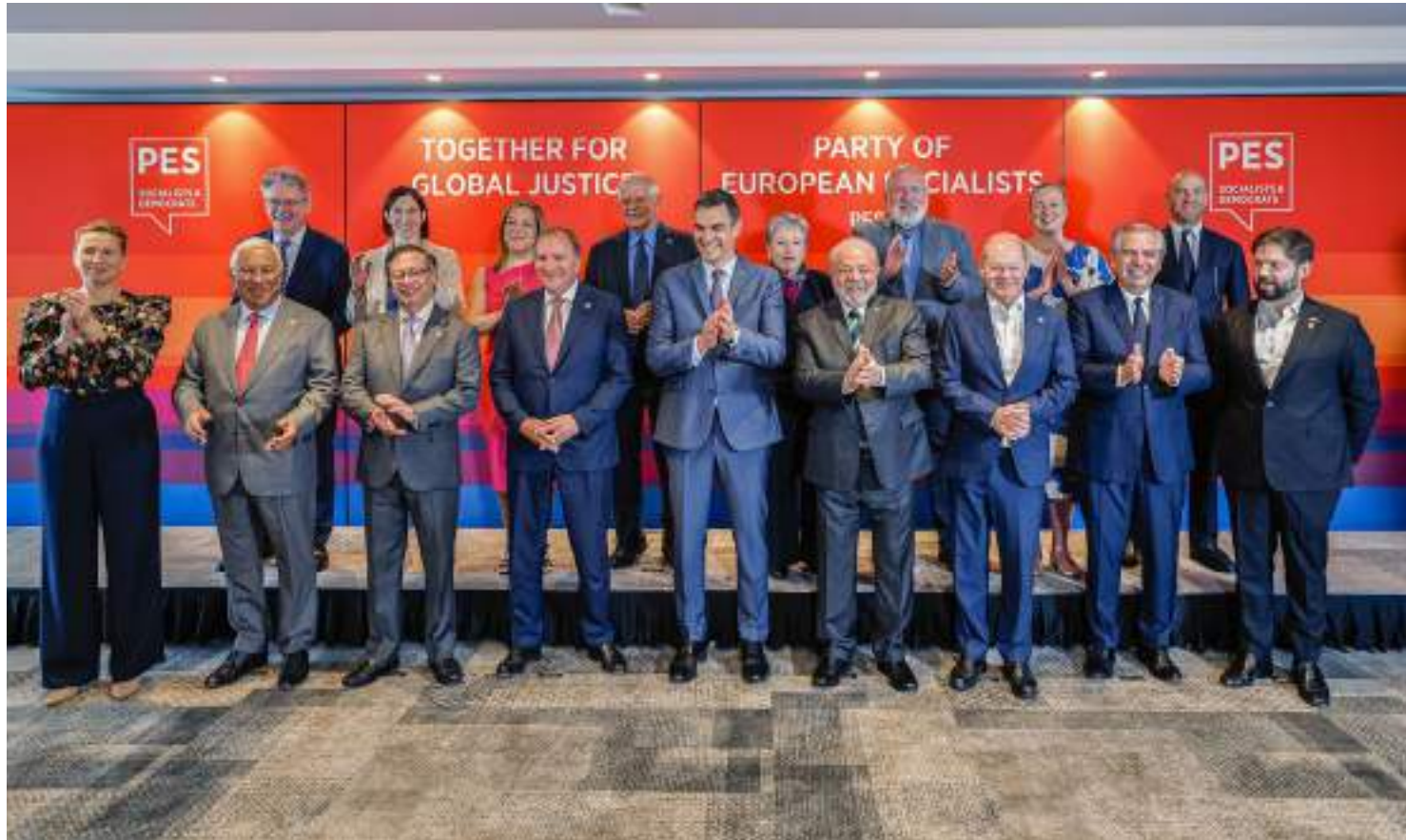
Líderes mundiais estabeleceram valor após dias de reuniões; outros setores também devem receber investimento

Terminou nesta terça-feira (18) a 3ª Cúpula da Comunidade de Estados Latino-americanos e Caribenhos (Celac) e da União Europeia (UE), em Bruxelas, na Bélgica, onde fica a sede do bloco europeu. O encontro reuniu 60 líderes dos dois continentes, incluindo o presidente Luiz Inácio Lula da Silva. O evento não ocorria desde 2015 e foi realizado em um cenário de aproximação entre europeus e latino-americanos. A declaração final da cúpula, divulgada pelas chancelarias dos países, tem mais de 40 pontos e abrange diversos temas de interesse comum. Um dos pontos, que tem sido alvo de cobrança de governos de países pobres e em desenvolvimento, refere-se à disponibilização de recursos, por parte das nações mais ricas, para financiar projetos de mitigação e adaptação em relação às mudanças climáticas. "Reconhecemos o impacto que as alterações climáticas estão a ter em todos os países, afetando particularmente os países em desenvolvimento e mais vulneráveis, incluindo os pequenos Estados insulares em desenvolvimento, no Caribe, as