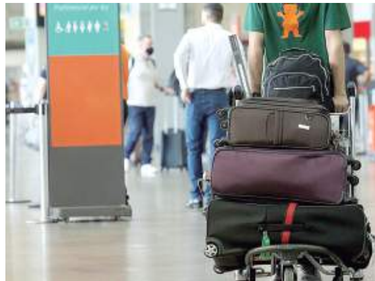
Grupo agia para embarcar drogas no Aeroporto de Guarulhos