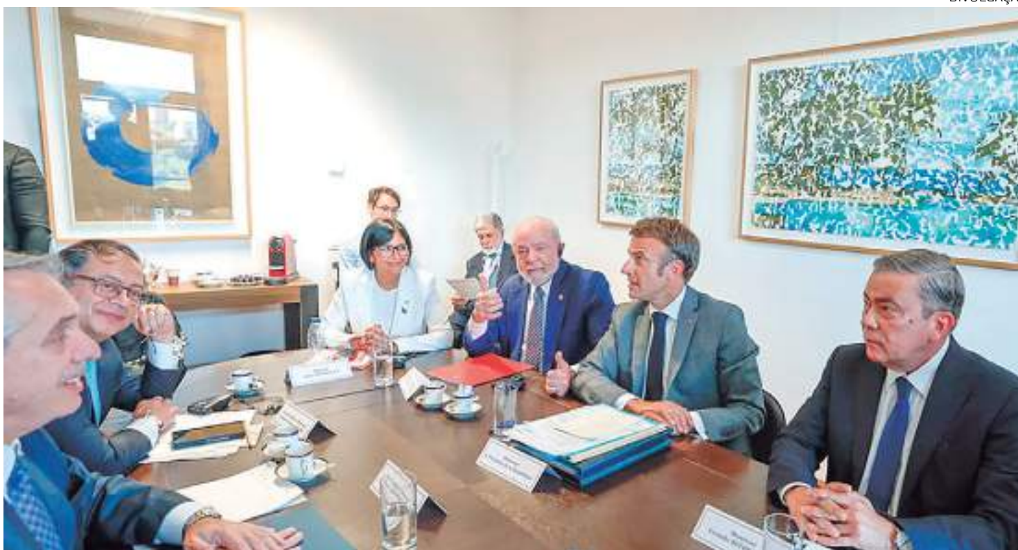
Líderes mundiais reúnem-se em Bruxelas para discutir interações entre Comunidades Latino-Americanas e União Europeia

Nesta terça-feira (18), chefes de Estado publicaram uma declaração oficial comum, que prevê o "acompanhamento internacional" do pleito.