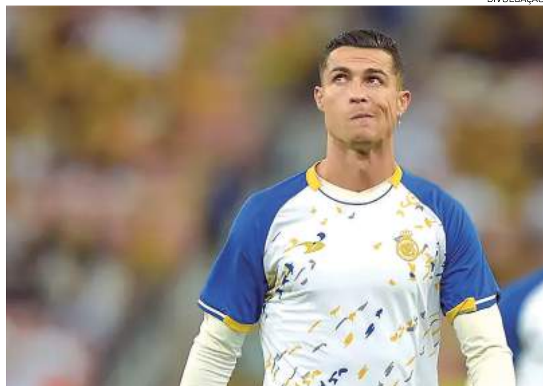
Craque português falou que Liga Saudita é melhor que a League Soccer