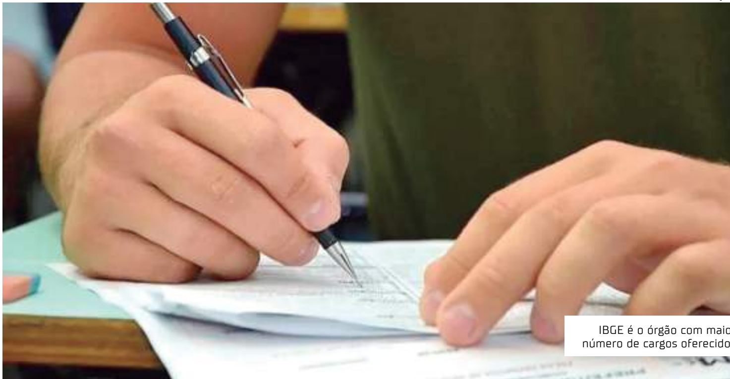
IBGE é o órgão com maior número de cargos oferecidos

Segundo a ministra, foram perdidos, desde 2017, cerca de 80 mil servidores civis na administração pública federal porque não houve reposição de quadros. De acordo com o ministério, entre 2017 e 2023, a área social perdeu 15,7% da força de trabalho, em contraste