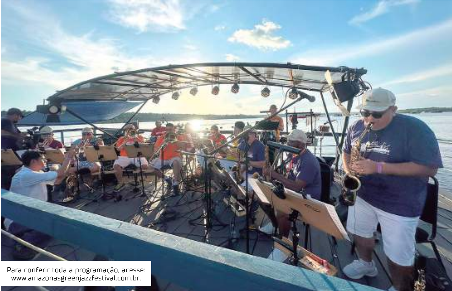
Para conferir toda a programação, acesse: www.amazonasgreenjazzfestival.com.br .

Já o espetáculo de abertura do Amazonas Green Jazz Festival acontecerá no dia 21 de julho, a partir das 20h, com a estreia mundial do concerto "Amazônia Verde para Sempre", do compositor americano Ed Sarath, elaborado a partir