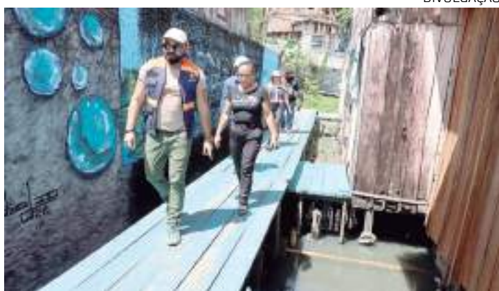
Mais de 900 moradores são beneficiados

Unidade Gestora de Projetos Municipais de Abastecimento de Água e Esgotamento Sanitário (UGPM-Água), acompanhou a instalação dos 350 metros de tubulações de esgoto, que possui uma estação elevatória, responsável por recolher os dejetos humanos da região e levar até a Estação de Tratamento de Esgoto do bairro de Educandos (ETE Educandos).