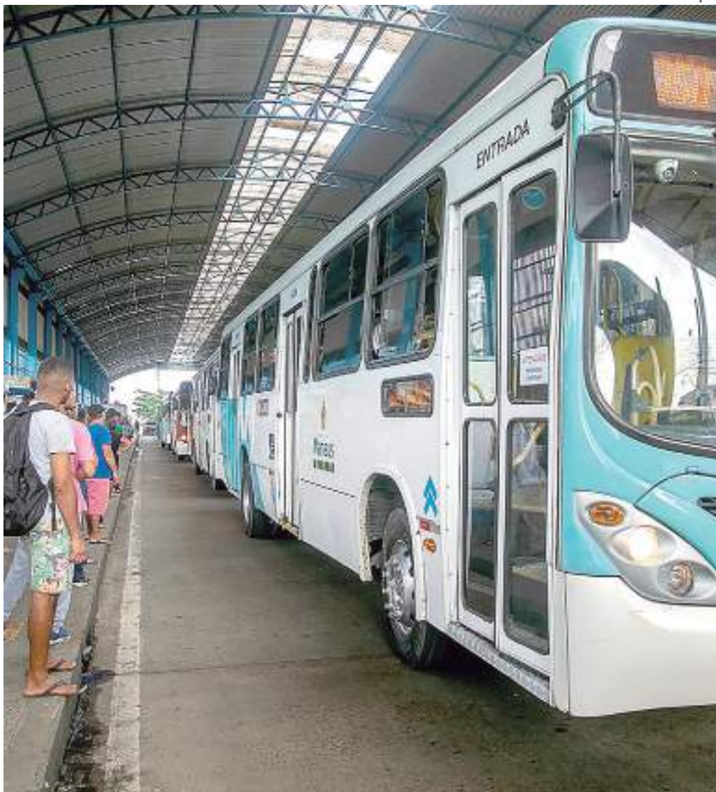
Medida recomenda o embarque e desembarque de passageiros em lugares iluminados