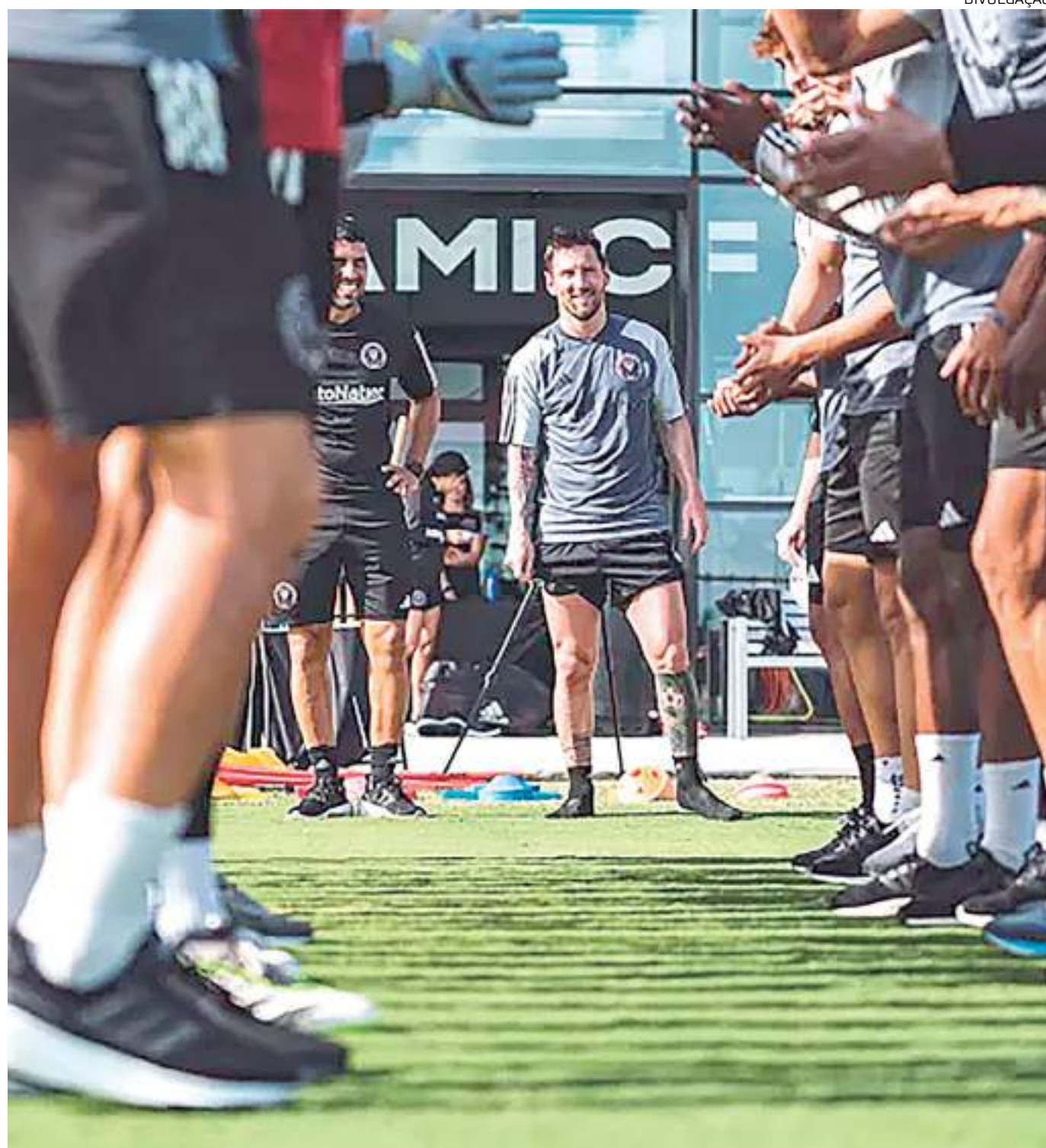
Messi foi bem recepcionado pelos seus companheiros do Inter Miami

O Paris Saint-Germain anunciou, neste sábado, a saída de Messi ao fim da