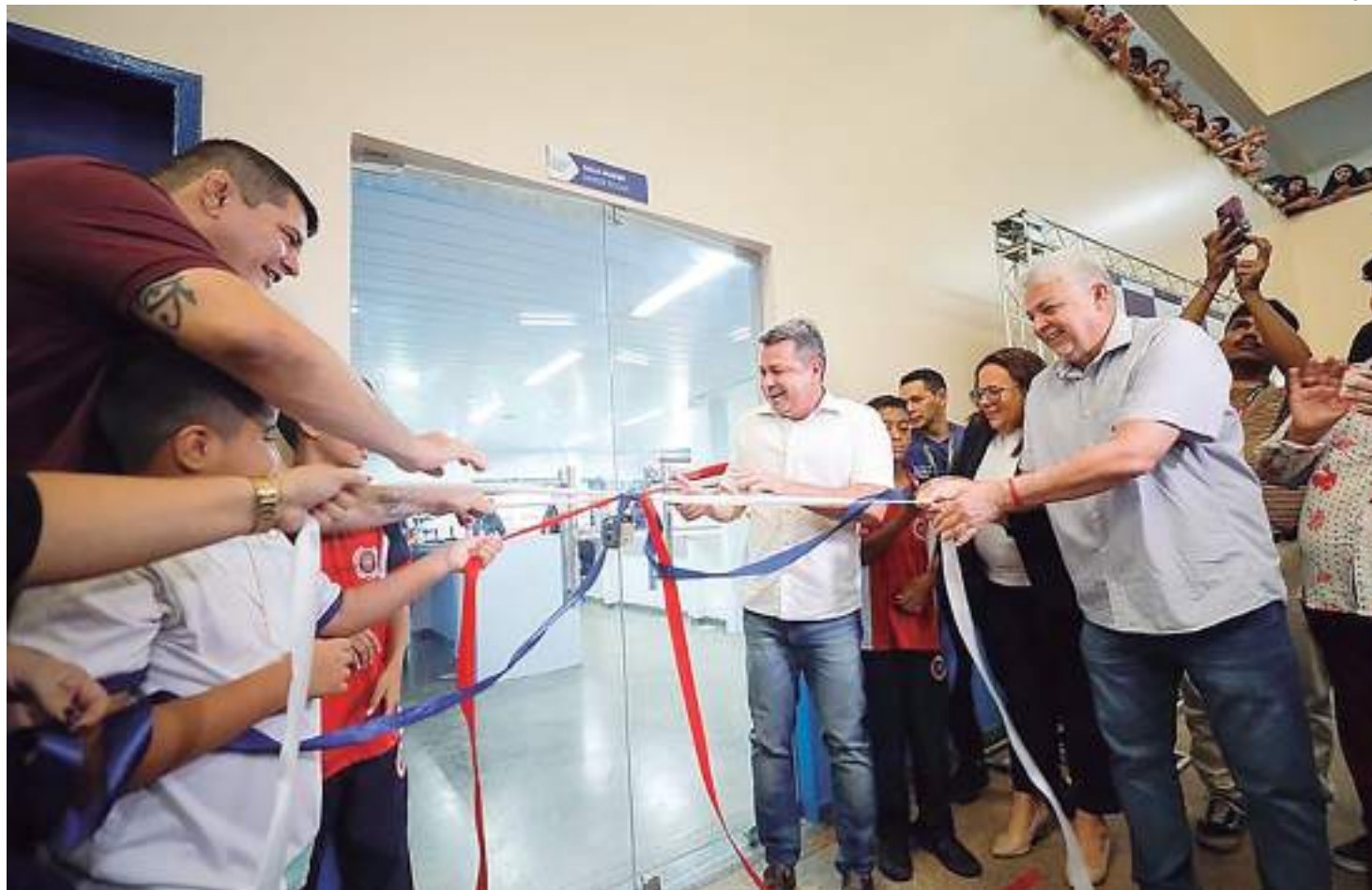
Laboratório é o 51º de um total de 100 a serem entregues pelo governo

"É uma grande satisfação poder fazer a entrega do 51º laboratório, que vem facilitar, com toda certeza, o trabalho dos nossos docentes junto à