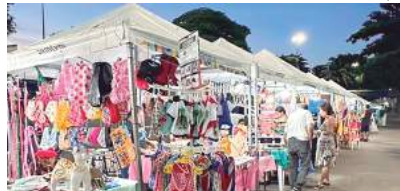
Feira de Artesanato Itinerante