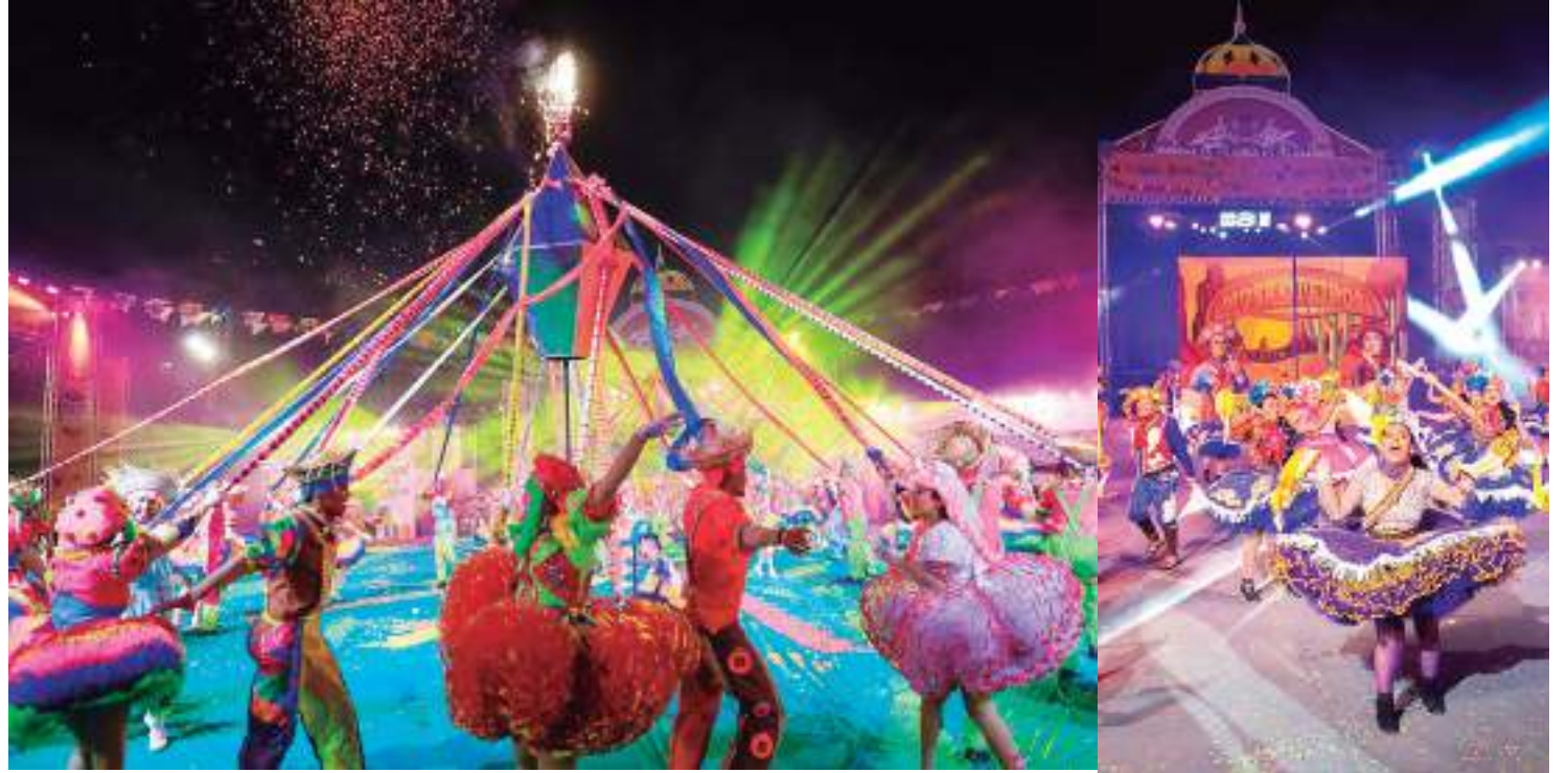
Apuração das notas dos jurados acontecerá no Centro Cultural Povos da Amazônia

"Chegamos à 65ª edição do festival, considerado o mais antigo do Estado, posto que se deve a vários fatores, como a organização, a equipe técnica envolvida, o apoio financeiro do Governo do Estado aos grupos folclóricos, um corpo de jurados técnico-artístico comprometido e a transparência da