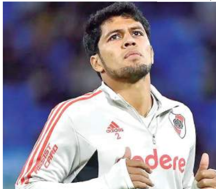
Zagueiro argentino está entre os reforços do Vasco para segundo turno do Brasileiro

"É possível [se recuperar com Ramón Díaz]. É um bom defensor. É um jogador limpo e taticamente obediente. Tem um bom jogo aéreo", disse o jornalista argentino Juan Cortese.