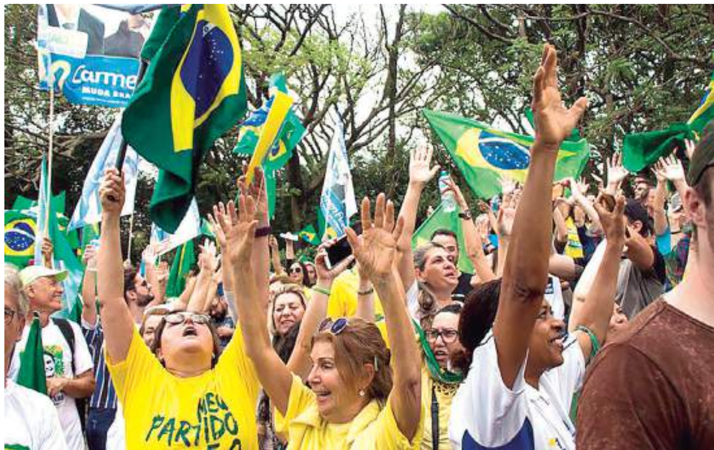
Apoiadores de Jair Bolsonaro em 30 de setembro de 2018 em Porto Alegre, Brasil

Entre tantos discursos violentos, está a democracia brasileira. Após mais de 20 anos de ditadura militar, o povo brasileiro teve a oportunidade