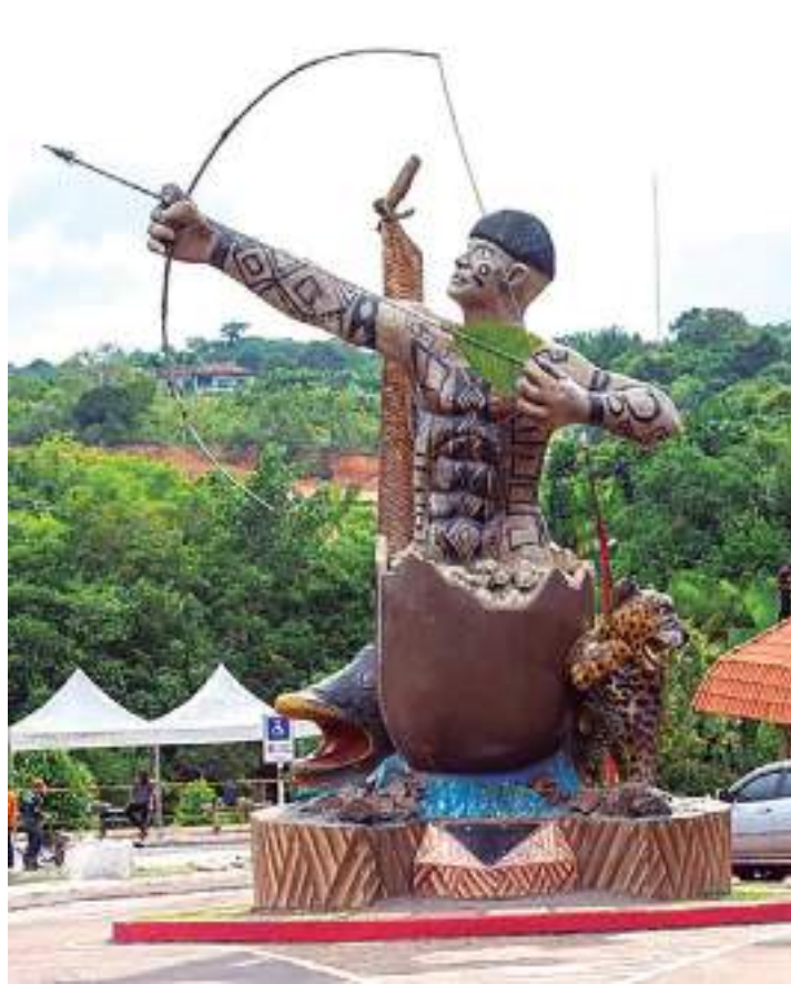
No total, 30 atrações vão se apresentar na Festa

Feira de Agroindústria de Negócios e Economia Criativa A XXV Feira de Agroindús-