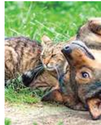
Ação acontece no Centro de Atendimento à Saúde Animal