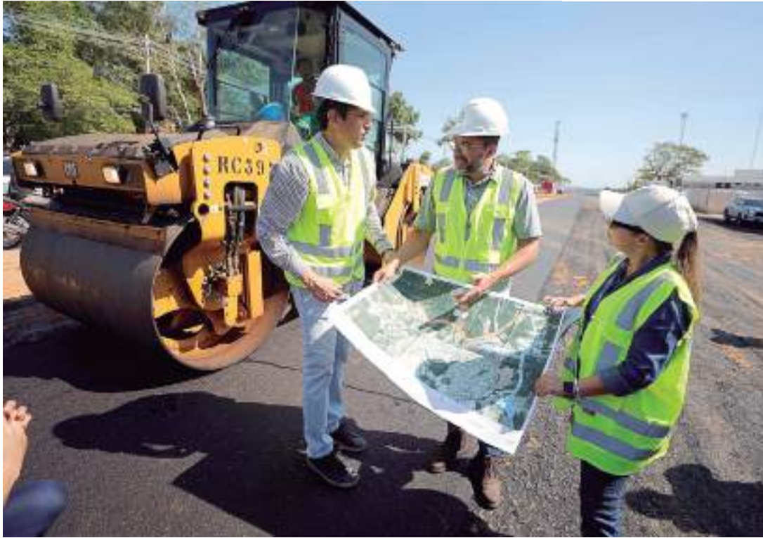
Governador também destacou que as obras do complexo viário Anel Leste já contemplam 55% de execução

Segundo Wilson Lima, o Complexo Viário Anel Sul – antiga Avenida do Turismo – irá desafogar o trânsito da avenida Torquato Tapajós. A via vai atender a atual demanda