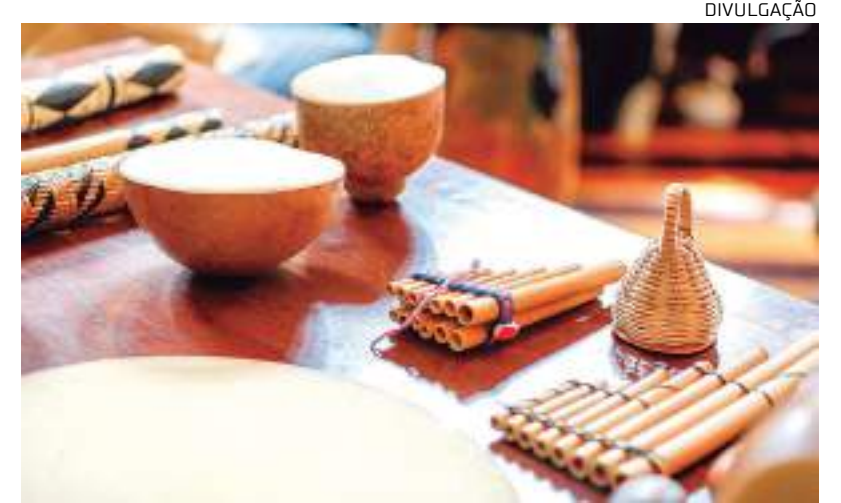
Inscrições começam nesta segunda-feira (31)