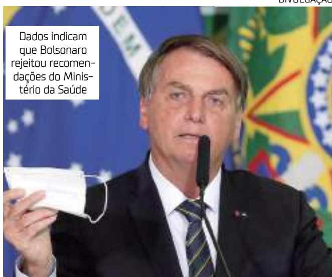
Dados indicam que Bolsonaro rejeitou recomendações do Ministério da Saúde

O ex-presidente é mundialmente conhecido por fazer propagandas enfatizando a cloroquina como tratamento contra o vírus, além de atuar com lentidão e até se manifestar contrário à imunização, mesmo com a produção de vacinas em outros países.