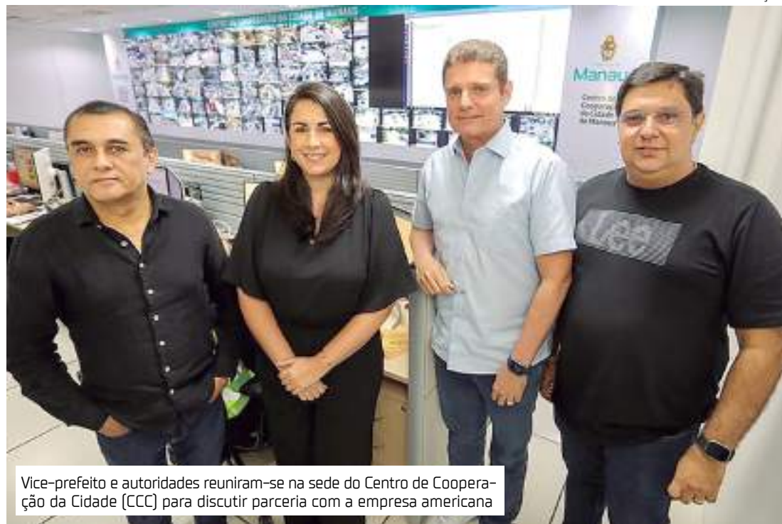
Vice-prefeito e autoridades reuniram-se na sede do Centro de Cooperação da Cidade (CCC) para discutir parceria com a empresa americana

"Essa possibilidade de integração irá acontecer em tudo que for voltado para a cidade de Manaus. Por isso, essa parceria com o