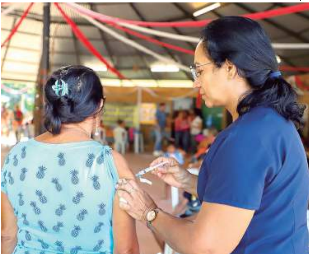
Pontos de vacinação funcionam das 8h às 12h

Como forma de assegurar o controle da Covid-19 e promover a saúde e o bem-estar da população na capital, a Prefeitura de Manaus dá continuidade à campanha de imunização contra a doença neste sábado, 28, com a oferta de vacinas em nove unidades de atenção básica da Secretaria Municipal de Saúde (Semsá). Os pontos de vacinação funcionam das 8h às 12h.