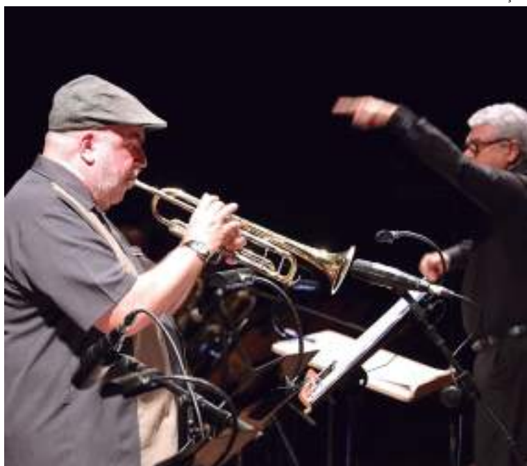
Trompetista norte-americano já venceu 10 vezes o Grammy