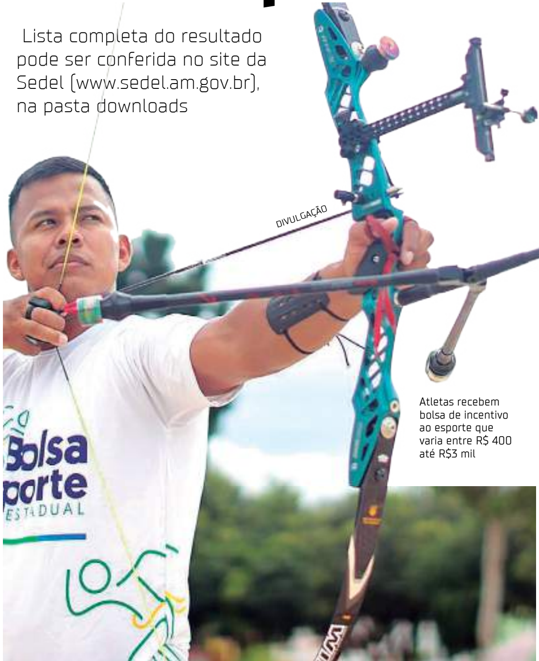
Atletas recebem bolsa de incentivo ao esporte que varia entre R$ 400 até R$3 mil

Lista completa do resultado pode ser conferida no site da Sedel ( www.sedel.am.gov.br ), na pasta downloads