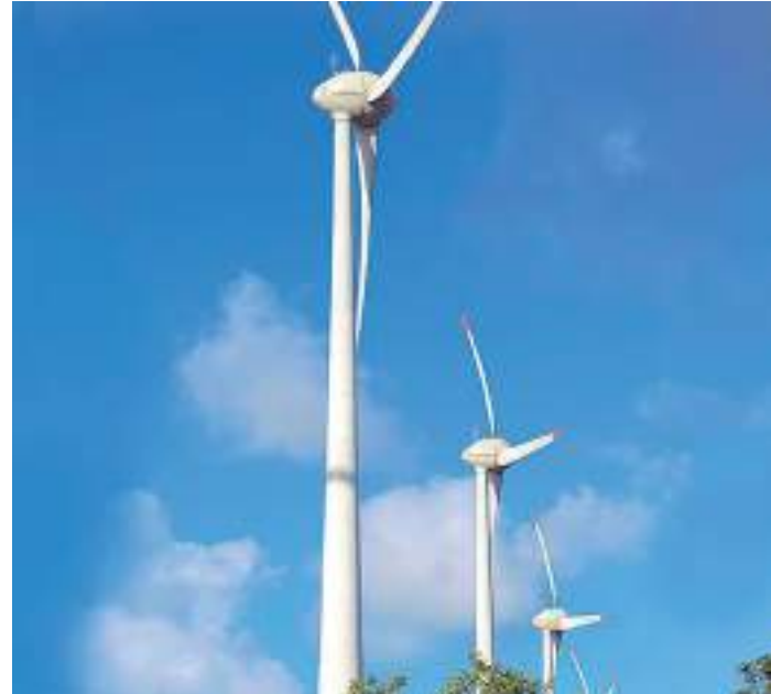
Brasil, Chile, México, Colômbia e Argentina receberam projetos

dial em investimentos em manufatura, tecnologia e geração de energia a partir de fontes renováveis. A China também é liderança mundial em capacidade de geração elétrica renovável, com 1.020 GWs de potência instalada, contra 511s GW do conjunto da União Europeia e 292 GWs dos Estados Unidos. Os chineses ainda abrigavam, em 2022, os dez principais fornecedores globais de equipamentos de energia solar. Além disso, os seis dos dez maiores fabricantes globais de turbinas eólicas, por capacidade encomendada, ficaram no país asiático em 2019.