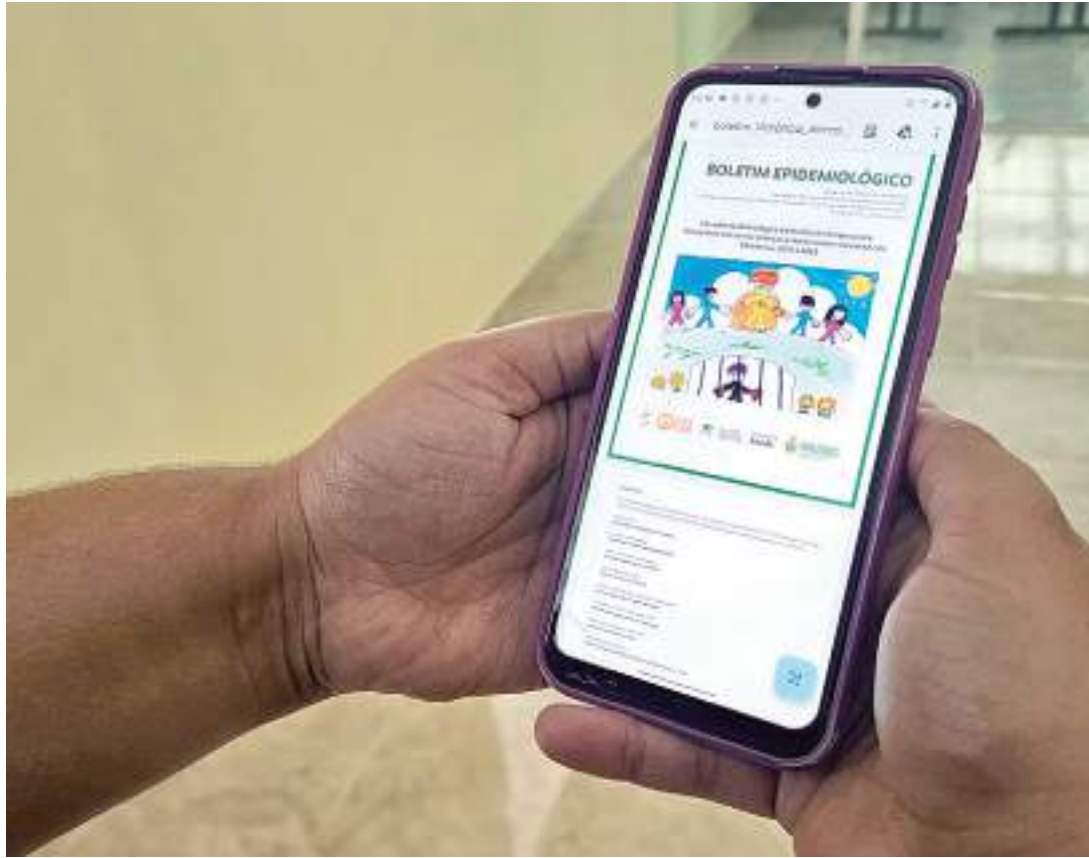
São 16.482 casos de violência contra crianças e adolescentes entre os anos de 2018 e 2022

No Amazonas, foram notificados 16.482 casos de violência contra crianças e adolescentes entre os anos de 2018 e 2022. Em ambos os sexos, a principal faixa etária afetada pela violência é de crianças e adolescentes entre 10 e 14 anos (35,4%). Os indicadores apresentados foram consolidados pela coordenação estadual da Vigilância das Violências e dos Acidentes (Viva), na FVS-RCP, e retiradas do Sistema de Informação de Agravos de Notificação (Sinan), do Ministério da Saúde.