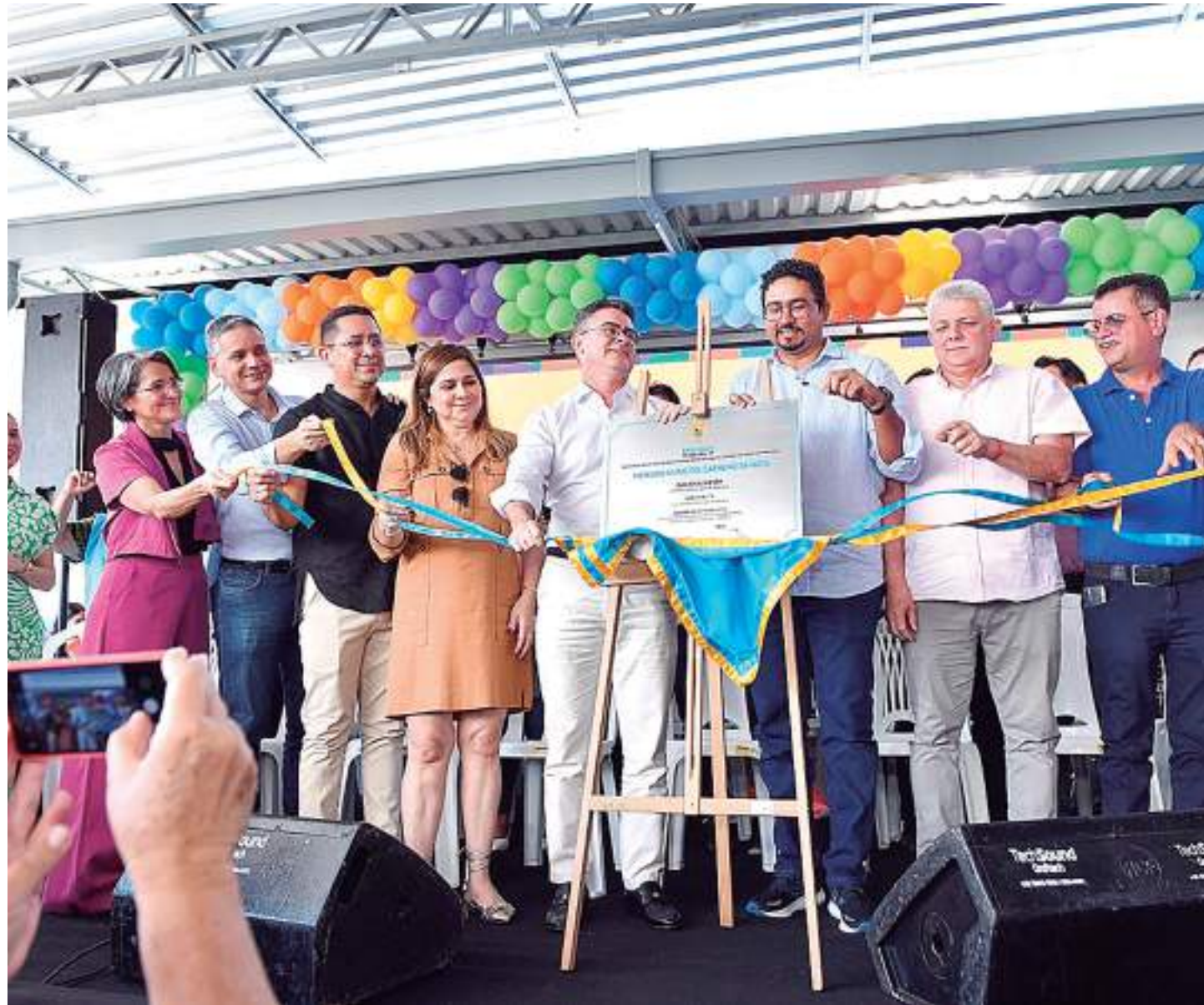
David Almeida entrega o novo mercado Carneiro da Mota, no bairro Morro da Liberdade

trado pela Secretaria Municipal de Agricultura, Abastecimento, Centro e Comércio Informal (Semacc), conta com 33 permissionários que oferecem diversos serviços, como lanches, bazares, estivas, confecções, peixes, carnes, hortifruti, assistência técnica, entre outros, gerando cerca de 80 empregos direta e indiretamente.