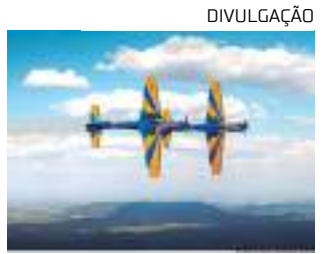
Esquadrilha da Fumaça vai rasgar os céus do complexo turístico

As comemorações em torno do patrono da aviação e inventor do avião 14-Bis envolvem, ainda, em Manaus, cerimônias militares, palestras em escolas, exposições em shoppings e no aeroporto internacional Eduardo Gomes, apresentação da orquestra sinfônica da FAB no Teatro Amazonas, corrida, entre outros.