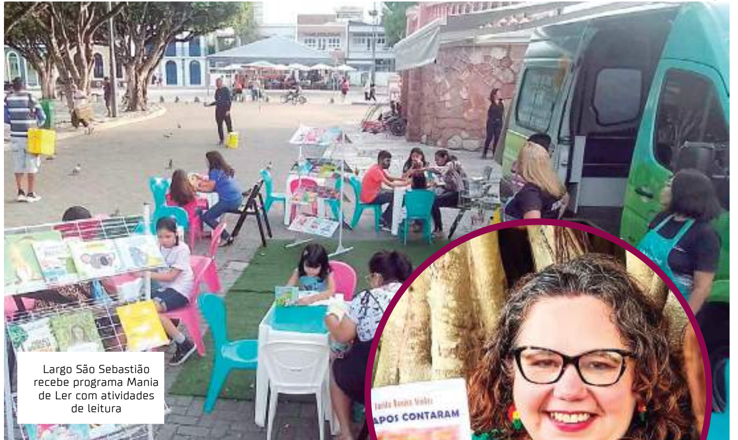
Largo São Sebastião recebe programa Mania de Ler com atividades de leitura

De acordo com o secretário de Cultura do Estado, o Mania de Ler tem feito um papel muito relevante com o incentivo à leitura, que alcança as famílias de todo o estado. “Nesse sentido, trazer esse conteúdo tão rico, que conta nossa história e influi na relação identitária que temos