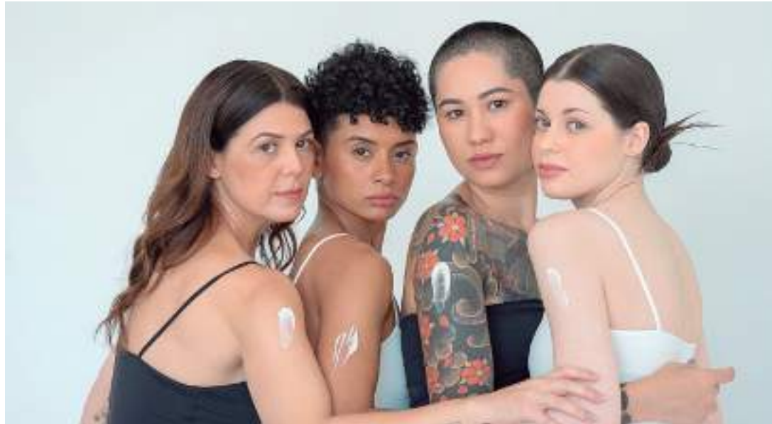
Amakos não prioriza "rejuvenescer", mas fortalecer os elementos que auxiliam a pele

A empreitada nasceu no âmbito do Programa Prioritário de Bioeconomia (PPBio), coordenado pelo Instituto de Conservação e Desenvolvimento Sustentável da Amazônia (Idesam). A estruturação da Amakos possui Laboratório de Pesquisa e Desenvolvimento, além da fábrica própria, garantindo a inovação contínua e o rigor no controle de qualidade, e transparência de informações. A fábrica está localizada no Centro de Incubação e Desenvolvimento Empresarial (CIDE), em Manaus.