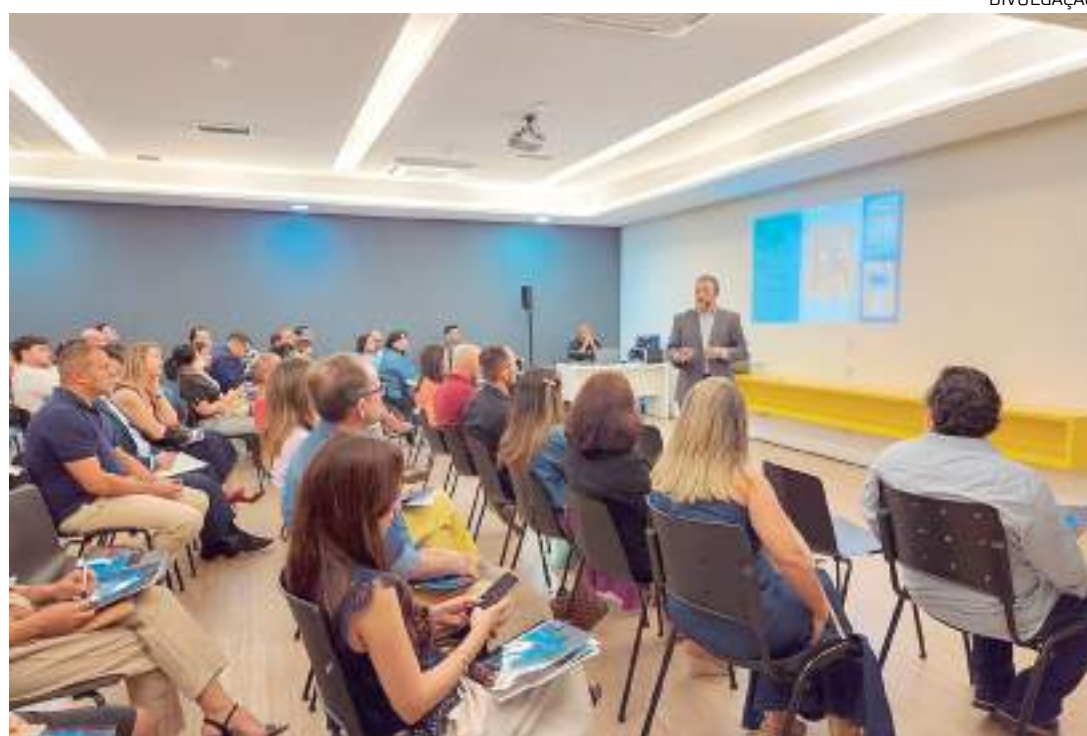
Projeto "Academia de Líderes" busca capacitar líderes para estimular o desempenho

A missão da proposta, segundo o especialista em varejo, é compartilhar todo o conhecimento adquirido ao longo de mais de 25 anos