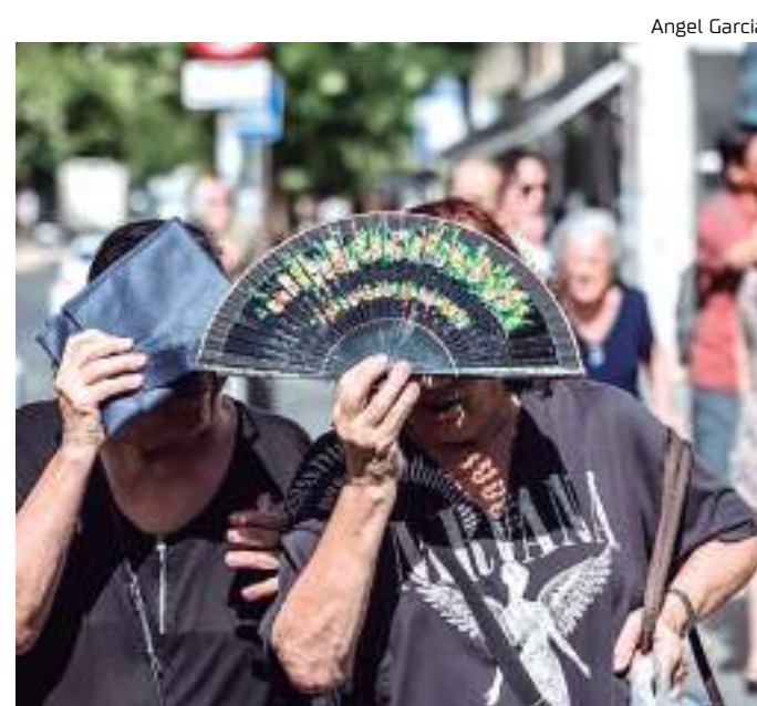
Pessoas se protegem do sol em altas temperaturas, na Espanha

"Não é um recorde para comemorar e não será um recorde por muito tempo, com o verão do hemisfério norte ainda à frente e o El Niño se desenvolvendo", Friederike Otto, professor sênior de ciência do clima no Grantham Institute for Climate Change and the Environment em Reino