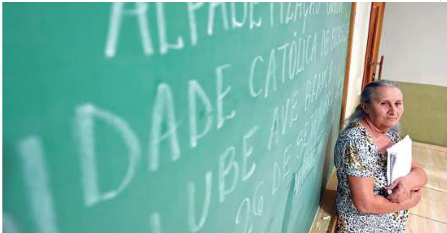
Plano Nacional de Educação pretende erradicar analfabetismo no Brasil até 2024

"Temos que mudar nosso sistema de alfabetização, pois, ainda não levamos de fato, as especificidades do indivíduo e de sua região. A