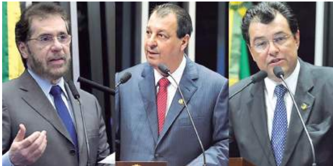
Senadores defendem compromisso com região Amazônica

Com a reforma serão extintos os cinco tributos sobre o consumo que estão vigentes: Imposto sobre Produtos Industrializados (IPI), Programa de Integração Social (PIS), Contribuição para Financiamento da Seguridade Social (Cofins), Imposto sobre Circulação de Mercadorias e Serviços (ICMS) e Imposto sobre Serviços (ISS). No lugar deles serão criados, de acordo com a proposta, dois impostos sobre o valor agregado (IVAs): o Imposto sobre Bens e Serviços (IBS), em substituição ao ICMS e ISS, e a Contribuição sobre Bens e