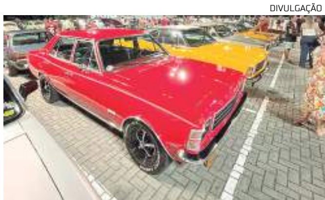
A exposição de carros antigos terá cerca de 200 veículos de modelos variados

Outras opções de lazer do Amazonas Shopping são os restaurantes, as estreias do cinema Kinoplex e os parques Florestinha e Puppy Play.