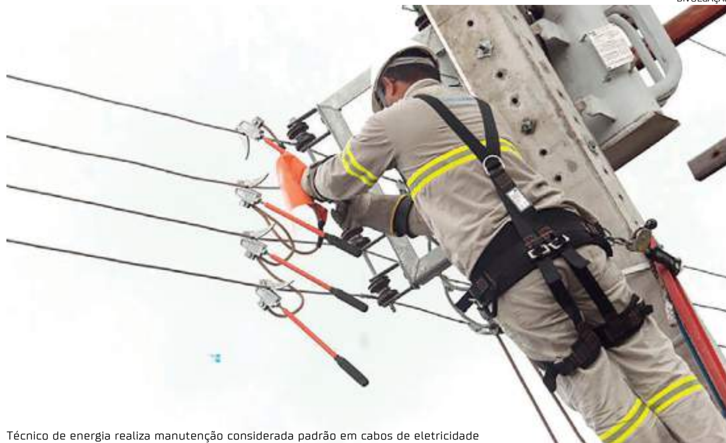
Técnico de energia realiza manutenção considerada padrão em cabos de eletricidade

Além de causar prejuízos materiais, a falta de energia também traz transtornos para quem cuida de pessoas com necessidades especiais, uma dona de casa