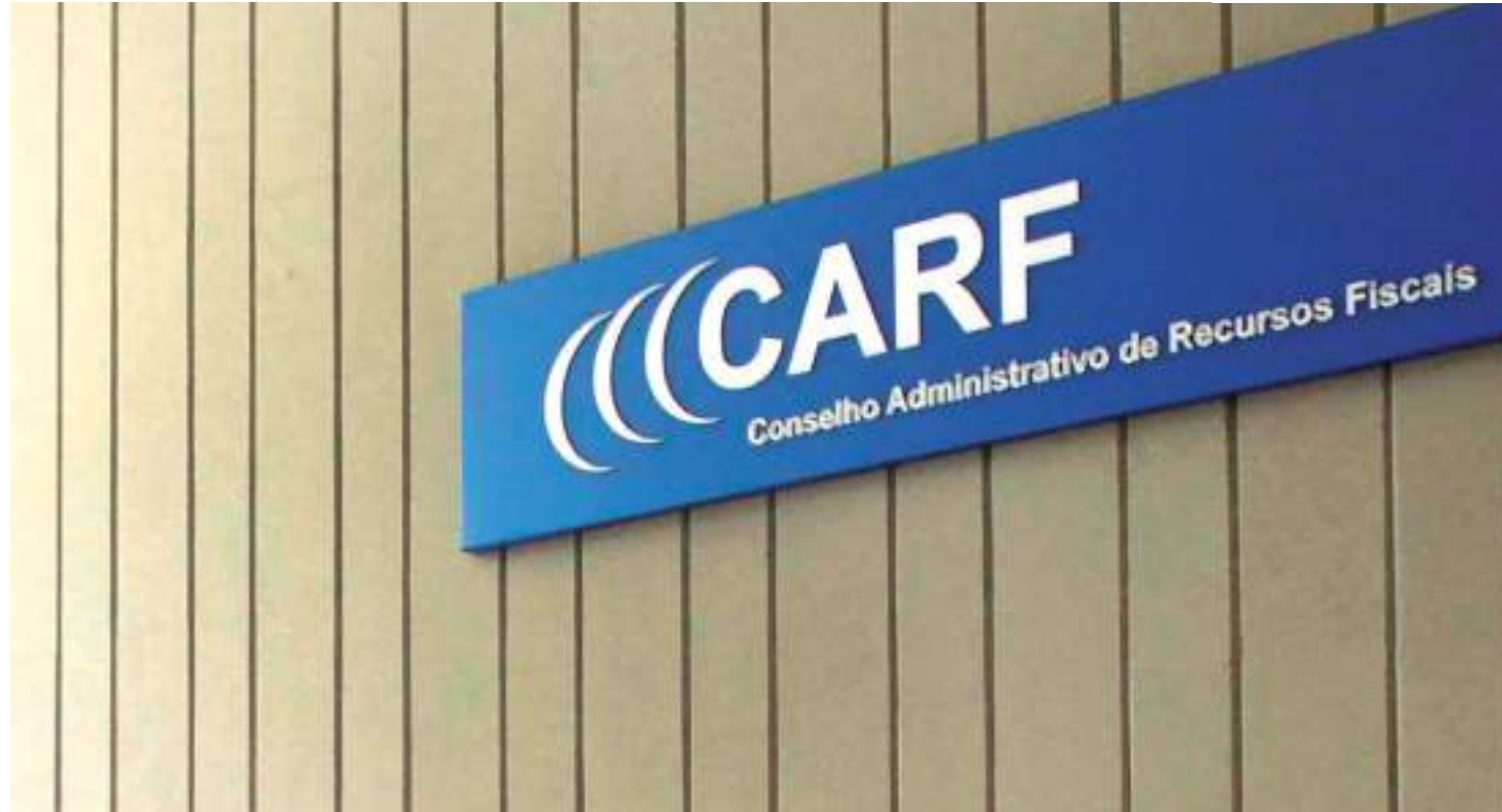
Conselho Administrativo de Recursos Federais é cobijado pelo governo Lula