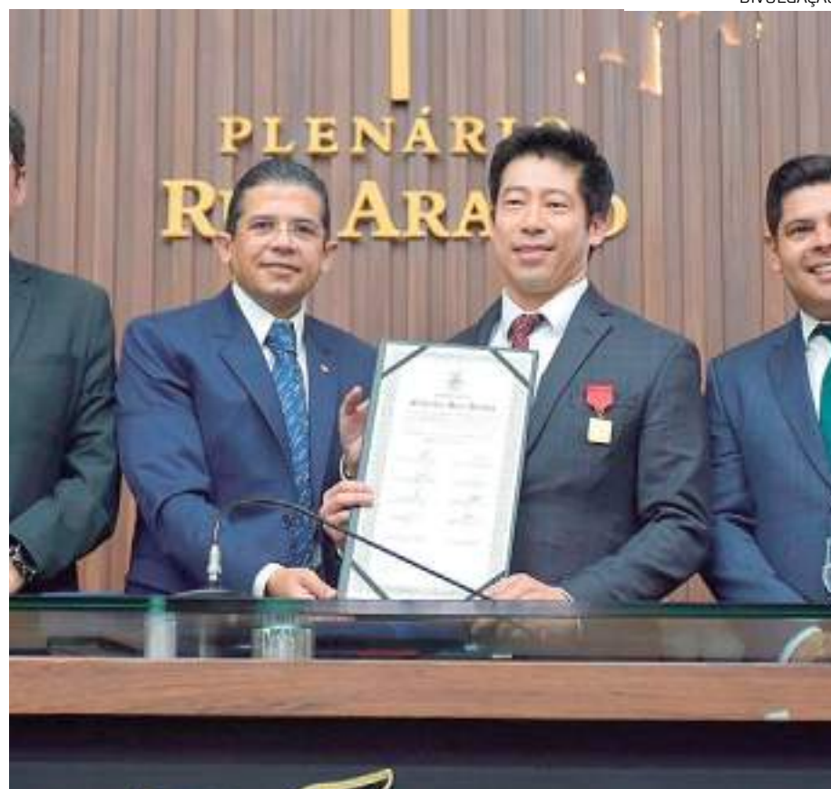
Homenagem foi prestada em tribuna da Assembleia Legislativa do Amazonas