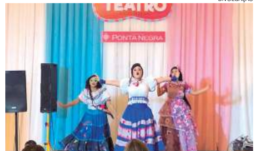
Histórias serão contadas pela companhia de teatro Saltimbancos