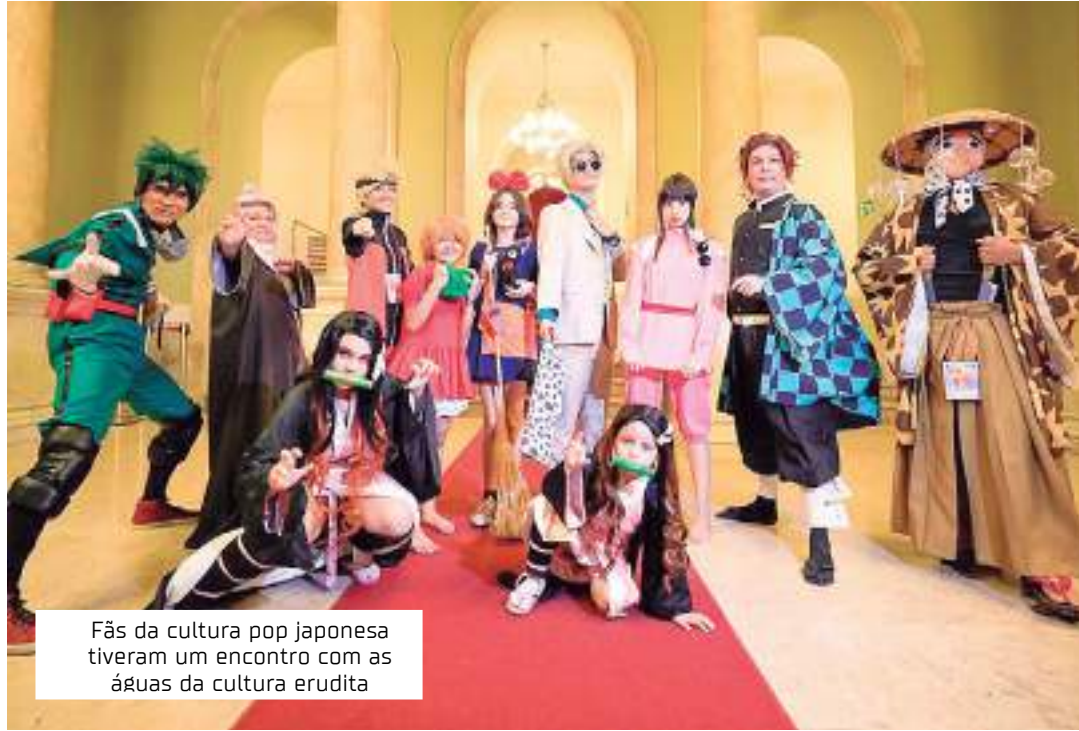
Fãs da cultura pop japonesa tiveram um encontro com as águas da cultura erudita

Átila regeu a Geek Juke Box, responsável por tocar as trilhas sonoras conhecidas dos fãs das animações japonesas. Com uma formação híbrida, meio orquestra e meio banda, a Geek Juke Box cumpriu o papel, levando o público presente, formado em sua maioria por conhe-