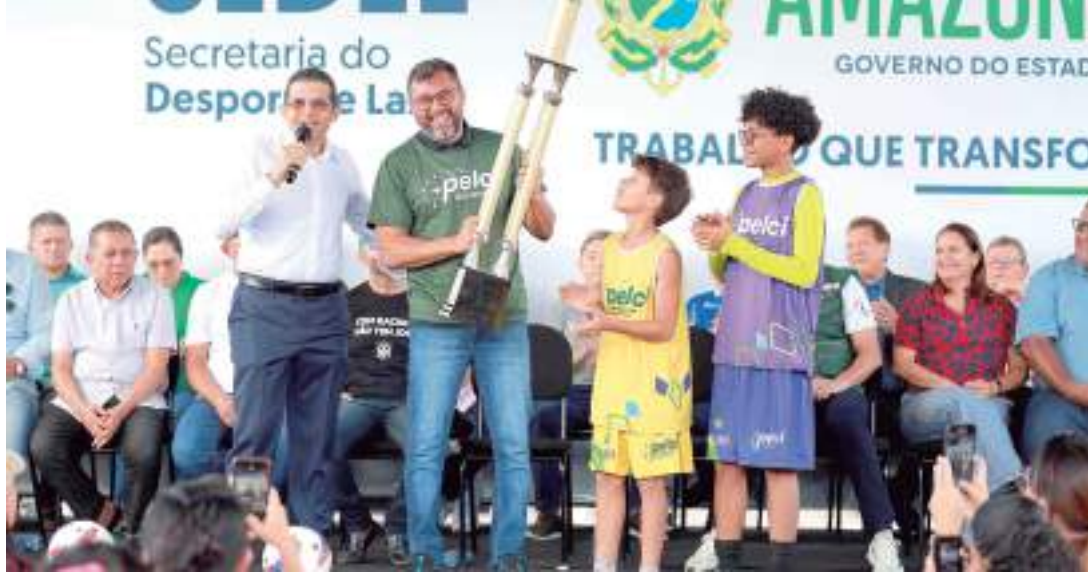
Governador anunciou durante evento, investimento para o futebol amazônico

"Eu faço questão de, no Estado, além de cuidar do alto rendimento, também cuidar dessa molecada. Vim de um município do interior e eu sei o quanto um campo de futebol faz diferença na vida de uma comunidade, não só para as crianças, para os adolescentes, mas também para os pais, as mães, porque esse espaço se torna referência na comunidade. Aqui é assim: o Pelci cuida da criança e o Respi-