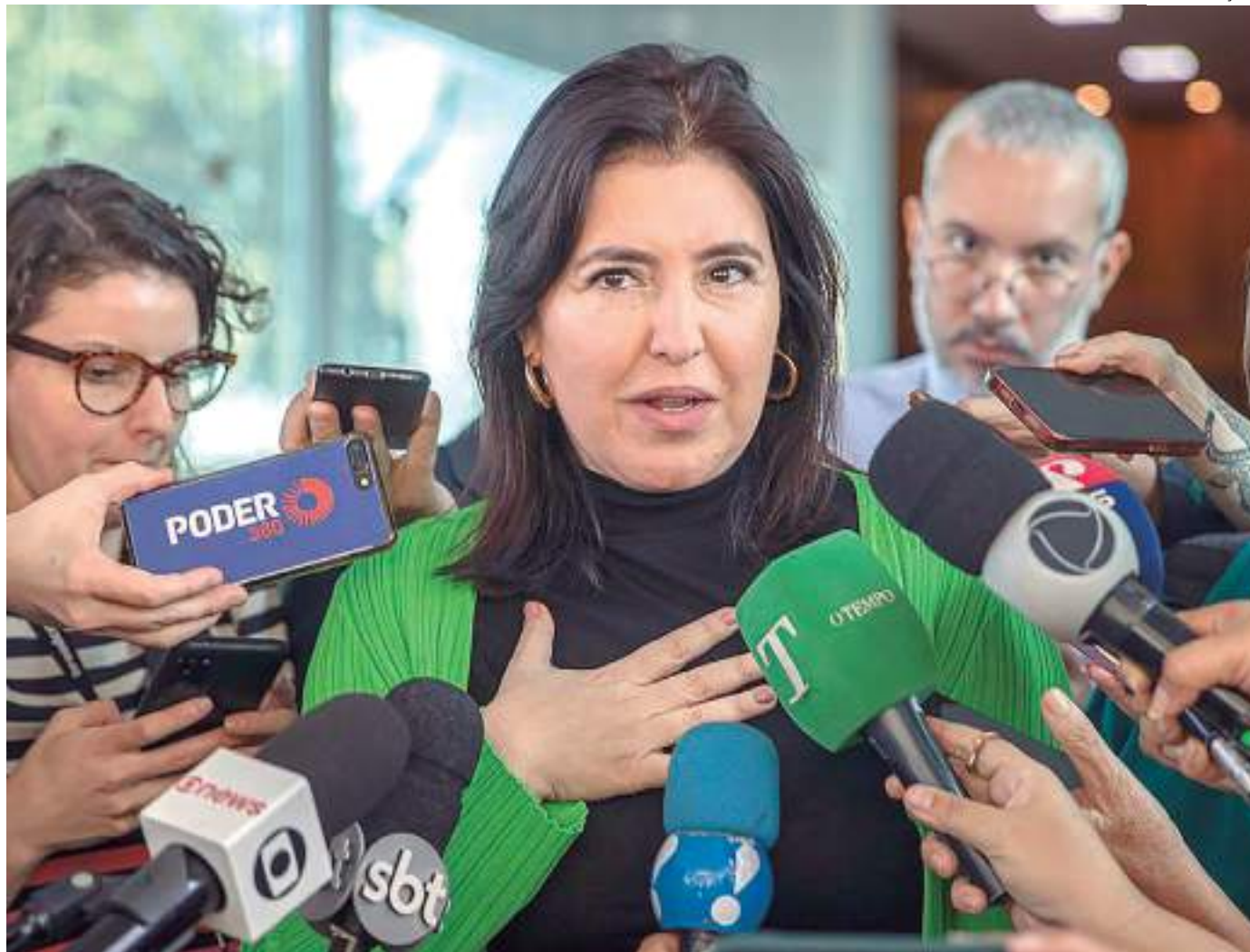
Tebet argumentou que corte foi necessário para não retirar recursos de políticas públicas

Segundo a ministra, o corte foi necessário para não precisar retirar re-