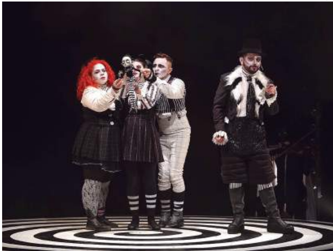
A peça conta a história de cinco crianças insones que enfrentam os medos gerados pelos maus pensamentos