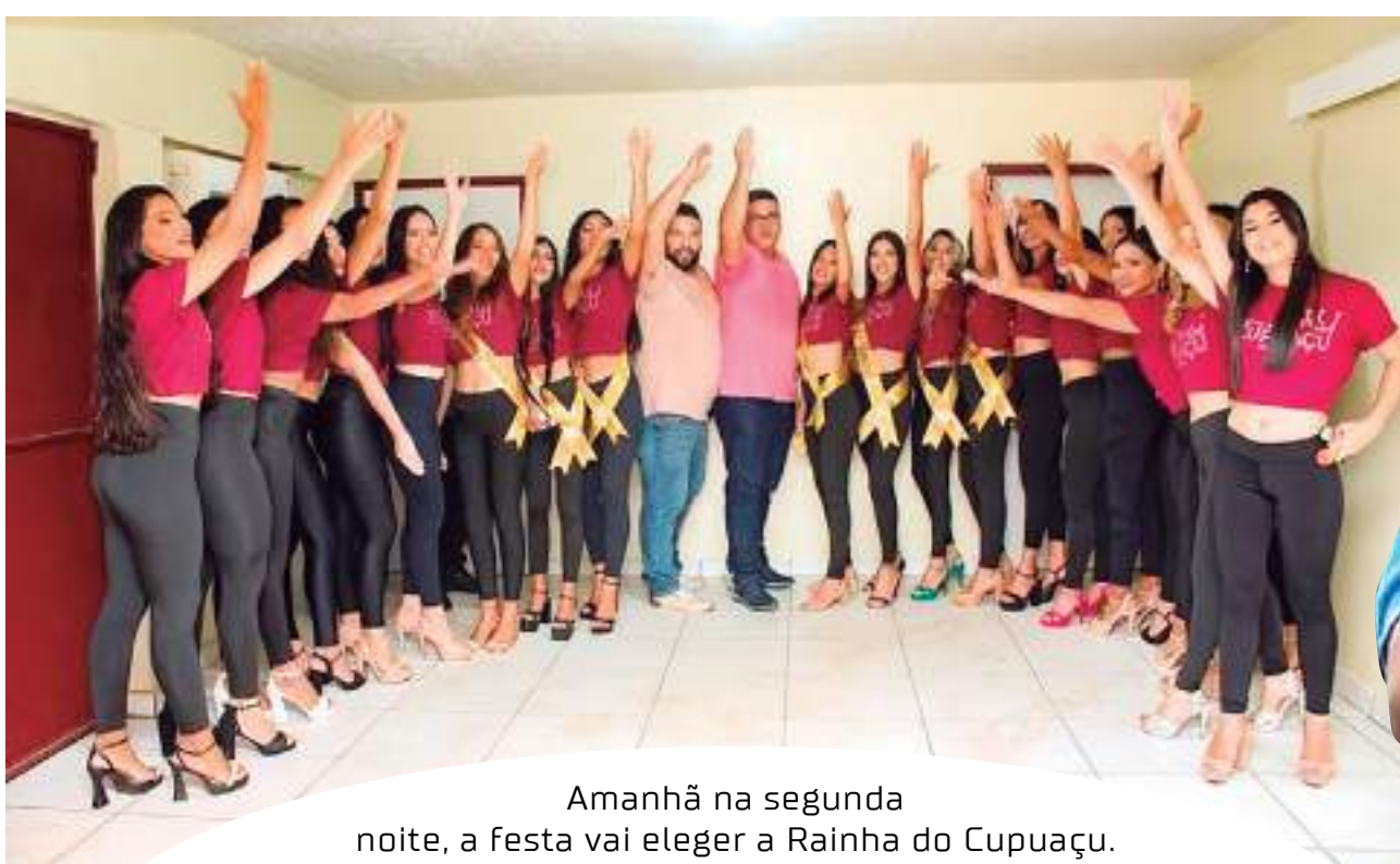
Amanhã na segunda noite, a festa vai eleger a Rainha do Cupuaçu. As candidatas estão empenhadas e esbanjam beleza e simpatia