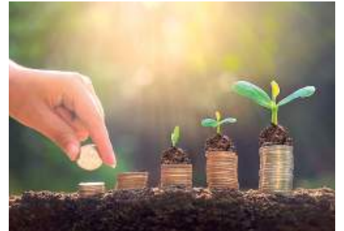
ESG é usado para se referir a práticas ambientais

"ESG é um conjunto de padrões que as empresas conscientes usam para operar, de maneira que protege o meio ambiente, beneficia a socie-