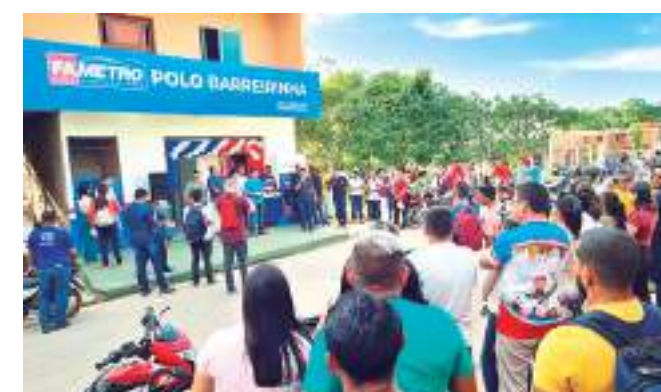
Ao todo são oferecidos 19 cursos de graduação online