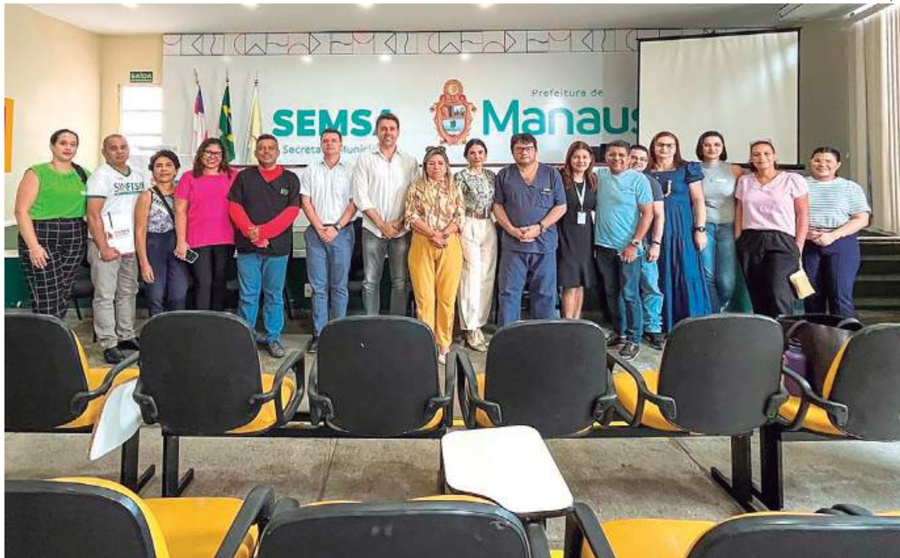
Diversos representantes da área da saúde participaram da reunião da Mesa Municipal de Negociação do Sistema Único de Saúde

Participaram da reunião representantes das direto-