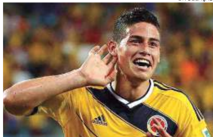
James Rodríguez deve ser anunciado pelo São Paulo nos próximos dias