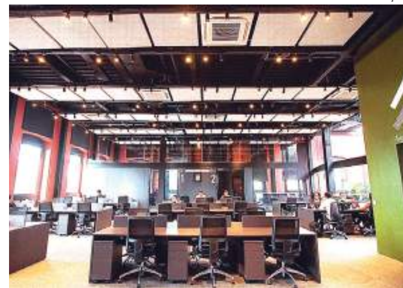
Formação será realizada no Casarão da Inovação Cassina