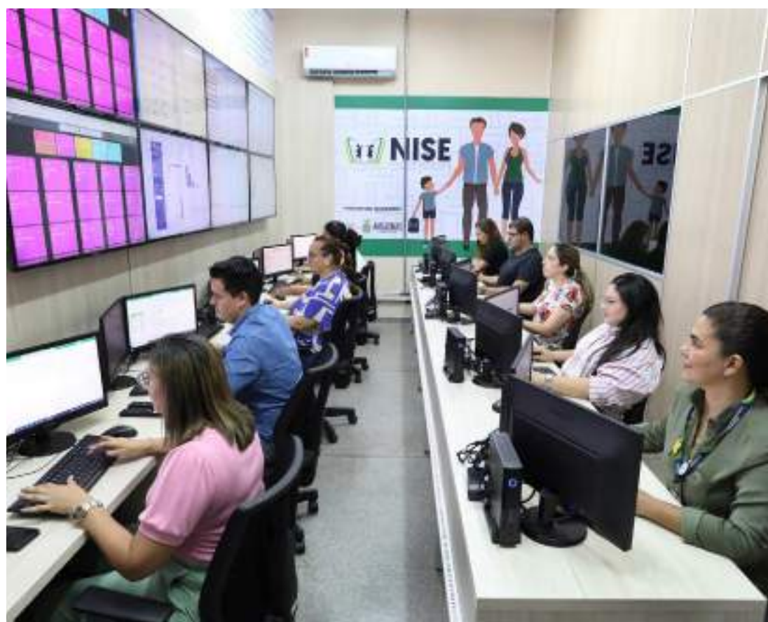
Estelionatários estão se passando por criminosos e cobrando PIX das escolas para impedir falsos ataques

"A pessoa tem que tentar ficar tranquila, procurar se certificar do máximo de detalhes possíveis, não transferir nenhum dinheiro via Pix, comunicar de imediato a polícia e autoridades por meio dos