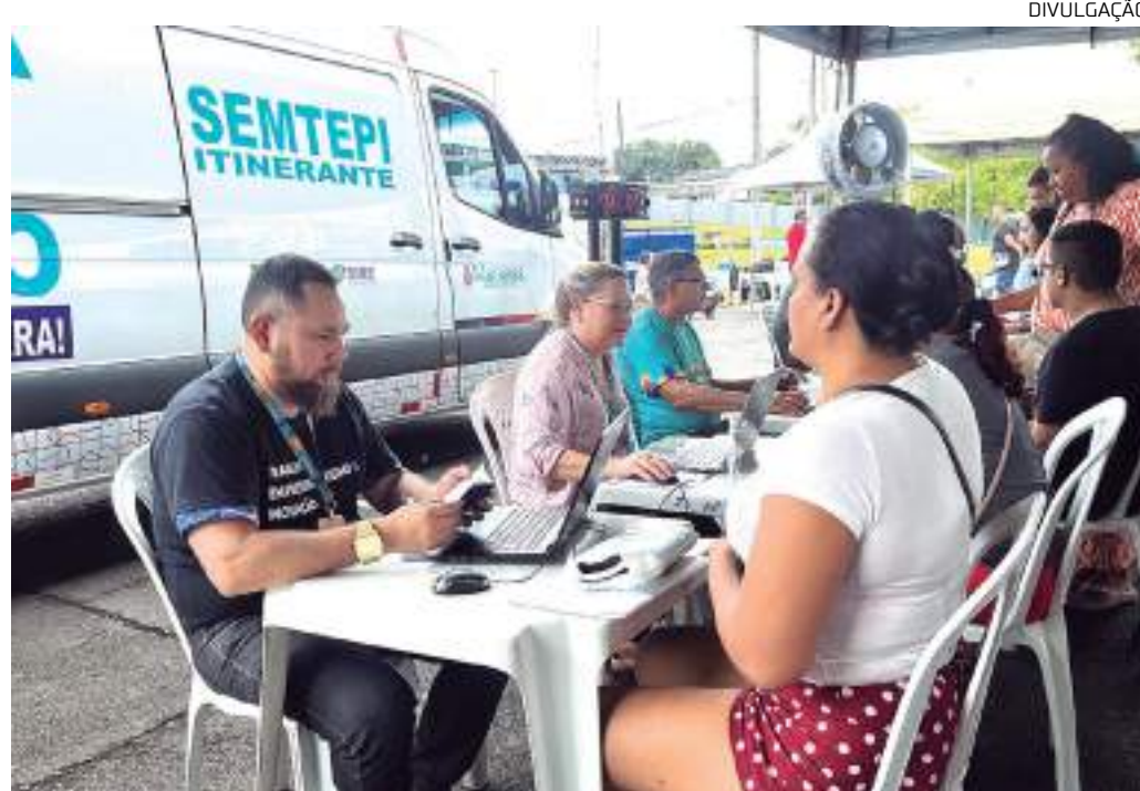
Ação promove diversos serviços como vagas de emprego e cadastro no Sine Manaus

"Acreditamos que essa proximidade com as comunidades nos permitirá identificar necessidades específicas e personalizar ainda mais nossos serviços, tornando-os cada vez mais eficazes e relevantes para a população local. Além disso, o 'Sine nos Bairros' também possibilitará uma maior interação e diálogo com os moradores, fortalecendo os laços entre nossa instituição e a comunidade", ressaltou o diretor do Sine