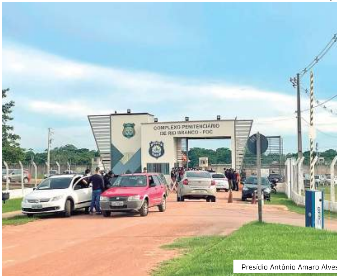
Presídio Antônio Amaro Alves

Ainda segundo o coronel, além do policial penal feito refém e liberado hoje, outro agente foi ferido logo no início da rebelião. Atingido por um tiro de raspão no olho, ele foi atendido em um pronto-socorro e liberado logo em seguida. No fim da tarde de ontem, a Secretaria Nacional de Políticas Penais