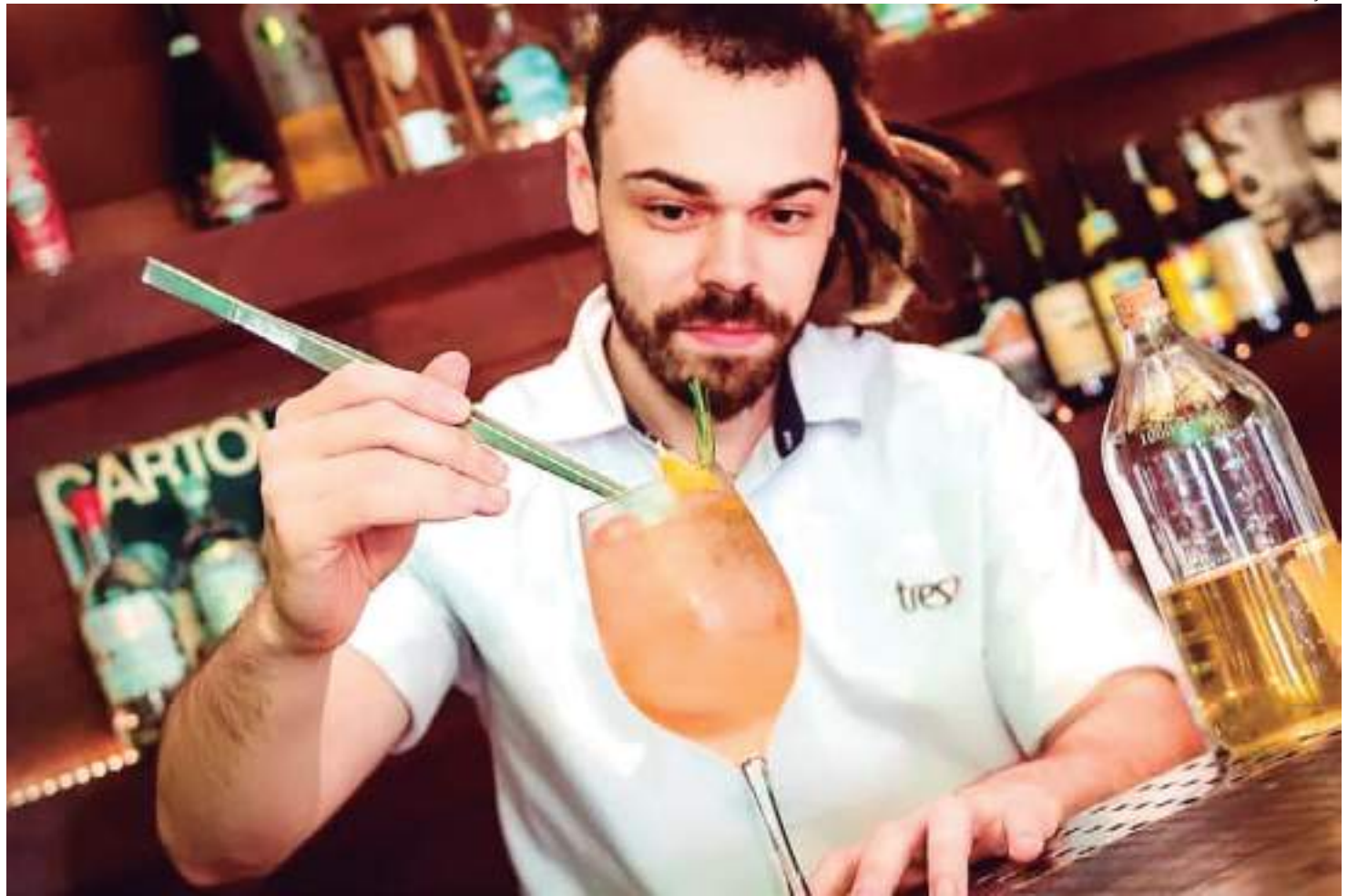
Especialista constrói bebidas usando ingredientes da região amazônica

"Produzimos aqui no Amazonas. Nós substituímos insumos importados por insumos locais