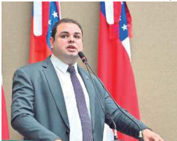
Presidente da Aleam destacou importância da Lei

De acordo com a lei, a Semana Estadual de Conscientização Sobre a Epilepsia deve anteceder o dia 26 de março, Dia Mundial de