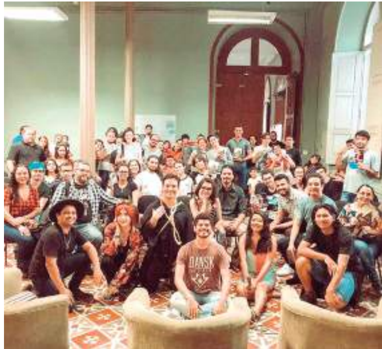
Evento é realizado nos dias 28, 29 e 30 de julho