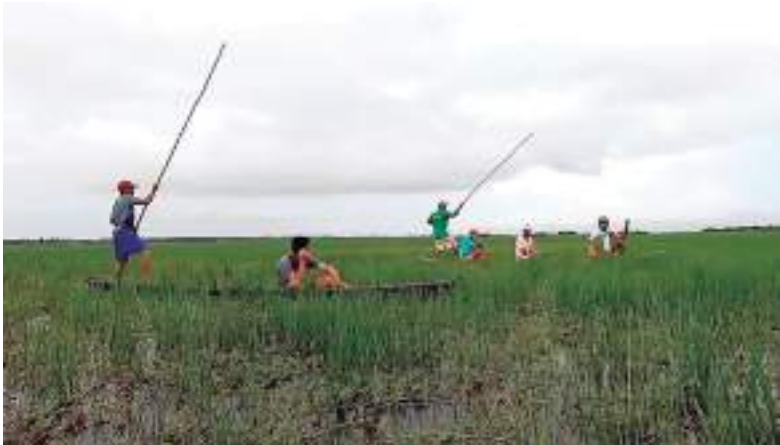
Quilombo no Maranhão.