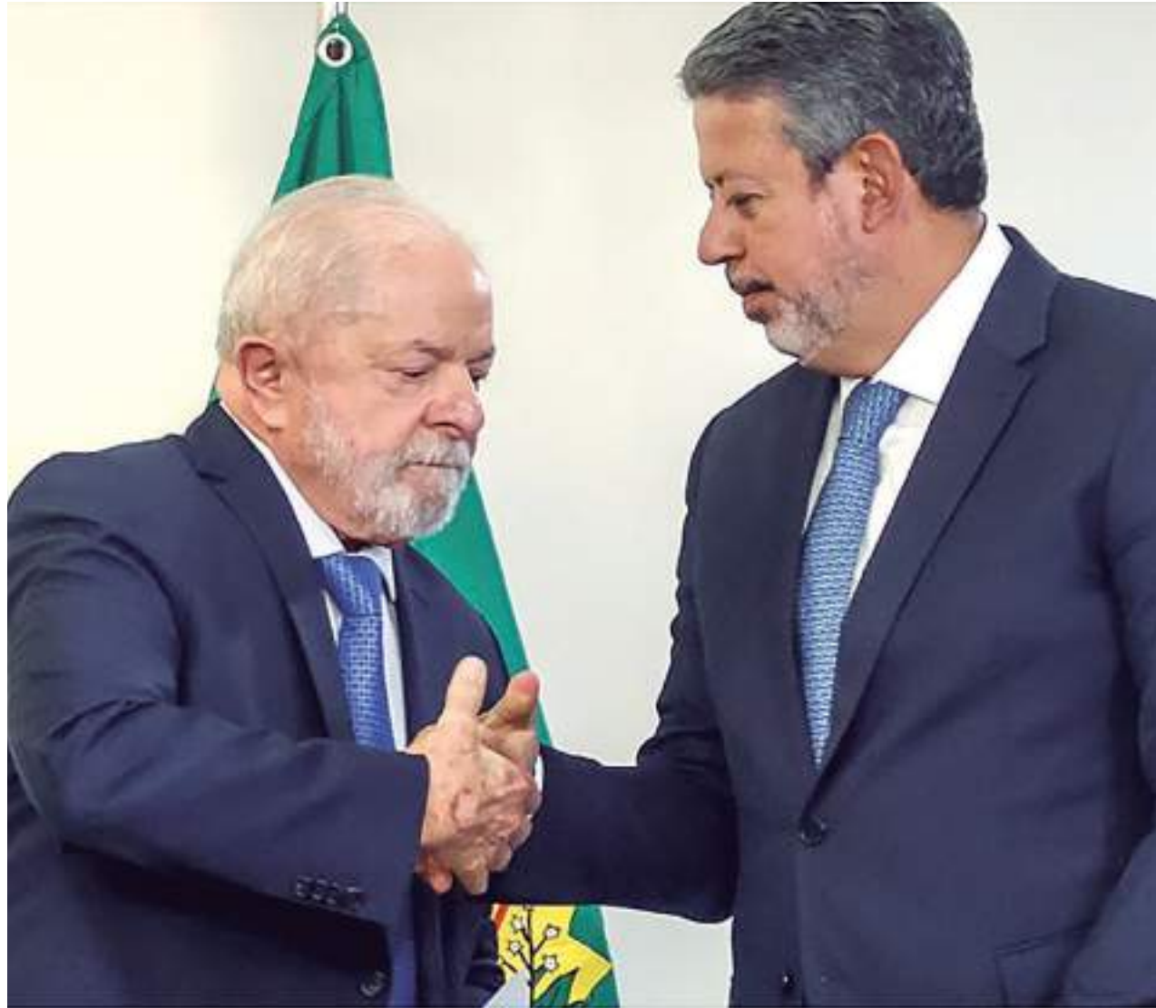
Partido do presidente da Câmara, Arthur Lira, o progressistas deve ter voz decisiva nas trocas ministeriais

Auxiliares do presidente dizem que é comum que o petista se encontre com a cúpula dos partidos antes de selar a entrada de legendas no governo.