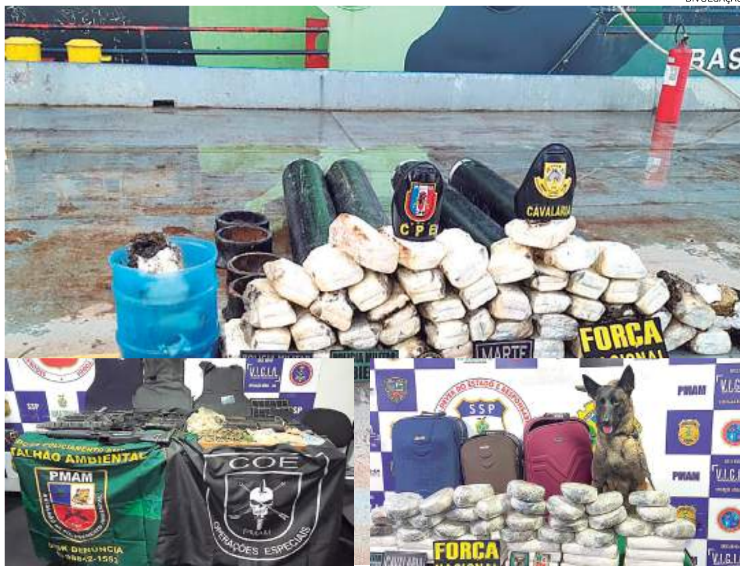
Governo já concluiu mais de 159 quilô

O documento da Base Arpão registra, também, a apreensão de 1,2 tonelada de carne de caça e pescado (R$ 81,1 mil), sete embarcações (R$ 7,6 milhões), 14