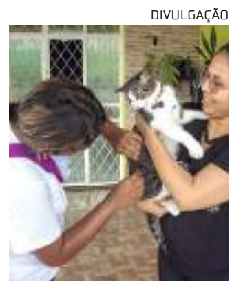
Programação vai até dia 25 de agosto

A estimativa do CCZ é que 2.000 animais, entre cães e gatos, sejam vacinados. Como critérios para receber a vacinação, uma tarefa que deve ser feita anualmente, o animal precisa estar em boas condições de saúde e ter, ao menos, três meses de idade.