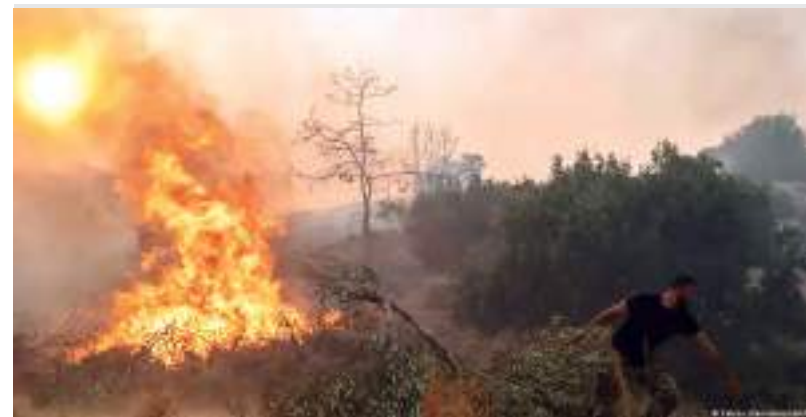
Ilha de Rodas, na Grécia: Destino turístico sofre com incêndios florestais.