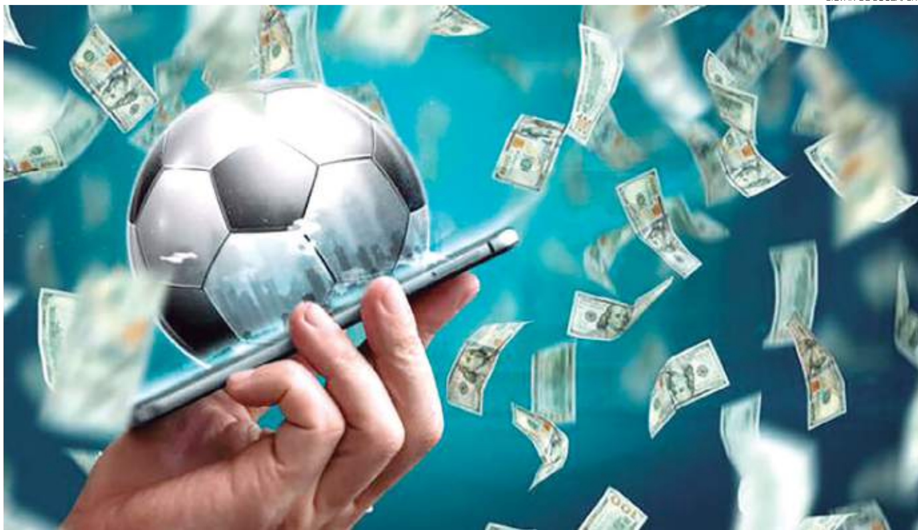
Justiça arrolou 14 pessoas por suspeita de envolvimento na manipulação de jogos do futebol brasileiro

Todos os investigados responderão aos artigos 198 e 199 da nova Lei Geral do Esporte, com penas variando de multas a até 12 anos de reclusão. A justiça estabeleceu 10 dias para que os réus respondam ao processo com provas e testemunhas.