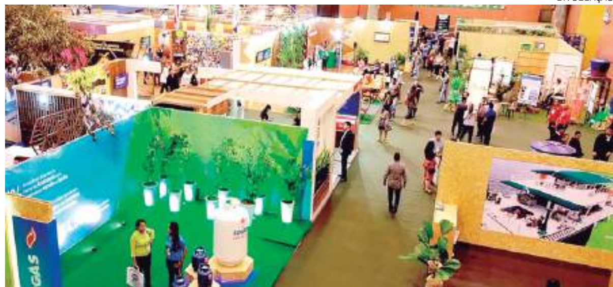
Primeira edição da Feira de Sustentabilidade do Polo Industrial de Manaus