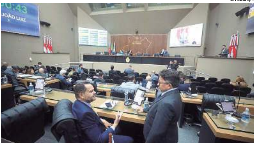
Aleam analisa proposta, mas desfecho deve ser positivo para aprovação do PL

Voltado a estudantes dos ensinos fundamental e médio, a proposta pretende incentivar a capacitação de professores, por meio de cur-