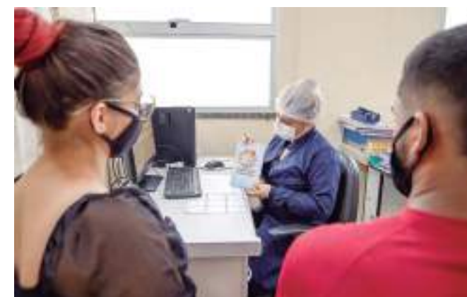
Participação dos homens fortalece vínculos com a família

O envolvimento dos homens na gravidez, além de fortalecer os vínculos com a família, é uma ação que também pretende reduzir o distanciamento entre o público masculino e as unidades de saúde, trabalhando autocuidado e necessidade de criar uma dinâmica saudável na família.