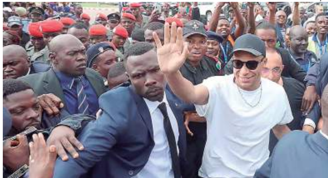
Mbappé foi ovacionado em Camarões, onde realizará ações beneficentes