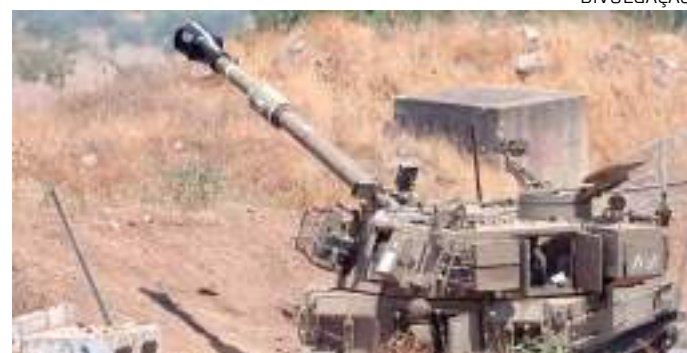
Um veículo de artilharia do exército israelense na fronteira de Israel com o Líbano

Testemunhas da Reuters viram nuvens de fumaça branca subindo do sul montanhoso. Um morador de Wazzani, o vilarejo no sul do Líbano onde um dos foguetes caiu, disse que fogo de artilharia atingiu o