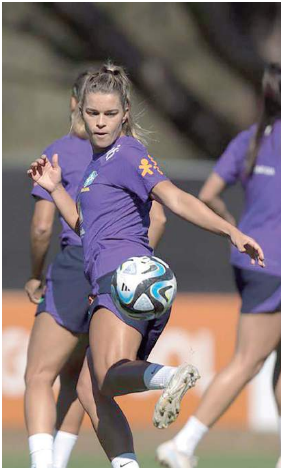
Seleção treinou nas instalações de hotel na Gold Coast

O Brasil realizou a primeira atividade com bola na Gold Coast como parte da preparação para a Copa do Mundo de futebol feminino, que será disputada a partir de 20 de julho na Austrália e na Nova Zelândia. Nesta quinta-feira, a partir das 11h (horário local), a seleção comandada por Pia Sundhage treinou no campo do Resort Royal Pines.