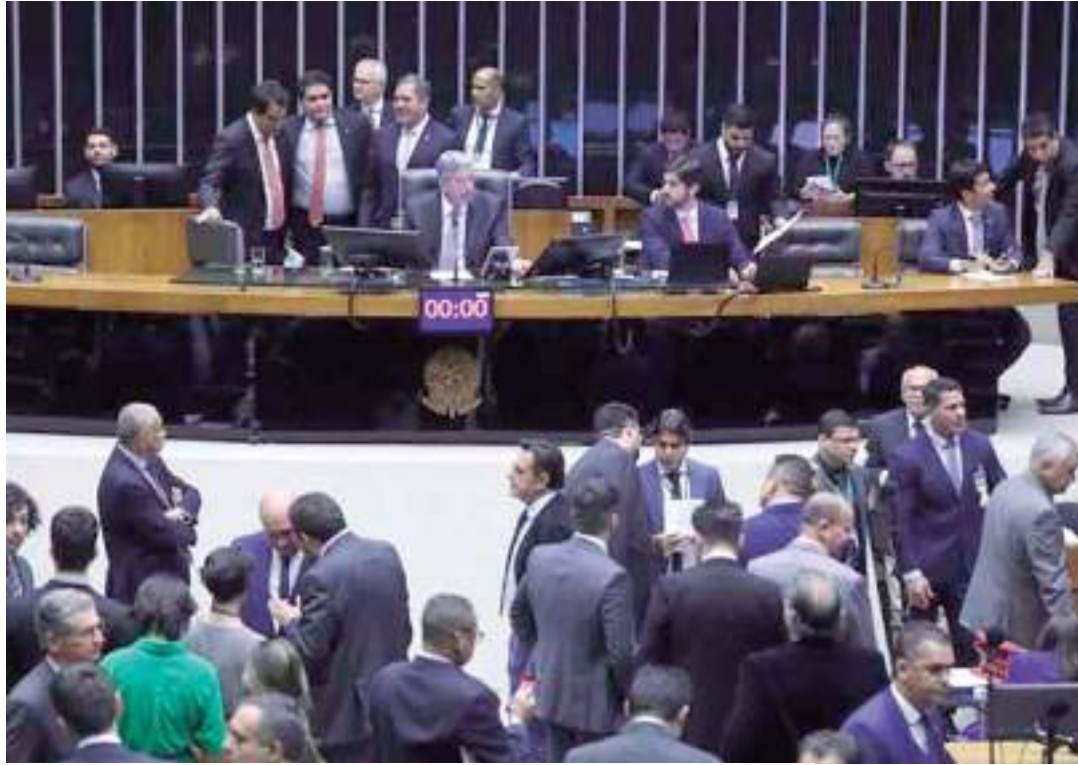
O plenário da Câmara dos Deputados durante sessão

Para atender demanda governadores do Sul e Sudeste, o