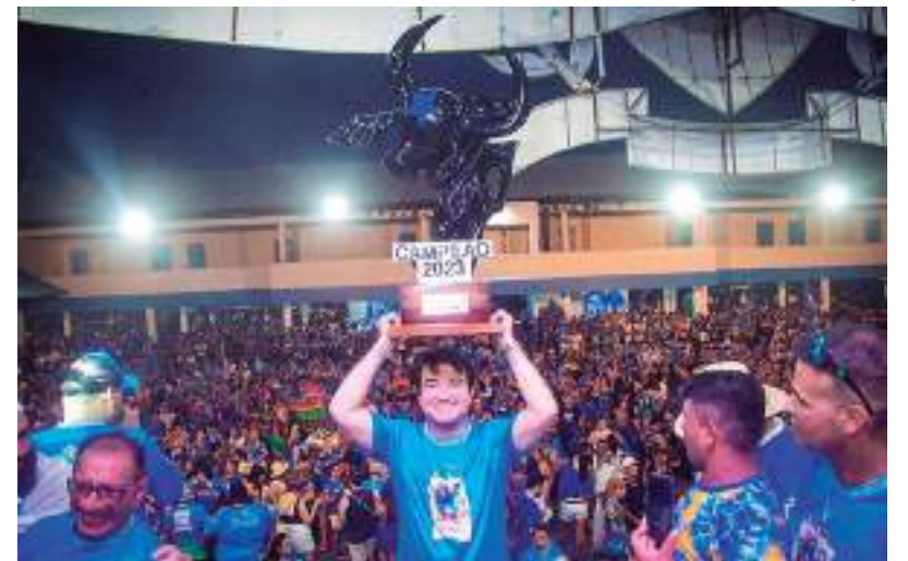
Bicampeão do 56º Festival de Parintins promete uma grande celebração