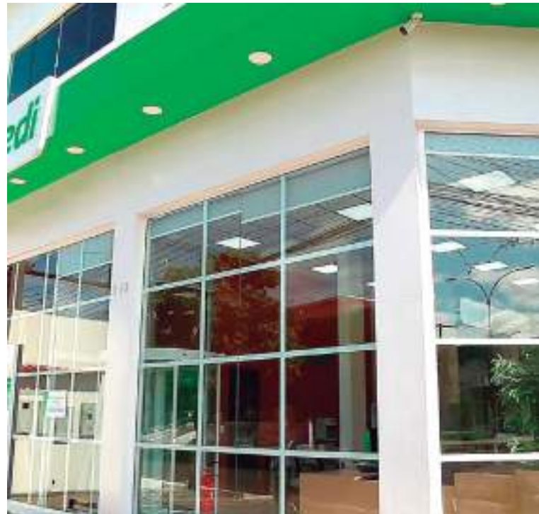
Nova agência Sicredi possui design moderno e acolhedor