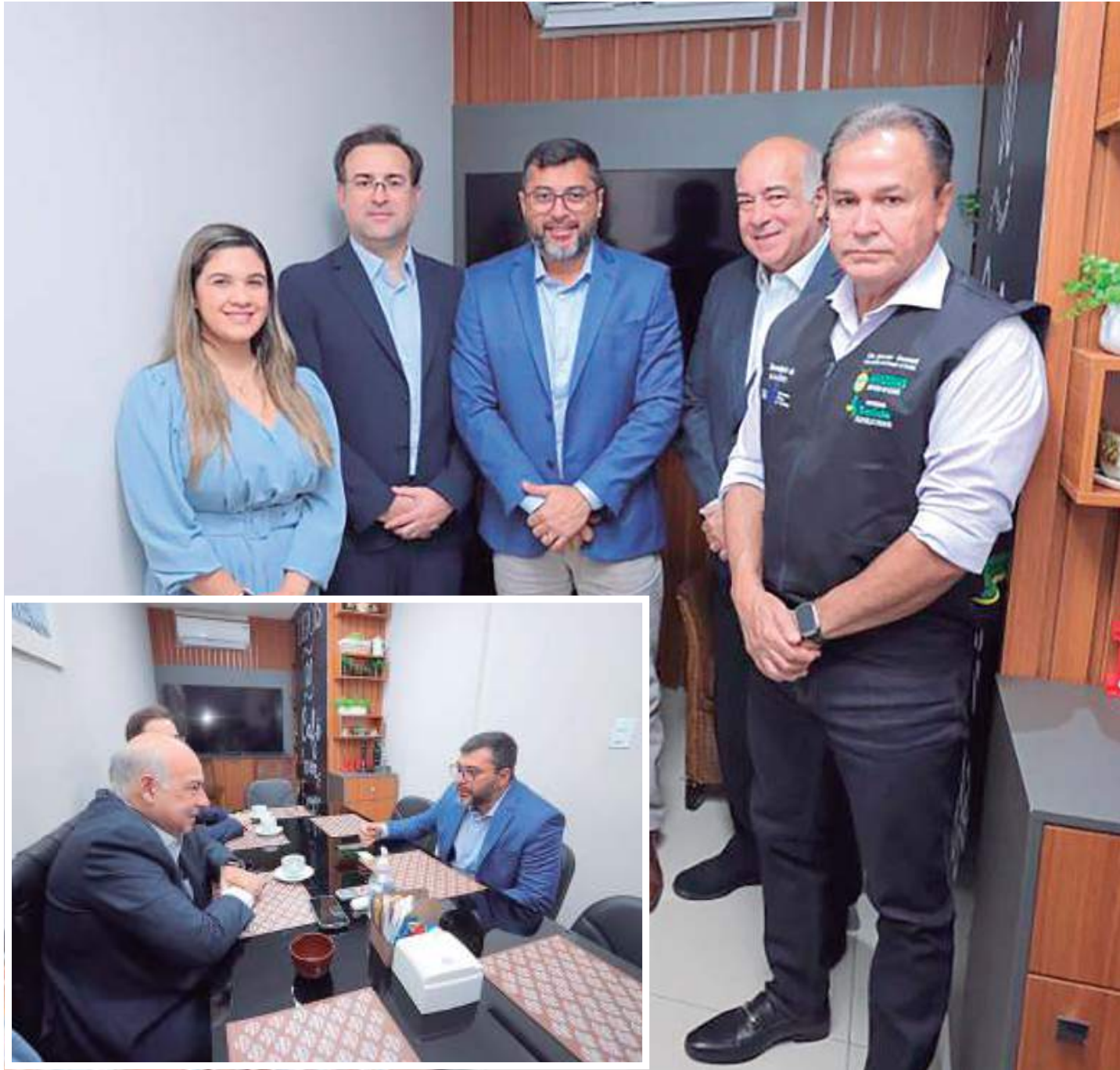
Governador Wilson Lima com liderança com a Sociedade Beneficente Israelita Brasileira Hospital Albert Einstein

Estarão no foco das pesquisas as doenças tropicais e mortalidade materna, além de priorizar a adaptação de infraestrutura para regiões isoladas, como alternativas