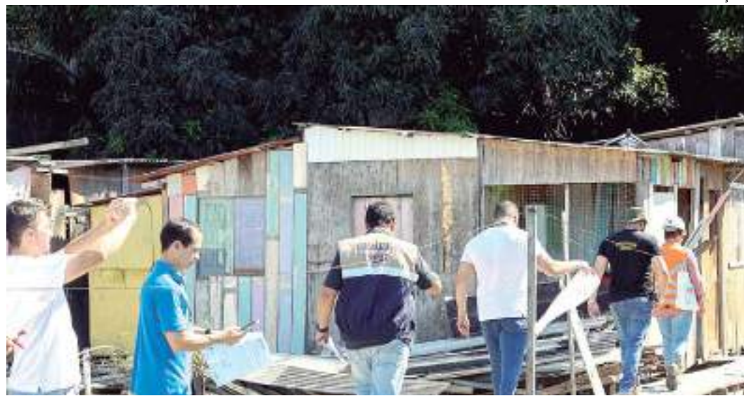
Construções ocorreram após o cadastro realizado pelo programa em 2020

Conforme explica o secretário da Sedurb, engenheiro civil Marcellus Campêlo, as construções irregulares foram erguidas após o cadastro realizado pelo programa, em 2020, e por isso não são elegíveis para serem contempladas. "A área também foi desapropriada para fins de interesse social pelo decreto nº 45.115 de janeiro de 2022 e as famílias que habitavam o local há mais de uma década estão sendo reassentadas para que o programa possa iniciar as