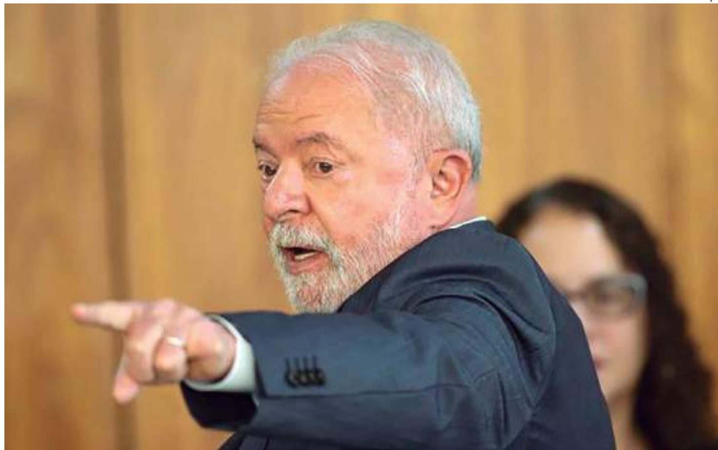
Valores fazem parte de esforço de Lula para aprovar reforma tributária na Câmara Federal

Do valor total liberado, R$ 5,25 bilhões foram só para emendas individuais de transferência especial. Batizada de "emenda Pix", a modalidade dificulta o