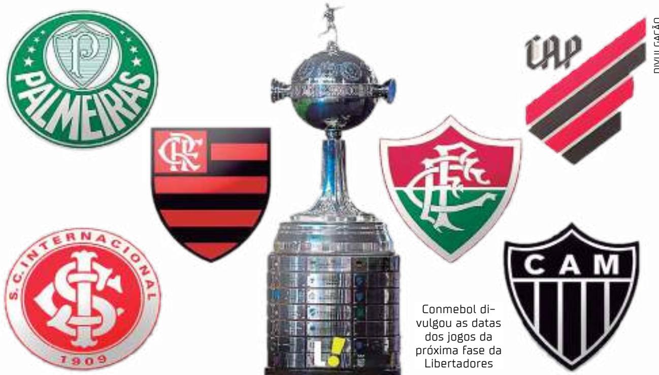
Conmebol divulgou as datas dos jogos da próxima fase da Libertadores

A única indefinição é em relação ao local do duelo de ida entre Argentinos Juniors e Fluminense. Segundo a divulgação da Conmebol, estádio e cidade constam como "a definir".