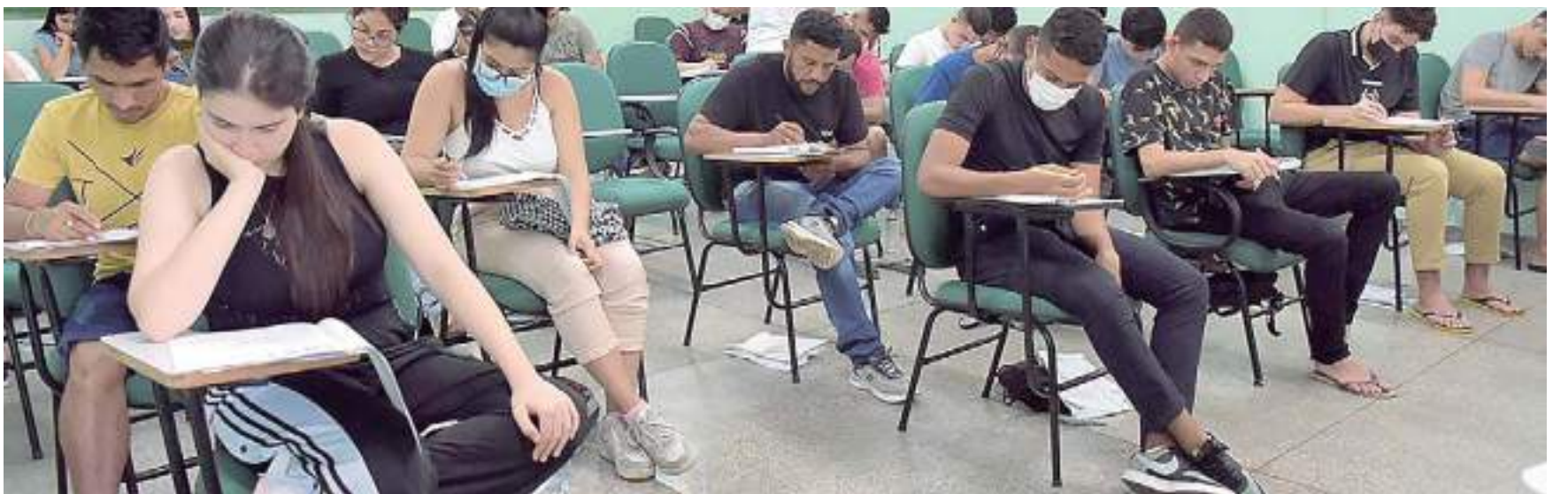
São 5.411 vagas, sendo 3.262 para o Vestibular e 2.149 vagas para o SIS

Serão 106 cursos ofertados em 32 municípios, entre capital e interior. No total, 3.262 vagas são para o Ves-