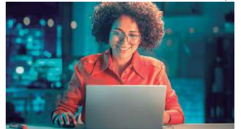
Setor de Tecnologia da Informação ainda sofre com a falta de profissionais