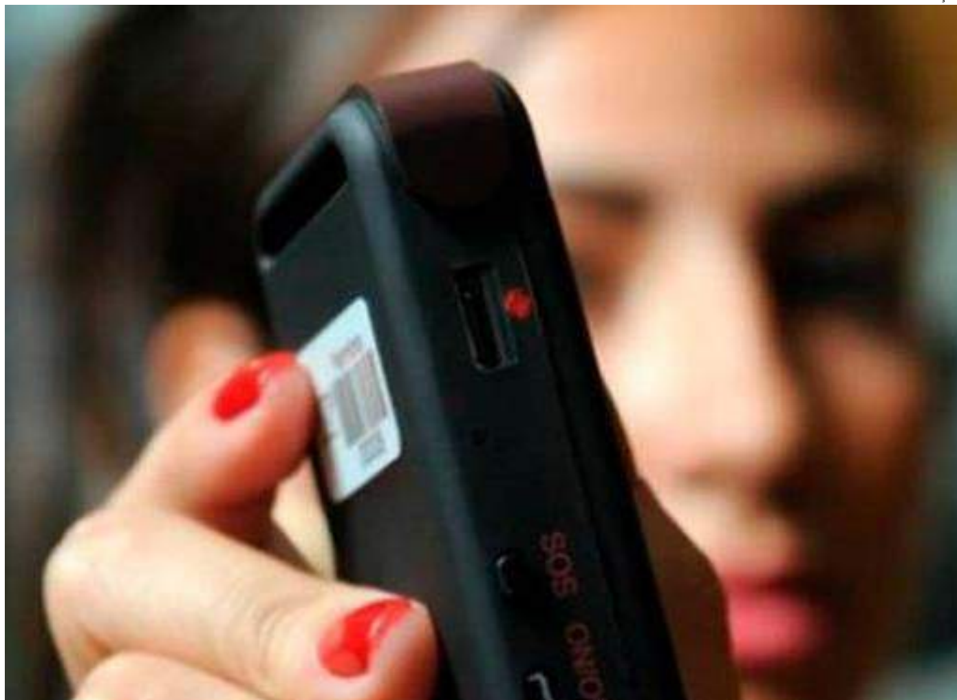
Projeto agora segue para a sanção do prefeito de Manaus, David Almeida

Com a sanção do prefeito, linhas de ônibus da capital devem ter dispositivo integrado às polícias e permitirá imediato acionamento nos casos de abordagens de criminosos.