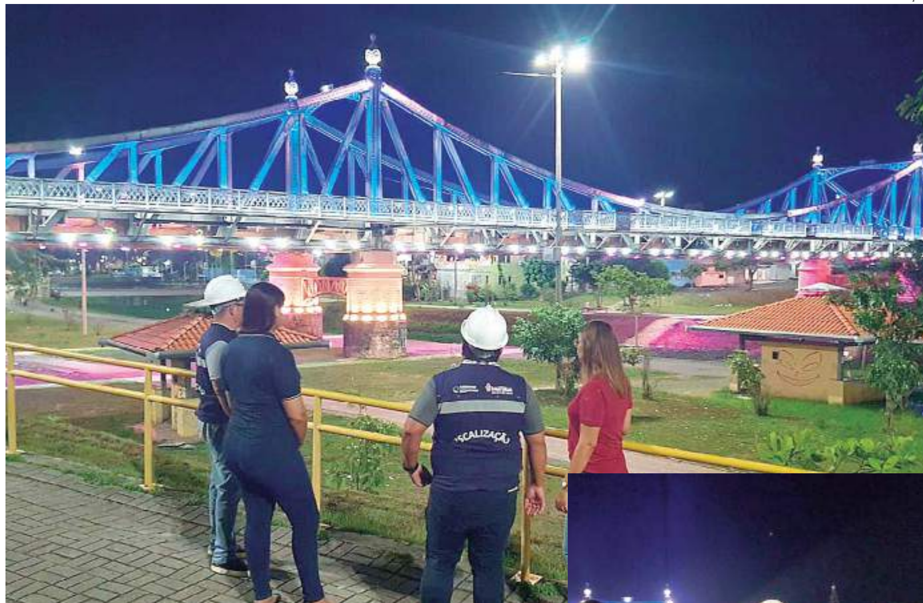
Fiscalização ocorreu na nova iluminação da Ponte 7 de Setembro

Durante a vistoria, a equipe da Controladoria conheceu o funcionamento do sistema implantado e vistoriou o cronograma de execução do serviço, o qual foi iniciado no final de 2022 e concluído no começo de 2023, no entanto, a localidade vem