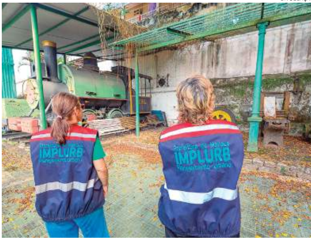
Implurb apresenta projetos para requalificação e revitalização do Museu

"E para observar qual escala do imóvel, textura, realidade do material dos objetos, é só ver a arquitetura e estar no ambiente, de forma atenta, desde paredes, estrutura da cobertura, telhas, os materiais de uma engenharia mecânica da época. Tudo isso nos traz essa percepção e reflexão ampliada com as buscas documentais. O levantamento é extremamente importante para decodificar a representação gráfica do estado atual, de um museu que está há mais de 15 anos fechado, mas cuja memória afetiva da maioria das pessoas é de ser um museu