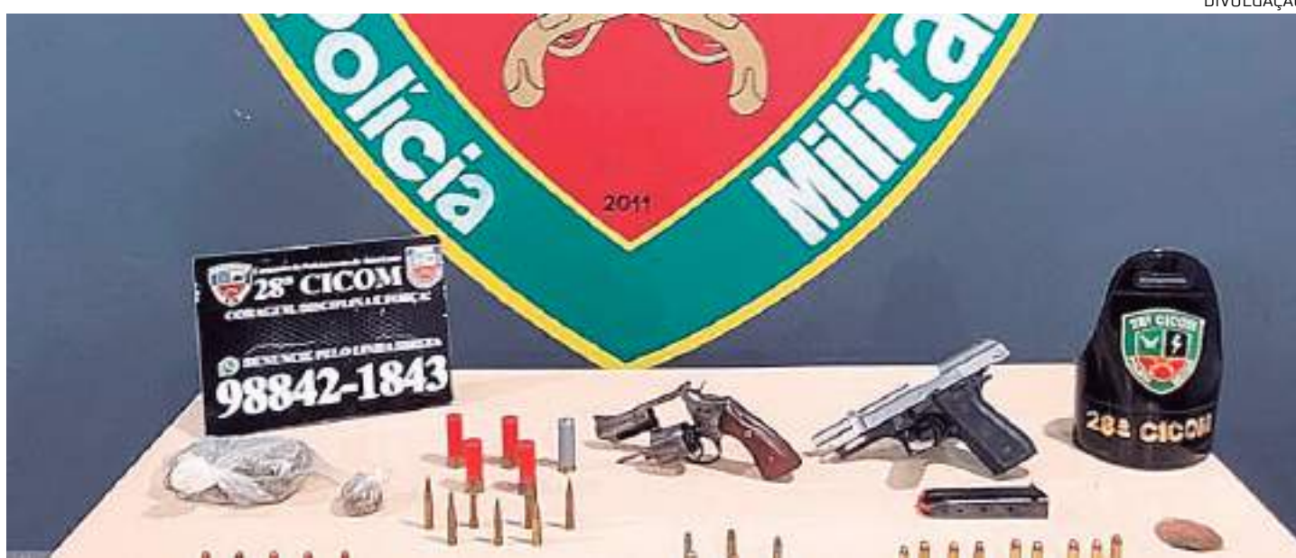
Armas, munições, dinheiro e drogas também foram tirados de circulação durante as ações

Ao todo, as equipes policiais tiraram de circulação 15 armas de fogo, 142 munições, R$ 480 em espécie e cerca de 5 quilos de entorpecentes. A maioria das prisões foi efetuada por suspeita dos presos terem envolvimento em crimes de porte ilegal de arma de fogo, roubo e tráfico