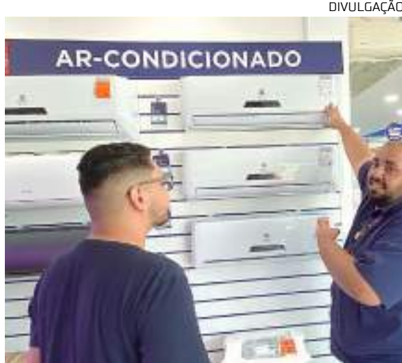
Info Store espera aumentar em 100% as vendas no segmento

A Info Store atua há 25 anos no setor de tecnologia e está presente em Manaus/AM, com 11 lojas, e em Boa Vista/RR, com uma unidade. O Grupo mantém, ainda, outras marcas, como AMZ Tech, direcionada para a área do atacado, e as franquias da Samsung e Motorola.