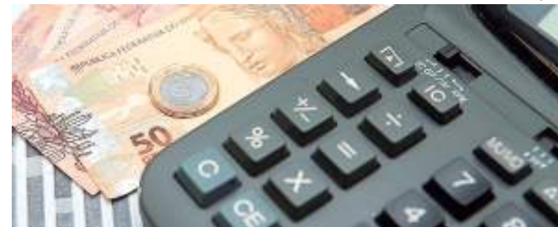
Projeção continua acima da meta de inflação para este ano