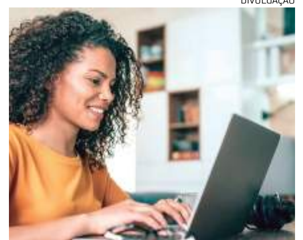
Capacitação garante uma certificação extra no currículo

Na plataforma também é possível encontrar uma série de capacitações para a área de Tecnologia, todas oferecidas em parceria com a CISCO, uma das empresas tecnológicas mais importantes do mundo. Todos os cursos são independentes, sem ordem específica nem quantidade limite por pessoa e estão disponíveis em espanhol e português.