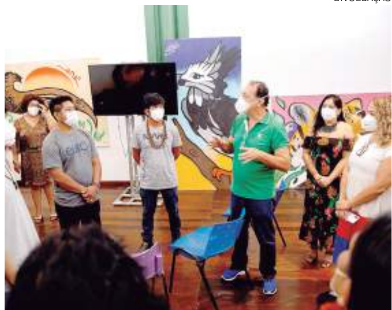
FAS reúne lideranças indígenas e comunidades tradicionais da Amazônia Legal