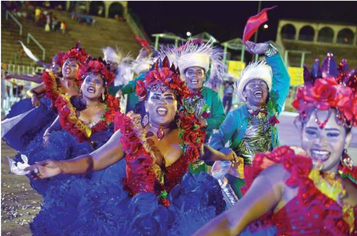
A abertura será no dia 14 de julho, a partir das 20h, no Centro Cultural Povos da Amazônia

"São dezenas de danças folclóricas, além do boi-bumbá que representam muito da identidade cultural do Amazonas. O festival traz manifestações artísticas com o pertencimento de uma comunidade, de um grupo social, uma escola e, assim, as gerações atuais dão continuidade a uma história, que se iniciou anos atrás e perdura até hoje, envolvendo o coletivo em torno da cultura e do folclore", disse o secretário.