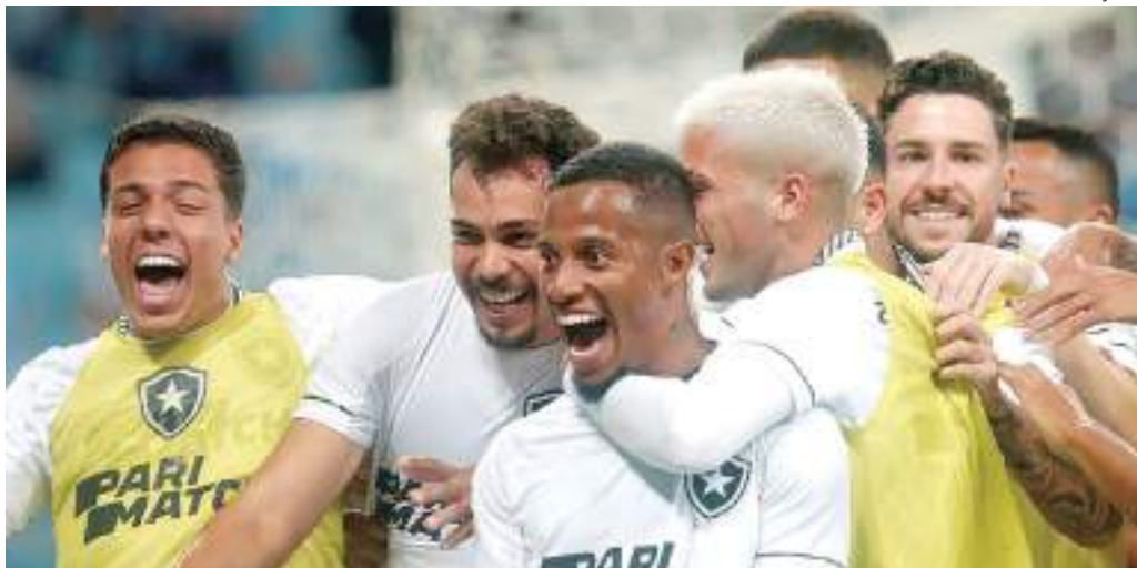
Alvinegro carioca está embalado na busca do título do Campeonato Brasileiro