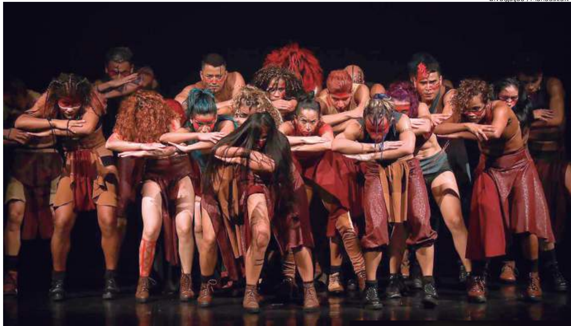
II Encontro de Profissionais de Dança do Amazonas tem abertura no Teatro Amazonas