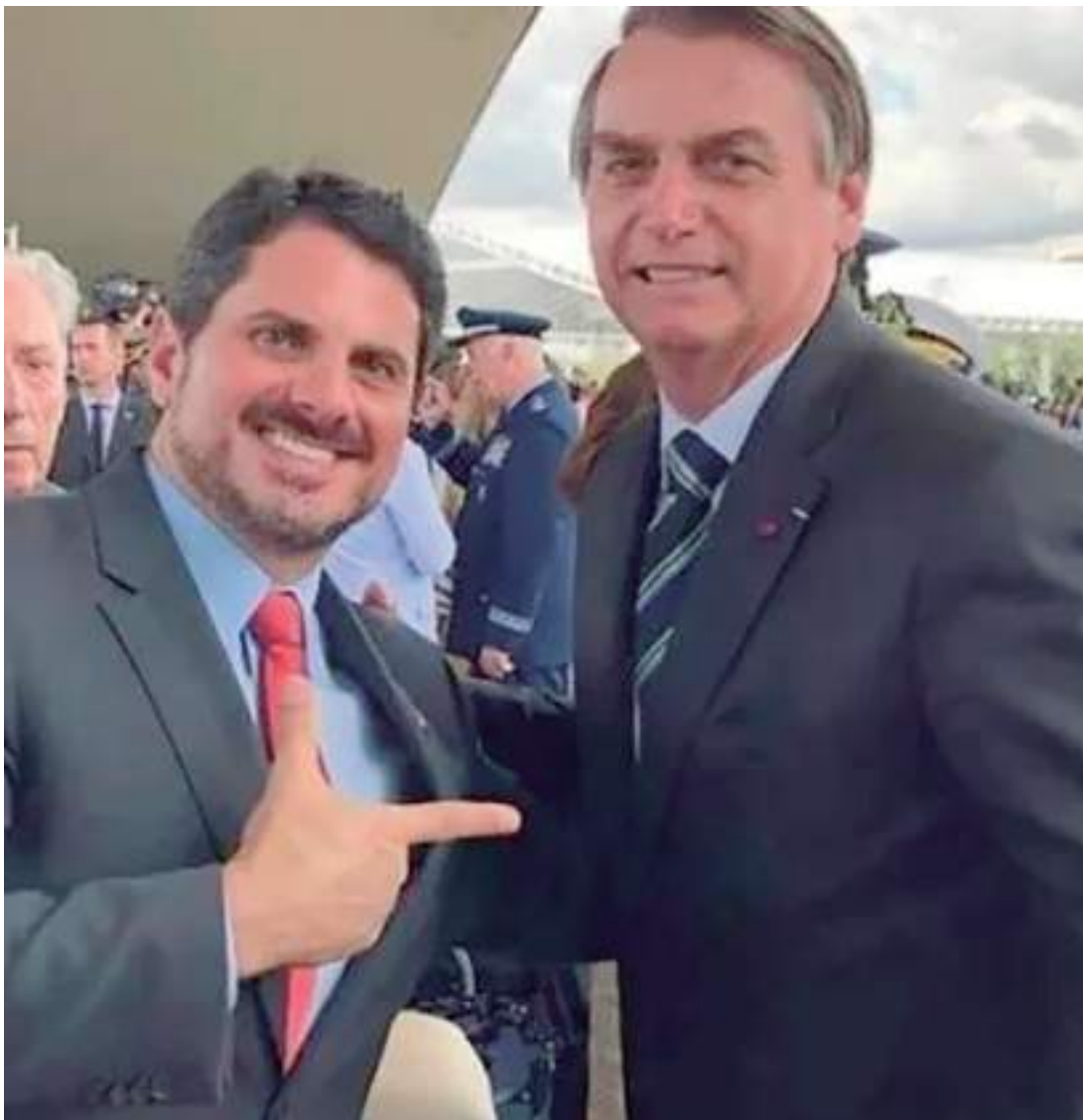
Ex-presidente Jair Bolsonaro e o senador Marcos do Val

O ex-presidente Jair Bolsonaro (PL) prestará um novo depoimento à Polícia Federal, nesta quarta-feira (12), no âmbito da operação que mira o senador Marcos do Val. A oitiva será às 14h, na sede da PF, em Brasília (DF).