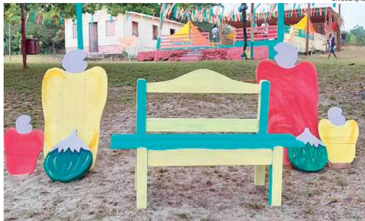
Festa do Cajumã acontece dia 26/08, na Comunidade São Francisco das Chagas do Caribi

Os interessados em conhecer mais detalhes da Festa do Cajumã e se informar sobre pacotes para o evento podem entrar em contato pelo telefone (92) 98447-9996.