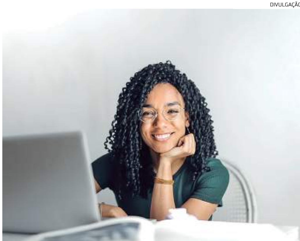
Mais de um milhão de estudantes em todo o Brasil já foram beneficiados

Segundo a Organização de Cooperação e Desenvolvimento Econômico (OCDE), apenas 21% dos jovens brasileiros, entre 25 e 34 anos, concluíram o ensino superior. Em outra faixa etária, a situação é ainda mais alarmante. No Brasil, 31% dos jovens entre 18 e 24 anos não estudam nem trabalham, de acordo com dados do Instituto Brasileiro de Geografia e Estatística (IBGE) de 2021. Um dos pontos relevantes para a