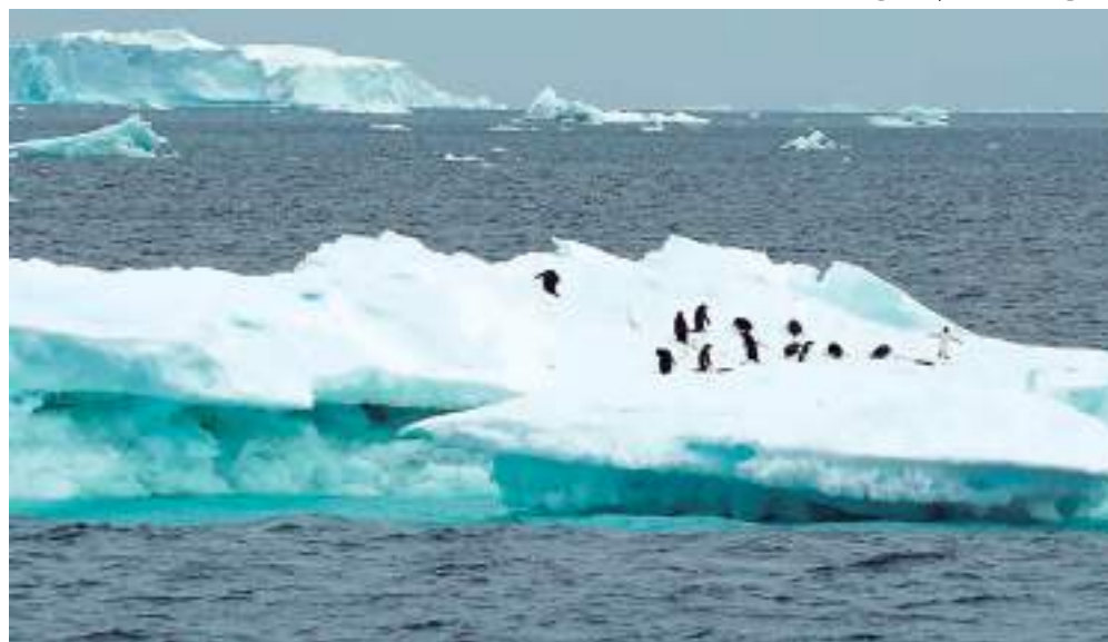
Pinguins em iceberg na Península Antártica