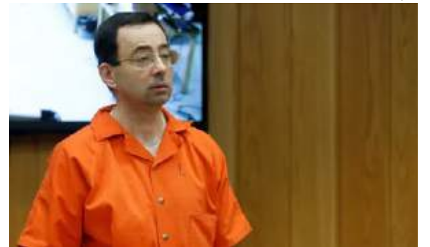
Larry Nassar é o médico que abusou de ginastas dos EUA