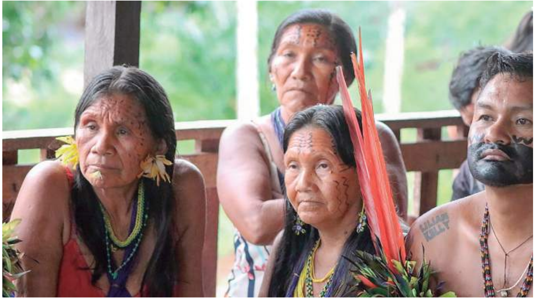
Indígenas de São Gabriel da Cachoeira, município que abriga a maior população indígena do Brasil

Figuram como diretrizes norteadoras da Política Estadual de Proteção das Línguas Indígenas, o reconhecimento e a garantia do direito fundamental das pessoas e comunidades indígenas ao pleno uso público da própria língua, dentro ou fora das terras indígenas; a proteção, a promoção, a valorização, o reconhecimento, a difusão e a revitalização das línguas indígenas no Amazonas; o respeito e a proteção da diversidade das línguas indígenas; o reconhecimento da autonomia e do protagonismo dos povos indígenas; a garantia e a valorização da participação