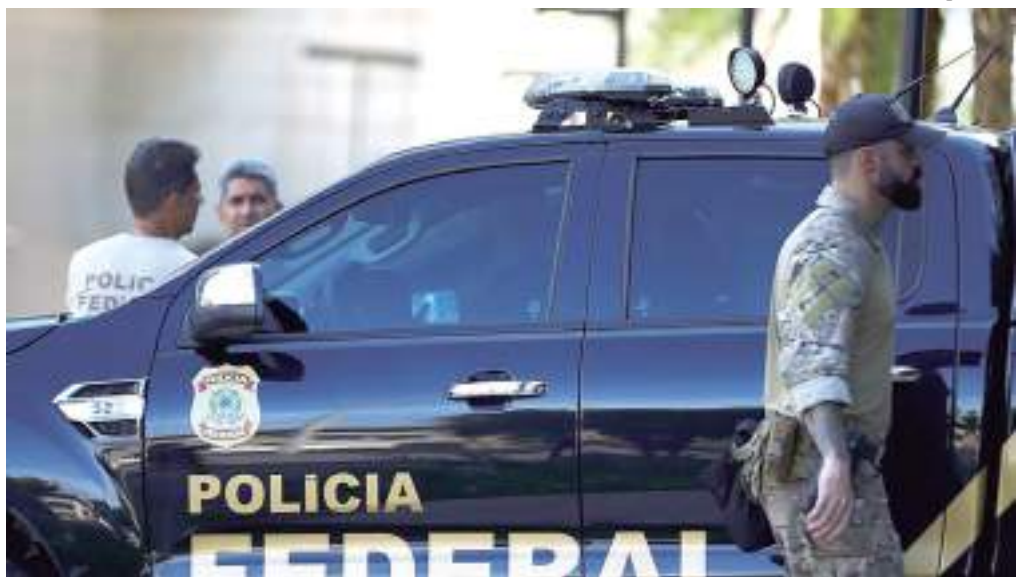
Suspeitos teriam movimentado R$ 80 milhões