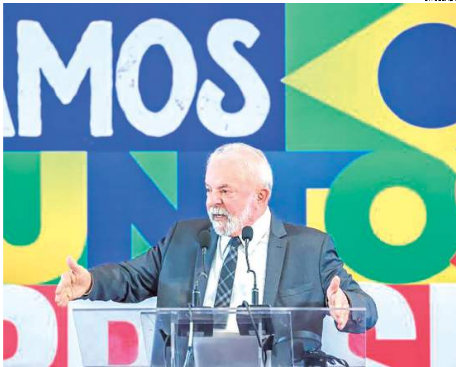
Presidente Lula deve participar de relançamento de programa Luz para Todos

O governo ainda fará outros dois anúncios, além do Luz para Todos e da entrega do Linhão. Um dos projetos é a entrega da internet por infovia e o outro no campo ambiental, ainda não