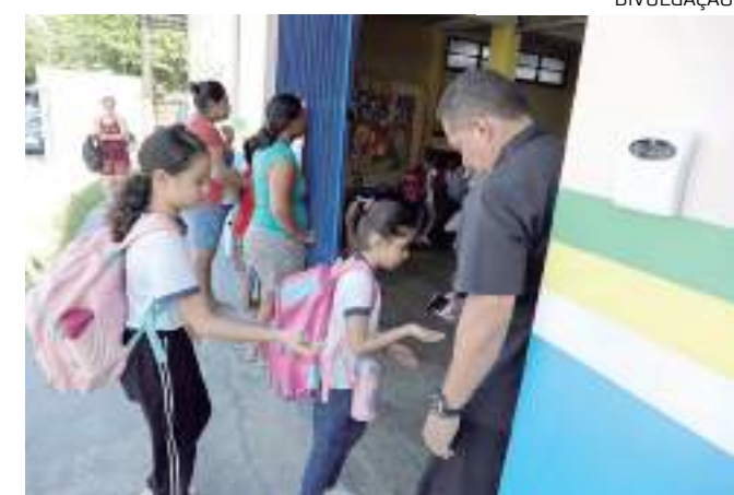
1º ao 5º ano do Ensino Fundamental, alunos voltam às aulas

"Para eles, a escola é um lugar onde eles têm vontade de estar presente e, nós, professores, estamos cheios de energia para iniciar essa nova etapa", relatou.