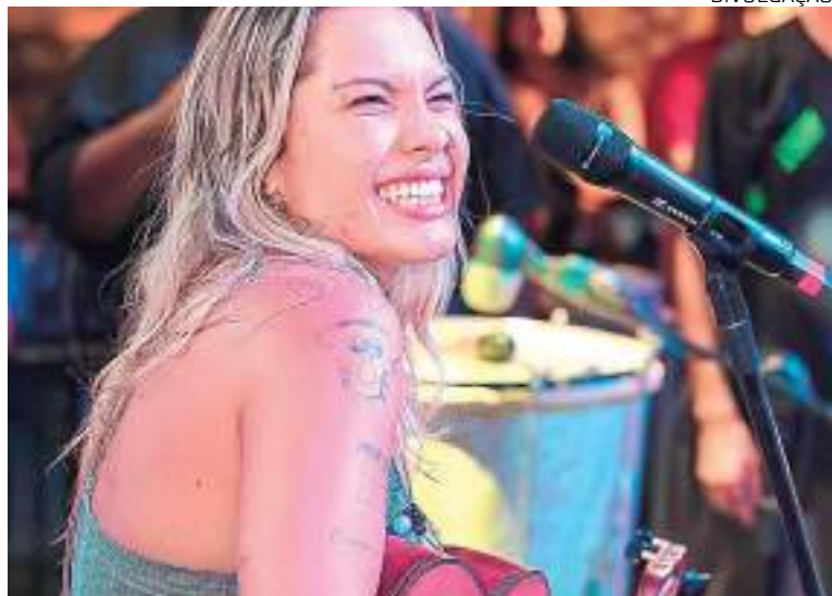
Samba Sunset será realizado no Via Torres, com outras atrações locais