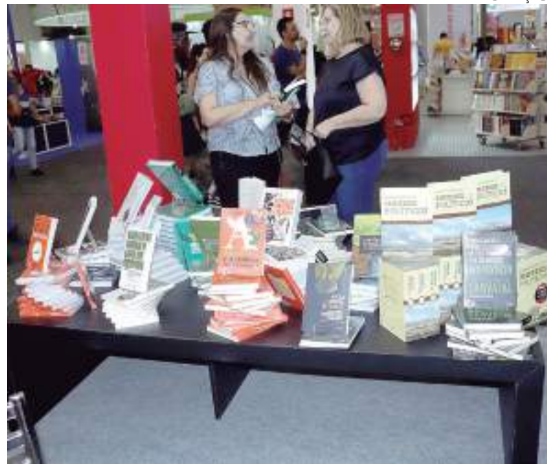
Evento ocorre de 11 a 14 de julho