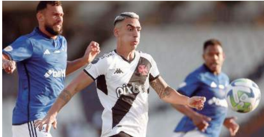
Vasco não consegue vencer há nove jogos no Campeonato Brasileiro de 2023

O América-MG aparece com 68,4% de chance de rebaixamento, enquanto o Coritiba tem 64,4% e o Goiás, que completa o Z4 na 17ª posição, tem 55,1%. Outros cinco clubes têm índices