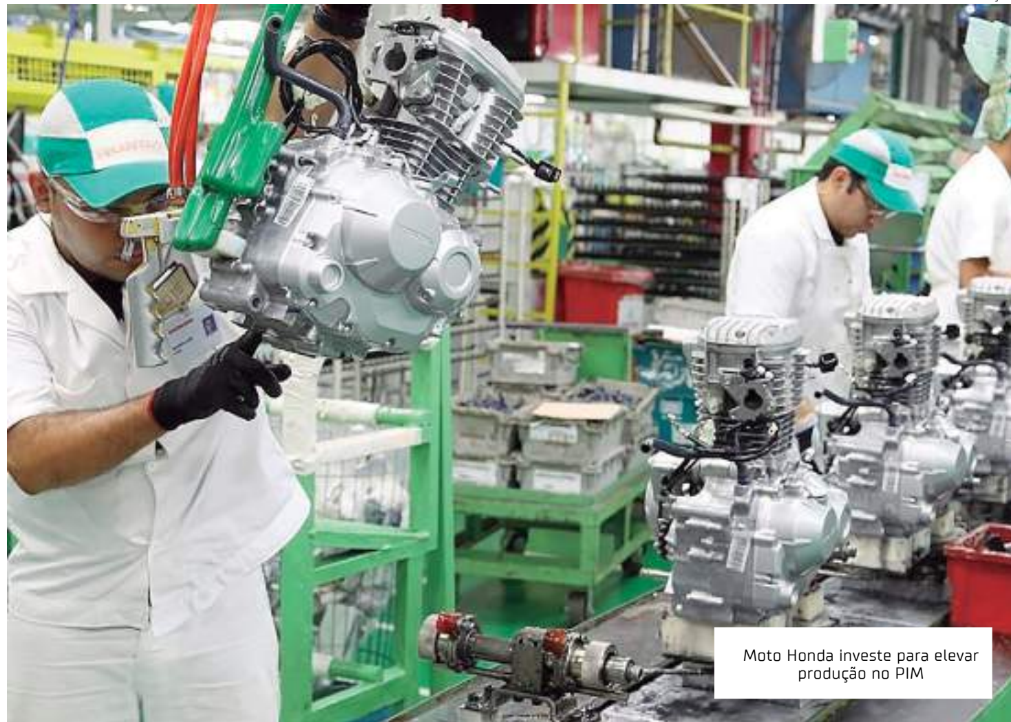
Moto Honda investe para elevar produção no PIM

No ranking de emplacamentos mensal, as posições foram mantidas: Street (72.991 unidades e 52% de participação