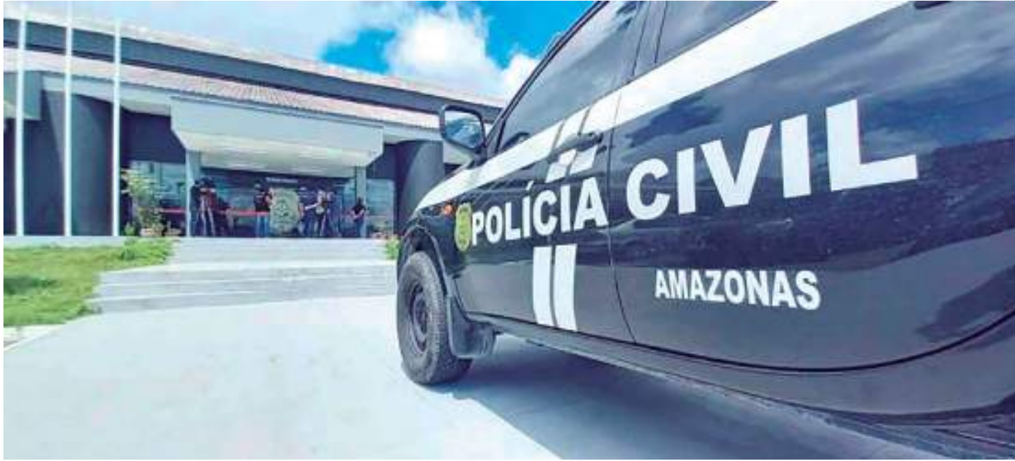
Fachada da Delegacia Especializada em Homicídios e Sequestros