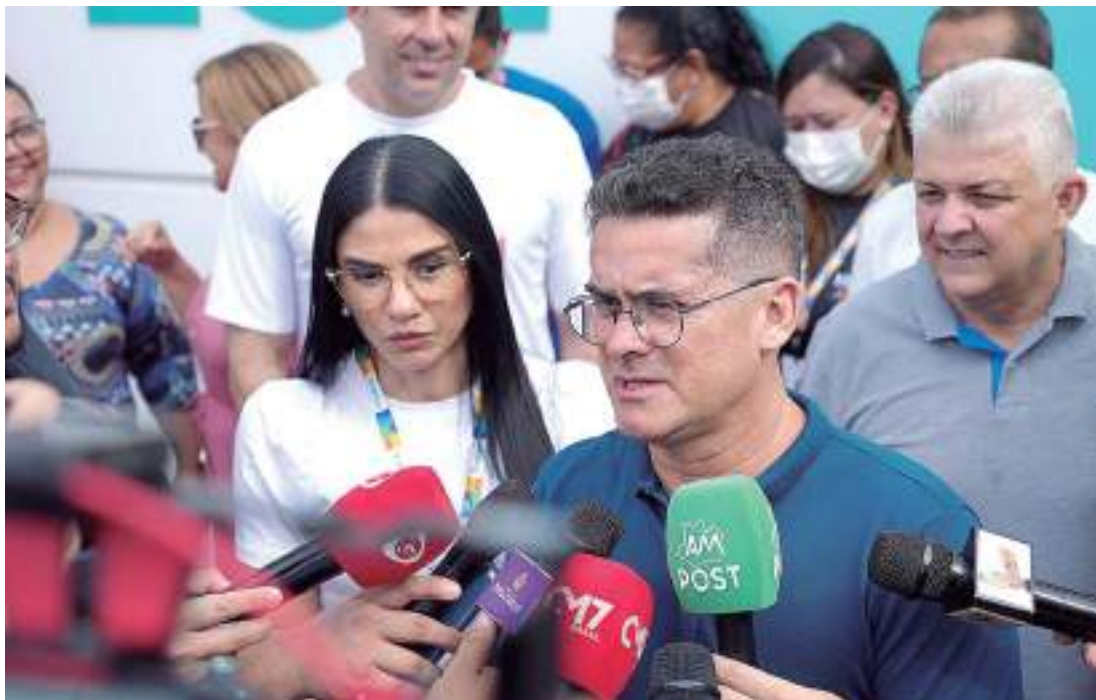
Com a entrega, sobe para 40 o total de unidades revitalizadas

“Nesta semana vamos entregar oito unidades de saúde da família. Hoje, as entregas aconteceram na zona Leste. Assim, a gente chega a 40 unidades deste porte reformadas na cidade de Manaus, além das UBSs tipo 4 que estamos construindo e