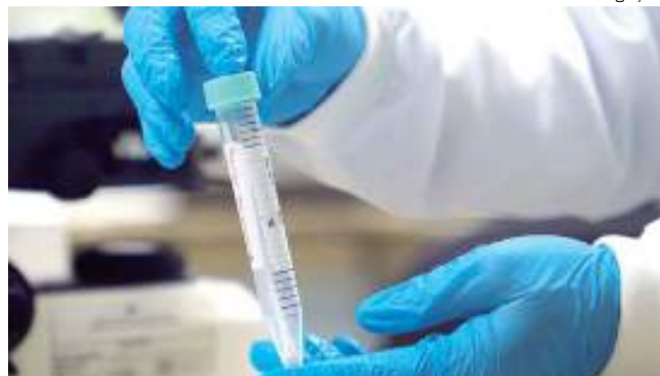
Para mais informações acesse: www.fvs.am.gov.br