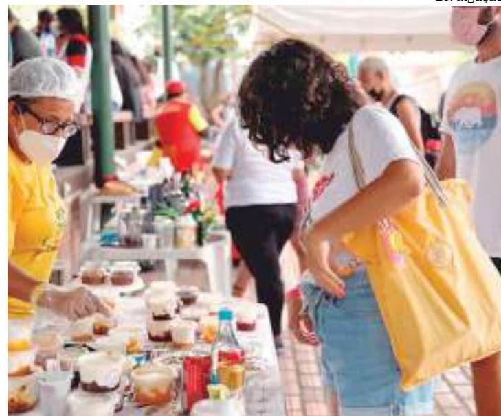
Empreendedora apresenta seus produtos na feira da FAS

“Todos os anos o anúncio da Virada Sustentável Manaus é esperado pela população manauara, e é uma honra poder fazer isso dentro de uma edição da Feira da FAS com uma temática tão importante. Para a FAS é uma honra promover, mais uma vez, um encontro de trocas de saberes e realidades tão ricos. Convidamos