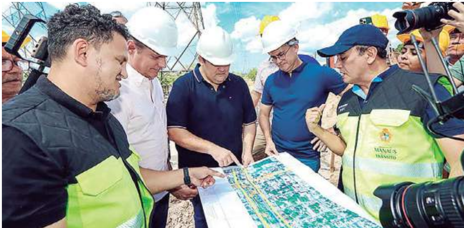
Obra está avançada e deve ser entregue até o fim deste ano, seis meses antes do prazo original