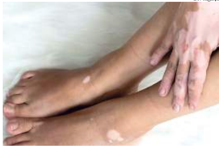
Segundo a Fuham são mais de 100 de casos em 2023

É importante destacar que não existem formas de prevenção do vitiligo. Como em cerca de 30% dos casos há um histórico familiar da doença, os parentes de indivíduos afetados devem realizar vigilância periódica da pele e recorrer ao dermatologista caso surjam lesões de hipopigmentação.