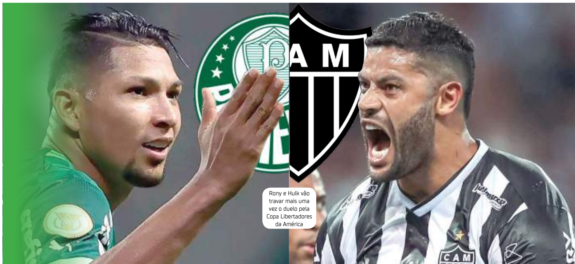
Rony e Hulk vão travar mais uma vez o duelo pela Copa Libertadores da América

Pelo terceiro ano seguido, Palmeiras e Atlético-MG vão se enfrentar no mata-mata da Copa Libertadores nesta quarta-feira (2), às 20h30, no estádio Mineirão.