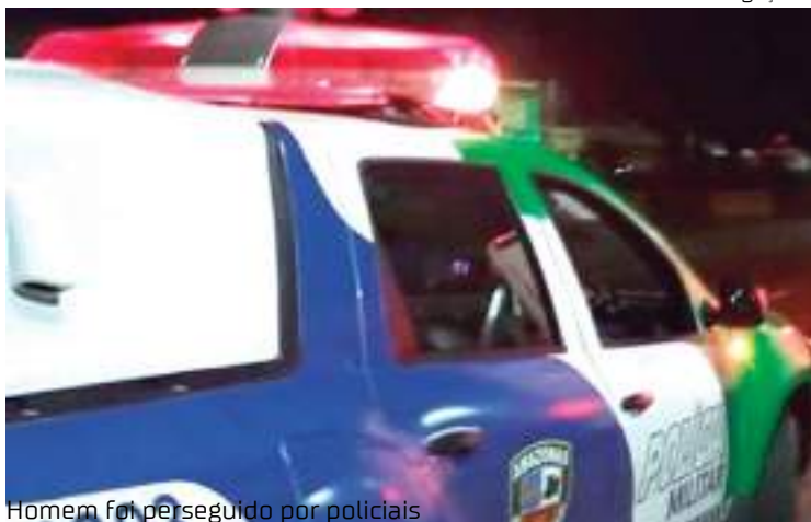
Homem foi perseguido por policiais