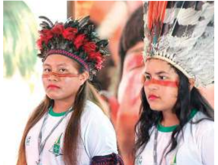
Dado está em relatório divulgado pelo Cimi