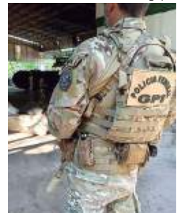
Operação de incineração da Polícia Federal