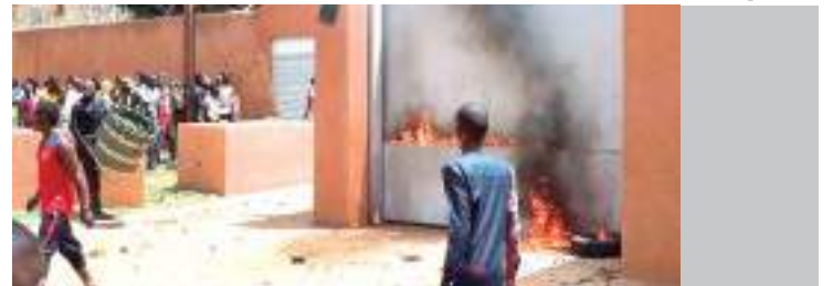
Manifestantes pró-junta diante de embaixada francesa no Níger

na terça-feira que oferecerá um voo especial para repatriar seus cidadãos de Niamei, e Colonna disse que os países europeus que enviam aviões de retirada coordenarão seus