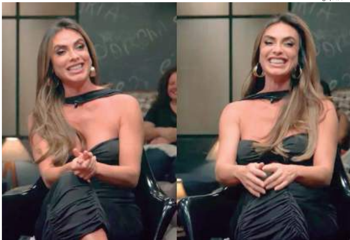
Nicole Bahls relembra quando hospedou fãs em própria casa

Nicole Bahls relembrou um momento no início de sua carreira, onde chegou a hospedar 16 fãs em sua própria casa. Em entrevista ao "Que História É Essa, Porchat?", ela contou o que a levou a abrigar tanta gente.