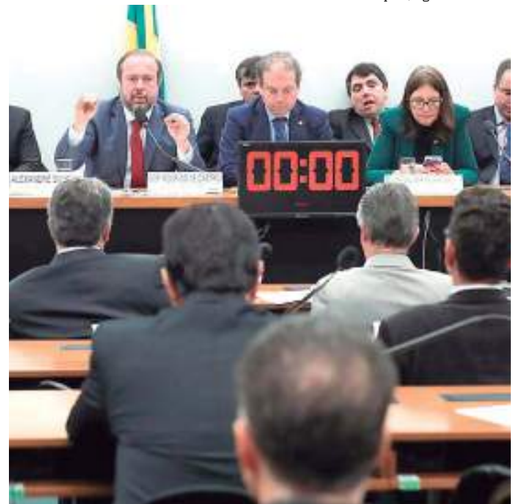
Audiência na Câmara dos Deputados, em Brasília

“Devido a estarmos na época da seca, as [usinas hidroelétricas do Rio] São Francisco já estão operando com sua vazão e geração mínimas e não poderíamos reduzir ainda mais. A geração termoeletrica, em todo o Brasil, já estava trabalhando de forma que não poderia ser reduzida. Portanto, como o grande exportador do Nordeste são as fontes eólicas e solares, foi aí que tivemos que cortar. Não porque exista um problema de geração