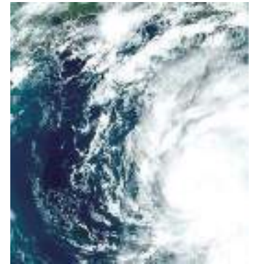
Furacão Idalia se aproxima da Flórida