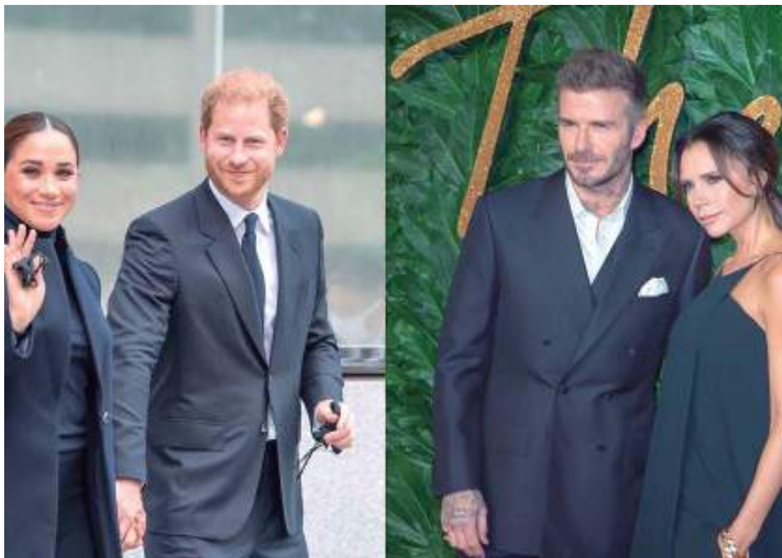
Harry e Meghan rompem amizade com David e Victoria Beckham

Mais uma confusão envolvendo os Duques de Sussex chegou à imprensa! De acordo com o portal Daily Mail, a amizade de longa data entre o Príncipe Harry, Meghan Markle e o casal David e Victoria Beckham parece ter chegado ao fim. Isso porque o casal teve uma briga por telefone, jogando fora todos os anos de cumplicidade.