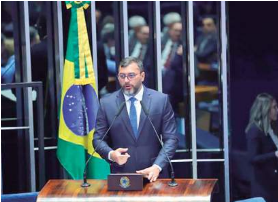
Governador reforçou a importância do modelo que emprega meio milhão de pessoas

“Se a Zona Franca de Manaus enfraquece, se a Zona Franca começa a perder a sua força, é começar a tacar fogo na floresta. E aí é necessário também entender que o Amazonas não é só da Amazônia, o Amazonas é do Brasil. Faço um apelo, e o senador Eduardo Braga conhece muito bem essa realidade, para que haja um bom senso do Senado, da relatoria, de levar essas questões em consideração”,