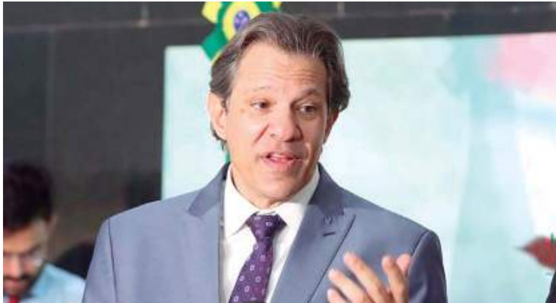
Ministro teve uma reunião com o presidente Lula e os ministros que compõem a Junta de Execução Orçamentária

O ministro teve uma reunião com o presidente Luiz Inácio Lula da Silva e os ministros que compõem a Junta de Execução Orçamentária (JEO): Rui Costa, da Casa Civil; Simone Tebet, do Planejamento; e Esther Dweck, da Gestão e Inovação em Serviços Públicos. Segundo Haddad, eles discutiram a sanção do novo arcabouço fiscal, aprovado pelo Con-