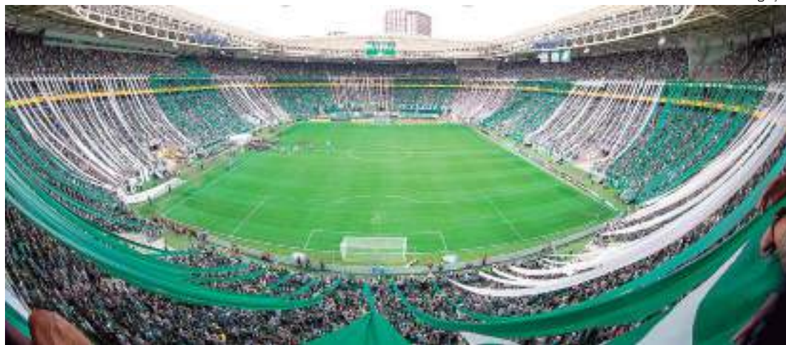
Torcida Alviverde promete ajudar o time a conseguir mais uma vitória na Libertadores

Com a goleada por 4 a 0 no confronto de ida, na Colômbia, o Alviverde pode perder por até três gols de diferença. Qualquer empate também garante o Palmeiras na semifinal da Libertadores. Ainda, o duelo o final de semana é o clássico contra o Corinthians, fora de casa, pela 22ª do Bra-