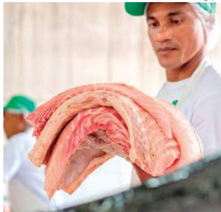
Filé do pirarucu vendido por feirante na feira da FAS

A FAS tem como missão contribuir para a conservação do bioma pela valo-