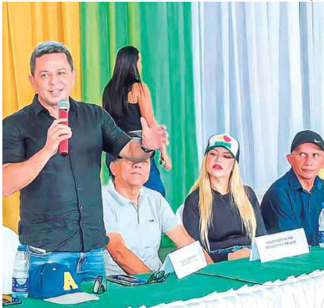
Ação conjunta pretende realizar cerca de 250 atendimentos

As cirurgias terão início nesta quinta-feira (24) e se estendem até o dia 27 de agosto. A catarata atinge o cristalino, lente da parte interna do olho, que deixa de ficar transparente e passa a ser opaca, causando a perda gradual da visão. O pterígio é uma doença externa que forma uma espécie de "carne" no canto de um ou dos dois olhos.