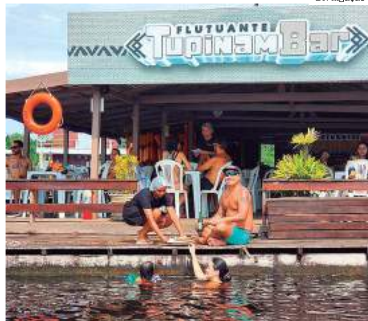
TupinamBar atinge a ocupação máxima nos dias mais quentes

“Todo o lixo é separado em cestos para o descarte correto em Manaus. A energia é solar. A caixa de gordura é limpa com frequência e os resíduos tratados para não poluir o ambiente. O mesmo ocorre com os dejetos do banheiro que passam por uma esta-