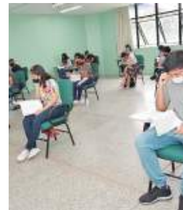
Boleto pode ser pago até o dia 1º de setembro

As provas acontecem nos dias 22 de outubro de 2023 para os candidatos do SIS - Acompanhamento I, II e III, e 23 de outubro de 2023 (conhecimentos gerais) e 24 de outubro de 2023 (conhecimentos específicos e redação) para os candidatos do Vestibular. Os portões serão abertos às 12h e fechados às 12h50 (horário de Manaus).