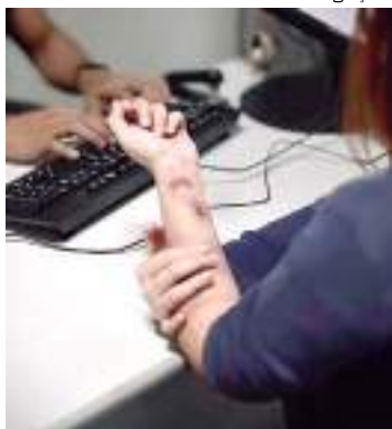
Para denunciar ligue 181 ou 180

O Boletim de Ocorrência (BO) é o primeiro passo para iniciar uma investigação e, em alusão ao Agosto Lilás, as Delegacias Especializadas em Crimes contra a Mulher (DECCMs), da Polícia Civil do Amazonas (PC-AM), destacam como o procedimento pode ser primordial para ajudar uma mulher a sair do ciclo da violência doméstica.