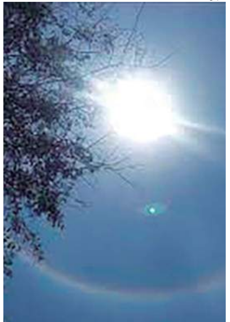
As altas temperaturas estão relacionadas com o fenômeno 'El Niño'

"Primeiro, arborização. Acredito que arborização ajudaria muito a diminuir o calor. Ao invés de priorizar estacionamento, plantar mais árvores. Bebedouro também, espalhados pelo Centro de Manaus", finalizou Sanches.