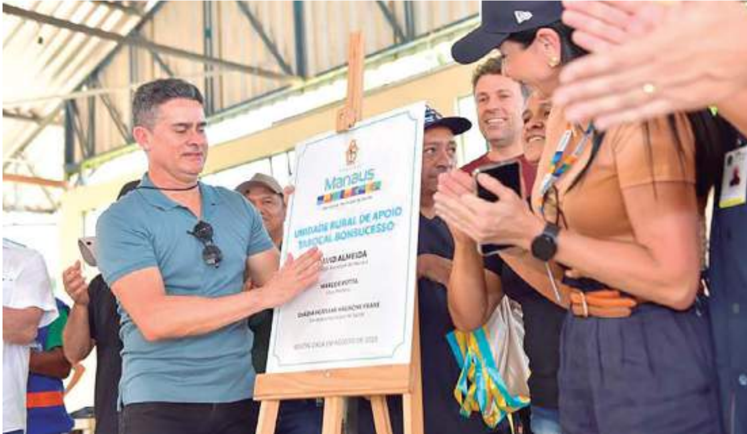
Estruturas passaram por uma revitalização total e serão fundamentais para a qualificação dos atendimentos