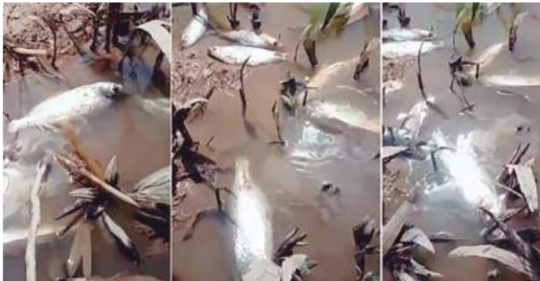
Senadora Soraya Thronicke relatora do projeto na comissão de agricultura

Em sua argumentação, a senadora sul-mato-grossense rejeitou as 10 emendas apresentadas por senadores e garantiu estar “convicta de que a data da promulgação da Constituição Federal, de 5 de outubro de 1988, representa parâmetro apropriado de marco temporal para verificação da existência da ocupação da terra pela comunidade indígena”. Ela enfatizou que isso se baseia na necessidade de estabelecer critérios claros para verificar a ocupação das terras indígenas e garantir a proteção