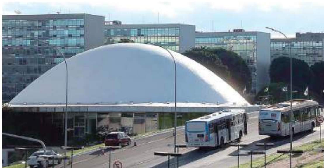
Matéria foi aprovada hoje no Senado

A proposta acrescentou ao Código Penal Militar os crimes já considerados hediondos pela Lei 8.072 de 1990: homicídio qualificado, estupro, latrocínio, extorsão