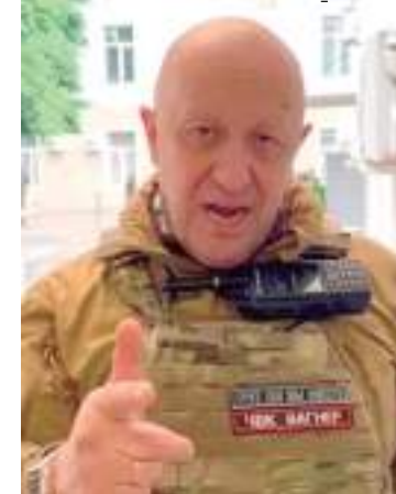
Yevgeny Prigozhin é o chefe do grupo paramilitar Wagner