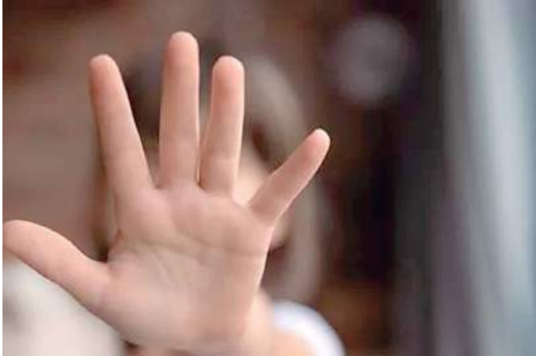
Professor da rede municipal é suspeito de importunar alunas de 13 anos

Um professor, de 62 anos, foi preso na terça-feira (22), por importunação sexual contra duas alunas de 13 anos. O fato teria ocorrido em uma escola da rede pública municipal localizada na Zona Leste de Manaus.