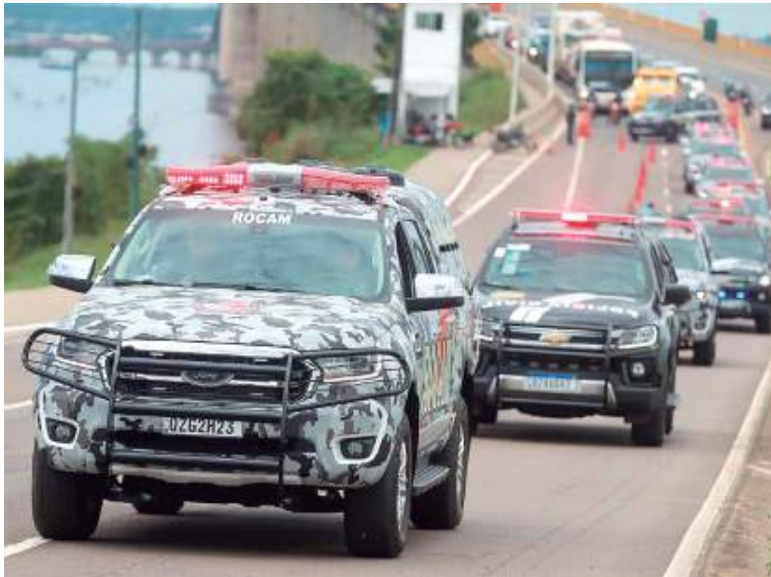
Segurança Pública foi a área que mais apresentou avanços

O Ranking avaliou 99 indicadores, em 10 pilares