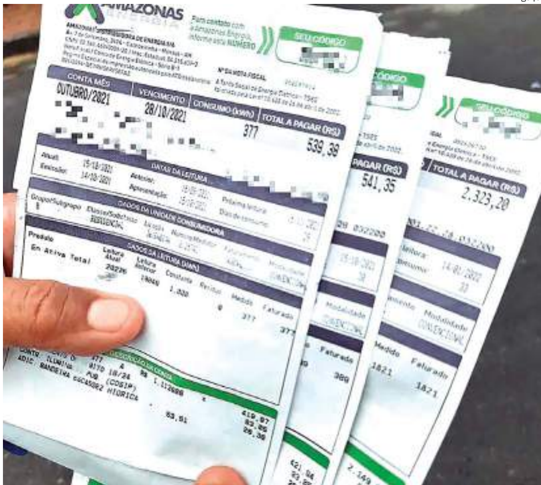
Amazonas Energia é a empresa com mais reclamações na Comissão de Defesa do Consumidor

Em 2023, foram registradas quase 6 mil reclamações dos clientes, segundo dados divulgados pelo Instituto de Defesa do Consumidor (Procon-AM). No ano 2022, o Amazonas Energia recebeu 10,4 mil reclamações de clientes da concessionária. Problemas recorrentes devido ao corte indevido de fornecimento de energia, problemas de queda de energia e cobranças abusivas são as reclamações mais frequentes dos consumidores.