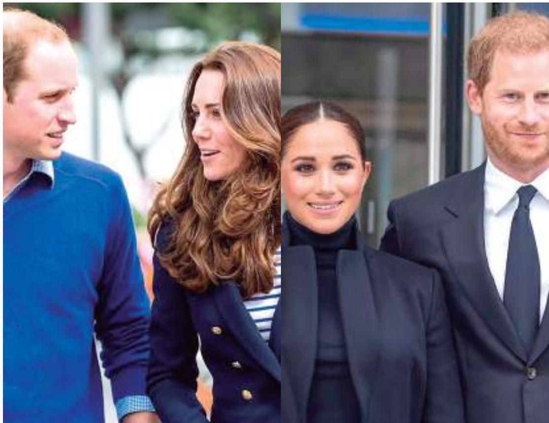
Harry precisa da autorização de Meghan para conversar com Kate, diz site