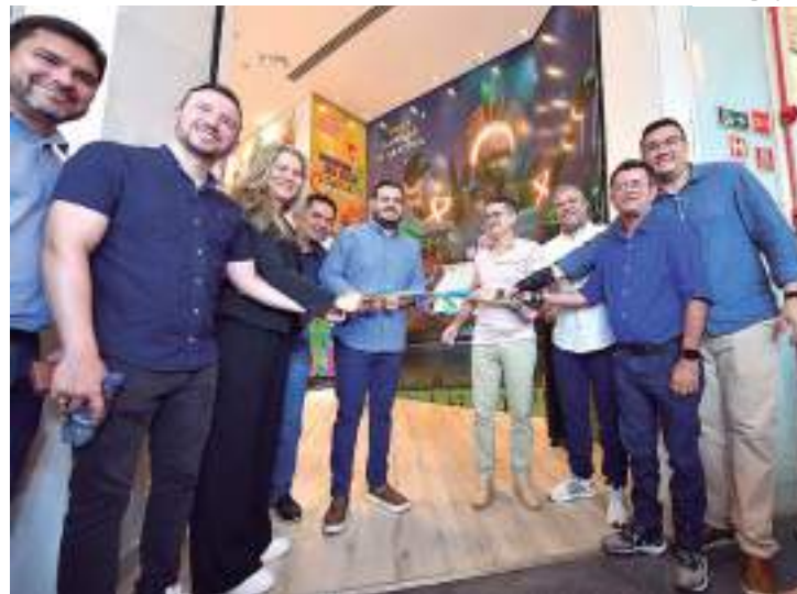
População encontrar na loja todas as informações sobre o festival

“Teremos uma pegada de sustentabilidade ambiental. No show principal do evento, que é a atração internacional, o David Guetta, nós vamos disponibilizar na abertura do link da inscrição, dez mil ingressos, e nós vamos trocar cada ingresso por 30 garrafas PETs, para que elas não possam poluir os nossos rios e igarapés. Faremos parceria com as empresas de reciclagem e essas gar-