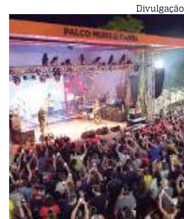
Local fica localiado no complexo da Ponta Negra

Para finalizar a programação do final de semana, a Tardezinha da Casa de Praia, promove, a partir das 18h, a apresentação especial do #Cirandas2023, com a participação de grupos de dança de Manaus e Manacapuru, entre eles, a campeã do 65º Festival Folclórico do Amazonas, Ciranda Princesinha da Vila.