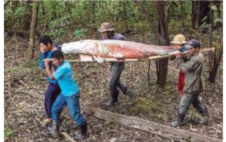
Pirarucu de manejo sustentável criado em área de reserva

A ideia é expandir a comercialização do pirarucu no Brasil, estreitar os laços com as bases produtivas, aprimorar os processos de beneficiamento do pescado,