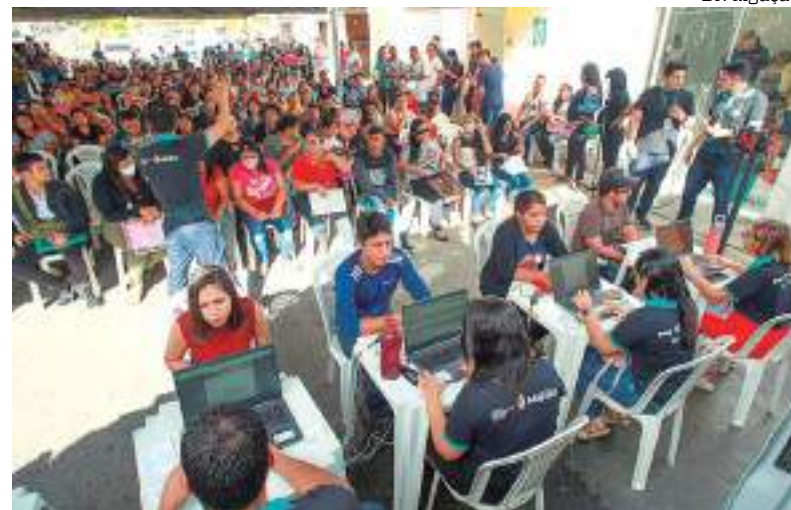
Interessados devem levar RG, CPF, PIS, CTPS, comprovante de escolaridade e residência