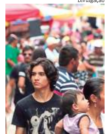
Pessoas caminhando pelas ruas do Centro Histórico de Manaus

A Serasa, inclusive, conta com uma série de programas com o intuito de contribuir com a queda da inadimplência e melhorar os dados. Em julho, mais de 188 mil acordos foram fechados pelos canais do Serasa Limpa Nome. O número de ofertas disponíveis, no entanto, batia 23,1 milhões.