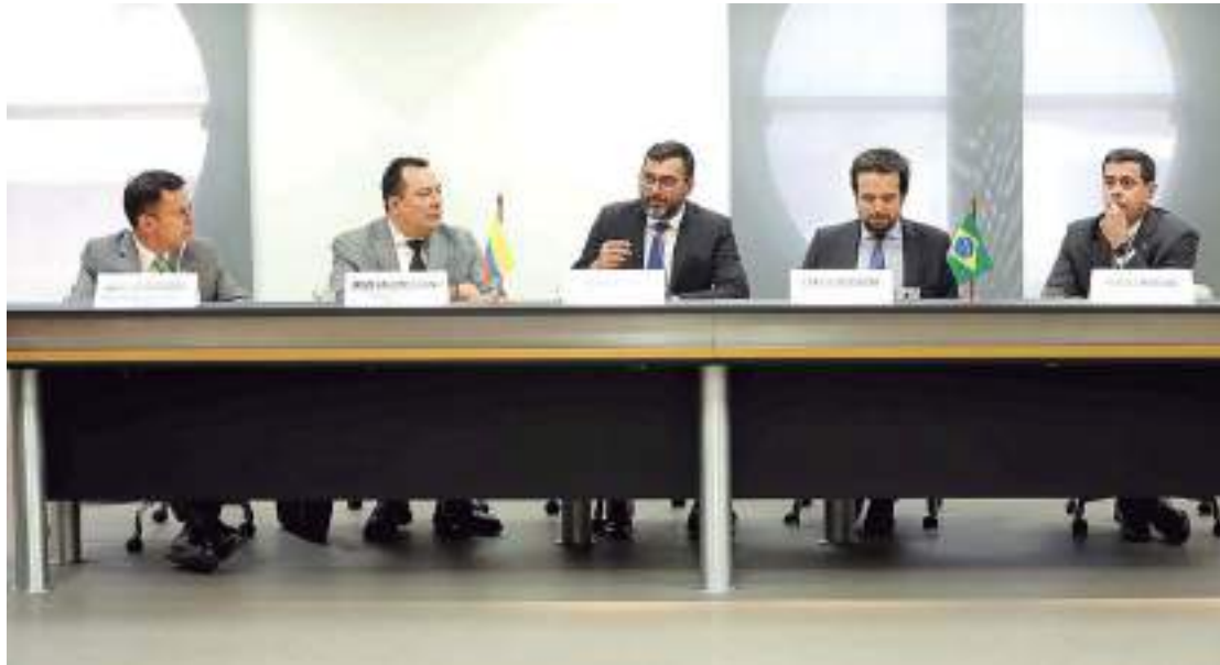
A execução do programa no Amazonas é uma articulação direta do governador com a Anatel

“Isso é fundamental porque a conectividade, a internet, ela diminui as distâncias, facilita o em-