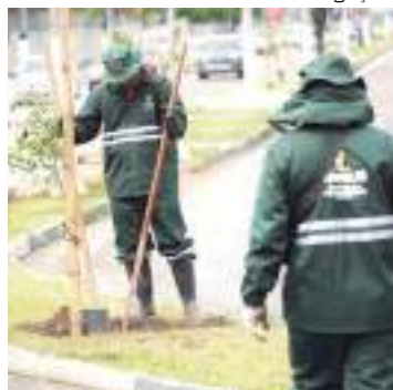
A meta é plantar mais 300 mil mudas em 2 anos

O verão amazônico trouxe para a cidade de Manaus, além do calor, a necessidade de se intensificar os cuidados com a arborização da capital. O trabalho de produção, plantio e doação de mudas e o manejo da arborização, incluindo regas noturnas, é realizado pela Prefeitura de Manaus, por meio da Secretaria Municipal de Meio Ambiente