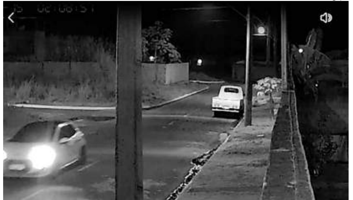
Câmeras flagram momento que empresário é sequestrado em Iranduba

Os sequestradores pediram um valor para o resgate, a partir de então, foi acompanhada toda a negociação. Após o pagamento ser realizado, eles deixa-