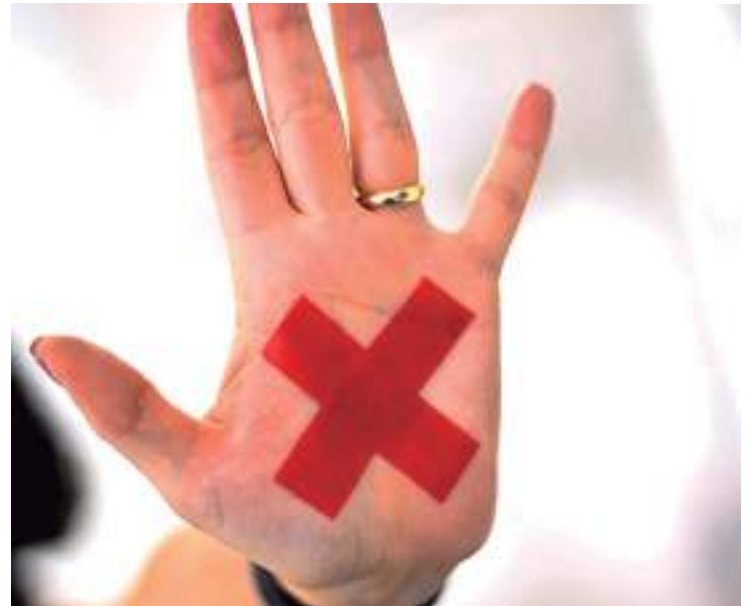
Proposta foi aprovada no Senado por votação simbólica

A assinatura da parceria ocorreu na manhã do dia 1/08, na Sala de Reuniões da Presidência do TJAM, com as presenças da presidente da Corte Estadual, desem-