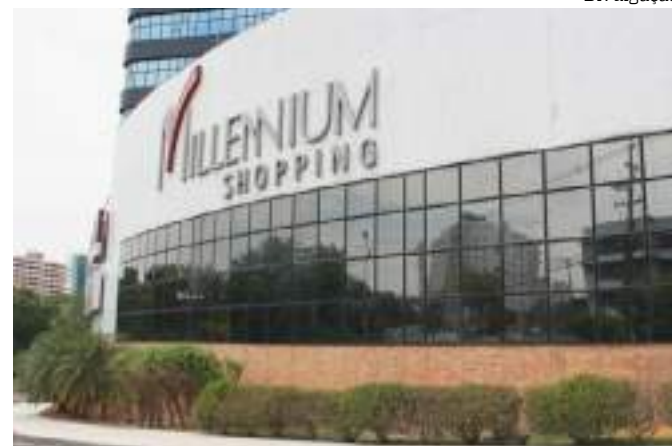
Fachada do Millennium Shopping

“Outra opção para aproveitar o Dia dos Pais é reunir a família para um almoço ou jantar no shopping. O Millennium conta com os restaurantes Picarha Mania e o Salomé, que possuem um espaço amplo e confortável para os clientes, além disso, também contamos com um mix de opções na praça de alimentação”, informou Elizandra.