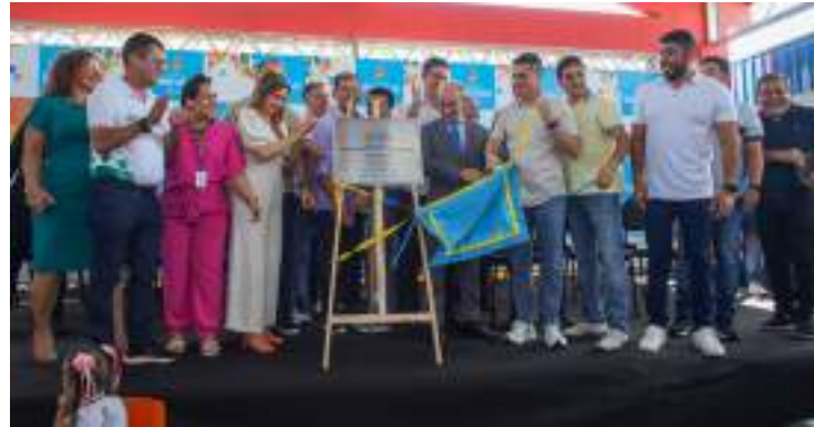
Unidade tem capacidade para atender cerca de 200 alunos

está avançando na construção de novas creches. Até 2022, nós tínhamos 20 creches próprias. Nesta gestão, assumimos o compromisso de entregar obras que estavam paradas há muitos anos e já estamos entregando a segunda creche. Até o final da gestão, o nosso objetivo é entregar mais sete. Essa é uma preocupação que nós temos com as famílias de Manaus, já que muitas mães precisam trabalhar e deixar seus filhos em um ambiente seguro”, declarou a secretária.