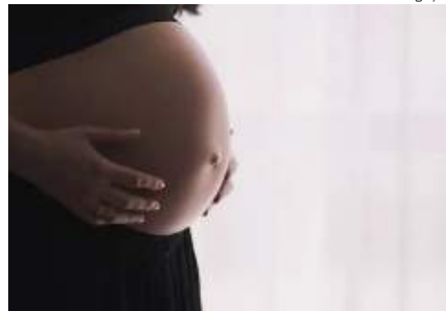
Criança ficou grávida após ser estuprada por padeiro

Um padeiro de 40 anos, condenado a 13 anos e 4 meses de reclusão pelo crime de estupro de vulnerável praticado contra uma adolescente de 12 anos. O crime aconteceu em 2011, no bairro Colônia Santo Antônio, Zona Norte de Manaus.