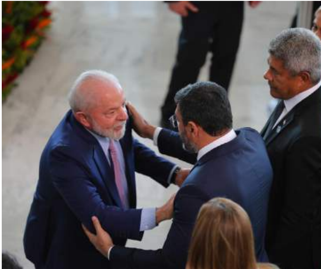
Presidente Lula e Wilson Lima cumprimentaram-se durante posse do novo ministro do Turismo

“Fazer turismo na Amazônia, no Amazonas, por exemplo, é diferente de fazer turismo no Nordeste, no Rio de Janeiro ou em outra região brasileira. Então, a gente tendo alguém que vivencia