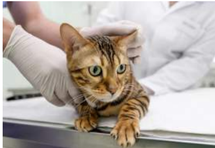
Manaus conta com mais de 697 mil animais domésticos

“Os tutores costumam enfrentar situações desagradáveis quando os pets adoecem, que vão desde a preocupação com os animais ao imprevisto financeiro pelo atendimento veterinário. A missão dos planos de saúde da Petlove é democratizar o acesso a serviços veterinários, e, por isto, nossos serviços são sem distinção de idade, porte ou doenças pré-existentes para novas adesões, oferecendo soluções para todos os perfis de clientes, com o objetivo de que os pets sejam mais felizes e saú-