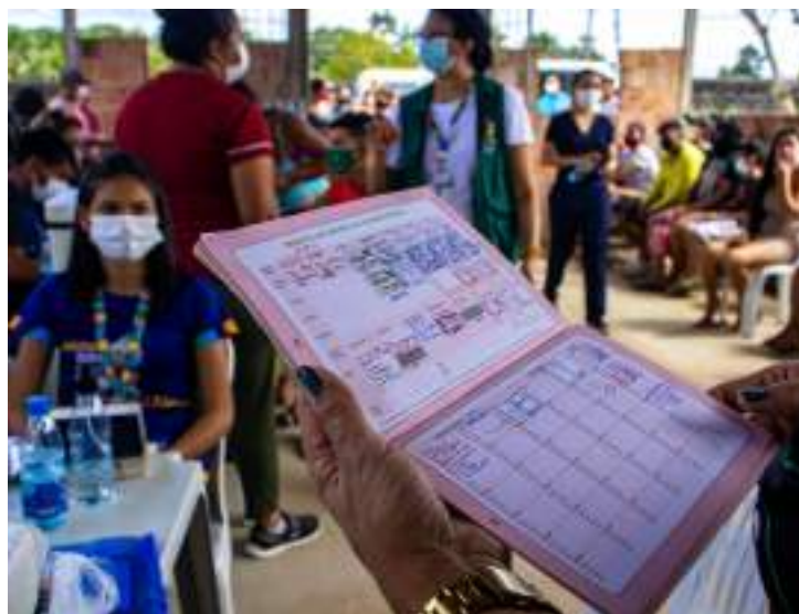
Vacinas disponíveis para gestantes e crianças de 0 a 6 anos

Isabel enumera as vacinas contra hepatite B e contra influenza, antitetânica