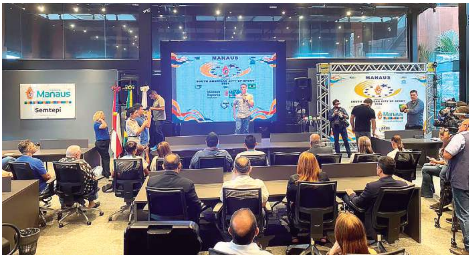
Prefeito David Almeida anuncia que Manaus concorre ao título de Cidade Sul-Americana do Esporte 2024