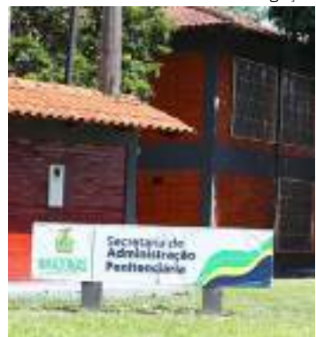
As visitas são agendadas por meio do Aplicativo Visita legal

A Secretaria de Estado de Administração Penitenciária (Seap) divulgou, na quarta-feira (02), o calendário da nova rodada de visitas virtuais nas unidades prisionais do Amazonas. A medida visa proporcionar a comunicação entre o interno e os seus familiares, estreitando os laços e diminuindo a distância por meio da tecnologia.