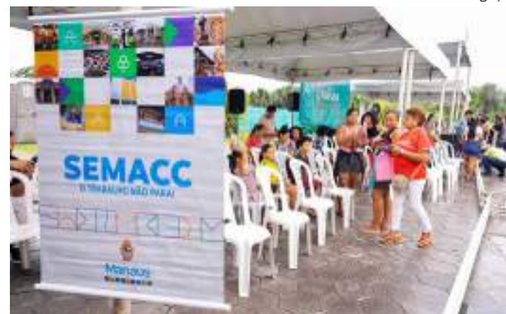
São oferecidos mais de cem serviços públicos totalmente gratuitos

região e de bairros adjacentes o acesso a serviços como a inclusão e atualização do Cadastro Único, emissão da 1ª via da Certidão de Nascimento e encaminhamento para a retirada da 2ª via, consultas com clínico geral, vacinação, procedimentos odontológicos (limpeza, restauração e extração), agendamento para a castração de animais domésticos, cadastro para vagas de emprego e muito mais.