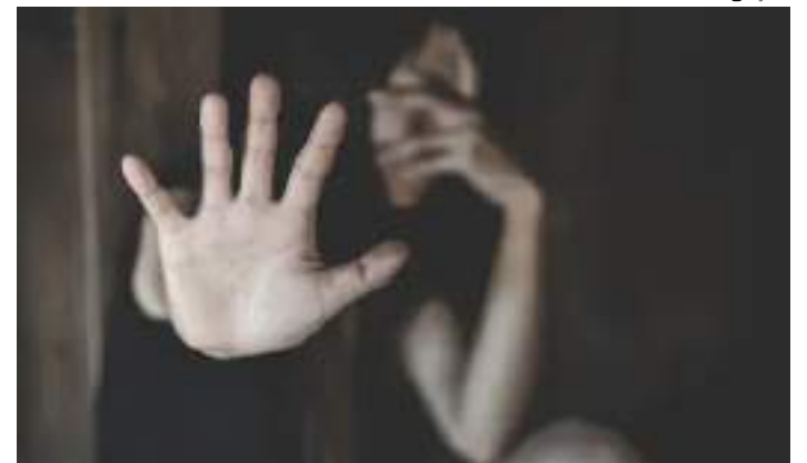
Amazonas é 4º Estado que mais registra casos

configura como o 4º Estado que mais registra casos de violência contra a mulher, de acordo com o Anuário Brasileiro de Segurança Pública de 2023. Além disso, dados do Tribunal de Justiça do Amazonas (TJ-AM) mostram que, somente nos dois primeiros meses deste ano, mais de 1.400 Medidas Protetivas de Urgência (MPUs) foram concedidas em favor de mulheres vítimas de ameaças e de violência doméstica e familiar.