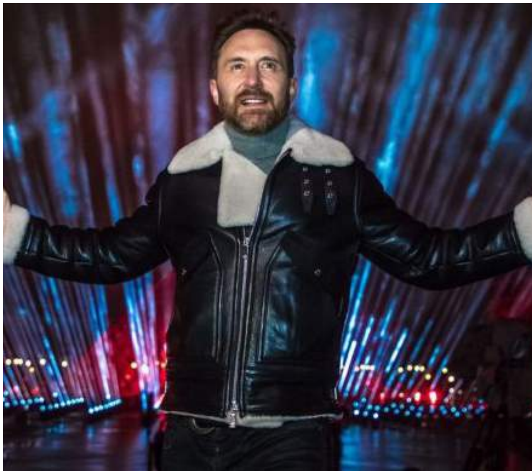
Em 2011 ele alcançou o 1º lugar da tabela de DJs mais populares do mundo pela, feito que iria repetir em 2020

“Ele tocará em Ibiza, tocará em Manaus, nossa atração internacional é o DJ David Guetta. Isso é Sou Manaus. Muito obrigado as pessoas que nos ajudaram a fechar essa atração, toda nossa equipe. Tenho certeza que Manaus vai tremer com David Guetta na Amazônia.