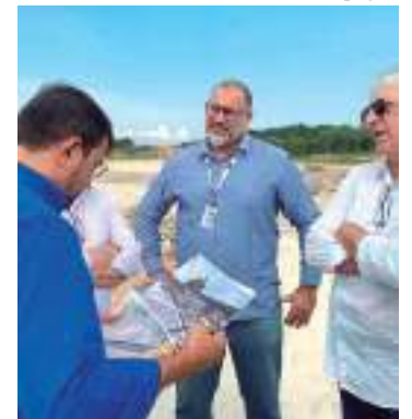
Projeto passará por processo licitatório este ano

O novo prédio será construído em um terreno localizado no parque Mosaico, no Lirio do Vale, zona Oeste.