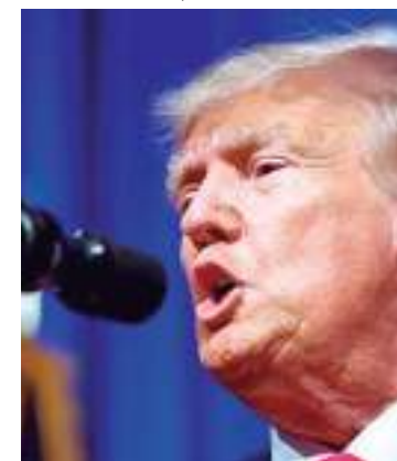
O ex-presidente dos EUA Donald Trump