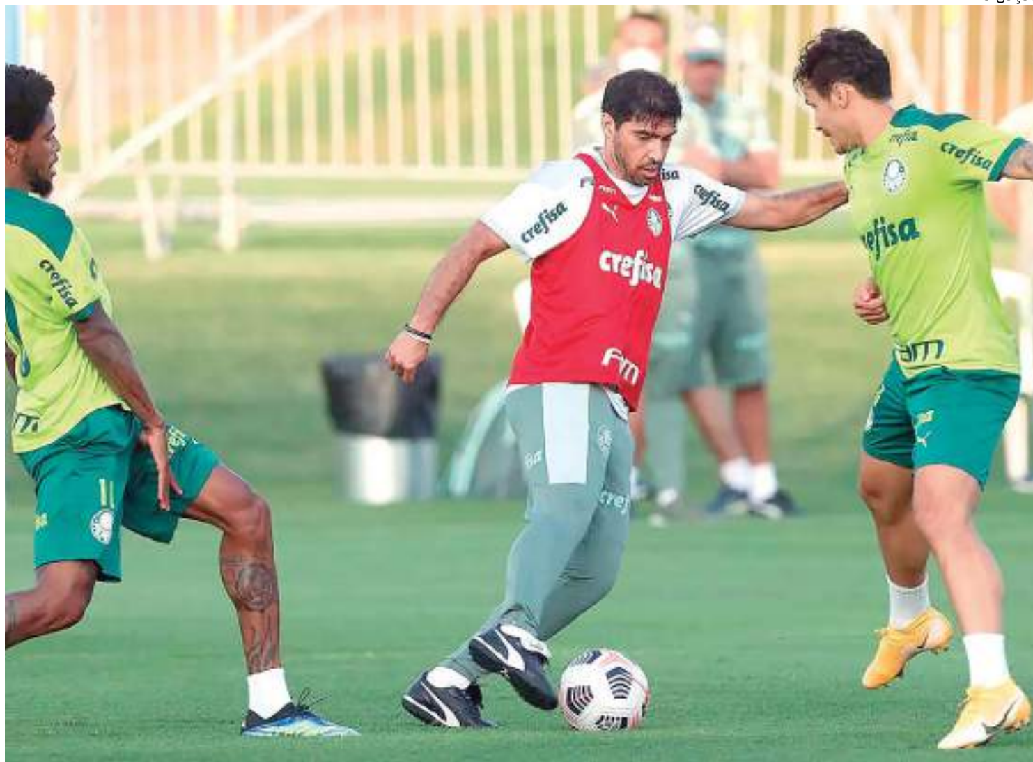
Time paulista realiza treino para enfrentar o Deportivo Pereira pela Libertadores

O Palmeiras viaja para a distante Pereira nesta se-