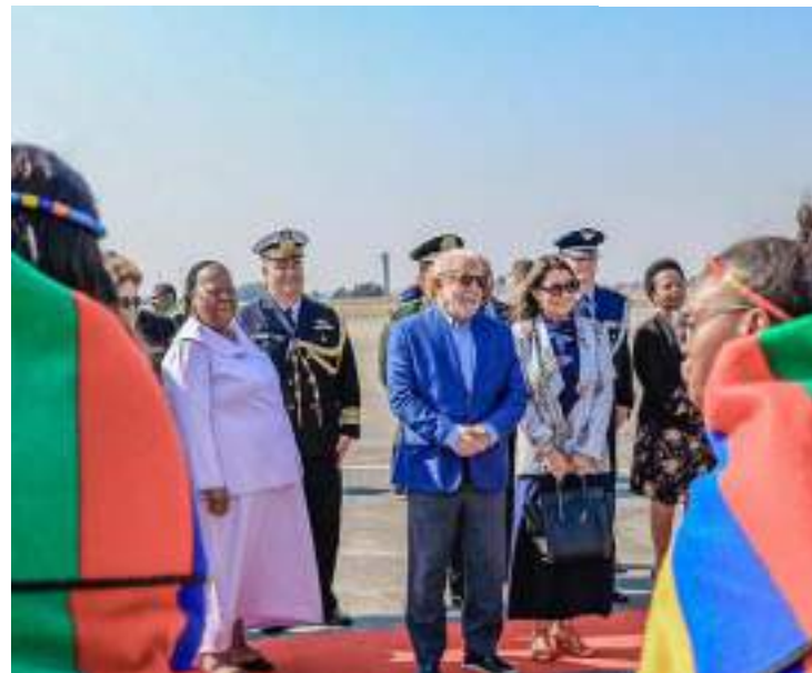
Presidente visitará também Angola e São Tomé e Príncipe

Lula também irá à Assembleia Nacional de Angola para participar de um seminário, onde falará sobre projeto no Vale do Cunene, e de um evento empresarial que deverá ter