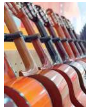
Serão disponibilizadas 170 vagas gratuitas para a população

A implementação da nova unidade do Liceu no Centro Cultural Aníbal Beça é uma iniciativa da Secretaria de Cultura e Economia Criativa em parceria com o Centro de Educação Tecnológica do Amazonas (Cetam), com o objetivo de oferecer gratuitamente cursos direcionados para o desenvolvimento artístico.