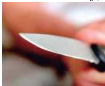
Homem foi atacado e esfaqueado