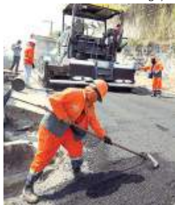
Foram 80 toneladas de massa asfáltica aplicadas

A Prefeitura de Manaus, por meio da Secretaria Municipal de Infraestrutura (Seminf), realiza serviços de recapeamento asfáltico na rua Diacui, na comunidade Mundo Novo, bairro Cidade Nova. A ação faz parte do novo programa “Obras de Verão 2023”, que aplica 80 toneladas de massa asfáltica no trecho.