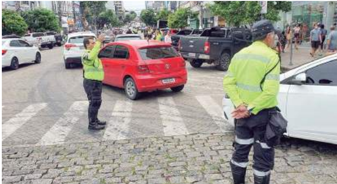
Agentes de trânsito passam a fiscalizar CNH, documento do veículo e a realizar teste de alcoolemia

“Com a aplicação das novas diretrizes, a fiscalização e atuação se tornam ferramentas essenciais para ga-