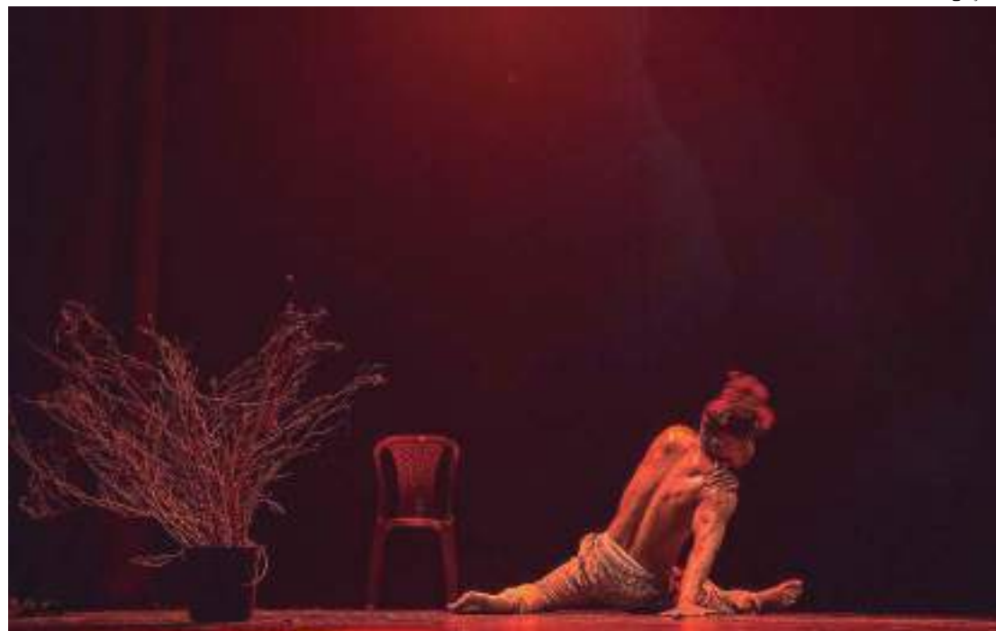
Abertura acontece no dia 26 de agosto no Teatro Amazonas

“A nossa proposta é descentralizar os espetáculos, levar programação para bairros de Manaus e cidades no interior. Entre as atividades estão ainda palestras, oficinas, vivência e diálogos com os contemplados para o festival”, afirma a organizadora. “Vamos homenagear profissionais que contribuíram para a divulgação e valorização da arte a que se dedicam.