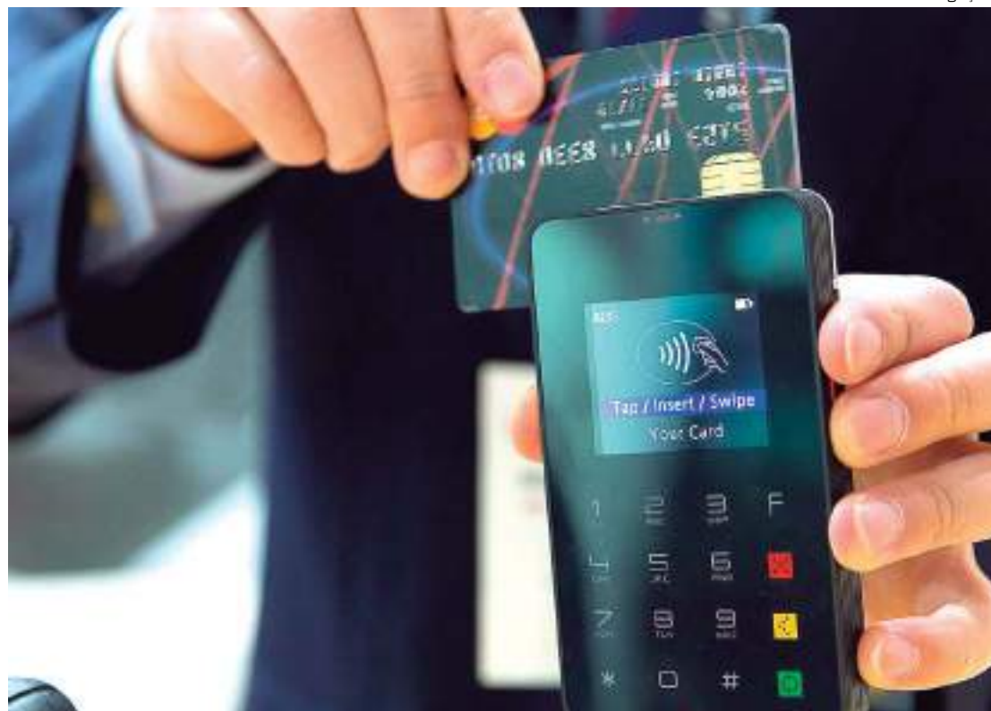
Homem utiliza o cartão de crédito

A Serasa garante à empresa parceria um controle total de privacidade e segurança das informações preenchidas na plataforma, oferece uma trilha de auditoria que dá 100% de transparência e confiabilidade ao novo modelo e ainda disponibiliza um