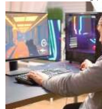
Fã do universo dos jogos eletrônicos

Para conferir os produtos em oferta na Semana Gamer da Info Store basta visitar uma das 11 unidades de Manaus, a loja de Boa Vista ou pelo site www.infostore.com.br . Pelo site, o cliente tem a vantagem de optar pela entrega expressa e receber o produto em até 3 horas.