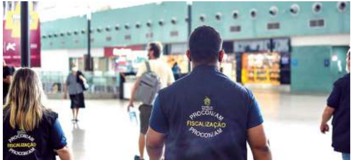
Empresa tem 48 horas para apresentar explicações

“A decisão deve-se à persistência de fatores econômicos e de mercado adversos, relacionados,