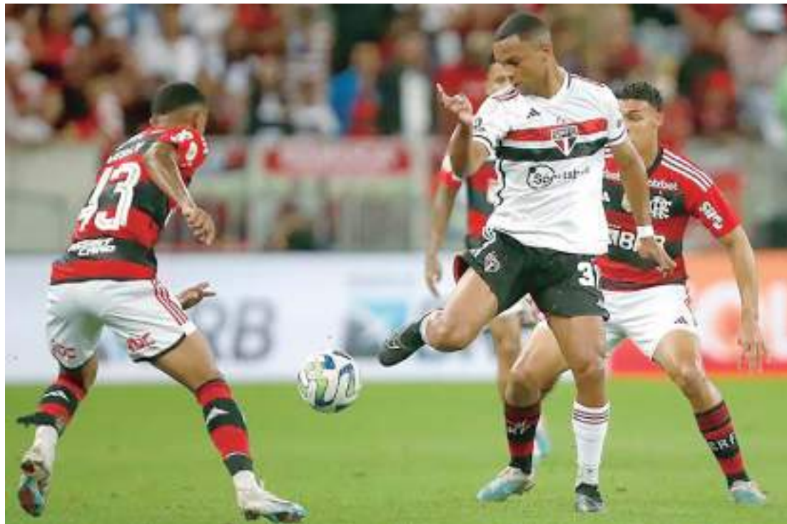
CBF realizou sorteio do mando de campo para final do Copa do Brasil

“O clube não vai a uma final faz 20 anos. É um título que para a vitrine do clube é muito representativo le-