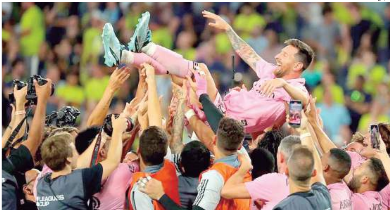
Após chegada de Messi no Inter Miami, time conquistou títulos importantes

aposta em novos contratos de patrocínio para elevar as receitas nos próximos anos. Uma série de parcerias expira no final do ano, permitindo ao clube chegar ao mercado num momento em que seus ativos provavelmente são mais valiosos.