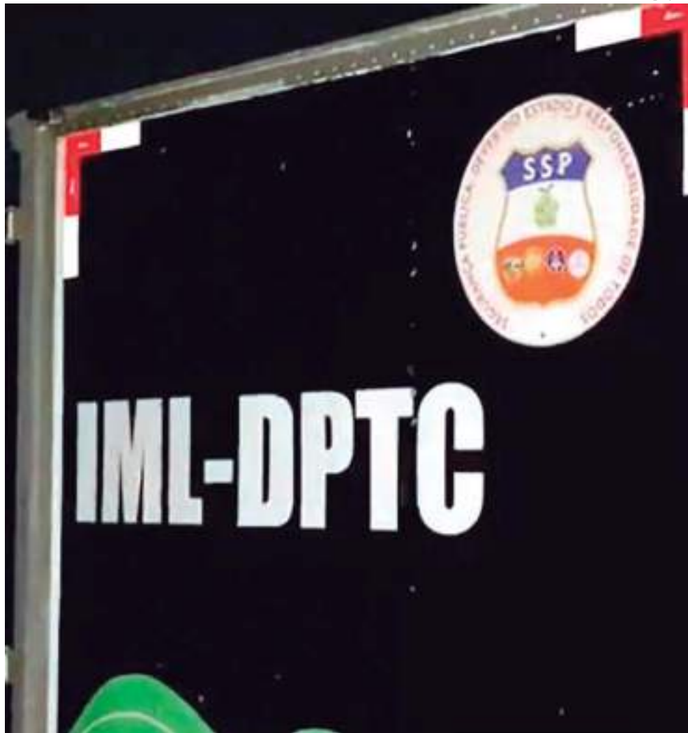
Carro do Instituto Médico Legal retirou o corpo

O corpo foi recolhido e encaminhado à sede do Instituto Médico Legal (IML). Agora, o caso será investigado pela Delegacia Especializada em Homicídios e Sequestros (DEHS).