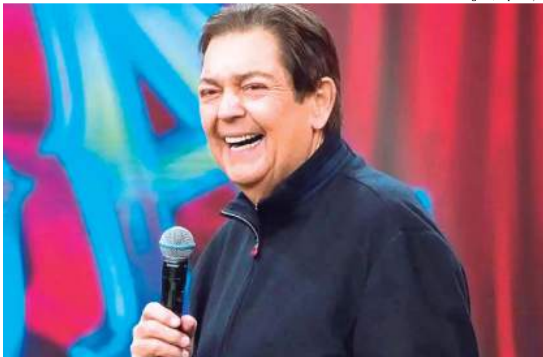
Fausto Silva no programa "Faustão na Band"

Faustão, 73 anos de idade, se recupera da cirurgia de transplante de coração, informou Luciana Cardoso, mulher do apresentador, na manhã desta segunda-feira (28). Ele foi submetido ao procedimento no domingo (27), e estava na fila de espera do SUS para o transplante desde o dia 8 de agosto.