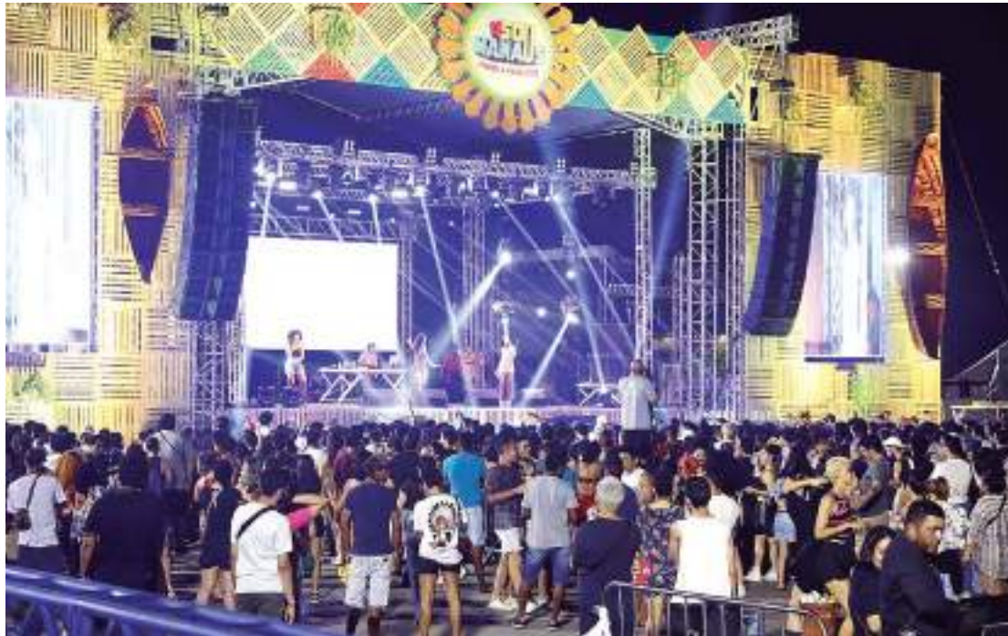
Maioria dos custos será viabilizado pelos patrocinadores do evento