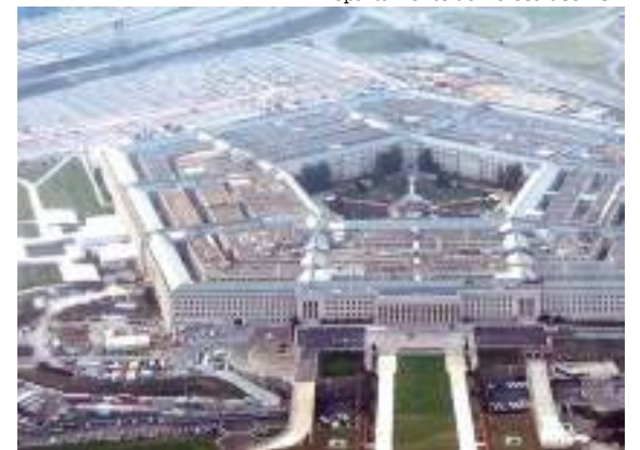
Departamento de Defesa dos EUA