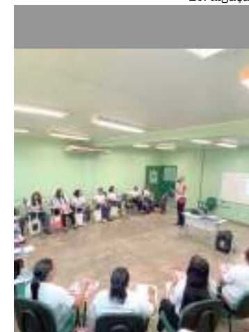
Projeto capacita agentes na assistência de gestantes e crianças

mílias em municípios e gigantescas áreas de proteção ambiental na Amazônia, como as Reservas de Desenvolvimento Mamirauá e Amanã e a Floresta de Maués. Inspirado na iniciativa, em 2016, o Governo do Estado do Amazonas instituiu o Programa Primeira Infância Amazônica (PIA), que com o objetivo garantir o desenvolvimento físico, psicológico, intelectual e social da criança.