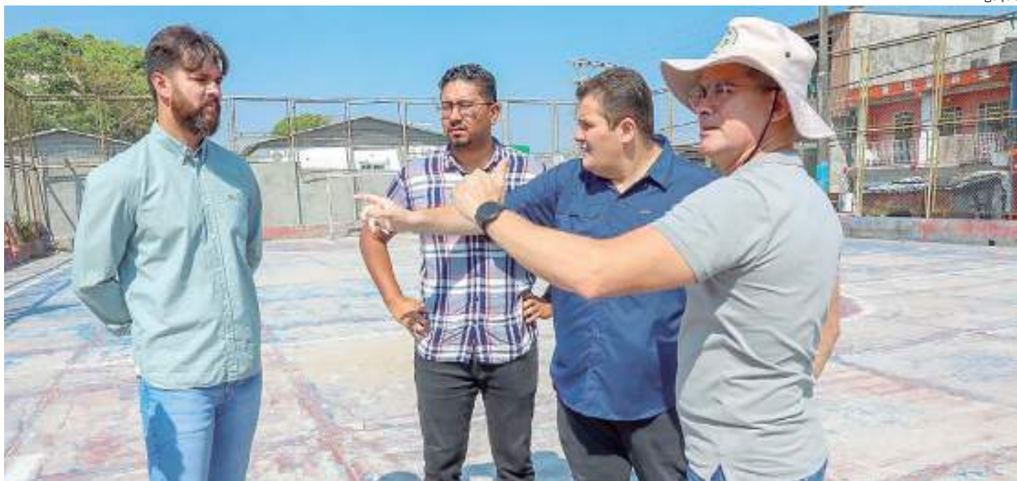
Entre as ações, está a reinauguração da Unidade Básica de Saúde (UBS) Geraldo Magela

“Nós estamos recuperando a feira do Armando Mendes, as ruas, e até o