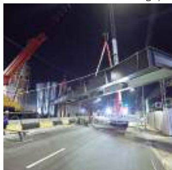
Projeto, que visa desafogar o trânsito na área

A Prefeitura de Manaus, via Secretaria Municipal de Infraestrutura (Seminf), instalou, na madrugada de domingo, (27), uma viga metálica de 20 toneladas que vai servir de base para a nova passarela na avenida Ephigênio Salles, no trecho em frente ao Tribunal de Contas do Estado do Amazonas (TCE-AM). O projeto, que visa desafogar o trânsito na área,