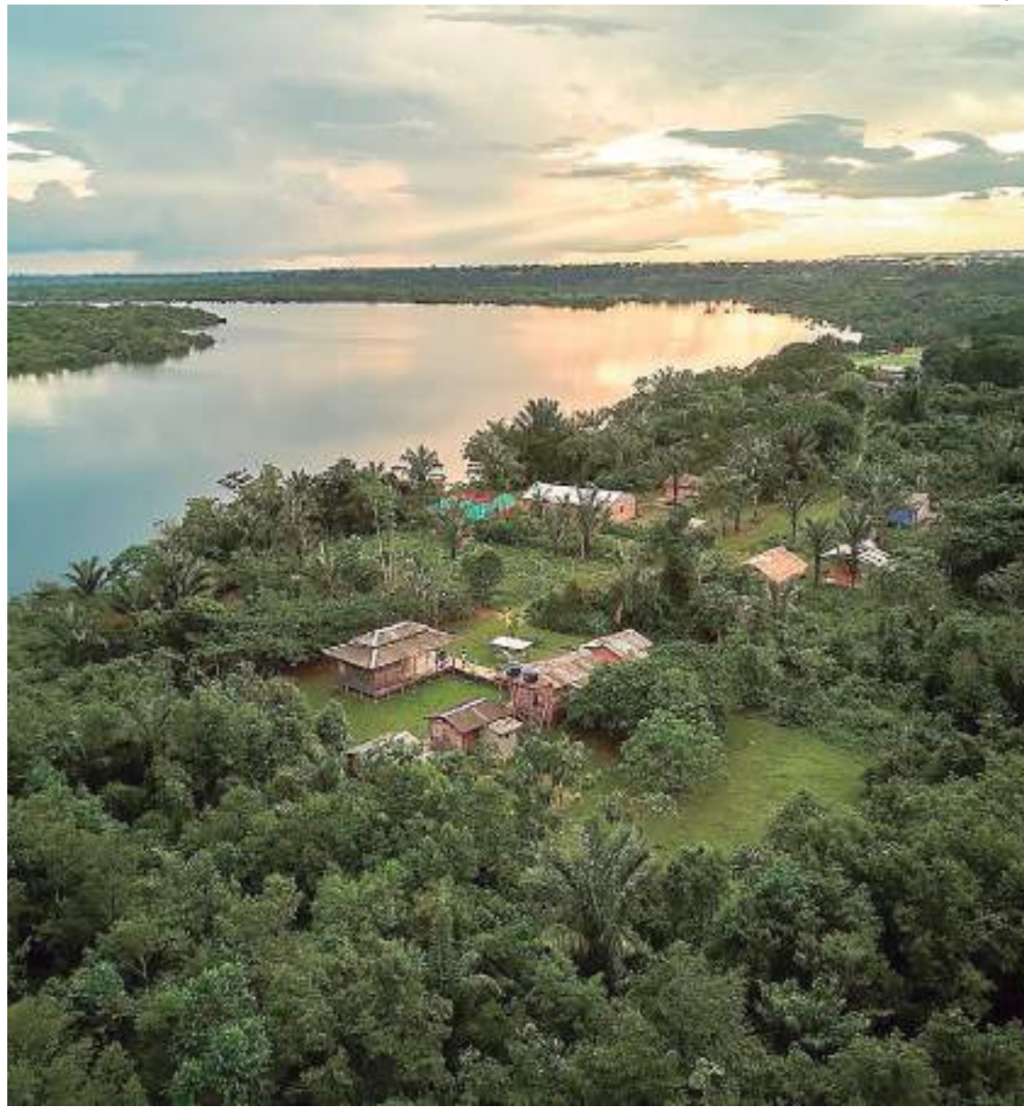
Evento acontece em Belém nos dias 8 e 9 de agosto

A programação está organizada em plenárias, mesas de discussões abertas para toda sociedade, sobre temas prioritários para a ges-