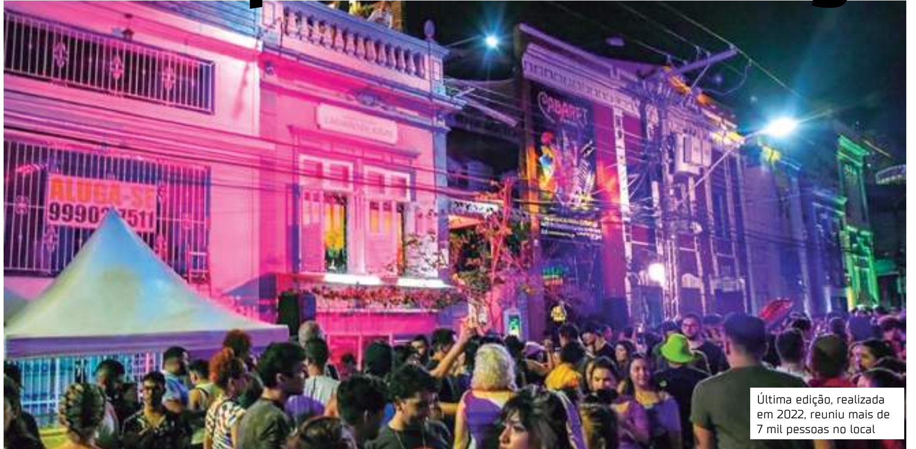
Última edição, realizada em 2022, reuniu mais de 7 mil pessoas no local

O 'Te Encontro na Barroso' é promovido pelo Centro Cultural Casarão de Ideias (CCCI), a partir do Termo de Fomento nº 35/2023, da Secretaria de Estado de Cultura e Economia Criativa (Sec), e da emenda de bancada nº 19/2023, do deputado estadual Wilker Barreto.