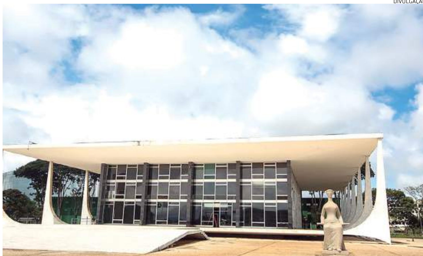
O tribunal, ao longo da história tem revisado e proibido normas que chancelem violência contra a mulher

A maioria de votos contra a tese foi formada na