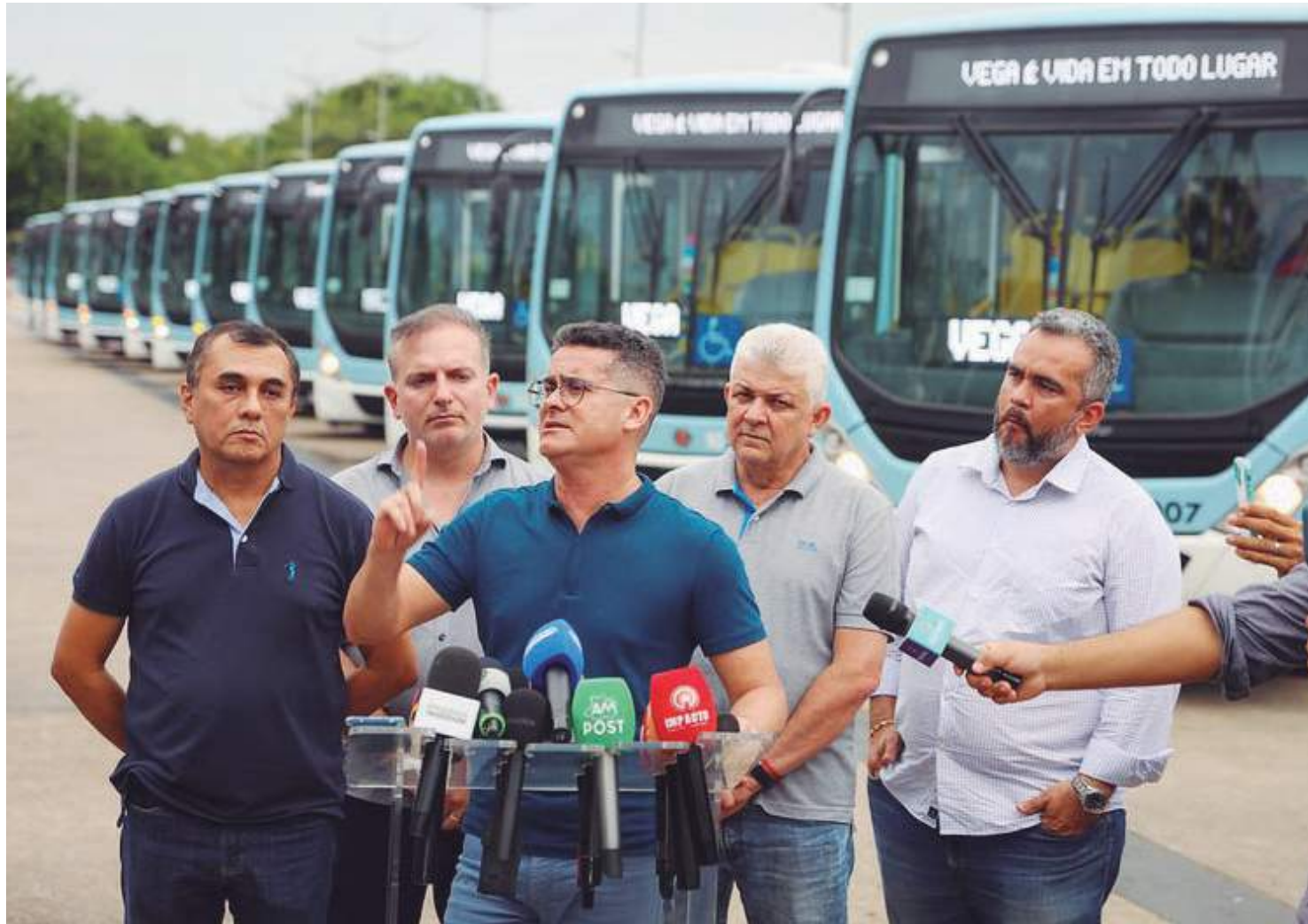
Prefeito destaca que contínua renovação demonstra o compromisso da administração em melhorar a qualidade do transporte público

“Quando assumimos a prefeitura, não tínhamos ônibus com ar-condicionado. Hoje, temos mais de 200. Entregamos mais 14 de um total de 150 ônibus que entregaremos até o final deste ano. Vale ressaltar que destes, 12 serão elétricos e já devem chegar no próximo mês em nossa cidade. Esses ônibus que estamos en-