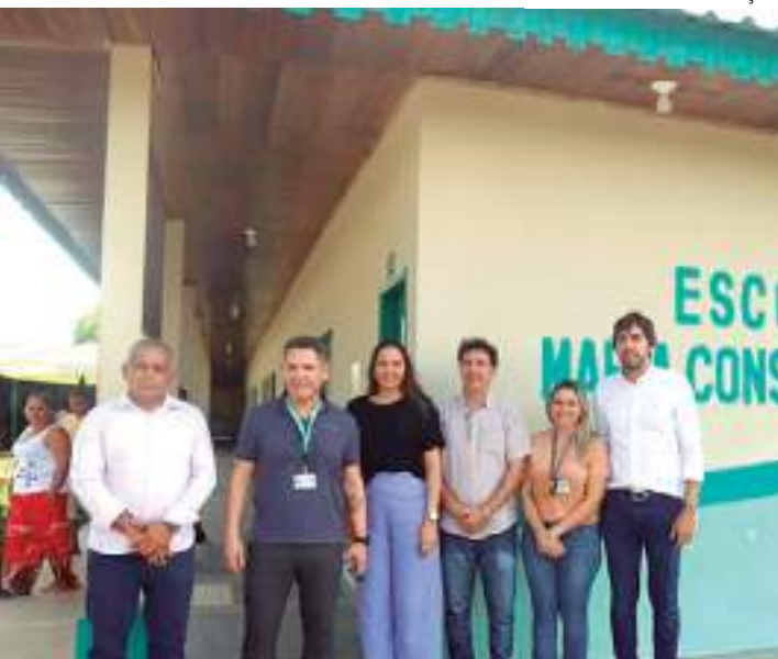
Implementação do polo rural trará série de benefícios para a comunidade

"Fico muito feliz em ter sido o proponente dessa matéria. Em breve, Novo Remanso será a primeira comunidade rural a receber cursos da Universidade Estadual do Amazonas, criada há mais de 20 anos com o intuito de interiorizar cada vez mais a educação