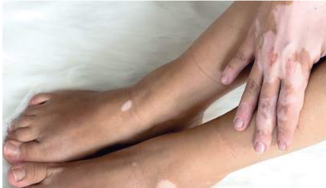
Segundo a Fundação Hospitalar Alfredo da Matta já são mais de 100 de casos em 2023

Essa condição se caracteriza por manchas brancas de tamanho variável na pele, resultando em uma diminuição da cor nessas áreas. O vitiligo pode afetar pessoas de todas as idades, raças e gêneros, e embora não seja uma condição grave em termos de saúde física, pode ter um impacto emocional significativo, afetando a