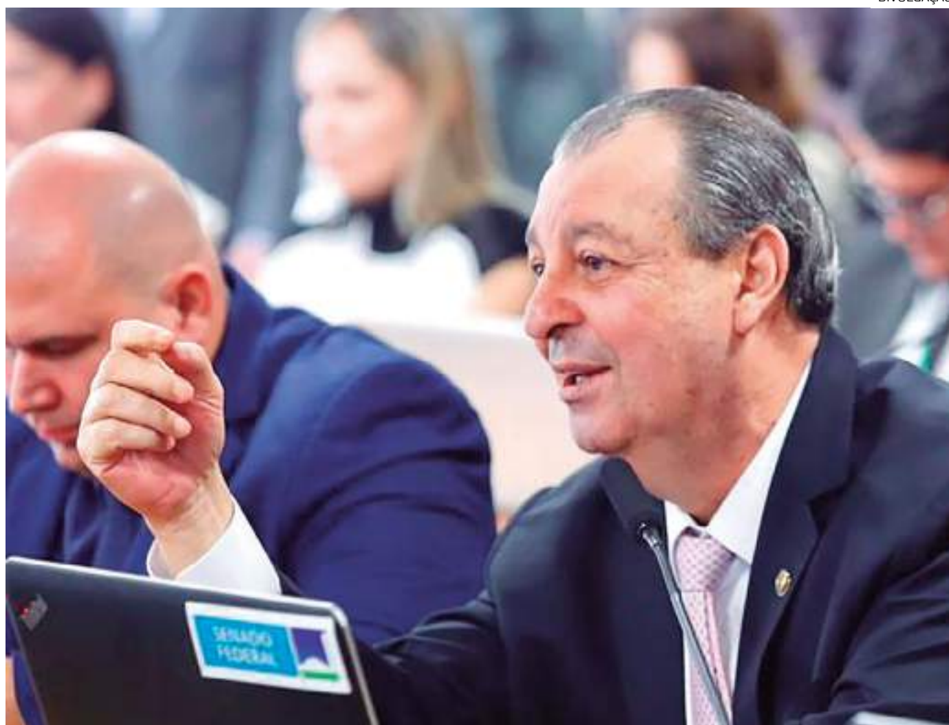
Senador destacou a importância de se destinar recursos para atender emergências decorrentes de eventos adversos

O Senador do Amazonas destacou a importância de se destinar recursos financeiros para atender emergências decorrentes de eventos adversos, como enchentes, deslizamentos de terra e desastres ambientais, mas alertou que é preciso pensar em