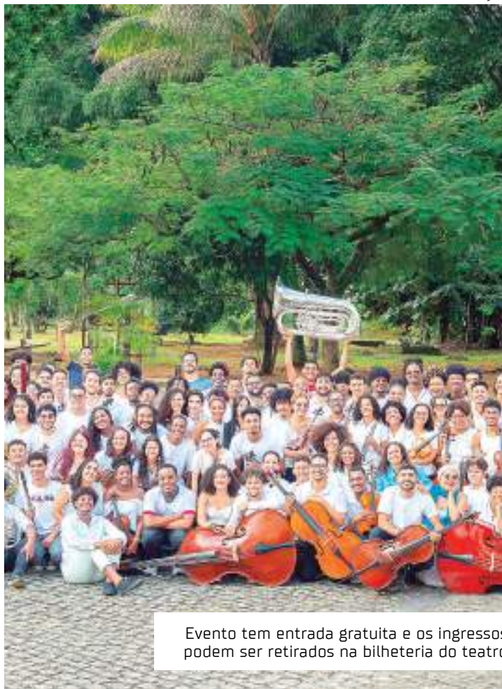
Evento tem entrada gratuita e os ingressos podem ser retirados na bilheteria do teatro

Esta será a primeira turnê nacional do Coro Juvenil, principal formação de canto coral do NEOJIBA, e a primeira vez que coro e orques-