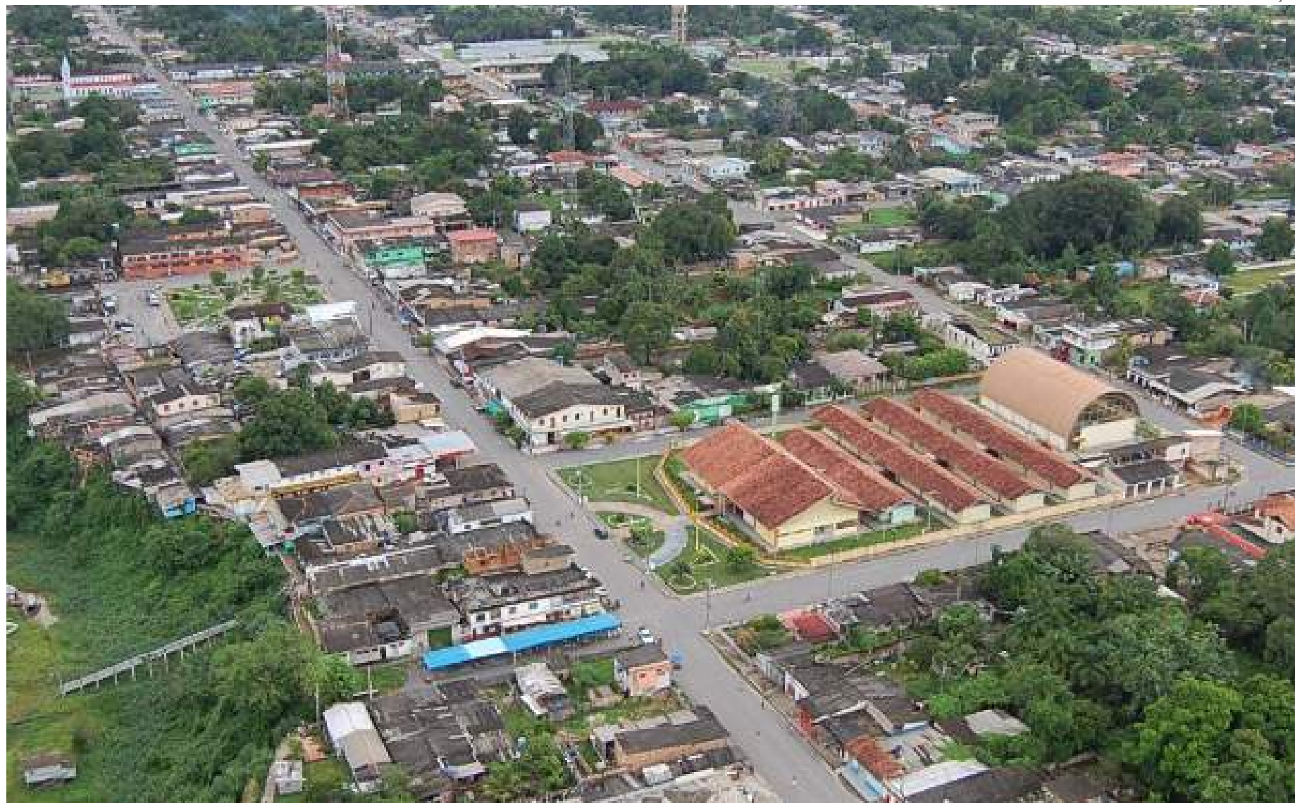
Obras vão impactar na melhoria dos serviços de transporte público, com as ruas recuperadas, e de qualidade de vida da população

O Governo do Amazonas vai investir R$ 5 milhões e a contrapartida do municí-