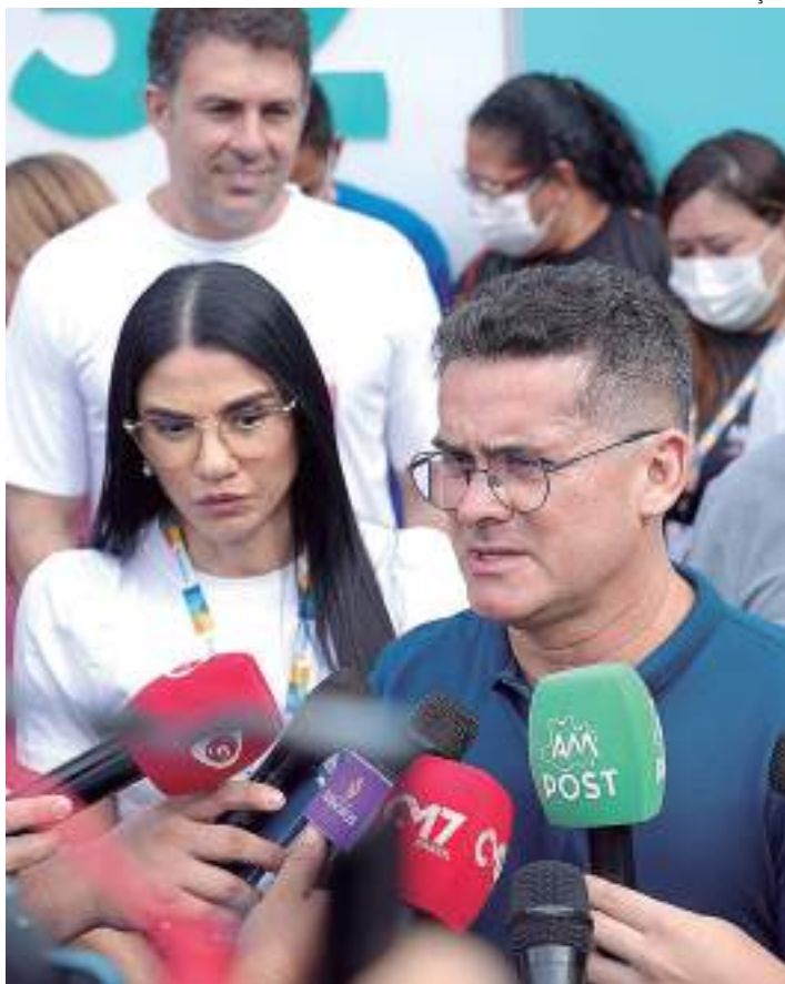
Com essa entrega, sobe para 40 o total de unidades revitalizadas

"Nesta semana vamos entregar oito unidades de saúde da família. Hoje, as entregas aconteceram na zona Leste. Assim, a gente chega a 40 unidades deste porte reformadas na cidade de Manaus, além das UBSs tipo 4 que estamos construindo e vamos entregar muito em breve. Com isso, nós damos uma melhor condição para os nossos