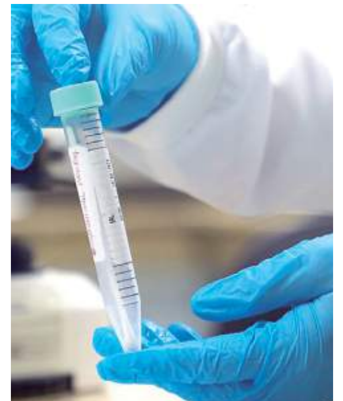
Monitoramento segue sendo realizado pela FVS-RCP

As informações são atualizadas pela FVS-RCP e estão disponíveis no site da Fundação, no endereço www.fvs.am.gov.br .