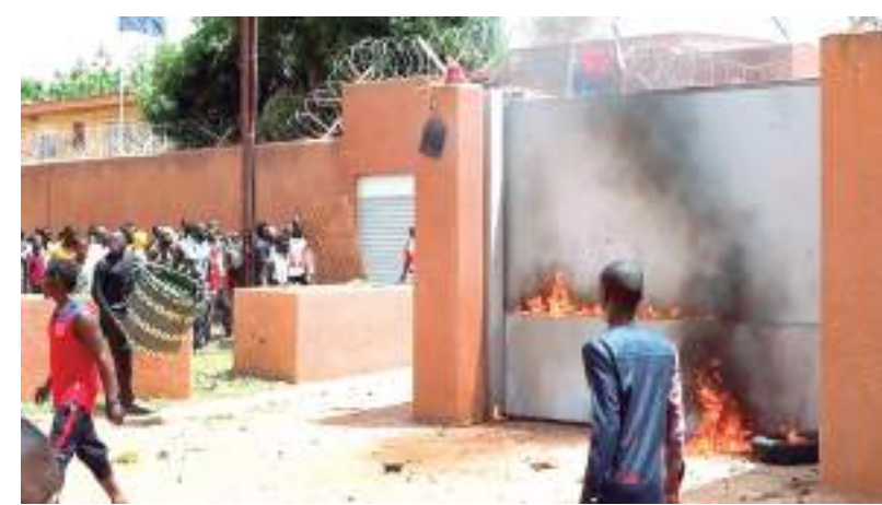
Manifestantes pró-junta diante de embaixada francesa no Níger