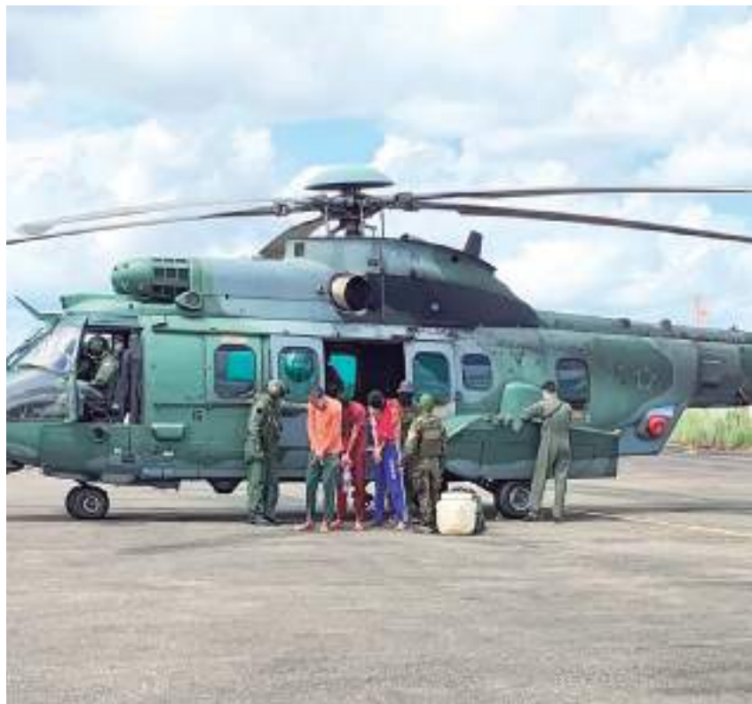
Detidos são venezuelanos e têm entre 23 e 33 anos de idade