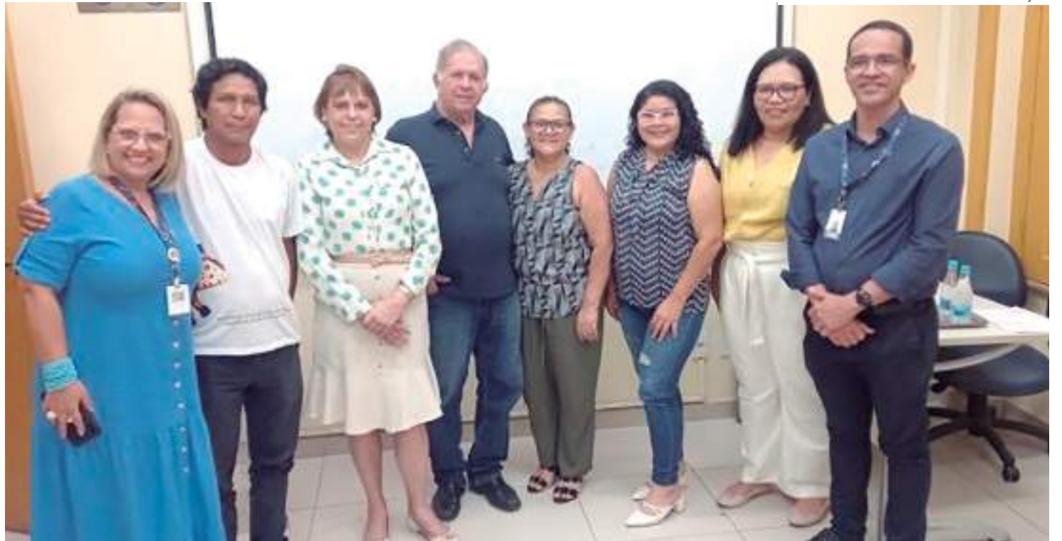
Servidores do Senac Amazonas e do restaurante Casa de Comida Indígena Biatuwi firmam parceria para o projeto-piloto

“Ao promover a culinária indígena, essas iniciativas, como a incubadora, ajudam a preservar e resgatar os saberes tradicionais, receitas e técnicas culinárias transmitidas ao longo de gerações dentro das comunidades indígenas. Essa valorização é fundamental para manter viva a identidade cultural desses povos. O reconhecimento e a promoção da culinária indígena em uma incubadora gastronômica e restaurante aberto ao público podem ser uma forma de garantir maior representatividade e inclusão das culturas indígenas na sociedade em geral. Isso ajuda a quebrar preconceitos, permitindo que essas culturas sejam apreciadas e respeitadas”, contextualiza.