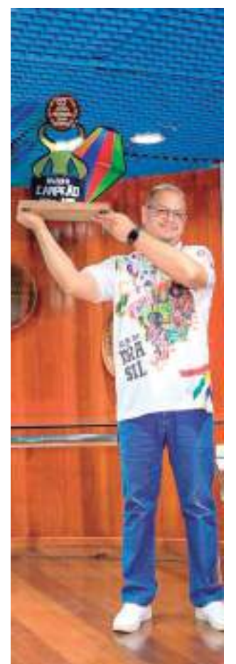
Corre Campo é hexacampeão na categoria Master A