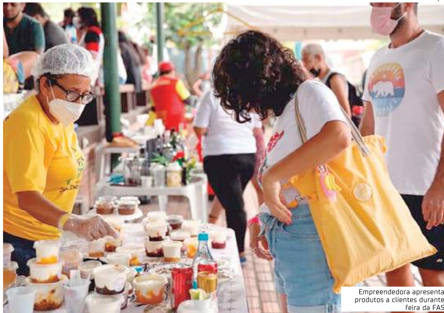
Empreendedora apresenta produtos a clientes durante feira da FAS