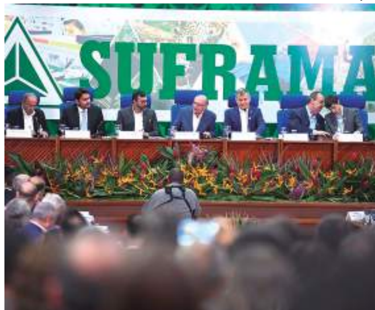
Conselho de Administração da Suframa