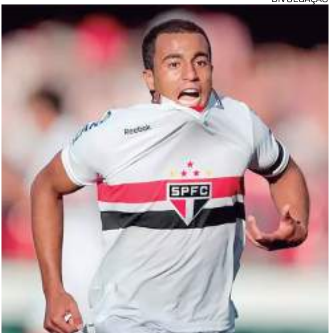
Atacante Lucas Moura retorna ao time que o revelou nos anos de 2010