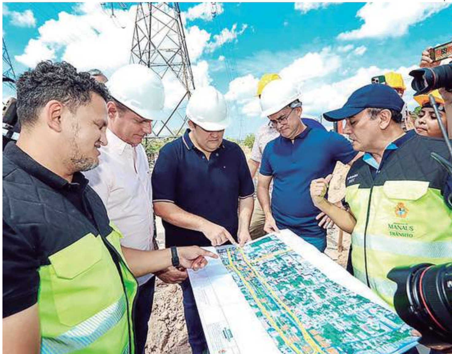
Prazo de entrega está seis meses adiantado e previsto para o fim deste ano

No local, as equipes irão avançar para a perfuração de mais 71 estacas, que serão colocadas na avenida Barão do Rio Branco, totalizando