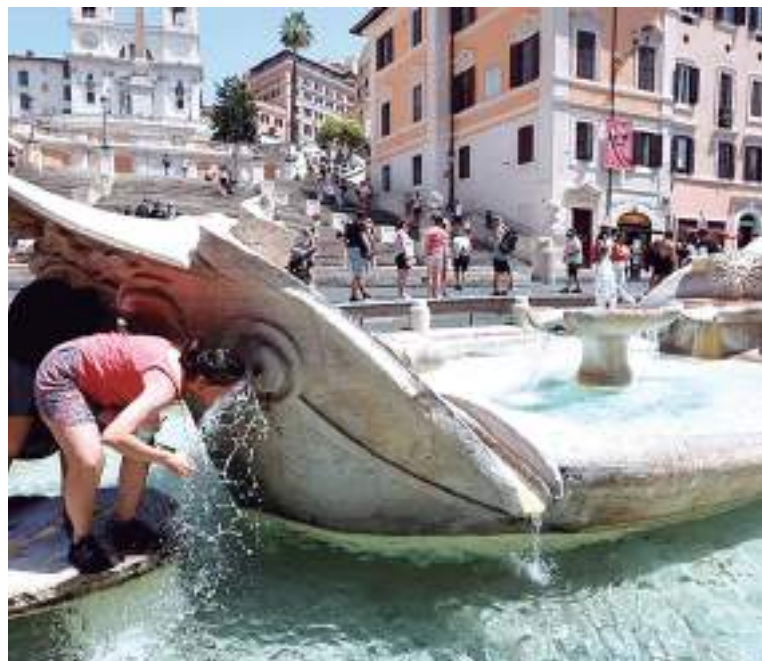
Especialistas alertam consequências do aquecimento global no verão