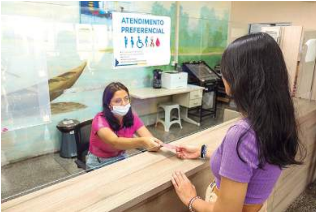
Determinação está prevista na Lei 14.626, de 2023

da lei que amplia a prioridade aos doadores, a preferência nas filas vale depois de outros grupos prioritários: deficientes ou com mobilidade reduzida, idosos, gestantes, lactantes, pessoas com crianças, pessoas obesas e autistas.