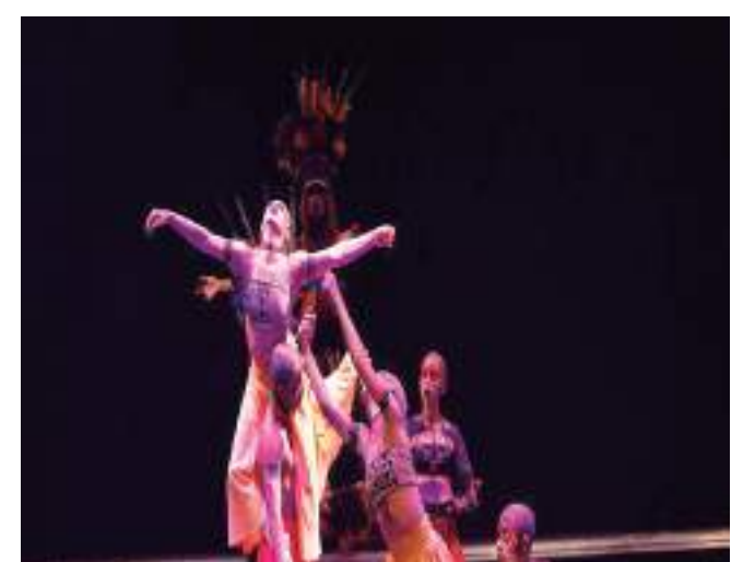
Sucesso do 1º circuito leva a apresentação para outros estados

O espetáculo foi montado a partir de uma pesquisa histórica de obras do escritor amazonense Mário Ypiranga, que descreveu, na década de 30 do século passado, os costumes e tradições da etnia Arara, localizada no Estado do Pará. A montagem apresenta desde a criação do mundo através da cosmologia indígena até os rituais dos povos originários, como o trabalho feminino, o ritual de iniciação de homens e mulheres, a luta dos guerreiros, finalizando com a Dança do Sol.