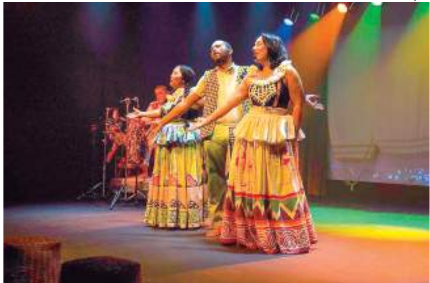
Evento tem como objetivo promover a valorização de produções artísticas

Durante oito dias, o Anfiteatro do Sesc, Festival Folclórico do Sesc, Casarão de Ideias e a Escola de Teatro Interarte serão palco dessas produções artísticas de diversos estados que compõem a Amazônia Legal, como Amapá, Roraima, Acre, Piauí, Rondônia, Tocantins e Mato Grosso.