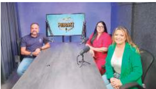
Siga o canal do Programa Qualidade Amazonas no YouTube

A Visteon Amazonas Ltda. é uma empresa em Brasil, com o escritório principal em Manaus. Opera no setor Manufatura de outros Equipamentos e componentes eletrônicos sortidos. A empresa foi estabelecida em 29 de julho de 1998.