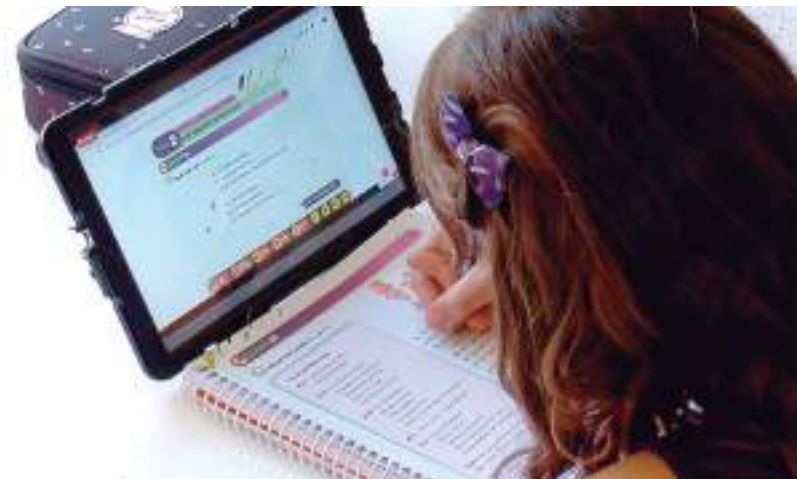
Objetivo é contratar serviços de internet nas escolas