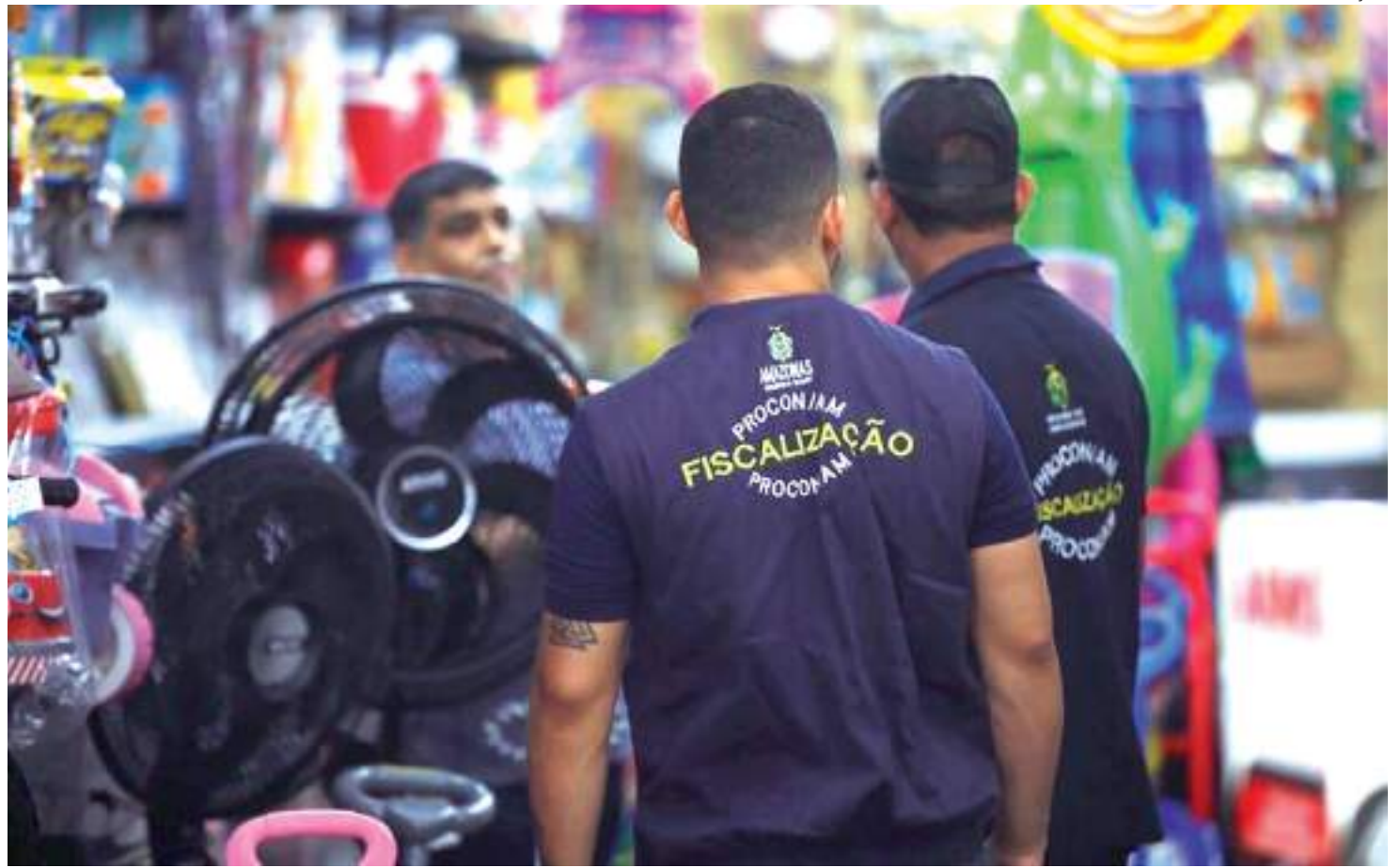
Reclamações podem ser realizadas por meio do site: www.procon.am.gov.br

- Não pode ser exigido um valor mínimo para a utilização do cartão de crédito. Entre-