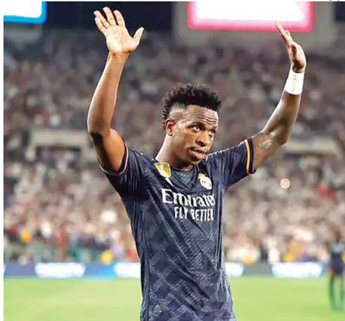
Atacante Vinícius Junior sofreu racismo em jogo do Campeonato Espanhol