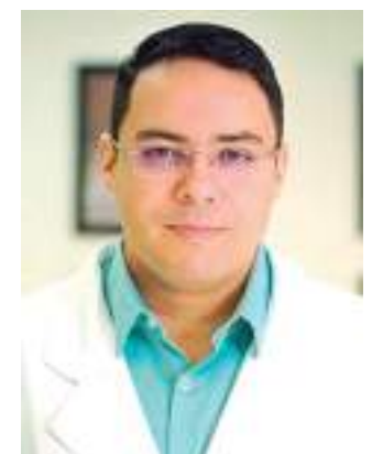
Em caso de necessidade procure imediatamente um especialista

Qualquer sinal de alteração nos olhos procure imediatamente um especialista.