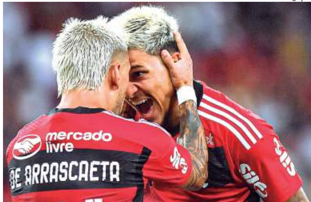
Arrascaeta e Pedro estão na lista dos escolhidos pelos times árabes