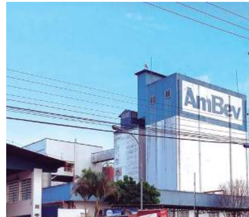
Unidade da empresa de bebidas em Manaus