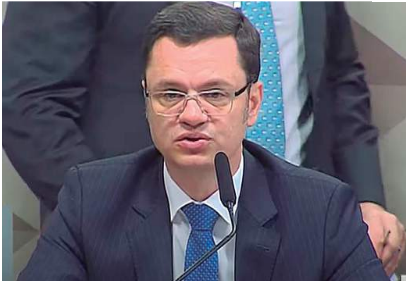
Torres é um dos investigados no inquérito aberto no STF para apurar possíveis autoridades omissas

Torres afirmou ainda à CPI que houve “falha grave” na execução do protocolo de ações definido pela Secretaria da Segurança Pública dois dias antes dos ataques, em 6 de janeiro, e que só viajou para os Estados Unidos depois de enviar o plano a todos os envolvidos.