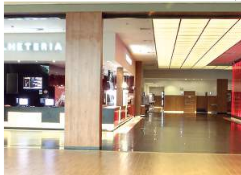
Para comprar ingressos acesse: www.ingresso.com .