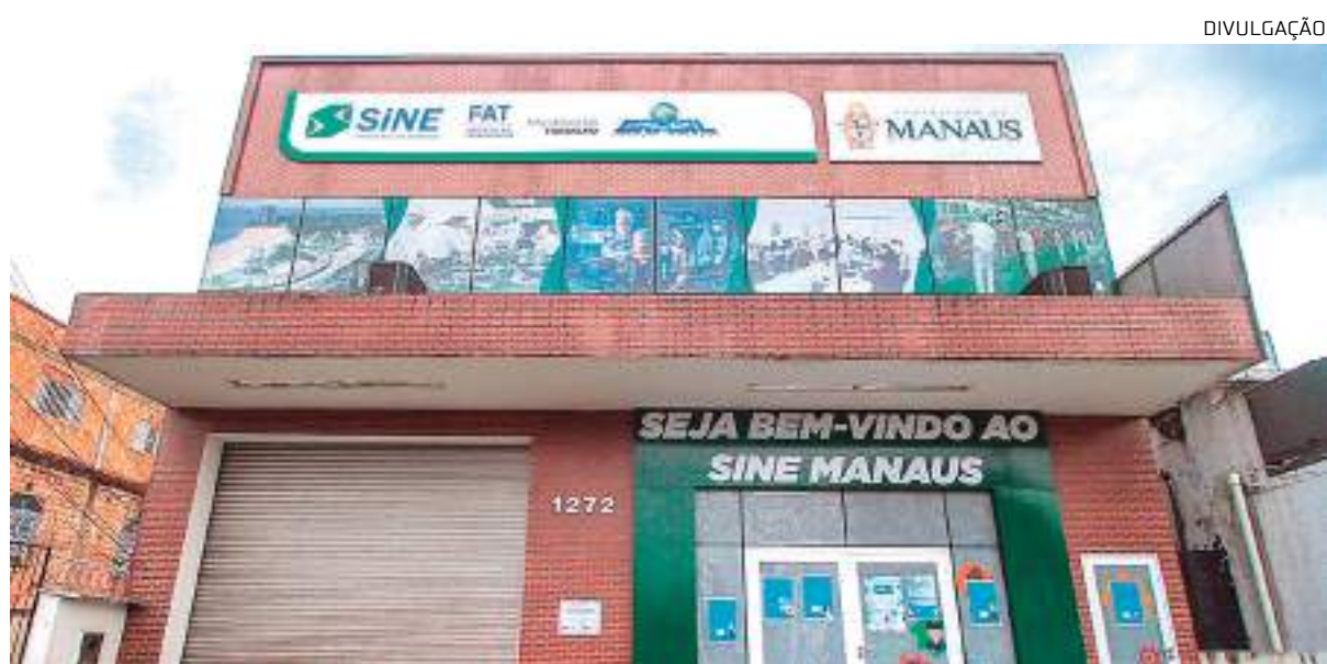
Posto do Sine Manaus, na avenida Constantino Nery