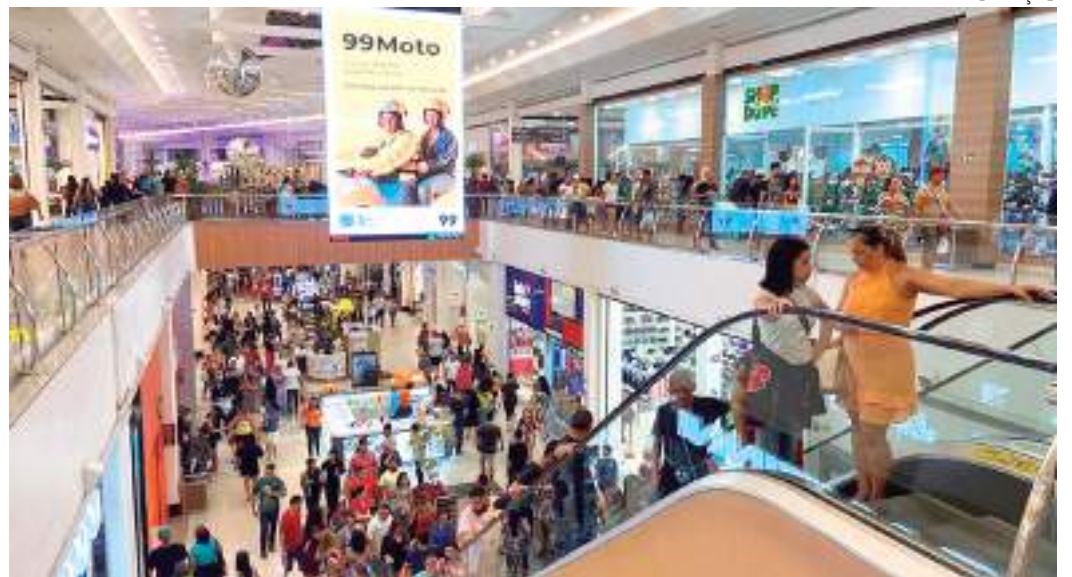
Centro de compras do Amazonas Shopping

No Amazonas Shopping, além de comprar o presente, ainda é possível concorrer a um carro Peugeot 208 Style. Para isso, a cada R$ 300 em compras, os clientes têm direito a um cupom para participar do sorteio. O cliente deve baixar o aplicativo “Amazonas Shopping”, na Play Store ou Apple Store, e acessar a aba “Promoções”. Em seguida, basta clicar em participar, na opção Amazonas Shopping, aceitar os termos de uso e escolher enviar notas. Para finalizar,