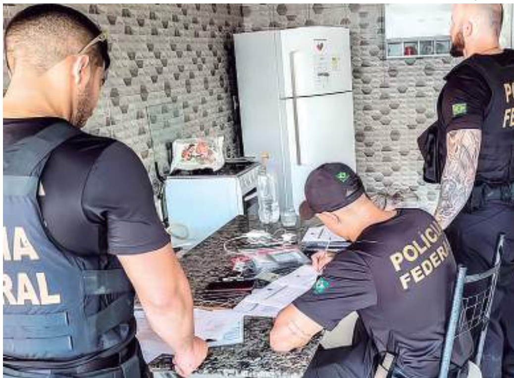
Agentes da PF em operação, no Pará

O Ibama promoveu, juntamente com as Forças Armadas, Polícia Federal e Fundação Nacional dos Povos Indígenas (Funai), ação conjunta de combate ao garimpo ilegal na região oeste do Amazonas, onde está localizada a Terra Indígena Vale do Javari, na tríplex fronteira que liga Brasil, Peru e Colômbia. 22 embarcações usadas para