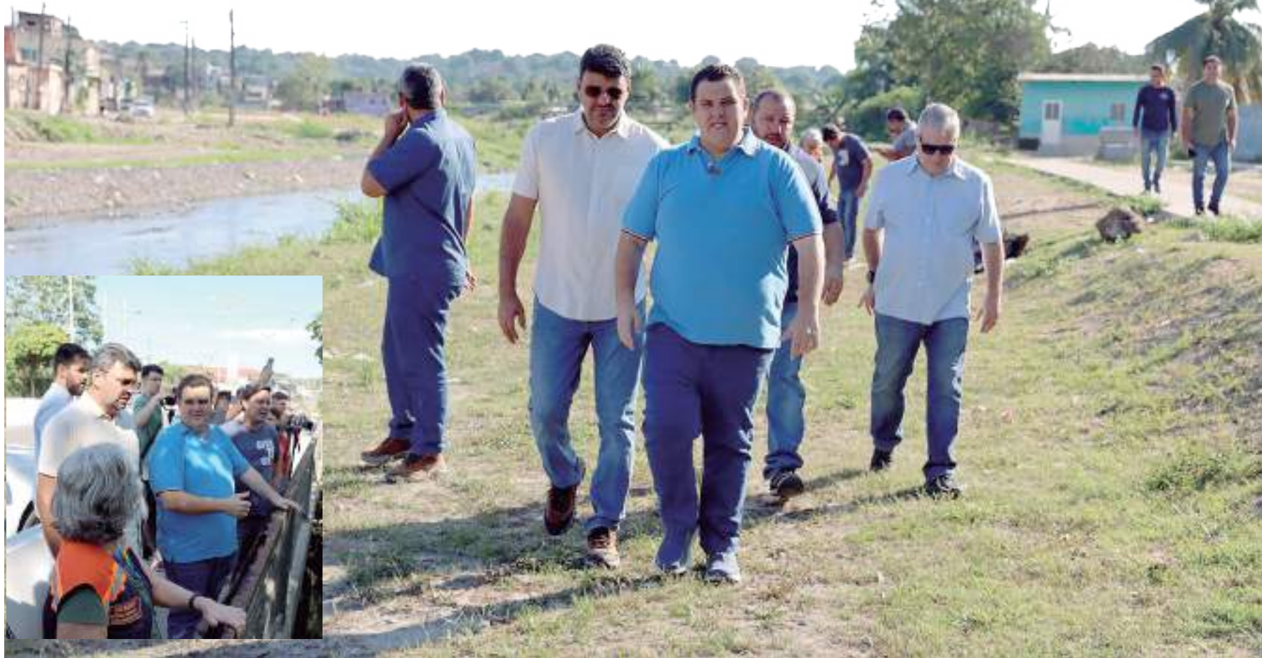
Ação é coordenada pela Unidade Executora do Programa de Infraestrutura Urbana e Ambiental de Manaus