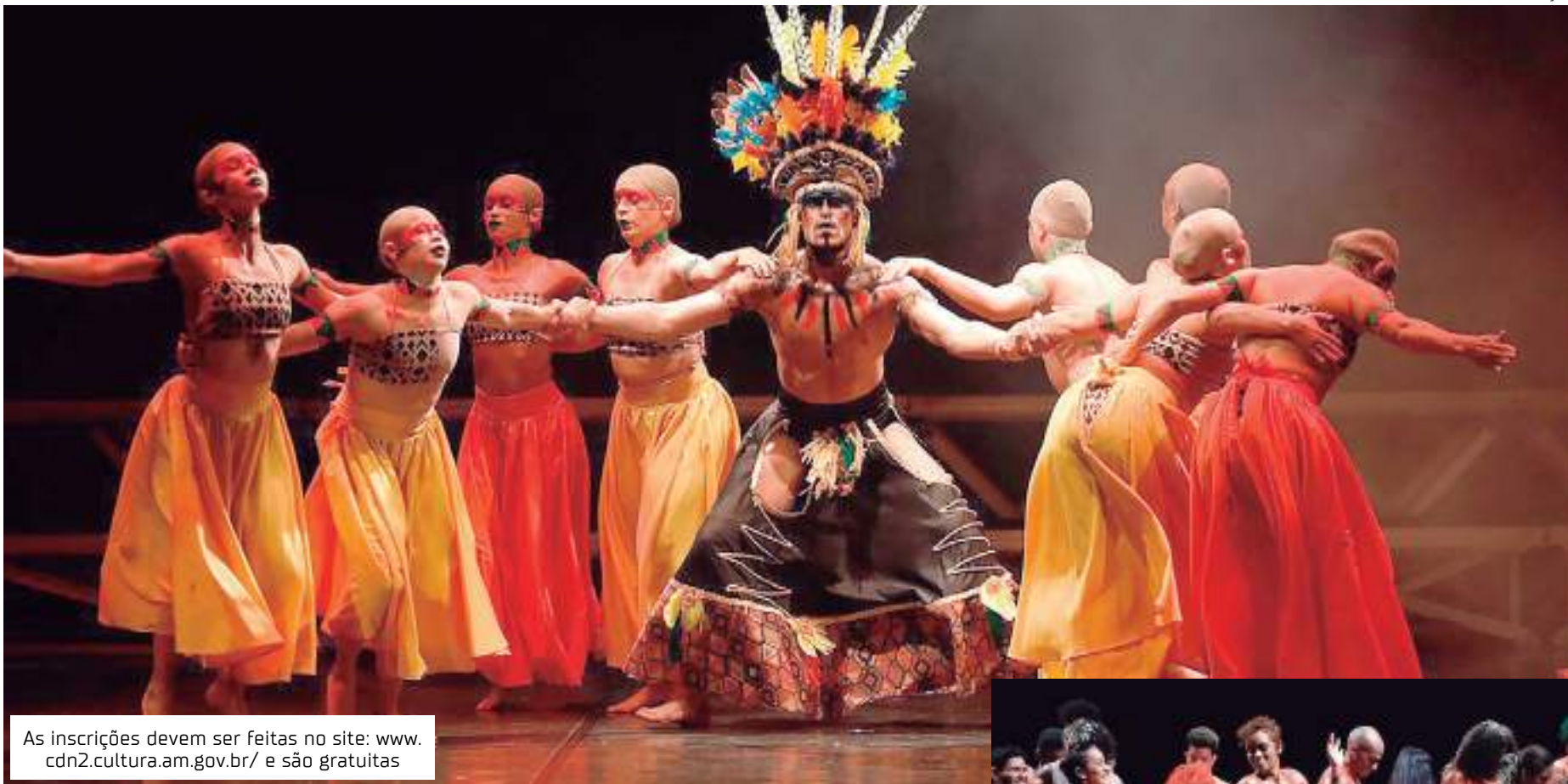
As inscrições devem ser feitas no site: www.cdn2.cultura.am.gov.br/ e são gratuitas

dos os integrantes e portfólio do proponente.