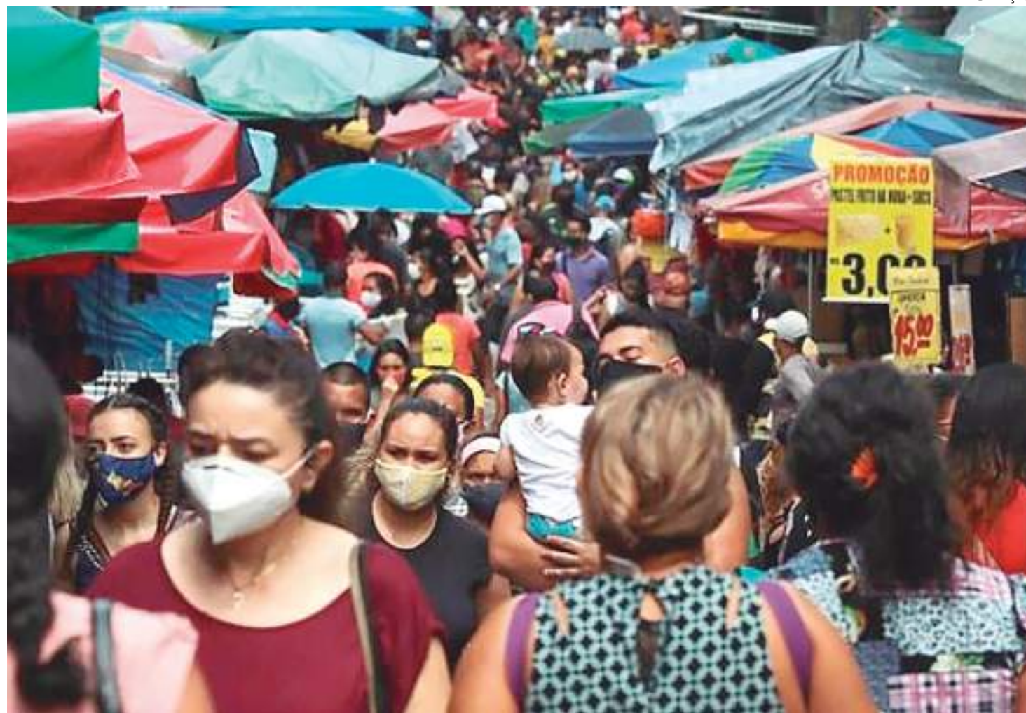
Consumidores fazem compras no Centro Histórico de Manaus

Apesar das reduções, a receita bruta do Amazonas