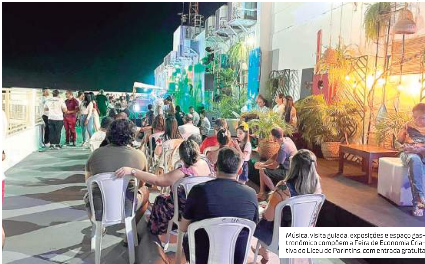
Música, visita guiada, exposições e espaço gastronômico compõem a Feira de Economia Criativa do Liceu de Parintins, com entrada gratuita

A feira celebra os 10 anos de atuação do Liceu de Artes e Ofício Claudio Santoro no município e os 35 anos de fundação do Bumbódromo, realizada sempre das 15h às 20h, aos sábados, até o dia 25 de novembro.