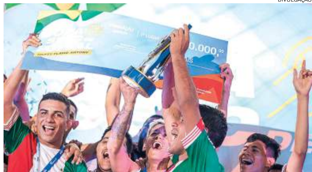
Sesc Amazonas realiza Copa de Futsal a partir do dia 30 de agosto