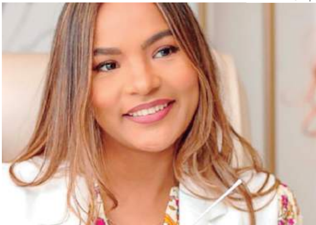
5% a 17% da população feminina mundial sofre deste distúrbio

O vaginismo caracteriza-se pela contração involuntária dos músculos internos da vagina, pode ser classificado como primária quando nunca houve penetração parcial ou total na vagina, e secundária quando já ocor-