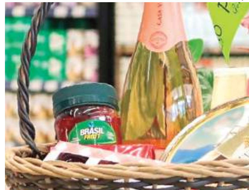
Cesta com vinhos selecionados de brinde