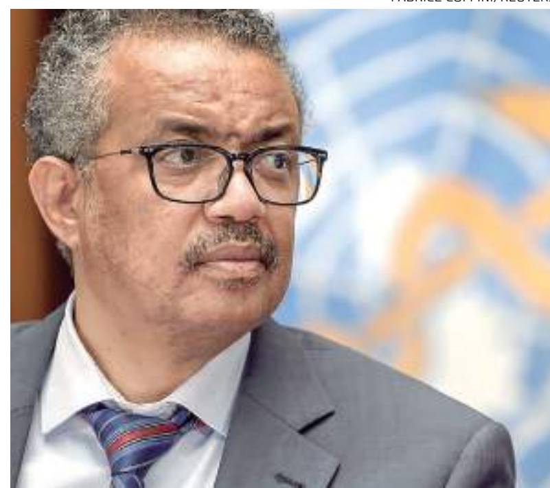
Tedros Adhanom ressalta a importância de rastrear variante do coronavírus