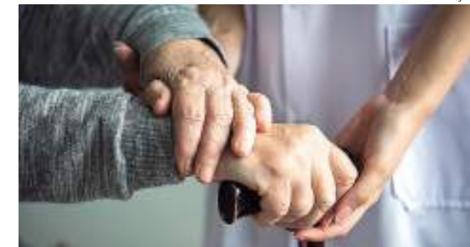
Estudo mostra aumento na parcela da população idosa no país

"A dificuldade no manejo diário com diversas necessidades dos idosos faz com que a família busque profissionais capacitados de conhecimento técnico específico".