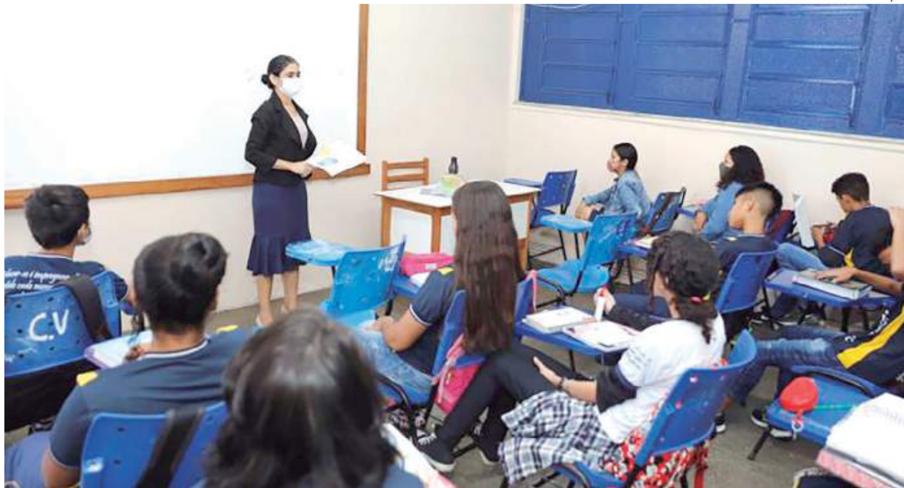
Os recursos do Fundef aos profissionais da educação do Amazonas são resultado da Ação Civil Originária nº 660, ajuizada pelo Estado

No total, 16.373 servidores que estão com ma-