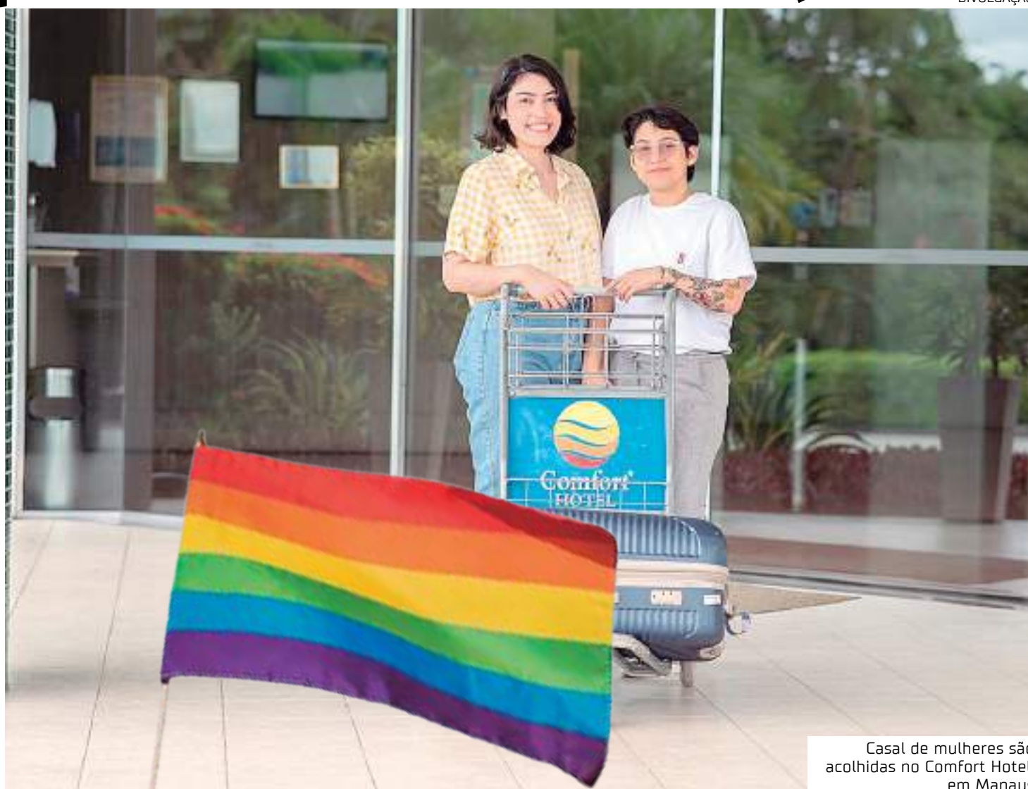
Casal de mulheres são acolhidas no Comfort Hotel, em Manaus