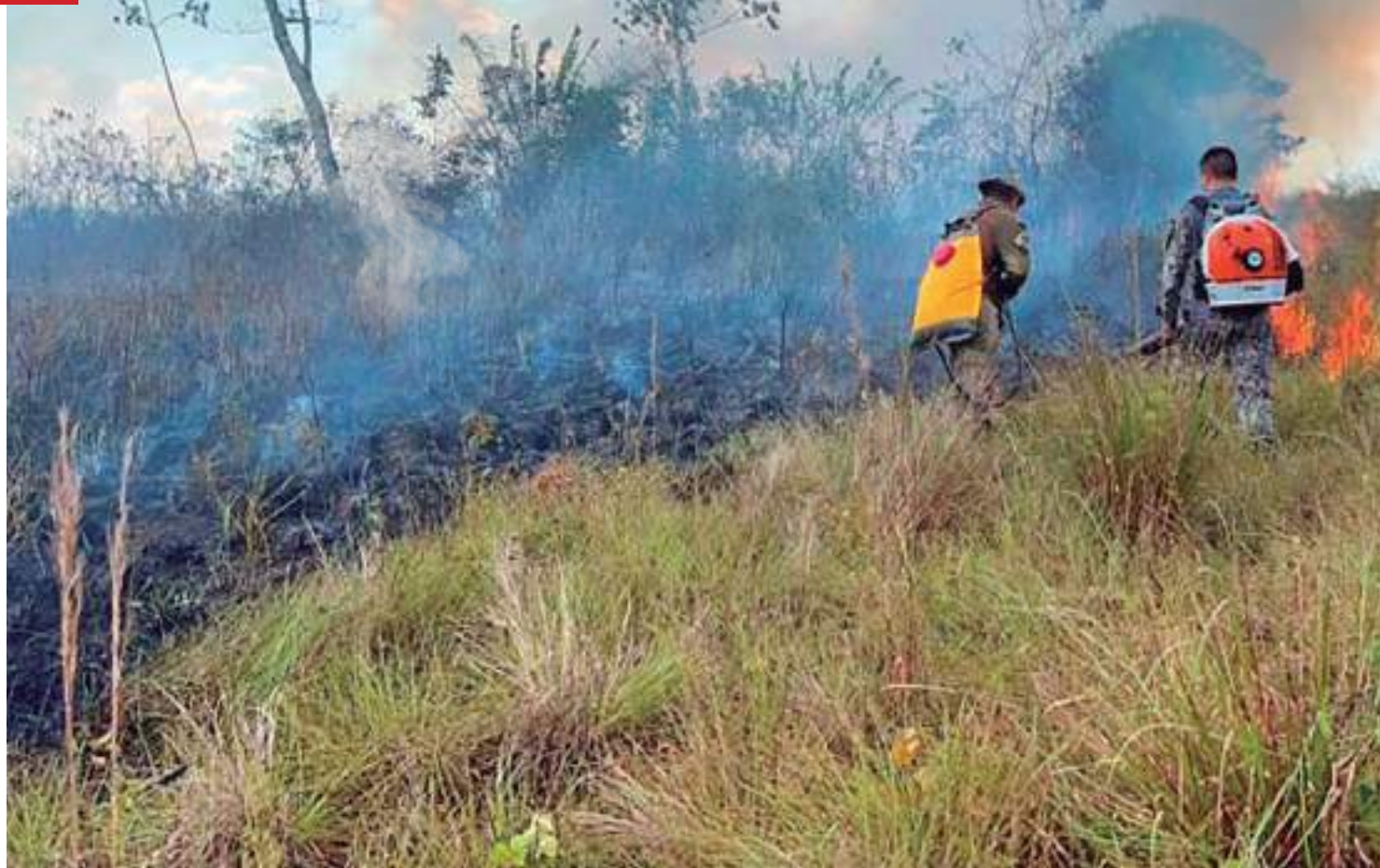
Dados correspondem ao período de 12 de julho a 8 de agosto

De acordo com o comandante-geral do CBMAM, coronel Orleilson Ximenes Muniz, na terça-feira (08), a corporação realizou a troca de fase da operação, com retorno dos bombeiros que estavam atuando nos cinco municípios, desde julho, e envio de novas equipes para a segunda fase. "Nosso trabalho tem