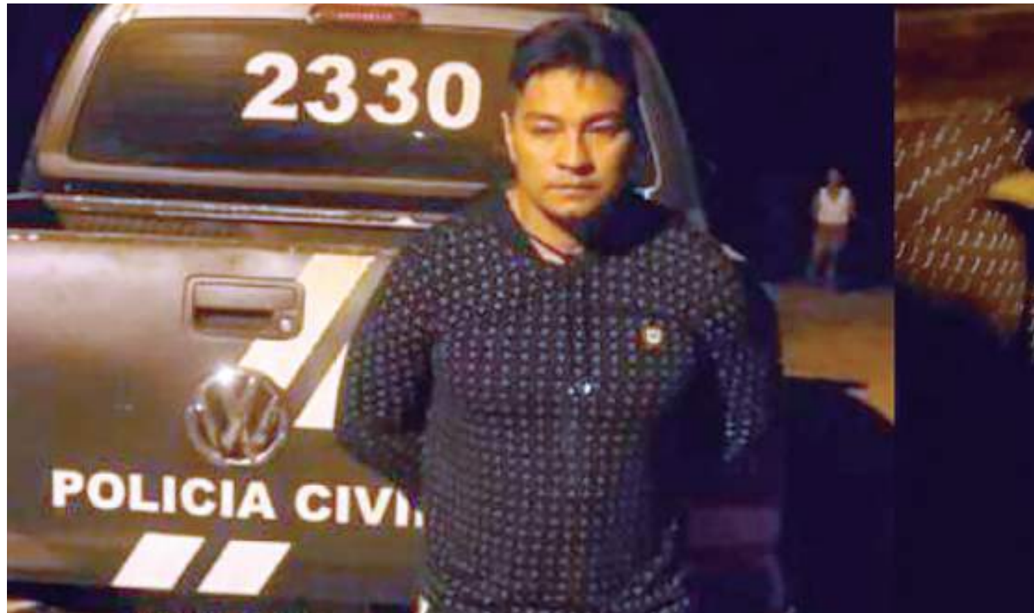
O suspeito foi encontrado no Pará em operação conjunta da polícia civil do Amazonas e paraense

"Entendemos que ela precisa sim ser encarcerada para responder perguntas que devem ser questionadas. Atualmente ela é uma pessoa eh foragida, vamos aproveitar o espaço também pra ajuda novamente pra população pra que a gente eh capture essa moça pra que enfim a gente