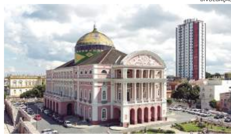
Atividades acontecem entre 17 e 22 de agosto, com inscrições gratuitas