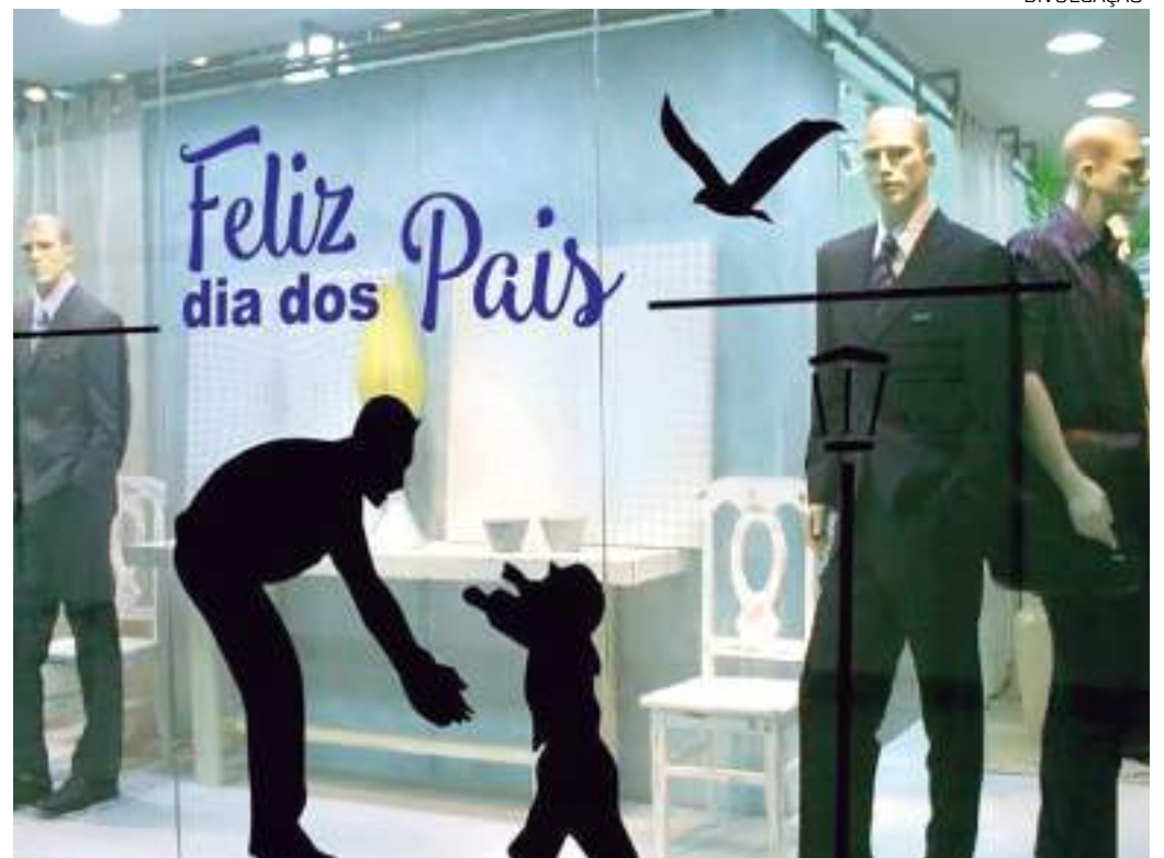
Loja de roupas preparada para os Dia dos Pais

A data é a quarta mais importante para o comércio, depois do Natal, Dia das Mães e Dia das Crianças, na ordem. Essa importância nas vendas é refletida na geração de empregos temporários. A CNC estima que 10.380 mil pessoas sejam contratadas para atender à demanda de vendas.