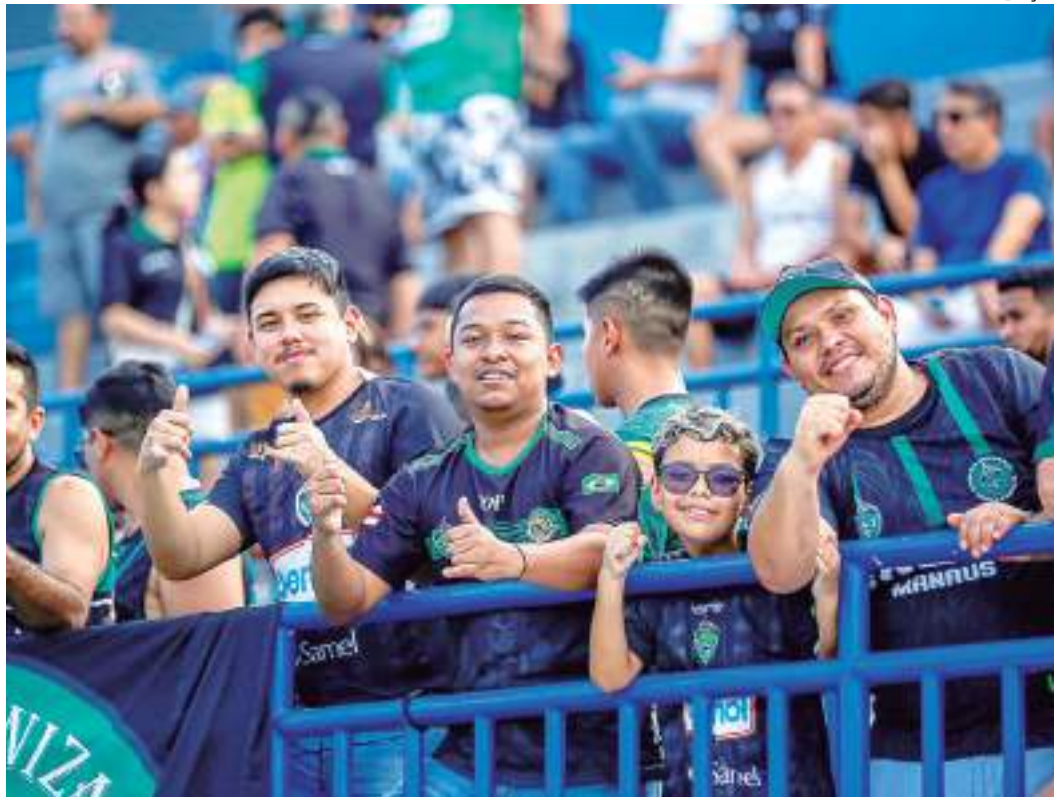
Torcedores devem apoiar o Manaus nas duas partidas decisivas na Série C

Caso o torcedor queira comprar somente um ingresso, fora do combo, para