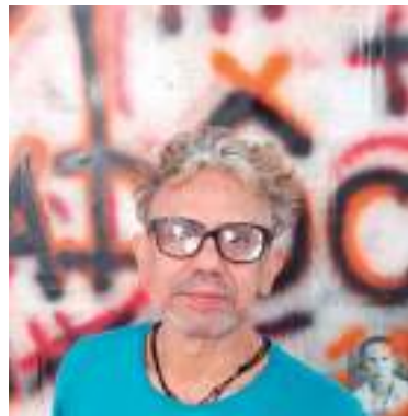
Artista recebe convidados para abertura da exposição nesta quinta-feira