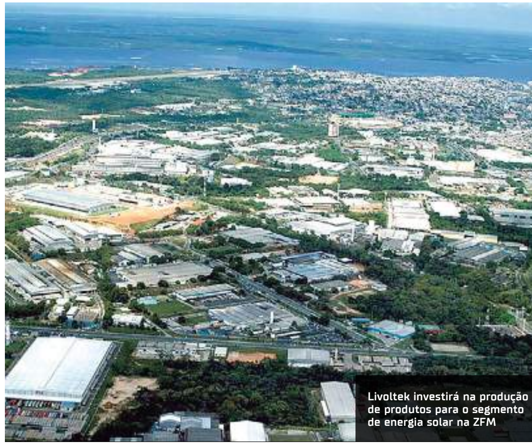
Livoltek investirá na produção de produtos para o segmento de energia solar na ZFM

abril de 2023. Em sete anos, a evolução é de 2.400%. E a adesão a essa matriz energética impacta na economia e no meio ambiente. Para se ter uma ideia, nos dados acumulados desde 2012 são mais de R$ 143,4 bilhões em novos investimentos, mais de 868 mil empregos gerados, mais de R$ 42,7 bilhões em tributos arrecadados e mais de 36,7 milhões de toneladas de gás carbônico (CO2) evitados, segundo a Absolar.