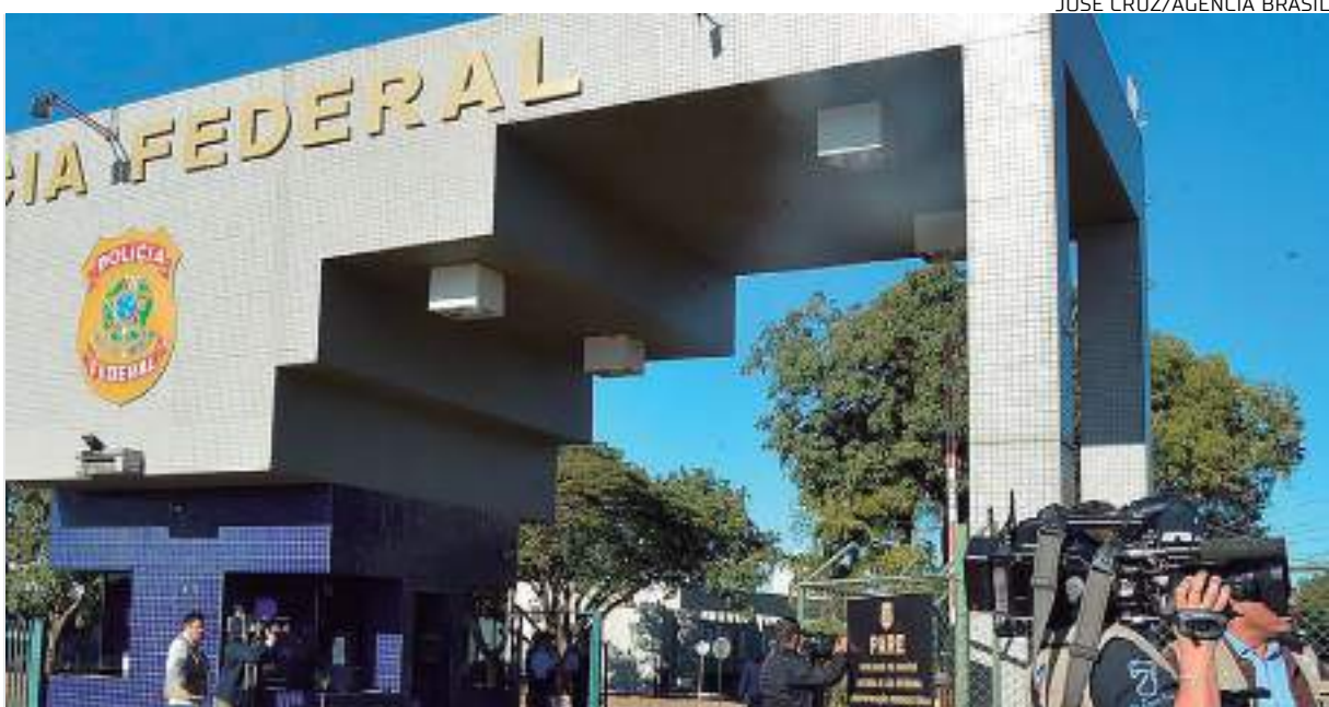
Operação Fake Mail teve início nesta quarta-feira (09)