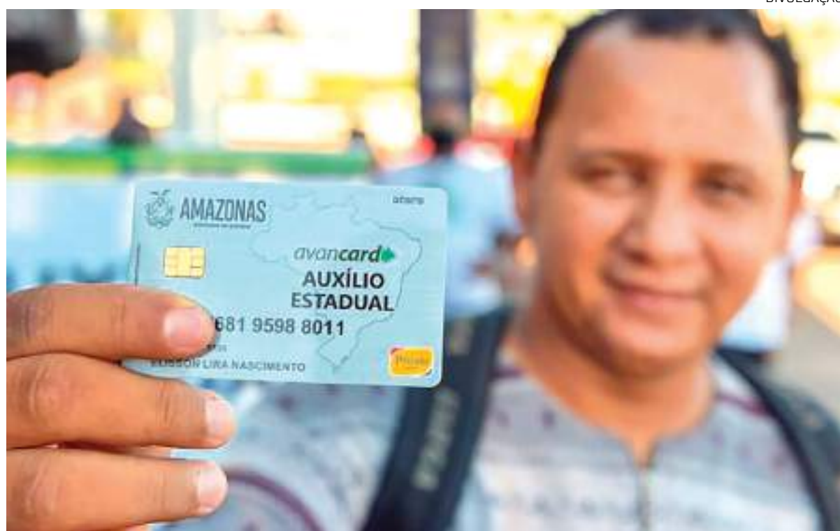
Beneficiário do Auxílio Estadual com o cartão do programa