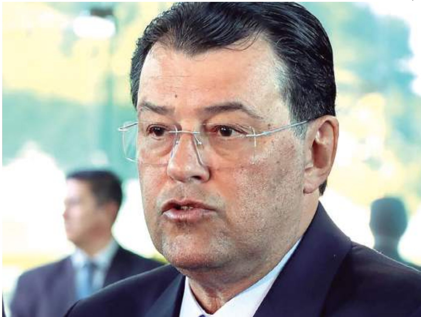
Entrevista coletiva do Senador Eduardo Braga, relator da Reforma Tributária

Braga pensou ao texto que chegou da Câmara duas Propostas de Emenda à Constituição (PECs) já em tramitação no Senado: a PEC 110, de autoria de