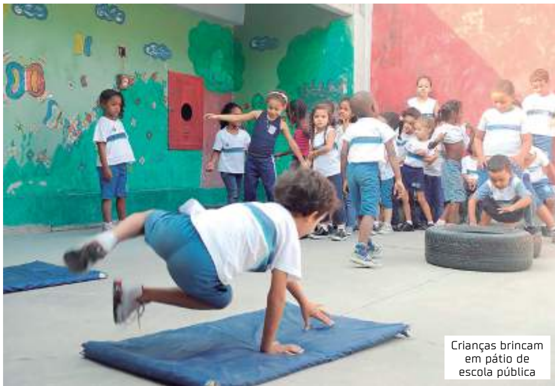
Crianças brincam em pátio de escola pública

As temáticas mais ofertadas são formas lúdicas, críticas e participativas de aprendizagem (30,4%), usos de metodologias que promovam a aprendizagem autônoma e participativa (26,9%) e conteúdo específicos das áreas e componentes curriculares (28,4%).