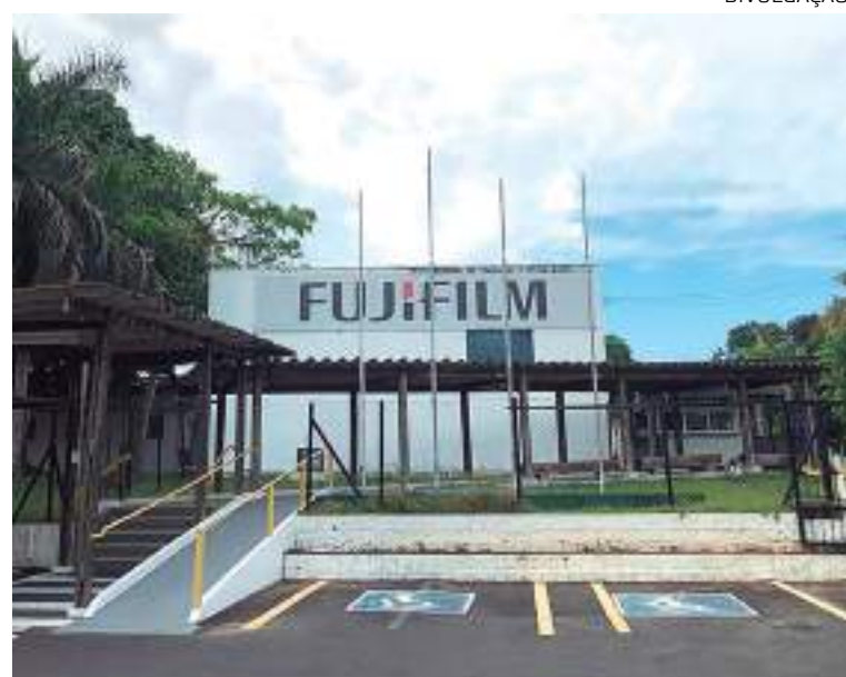
Fábrica da Fujifilm completa 30 anos de operação em Manaus

Fujifilm Brasil Fundada em 1958, a FUJIFILM do Brasil Ltda, subsidiária da FUJIFILM Holdings America Corporation, atua nos segmentos de imagem, saúde e soluções para negócios com o propósito de inovar sempre, oferecendo produtos e soluções que impactem de forma positiva a cultura, ciência, tecnologia e indústria de nosso país.