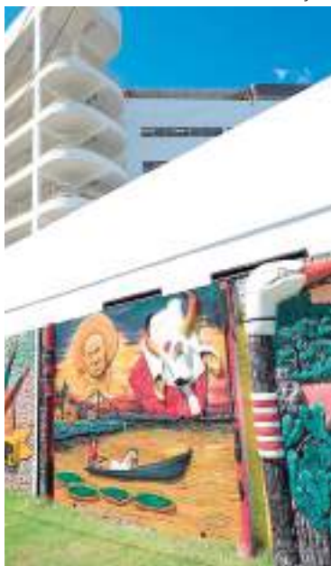
Programação é gratuita