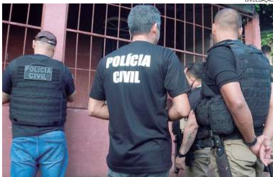
A redução foi registrada durante primeiro semestre deste ano