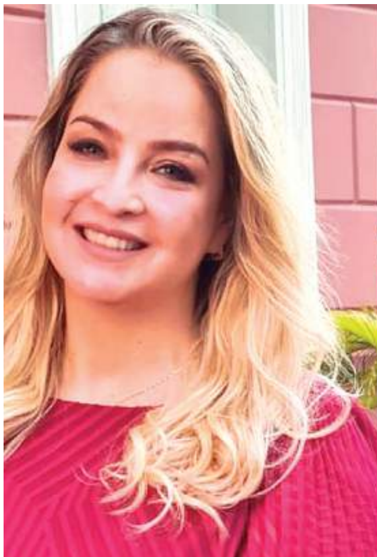
Ex-candidata ao Governo do Amazonas, Carol Braz não confirma candidatura. Já Campelo é tratada como certa na disputa

A ideia da deputada estadual é se alinhar ao projeto de Renata Abreu, que defende o