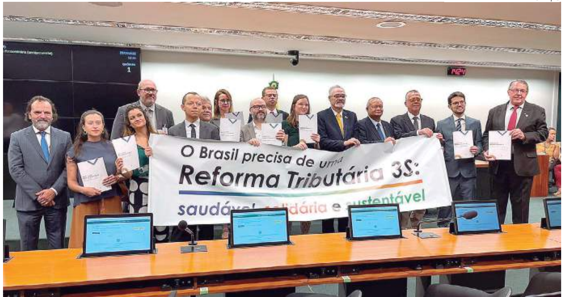
Organizações da sociedade civil lançam manifesto pela Reforma Tributária 3S em ato simbólico na Câmara dos Deputados

Dentre as mudanças previstas, ele explica, por exemplo, o Brasil deu um primeiro e tímido passo para incentivar a transição para economia de baixo carbono com a proteção ambiental sendo princípio básico para novos