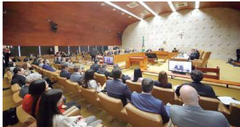
O plenário do STF no julgamento sobre a descriminalização do porte de drogas

O ministro do Supremo Tribunal Federal (STF) Alexandre de Moraes votou pela descriminalização do porte de maconha para consumo pessoal. O magistrado defendeu que é preciso definir uma quantidade mínima que diferencie o usuário do traficante de entorpecentes, que seria de 25 a 60 gramas da droga.