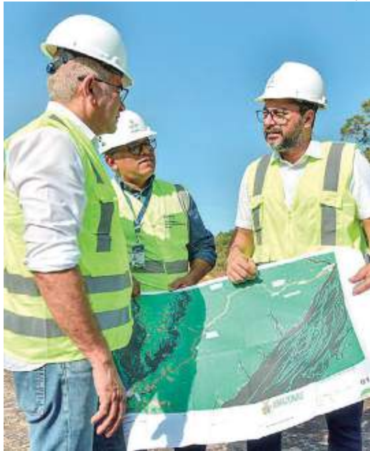
Governador vistoriou a obra ao lado de demais autoridades

"É uma das grandes obras do governador Wilson Lima, são quase 100 quilômetros. Nós estamos praticamente transformando essa rodovia em uma rodovia padrão AM-070. Ela vai interligar com a AM-070 e vai permitir esse fluxo de turistas, de passageiros, de pessoas, muito rapidamente