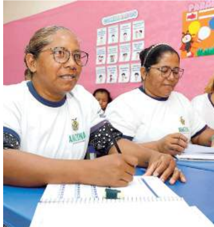
Aulas do 2º semestre letivo da EJA iniciam na próxima segunda-feira, 07 de agosto

O retorno às salas de aula acontecerá no próximo dia 07 de agosto, quando mais de 30 mil alunos da rede estadual regressam à rotina da EJA. A modalidade oferece