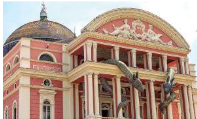
Obra fica exposta no espaço cultural até o dia 12 de agosto