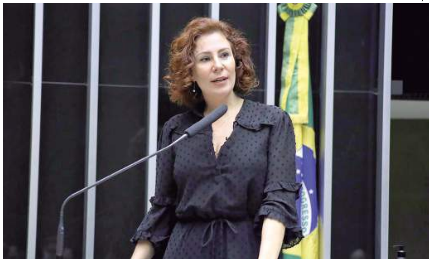
Deputada federal Carla Zambelli disse que está à disposição da Justiça