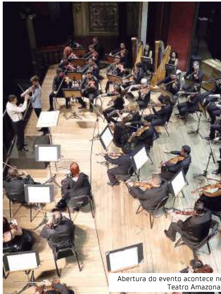
Abertura do evento acontece no Teatro Amazonas

No dia 8 de agosto, das 15h às 18h, será realizada uma vivência artística da Focus Cia de Dança com o Corpo de Dança do Amazonas, no Teatro da Instalação, rua Frei José dos Inocentes, Centro. Haverá também workshops de dança com membros da Focus Cia de Dança, nos dias 10 de agosto, das 9h às 11h30 e das 14h às 16h30, e no dia 11 de agosto – das 9h às 11h30, no Liceu de Artes e Ofícios Claudio Santoro,