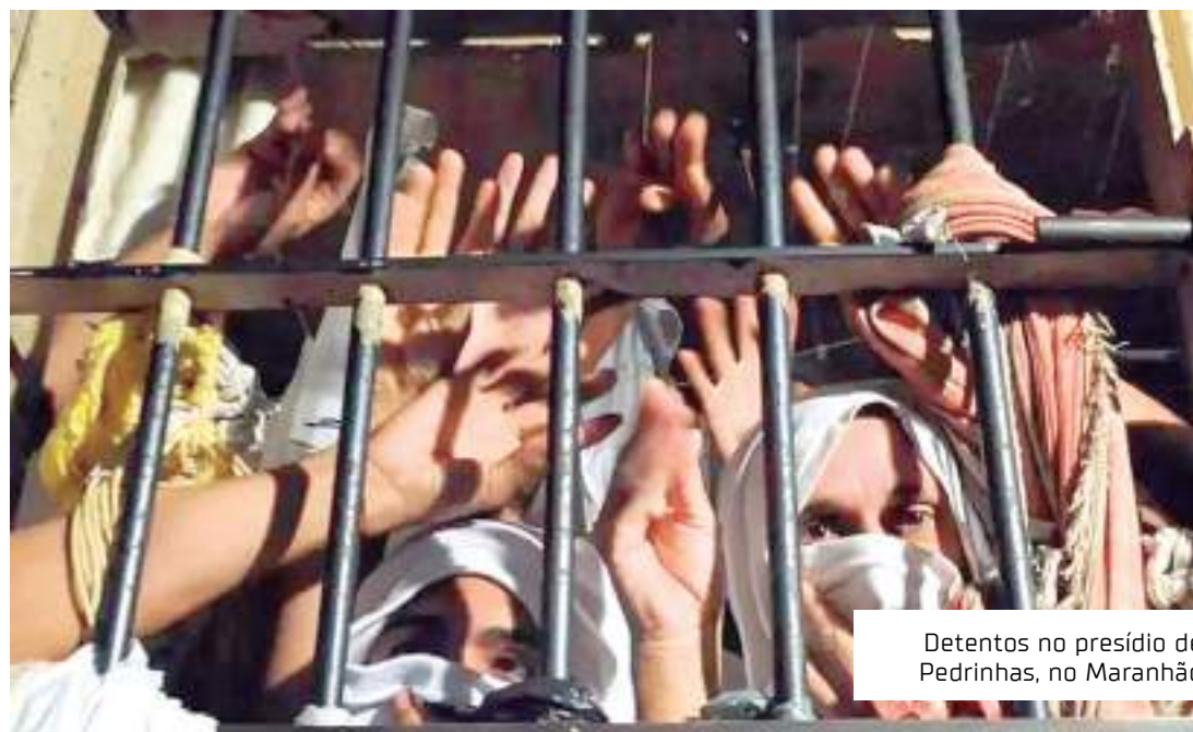
Detentos no presídio de Pedrinhas, no Maranhão