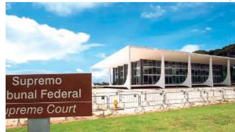
Fachada do Supremo Tribunal Federal em Brasília