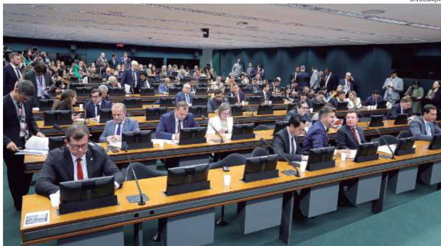
Comissão especial na Casa terá prazo de até 40 sessões para discussão do tema

A proposta de emenda à Constituição da Anistia já foi aprovada pela Comissão