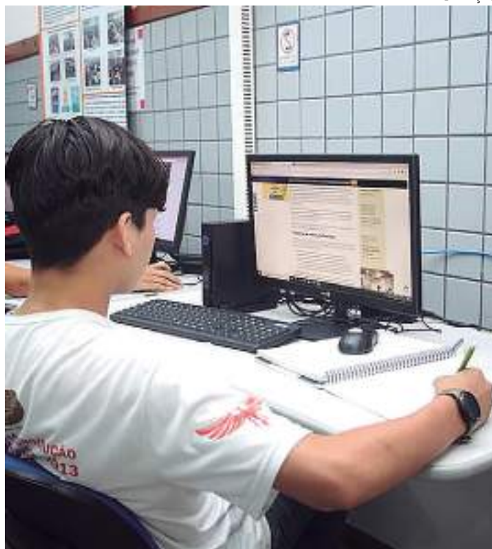
Starlink é a primeira e a maior constelação de satélites do mundo

Starlink é a primeira e a maior constelação de satélites do mundo, usando uma órbita terrestre baixa para fornecer internet banda larga via satélite, capaz de suportar transmissão, jogos on-line, chamadas de vídeo e serviços de streaming. Contemplando, além da conexão satelital de alta capacidade, câmeras de vigilância, controle e manutenção assistida, por meio da