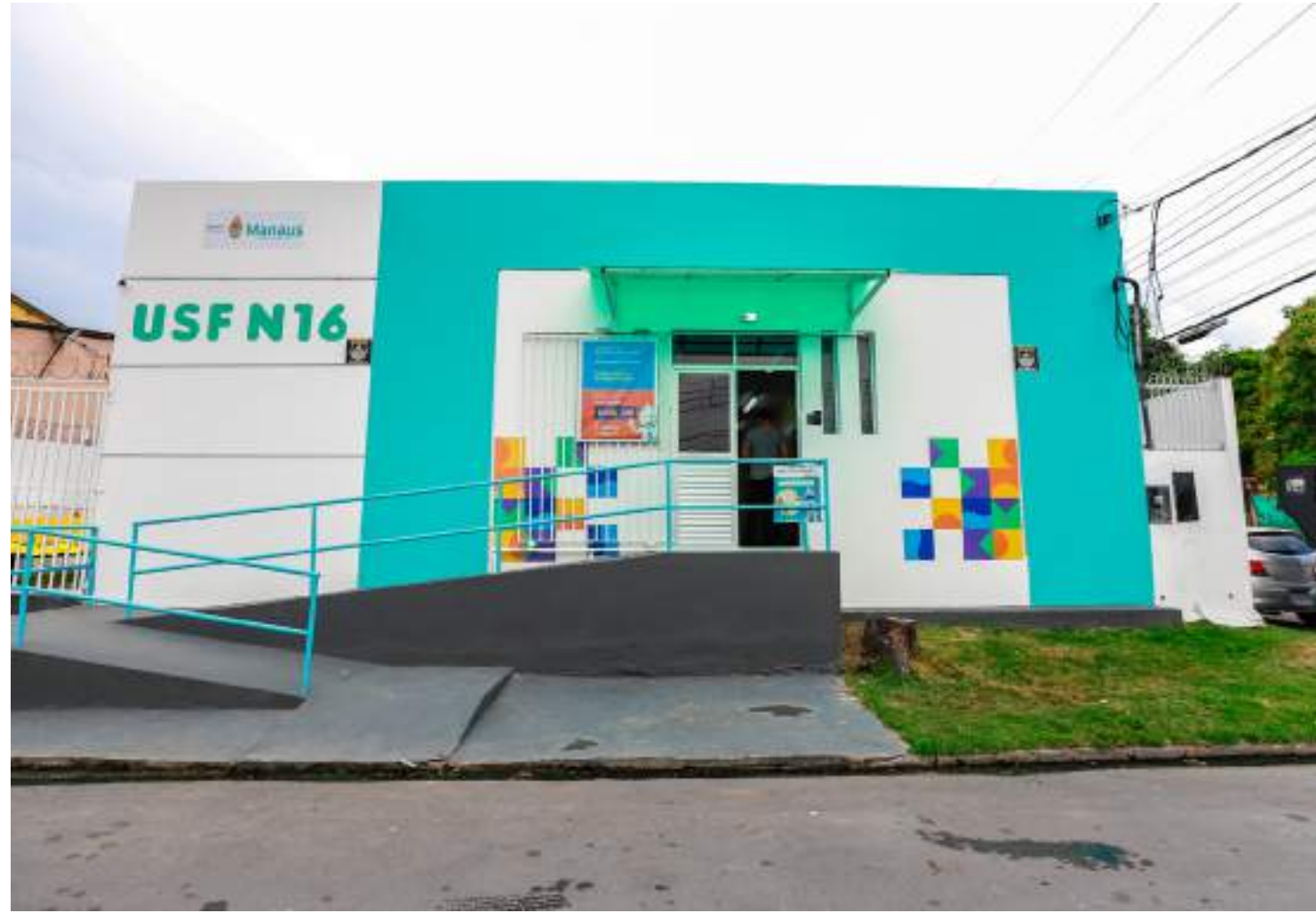
Revitalizações em unidades são viabilizadas por meio de Parceria Público-Privada (PPP)

De acordo com a secretária, as revitalizações são viabilizadas por meio de Parceria Público-Privada (PPP), e incluem ade-