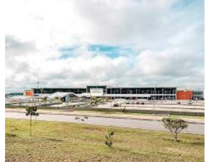
Sede do Sebrae Amazonas

Principal operadora privada de aeroportos do mundo, a VINCI Airports opera mais de 72 aeroportos em 13 países da Europa, Ásia e Américas. Graças à sua experiência como integrador global, a VINCI Airports desenvolve, financia, constrói e administra aeroportos, fornecendo sua capacidade de investimento e seu know-how na otimização