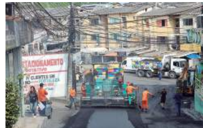
Estado repassou R$ 181,8 para o programa

O Asfalta Manaus está dividido em três convênios, cujos repasses foram feitos para a Prefeitura de Manaus da seguinte forma: no Asfalta Manaus 1, foram repassados R$ 100 milhões, no dia 12 de novembro de 2021, e a contrapartida do município foi de R$ 10.442.704,28; para o Asfalta Manaus 2, o repasse foi de R$ 50 milhões, realizado na mesma data do anterior, e a contrapartida municipal foi de R$ 1.585.108,91; e no Asfalta Manaus 3 foram R$ 31.814.817,25, quitados em 30 de junho de 2022, e a contrapartida da Prefeitura de Manaus foi de R$ 781.392,7.