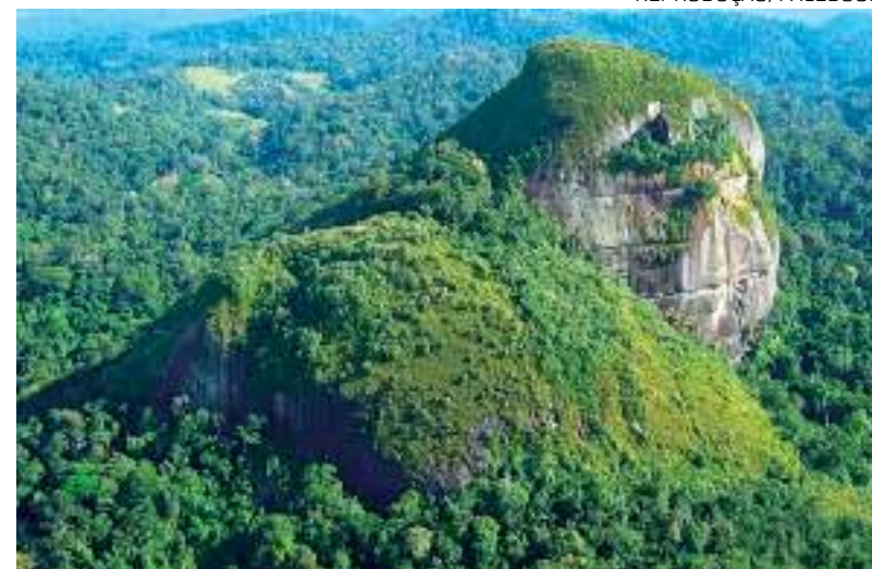
Parque Nacional Montanhas do Tumucumaque