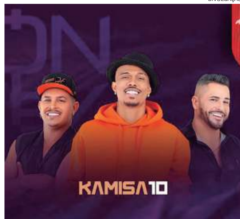
Evento acontecerá na Arena Paris Ponta Negra