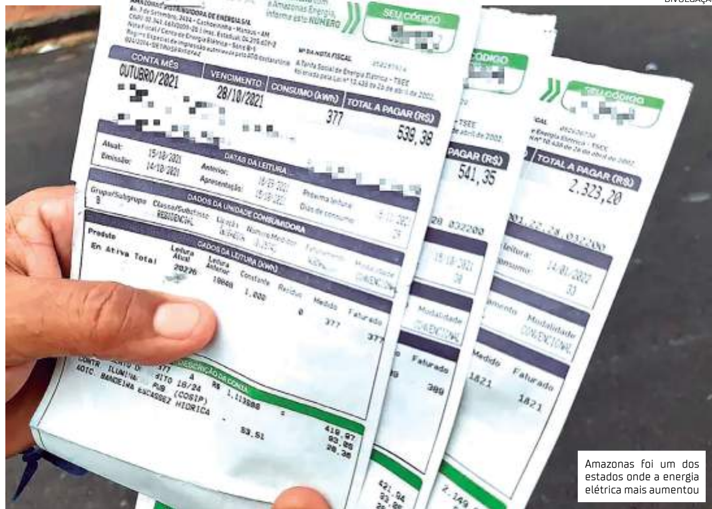
Amazonas foi um dos estados onde a energia elétrica mais aumentou

Em 2023, foram registradas quase 6 mil reclamações dos clientes, segundo dados divulgados pelo Instituto de Defesa do Consumidor (Procon-AM). No ano 2022, o Amazonas Energia recebeu 10,4 mil reclamações de clientes da concessionária. Problemas recorrentes devido ao corte indevido