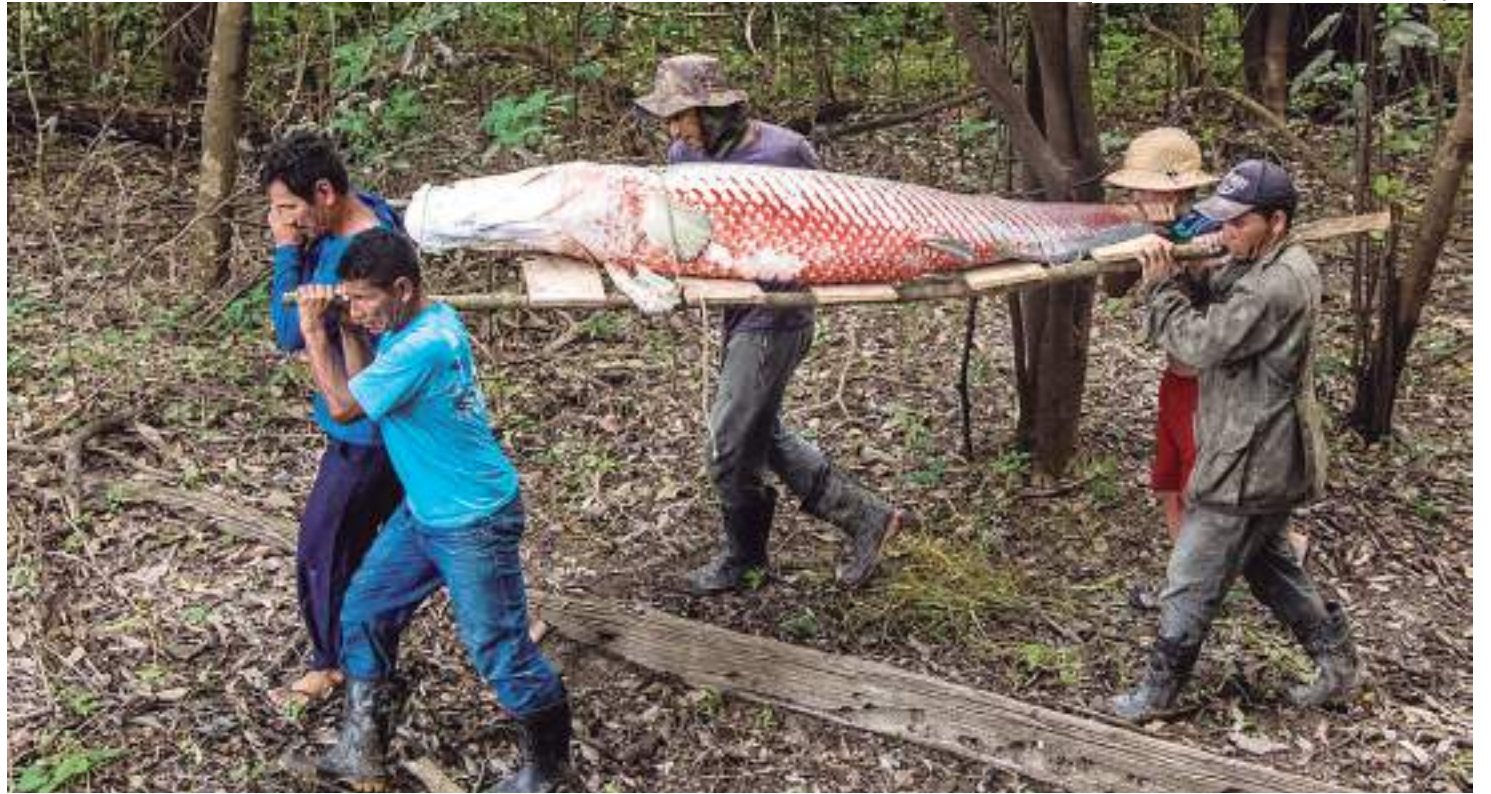
Pirarucu de manejo sustentável criado em área de reserva ambiental

O Fish of Change aborda os principais gargalos do manejo do pirarucu, fortalecendo o mercado interno e desenvolvendo as