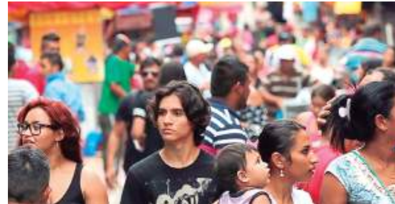
Pessoas vão ao Centro Histórico de Manaus fazer compras