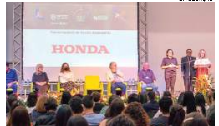
Palestra no Centro de Convenções Vasco Vasques

Outro evento da ABRH-AM gratuito e aberto ao público, a EXPOABRH chega a 20ª edição em 2023. Durante a Feira, os vi-