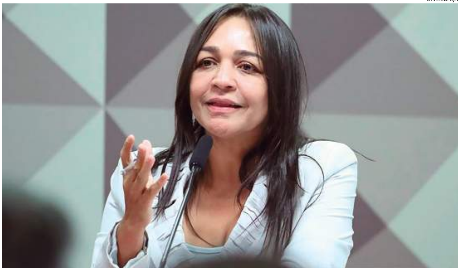
A relatora afirmou que após as declarações graves de hacker, sigilos do ex-presidente devem ser quebrados

Segundo Eliziane, a comissão deve pedir quebras de sigilo e documentos a órgãos de fiscalização, como o Conselho de Controle de Atividades Financeiras (Coaf), para buscar possíveis elementos