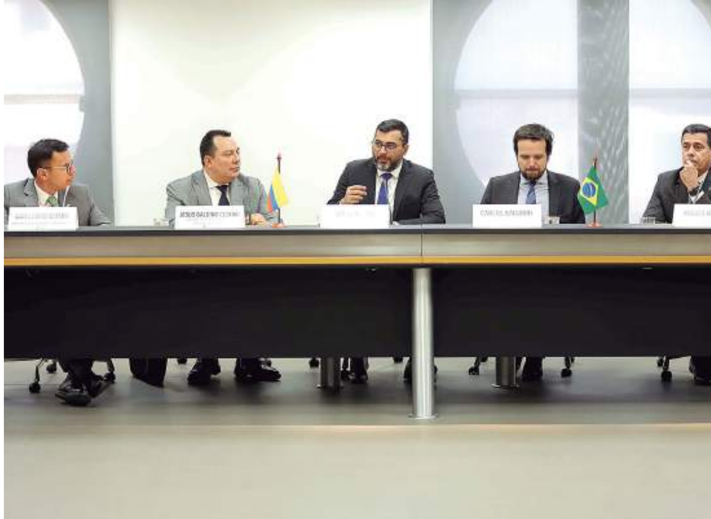
A execução do programa no Amazonas é uma articulação direta do governador com a Anatel

"Isso é fundamental porque a conectividade, a internet, ela diminui as distâncias, facilita o empreendedorismo, facilita o social, e quando falo de questão social, falo de educação, falo de saúde, falo de assistência social, então isso é um ganho muito grande para aquela