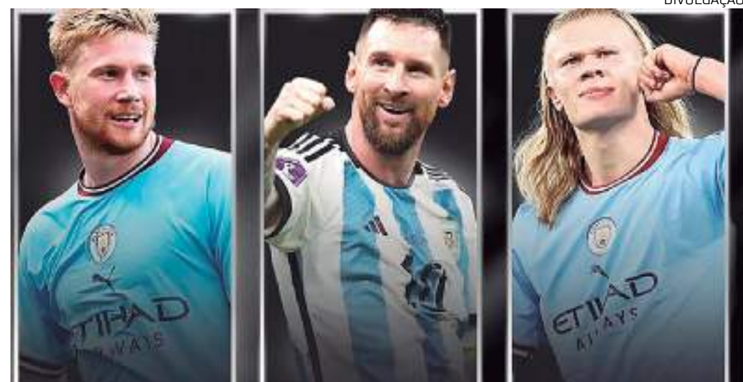
De Bruyne, Haaland e Messi são indicados ao prêmio de Jogador do Ano da Uefa