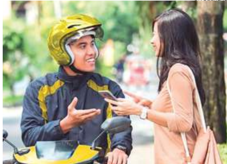
Passageiro e motociclista parceiro da 99Moto