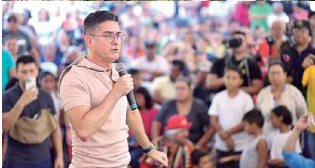
Ao todo são 10 quilômetros de ramal que serão recuperados

estavam prejudicados pelas dificuldades enfrentadas no ramal para conseguir escoar seus produtos por conta das péssimas condições da via.