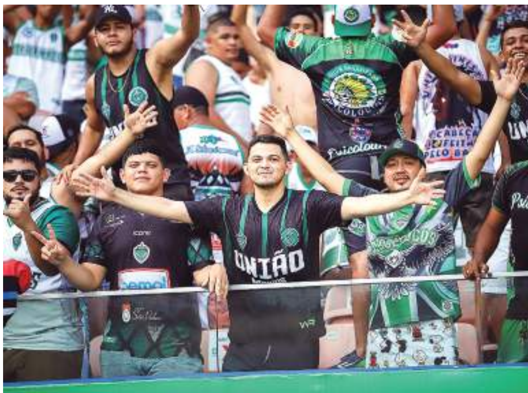
Manaus FC precisa de sua torcida para vencer time cearense na Arena da Amazônia

Atualmente na 17ª colocação com 18 pontos, o Manaus encara o Floresta-CE, que está uma posição acima na tabela de classificação, com 19 pontos. Uma vitória neste confronto direto tira o Gavião Real da zona do rebaixamento. Na última rodada, o Manaus viaja para enfrentar o Figueirense, em Florianópolis (SC), no próximo sábado (26).