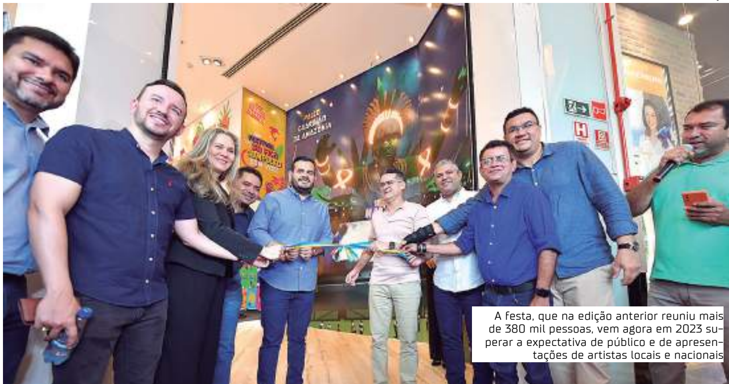
A festa, que na edição anterior reuniu mais de 380 mil pessoas, vem agora em 2023 superar a expectativa de público e de apresentações de artistas locais e nacionais

"Teremos uma pegada de sustentabilidade ambiental. No show principal do evento, que é a atração internacional, o David Guetta, nós vamos disponibilizar na abertura do link da inscrição, dez mil ingressos, e nós vamos trocar cada ingresso por 30 garrafas PETs, para que elas não possam poluir os nossos rios e igarapés. Faremos parceria com as empresas de reciclagem e essas garrafas serão levadas para um outro local, assim nós