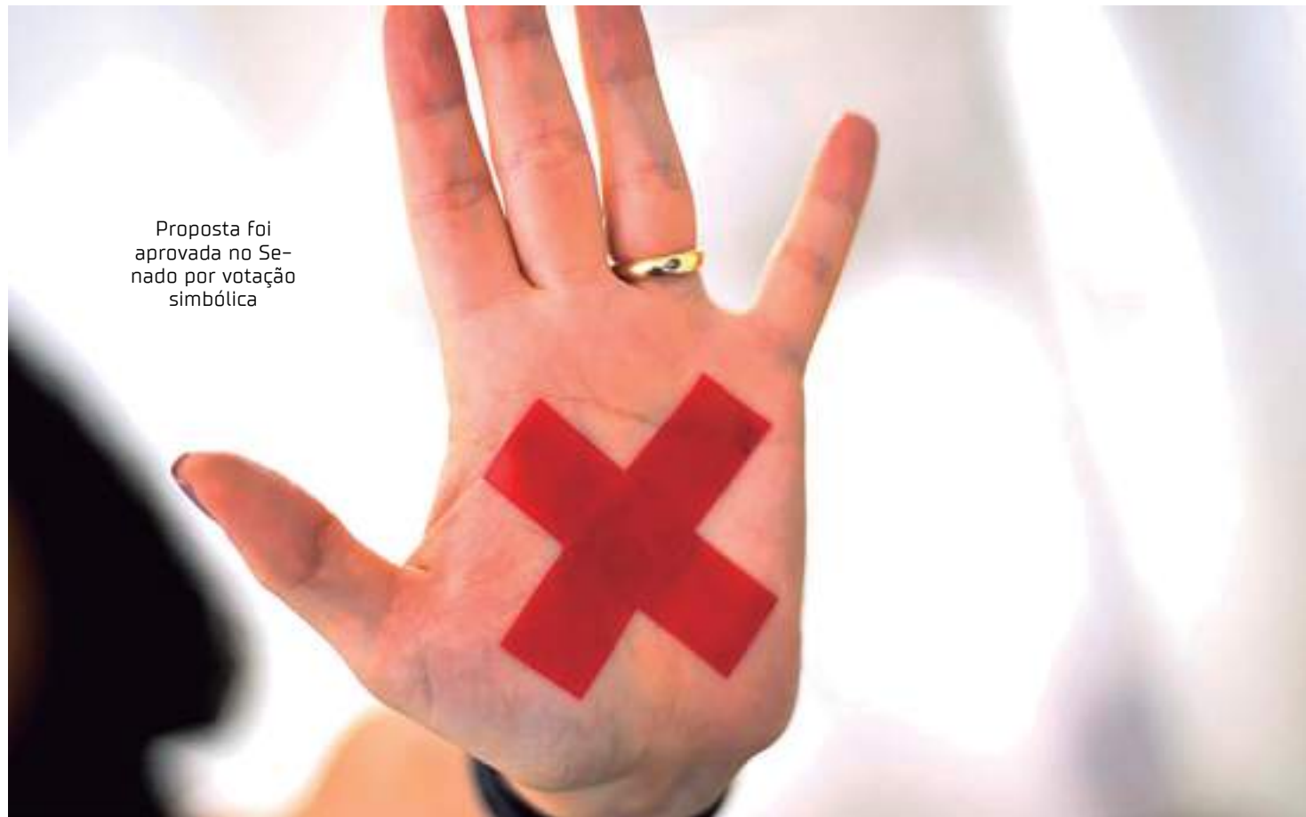
Proposta foi aprovada no Senado por votação simbólica

O Tribunal de Justiça do Amazonas (TJAM), por meio da Coordenadoria Estadual da Mulher em Situação de Violência Doméstica e Familiar (Cevid/TJAM), firmou Acordo de Cooperação Técnica com o Serviço Nacional de Aprendizagem Comercial (Senac) para oferta de cursos a mulheres vítimas de violência doméstica, em áreas como Informática, Gestão, Hospitalidade, Idiomas, Moda, Produção de Alimentos, Saúde, Turismo, Artes, Beleza, Comunicação, Comércio, Conservação e Zeladoria, Educação, além de