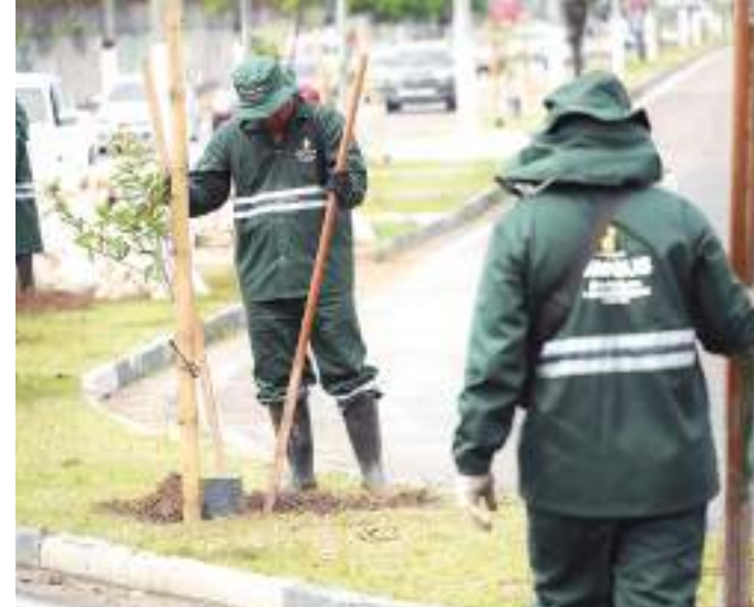
As metas são a produção de mais 300 mil mudas em 2 anos

“O objetivo é que tenhamos todas as árvores, localizadas em áreas públicas da cidade, catalogadas em uma base de dados, gerando um