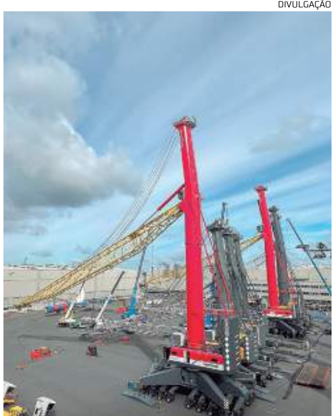
Tratativas foram iniciadas ainda em 2022

De acordo com a Gestão Corporativa, o investimento trará mais desenvolvimento profissional, em-