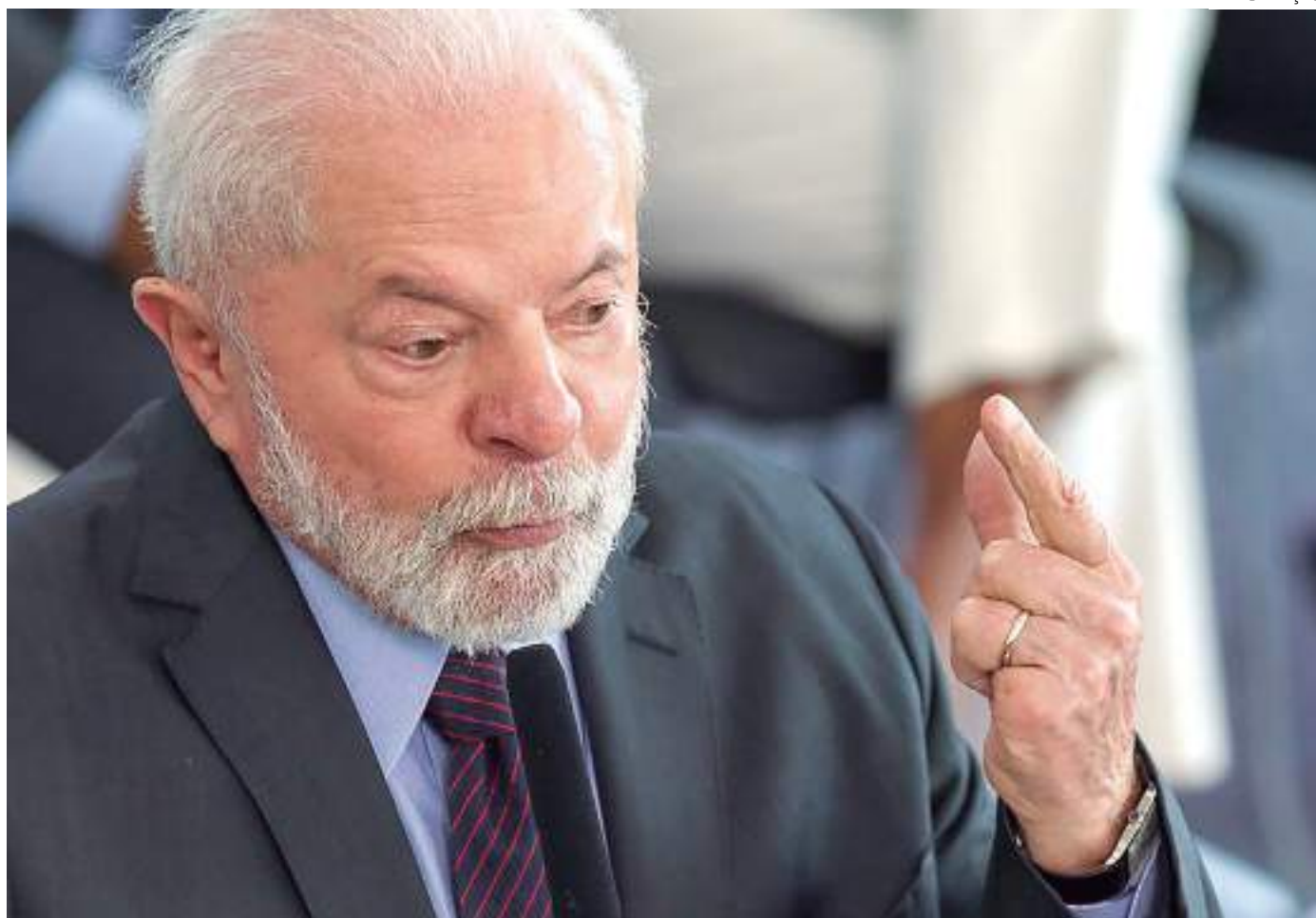
Presidente projeta crescimento de indústria, comércio e serviços no Brasil

"A Enimpecto é uma importante sinalização do governo no sentido de organizar diversas políticas públicas que contribuem para uma economia mais verde e mais inclusiva", diz o secretário de Economia Verde, Descarbonização e