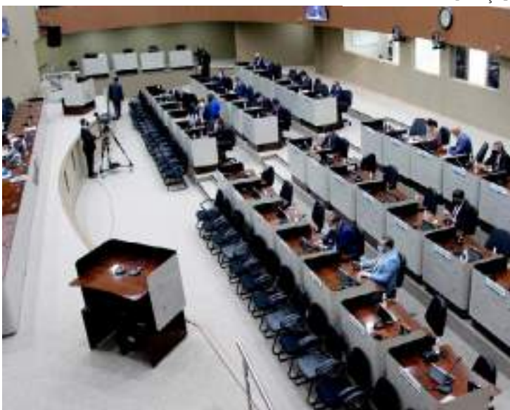
Vereadores e Prefeitura realizaram pedidos da categoria

O reajuste aprovado na CMM segue os termos do reajuste acordados em reunião extraordinária da Mesa Municipal de Negociação do Sistema Único de Saúde (SUS), no