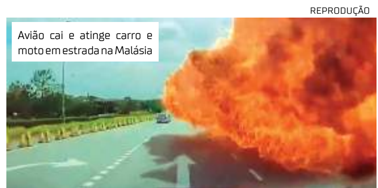
Avião cai e atinge carro e moto em estrada na Malásia

A Jet Valet não respondeu imediatamente a um pedido de comentário da Reuters, mas a mídia local citou a empresa dizendo que ela cooperará com as autoridades na investigação.