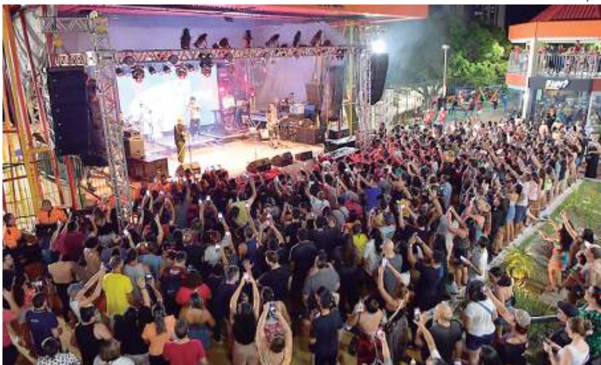
Espaço fica localizado no Complexo da Ponta Negra