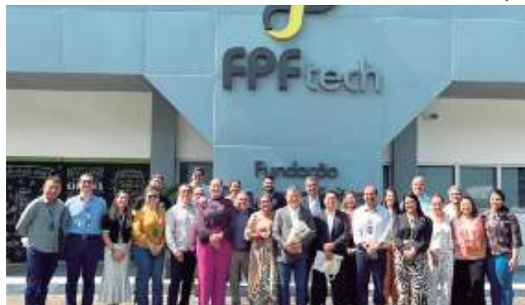
Servidores da Sufra visitam a FPFtech por conta do aniversário