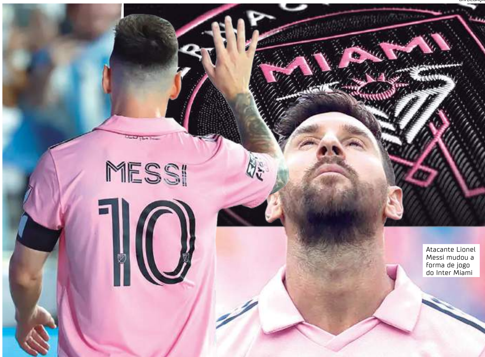
Atacante Lionel Messi mudou a forma de jogo do Inter Miami

“Os jogadores, o corpo técnico, o clube... todos nós somos guiados por seu entusiasmo e sua liderança. Ele sempre tem uma resposta