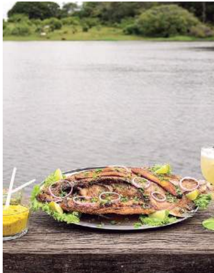
Pratos regionais podem ser comprados por aplicativo

Um dos pratos mais tradicionais do Amazonas recebe influências portuguesas, incorpora