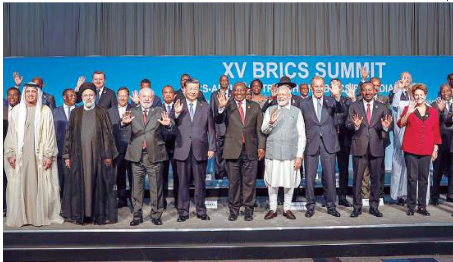
Grupo aprovou a entrada de seis novos países no grupo, a partir de janeiro de 2024

"A mim não importa, não importa do ponto de vista do Brics, quem ganha as eleições na Argentina. Todo mundo sabe que eu sou amigo do Alberto Fernández [atual presidente], mas quando tiver uma eleição, o Brasil, enquanto Estado, vai negociar com o Estado argentino, independentemente de quem seja o presidente. Pode ser que o presidente não queira negociar com o Brasil, é um direito livre soberano dele, ninguém vai obrigar", disse.