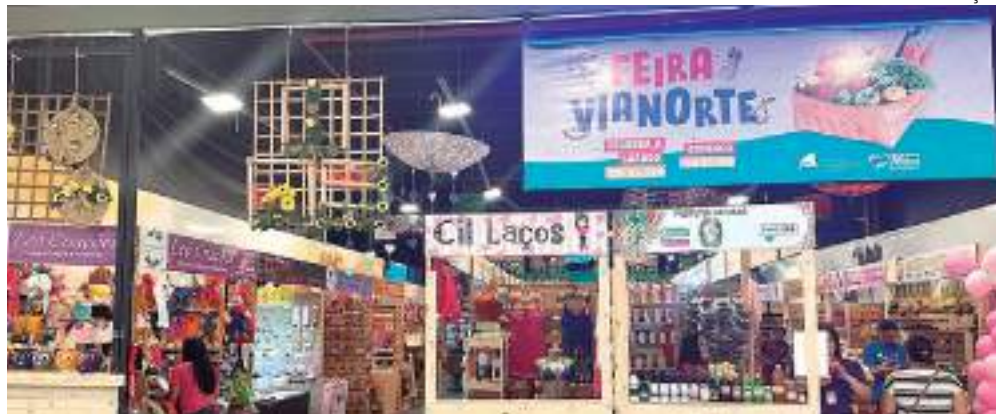
Feira reúne 25 empreendedores no Manaus ViaNorte

encontram frutas, legumes e verduras orgânicos cultivados por famílias de Rio Preto da Eva, município a 81 quilômetros da capital, e também queijos artesanais vindos de Autazes, situada a 111 quilômetros de distância. Além disso, há artesanatos, um espaço gastronômico, roupas e produtos diversificados.