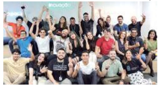
Profissionais experientes e conexões para projetos inovadores