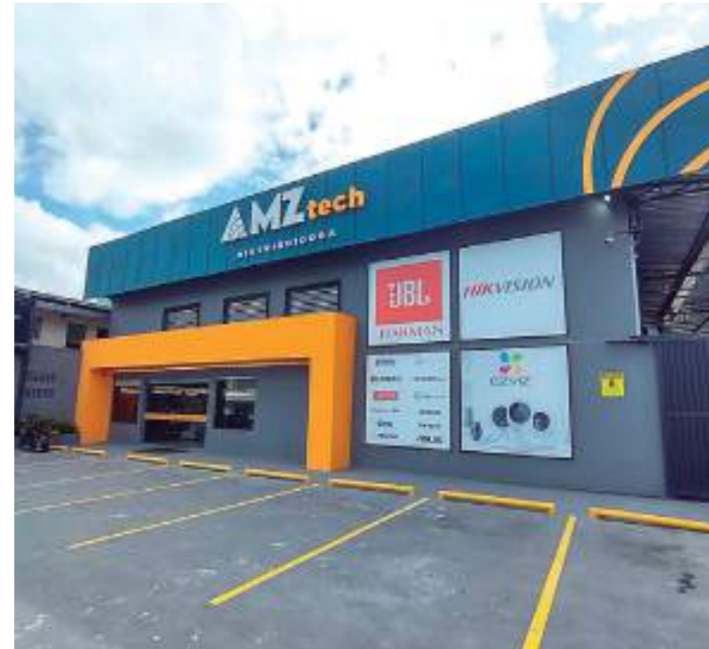
Fachada da AMZ Tech em Manaus