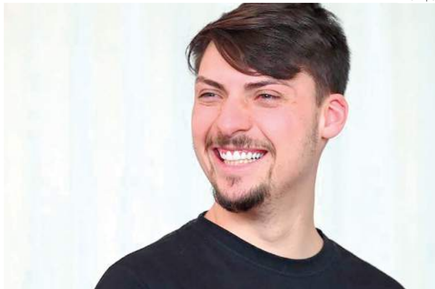
De acordo com a defesa, ele estava no local no momento da chegada da polícia e "está sossegado"