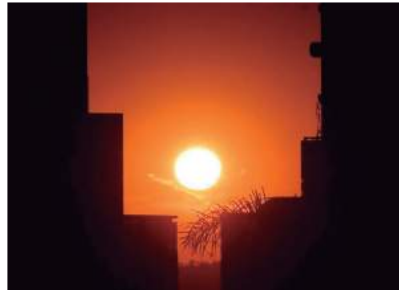
Na rota do calor, o DF (foto) enfrenta dias com mais de 33°C