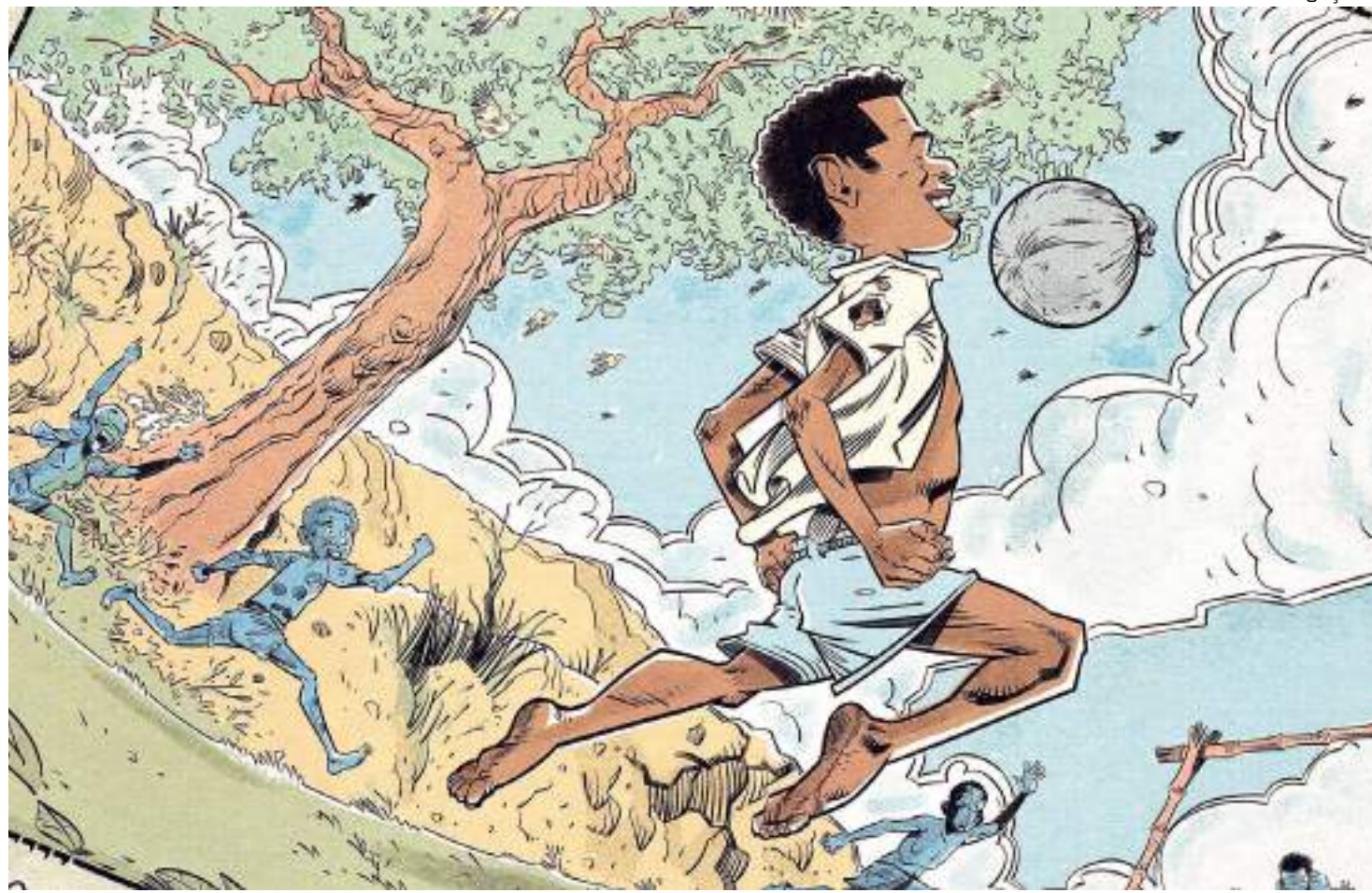
Nova HQ traz uma narrativa pessoal, realista do craque Botafoguense

Com roteiro de Fabiano Santos e desenhos e cores de Samuel Bono (O Corcunda de Notre Dame, Pelota), a HQ narra toda a trajetória, desde a infância em Pau Grande (distrito do Rio de Janeiro) e a origem do apelido "Mané", até a chegada no Botafogo, as conquistas na Seleção Brasileira e seu adeus aos gramados em 1973.