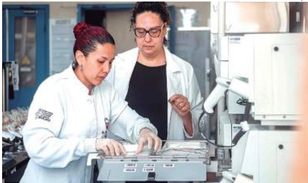
Novo equipamento realiza a Técnica de Inativação de Patógenos, que reduz a transmissão de doenças

"Podemos ter bactérias dentro das bolsas de plaquetas oriundas tanto do manuseio das bolsas quanto do organismo do doador. A partir dessa inativação a gente vai conseguir eliminar