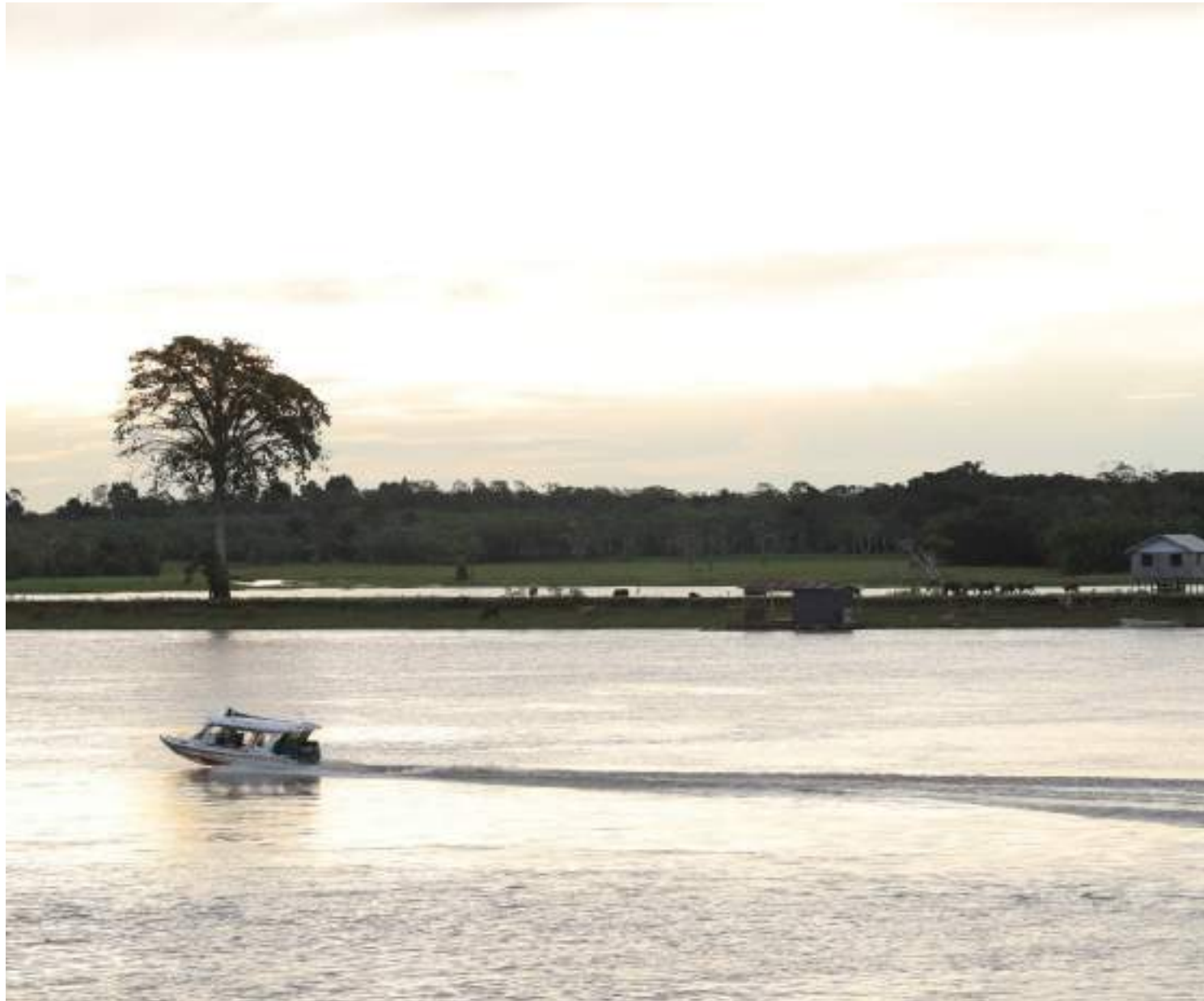
Ipaam segue trabalhando na análise necessária para a emissão da licença de exploração

O Ipaam segue trabalhando na análise necessária para a emissão da licença de exploração, conforme assegura deci-