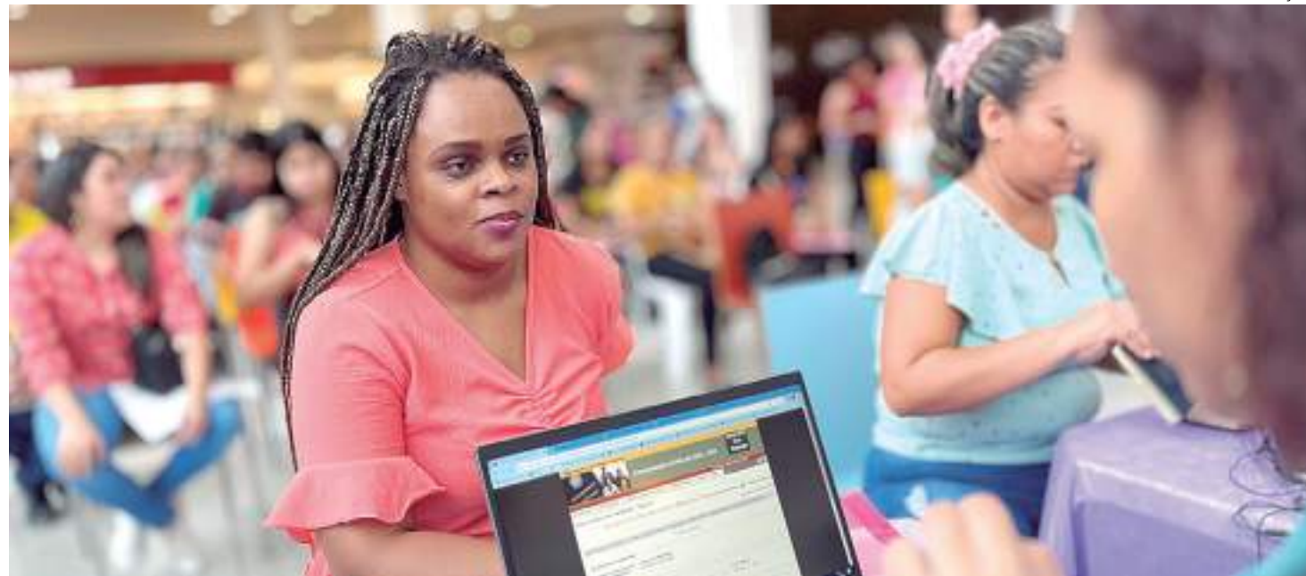
Ação acontece de 8h às 12h no conjunto Viver Melhor 2

Durante o sábado, a van estará estacionada em frente à leadam, disponibilizando vagas de emprego, cadastro no Sine Manaus e orientação para Carteira de Trabalho e Previdência Social (CTPS Digital) e seguro-desemprego. De acordo com a diretoria do Sine Manaus, os interessados