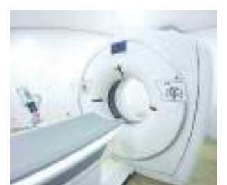
Equipamento já foi utilizado 3,8 mil vezes

De janeiro a julho de 2023, o Serviço de Arquivo Médico e Estatística (Same) registrou 2.169 tomografias no Hospital Regional Dra. Luiza da Conceição Fernandes.