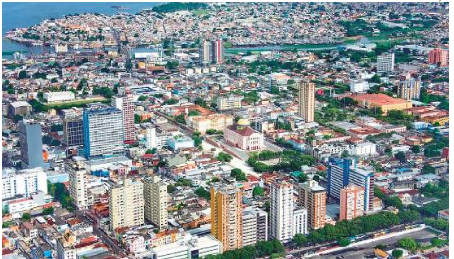
Vista aérea dos imóveis no Centro Histórico de Manaus

Somando os dois trimestres de 2023, as vendas de imóveis novos totalizaram um montante de R$ 917 milhões, representando um aumento de 21% em relação aos R$ 786