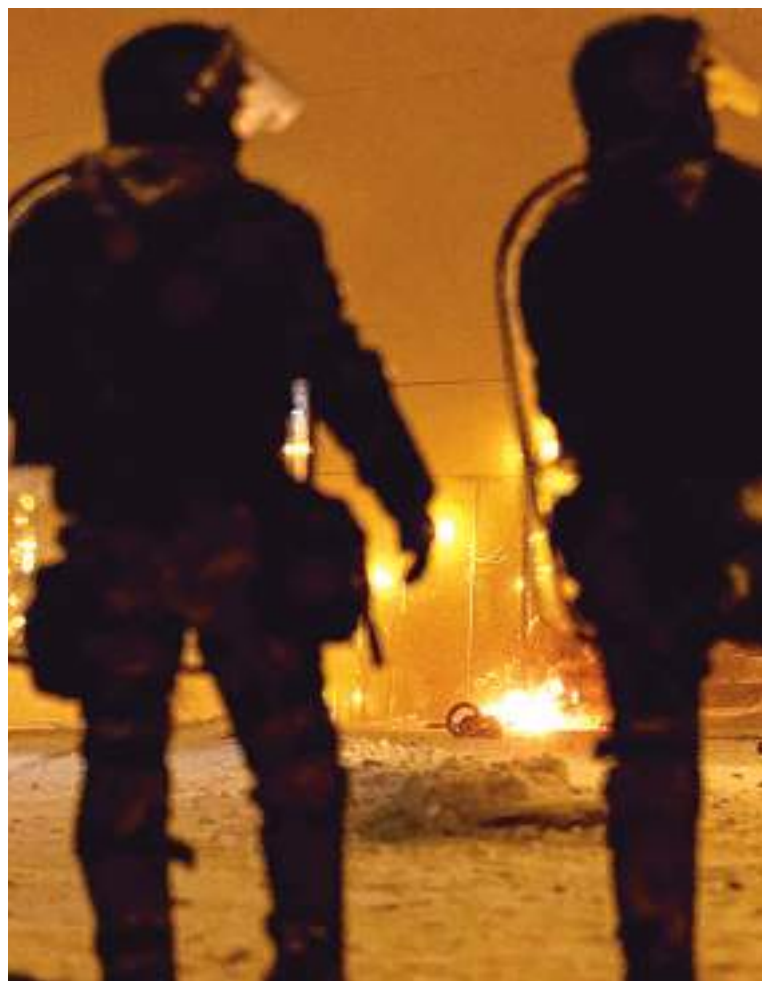
Dezenas de pessoas foram presas por saquearem lojas e mercados