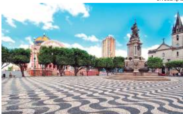
Programação conta Circuito da Cultura no Centro de Manaus