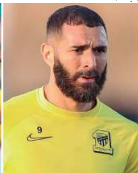
Neymar, CR7 e Benzema já sabem seus rivais na Champions Asiática