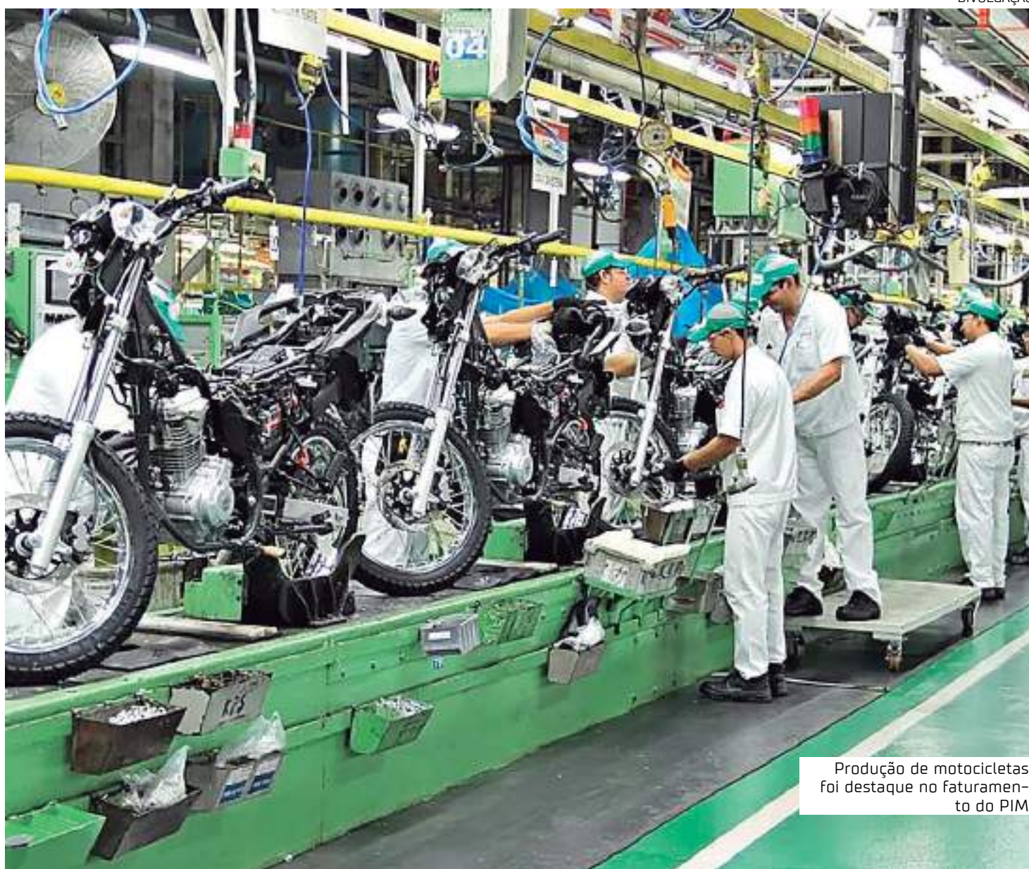
Produção de motocicletas foi destaque no faturamento do PIM

ma, Bosco Saraiva, avalia como positivo o fato de o PIM ter fechado o primeiro semestre com desempenho superior ao do ano passado, que representou recorde de faturamento da