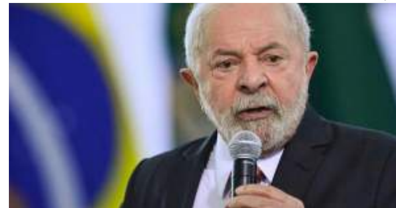
Presidente Lula durante cerimônia no Palácio do Planalto