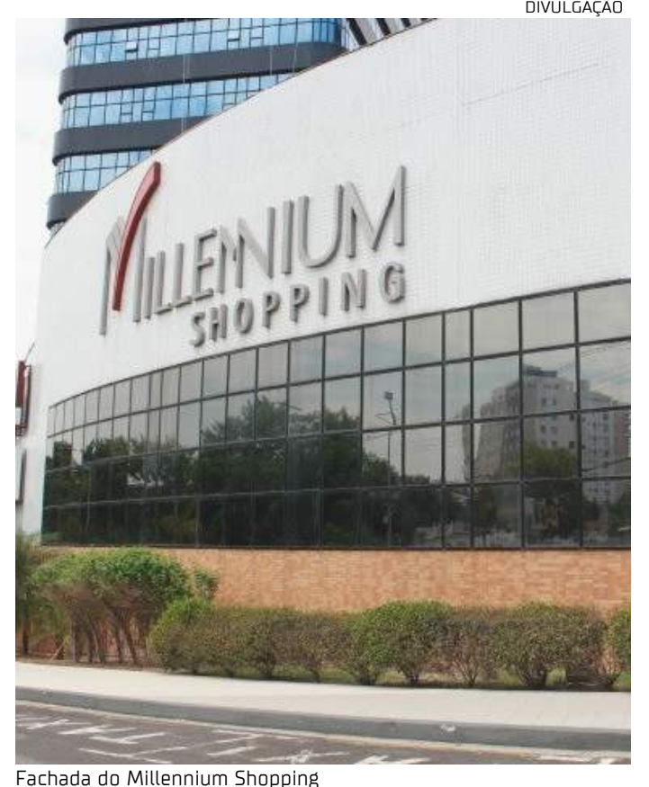
Fachada do Millennium Shopping

Ela destaca que o acampamento também irá promover a socialização tanto entre as crianças quanto os pais. “E eles irão ter a experiência de passar uma noite no shopping, participar de gincanas e brincadeiras, e ainda interagir com personagens que fazem parte do universo da criançada”, destacou Elizandra.