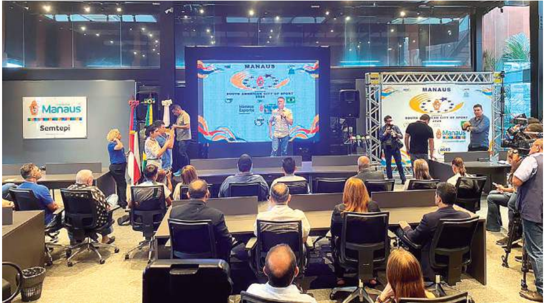
Prefeito David Almeida anuncia que Manaus concorre ao título de Cidade Sul-Americana do Esporte 2024

"É um projeto piloto que está começando no país. No Brasil, até 2027, as cidades serão indicadas. Essas cidades precisam atender um caderno de encargos, onde não a Prefeitura, mas toda