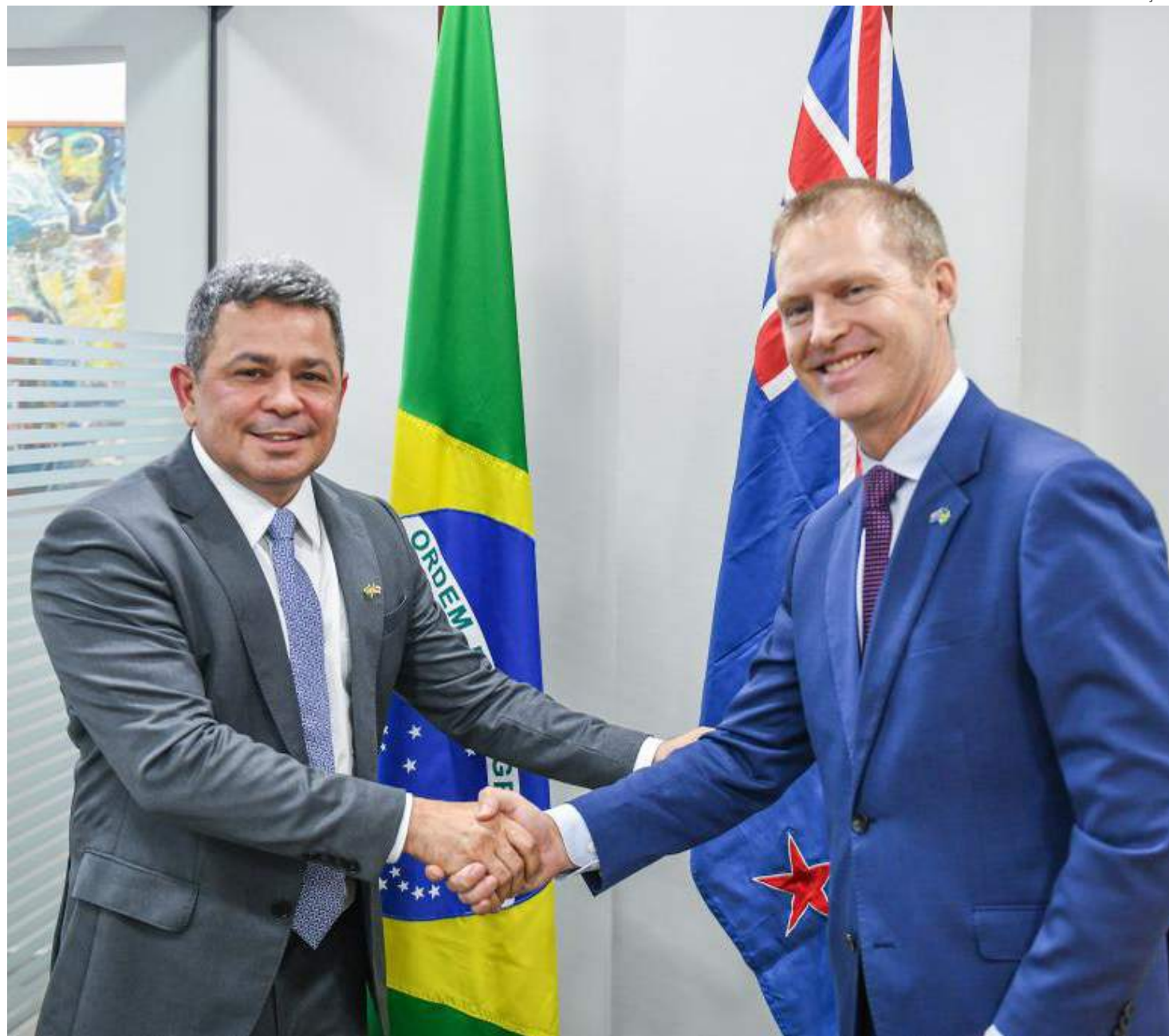
Reunião marcou o fim da programação do embaixador, que veio conhecer a realidade do estado

O embaixador se comprometeu em apresentar a proposta às entidades neozelandesas. "Ele se demons-