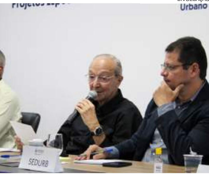
Objetivo é promover ações para desenvolvimento sustentável

No evento, foram referendadas e encaminhadas para a Casa Civil: a minuta da Política Energética Estadual, prevista pelo Cap. XVI