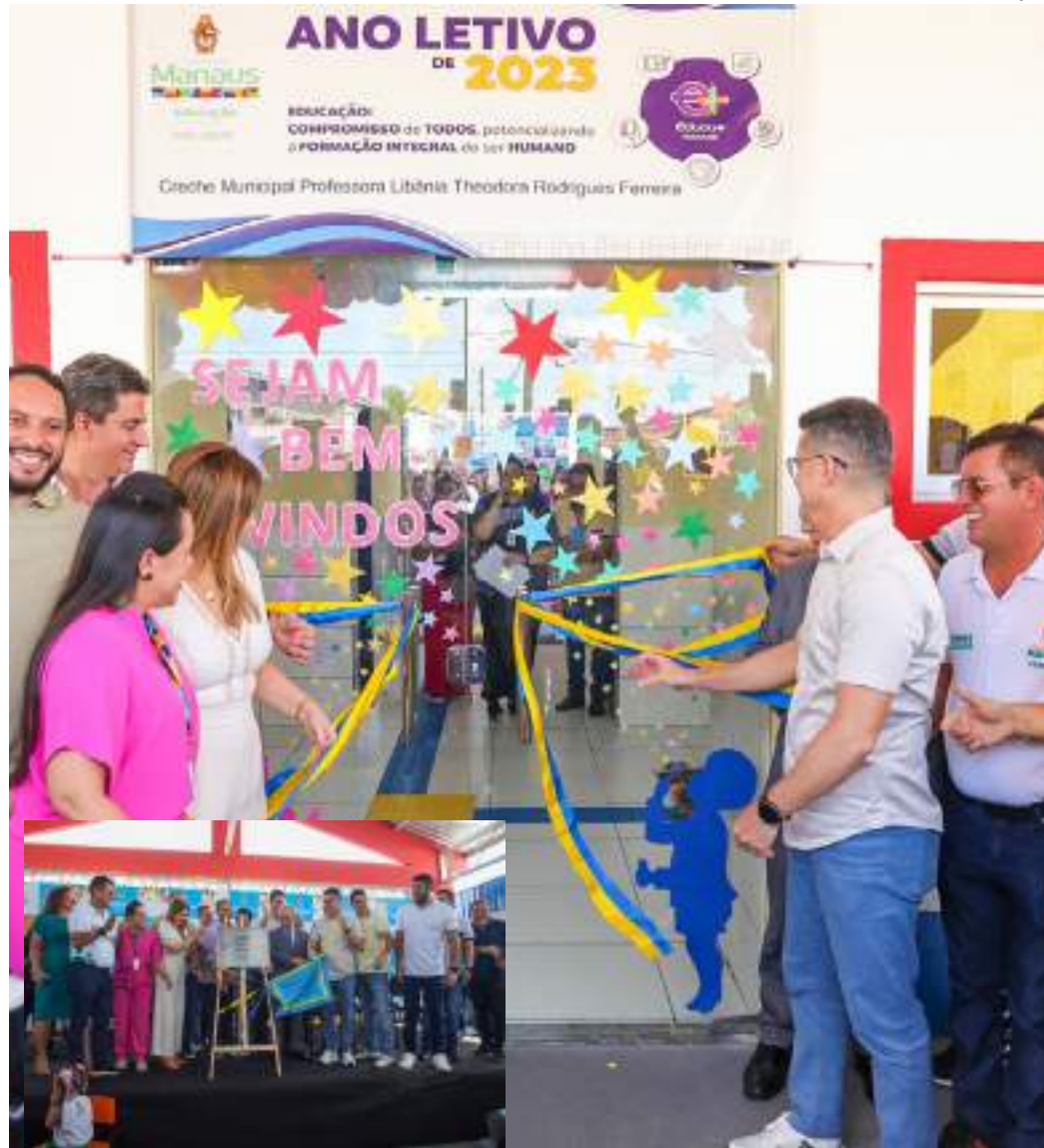
Unidade tem capacidade para atender cerca de 200 crianças

"Agora eu posso trabalhar tranquilamente. Aqui eu deixo a minha filha sem nenhuma preocupação, sei que ela é