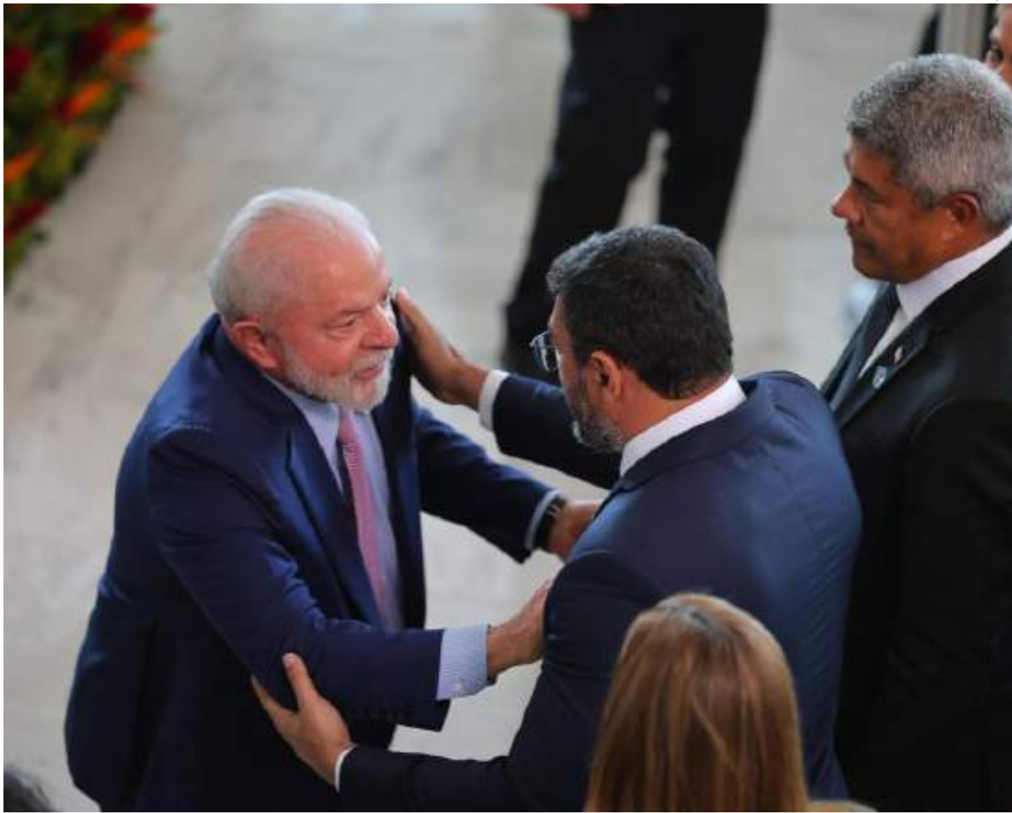
Lula e Wilson Lima estiveram juntos na posse do novo ministro do Turismo, Celso Sabino

"A gente sai da termoelétrica e entra para a energia verde que é a energia vinda de Tucuruí. E, portanto, damos adeus aos motores da usina