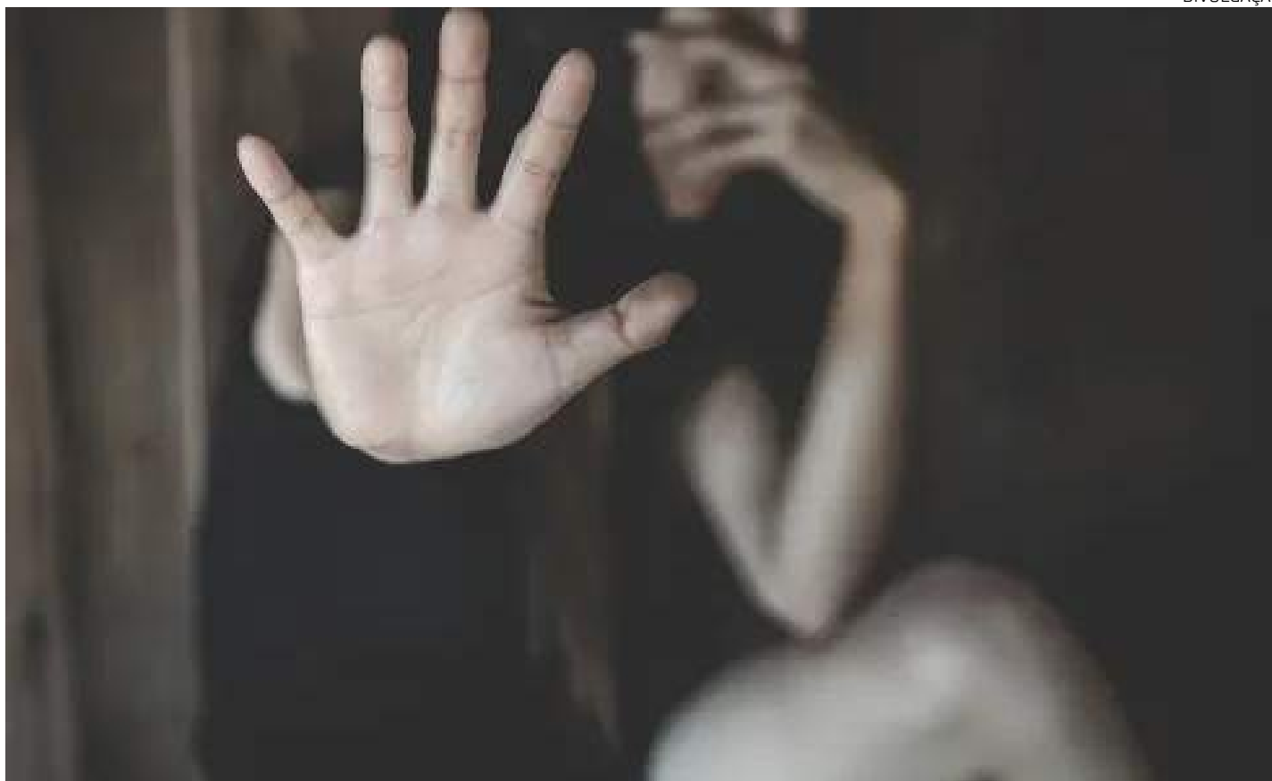
Amazonas se configura como o 4º Estado que mais registra casos de violência contra a mulher

A ocasião tem apresentação cultural do grupo de idosos do Centro de Referência de Assistência Social (Cras) Mutirão, feira de empreendedorismo feminino "Elas por Elas", ação de embelezamento para mulheres, oferta de atendimento psicológico, social e jurídico por in-