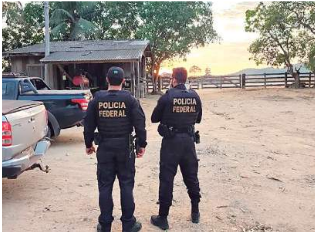
Operação abrange áreas de Mato Grosso e do Pará

"Em seguida, desmatariam tais áreas e as destinariam para criação de gado. Assim, os verdadeiros responsáveis pela exploração das atividades se sentiriam protegidos contra eventuais processos criminais ou administrativos, os quais seriam direcionados aos par-