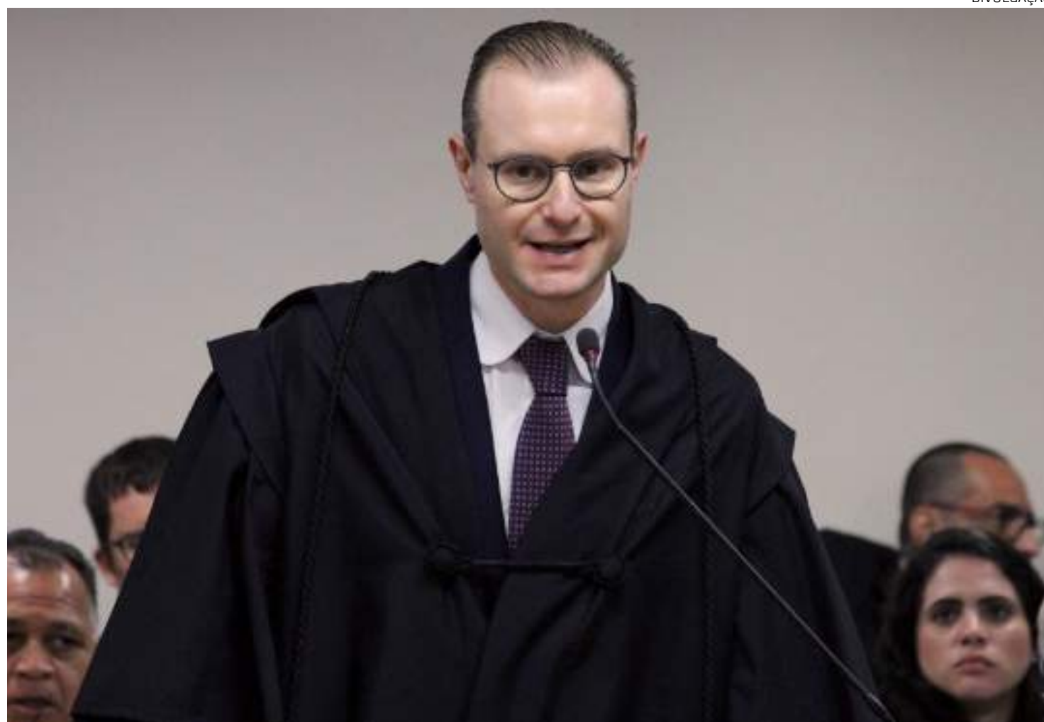
Novo ministro nasceu em Piracicaba e tem 47 anos. Ele poderá permanecer na Corte por 27 anos

soas que acompanharam a posse no plenário do STF, além dos presidentes da Câmara, Arthur Lira (PP-AL), do Senado, Rodrigo Pacheco (PSD-MG), de ministros