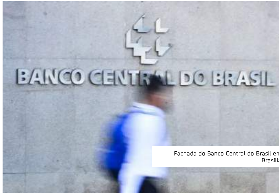
Fachada do Banco Central do Brasil em Brasília

mercado, se tudo seguir como esperado, a taxa básica de juros chegaria pouco abaixo dos 9%, e isso somente em 2025.