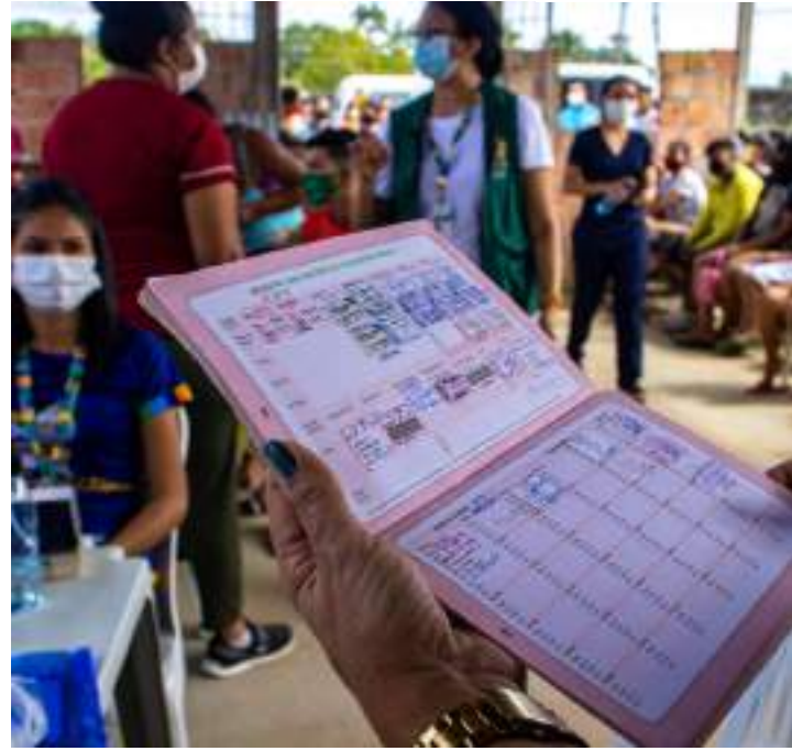
Vacinas estão disponíveis para grávidas e crianças de 0 a 6 anos

"A idade definida para aplicação das vacinas considera a maturidade do sistema imunológico para produzir anticorpos. Por este motivo deve-se vaci-