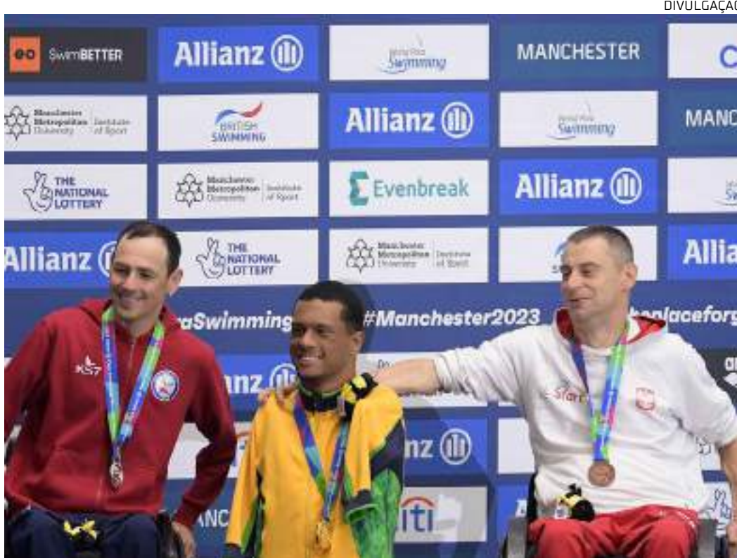
Atletas brasileiros subiram no mais alto lugar do pódio

"É a prova mais difícil para mim. Mas a cada treino e competição, eu tenho aprendido mais. Era o único recorde das Américas que não era meu e cheguei com o objetivo de batê-lo. Agora, podem pesquisar