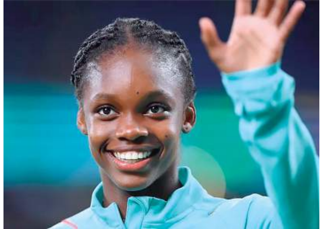
Atacante colombiana joga pelo Real Madrid e foi eleita a "Rainha da América" em 2022

Logo após despontar como uma grande pro-