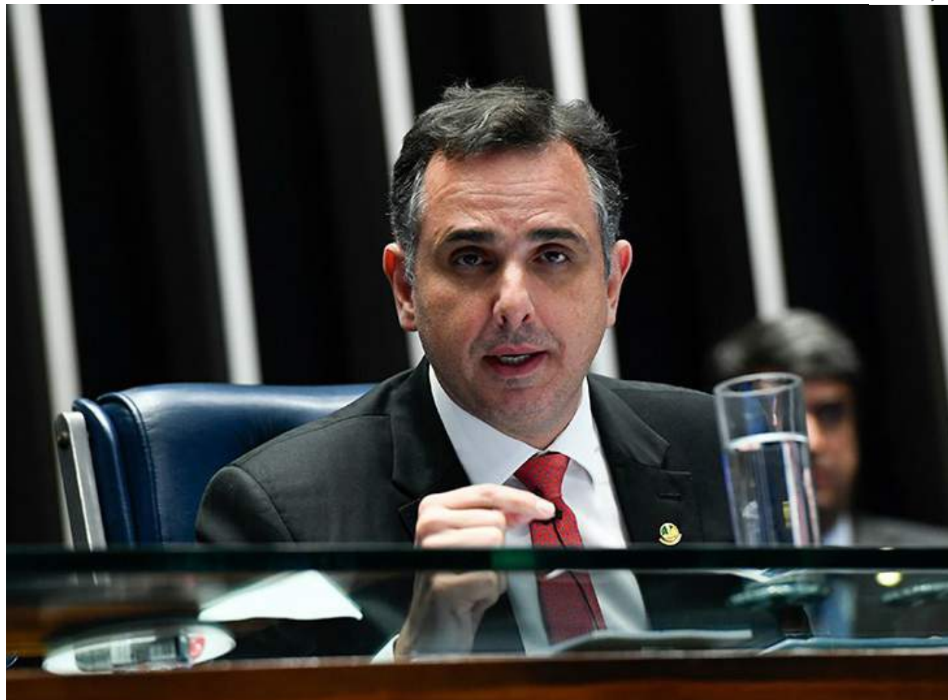
A descriminalização pautada pelo STF e rechaçada por Pacheco diz respeito ao uso pessoal da planta

O presidente do Senado afirmou também que o STF não pode tomar uma decisão contrária a uma lei vigente, que uma eventual descriminalização pelo Supremo sem discussão no Congresso Nacional e