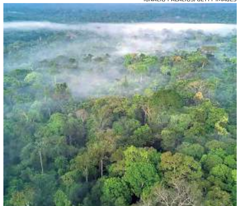
Encontro na Amazônia tem como foco a cooperação entre as nações