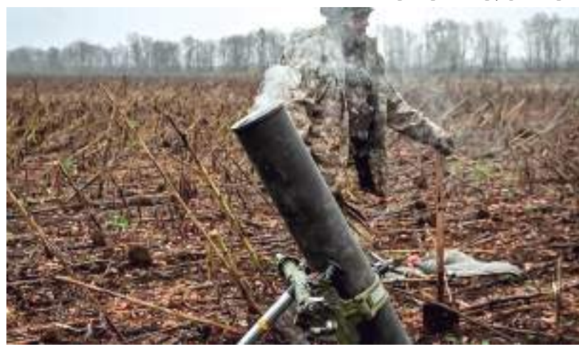
Região de Zaporizhzhia tem sido alvo de incursões ucranianas