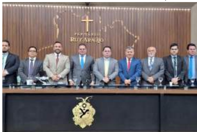
Equipe da Suframa apresenta Lei de Informática para a Amazônia