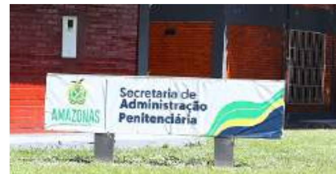
As visitas são agendadas por meio do Aplicativo Visita legal

A ferramenta está disponível no site www.seap.am.gov.br e no sistema operacional Android. O aplicativo é gratuito e o usuário deve baixá-lo na loja virtual Play Store. Com a implantação do sistema on-line de agendamento, os familiares dos reeducandos podem marcar dia e hora das visitas