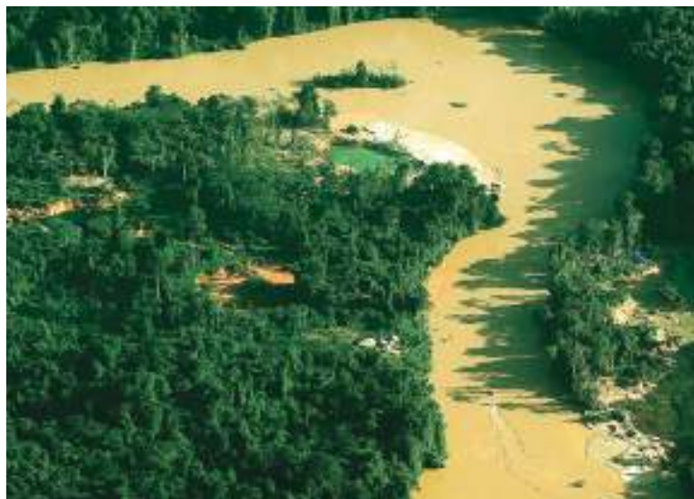
Ataque também matou agente de saúde e feriu outro indígena