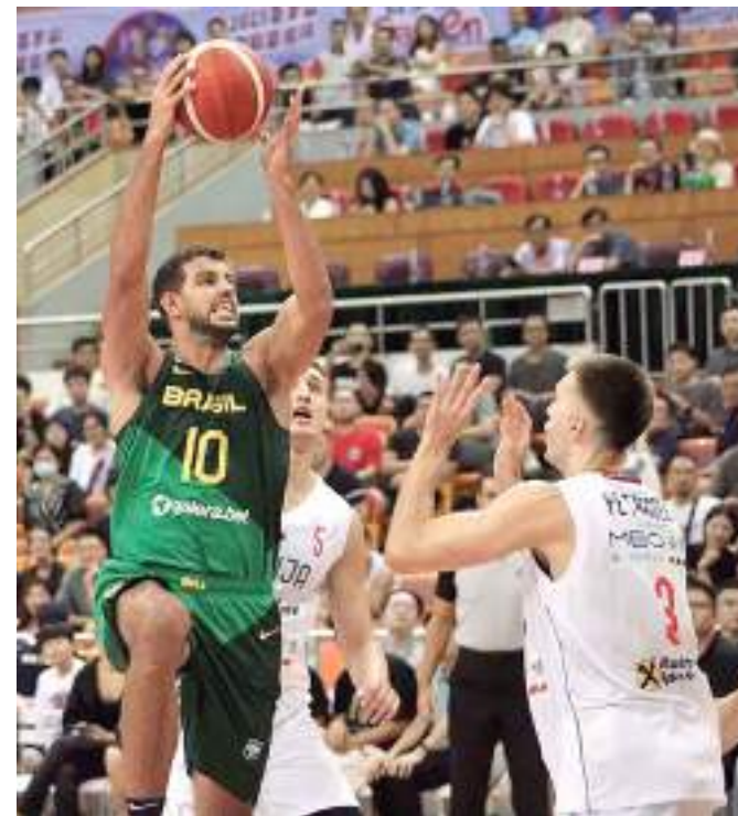
Brasil não conseguiu vencer a Sérvia em amistoso de basquete

A delegação brasileira viaja para Jacarta, na Indonésia, nesta terça, e estreia na Copa do Mundo no sábado, às 6h45 (de Brasília), contra o Irã. Os outros adversários na primeira fase serão Espanha e Costa do Marfim.