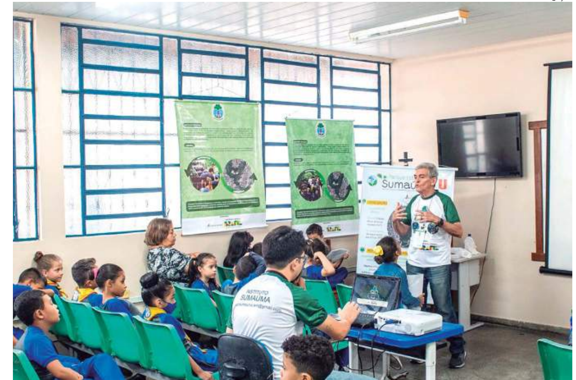
Ações fazem parte do projeto "Reconectar e Conservar"

Segundo ele, para o público infantil, a equipe utiliza o teatro de fantoches e a encenação de lendas da mitologia amazônica para abordar esses