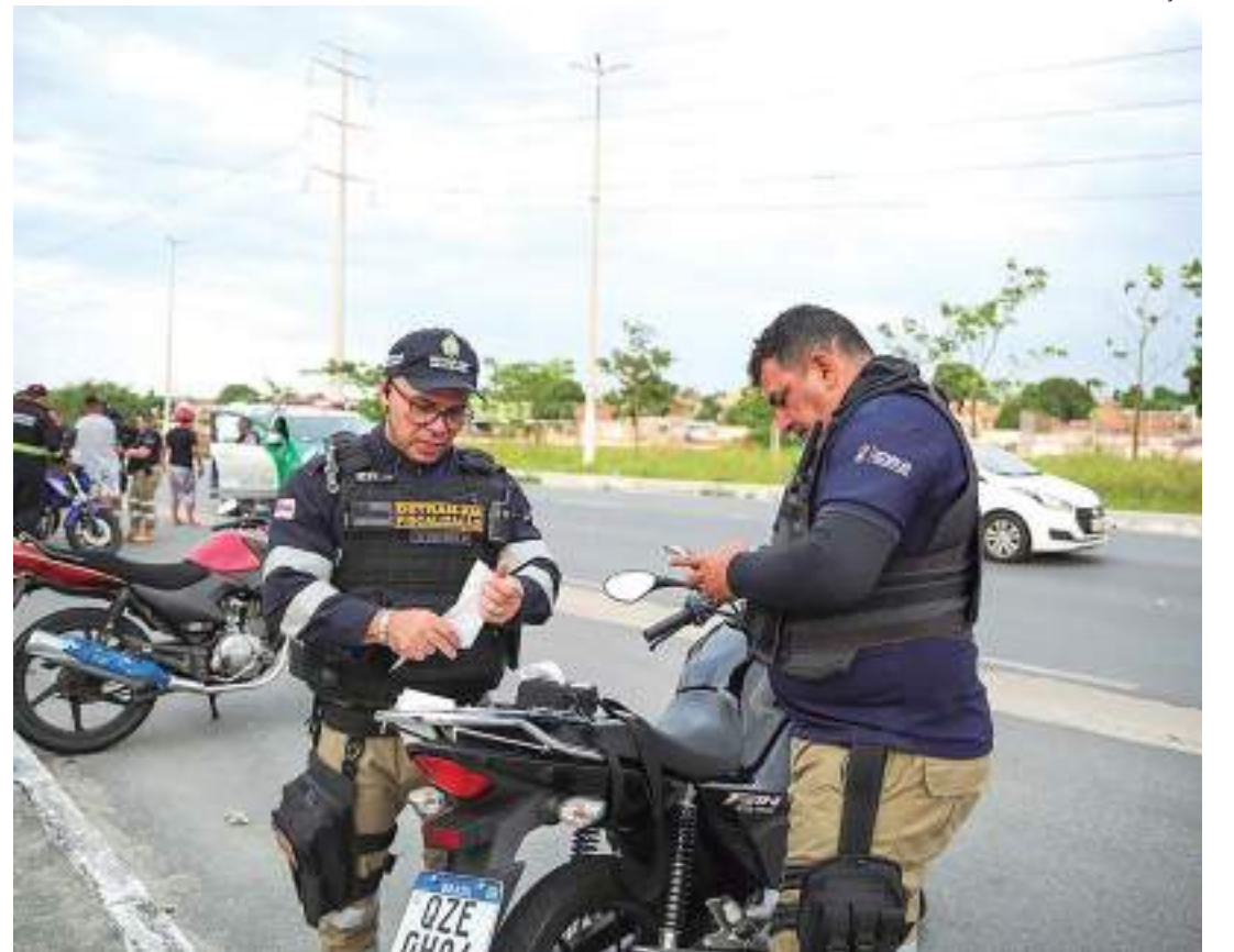
Durante fiscalização promovida na última semana, quase 100 pessoas foram autuadas por condução sem a devida permissão

"Outro meio de transporte, que está tendo a fiscalização intensificada, é o veículo automotor destinado ao transporte de passageiros com capacidade para até oito pessoas. Inclusive, os ocupantes desse modal de transporte representam 23% das mortes no trânsito", finaliza o coordenador da Fiscalização do Detran Amazonas, reforçando a necessidade de estar como veículo regular, documentação em dias e o uso constante dos equipamentos de segurança.