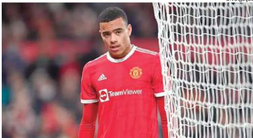
Mason Greenwood não jogará mais pelo Manchester United, por suspeita de estupro