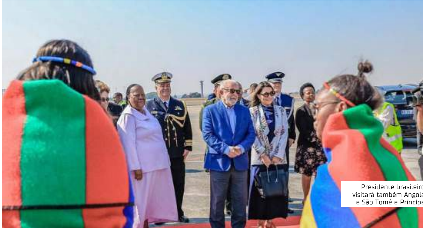
Presidente brasileiro visitará também Angola e São Tomé e Príncipe