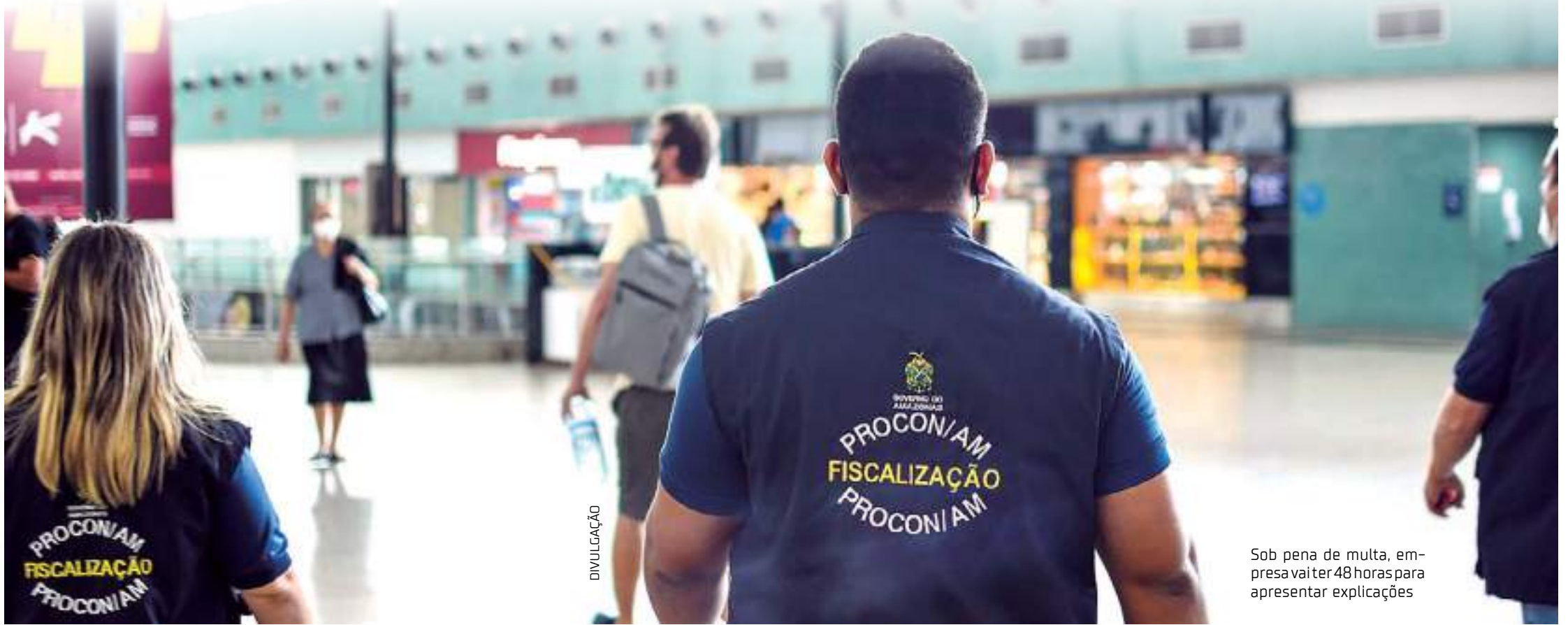
Sob pena de multa, empresa vai ter 48 horas para apresentar explicações

O Procon-AM dispõe de atendimento em sua sede, de segunda a sexta-feira, das 8h às 14h, na av. André Araújo, 1.500 - Aleixo, ou via telefone 0800 092 1512 / 3215 4009. Ou através do nosso site: www.procon.am.gov.br e e-mail: fiscalizacao@procon.am.gov.br .