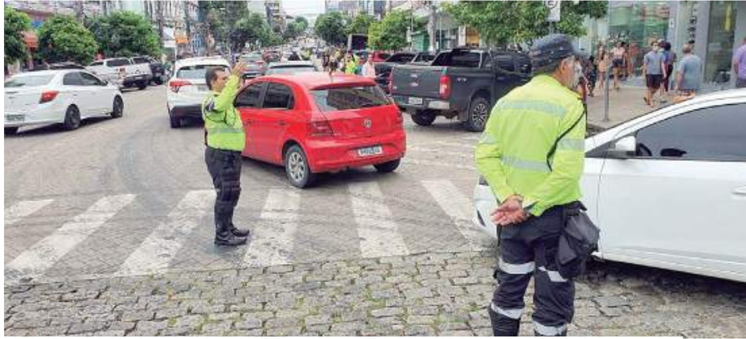
Agentes de trânsito passam a fiscalizar CNH, documento do veículo e a realizar teste de alcoolemia

"Com a aplicação das novas diretrizes, a fiscalização e atuação se tornam ferramentas