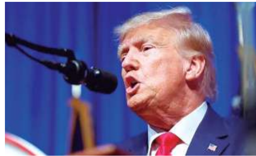
O ex-presidente dos EUA Donald Trump