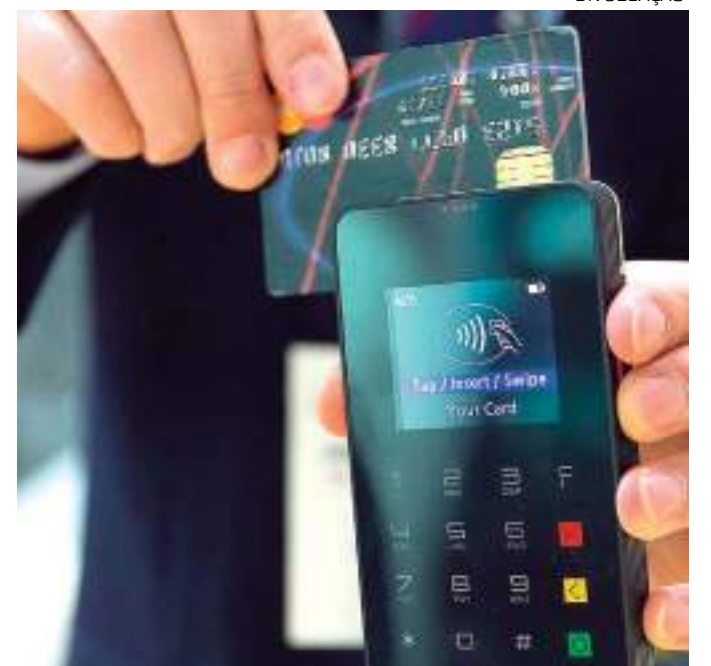
Homem usa cartão de crédito