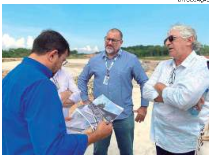
Novo prédio será construído no Lírio do Vale