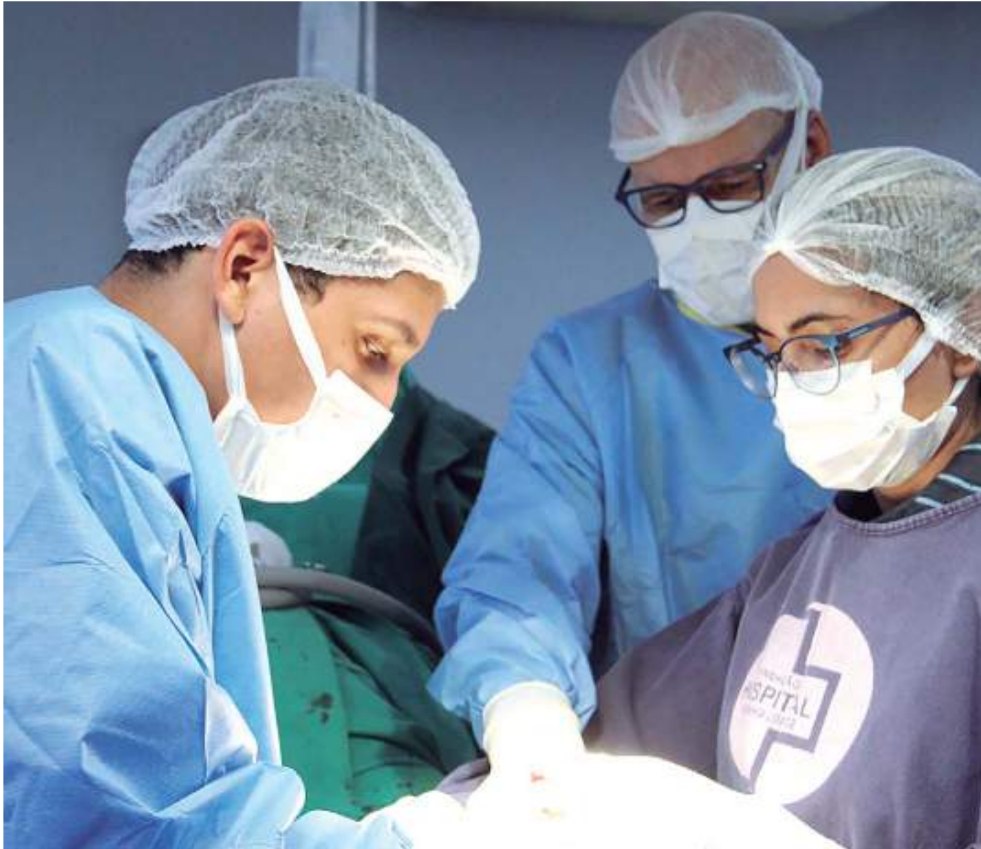
Ao todo, foram realizadas 4.542 cirurgias este ano