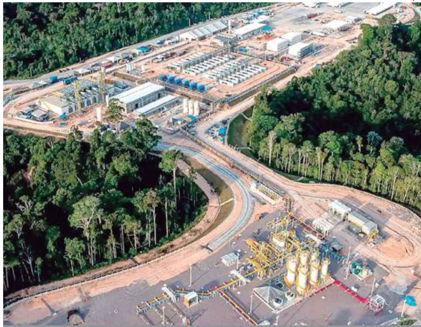
Empresas estarão sujeitas à compensação ambiental, com valor que será definido com base no grau de impacto

A iniciativa do governo surge após a Secretaria de Estado de Meio Ambiente (Sema) e o Ipaam serem alvos de representação por parte do Ministério Público de Contas (MPC), junto ao Tribunal de Contas do Estado do Amazonas (TCE-AM), em março do ano passado. Para o órgão, a falta da lei estadual dificultaria a execução adequada