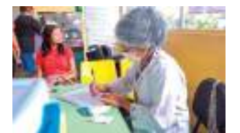
Vacinas podem ser tomadas de segunda a sexta, das 8h às 17h

Em Manaus, 83,57% das meninas entre 9 e 14 anos receberam a primeira dose da vacina contra o HPV, enquanto 64,70% receberam a segunda. Entre os meninos de 9 a 14 anos, 56,84% receberam a primeira dose e 29,87% foram protegidos com a segunda. Os dados apontam também que 38.990 meninas e 77.455 meninos precisam completar o esquema vacinal.