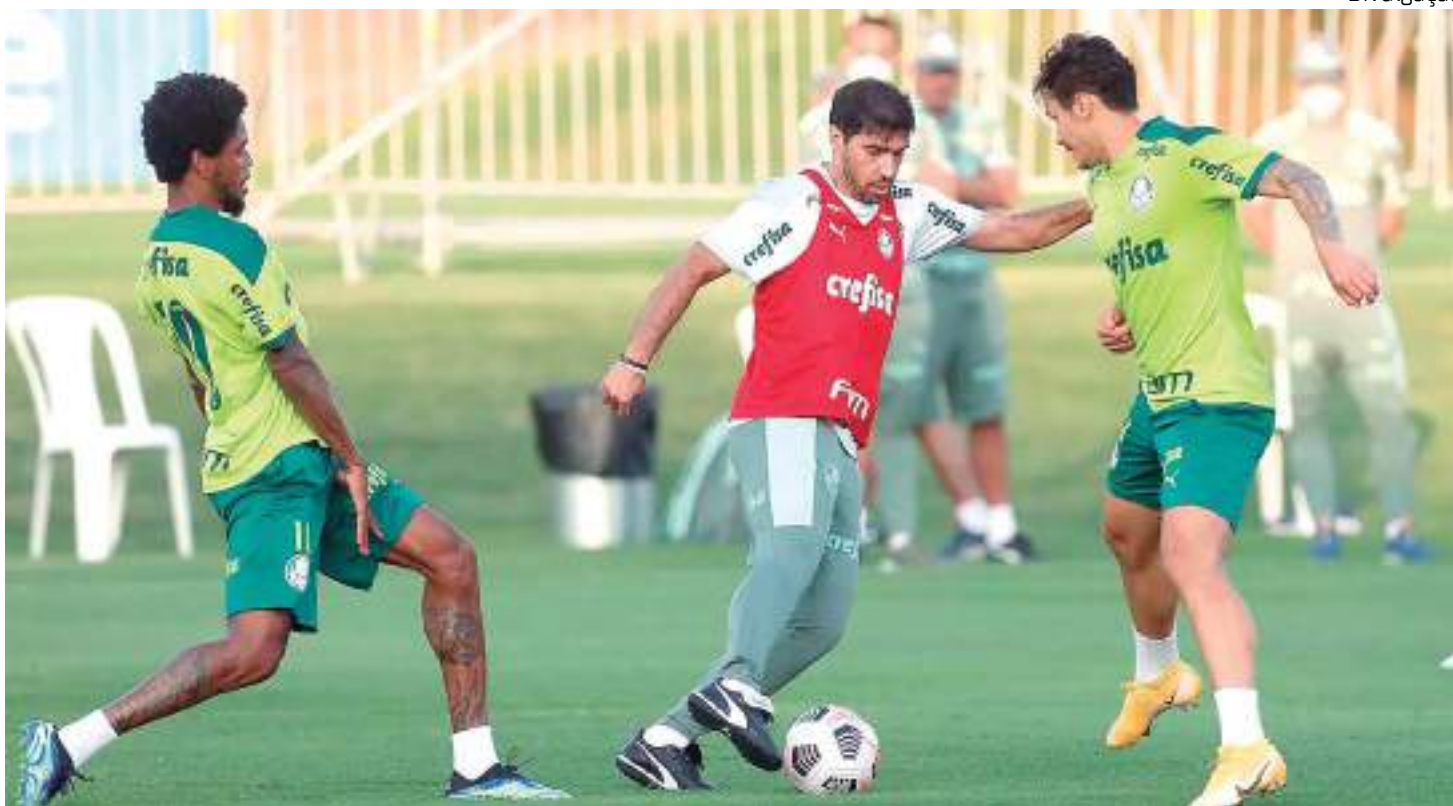
Time paulista realiza treino para enfrentar o Deportivo Pereira pela Libertadores