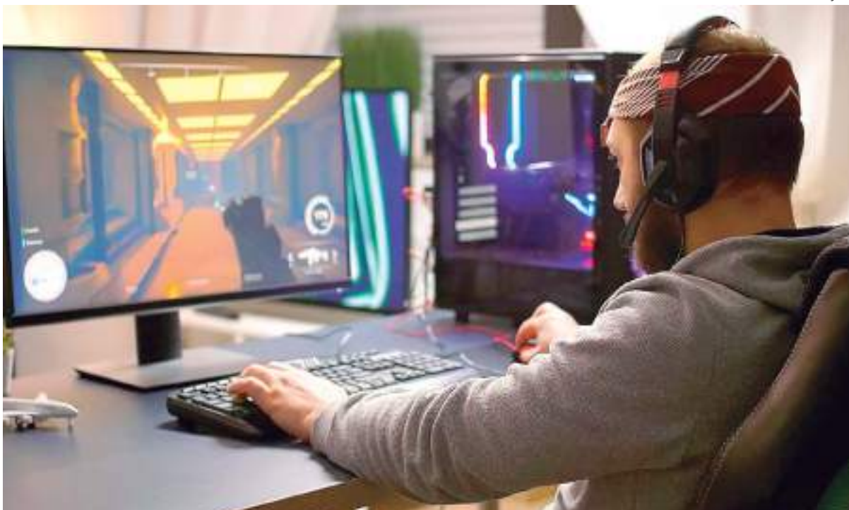
Fã do universo dos jogos eletrônicos