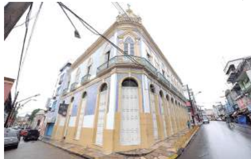
Atividades acontecem no Teatro da Instalação, Gebes Medeiros, dentre outros locais