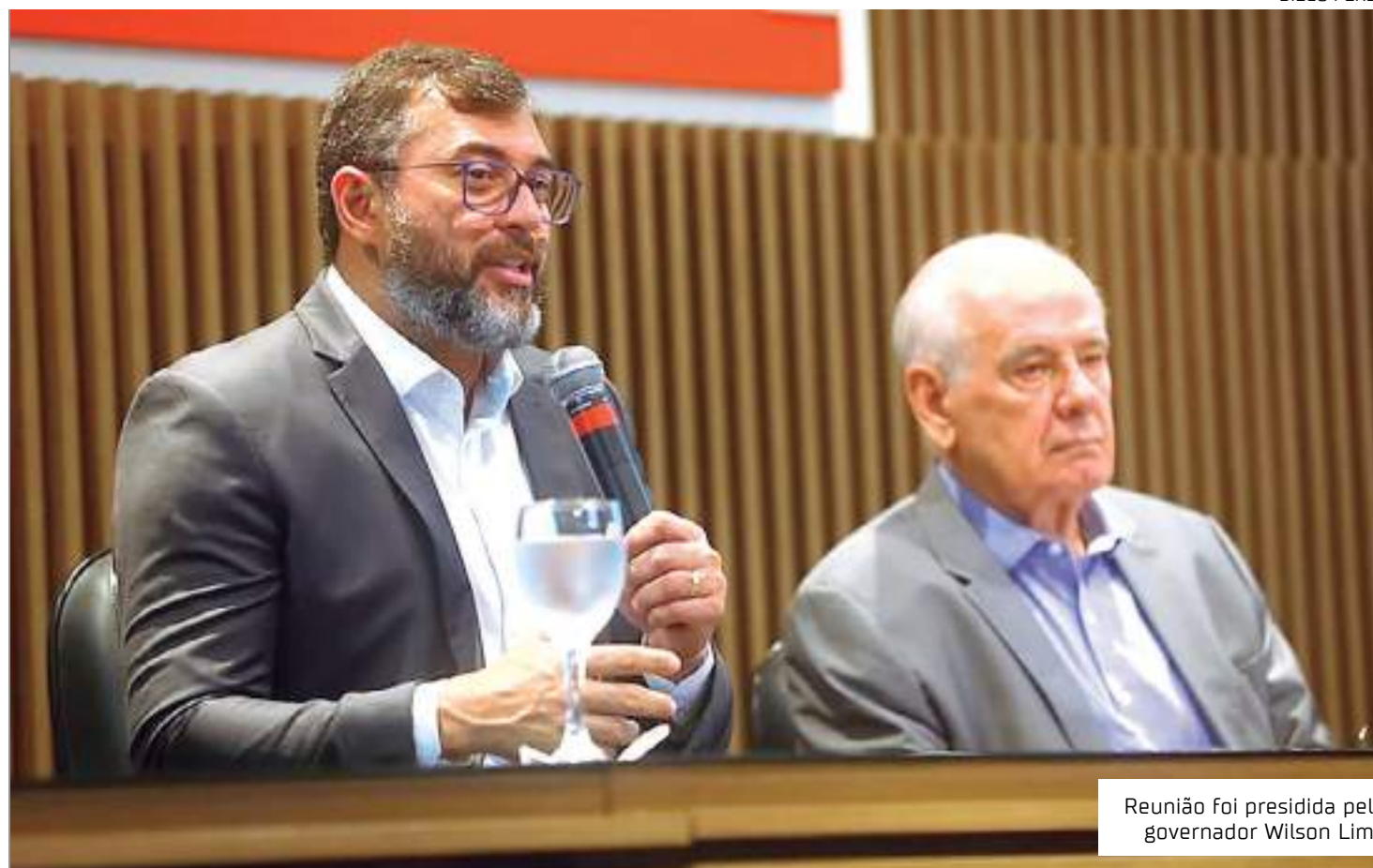
Reunião foi presidida pelo governador Wilson Lima

O Codam é um órgão colegiado com funções de assessoramento do Governo do Amazonas nos assuntos referentes ao desenvolvimento econômico e social e na formulação da política de incentivos fiscais e extrafiscais do Estado, tendo à frente a Secretaria de Estado de Desenvolvimento Econômico, Ciência, Tecnologia e Inova-