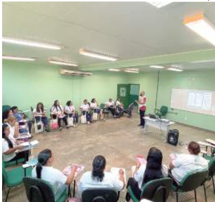
Iniciativa inspirou criação de política pública no Estado

Não é possível construir um futuro de qualidade para a Amazônia sem pensar no bem-estar de seus habitantes, as gerações do