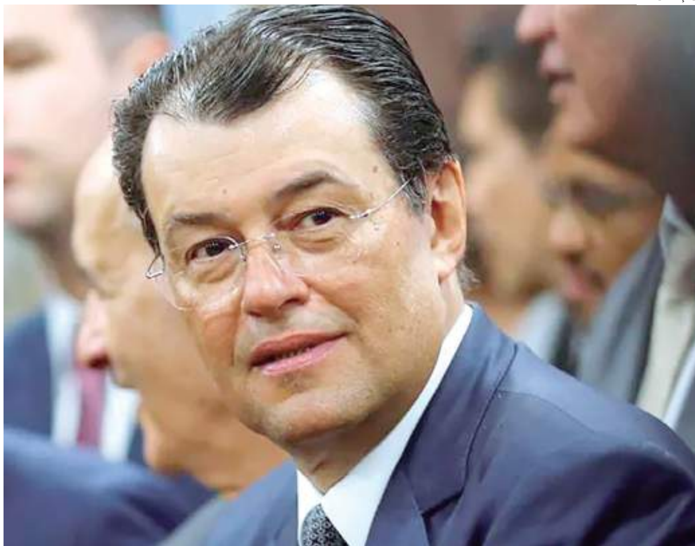
Braga e Rodrigo Pacheco defenderam o teto; presidente do Senado ainda pediu olhar para a qualidade do gasto público

Também esteve presente o presidente do Senado, Rodrigo Pacheco (PSD-MG). O parlamentar também defendeu a limitação da carga