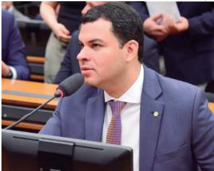
PL atinge em cheio casos em que os benefícios de aposentadoria são suspensos