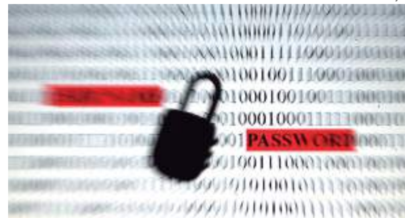
Propostas sobre proteção de dados pessoais são debatidas no Congresso