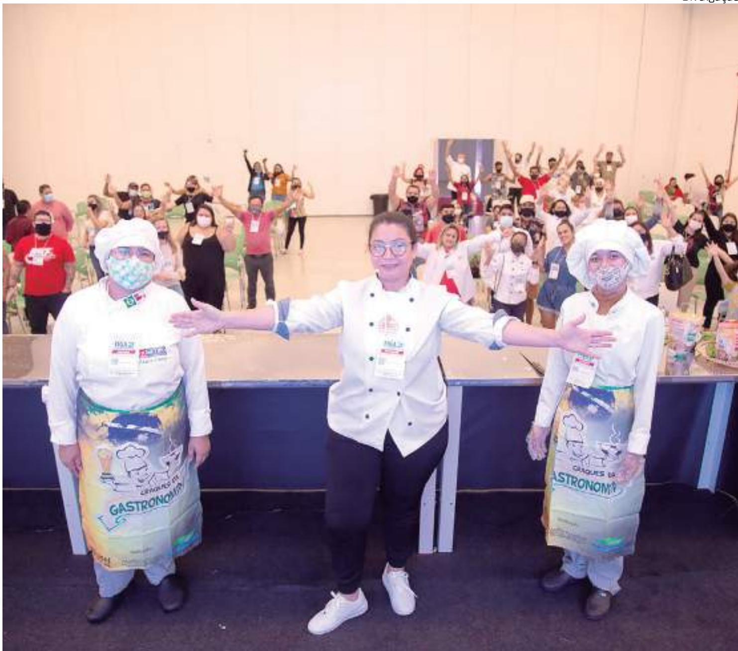
Evento contará exposição de produtos, arena gastronômica dentre outras atividades

Evento gastronômico será realizado nos dias 30 de setembro e 01 de outubro, com entrada gratuita