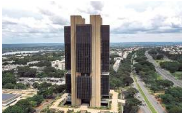
Fachada do Banco Central do Brasil em Brasília