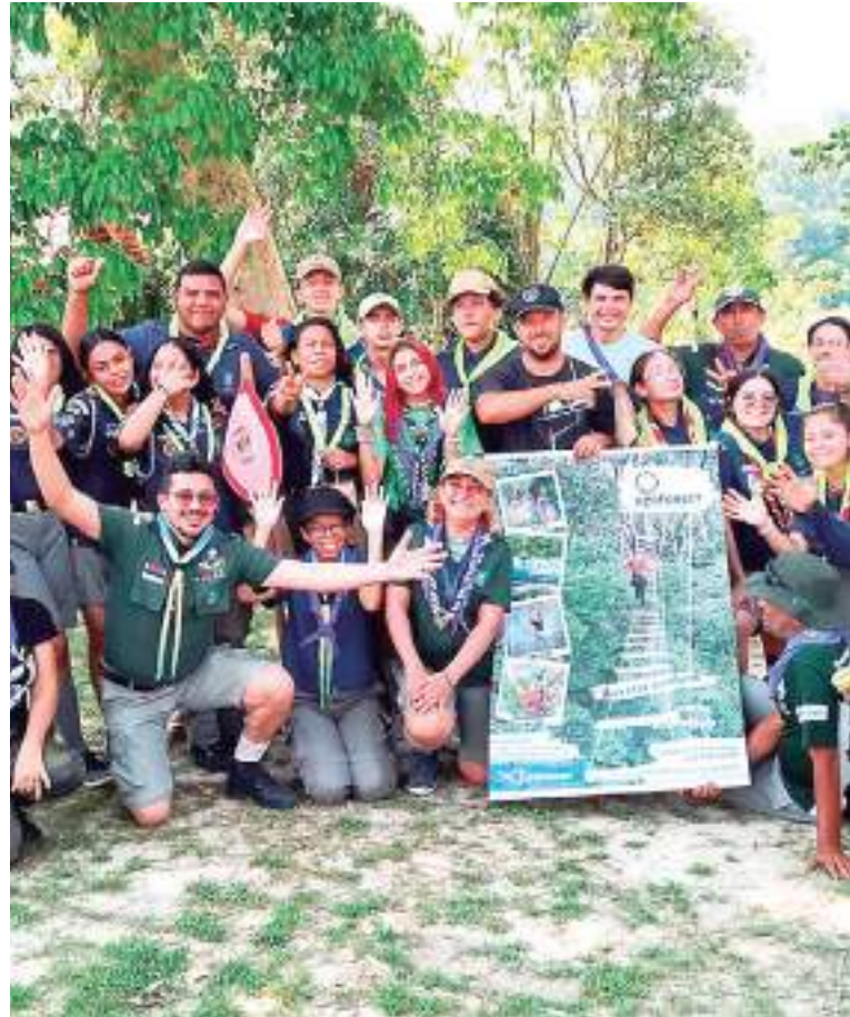
Ao todo, mais de 40 escoteiros do ramosênior, com idade de 15 a 17 participaram