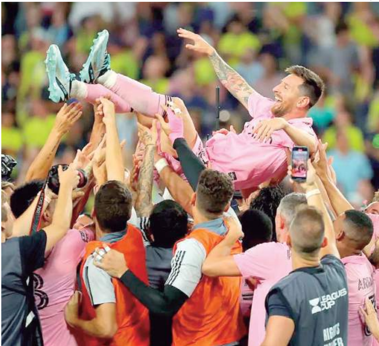
Após chegada de Messi no Inter Miami, time conquistou títulos importantes

Lionel Messi alterou os rumos do Inter Miami dentro e fora do campo. Além do título da Leagues Cup e da sequência de nove jogos sem perder, a chegada do craque argentino turbinou os negócios do clube norte-americano.