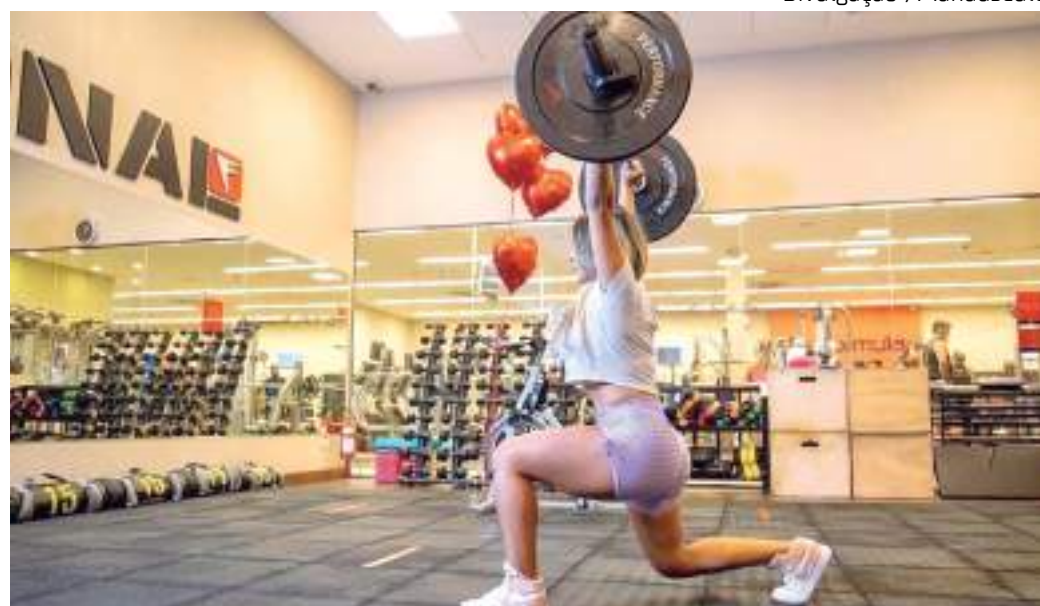
Desafio propõe adoção de novos hábitos, como alimentação equilibrada e prática -de exercício físico