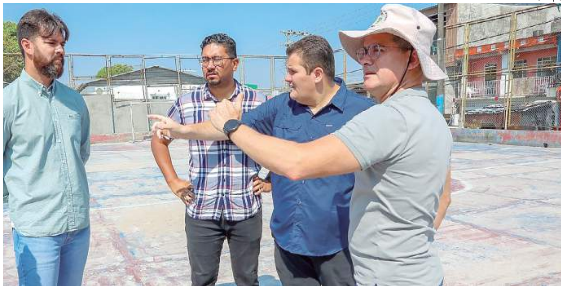
Entre as ações, está a reinauguração da Unidade Básica de Saúde (UBS) Geraldo Magela, a reestruturação da praça de alimentação e o terminal de ônibus do local

“Nós estamos recuperando a feira do Armando Mendes, as ruas, e até o dia 15 de setembro vamos entregar a UBS Geraldo Magela, que é porte 4, vamos