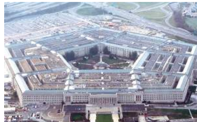
O Pentágono é a sede do Departamento de Defesa dos EUA