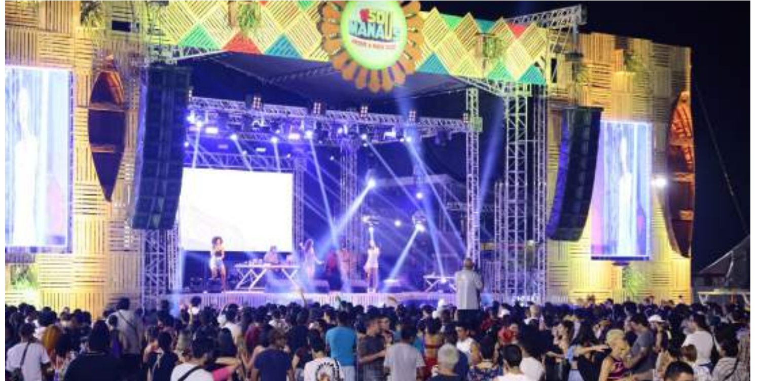
Maioria dos custos do Sou Manaus 2023 será viabilizado pelos patrocinadores do evento

A expectativa é que 150 mil pessoas participem do Sou Manaus Passo a Paço 2023 por noite. O festival acontece nos dias 5, 6 e 7 de setembro, no Centro Histórico de Manaus. No último dia de evento, dia 7, não será necessário ter a pulseira para ter acesso aos palcos.