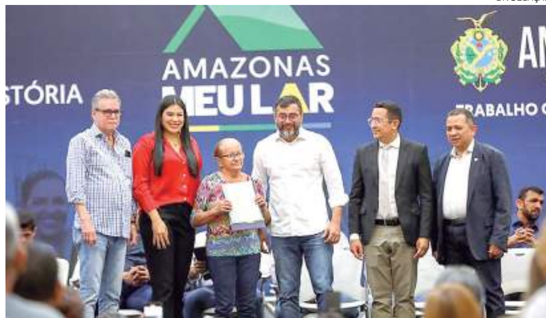
Pré-cadastro pode ser realizado pelo site www.amazonasmeular.am.gov.br

A cerimônia foi marcada, ainda, pelo pagamento de R$ 15,6