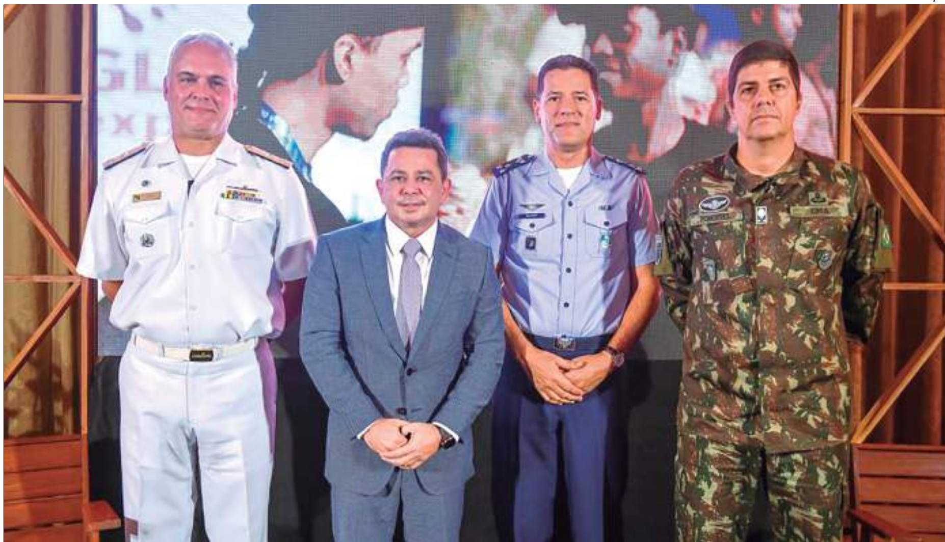
Vice-governador destacou a importância da atuação coordenada do Estado junto ao Exército

"É a oportunidade de tratar de questões que são sensíveis à Amazônia, que são sensíveis à soberania nacional, além do desenvolvimento da biotecnologia, da proteção dos recursos naturais dentro do patrimônio da