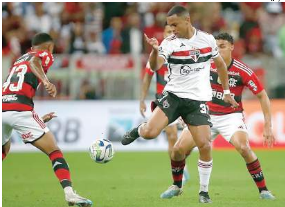
CBF realizou sorteio do mando de campo para final do Copa do Brasil

"Acho que muito mais importante do que uma conquista pessoal, seria a conquista de um clube. Para mim, isso tem muito mais valor. Eu tenho uma satisfação muito grande de ter trabalhado no Flamengo, que hoje é a equipe rival da competição. Mas para mim o que vai marcar realmente é a possibilidade de disputar mais uma final. É a minha quarta disputa de Copa do Brasil, mas o principal é que possa satisfazer o clube e que o São Paulo possa fazer a melhor competição possível. Flamengo e São Paulo chegaram por merecimentos neste momento. São grandes equipes, independente de estar jogando no Morumbi ou no Maracanã. Não existe favoritismo", destacou.