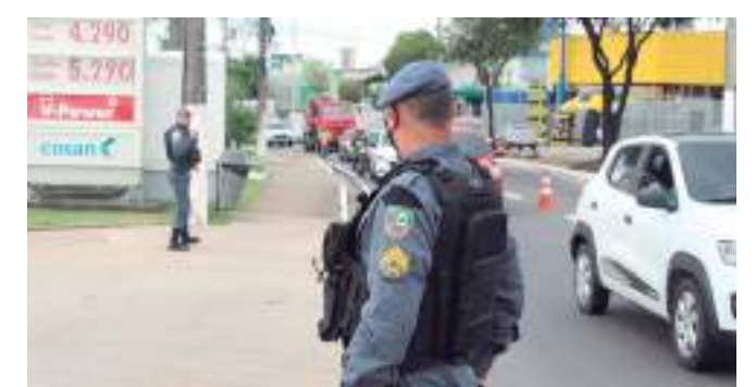
números revelam redução nas zonas oeste, leste e norte

"O Sistema de Segurança, por meio do Ciesp, faz o monitoramento de indicadores, e as Mortes Violentas Intencionais (MVI) representam um indicador que o sistema contabiliza diariamente. Todas essas informações são repassadas às polícias Militar e Civil, que trabalham muito alinhadas com a nossa perícia técnica. E o resultado dessa ação integrada é esse, a redução de vários indicadores, dentre eles a de latrocínio", afirmou o secretário.