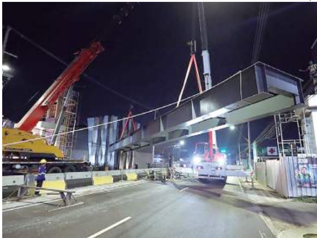
Passarela é parte de uma medida de intervenção da prefeitura para diminuir o engarrafamento na avenida

talação do piso, do guarda-corpo, da cobertura, da parte elétrica e a conclusão da pintura.