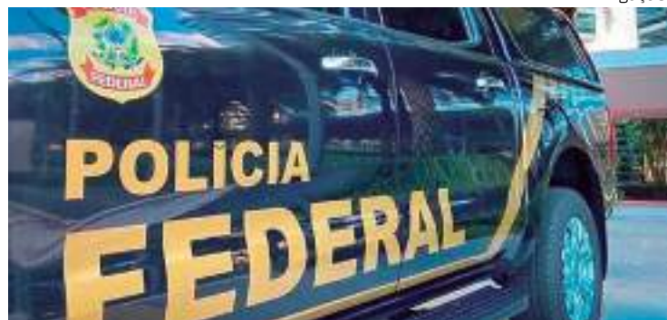
Homem era responsável por coordenar a exportação de cocaína

Um homem peruano foi preso em Manaus, pela Polícia Federal (PF) na segunda-feira (11), por meio de um mandado de prisão expedido pelo Supremo Tribunal Federal (STF). Ele é suspeito do crime de tráfico internacional de drogas.