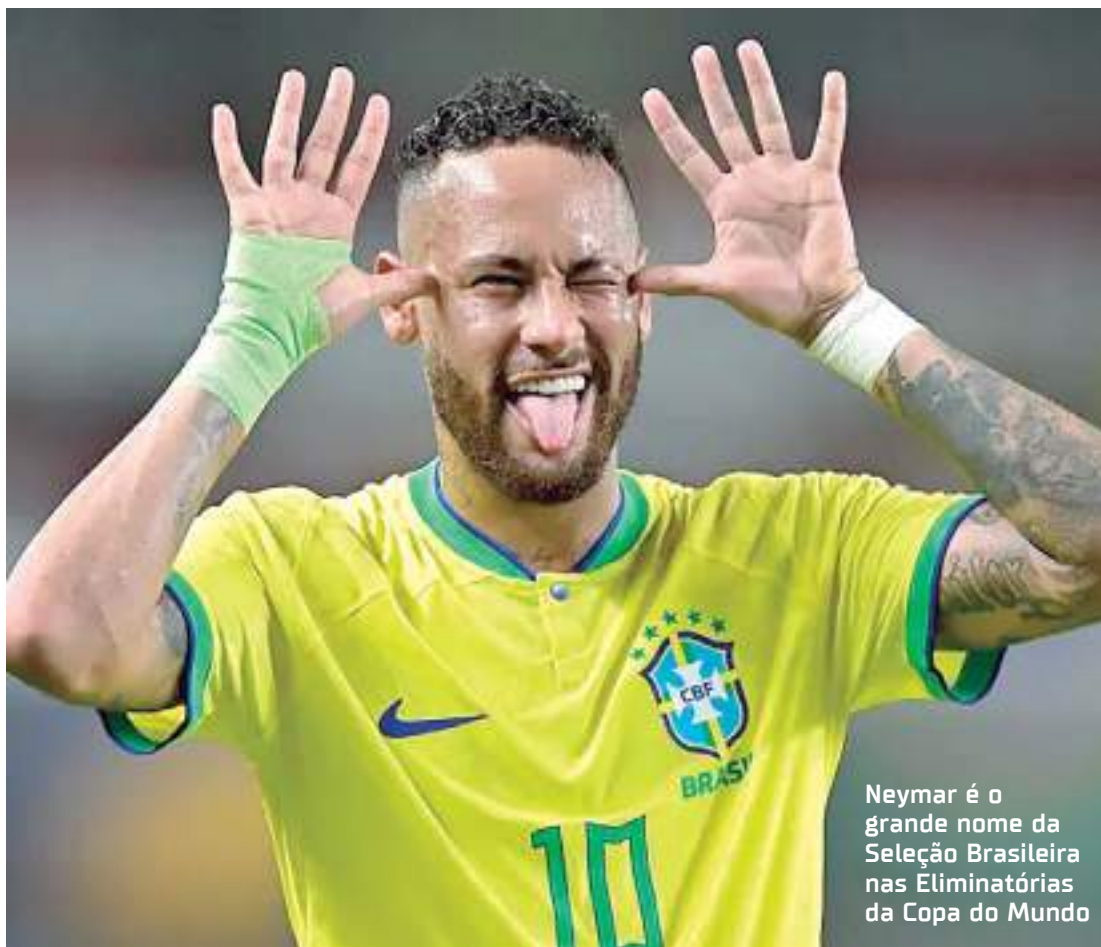
Neymar é o grande nome da Seleção Brasileira nas Eliminatórias da Copa do Mundo