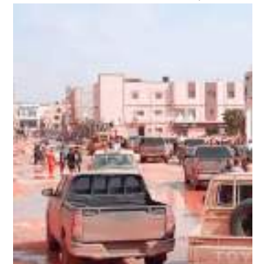
Cidade de Derna foi inundada por águas que romperam barragens

A Líbia, que suportou mais de uma década conflitos e que ainda não tem um governo central que possa abranger todo o país, está particularmente em risco. As autoridades gregas afirmaram na última segunda-feira (11) que mais de 4.250 pessoas foram evacuadas de aldeias e assentamentos na região.