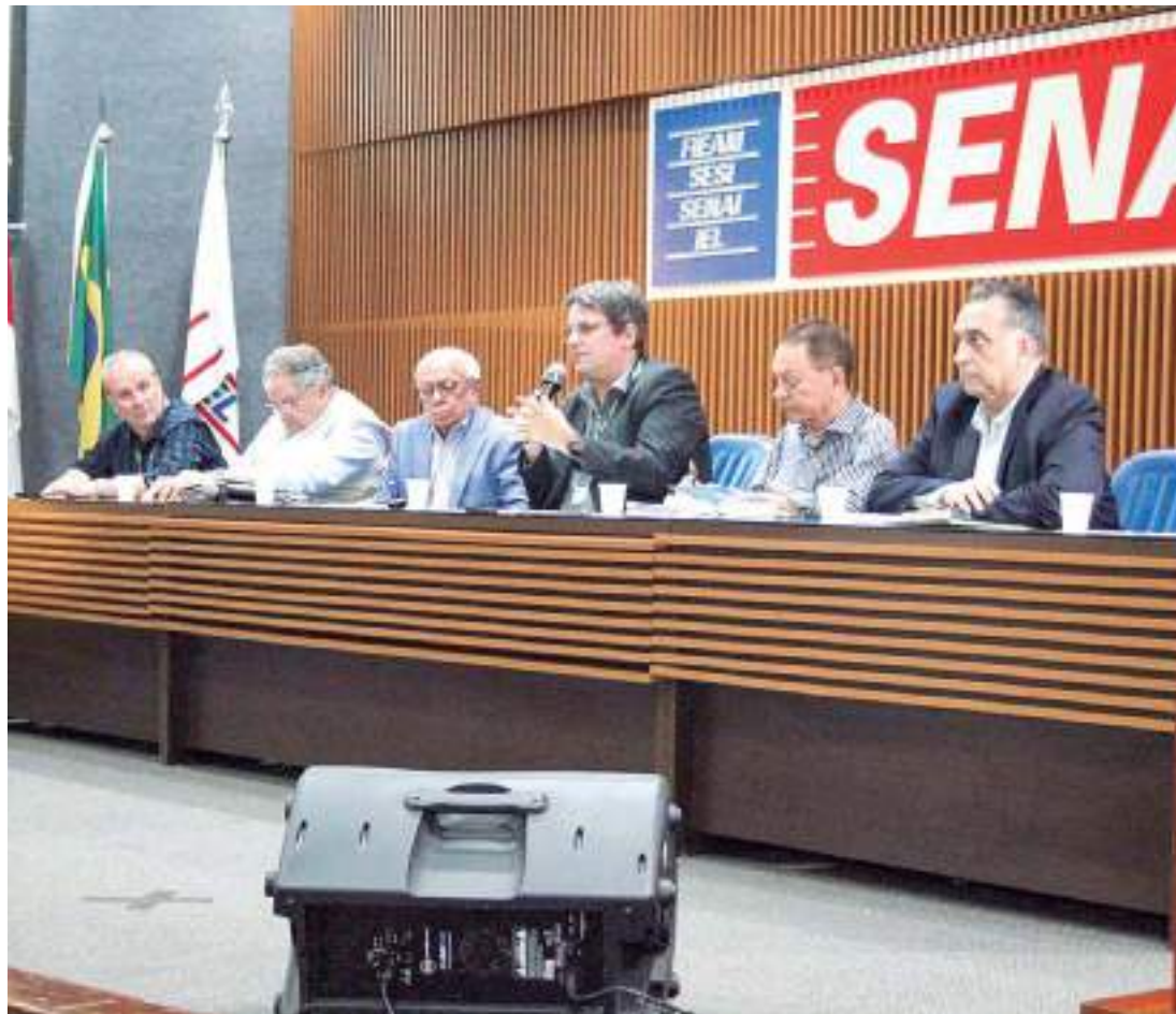
Reunião contou com representantes das sete Câmaras Setoriais

representantes das sete Câmaras Setoriais estruturadas da seguinte forma: Agroindústria, Bioindústria, Comércio e Serviços, Indústria, Micro e Pequenas Empresas, Recursos Minerais e Turismo.