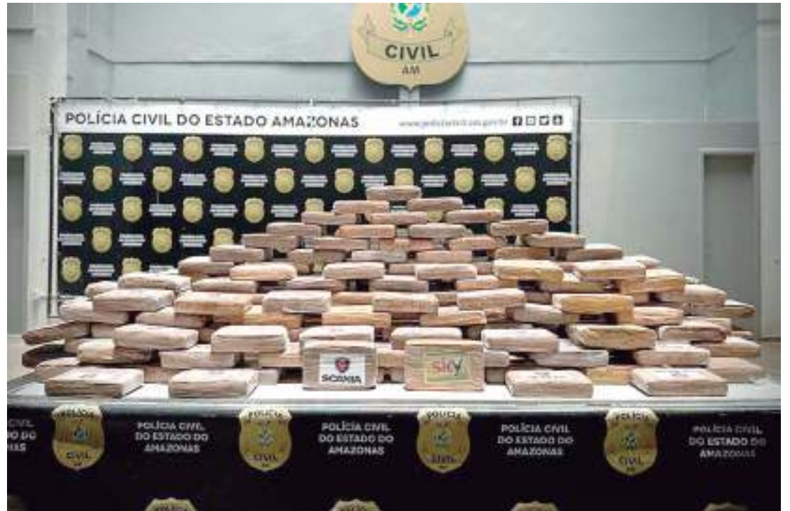
Polícia apreende 200 quilos de cocaína no ramal do Brasileirinho

De acordo com o delegado Ericson Tavares, títu-