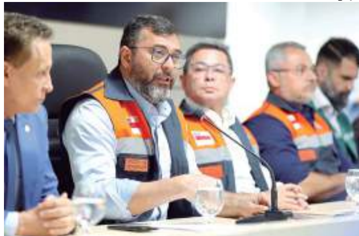
Governador fez anúncio ao lado do seu vice e 15 titulares de diferentes órgãos

tou uma sala de situação para controle do Painel do Fogo, ferramenta que permite o monitoramento via satélite dos focos de calor. A sala de situação, além do monitoramento, fará o compilado técnico e detalhado dos dados diários de ocorrências de incêndio na capital e interior.