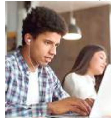
Vagas são para estudantes de Manaus, Tefé e Coari

O IEL não recebe currículos por e-mail, nem de forma presencial. A participação será via sistema por meio do cadastro. As vagas ficarão disponíveis até completar o número máximo de candidatos a serem encaminhados de acordo com a demanda da empresa cliente.