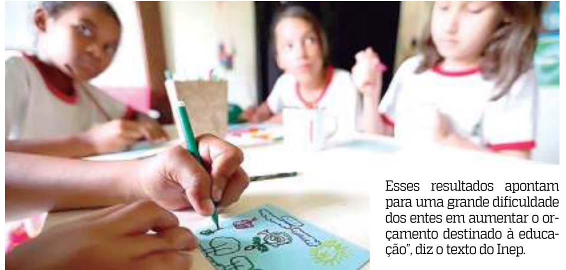
Crianças em escola da rede pública de ensino

Sobre essa medida de investimento, a OCDE faz uma ressalva: “O investimento na educação como porcentagem do PIB é uma medida da prioridade que os países atribuem à educação, mas não reflete os recursos disponíveis nos sistemas educativos, uma vez que os níveis do PIB variam entre países”.