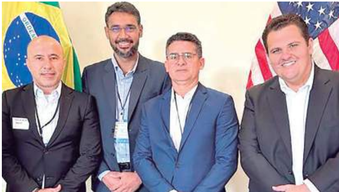
Prefeito frisou que oportunidade de participar do programa é única

“A nossa gestão pensa Manaus de uma forma diferente. Nós sabemos do tamanho e da importância da capital amazonense e vislumbramos uma grande margem para o desenvolvimento. Por isso, oportunidades como essa são impor-