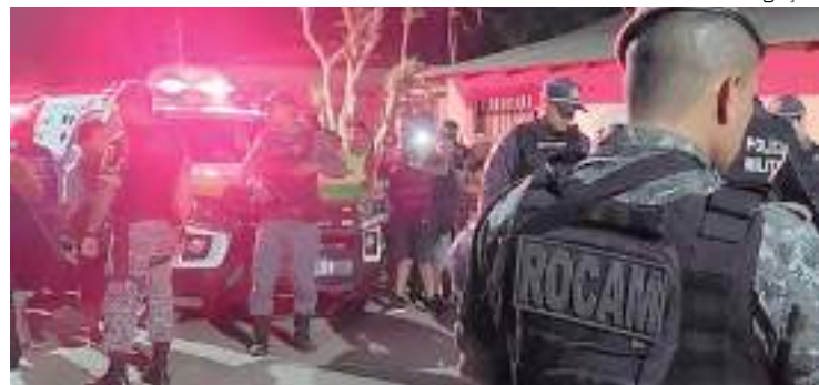
Homem foi morto com ao menos sete tiros

Um homem de 36 anos, que não teve o nome divulgado, foi assassinado a tiros na noite de segunda-feira (25), em uma rua do bairro Mamoud Amed, em Itacoatiara, interior do Amazonas.