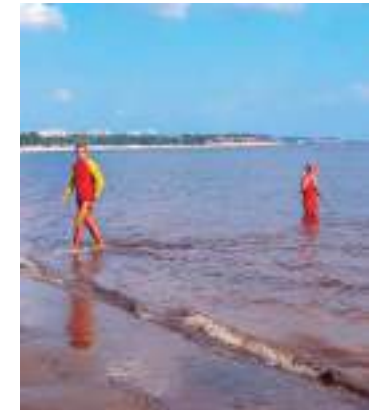
Ação busca alertar sobre buracos ou depressões que podem surgir no rio

Os buracos ou depressões podem surgir do movimento natural de subida e descida das águas do rio. A interdição do uso da praia pode ocorrer sempre que os laudos e/ou relatórios comprovarem que a praia encontra-se imprópria para o uso dos banhistas.