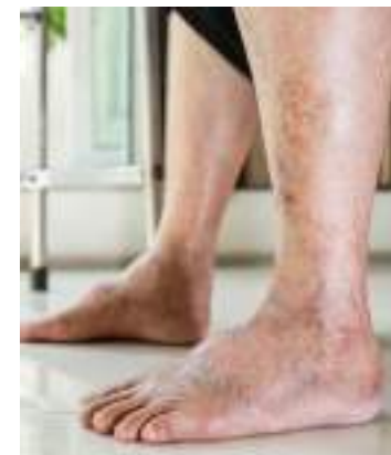
Aumento da temperatura das pernas faz parte dos sintomas

Outro aspecto importante é a conscientização sobre a doença para identificar fatores de risco e sintomas, aumentando as chances de sucesso nos tratamentos preventivos e terapêuticos.