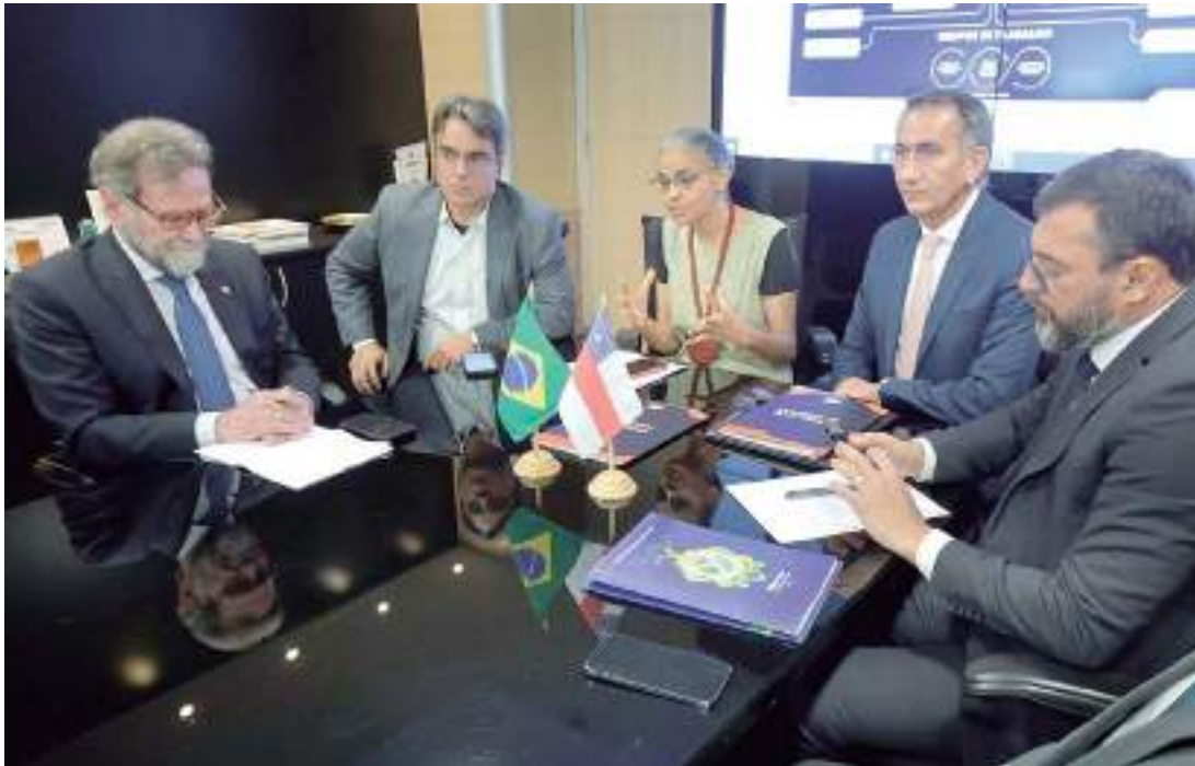
Reunião em Brasília teve presença da ministra Marina Sila e ministro Waldez Góes

“Nós temos três aspectos que são importantes para se levar em consideração nessa questão de estiagem: o primeiro deles é a questão da ajuda huma-