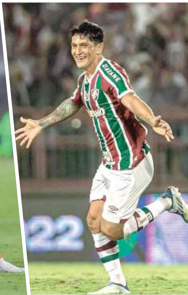
Cano quer a artilharia do Flu na Libertadores

com características ideais de defesa para a primeira partida da eliminatória contra o Fluminense, enquanto Bustos é visto como um jogador mais ofensivo e, talvez, ideal para a partida de volta.