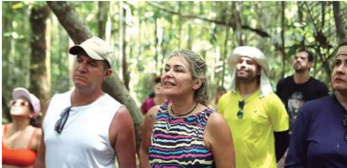
Segundo levantamento, 28,92% dos turistas visitaram o Amazonas pela primeira vez