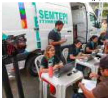
Atendimento à população começa a partir das 8h

A Prefeitura de Manaus, por meio da Secretaria Municipal do Trabalho, Empreendedorismo e Inovação (Semtepi), realiza, de quarta a sexta-feira, 27, 28 e 29 de setembro, a ação de serviços itinerantes no conjunto Viver Melhor, bairro Lago Azul, na zona Norte de Manaus. No local, a população terá acesso gratuito a va-