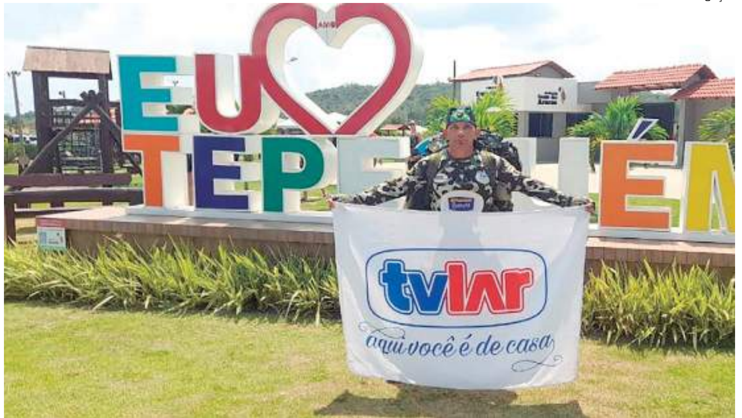
Atleta "Surucucu" participou da corrida da cidade de Tapequém

"Surucucu tem se destacado de forma notável em sua jornada esportiva, demonstrando não apenas habilidades excepcionais em sua disciplina, mas também um compromisso inabalável com os valores de determinação, superação e inclusão. Sua paixão pelo esporte ressoa profundamente com a missão da TVLar de enriquecer vidas e comunidades. Sua trajetória inspiradora é uma história que merece ser compartilhada com o mundo, e estamos entusiasmados por sermos parte disso", enfatizou o Diretor-Executivo da