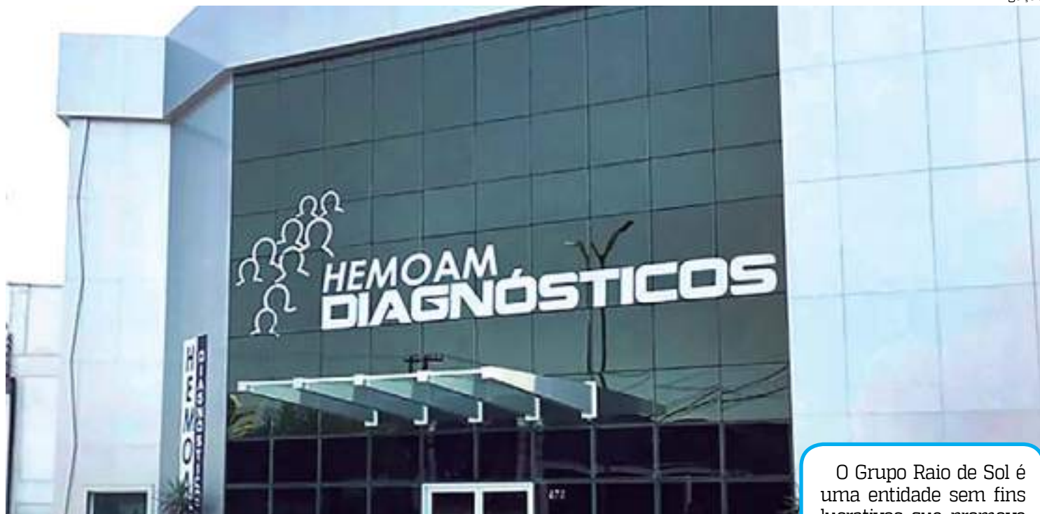
Laboratório Hemoam Diagnósticos oferece exames gratuitos

Mundial da Saúde - OMS, o diagnóstico precoce consiste no acompanhamento por meio de testagem para identificar a doença precocemente. O Instituto Nacional do Câncer, destaca que essa estratégia pode reduzir a prevalência do câncer em 80% das crianças e adolescentes.