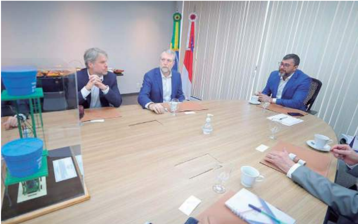
Wilson Lima lembrou que o BID já é um importante parceiro do Governo do Estado

O governador do Amazonas, Wilson Lima, reuniu, nesta quarta-feira (13), integrantes da equipe sênior do BID Invest - instituição de investimento, que é uma filial independente do Grupo Banco Interamericano de Desenvolvimento (BID) - e representantes da iniciativa privada.