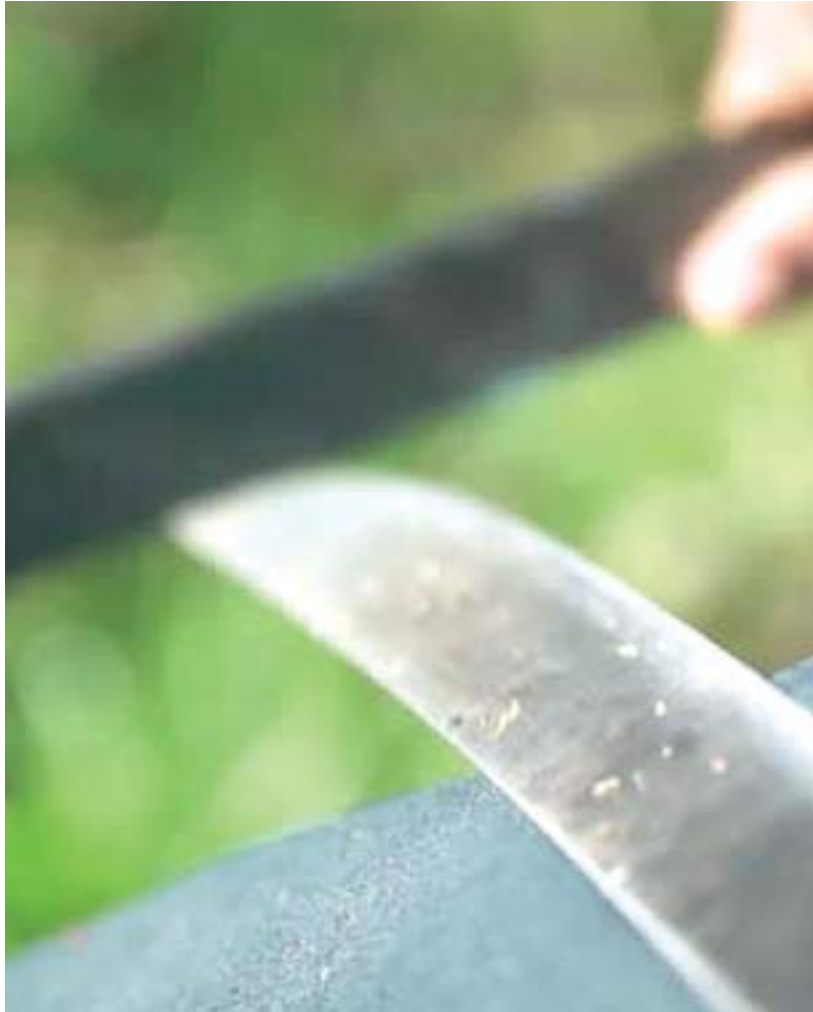
Mulher estava supostamente sob efeito de entorpecente

Uma mulher, de 27 anos, foi presa na noite de terça-feira (12) após agredir violentamente o próprio filho, um adolescente de 13 anos. O garoto foi atingido por um ventilador e golpes de terçados. A prisão ocorreu na comunidade Parque São Pedro, bairro Tarumã, Zona Oeste de Manaus.