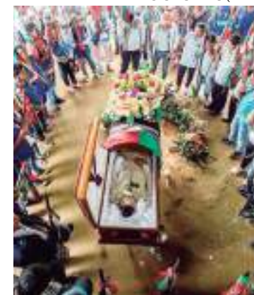
Funeral do líder indígena Edwin Dagua, na Colômbia

As conclusões são frustrantes para o governo Petro, que aprovou uma lei que ratifica o acordo de Escazú sobre proteção ambiental em outubro do ano passado. O acordo, adotado na região homônima de Escazú, na Costa Rica, em março de 2018, inclui disposições para proteger os ambientalistas, entre outras. A lei ainda não foi aprovada pelo Tribunal Constitucional da Colômbia.