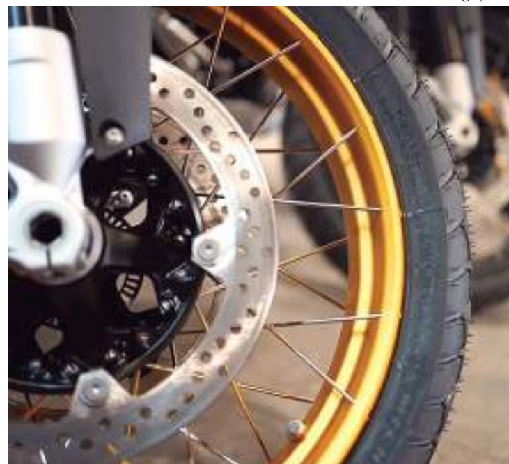
Motocicletas BMW Motorrad manauaras acelerando pelo Brasil

Com área aproximada de 15 mil metros quadrados e capacidade de produzir até 15 mil motocicletas por ano, a planta possui ações voltadas para sustentabilidade e meio ambiente, como o uso de energia proveniente de fontes renováveis, promovendo redução na emissão de CO 2 , e tem certificação I-REC (International REC Standard), sistema global que possibi-