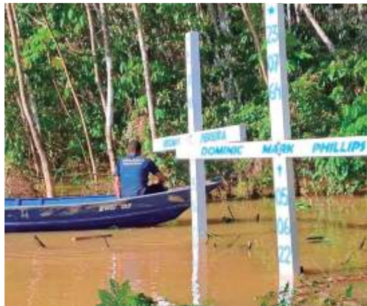
Homem em canoa passando pelo Rio Amazonas

A entidade aponta o esforço em ampliar a proteção dos defensores na América Latina, região com maior número de assassinatos, por meio do Acordo Re-