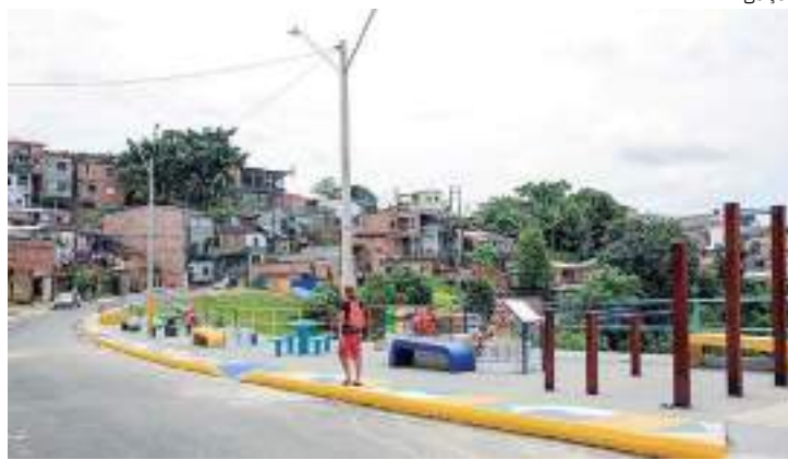
Moradores do bairro Nova Cidade recebem praça revitalizada

"Essa foi e continua sendo uma grande preocupação da minha gestão, porque a segurança das pessoas é a nossa maior prioridade. A erosão é um processo natural e se torna um problema em níveis danosos ao ambiente, quando acelerada pela intervenção errada do ser humano, com construções irregulares e redes de esgoto clandestinas. Temos atuado em várias frentes de obras com grandes