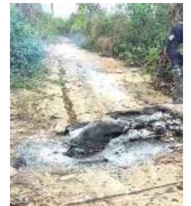
Maioria das ocorrências foi registrada em Humaitá

Durante o período, a Operação Tamoioatá ocorreu nos municípios de Apuí, Canutama, Humaitá, Lábrea, Manicoré e Novo Aripuanã, todos no sul do Amazonas.