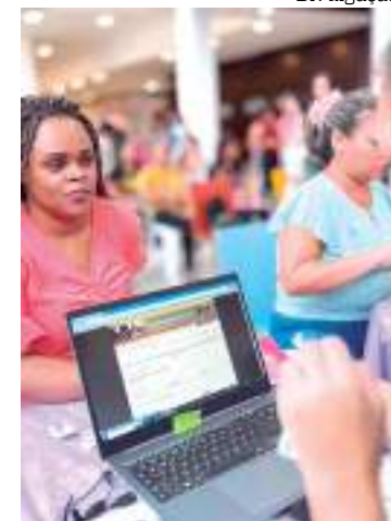
Ação itinerante atende moradores em vários pontos de Manaus

Entre as ações, que serão executadas pela equipe do Sine, estão a oferta de vagas de emprego para diversas áreas, cadastro e orientação para Carteira de Trabalho e Previdência Social (CTPS Digital) e seguro-desemprego. O propósito é levar os serviços do Sine Manaus diretamente aos bairros, aten-