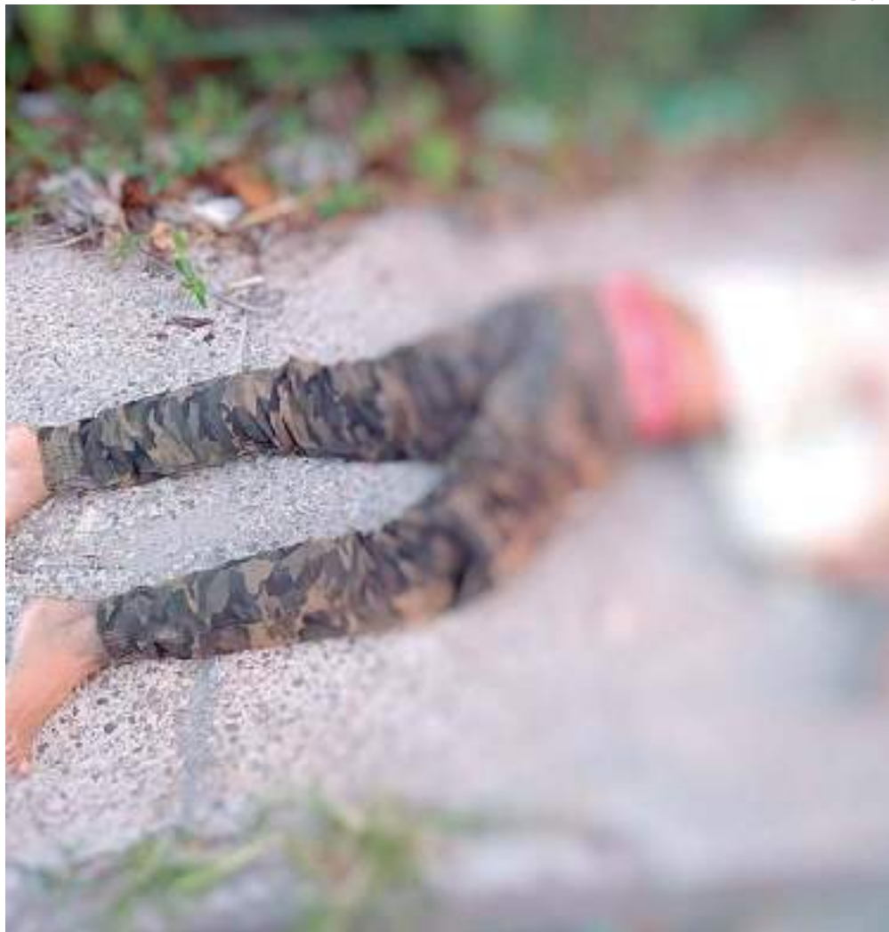
Corpo do homem foi encontrado com as mãos amarradas

A Delegacia Especializada em Homicídios e Sequestros (DEHS) deve investigar as circunstâncias da morte e o corpo do homem foi encaminhado para o Instituto Médico Legal (IML).