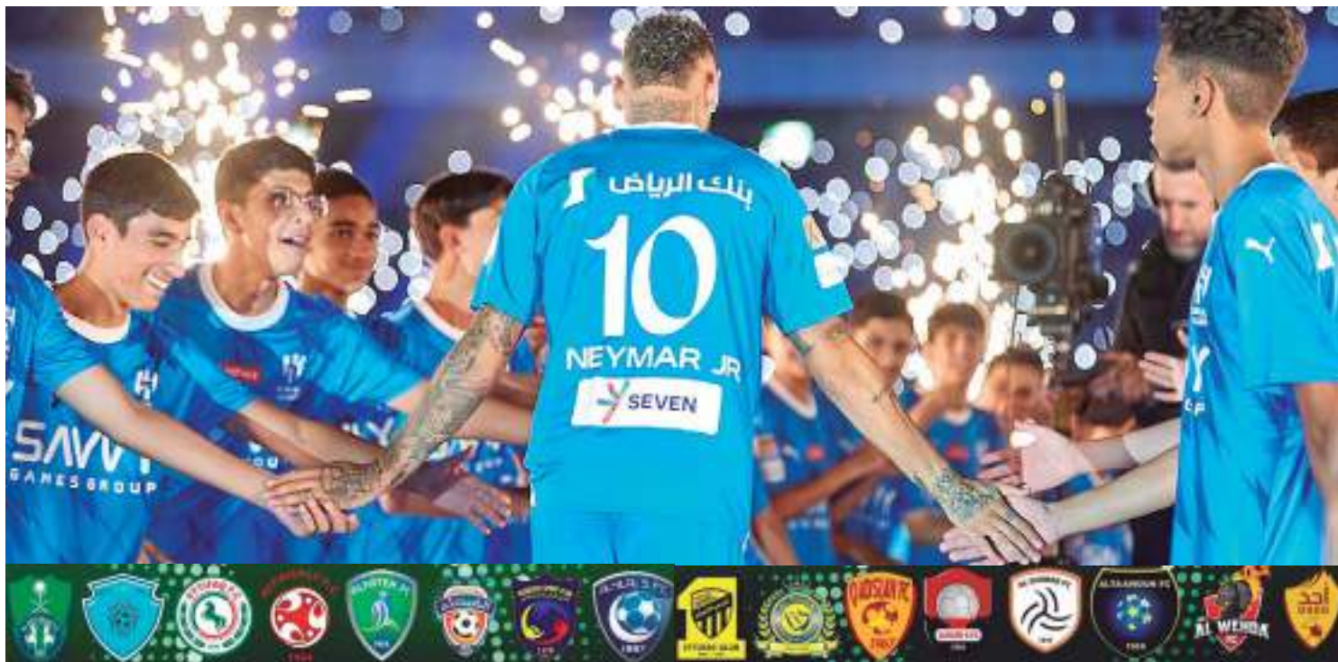
Atacante Neymar Jr. foi a maior contratação do futebol saudita

clube expôs no céu drones, que projetaram o número 10 e o rosto de Neymar e fez um mosaico de boas-vindas.