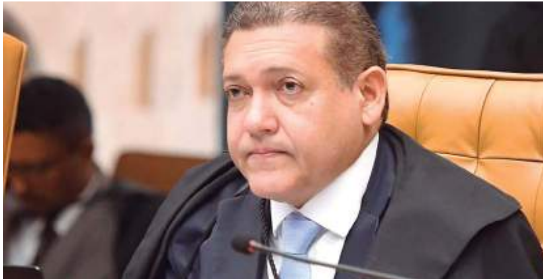
Kassio, que foi indicado ao Supremo pelo ex-presidente Jair Bolsonaro (PL), costuma votar de forma divergente

Antes dele, o relator, Alexandre de Moraes, havia votado pela condenação a uma pena de 17 anos, sendo 15 anos e 6 meses em regime fechado, além de 100 dias-multa, cada um deles no valor de um terço do salário mínimo —em valores atuais, mais de R$ 40 mil.