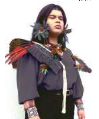
Artista amazonense assina a identidade visual do Festival