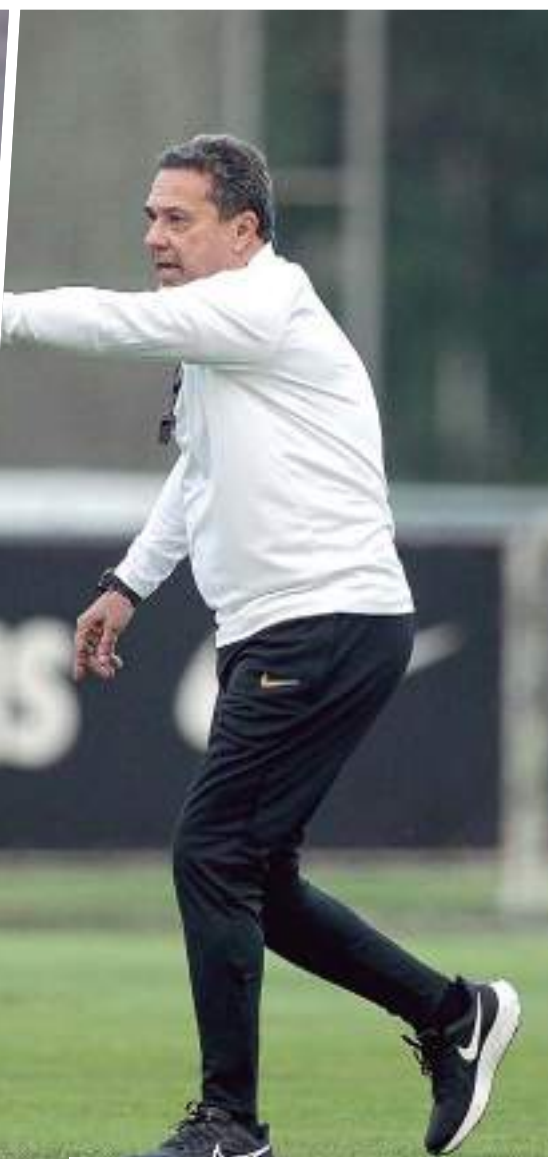
Luxemburgo precisa levar o time a vitória