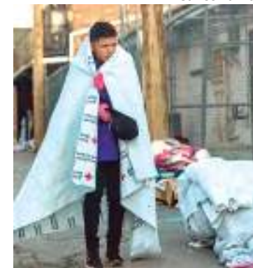
Migrante da Venezuela caminha pela rua em El Paso, Texas, EUA

O governo americano enfrenta um número crescente de venezuelanos e pessoas de outras nacionalidades que chegam na fronteira dos Estados Unidos com o México