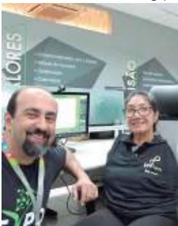
Mulher deficiente recebe apoio do projeto

Pesquisa gerou uma solução tecnológica que torna possível pessoas tetraplégicas, por exemplo, acessar computadores para realizar diferentes tarefas, entre as quais, editar textos, criar planilhas e navegar na internet, utilizando somente movimentos da cabeça, piscar de olhos ou abertura de boca. O projeto foi realizado pela Fundação Paulo Feitoza - FPFtech, em Manaus.