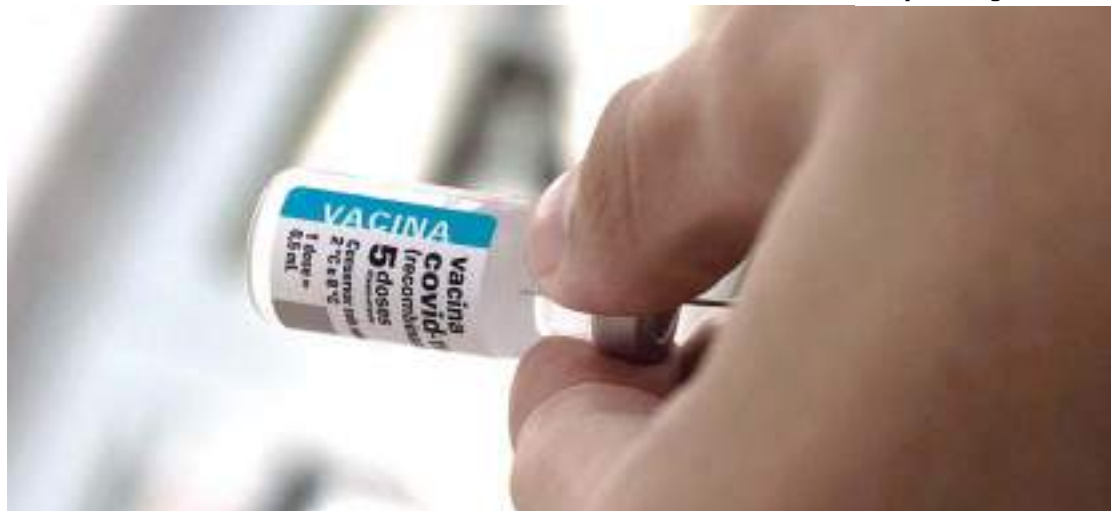
Mudança requer incorporação da vacina no calendário do programa

Para garantir vacinas nacionais da plataforma RNA mensageiro, mais versátil na luta contra o coronavírus, o Ministério da Saúde tem apoiado desenvolvimentos próprios do Instituto de Tecnologia em Imunobiológicos (Bio-Manguinhos) e do Instituto Butantan. Gatti considera que o ideal é que uma tecnologia nacional de RNA mensageiro possa estar à disposição do PNI, uma vez que as vacinas contra covid-19 oferecidas por esses laboratórios até o momento são de outras plataformas.