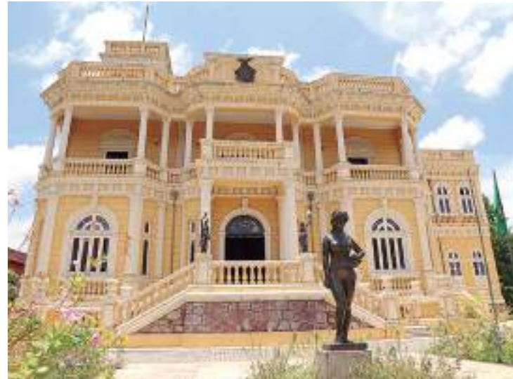
As atividades serão no Palácio da Justiça

Em “Fio do Meio”, o criador toma como célula o movimento do esbarrão. A partir dele, observa e provoca uma