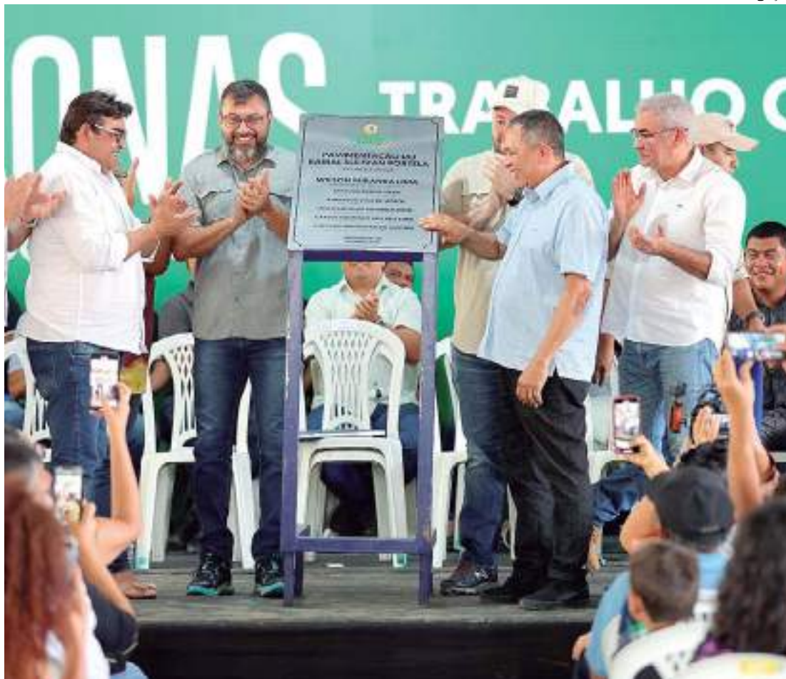
Governador também entregou mudas, sementes e alevinos para agricultores e piscicultores