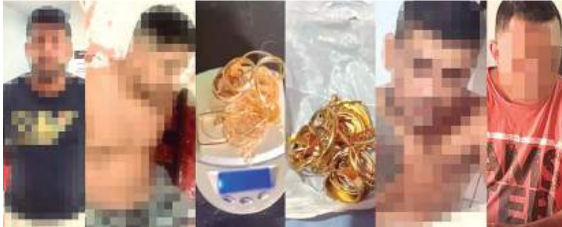
Homens foram presos por roubo a residência com joias

“O alvo do crime foi a residência de uma vendedo-