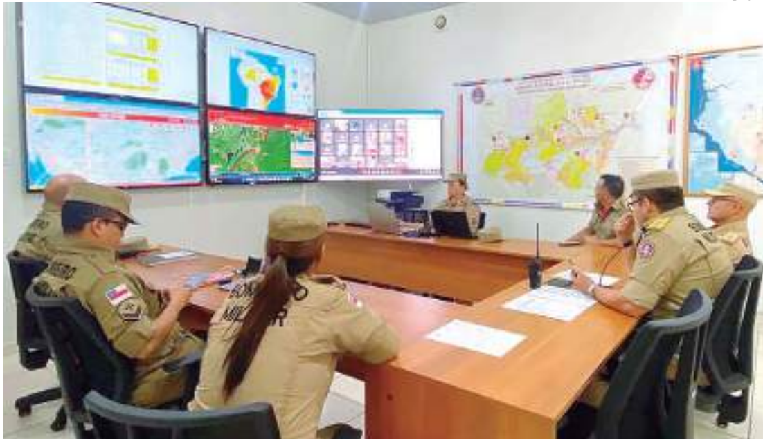
Participaram da reunião secretários da Defesa Civil e Meio Ambiente

Em quinze dias, o estado do Amazonas registrou 4.212 focos de queimadas, de acordo com dados do Instituto Nacional de Pesquisas Espaciais (Inpe). Mesmo sem o consolidado do mês de setembro, esse é o segundo maior registro do ano, atrás