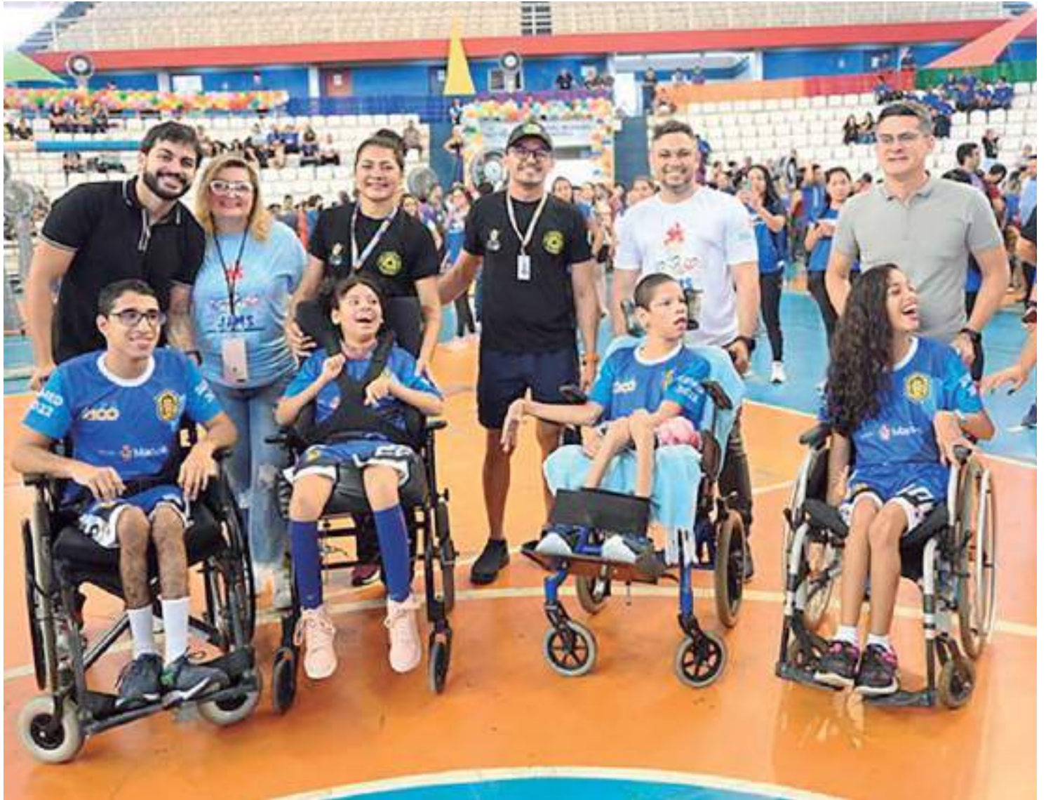
Prefeito de Manaus quer educação e esporte como “ferramenta” de inclusão social