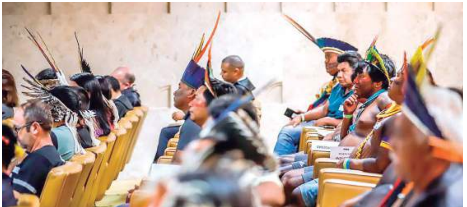
Placar de 9 a 2 foi comemorado por entidades de proteção aos povos originários

Segundo a ministra, a Constituição garante que as terras tradicionalmente ocupadas pelos povos indígenas são habitadas em caráter permanente e fazem parte de seu patrimônio cultural, não cabendo a limitação de um marco temporal.