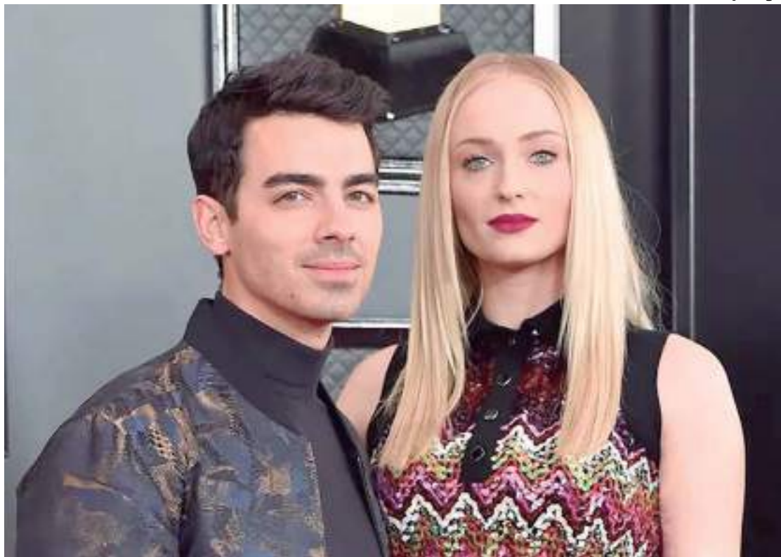
Joe Jonas e Sophie Turner são pais de duas meninas, de 3 e 1 ano

Joe Jonas rebateu a ex-mulher, Sophie Turner, que entrou com um processo pedindo o retorno imediato das duas filhas do casal, de 3 e 1 ano, que segundo ela alega foram “removidas ou retidas indevidamente”. Em um comunicado, o representante legal do cantor de 34 anos negou que ele tivesse sequestrado as crianças e disse que a atriz de 27, famosa por Game of Thrones, está indo contra o que tinha sido acordado entre eles.