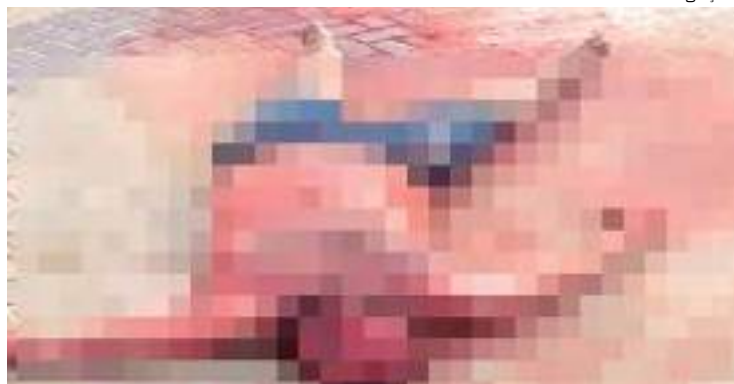
Corpo foi achado com sinais de facadas e ferimentos

Com sinais de facadas e ferimentos causados por atropelamento, um corpo de um homem, não identificado, foi encontrado na quinta-feira (21) em um terreno de construção próximo à avenida José Moacir Teberga de Toledo, no bairro Planalto, Zona Oeste de Manaus.