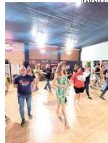
Entre os tipos de danças estão forró, brega, sertanejo e bolero

Endereço e contato para informações de valores das aulas podem ser obtidos via o WhatsApp (92) 98292-3253.