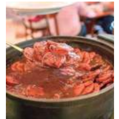
Evento acontece na Loppiano, localizado na Major Gabriel, no centro

Quem quiser contribuir com a causa pode garantir o ingresso pelo valor de R$ 60. As vendas são feitas de forma digital, fazendo contato pelo WhatsApp (92) 99128-1820, disponibilizado pelo próprio empresário. No dia do evento, será possível tanto comer no local como fazer a retirada da feijoada a partir de 11h30.