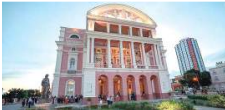
17º Festival de Teatro da Amazônia tem inscrições disponíveis

Para a inscrição, é necessário apresentar o título da oficina, descrição da atividade e metodologia, breve currículo, público-alvo, quantidade de pessoas adequada para melhor aproveitamento do conteúdo, necessidades técnicas e foto para divulgação.