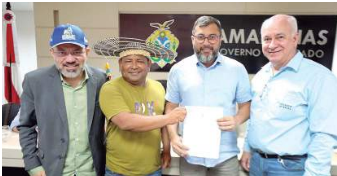
Autoridades e lideranças alinham planos para exploração responsável do potássio em Autazes

“A gente está falando aqui de uma outra matriz econômica no estado do Amazonas. Nós temos a Zona Fran-