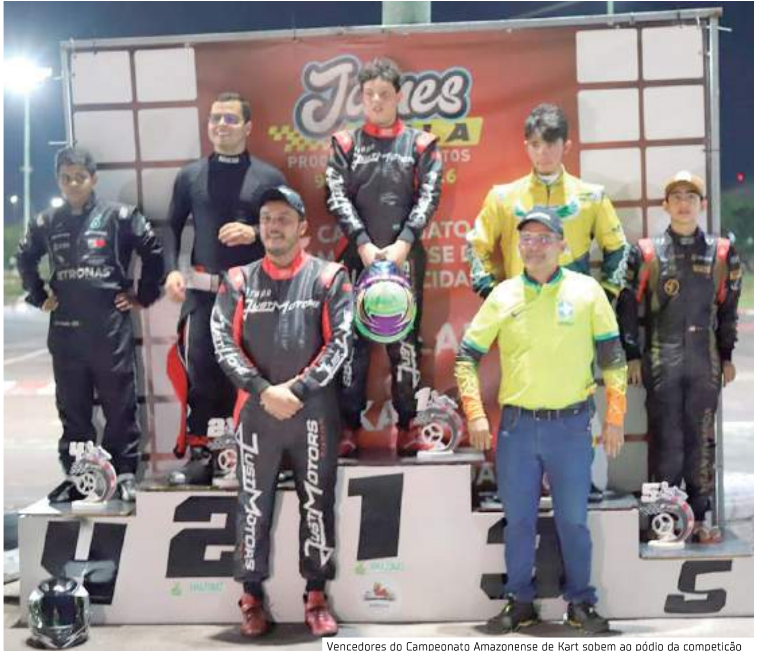
Vencedores do Campeonato Amazonense de Kart sobem ao pódio da competição

“Existem todos os protocolos pré corrida, que primeiramente é o briefing. Primeiro contato com os pilotos que serve para informar as regras estabelecidas para a corrida e um bate papo com todos. Na sequência tem o warm up, aonde o piloto vai para a pista em busca de testar o equipamento, juntamente com os sensores da cronometragem. A direção de prova e uma atividade que requer muita atenção e tomar as decisões certas para que ocorra o bom andamento da prova. Claro que muitas das vezes as decisões não agradem os pilotos, mas nossa intenção é sempre ter uma competição justa a todos os envolvidos”, explicou o diretor de provas Cícero