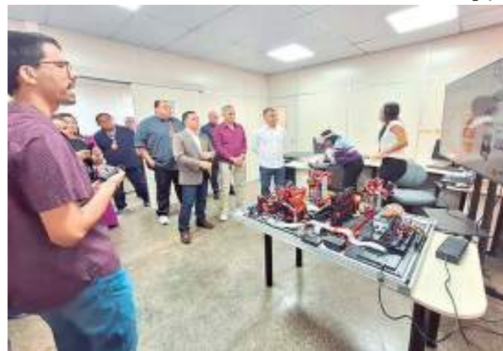
Representantes da Suframa conhecem projetos tecnológicos

Outro projeto de destaque apresentado foi o Projeto Yara, idealizado para monitorar a qualidade da água do Rio Amazonas de forma remota, por meio de dispositivos eletrônicos coletores e transmissores de informações, como: temperatura da água, oxigênio dissolvido, turbidez, pH, condutividade elétrica, salinidade, temperatura do ar e sólidos totais dissolvidos. Também