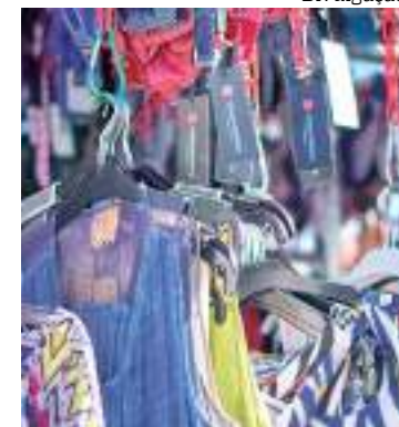
Mulheres empreendedoras vão expor seus produtos no evento