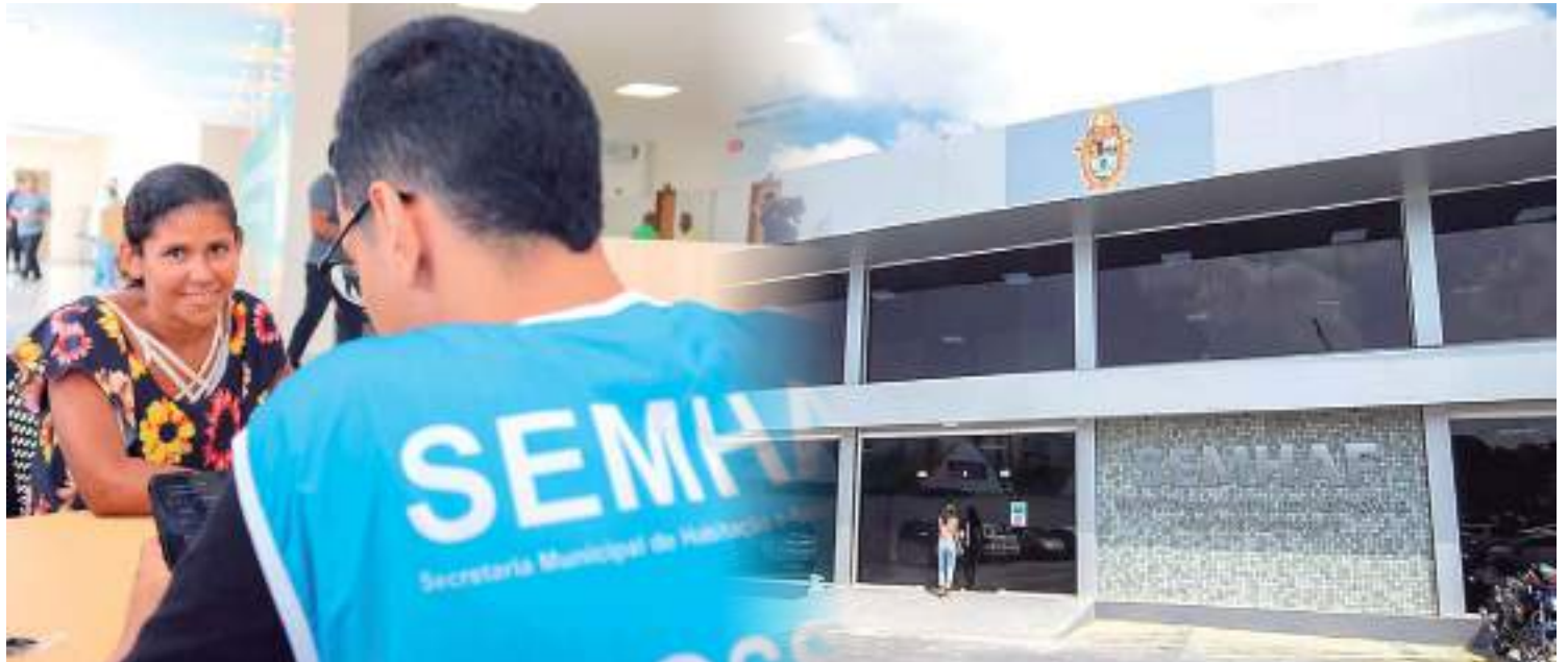
Atendimentos podem ser realizados presencialmente ou de forma on-line

A partir da parceria entre os Executivos municipal e federal, 17 mil famílias serão beneficiadas a partir do trabalho desenvolvido na Semhaf. Estão