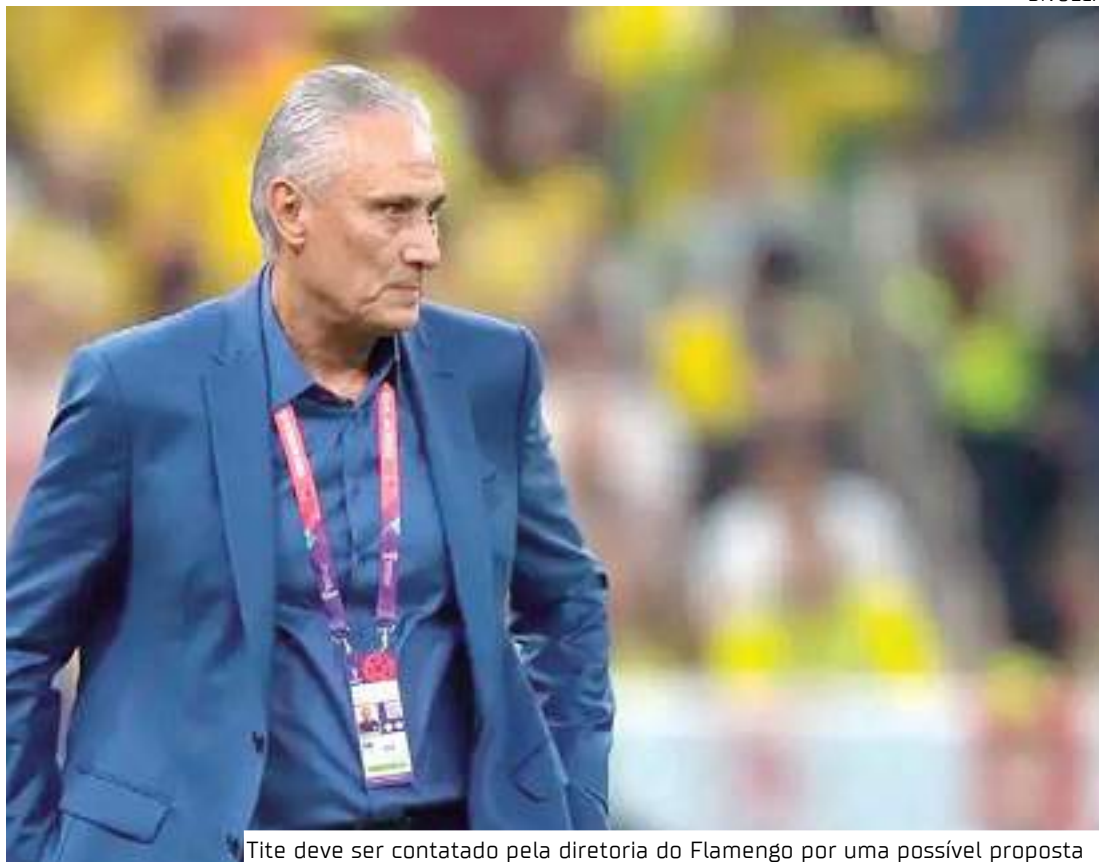
Tite deve ser contatado pela diretoria do Flamengo por uma possível proposta

Com a derrota para o São Paulo na final da Copa do