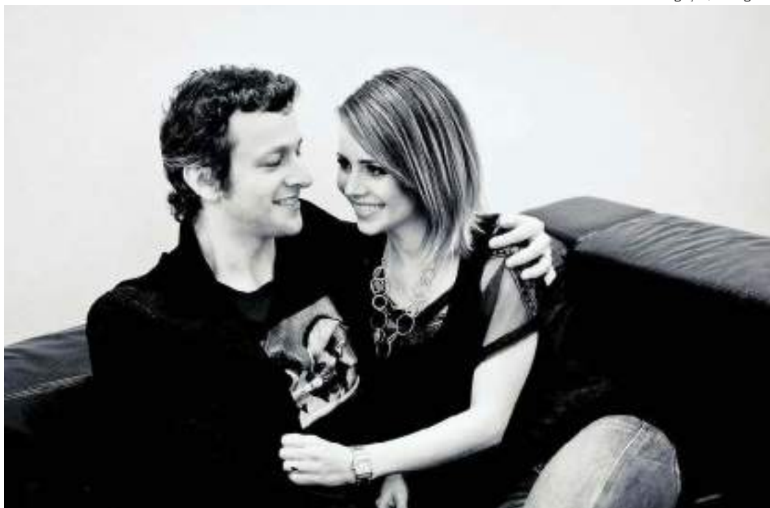
Lucas Lima e Sandy anunciam separação