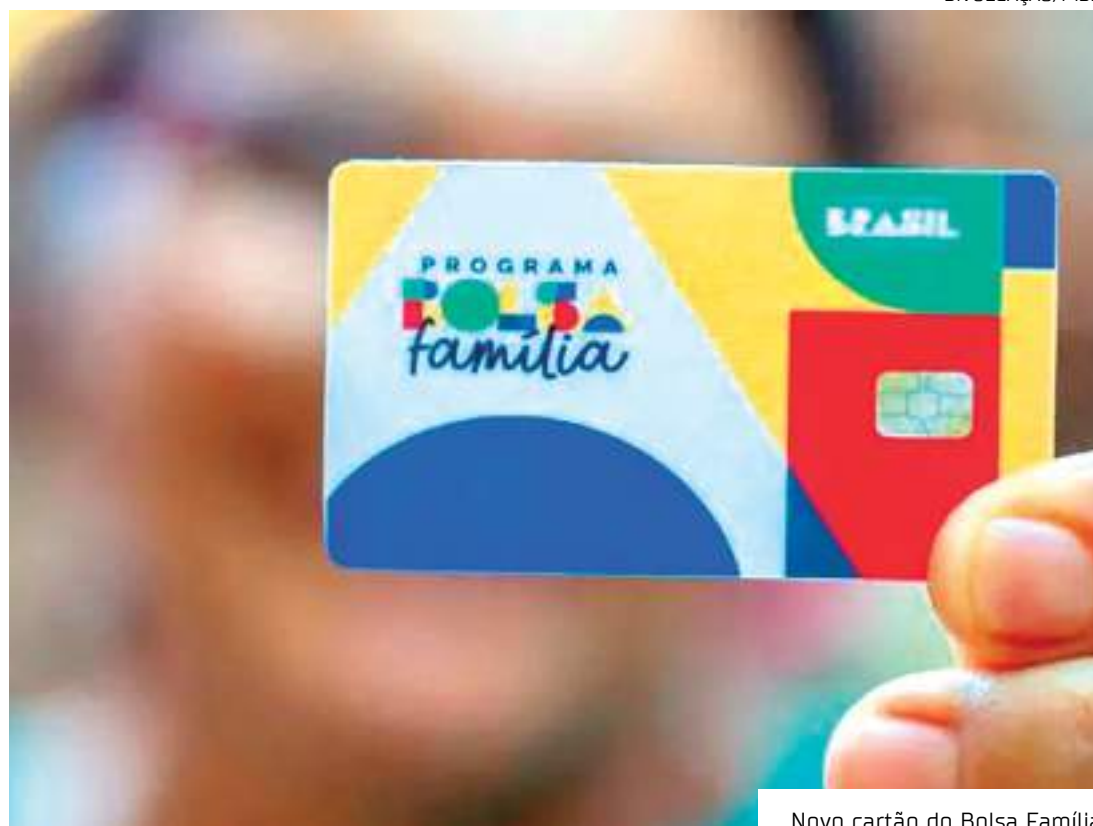
Novo cartão do Bolsa Família

O ministro do Desenvolvimento e Assistência Social e Combate à Fome, Wellington