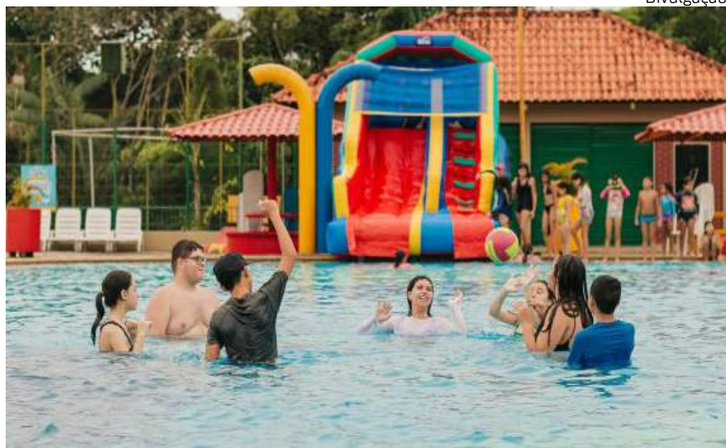
Evento terá uma programação esportiva e recreativa