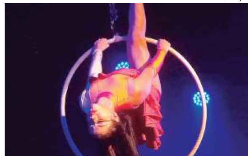
Evento tem oficinas de acrobacia