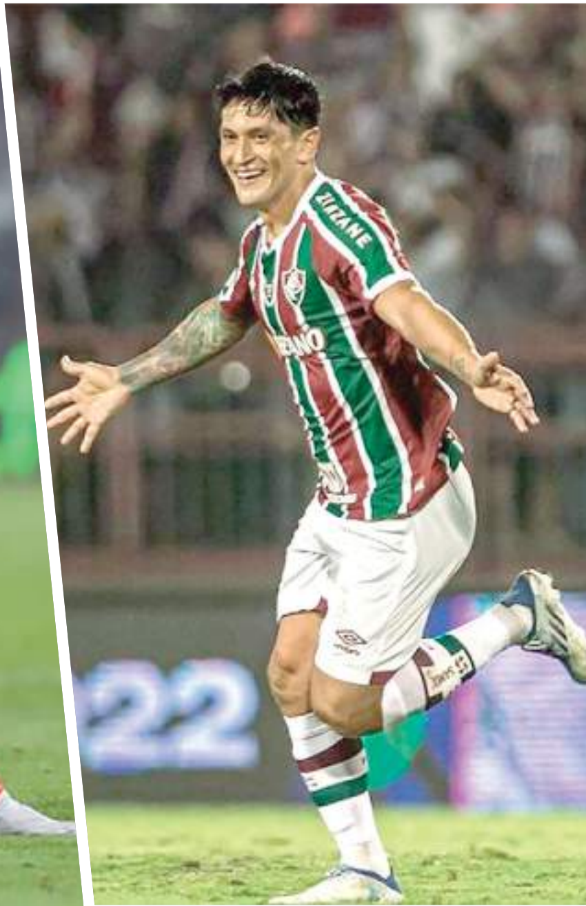
Cano quer a artilharia do Flu na Libertadores