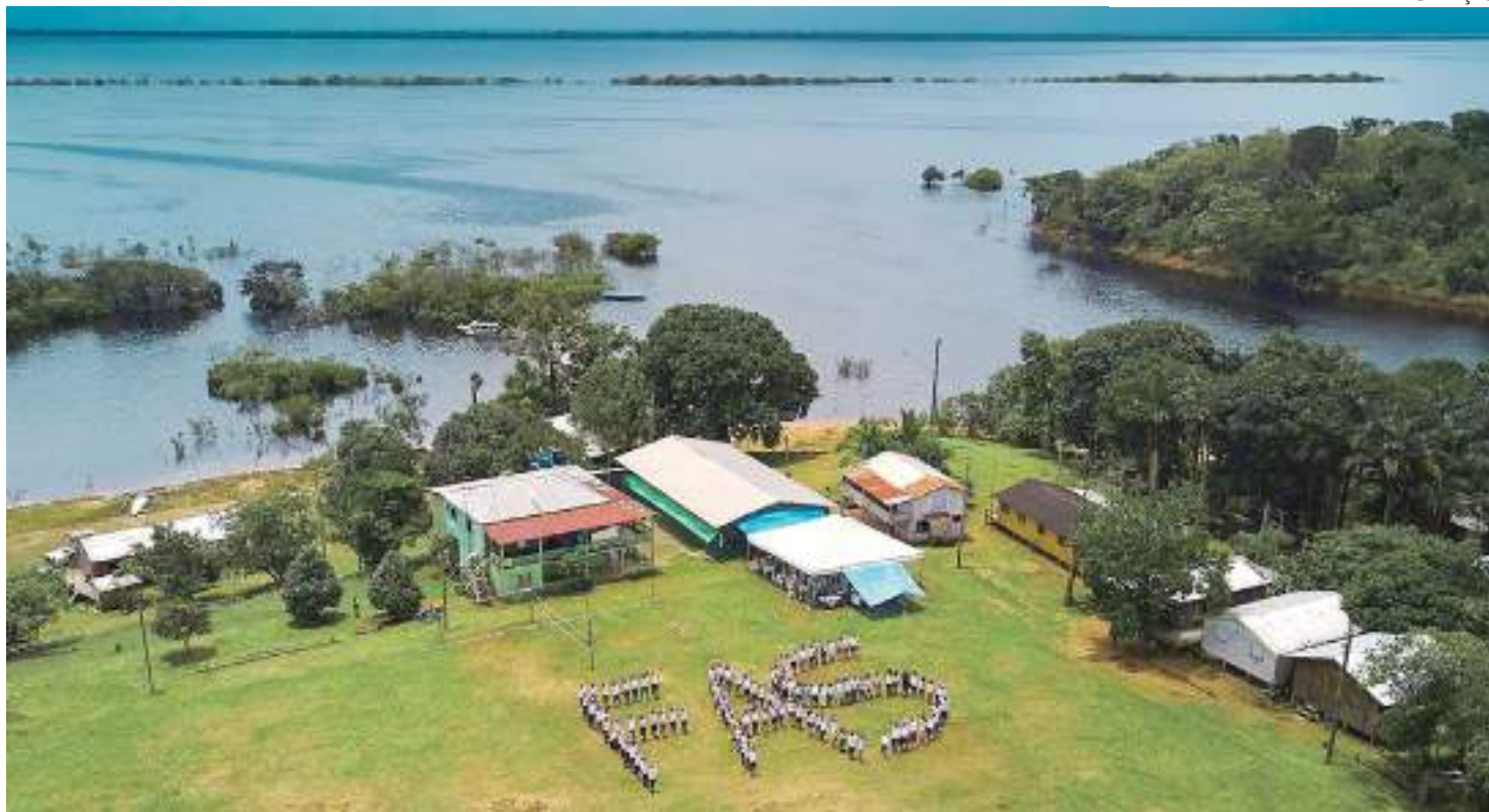
Fundação Amazônia Sustentável atua fomentando a economia verde na região

"Nesse contexto, é utilizado o Telessaúde como ferramenta para que 66 comunidades ribeirinhas tenham acesso a consultas remotas por meio de um ponto de conectividade