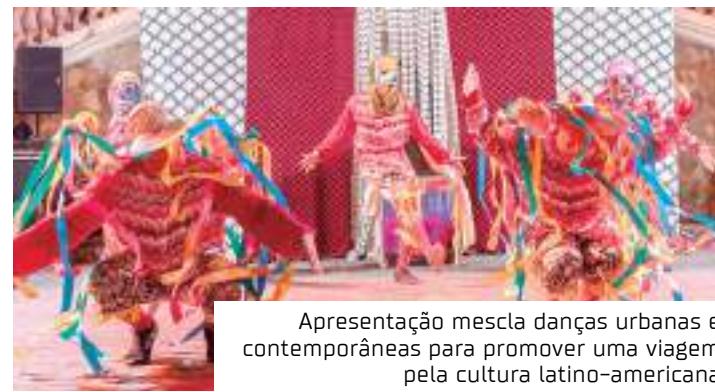
Apresentação mescla danças urbanas e contemporâneas para promover uma viagem pela cultura latino-americana

O grupo também produziu os espetáculos in process: curumins (2017); Notas Sobre Ela (2017); 1960: título interino (2018); Jamais Formos Modernos (2018/2019) e Sodade (2019/2020). A companhia já circulou com espetáculos no Amazonas e nos estados do Pará, Pernambuco e Minas Gerais.