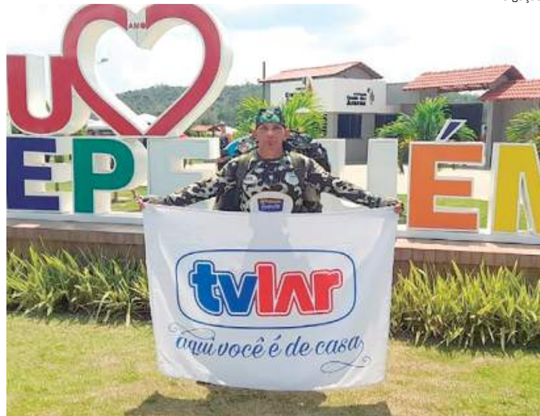
Atleta "Surucucu" participou da corrida da cidade de Tepequém

Alargada foi sincronizada com precisão, às 16h para a prova de 21km e às 16h10 para a de 10km, partindo do local conhecido como "Entroncamento Traição", no KM 94 da RR-203, até a Pousada Canto das Araras, na Vila do Paiva, em Amajari, ao