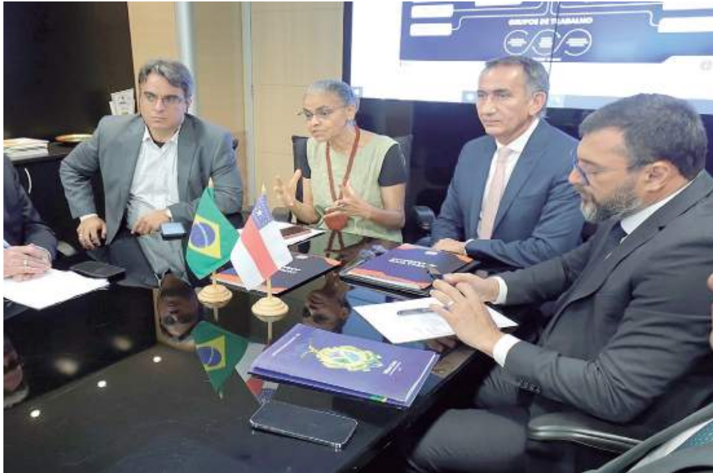
Reunião em Brasília teve presença da ministra Marina Sila e ministro Waldez Góes

Segundo o governador, o Ministério da Integração e Desenvolvimento Regional se comprometeu com o envio de itens como cestas básicas e água. O Ministério do Meio Ambiente garantiu que vai intensificar o combate aos