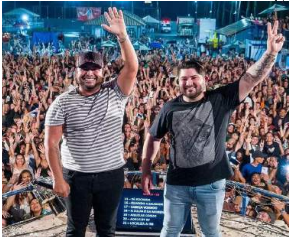
Banda escolhe a capital amazonense para gravar DVD