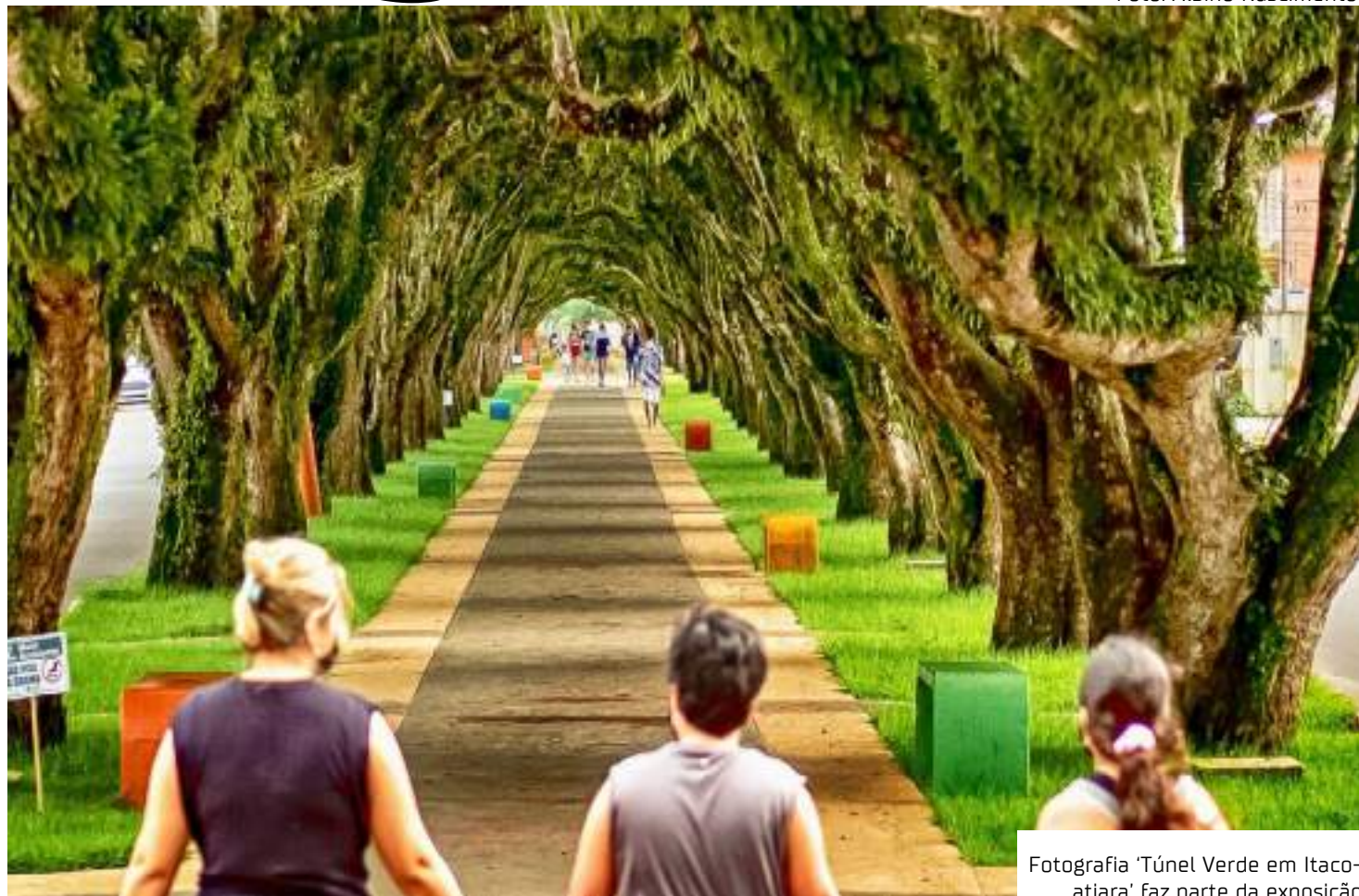
Fotografia 'Túnel Verde em Itacoatiara' faz parte da exposição

A ideia da exposição coletiva de fotografia surgiu em 2022, no intuito de homenagear o Dia do Turista, celebrado no