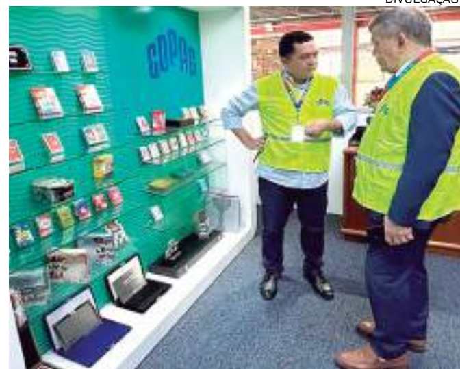
Portfólios de produtos são apresentados à Suframa

"A Copag é uma das empresas pioneiras do Polo Industrial de Manaus, é uma empresa que o Brasil precisa conhecer, saber que aqui, em Manaus, há 36 anos, se produz cartas de baralho em material de al-