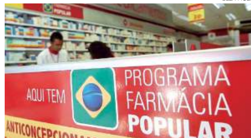
Ações estão sendo realizadas no RS, SC, AM e CE