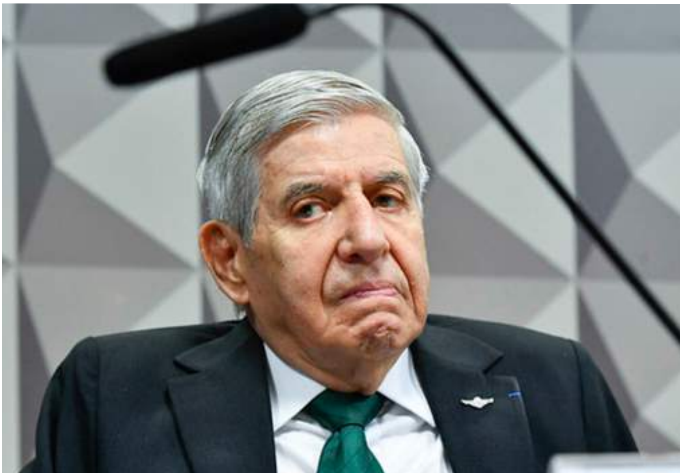
Depoimento do ex-ministro do GSI causou diversas polêmicas, principalmente suas declarações sobre Mauro Cid

Enquanto a oposição responsabiliza o Ministério da Justiça e Segurança Pública e o GSI pelo não acionamento da tropa, os governistas afirmam que se tratava