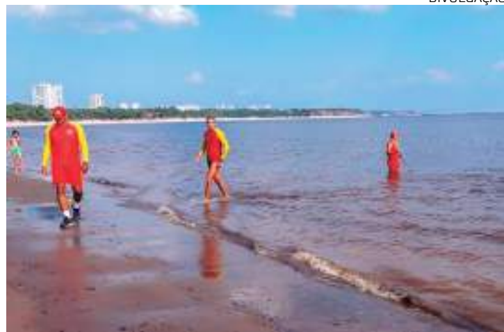
Medida visa proteger os banhistas

Em 2015, a praia foi interditada por medida de segurança quando o rio chegou na cota de segurança mínima, de 16 metros, conforme