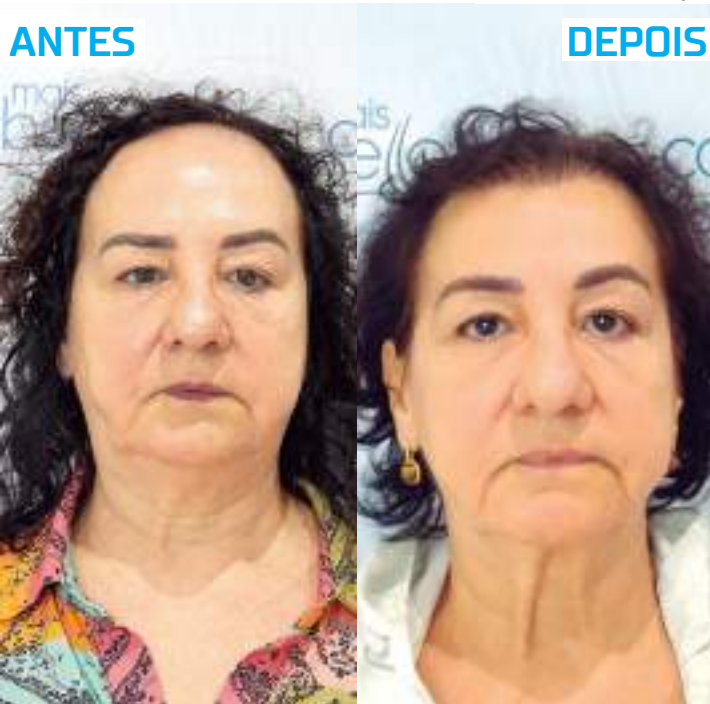
Procedimento é utilizado para o rebaixamento da linha do cabelo

"A hairline não é uma linha reta. Seus fios são mais finos e delicados e mudanças radicais nesta região podem afetar significativamente a autoimagem e a confiança. Como especialistas, nosso objetivo é criar uma transição suave entre a testa e o cabelo mais denso, mantendo a aparência natural",