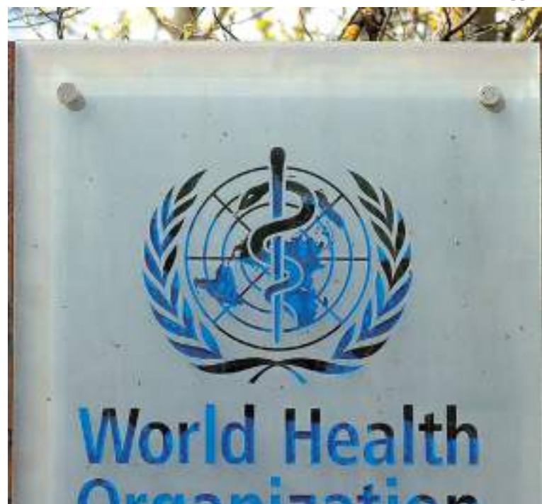
Logo da OMS em frente à sua sede, em Genebra, Suíça