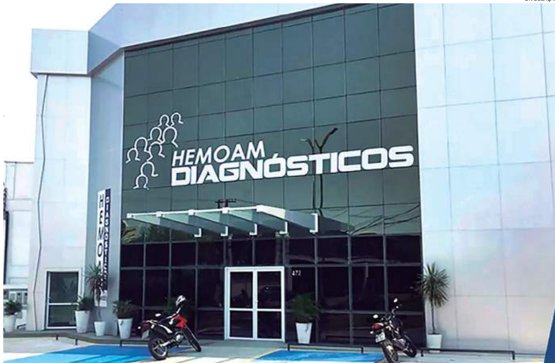
Laboratório Hemoam Diagnósticos fica localizado na avenida Theomário Pinto da Costa, zona centro-sul de Manaus

Segundo a Organização Mundial da Saúde - OMS, o diagnóstico precoce consiste no acompanhamento