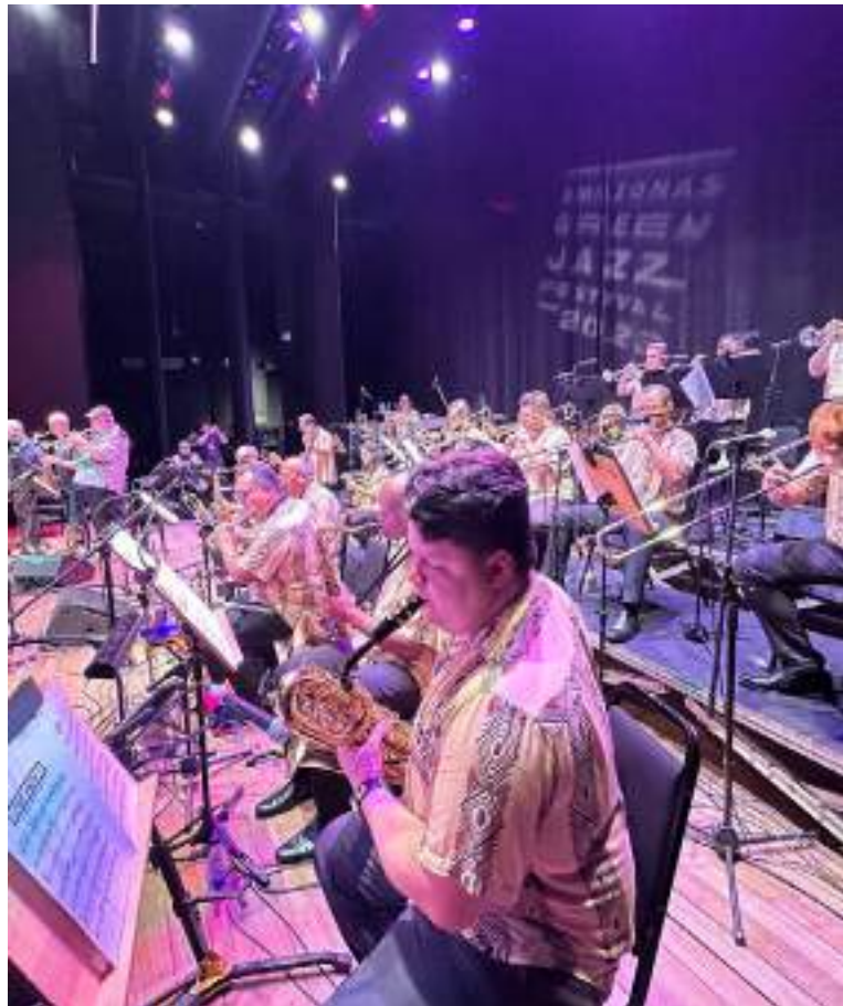
Espetáculo faz parte da "Série Legados"