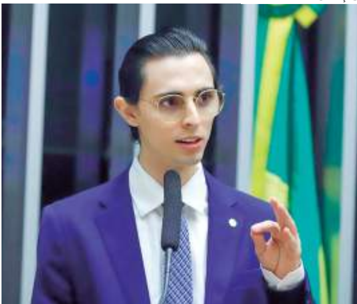
Deputado é pioneiro neste tipo de ação no Estado

Após a análise orçamentária e de mérito, foram aprovados 97 projetos, sendo 10 na área de Esporte, 7 de Assistência Social, 14 de Saúde, 5 de Cultura, 12 de Meio Ambiente e 49 de Educação. Entre os critérios para a sele-