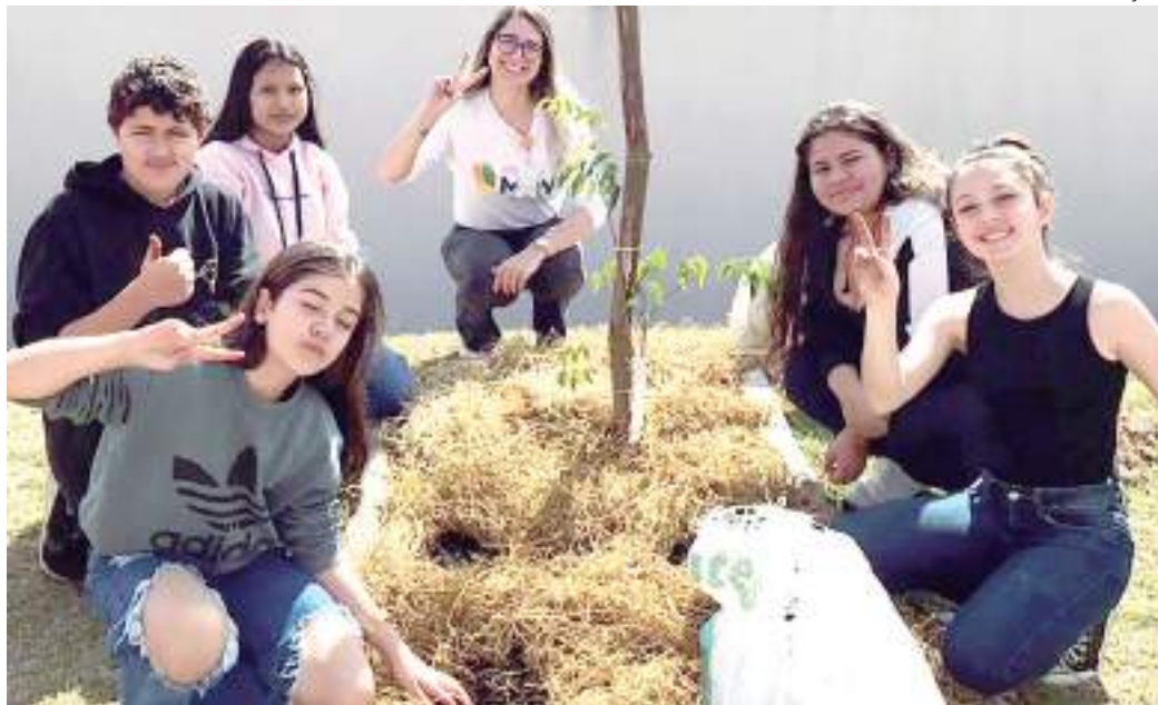
Iniciativa procura resolver desafios locais com jovens e crianças como protagonistas

O foco primordial desta edição é promover a solução de problemas por meio da educação - nas cidades de Campinas, Canoas, João Pessoa, Londrina, Manaus, Porto Alegre, Ribeirão Preto, Rio de Janeiro, Salvador, São Paulo, Sorocaba e Uberlândia -, tendo as crianças, adolescentes e/ou jovens com até 24 anos de idade como protagonistas das ações de