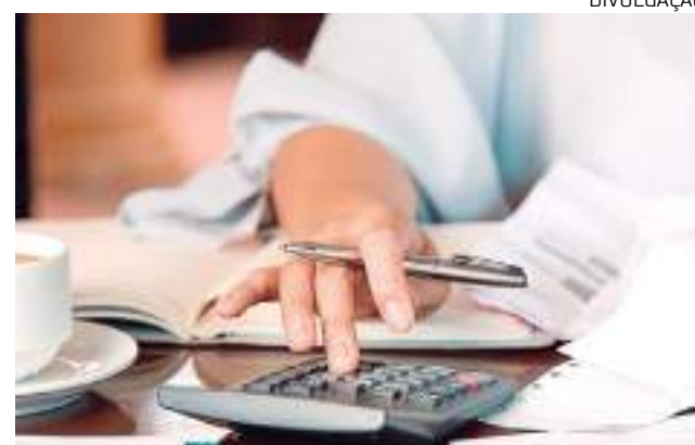
Consumidores são os que mais buscam crédito para limpar o nome

Os consumidores do Amazonas são os que mais buscam crédito para limpar o nome. O levantamento “Finanças Regionais: as diferenças na relação com o dinheiro entre os Estados do Brasil”, realizado pela Serasa em parceria com a Opinion Box, mostra que 27,3% dos locais procuram a alternativa para ficar no verde.