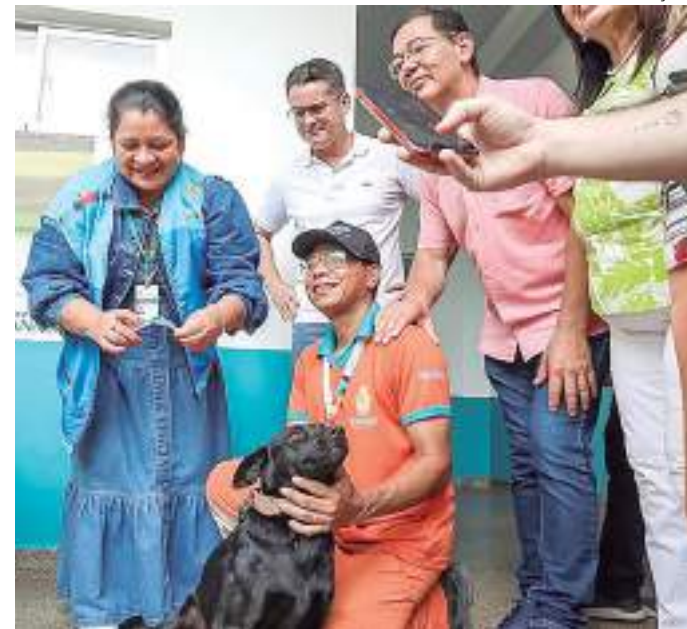
Prefeito lançou a campanha no Centro de Controle de Zoonoses

Em relação à raiva animal, o último registro na capital ocorreu em 2023, mesmo ano em que também houve casos em Humaitá, Manicoré