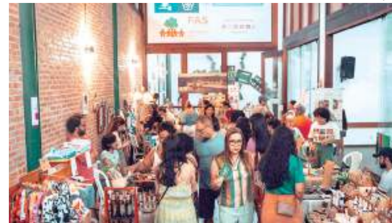
Expositores de economia verde expõem produtos no evento