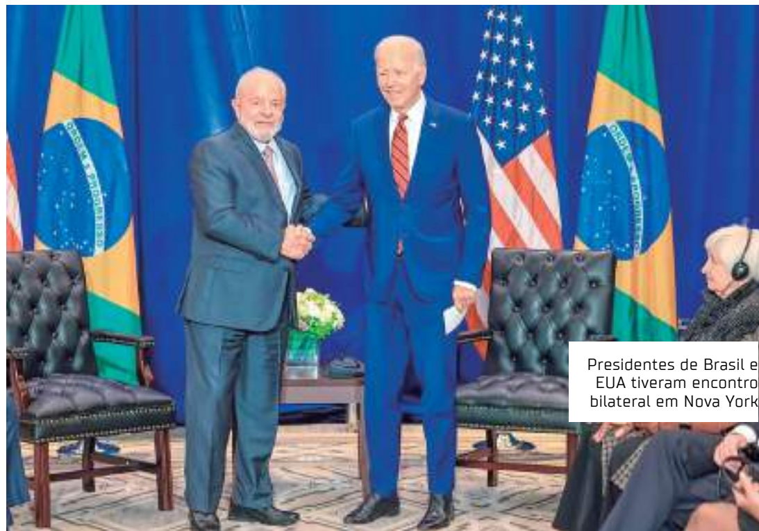
Presidentes de Brasil e EUA tiveram encontro bilateral em Nova York

Lula também defendeu o fortalecimento do papel dos sindicatos. "Todas pessoas que acreditam que sindicato fraco vai fazer com que o empresário ganhe mais, que o país fique melhor, está enganado. Não há democracia sem sindicato forte. Porque o sindicato é efe-