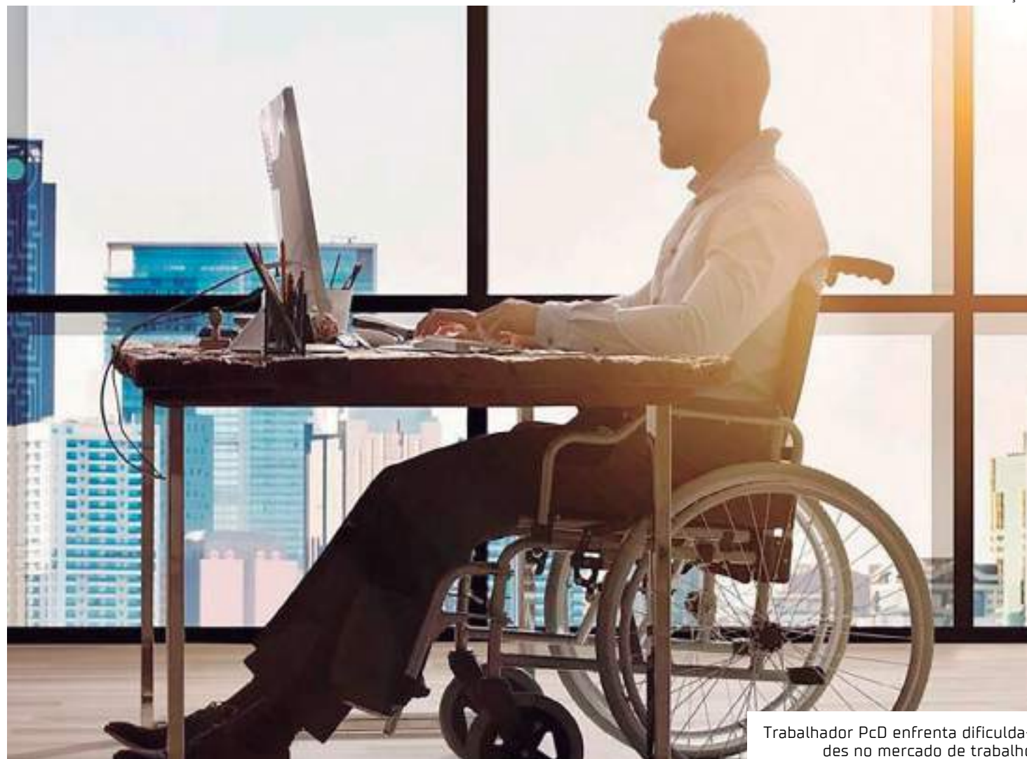
Trabalhador PcD enfrenta dificuldades no mercado de trabalho

Até mesmo os salários das pessoas trabalhadoras com deficiência se mostram 30% menor do que a média brasileira, segundo o IBGE, reflexo dos cargos diminuídos para