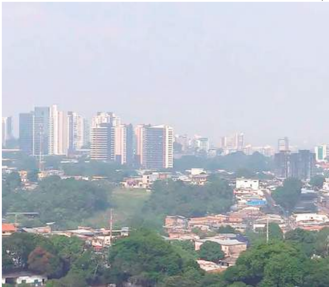
Fumaça proveniente das queimadas cobriu Manaus nesta última quarta-feira (20)

Através de nota, a Prefeitura de Manaus afirmou ter recebido, até às 15h30 de quarta-feira (20), 26 ocorrências, sendo: 11 de destelhamento, três de desabamento, três de tombamento, duas de alagamento, duas de rachaduras, duas relacionadas a bueiros, uma de risco de tombamento, uma solicitação de vistoria e uma solicitação de construção