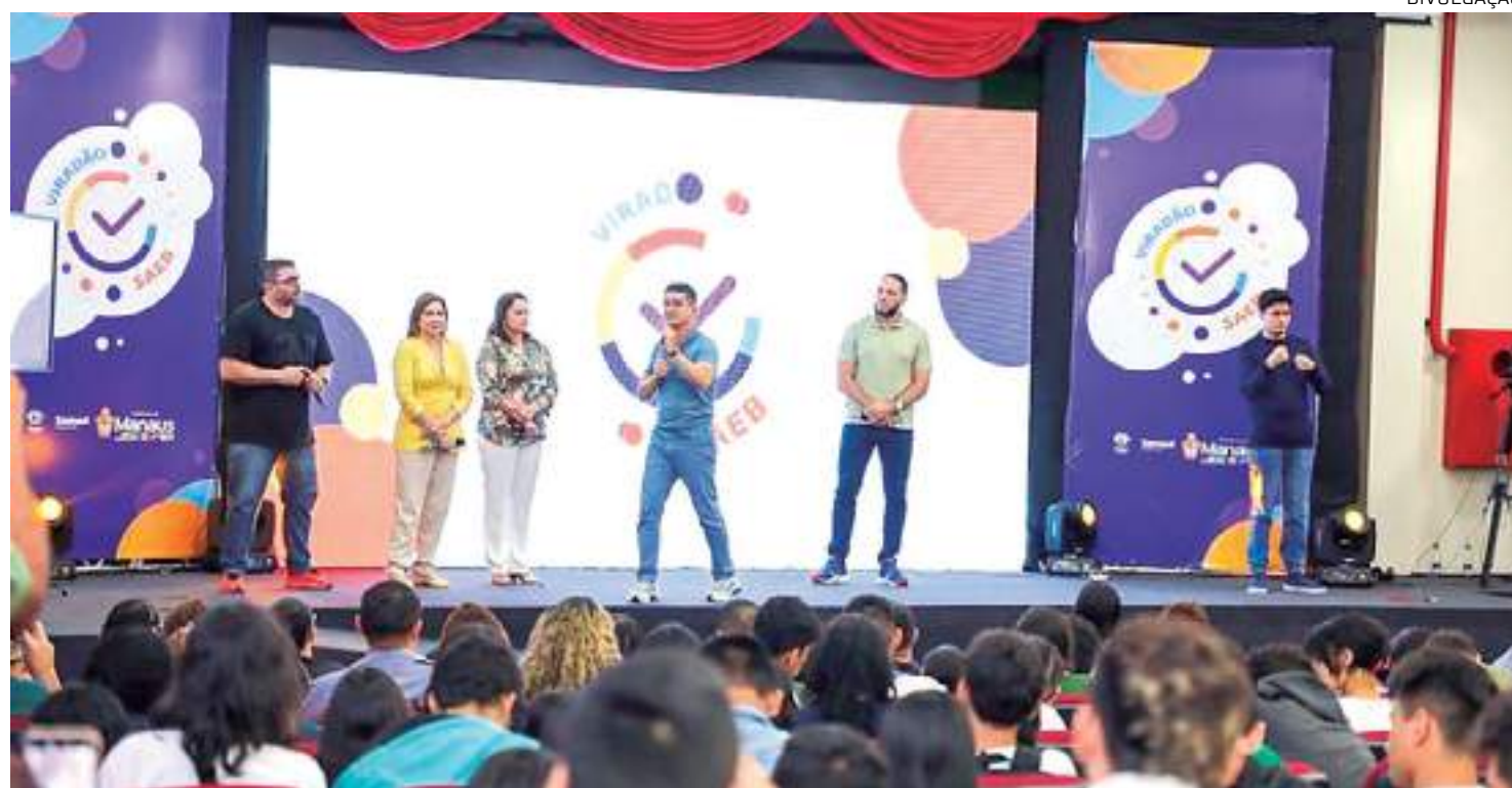
Gestor municipal discursou durante viradão do Sistema Nacional de Avaliação da Educação Básica

“Nós estamos mudando a cara da cidade de Manaus e vocês fazem parte dessa mudança. Nós melhoramos na educação, temos escolas reformadas, aumentamos o número de alunos em creche, criamos o “6º Tempo”, o “Educa+”, o “Alfabetiza+”, melhoramos o salário dos professores, recuperamos a autoestima dos nossos servidores, melhoramos o