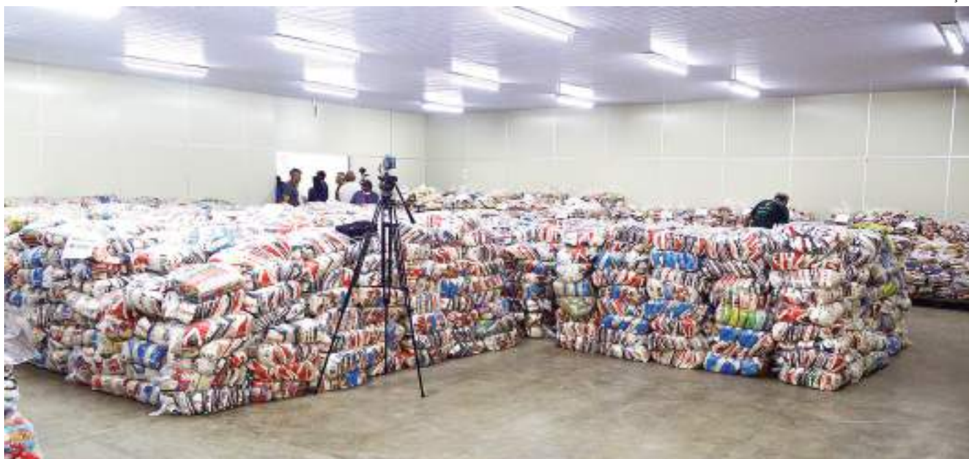
Alimentos arrecadados foram divididos em mais de 8 mil kits que serão entregues para mais de 40 mil pessoas

“Quero agradecer a população que nos auxiliou e ajudou no evento. Isso aqui faz parte daquela troca de alimentos por pulseiras e é a finalização da parte social do evento. Ontem, tivemos o encerramento da parte ambiental com mais de 200 mil garrafas PETs de todos os tamanhos, que fo-