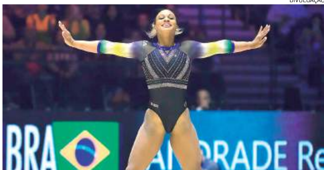
Brasileira mudou rit de apresentação para o Mundial de Atletismo