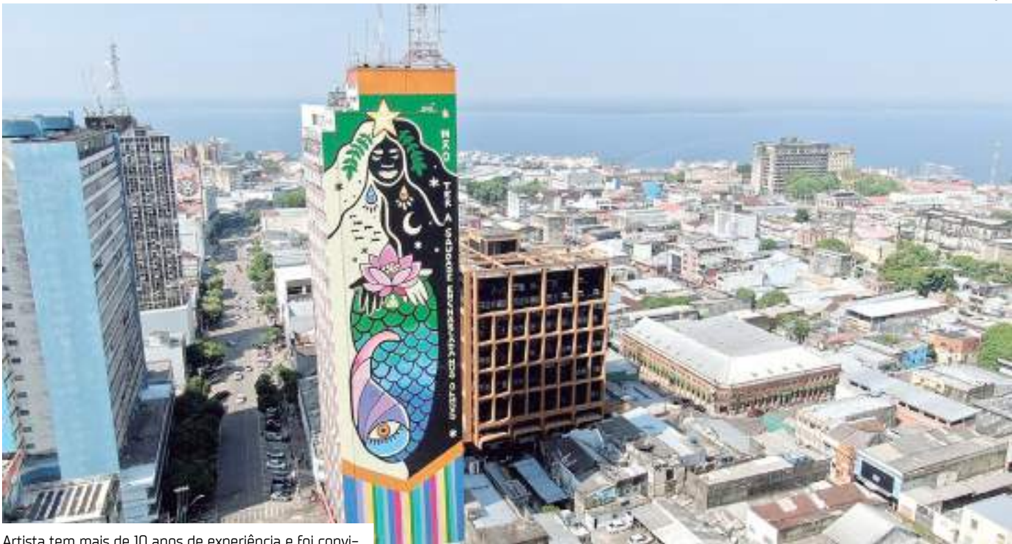
Artista tem mais de 10 anos de experiência e foi convidada a pintar um dos mais altos edifícios do Amazonas

Além de celebrar a finalização dos trabalhos na empena “Criadora de Si”, a exposição inédita “Miração”, assinada por Deborah Erê, traz de um