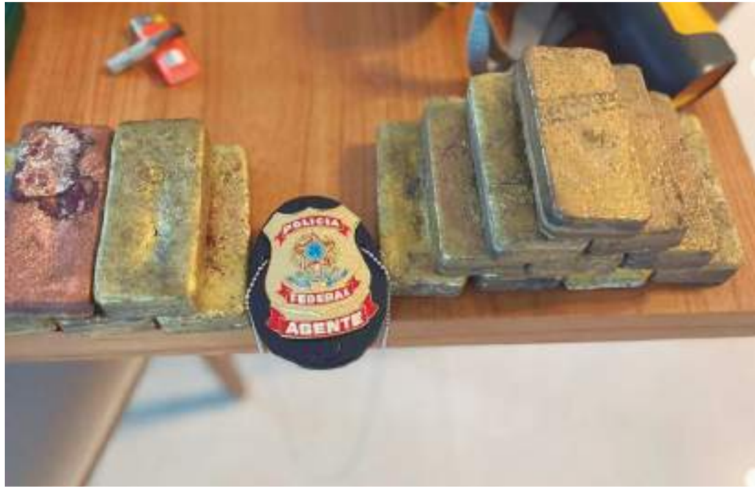
Ouro apreendido pela Polícia Federal durante operações

"Foi identificado que o ouro passou pelo processo de esquentamento, através de um austríaco que se naturalizou brasileiro e afirma ter mais de mais R$ 20 bilhões em barras