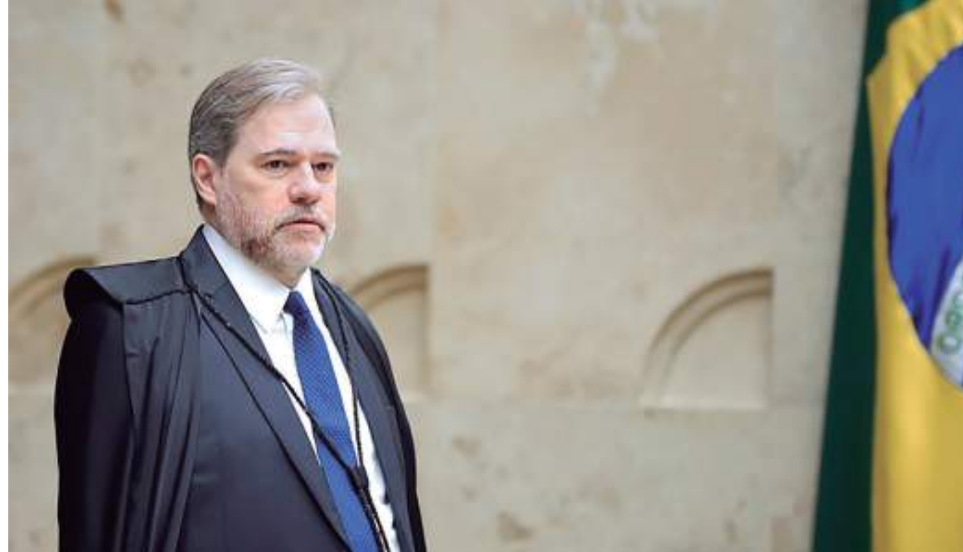
Ministro do STF acompanhou relator e encaminhou maioria (5 a 2) contra a tese

Relator do processo, Fachin foi o primeiro a votar e refulou a tese do marco temporal, ainda em 2021. Ele disse que a teoria desconsidera a classificação dos direitos indígenas como fundamentais, ou seja, cláusulas pétreas que