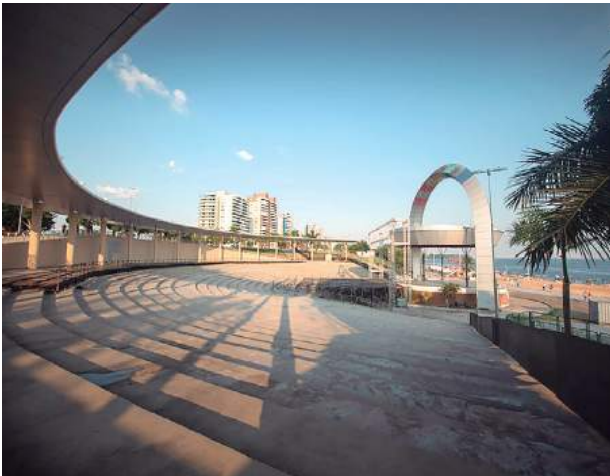
Diffusão começa a partir das 14h com entrada liberada no anfiteatro da Ponta Negra