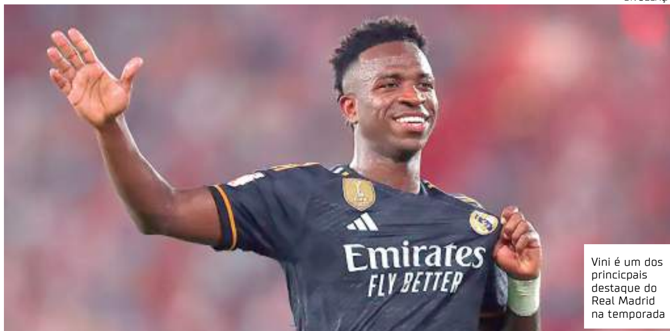
Vini é um dos principais destaques do Real Madrid na temporada

O camisa 7 do Real esteve diretamente envolvido em mais do que o quádruplo de gols do que Marcelo Brozovic e Declan Rice, por exemplo, ambos finalistas do prêmio.