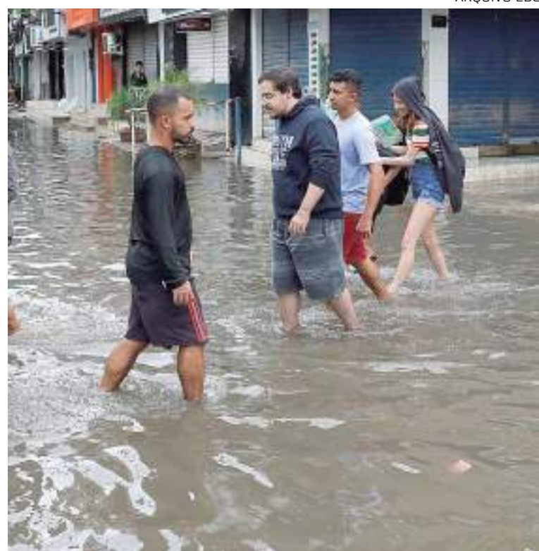
Chuvas intensas causam inundações em cidades do sul

“Assim, durante anos do El Niño, esses jatos tendem a se posicionar sobre a Região Sul, motivando a alta frequência de passagens frontais sobre essa região e, em decorrência, um maior acumulado pluviométrico”, explica o Centro Nacional de Monitoramento e Alertas de Desastres Naturais.