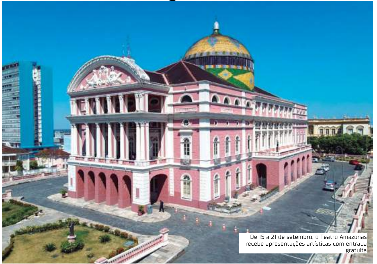
De 15 a 21 de setembro, o Teatro Amazonas recebe apresentações artísticas com entrada gratuita