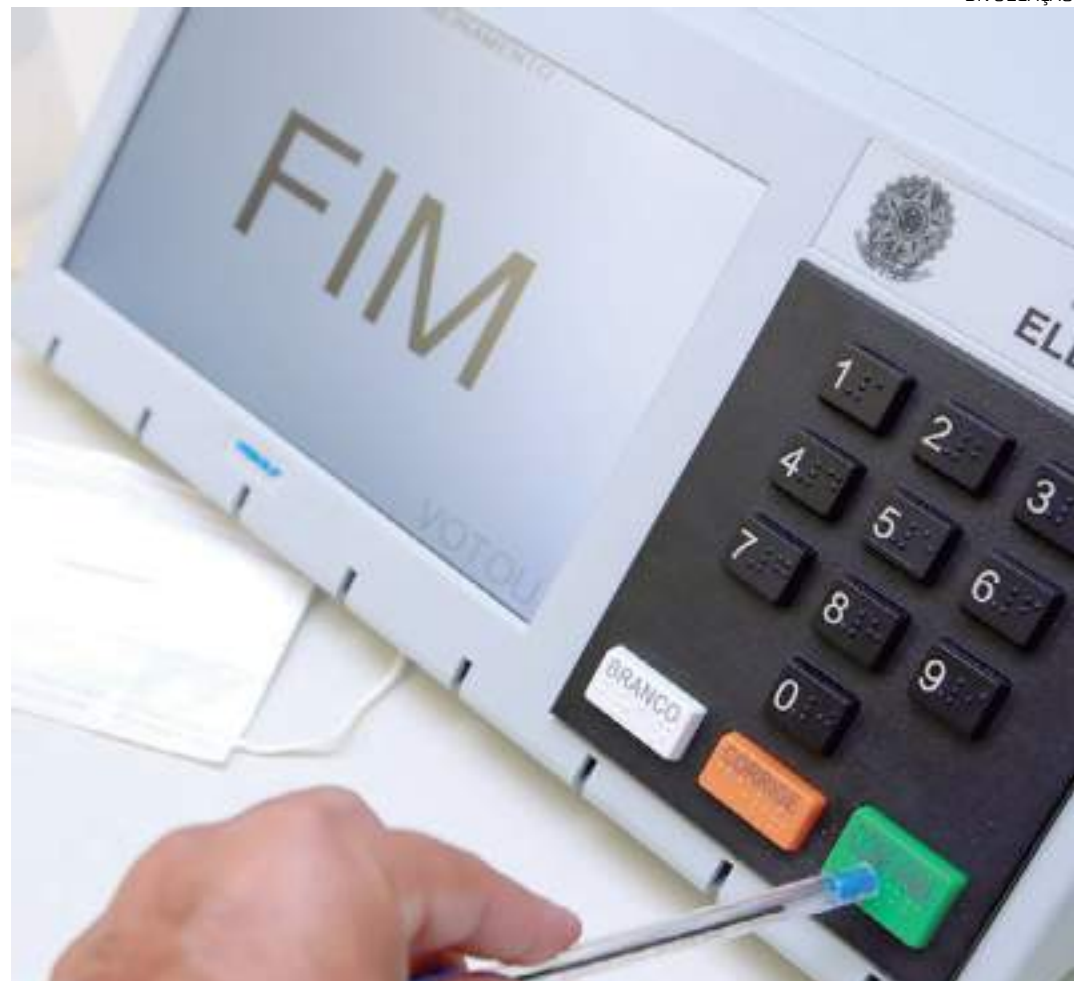
Testes devem ser realizados no dia 27 de novembro até o dia 1 de dezembro

Antes disso, porém, os 85 inscritos pré-aprovados terão que apresentar, entre 9 de outubro e 3 de novembro, seus planos de teste, sem os quais não poderão participar do processo.