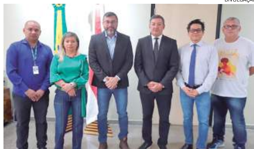
Wilson Lima afirmou ainda que o Estado tem feito um grande esforço para manter a máquina pública em pleno funcionamento

"A gente inicia uma proposta de desjudicialização dos processos e resolução de litígios de forma extrajudicial, criando fluxos de trabalho que permitam o atendimento de pessoas que precisam de demandas padroniza-