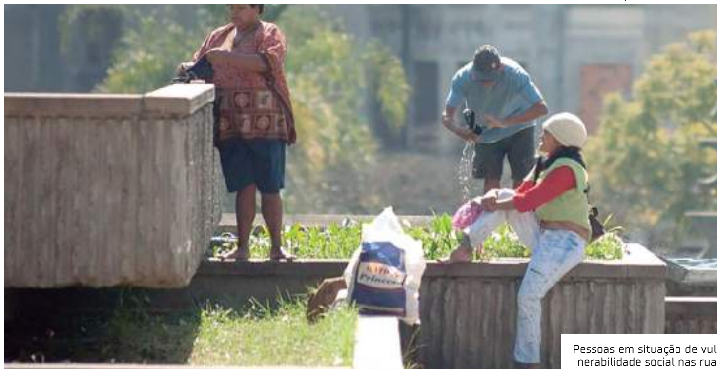
Pessoas em situação de vulnerabilidade social nas ruas

Entre as conclusões, o relatório mostra que a articulação