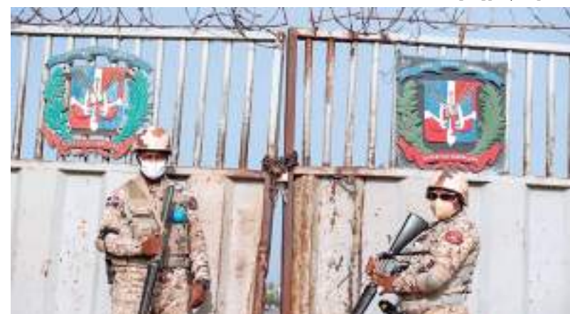
Membros do Exército da República Dominicana guardam ponte de fronteira