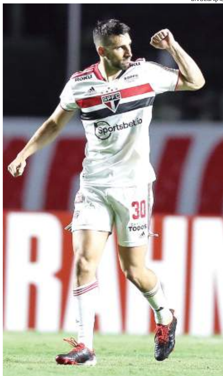
Calleri deve comandar time do São Paulo na primeira final