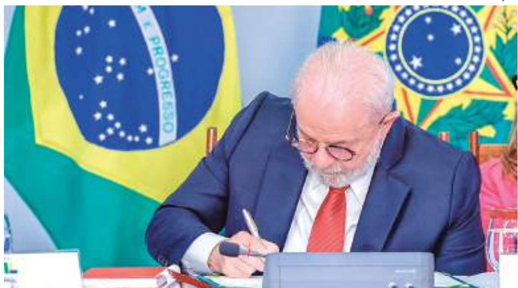
Presidente assinou lei que deve impactar R$ 13,8 bilhões nos cofres públicos