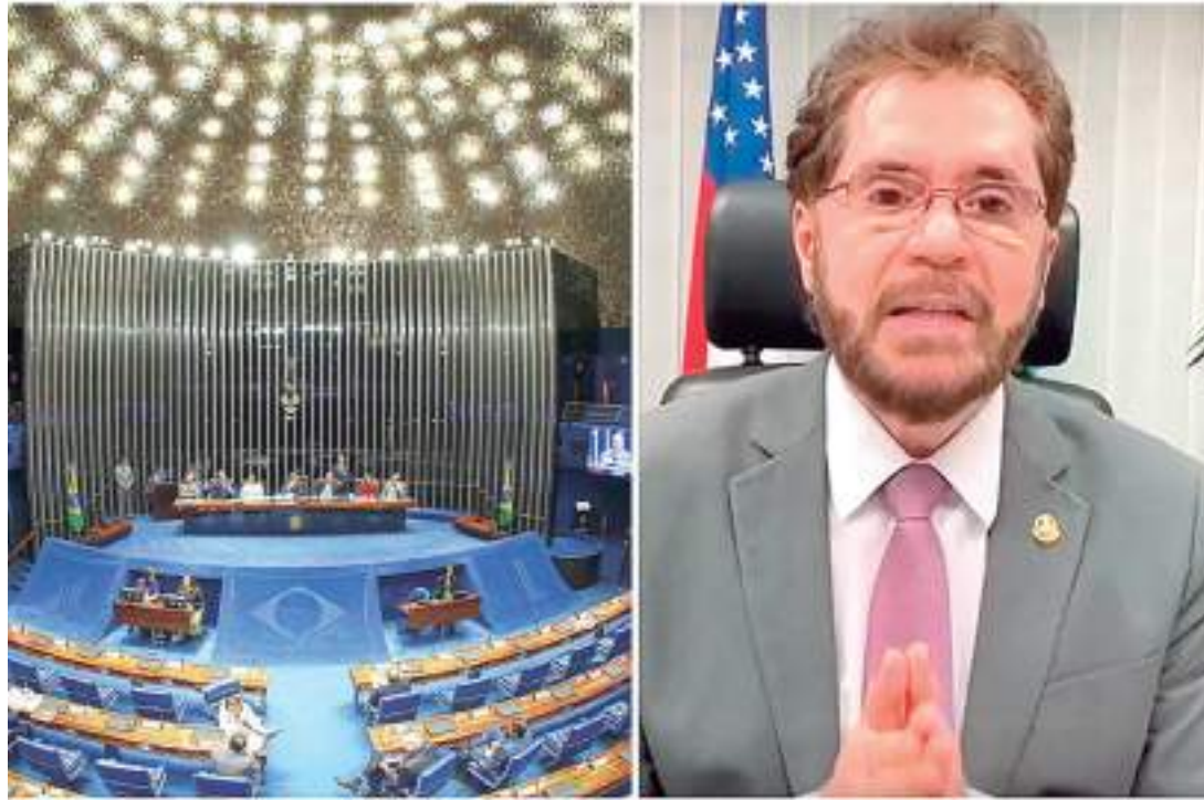
Senador considera como certo que o Senado fará alterações nos dois textos

"O uso do fundo eleitoral da cota das mulheres pra candidaturas de homens, sabemos que sabe que os partidos políticos funcionam como feudos e o resultado que vejo infelizmente é a piora na per-