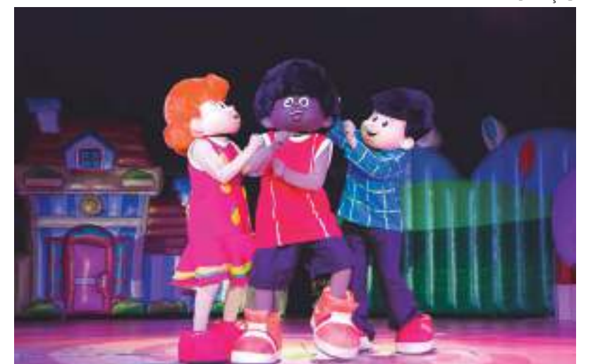
Projeto infantil tem mais de 8 bilhões de views no YouTube