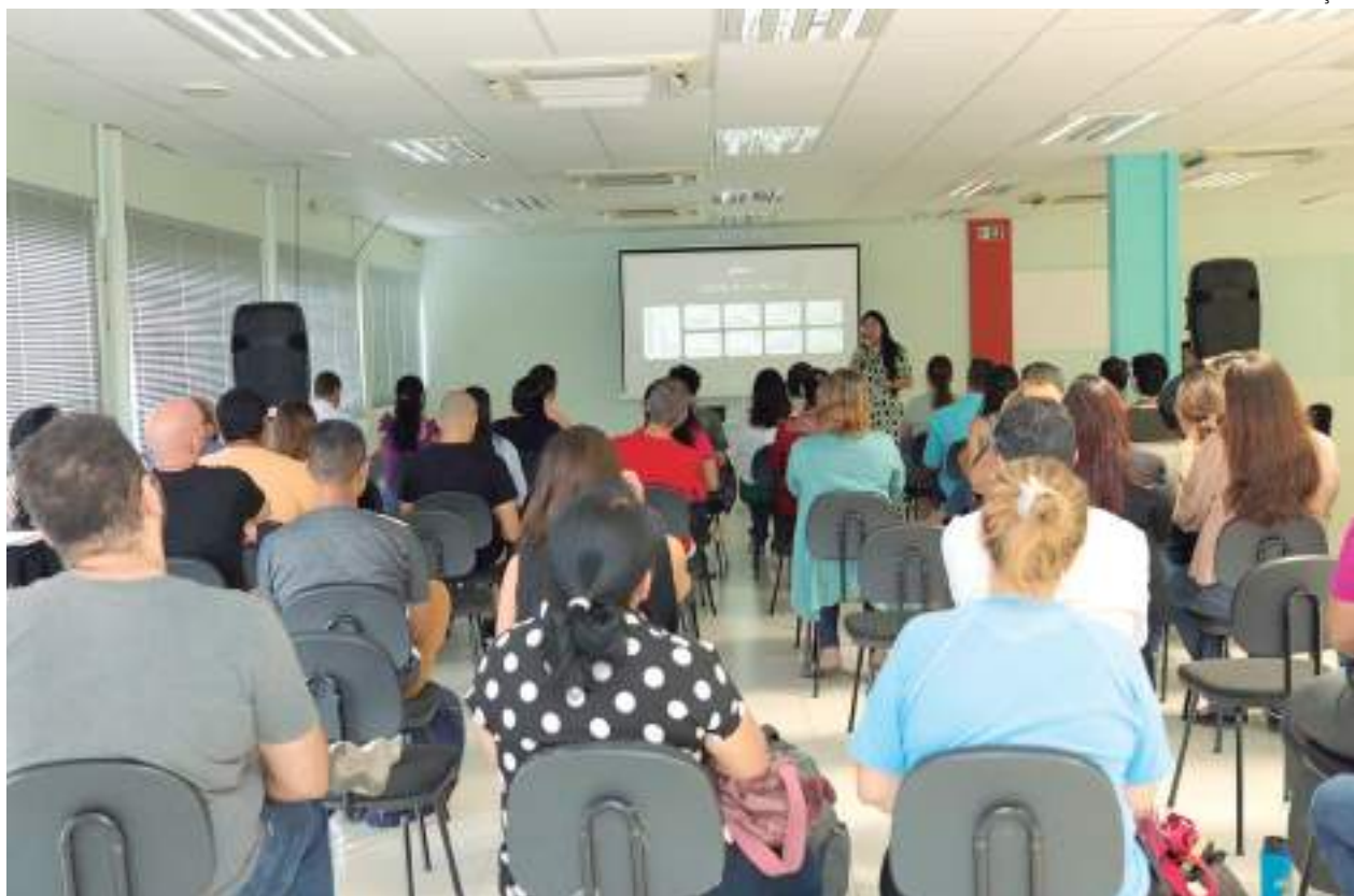
Alunos participam de curso na Fundação Paulo Feitoza

Mais de 100 pessoas acompanharam a programação, que ocorreu na sede da Fundação, localizada no bairro Distrito Industrial, zona Leste de Manaus.