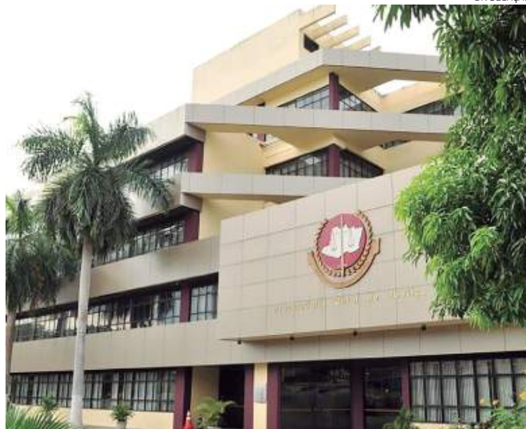
Instituição não realiza concurso público há 10 anos