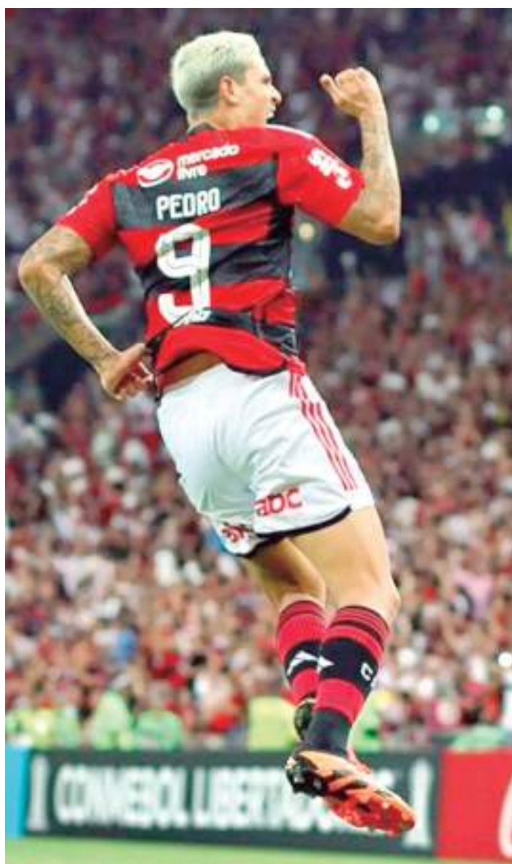
Pedro será titular na decisão da Copa do Brasil

Dorival Júnior também poderá entrar na história do São Paulo se for campeão, pois o time paulista nunca foi campeão da Copa do Brasil.