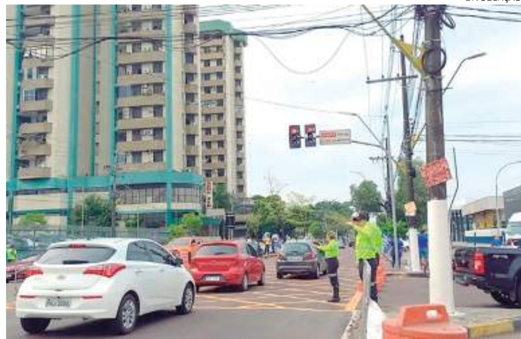
Cruzamento entre avenidas Djalma Batista e Constantino Nery

O IMMU desviará todo o trânsito para as avenidas Djalma Batista e São Jorge e Mário Ypiranga. A operação das Estações Arena e São Jorge ficará suspensa até o término