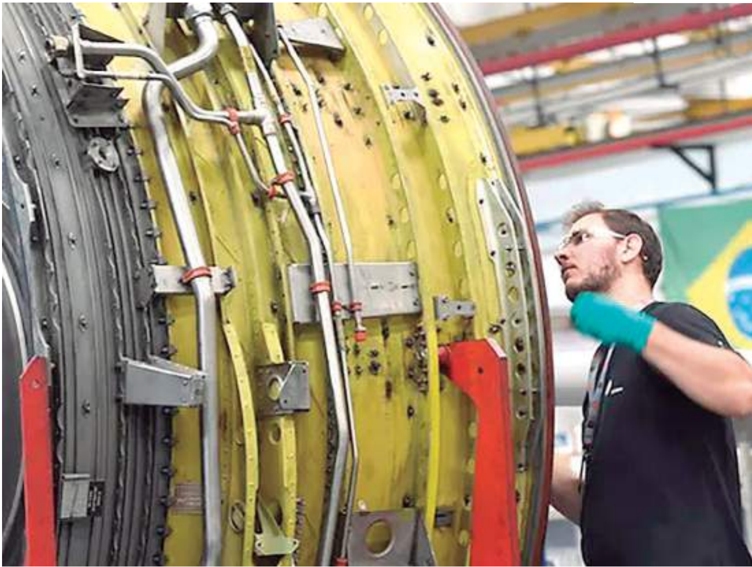
Trabalhador do setor industrial

Os desempenhos da indústria (0,9%) e dos serviços (0,6%) explicam o crescimento do PIB no último trimestre. No caso dos serviços, a influência positiva é