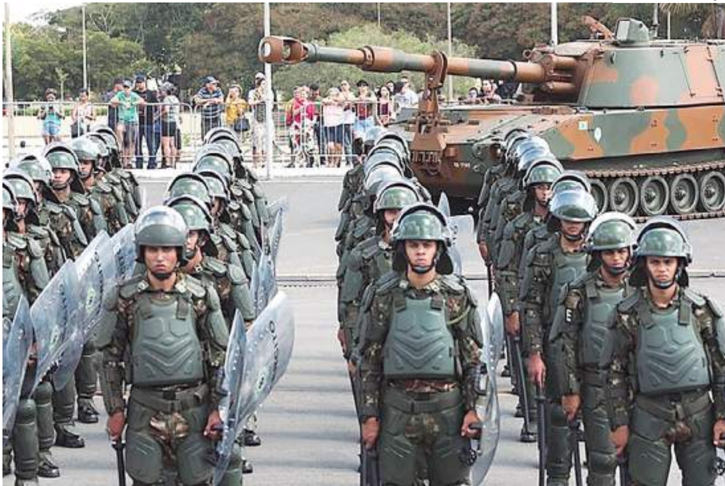
Militares das Forças Armadas Brasileira

na carreira militar, queira entrar para o processo político-eleitoral, terá que entrar para a reserva”, destacou o ministro Alexandre Padilha, da Secretaria de Relações Institucionais, após uma reunião no Ministério da Defesa.