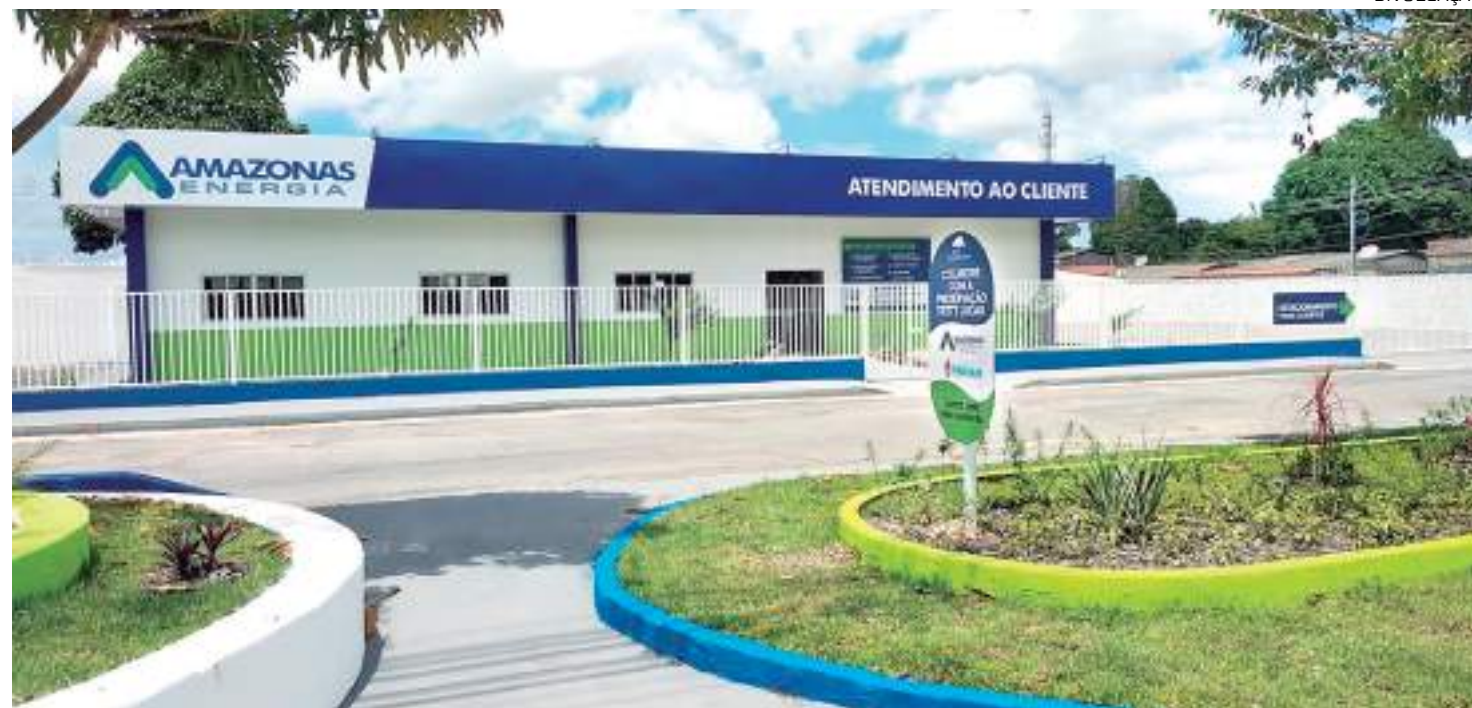
Prédio da Amazonas Energia em Manacapuru

Segundo os municípios, a cidade de Manacapuru pas-