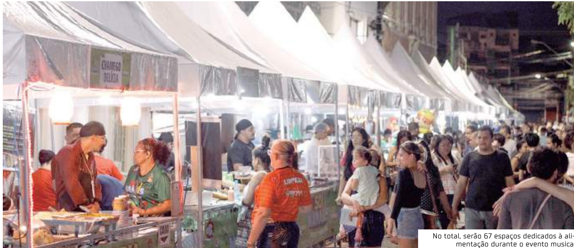
No total, serão 67 espaços dedicados à alimentação durante o evento musical

"O '#SouManausPassoaPaço 2023' é uma grande celebração da cultura e da arte nortista, e a gastronomia não poderia ficar de fora dessa grande celebração. Por orientação do prefeito David Almeida, este ano estamos ampliando os espaços e visamos fortalecer a