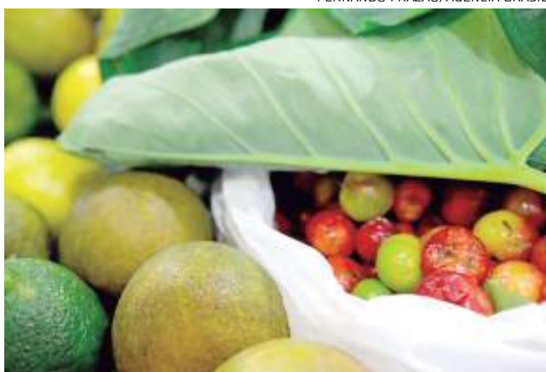
Verduras e frutas em exposição