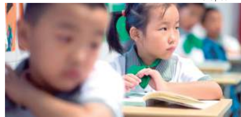
Alunos em escola, na China