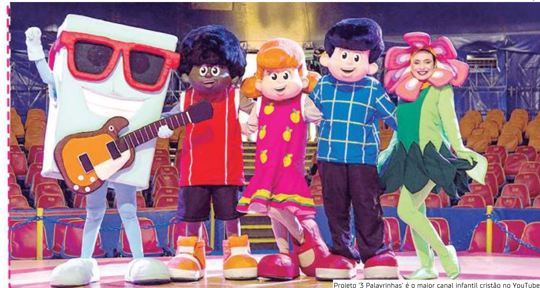
Projeto '3 Palavrinhas' é o maior canal infantil cristão no YouTube

A apresentação com aproximadamente 1h30 de dura-