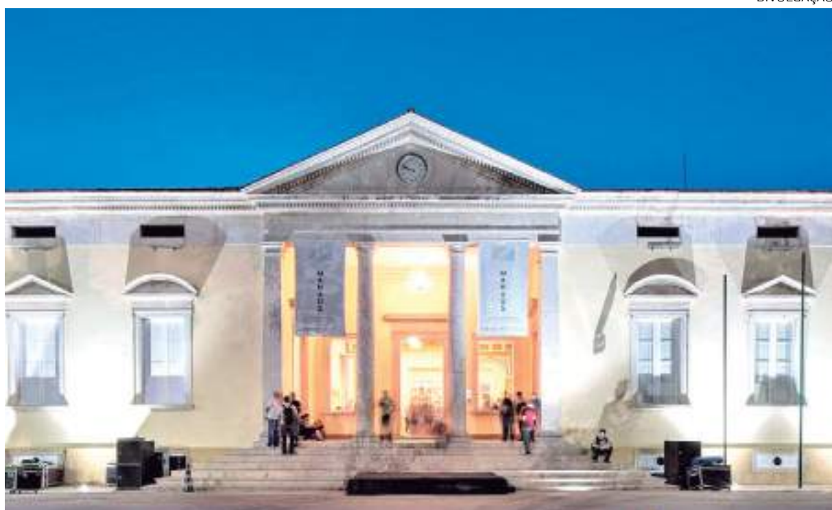
Museu da Cidade de Manaus recebe turmas de 09h às 16h00 de segunda a sexta-feira

Além das visitas, o projeto também promove palestras sobre Museografia e Patrimônio Cultural brasileiro. As atividades ocorrem também nas cidades de Santa Cruz das Palmeiras e Vinhedo, no interior do estado de São Paulo.