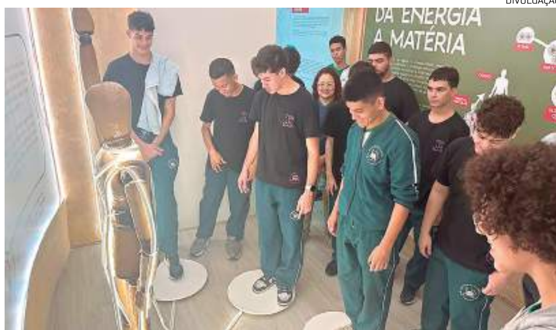
Alunos visitam painel de conscientização sobre energia limpa

O Centro de Eficiência Energética foi montado na cida-