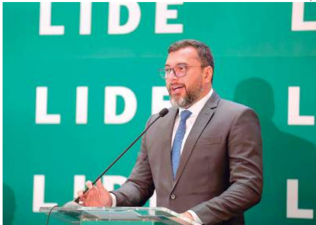
Wilson Lima discursando em Washington

O encontro inédito realizado pelo LIDE reúne governadores e prefeitos do Brasil com representantes de três organizações financeiras com sede em Washington: o Banco Mundial, o Banco Interamericano de Desenvolvimento (BID) e o International Finance Corporation (IFC). Também reúne autoridades internacionais e