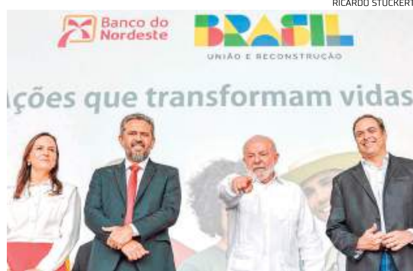
Lula durante cerimônia de 25 anos de criação do Programa Crediamigo em Fortaleza

Segundo Lula, o Brasil tem 4,6 milhões de propriedades no Brasil com menos de 100 hectares e é