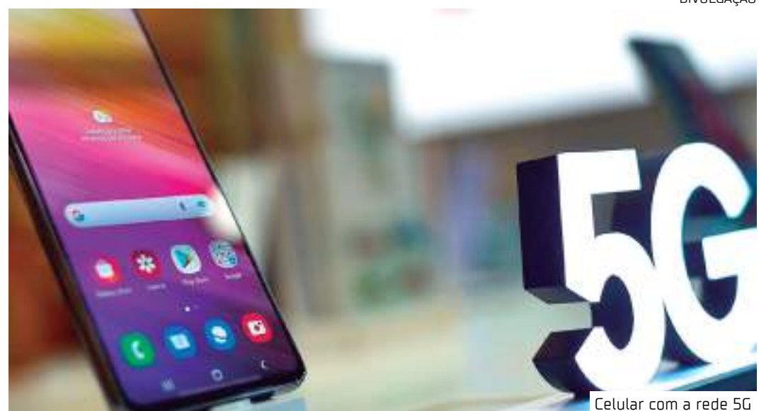
Celular com a rede 5G