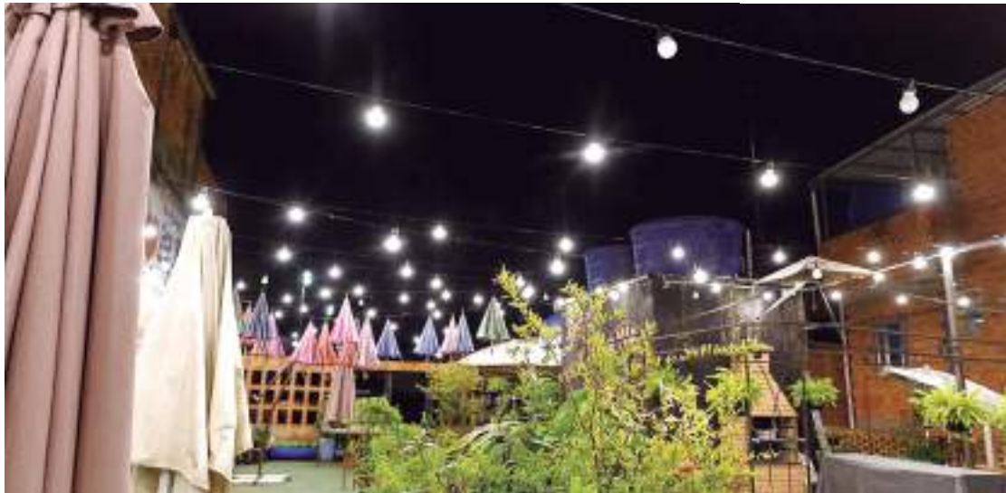
Áreas iluminadas com lâmpadas convencionais LED

A Signify é responsável por iniciativas no Brasil direcionadas a áreas de maior vulnerabilidade social, conectando ações de responsabilidade social e sustentabilidade. A iluminação é comprovadamente uma excelente ferramenta para a qualificação e maior acesso à educação e saúde em áreas isoladas do país.