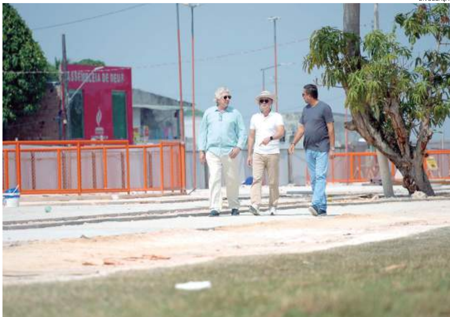
Prefeito vistoriou obra que fica localizada entre as avenidas Isaías Vieiralves e Olívia de Menezes Vieiralves

da anunciou a entrega da obra para outubro, como parte das comemorações de aniversário da cidade de Manaus. A etapa que será inaugurada tem aproximadamente 1 quilômetro de extensão, incluindo desde quiosques gourmet, playground, quadras esportivas, pista de caminhada até ciclovia, estacionamentos, academia ao ar livre, espaço multiuso e playpet.