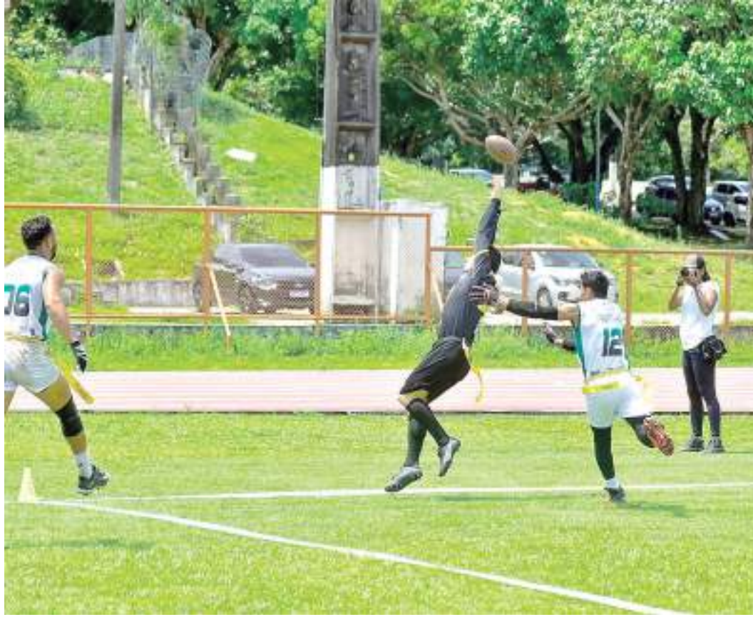
Amazonense de Flag Football acontece neste fim de semana na Vila Olímpica de Manaus

"A fase regular percorre os meses de setembro e outubro, com final prevista para dezembro. As disputas da categoria feminina também acontecem neste mês,