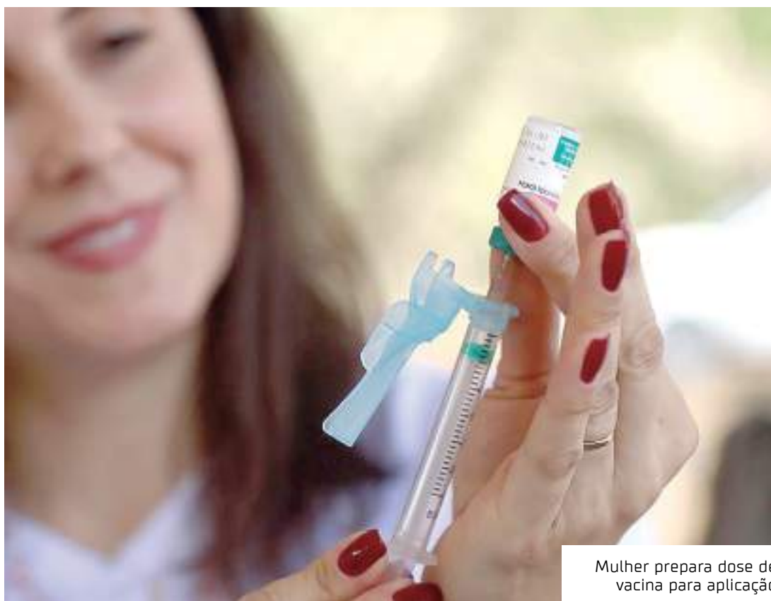
Mulher prepara dose de vacina para aplicação

As quedas nas coberturas vacinais observadas desde 2015, porém, acenderam um sinal de alerta para autoridades sanitárias do Brasil e do exterior, e a possibilidade de que doenças eliminadas do país retornem causa preocupação.