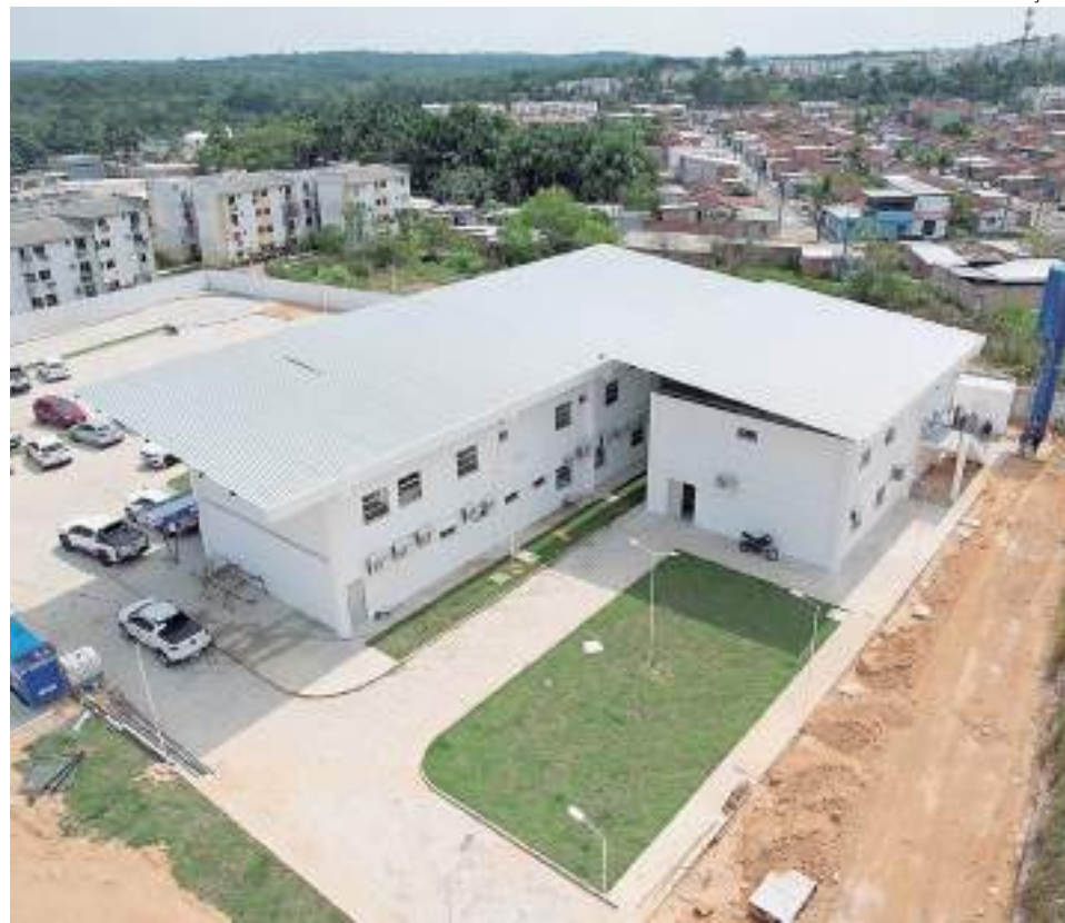
Nova UBS irá substituir a antiga unidade instalada na rua Maicuru

“Nós saímos de uma realidade daquelas casinhas da família de 32 metros quadrados para essa realidade de 1.200 metros quadrados. Estamos falando praticamente 400 vezes maior em metragem. A qualidade dos serviços será melhor. Essa é uma UBS moderna e isso torna a saúde básica de Manaus ainda mais competitiva, dando aos moradores do Viver Melhor a maior UBS da nossa cidade. O trabalho da