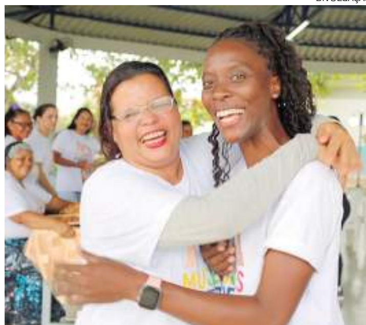
Elenco amazonense do espetáculo "Dois Irmãos"

Nas últimas semanas, 50 mulheres migrantes e refugiadas venezuelanas foram contempladas com kits profissionais para iniciarem o próprio negócio no ramo da estética e beleza. A solenidade faz parte da programação da 4ª edição do "Mujeres Fuertes" e realizada na sede do Hermanitos, localizada no bairro Centro – Zona Sul de Manaus.