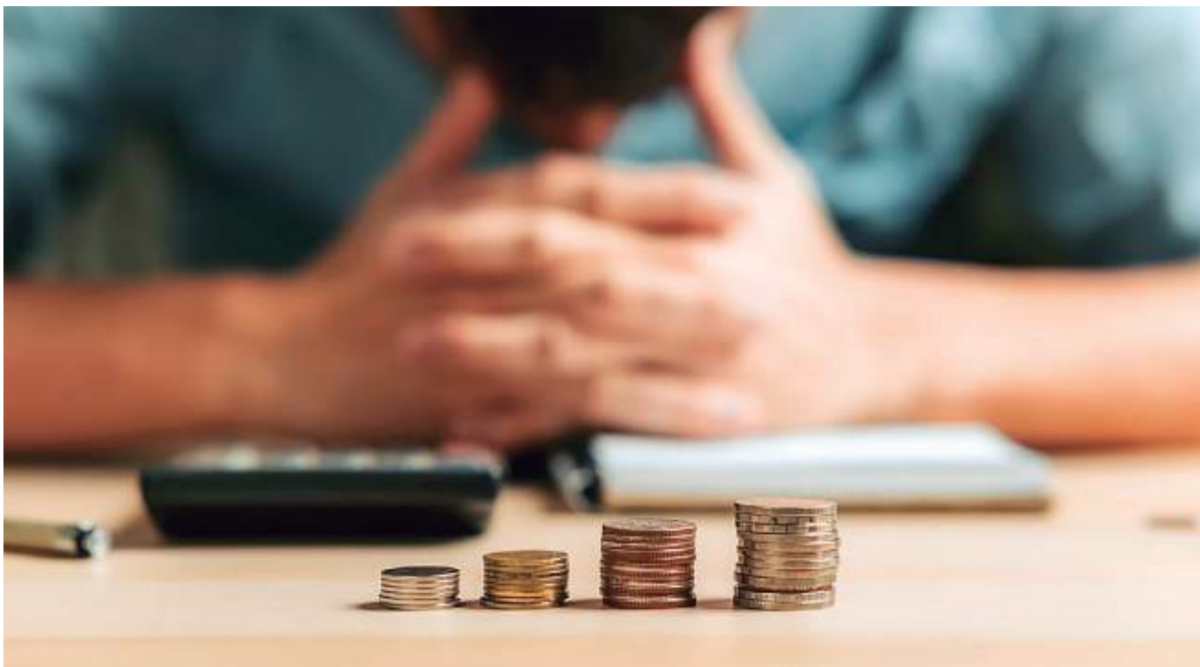
Número de inadimplentes no Brasil teve aumento em agosto

"Apesar do pequeno aumento ocorrido em agosto, que se refere principalmente às dívidas vencidas de 1 a 3 anos, a tendência deve ser de queda dos inadimplentes nos próximos meses, uma vez que todo o cenário macroeconômico corrobora para essa direção. Os efeitos