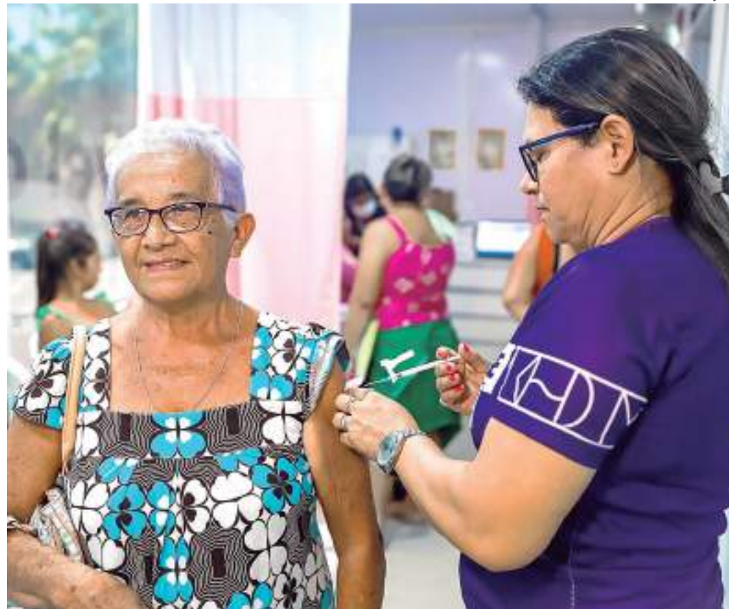
Aplicação de doses contra doença são administradas em nove pontos da rede básica de saúde

“O esquema vacinal completo contra a Covid inclui duas doses do esquema primário e dose de reforço, observando-se os intervalos entre as doses recomendados pelo Ministério da Saúde”, informa a gestora.