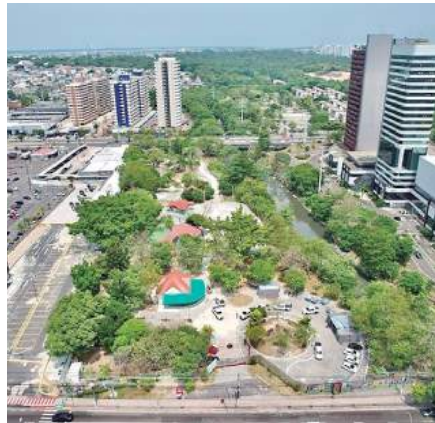
Espaço é uma opção de lazer e entretenimento para a população manauara