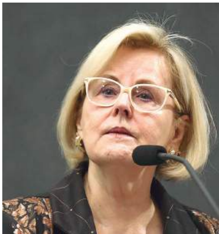
Presidente do Supremo Tribunal Federal (STF), Rosa Weber