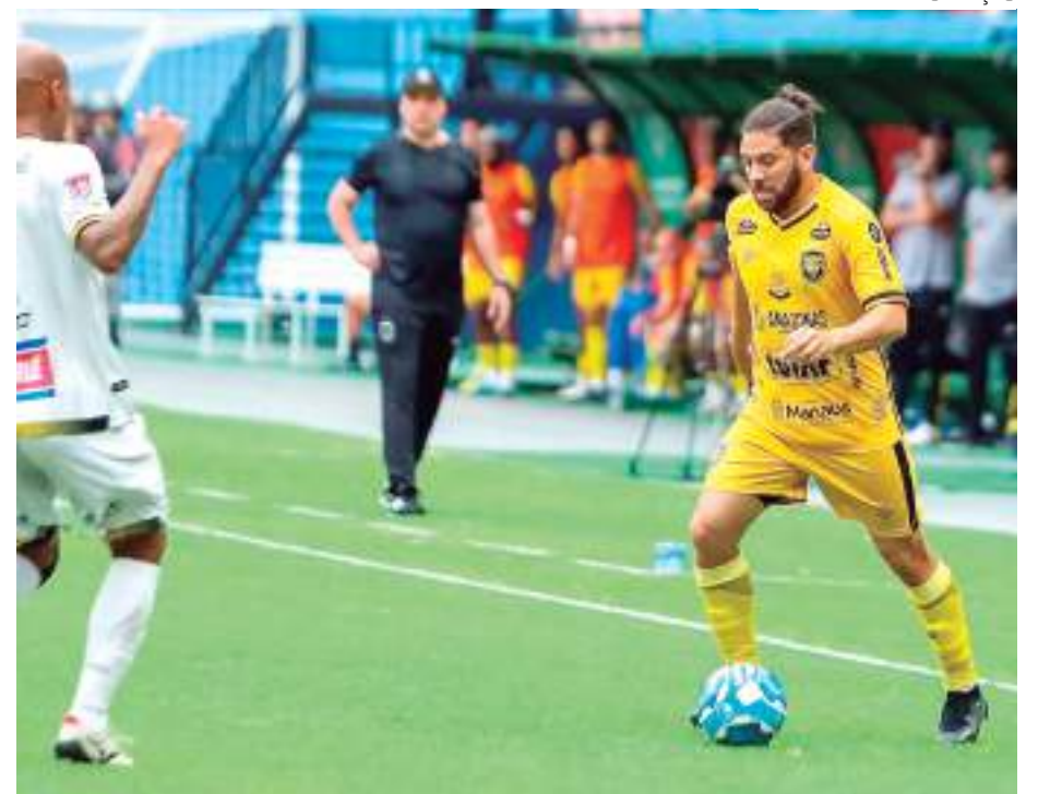
Amazonas venceu o Volta Redonda por 2 a 0 e está a uma vitória de ficar perto do líder

Volta Redonda x Amazonas Série C Data e horário: 23 de setembro de 2023, às 19h Local: Estádio Raulino de Oliveira, em Volta Redonda (RJ) Árbitro: Rafael Rodrigo Klein (RS) Assistentes: Jorge Eduardo Bernardi (RS) e Michel Stanislau (RS) VAR: Jose Cláudio Rocha Filho (Fifa/SP)