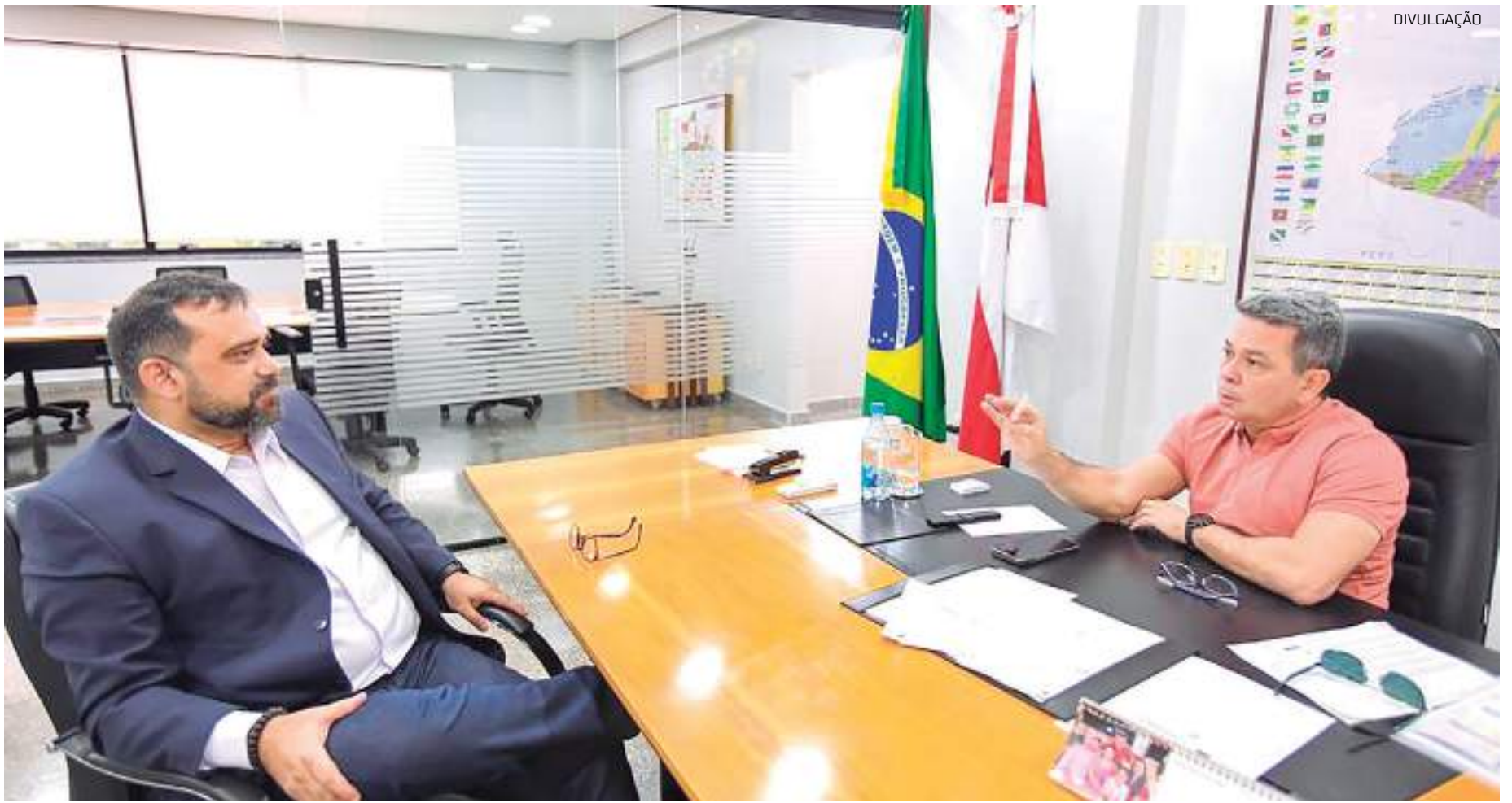
Vice-governador lembrou que a transição energética é um dos eixos do novo Programa de Aceleração do Crescimento (PAC) do Governo Federal