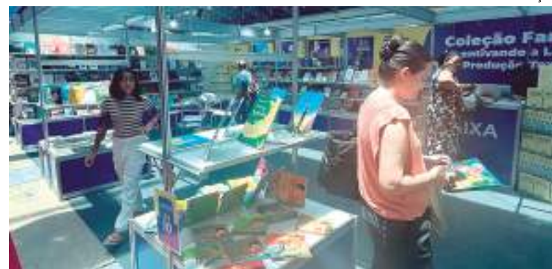
Evento ocorrerá no Centro de Convenções Vasco Vasques

A editora Valer informa que estará presente na 38.ª Feira de Livros e o Cuca Sesc Festival que ocorre entre os dias 5 e 8 de outubro de 2023 e vai homenagear o poeta e jornalista Jorge Tufic. Com entrada gratuita, o evento ocorrerá no Centro de Convenções Vasco Vasques, situado na avenida Constantino Nery, 5001, Chapada, das 8 às 21h.