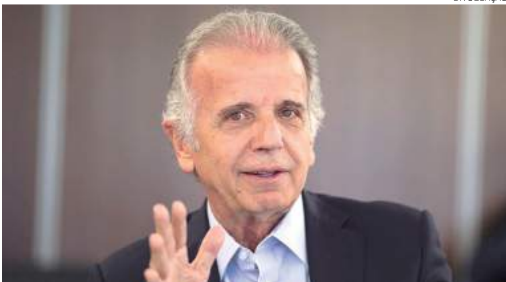
Múcio disse que culpados precisam ser identificados para que população não desconfie de Forças no geral