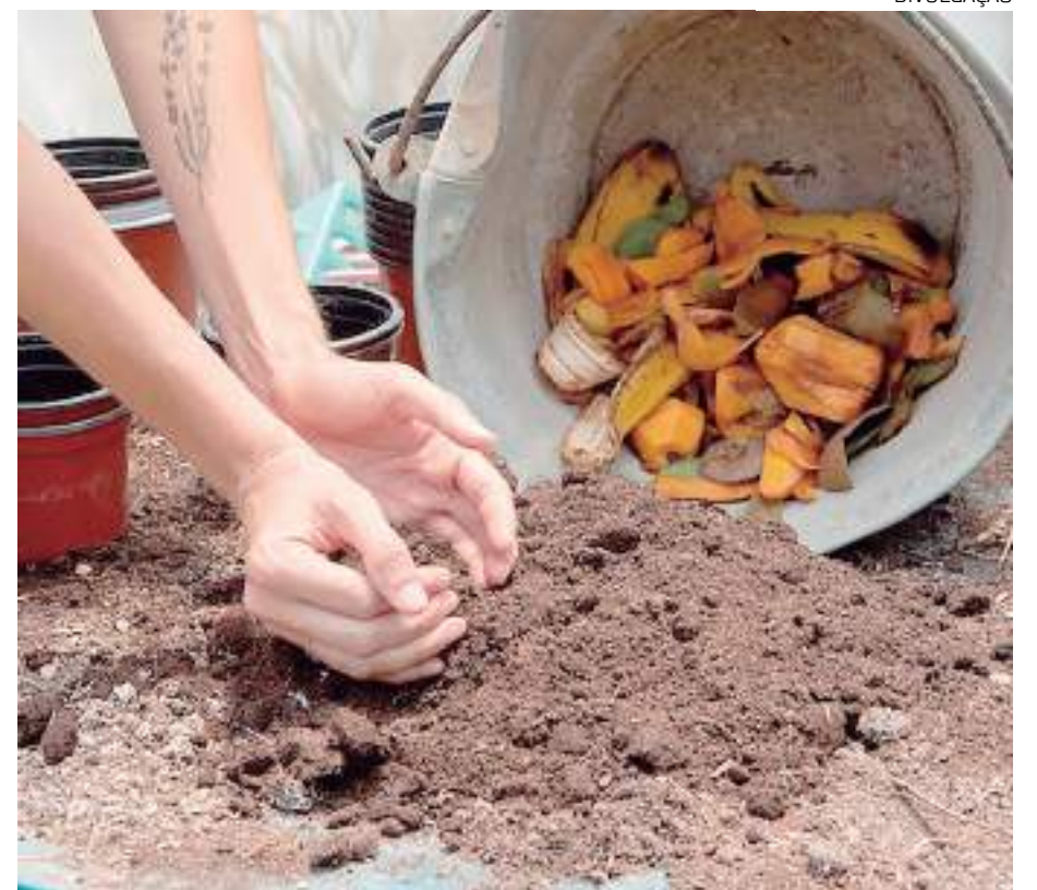
Estudos apontam que 51% dos resíduos orgânicos no Brasil, são depositados em lixões e aterros

A medida visa incentivar a utilização de resíduos orgânicos provenientes do processamento de alimentos nas unidades escolares, hospitais, presídios, restaurantes populares, restaurantes universitários e centros de abastecimento de alimentos “in natura”, a fim de destinar o composto orgânico resultante a projetos de agricultura familiar, hortas comunitárias, hortos de mudas a serem destinados a parques públicos, projetos de reflorestamento e jardinagem de prédios públicos.