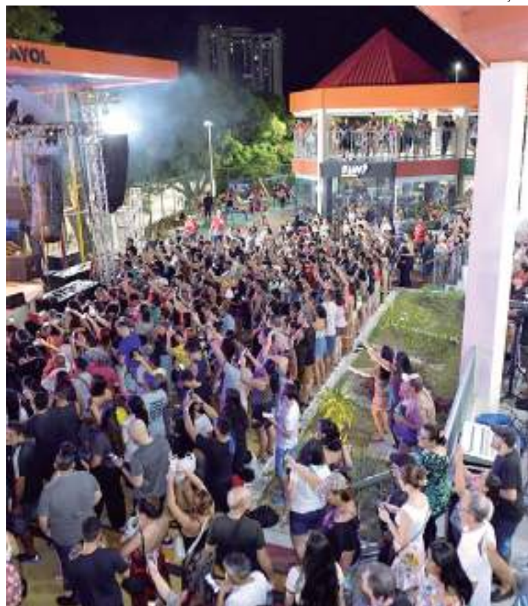
Espaço fica situado no complexo turístico Ponta Negra