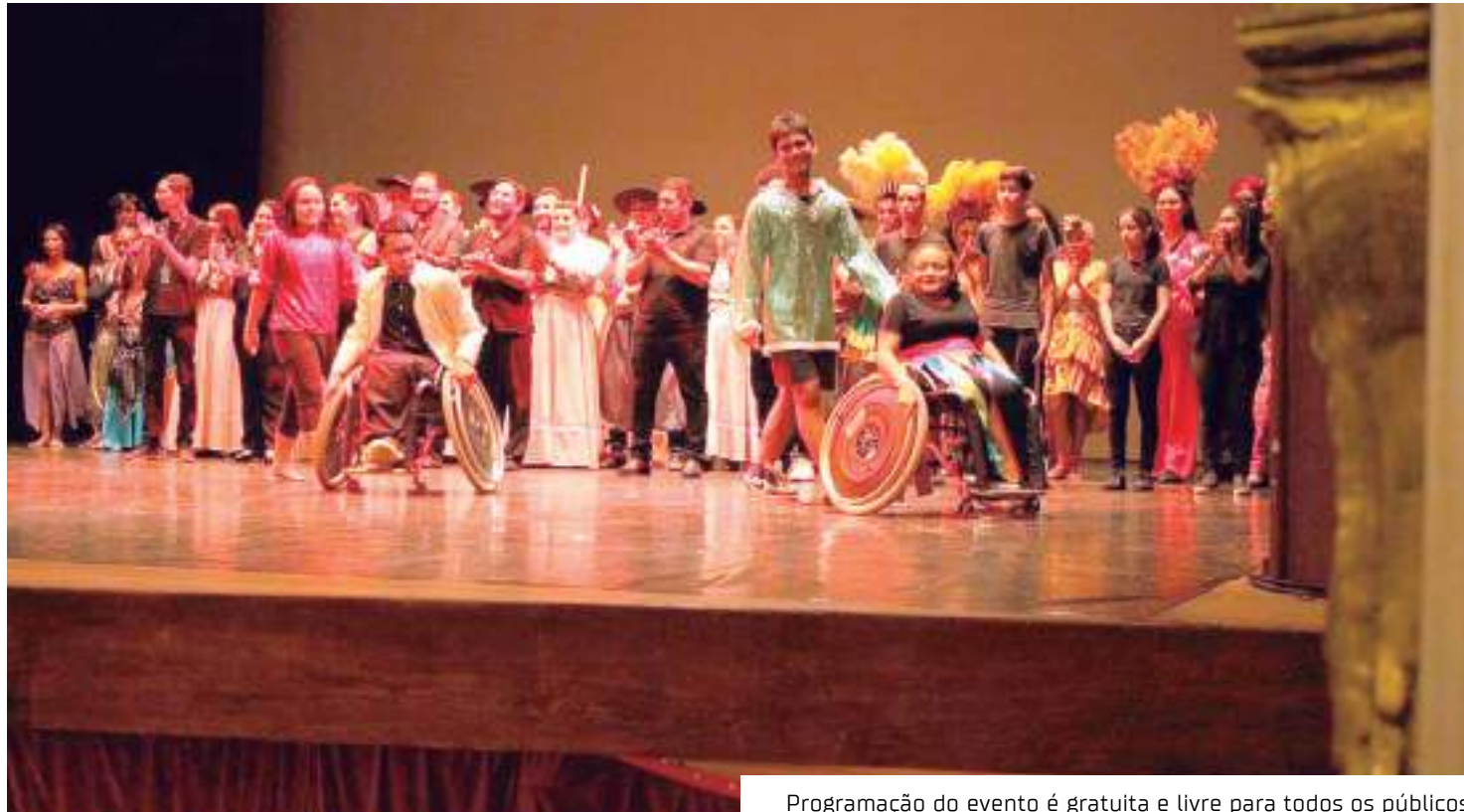
Programação do evento é gratuita e livre para todos os públicos

Para o cantor, fazer parte do musical é muito repre-