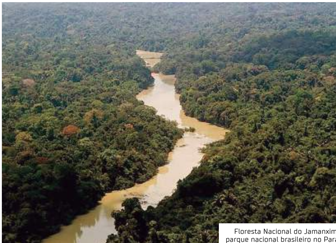
Floresta Nacional do Jamanxim, parque nacional brasileiro no Pará

Segundo o MapBiomas, o crescimento do garimpo em áreas protegidas em 2022 foi de 190% maior do que há cinco anos, com aumento de 50 mil hectares. Nesse ano, mais de 25 mil hectares em Terras Indígenas e de 78 mil hectares em Unidades de Conservação estavam ocupados pela ativi-