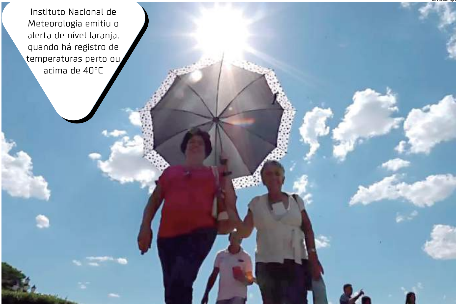
População sofre com calor extremo em Manaus

Instituto Nacional de Meteorologia emitiu o alerta de nível laranja, quando há registro de temperaturas perto ou acima de 40°C