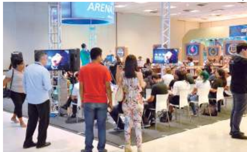
Edição da "Caravana do Empreendedorismo" no Shopping Manaus ViaNorte

No dia de encerramento, sexta-feira (29), ocorre a palestra "Boas práticas para serviços de alimentação", das 10h às 12h, e a oficina "Gestão de empresas", das 14h às 18h.