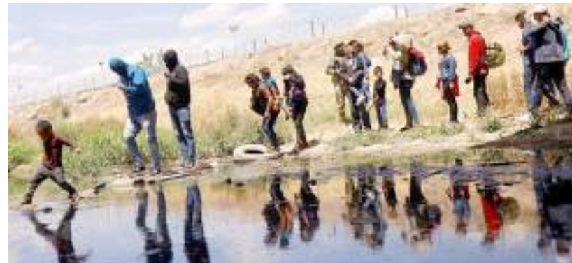
Imigrantes seguem em direção à fronteira dos Estados Unidos.