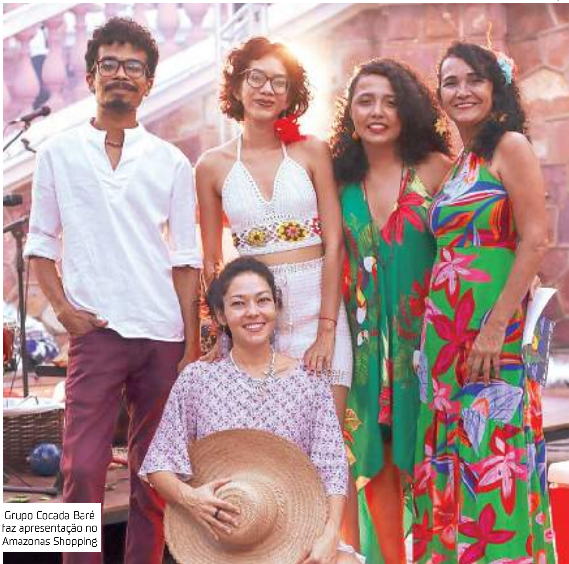
Grupo Cocada Baré faz apresentação no Amazonas Shopping

Em um ano, o grupo Cocada Baré já participou de eventos como "Amyipaguana - Mostra de Cultura Popular", Festival Afro-ameríndio, Oficina de Coco de Roda no projeto "Circuito +Cultura", do espetá-