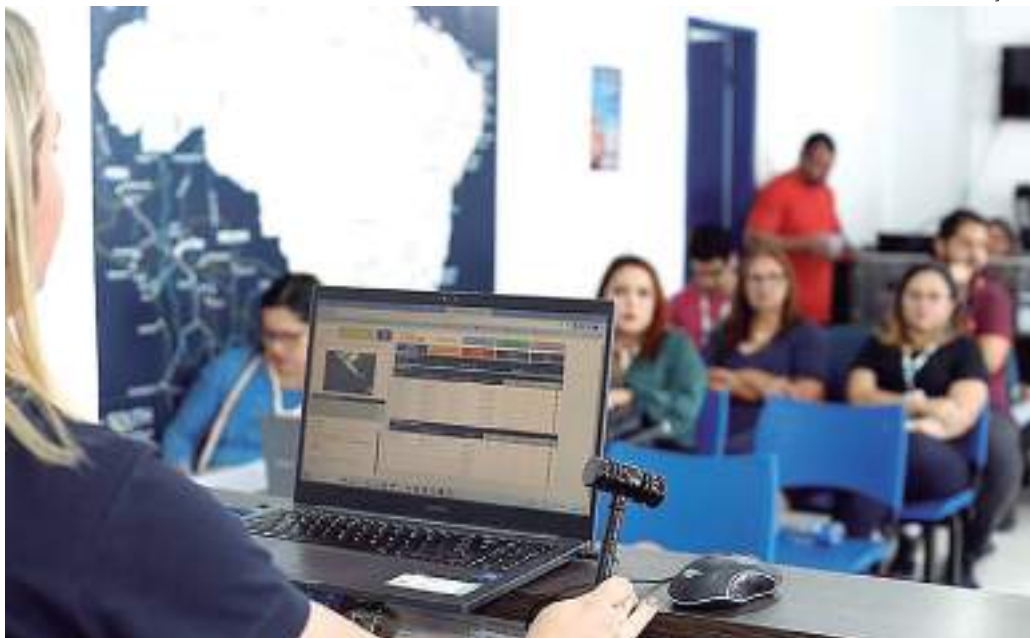
Leilões são organizados pelo Departamento de Patrimônio (DPAT)