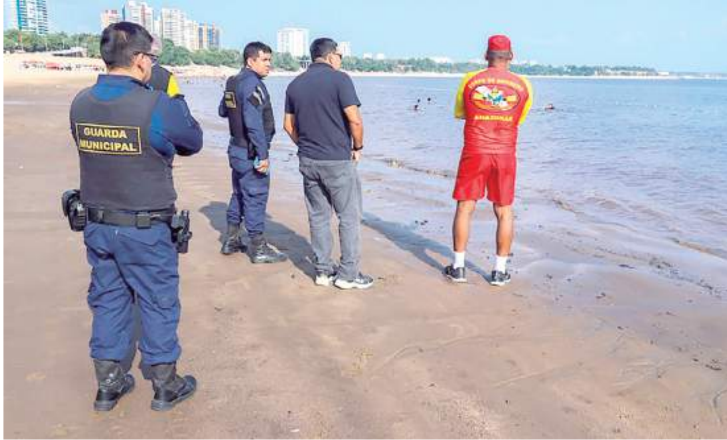
Segundo as autoridades, a praia será interditada quando o nível do Rio Negro atingir 16 metros

“Nossa prioridade é a qualidade dos nossos serviços e a oferta de oportunidades para quem mais precisa. Estamos atendendo 55 comunidades mapeadas, sendo 33 no rio Negro e 17 no rio Amazonas,