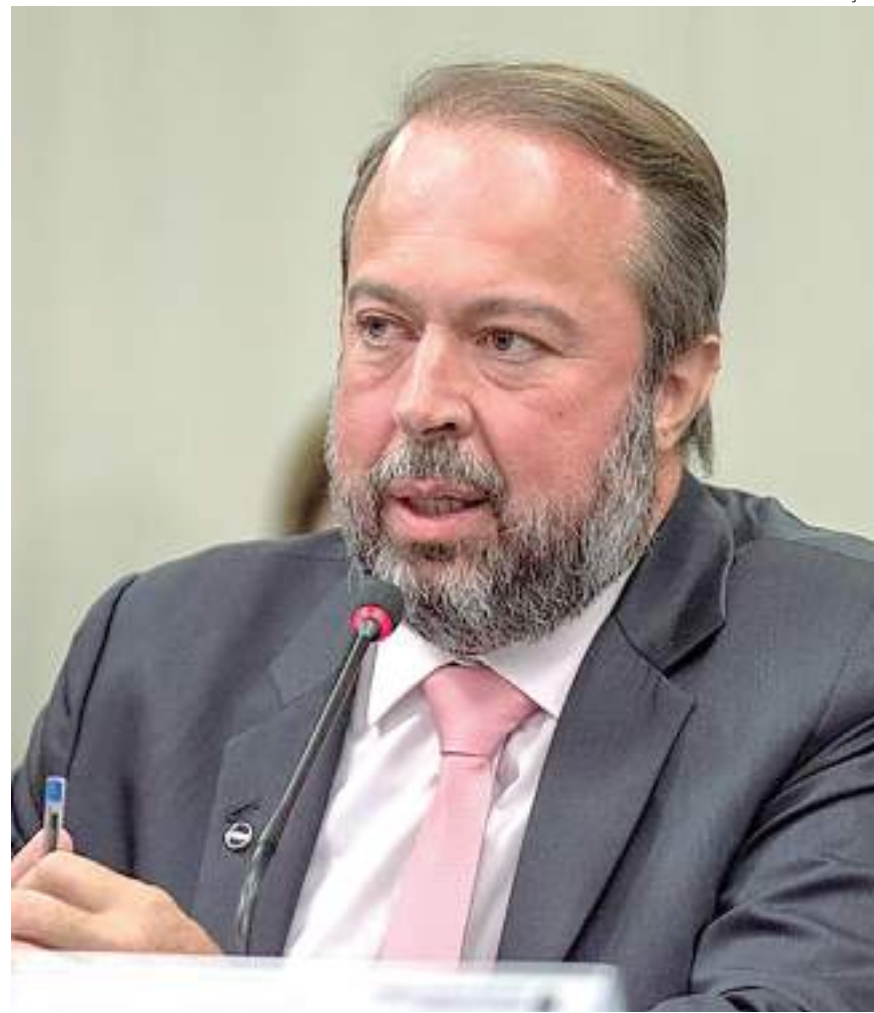
Ministro Alexandre Silveira comentou sobre estudo da Petrobras

A região já teve 95 poços petrolíferos perfurados, com apenas uma descoberta comercial de gás natural e alto índice de abandono por dificuldades operacionais, que o setor diz serem reflexos da tecnologia ultrapassada quando a região teve seu pico de exploração, nos anos 1970.