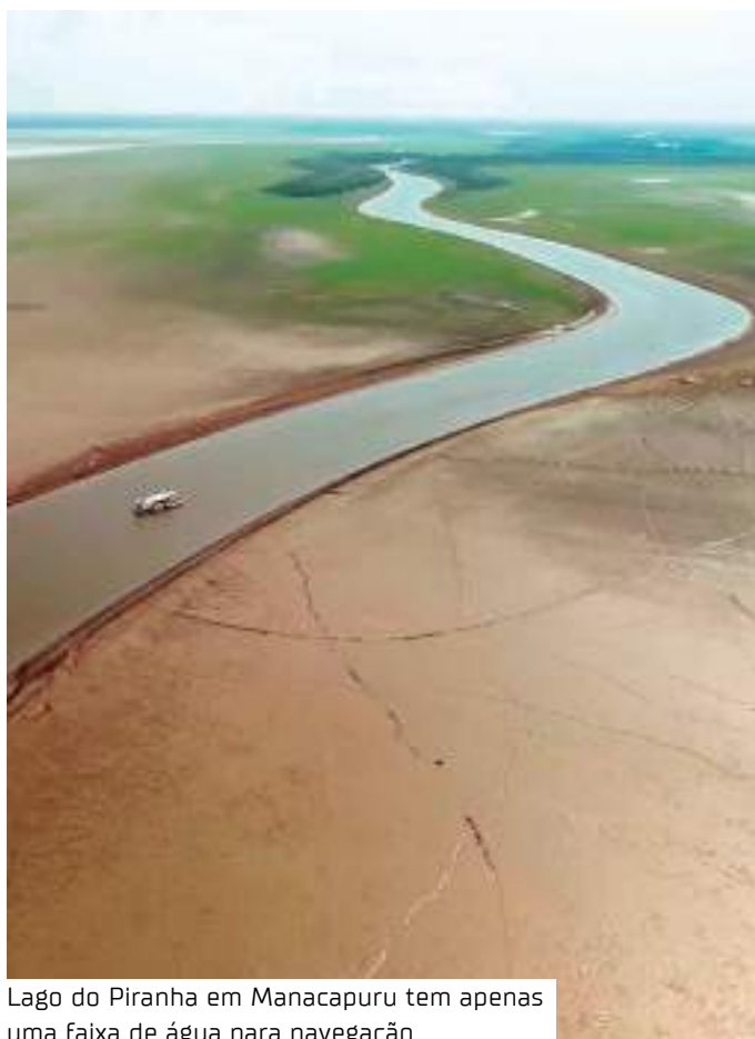
Lago do Piranha em Manacapuru tem apenas uma faixa de água para navegação

Além dos seres humanos, muitos animais também são vítimas do processo ambiental. A morte de peixes e botos tem chamado a atenção de especialistas, que também desenvolvem um papel na identificação e resgate deste grupo.