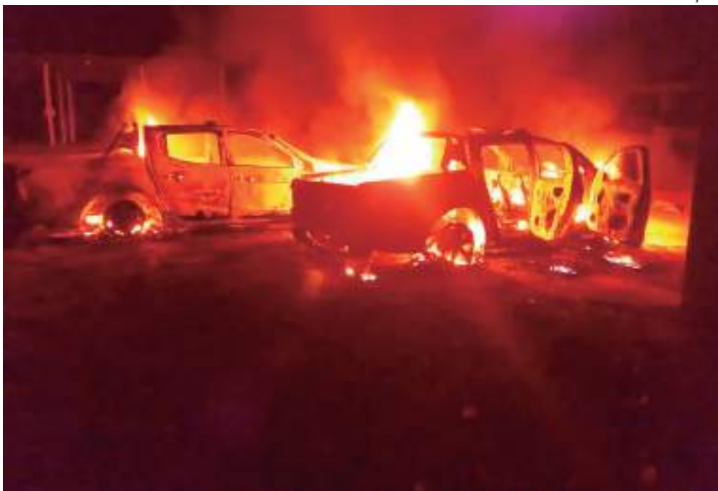
Dois caminhonetes foram completamente destruídas pelas chamas