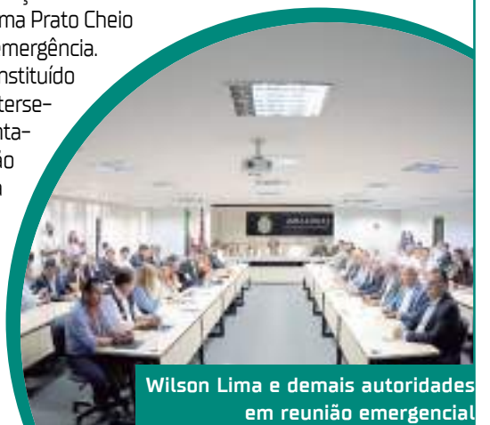
Wilson Lima e demais autoridades em reunião emergencial

Segundo levantamento da Defesa Civil do Amazonas, divulgado no último dia 29, cerca de 19 municípios das calhas do Alto Solimões, Baixo Solimões, Juruá, Médio Solimões e Purus estão em situação de emergência, afetando 174,7 mil pessoas; outras 36 cidades estão em alerta; e cinco em atenção. O rio Negro atingiu 15,88m.