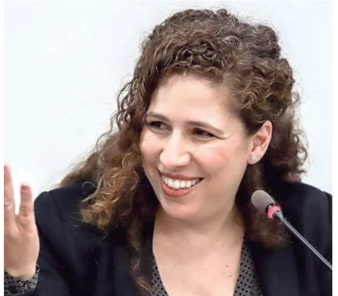
A Segundo a ministra da Gestão e da Inovação em Serviços Públicos, Esther Dweck, mais órgãos podem assinar termo

Vagas passam por órgãos como a Fundação Nacional dos Povos Indígenas (Funai), Agência Nacional de Energia Elétrica (Aneel), Ministério da Justiça e Segurança Pública e outros 17 setores.