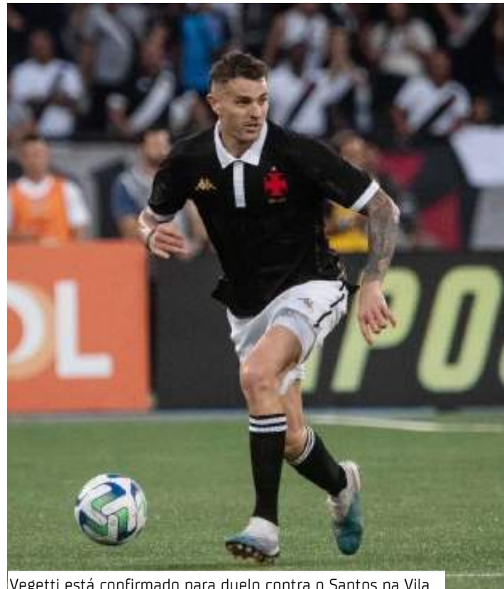
Vegetti está confirmado para duelo contra o Santos na Vila