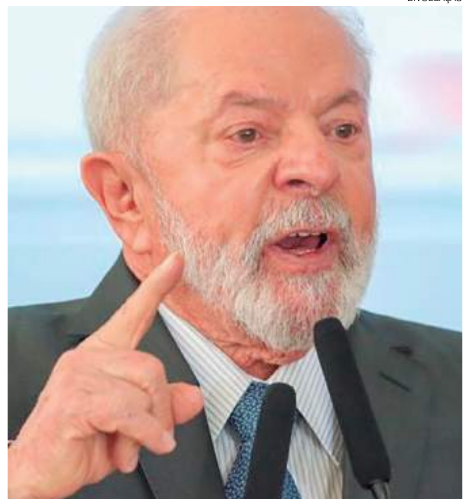
Ministros de Lula avaliam que é necessário resolver impasse o quanto antes

Na reta final do ano e com um bloqueio de R$ 3,8 bilhões vigente sobre as despesas, o governo vê um risco de apagão (“shutdown”) na máquina caso tenha de cumprir a regra.