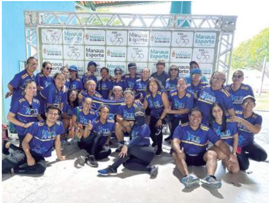
Segundo dia da 23ª Olimpíada da Terceira Idade movimentada sete modalidades no Parque do Idoso

"Está sendo muito legal. Muitos atletas estão participando de todas as competições de hoje. Toda a estrutura de apoio à disposição para