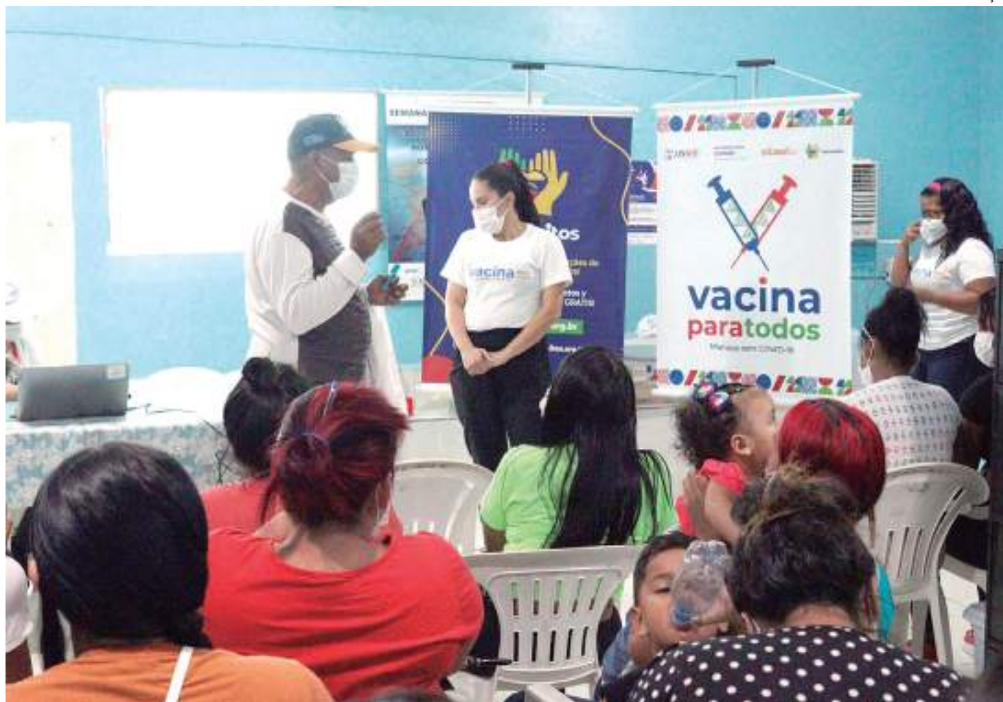
Organização da Sociedade Civil Hermanitos realiza ação social

A cerimônia acontecerá das 9h às 11h, no auditório do Ministério Público do Trabalho do Amazonas e Roraima (MPT - AM/RR), localizado na Avenida Mário Ypiranga, 2.479, bairro Flores.