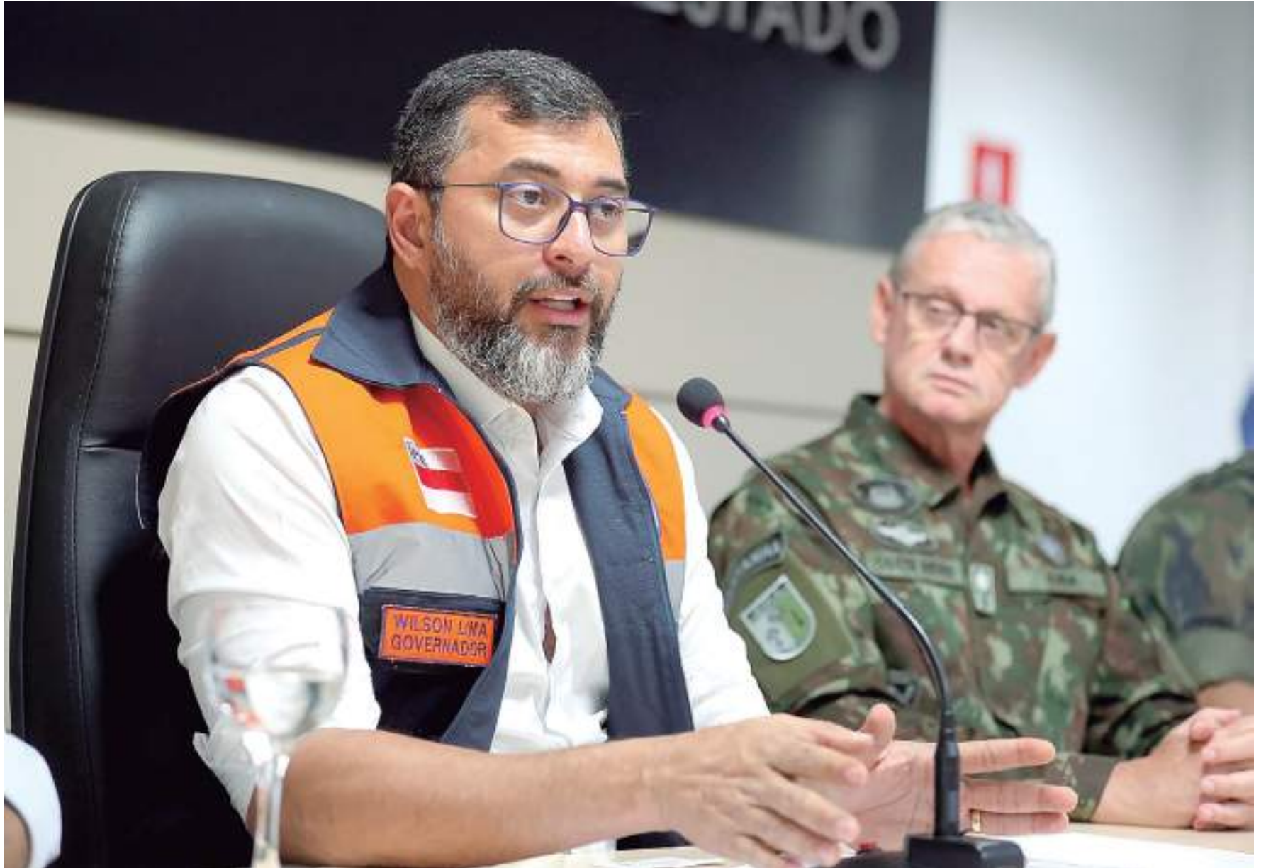
Governador também destacou os impactos da estiagem sobre a economia, em virtude das cotas dos rios, que estão próximas de atingirem os menores índices já registrados

O colegiado também atua para reorganizar o setor produtivo e promover a reestruturação econômica das áreas atingidas por desastres; e estabelecer medidas preventivas de segurança contra desastres em escolas e hospitais situados em áreas de risco