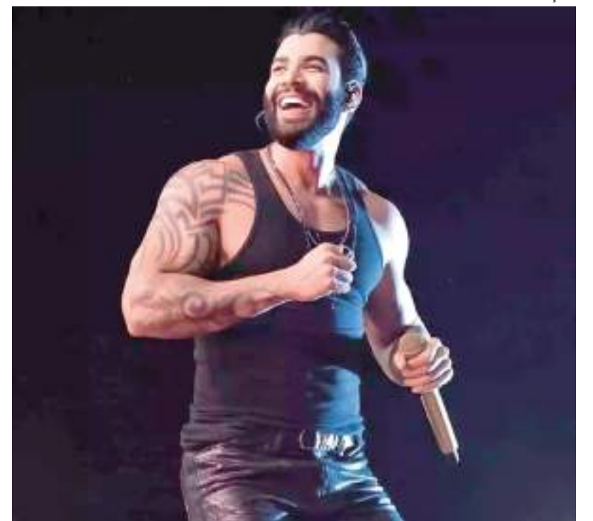
Gustavo Lima se apresentará na Arena da Amazônia em dezembro