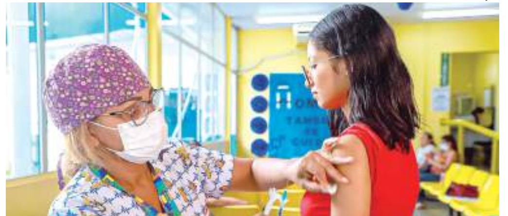
População deve comparecer entre 8h e 12h

Dando continuidade à mobilização para controlar a disseminação do novo coronavírus, a Prefeitura de Manaus oferta neste sábado (30), a vacina contra a Covid-19 em nove unidades da Secretaria Municipal de Saúde (Semsu). As pessoas que precisam iniciar ou atualizar seu esquema vacinal podem buscar o serviço no horário de 8h às 12h.