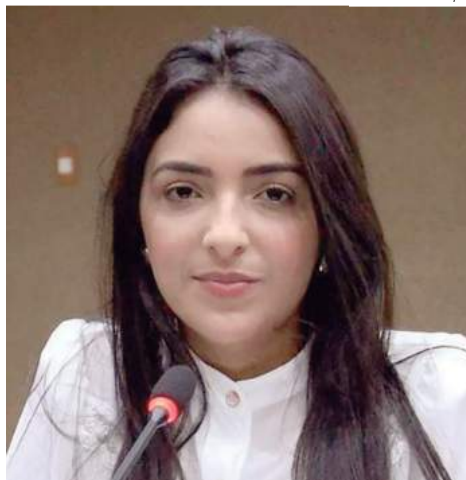
Vereadora exerce seu primeiro mandato na Câmara Municipal de Manaus

Totalizando um resultado de despesa anual de R$ 397 mil por vereador. Caso todos os parlamentares utilizarem integralmente sua cota, o custo total anual chega a R$ 16,3 milhões.