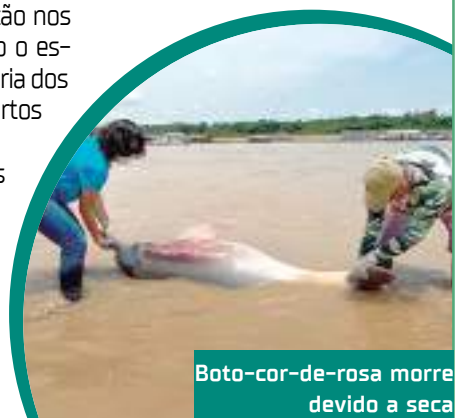
Boto-cor-de-rosa morre devido a seca

Para contornar os efeitos drásticos, os governantes e a esfera federal se uniram para atender as necessidades dos amazonenses afetados pela estiagem.