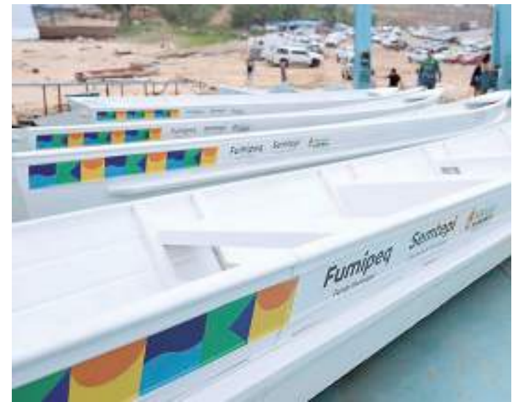
São 20 embarcações que foram entregues para ribeirinhos

O documento prevê uma série de ações para o enfrentamento da vazante no município, entre articulação com os governos estadual e federal, contratação temporária de pessoal e aquisição de bens e materiais, se necessário, para o atendimento da população no período.