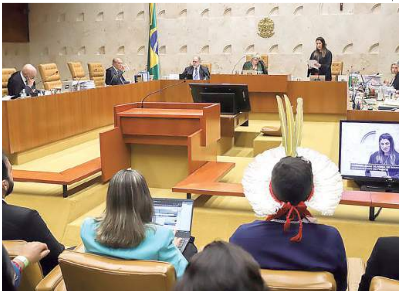
Resultado foi obtido com os ministros Moraes, Luís Roberto Barroso, Edson Fachin, Cristiano Zanin, Dias Toffoli, Luiz Fux e Gilmar Mendes

"Eu afasto a tese do marco temporal, acompanhando na íntegra do voto do ministro Fachin [relator], reafirmando que a jurisprudência da