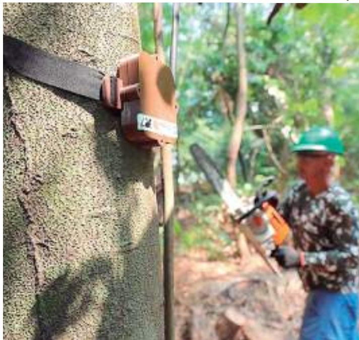
Tecnologia possui um sistema que identifica sons de motosserra e trator