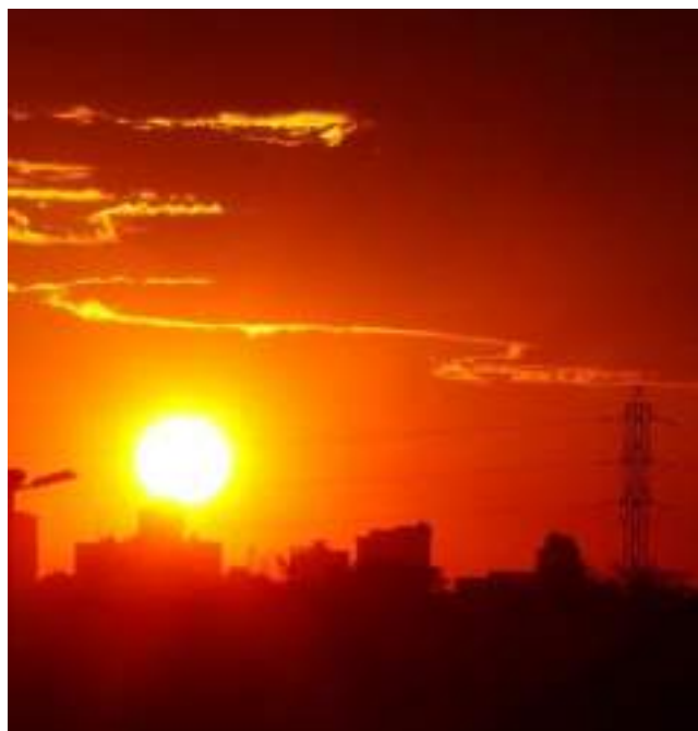
Primavera mais quente é esperada em Manaus