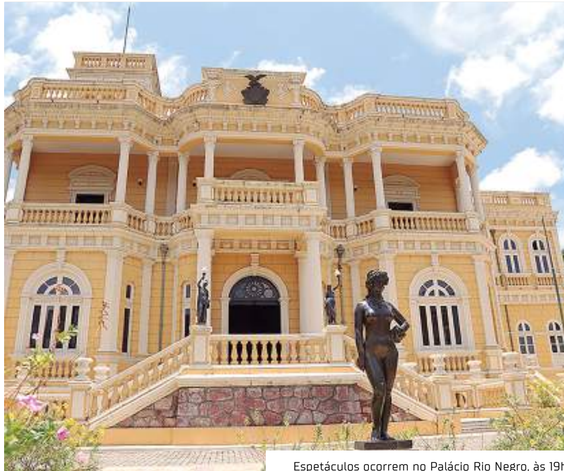
Espectáculos ocorrem no Palácio Rio Negro, às 19h

Em "Fio do Meio", o criador toma como célula o movimento do esbarão. A partir dele, observa e provoca uma via de mão dupla: a capacidade de mover corpos e, desse mover abrir espaços de conversação. Dando sequência a proposição