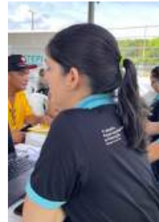
Servidores orientam população em três zonas da capital