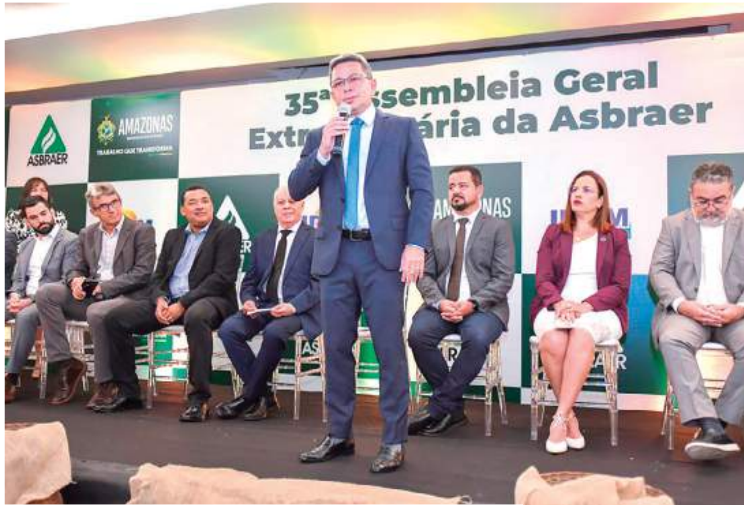
Vice-governador Tadeu de Souza discursou durante a abertura do evento

A 35ª Assembleia Geral Extraordinária da Asbraer tem com a presença de dirigentes de 24 entidades públicas de Ater de todo o Brasil e membros da Empresa Brasileira de Pesquisa Agropecuária