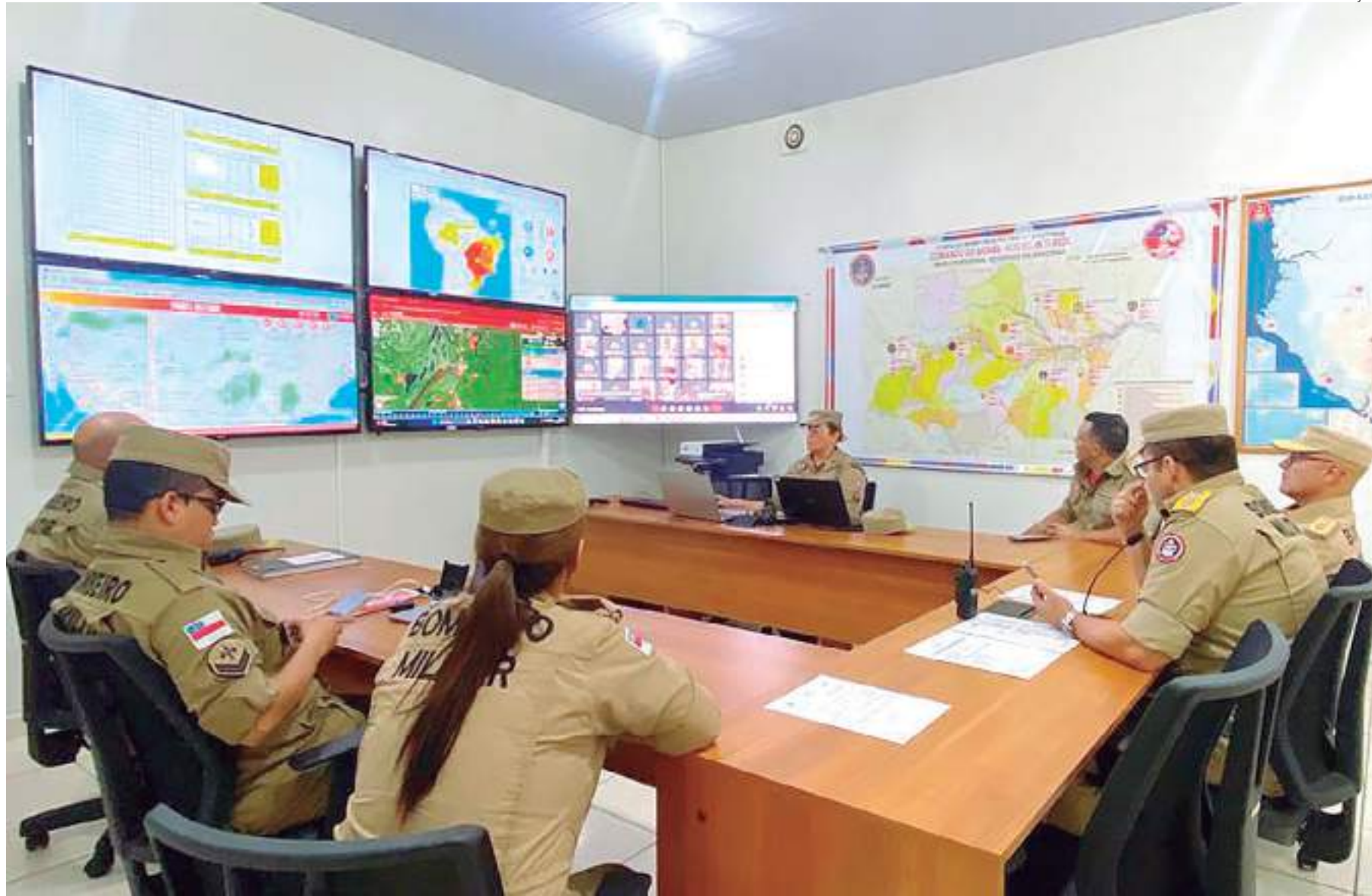
Participaram da reunião secretários municipais de Defesa Civil e Meio Ambiente

Em duas semanas, Amazonas tem mais de 4.000 focos de queimadas detectados