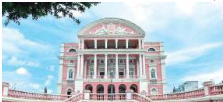
De 22 a 30 de setembro, o público terá atrações variadas