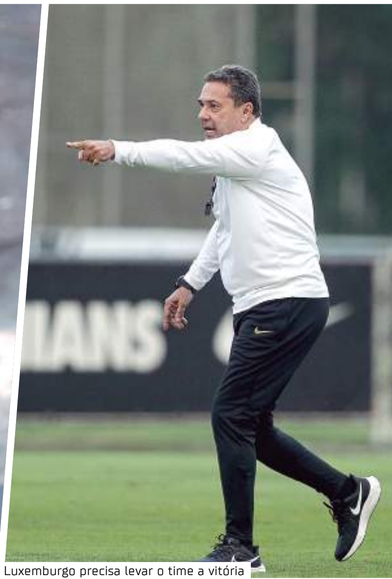
Luxemburgo precisa levar o time a vitória