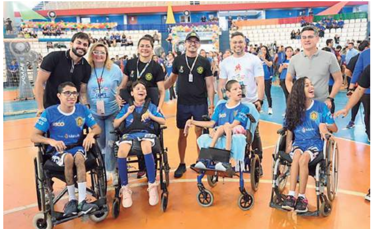
Prefeito de Manaus quer educação e esporte como "ferramenta" de inclusão social