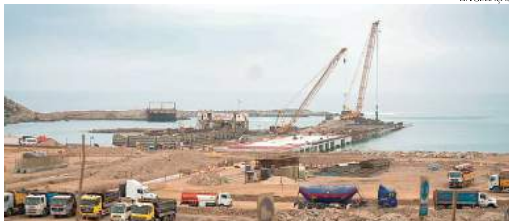
Porto de Chancay, no Peru, deve favorecer toda a Amazônia

"Há 100 anos nós perdemos a batalha da borracha por falta de ciência, tecnologia e inovação. Nós não podemos perder de novo no século XXI esta batalha", explicou ele que uma série de fatores são decisivos para o Brasil, mas principalmente para a Amazônia.