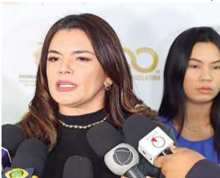
Parlamentar e vítima ressaltaram pedido por justiça em coletiva