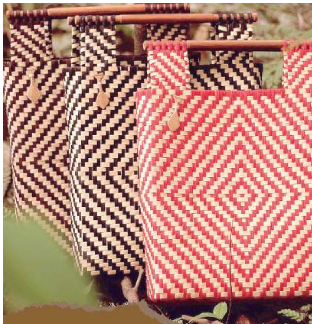
Produtos de artesãos do Amazonas são comercializados no evento

De acordo com o presidente da ApexBrasil, Jorge Viana, o artesanato brasileiro possui grande potencial para exportação. "Além de valorizar o saber fazer de diversas regiões do país, o segmento traz a diversidade do uso de matérias-primas e técnicas artesanais que representam a vocação de cada canto do Brasil. O segmento possui, ainda, diferencial competitivo frente aos compradores internacionais, ao apresentarem características de sustentabilidade, inovação e qualidade", finaliza Viana.