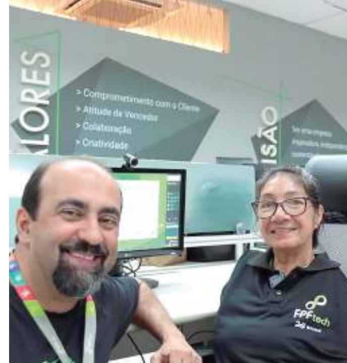
Pessoas tetraplégicas poderão utilizar internet com os movimentos do corpo

A pesquisa, promovida com recursos da Financiadora de Estudos e Projetos (FINEP) e investimentos de empresas sediadas no Polo Industrial de Manaus (PIM) aportados por meio da lei de informática, contou com a participação de pesquisadores, engenheiros, analistas de sistemas, designers, além de pessoas com deficiência que auxiliaram nos testes de usabilidade da ferramenta.