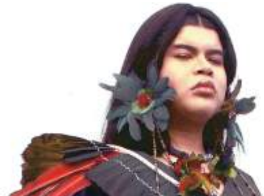
Artista amazonense assina a identidade visual do evento