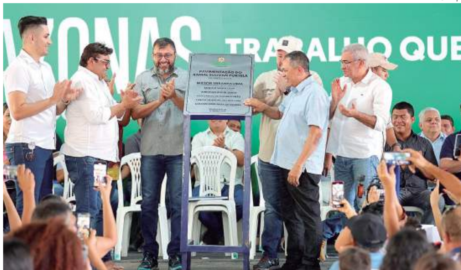
Wilson Lima estava acompanhado do prefeito de Rio Preto da Eva, Anderson Souza durante evento

Segundo a Secretaria de Estado de Infraestrutura (Seinfra), o planejamento para 2023 é que o total de 168 quilômetros da AM-010 seja pavimentado com a primeira camada asfáltica e 42 quilômetros com a segunda camada. A primeira tem quatro centímetros de espessura e a segunda 3,5 centímetros. "O trabalho que está sendo feito ali na AM-010 é um trabalho que tem a qualidade do nosso governo. Mesmo com a passagem das carretas, a gente está preparando uma rodovia para durar entre 10 e 15