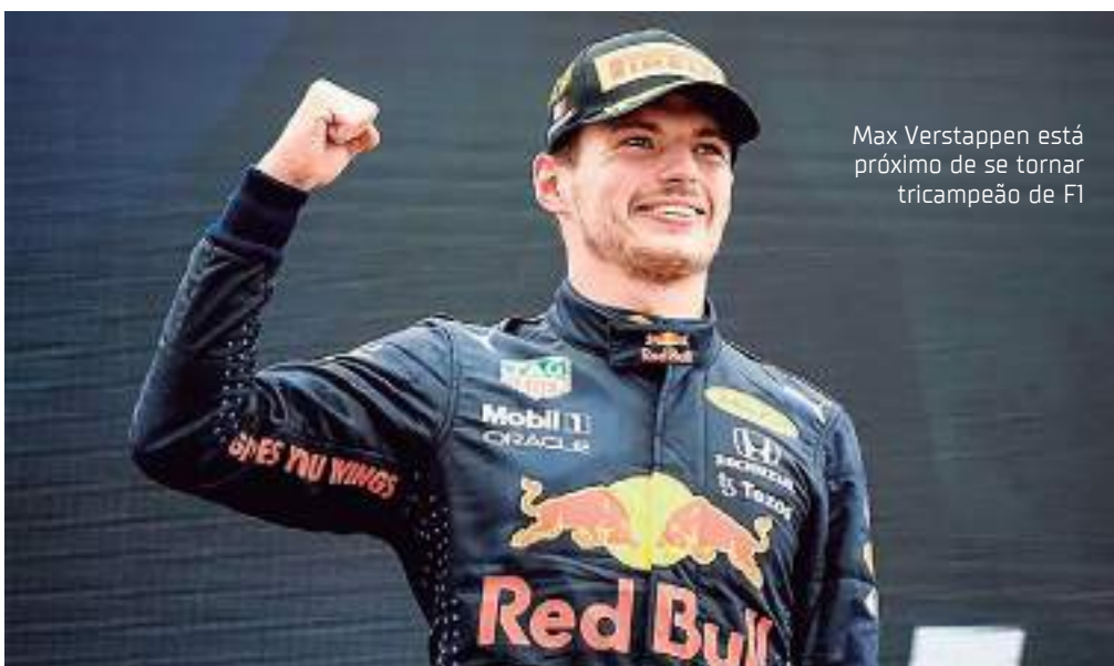
Max Verstappen está próximo de se tornar tricampeão de F1