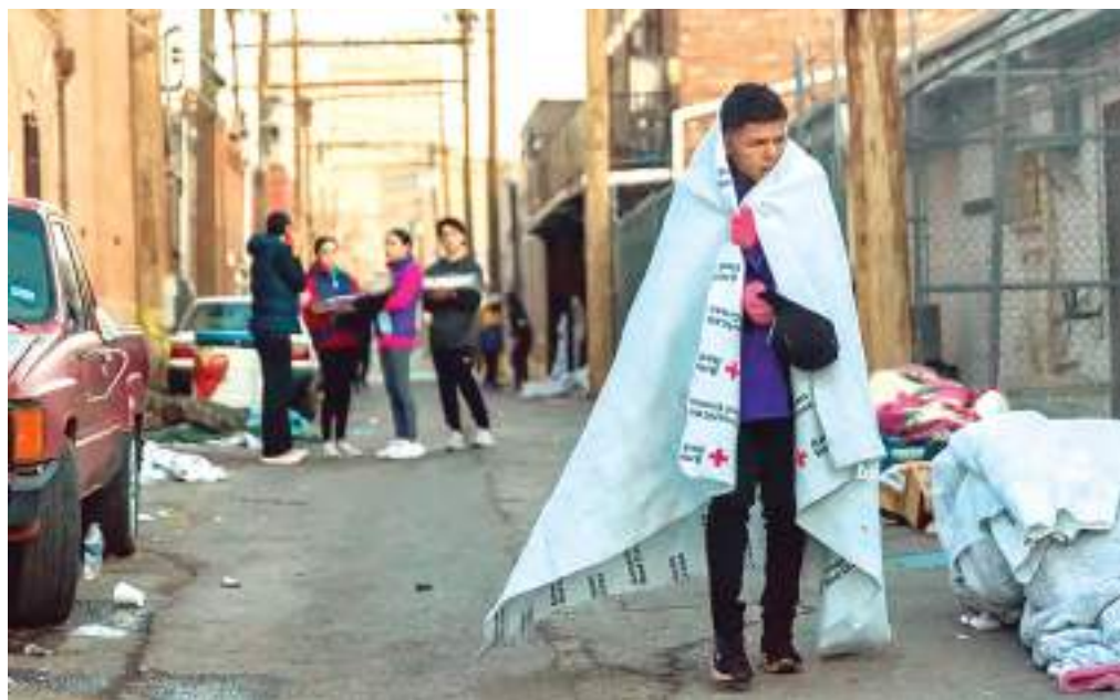
Migrante da Venezuela caminha pela rua em El Paso, Texas, EUA