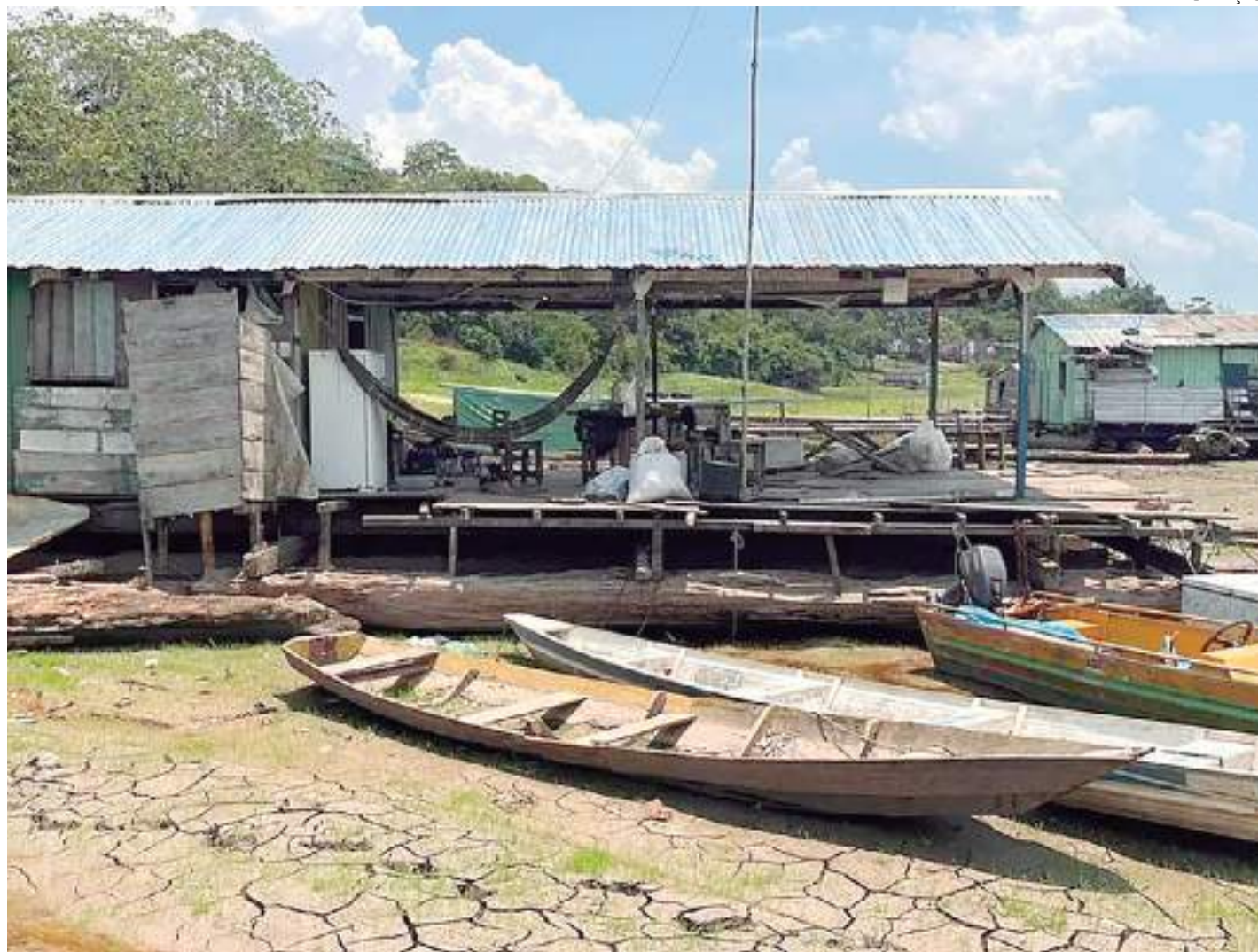
Lago do Aleixo secou em Manaus

“Nós já temos ações programadas. Por exemplo, amanhã, nós já vamos entregar 60 botes com motores para as comunidades que estão afetadas. A nossa estimativa é de furar uns 30 postos artesanais para levar água e essa estrutura ficar permanente nessas comunidades, independentemente da estiagem que nós temos aqui na nossa cidade. Vamos levar alimentos também, que essa é uma outra grande necessidade, inclusive os alimentos que nós vamos