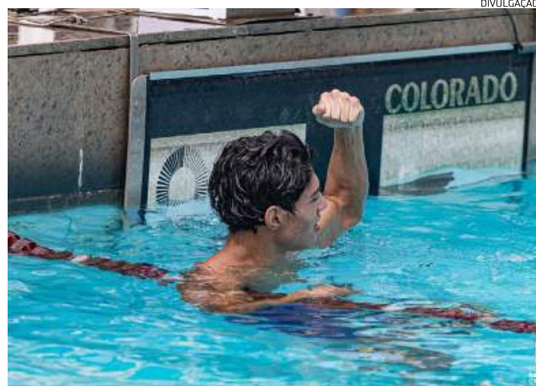
Nadador Caio Arcos é recordista dos 200 metros nado livre