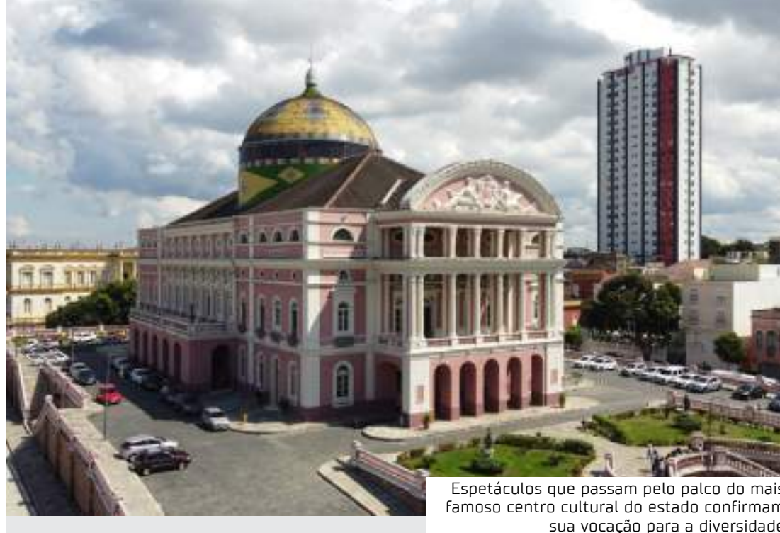
Espectáculos que passam pelo palco do mais famoso centro cultural do estado confirmam sua vocação para a diversidade

"O Toque que Muda" é um concerto que reúne as mulheres