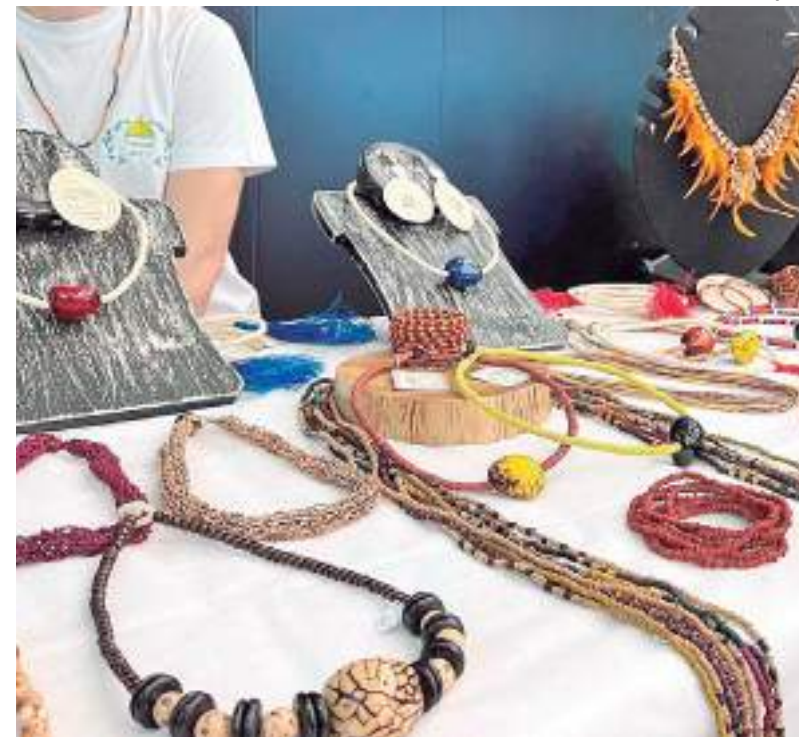
Feira de Artesanato 50+ estará disponível para visitação