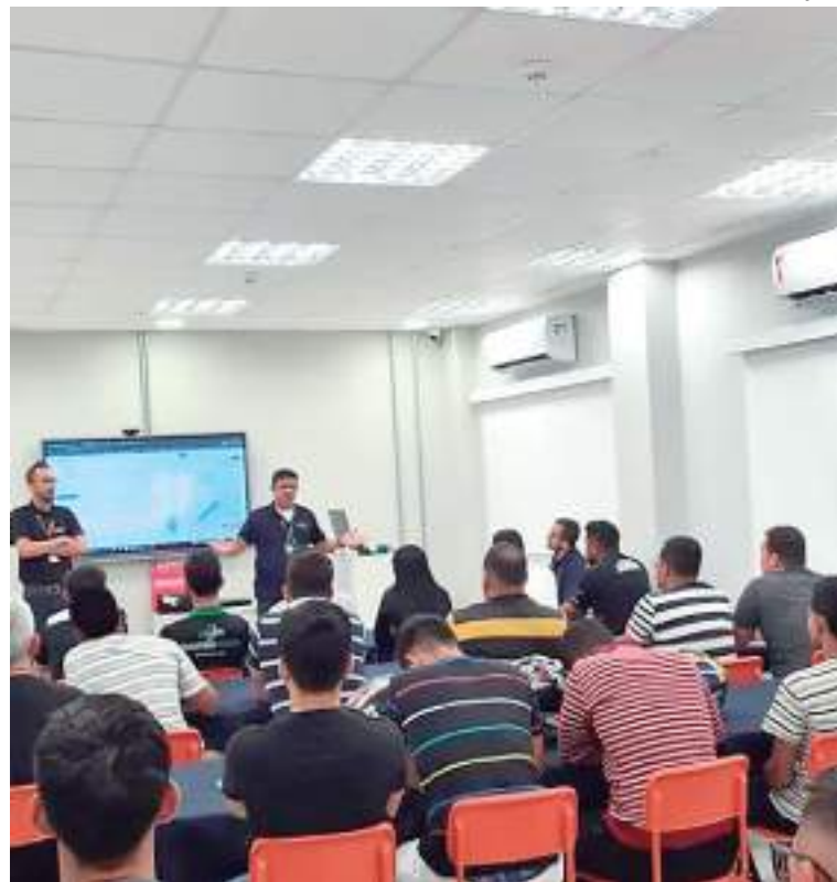
Rodada de Negócios da AMZ Tech reúne empresários