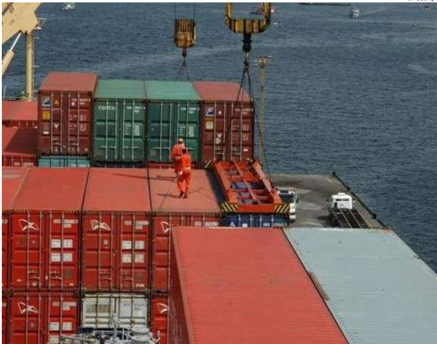
Praticagem é o serviço portuário que visa manter o tráfego livre e seguro

Em carta enviada à Agência Nacional de Transportes