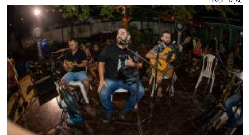
Evento reúne cantores de samba em Manaus