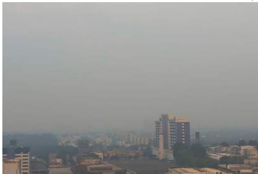
Capital amazonense coberta de fumaça

Em nota a Sema destacou ainda que o número de focos de calor no Amazonas em 2023 é 20% menor do que em 2022, quando foram registrados cerca de 17,9 mil focos. Entretanto, fatores climáticos mais intensos,