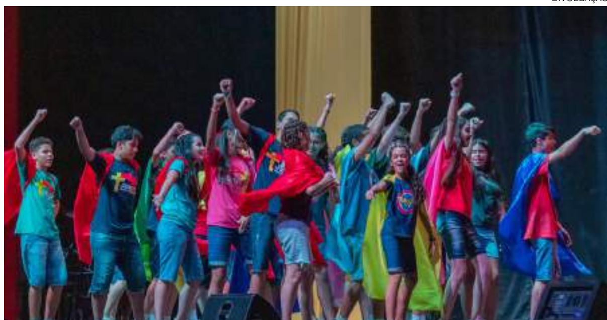
Programação é voltada para adolescentes entre 12 e 14 anos

Realizada desde 2015, a Noite dos Heróis reuniu mais de 4.500 pessoas na edição do ano passado. Para 2023, a expectativa é de superar a marca.