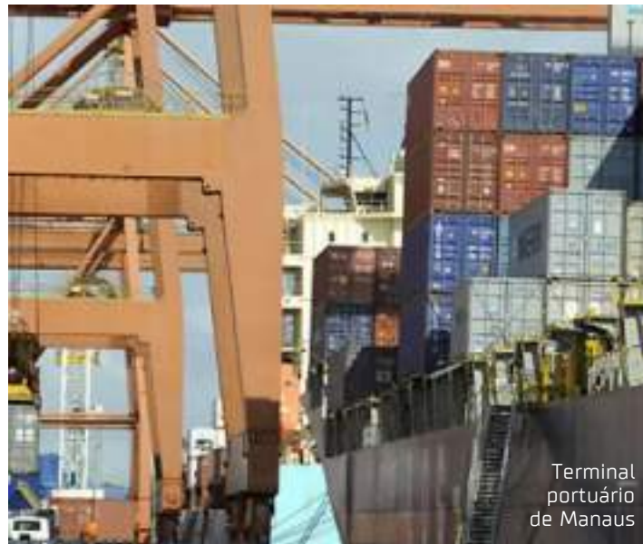
Terminal portuário de Manaus

Silva pede que os poderes competentes articulem com urgência uma resposta à sociedade no sentido de promover equilíbrio econômico aos usuários das hidrovias, coibindo prática de preços abusivos pelos atores do sis-