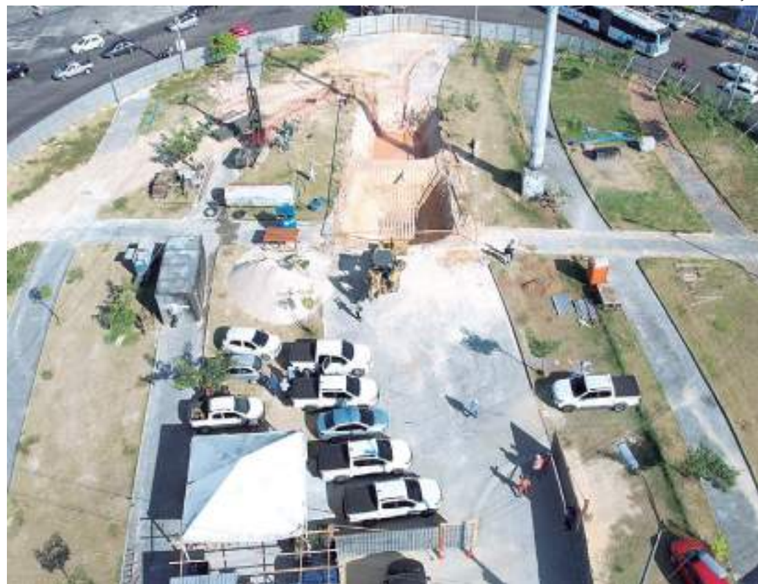
Complexo Rei Pelé, localizado na rotatória da feira do Produtor, na avenida Autaz Mirim, segue com obras aceleradas

Com um investimento na ordem de R$ 81 milhões, o complexo viário "Rei Pelé", localizado na rotatória da feira do Produtor, na avenida Autaz