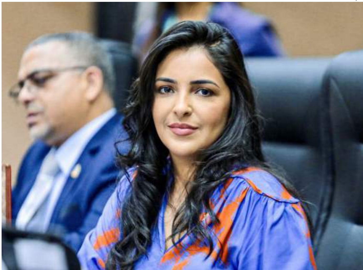
Maior gasto significativo da parlamentar é com assessoria jurídica, totalizando R$112 mil

Os gastos do fundo seguem as regulamentações das leis 437/2016 e 505/2021, sendo os valores repassados aos parlamentares somente após a contratação e comprovação efetiva de pagamento, através de notas fiscais ou recibos. Apesar da permissão