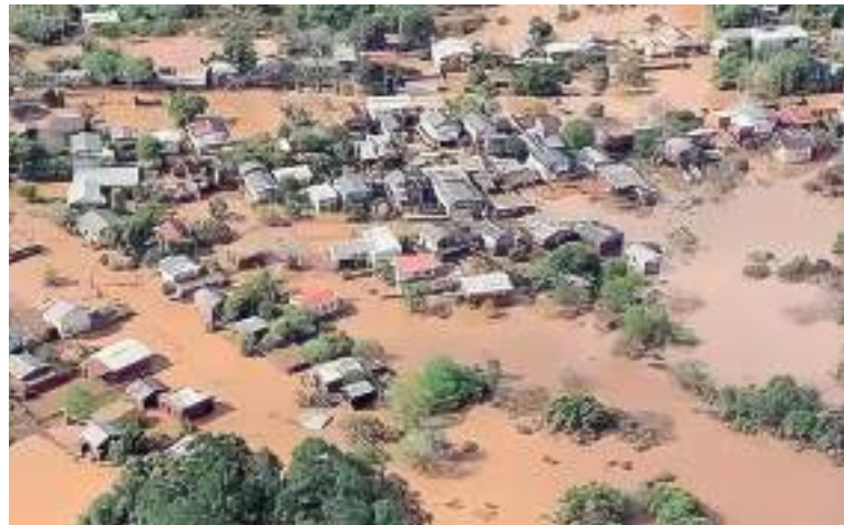
Fortes chuvas afetam municípios do Rio Grande do Sul