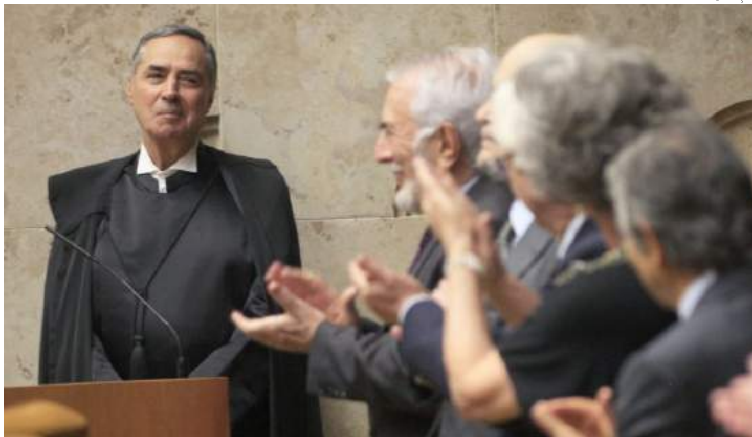
Novo presidente do STF elogiou Forças armadas por não 'sucumbirem ao golpe' e falou de 'recessão democrática'

Novo presidente do STF, Barroso discursou na posse e criticou os tempos de "recessão democrática". "Mas a recessão democrática fluiu, também, pelos desvios da democracia: as promessas não cumpridas de oportunidades, prosperidade e segurança para todos. As democracias contemporâneas precisam equacionar e vencer os desafios da inclusão social, da