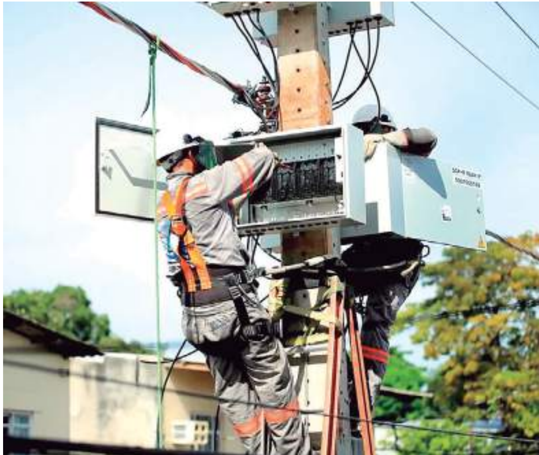
Equipes da Amazonas Energia atuam em regime de plantão de 24 horas para atender às ocorrências

As demandas podem ser registradas pelos canais de atendimento ao cliente: call-center/WhatsApp 0800 701 3001, aplicativo e site. Estes sistemas estão disponíveis 24 horas.