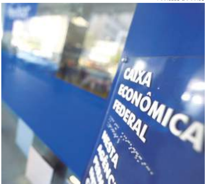
Sede de banco da Caixa Econômica