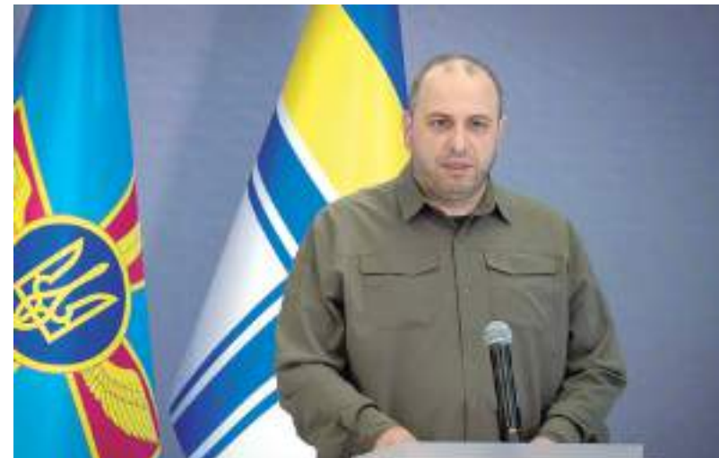
Ex-ministro da defesa da Ucrânia, Rustem Umerov