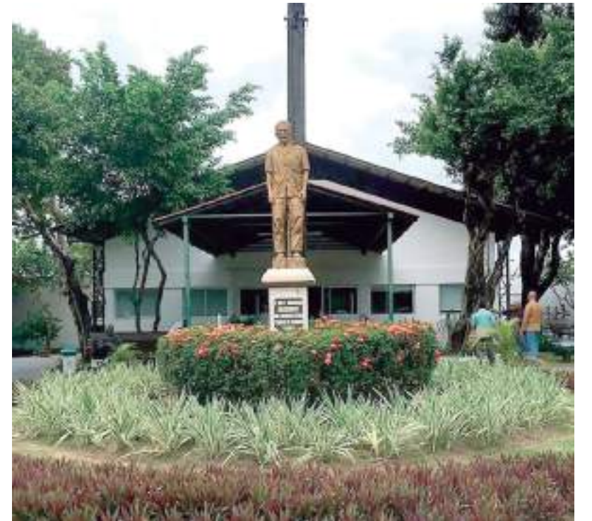
Fundação de Apoio ao Idoso Dr. Thomas em Manaus