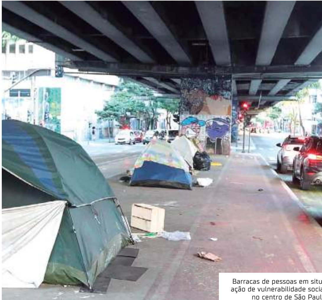
Barracas de pessoas em situação de vulnerabilidade social no centro de São Paulo

“Nosso objetivo é que essa plataforma gere frutos também para a educação e a cultura em direitos humanos,