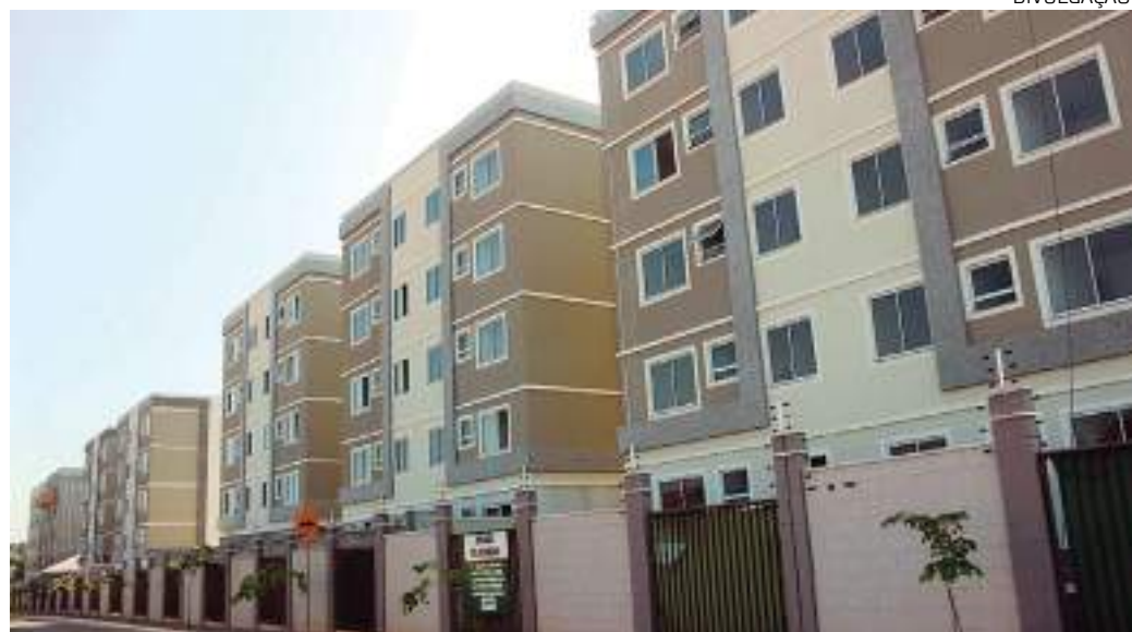
Maior construtora da América Latina oferta apês prontos e semiprontos

Com mais de quatro décadas de mercado e o propósito de construir sonhos