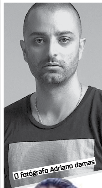
O fotógrafo Adriano Damas

Um dos fotógrafos mais requisitados no universo da Moda, Adriano Damas, formado em Artes Plásticas e radicado em São Paulo, entra em cena como fotógrafo e diretor criativo. No hall de experiências acumula trabalhos para revistas famosas como a Vogue, Bazaar, e as internacionais IKI MAG Italia, USED Inglaterra, S Dinamarca entre outras. O portfólio arrojado de top mo-