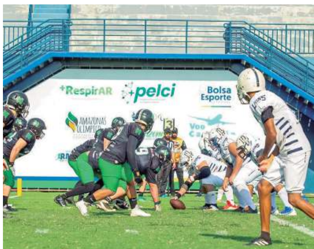
Manaus FA veceu na estádio da Colina o Remo Lions