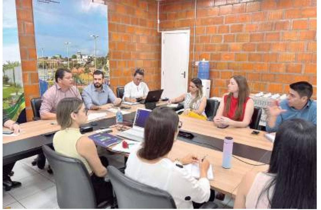
Em reunião foi discutida a expansão do Programa Brilha Amazonas

Outro projeto que está sendo pleiteado junto ao Governo Federal é a modernização dos aeródromos de Maués (a 276 quilômetros da capital), Apuí (a 453 quilômetros), São Gabriel da