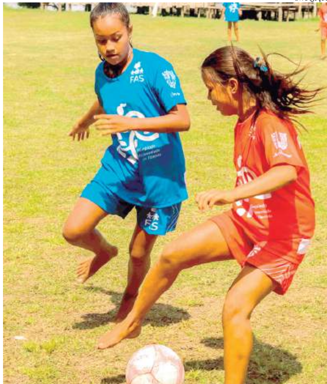
Jogo reuniu muitas atletas que sonham ser jogadoras profissionais de futebol

A prática do esporte inclusive foi proibida para mulheres no país, durante um dos governos de Getúlio Vargas, e assim permaneceu por mais de 40 anos, até o fim da ditadura militar nos anos 1980. Hoje, por conta do machismo enraizado na sociedade, o futebol