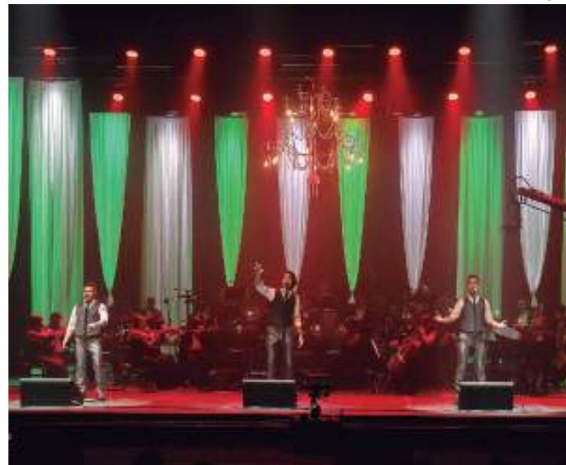
Teatro será palco de homenagem para cantor italiano