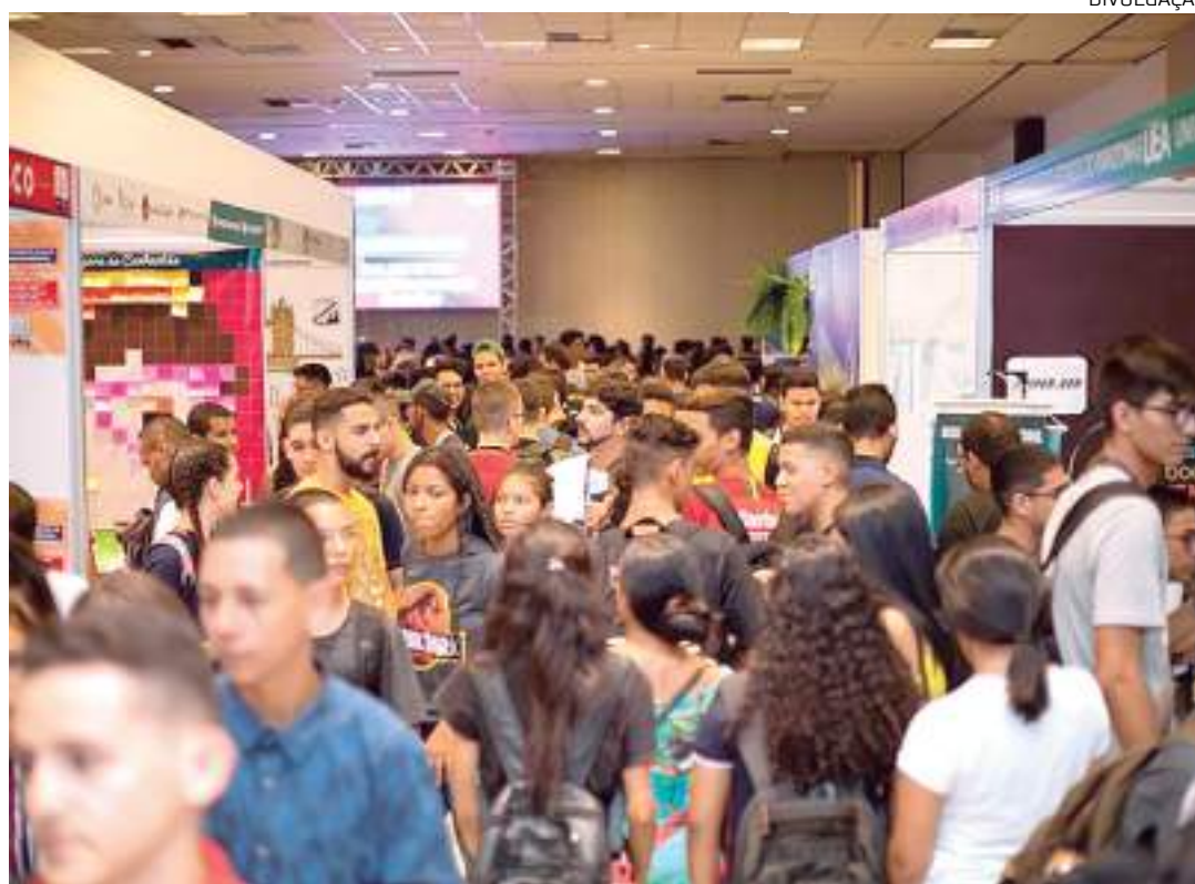
Feira reúne estudantes no Centro de Convenções Manaus Plaza Shopping

(22), das 9h15 às 19h, a FNE promove 36 atividades nas quatro salas. Na sala Nelson Mandela, os temas serão: "Turismo Sustentável e práticas hoteleiras responsáveis"; "Jornalismo em transformação: navegando no futuro da informação"; "As plataformas sociais e o Direito Digital"; "Quero ser Designer! E agora?"; "Você conhece a Economia? O que é? Pra que serve?"; "Jornalismo Esportivo"; "Design de Interiores: criando espaços funcionais e esteticamente agradáveis"; "A criatividade como estímulo à educação empreendedora"; e "Despertando Potenciais: o Inglês como ferramenta para aproveitar oportunidades".