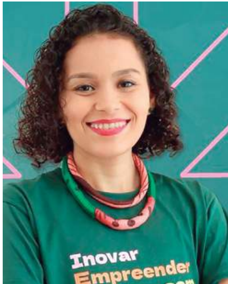
Empreendedoras da Amazônia Legal podem participar do programa