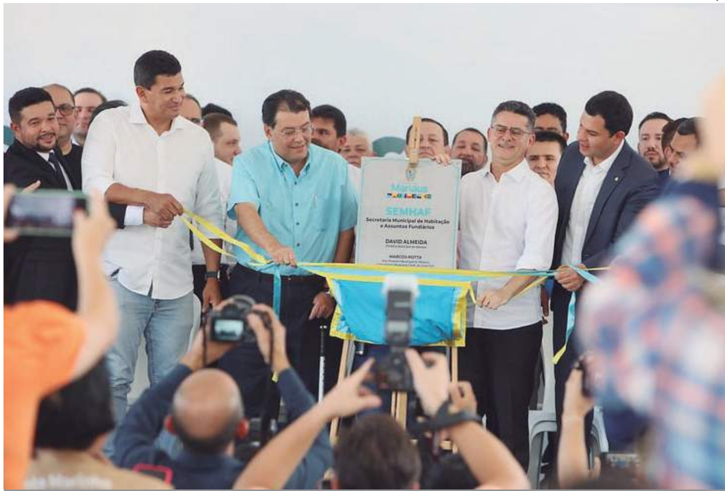
Anúncio aconteceu durante inauguração da sede da Secretaria Municipal de Habitação e assuntos fundiários (Semhaf)

"Essa parceria da prefeitura contando com o apoio de senador Eduardo Braga já trouxe, só este ano, mais de R$ 200 milhões aos cofres do município. Esses recursos são muito impor-