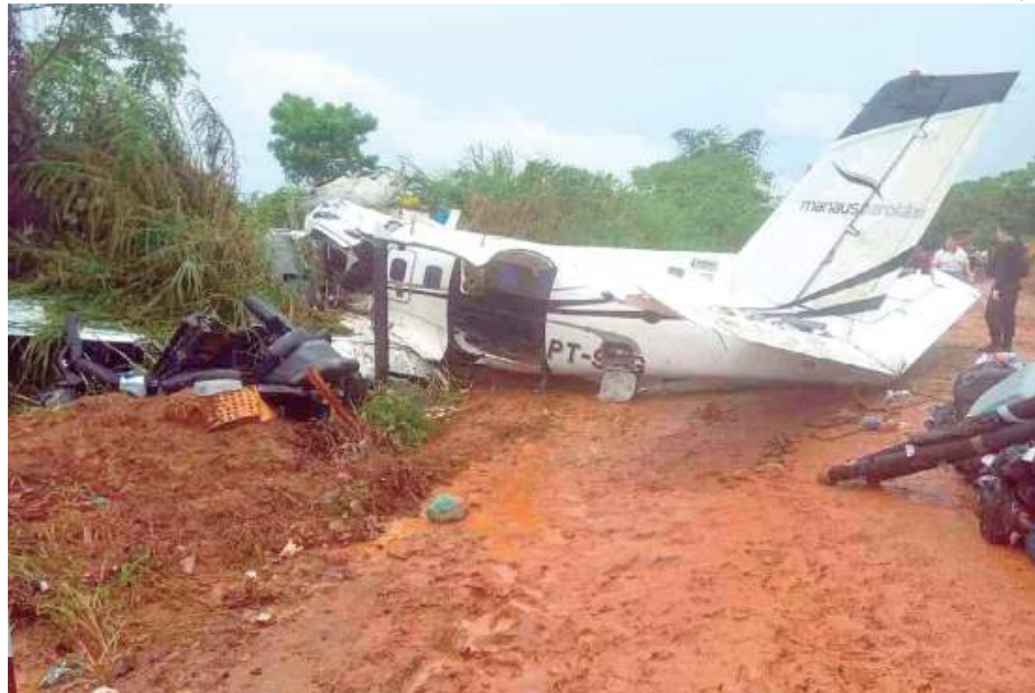
Todas as 14 pessoas a bordo da aeronave morreram no acidente