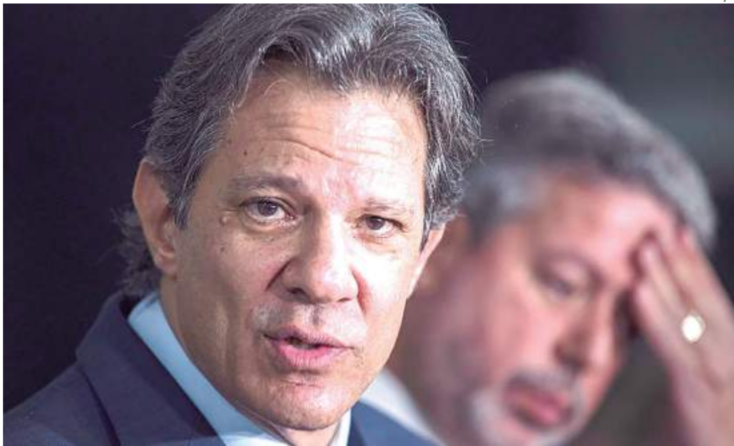
Haddad também rebateu críticas de atraso no cronograma do governo

Sobre o ambiente político para a discussão da reforma administrativa, Haddad disse que não vê "tumulto" no cenário. Segundo ele, ninguém é a favor do super salário no Brasil. "Então, por que a gente não começa