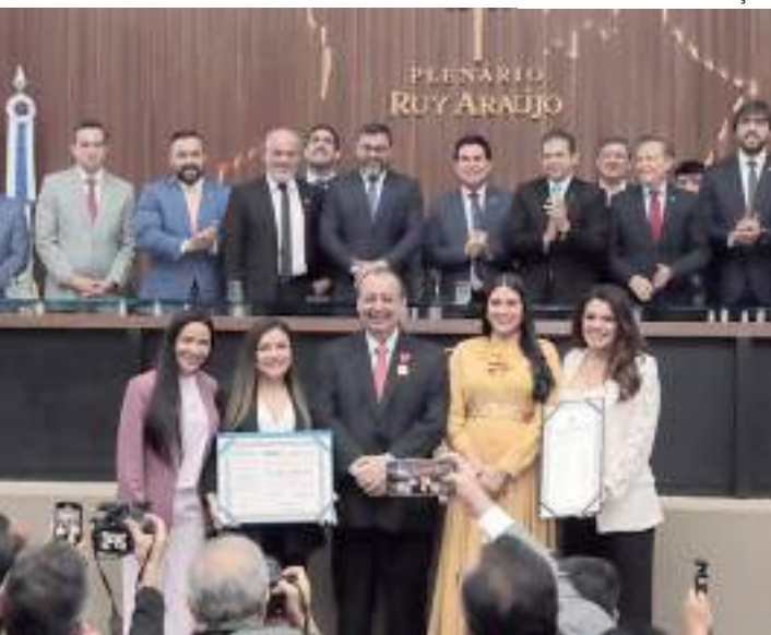
Autoridades resgataram legado de Omar pelo povo do Amazonas

"É uma honra muito grande além de me tornar oficialmente cidadão, receber a medalha Ruy Araújo", agradeceu o senador. Em seu discurso, ele destacou a importância dos amigos e da solidariedade nos momentos difíceis da vida política. Omar ressaltou sua trajetória desde sua chegada ao Amazonas em 1971, trazendo à tona memórias pessoais marcantes, como sua infância vivida na Rua