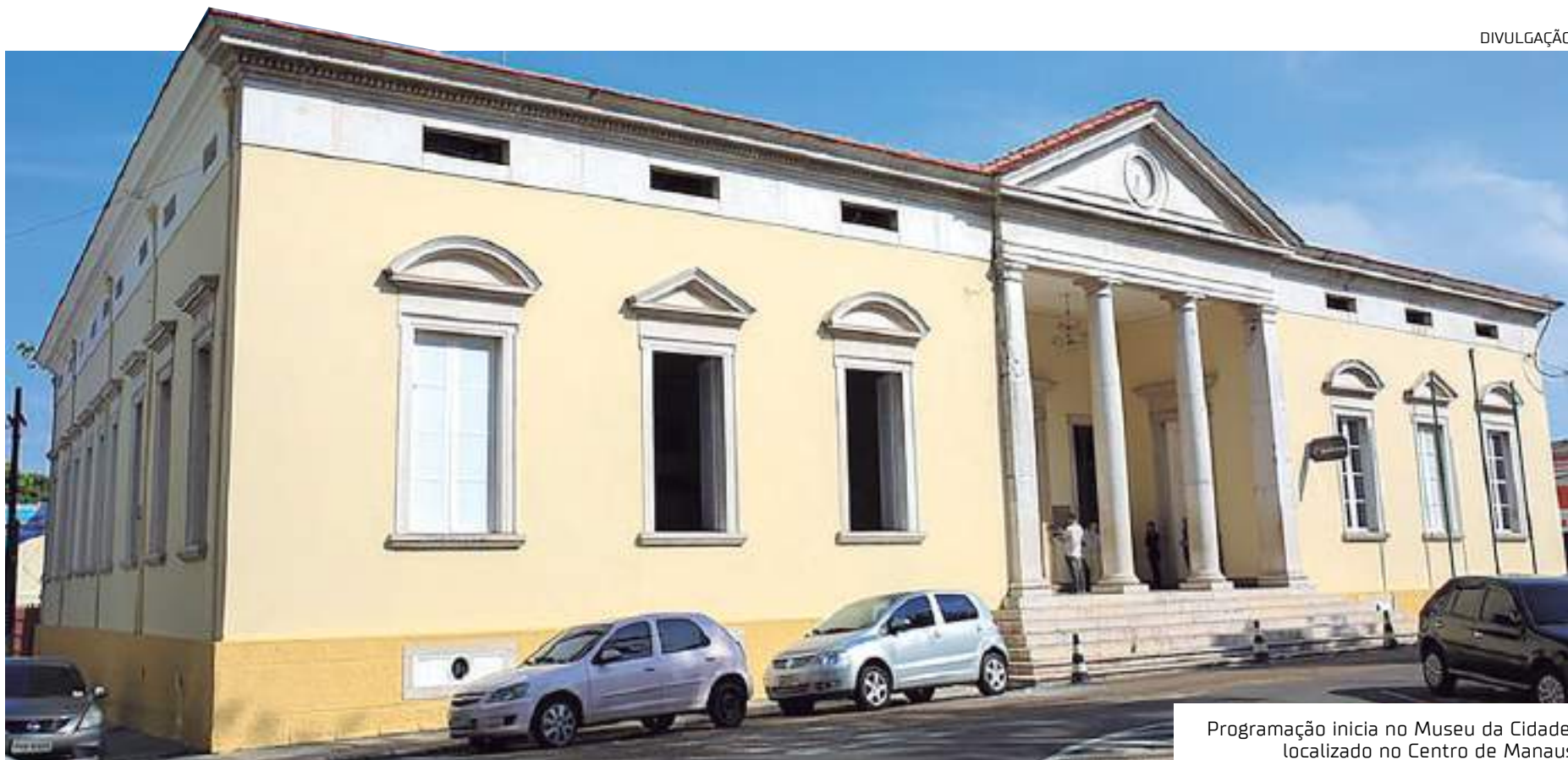
Programação inicia no Museu da Cidade, localizado no Centro de Manaus

Simultaneamente, será aberta a exposição de livros "Memórias e Democracia: Pessoas LGBTQ+, Indígenas e Quilombolas", na biblioteca João Bosco Pantoja, localizada na rua Monsenhor Coutinho, 529, Centro. Vale ressaltar que a exposição estará disponível do dia 18 a 22 de setembro, das