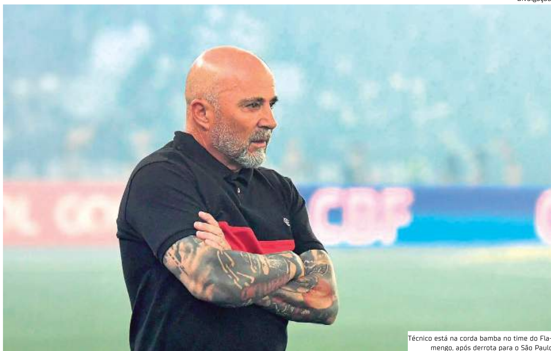
Técnico está na corda bamba no time do Flamengo, após derrota para o São Paulo

taque foi a pausa para a hidratação dos jogadores ainda no primeiro tempo. Na ocasião, Jorge Sampaoli sequer conversou com os atletas para passar instruções, e o pouco de diálogo que houve foi comandado por seu auxiliar. Durante todo o duelo, o argentino quase não se manifestou.